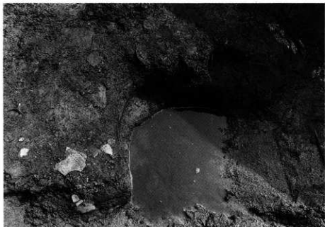
1. SK-106 完掘状況 (北から)