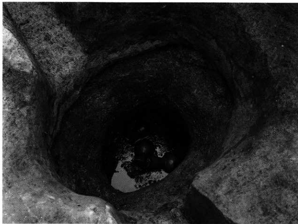
1. S K-120 第6層 出土状況(北西から)