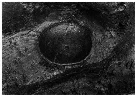
3. SD-101B 第6層 出土状況 (南から)