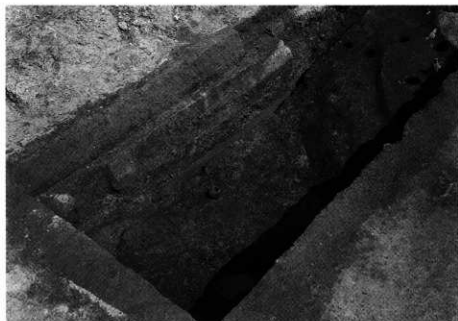
2. SD-101B 第7(下)層 出土状況 (南西から)