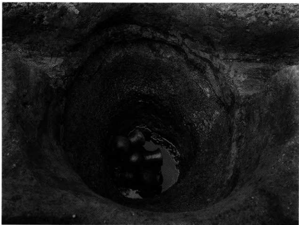
2. S K-120 第5層 出土状況(南から)