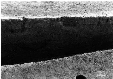
2. SK-115 土層断面 (南壁)