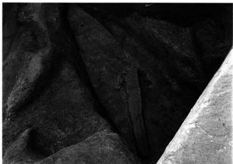
2. SK-111 第6(下)層 出土状況 (北東から)