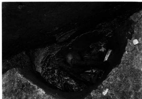
2. S K-102 第4層 出土状況 (北東から)