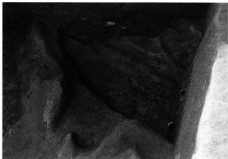
1. SK-111-130 完備状況 (東から)