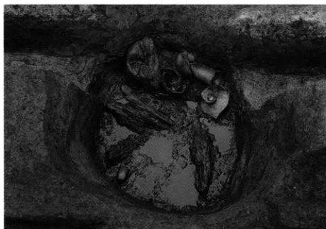
2. S K-120 第3層 出土状況 (南カ・E)