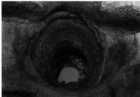
1. S K-120 完掘状況 (南カ・E)