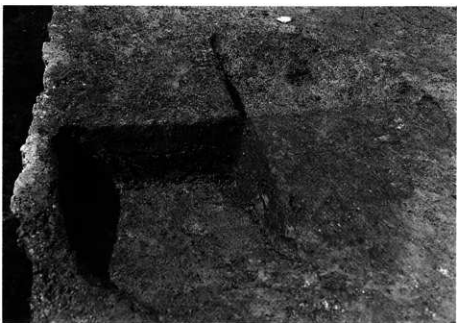
3. SK-110 土層断面 (東から)