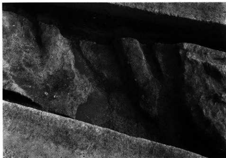
1. S D-103 完掘状況 (北から)