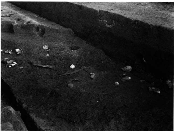
2. S D-101 C 第10層 出土状況 (北西から)