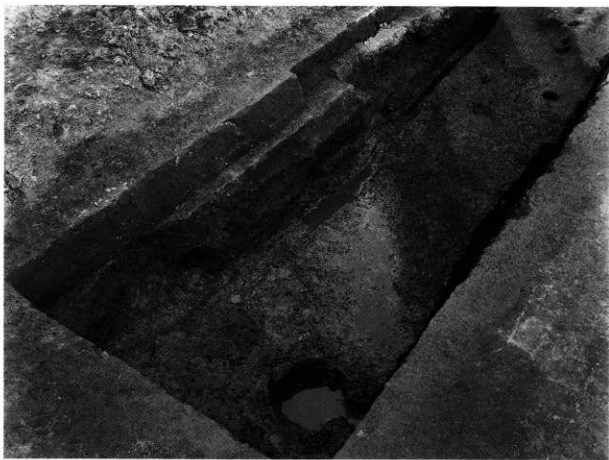
1. S D-101 C 完掘状況 (南西から)