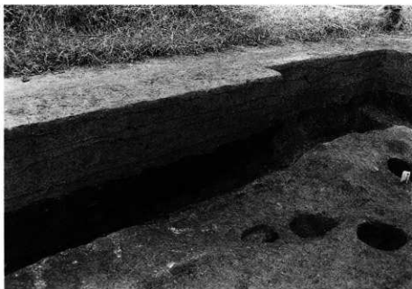
1. SK-126 土層断面 (北壁)