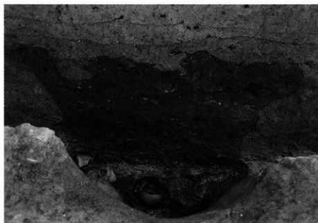
3. S K-120 土層断面 (南壁)