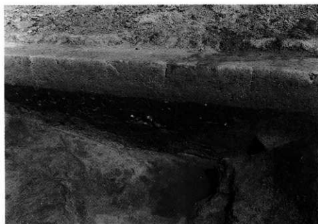
2. S D-103 土層断面 (北壁)