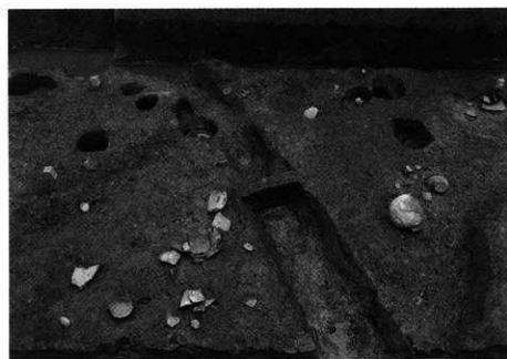
3. S D-104 第2層 出土状況(南から)