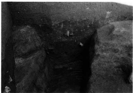
3. SK-111 土層断面 (北壁)