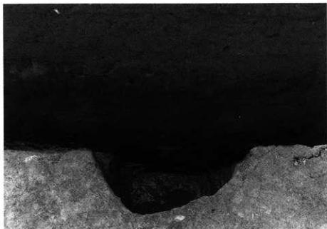
1. S K-102 完掘状況 (北から)