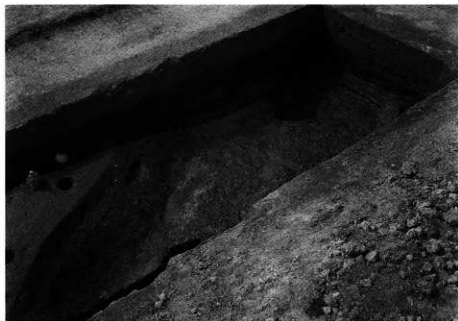
1. SD-101B 完掘状況 (北東から)