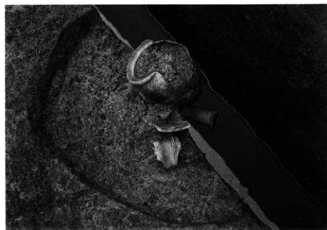
3. S K-102 第1層 出土状況 (北西から)