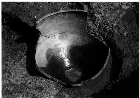
2. SX-101 完掘状況 (北西から)