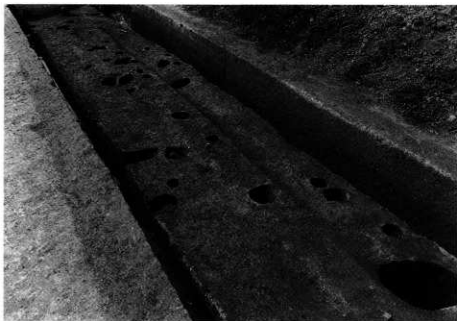
1. SB-101 完掘状況 (南東から)