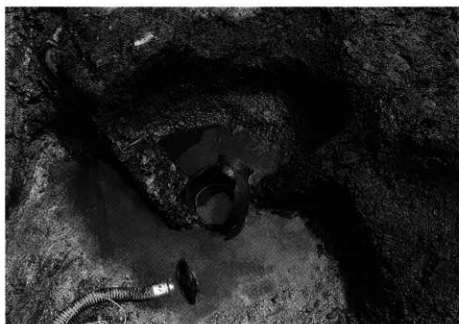
2. SK-106 第5層 出土状況 (西から)