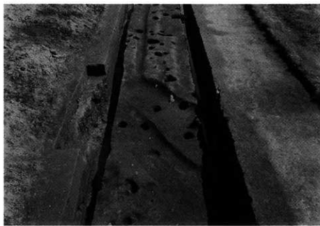
3. SD-101 完掘状況 (西から)