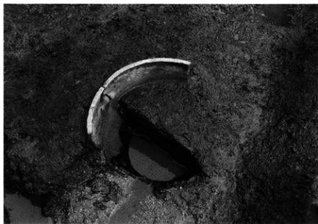
3. SX-101 検出状況 (北から)