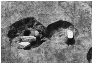
写真40 小竪穴32 (南から)