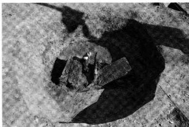
南トレンチ 井戸・SE-01 中層上 検出状況 (西から)