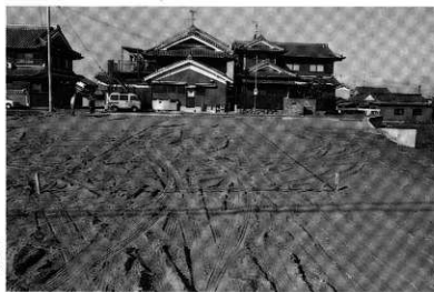
北トレンチ 調査前全景 (東から)