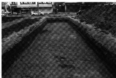
北トレンチ 遺構完掘状況 (西から)