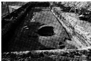
南トレンチ 遺構完掘状況 (東から)