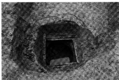
南トレンチ 井戸・SE-01 完掘状況 (西から)