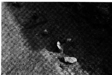
左上 南トレンチ 溝・SD-01検出状況 (東から)