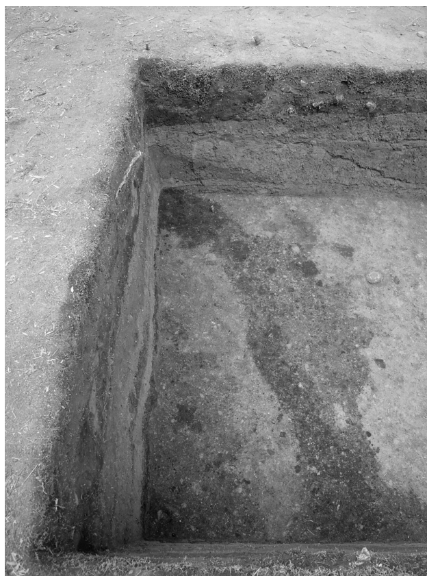
37 墳頂トレンチ北側拡大（西から）