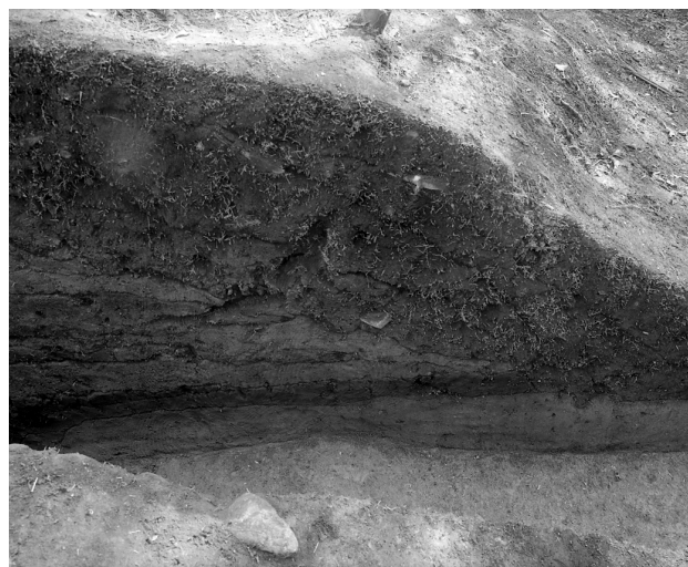
32 第4トレンチ墳裾部分断面（北東から）