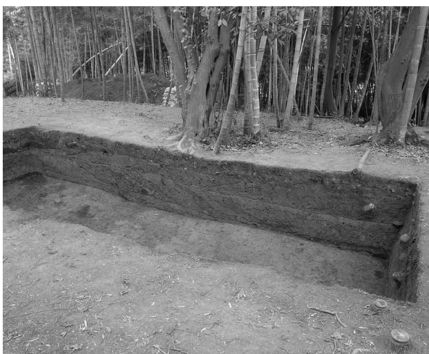
40 墳頂トレンチ東壁断面（西から）