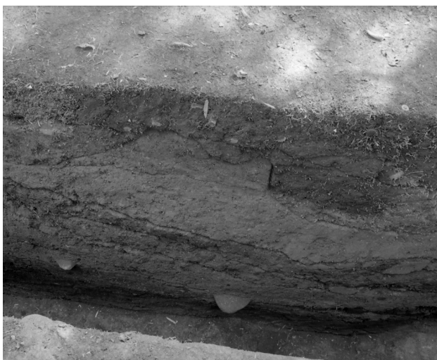
33 第4トレンチ中央部南壁断面（北東から）