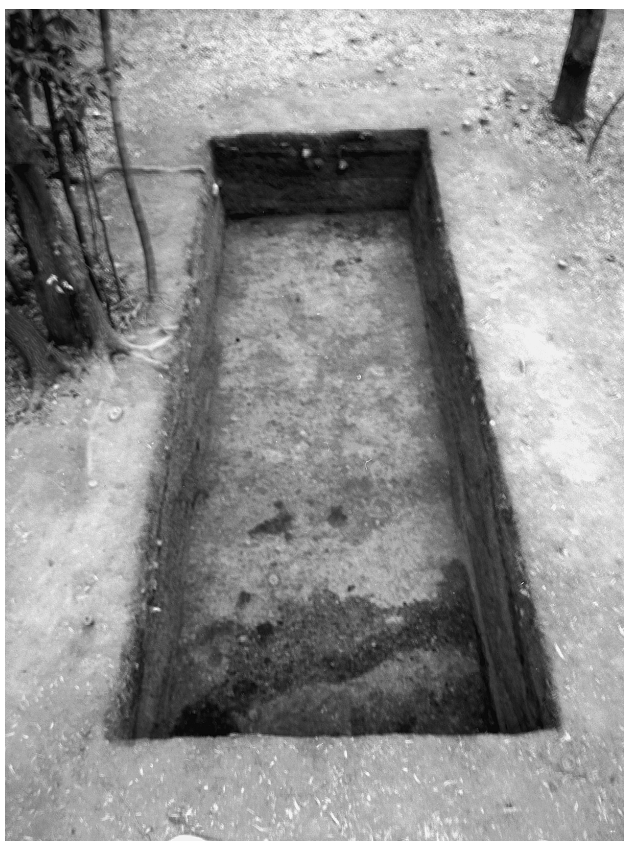
36 墳頂トレンチ完掘状況（北東から）