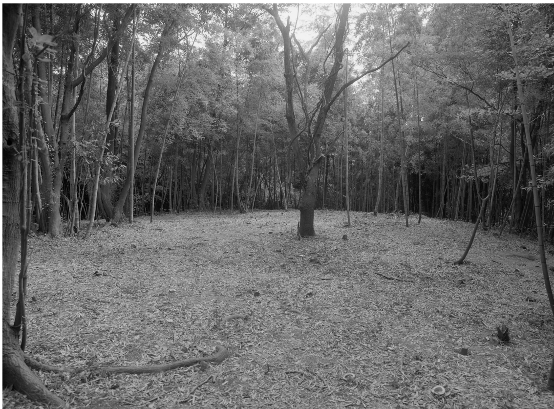
35 墳頂部全景（北から）