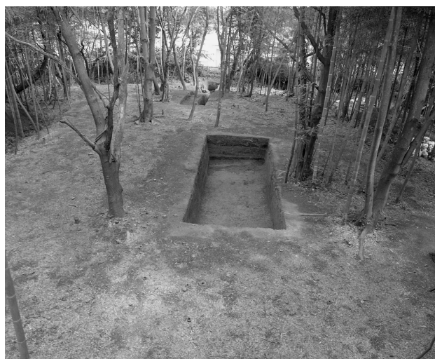
41 墳頂部と墳頂トレンチ全景（南西から）