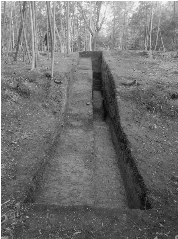
29 第4トレンチ墳裾（北西から）