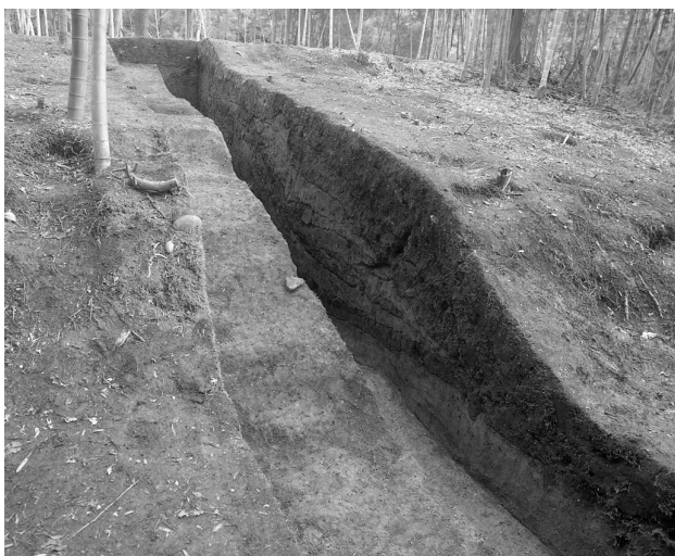
31 第4トレンチ南壁断面（北から）