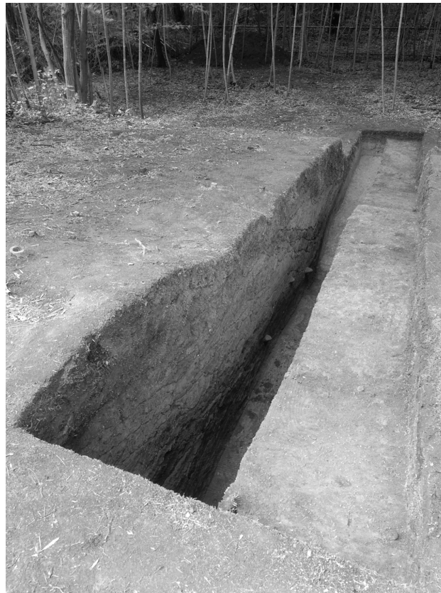
30 第4トレンチ南壁断面（東から）