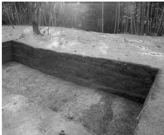
39 墳頂トレンチ西壁断面（東から）