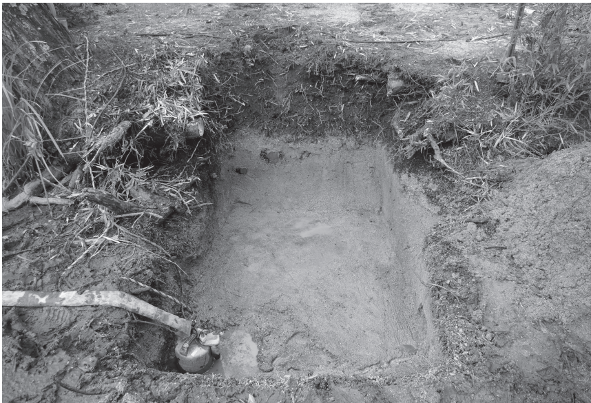
調査区 1 全景（東から）