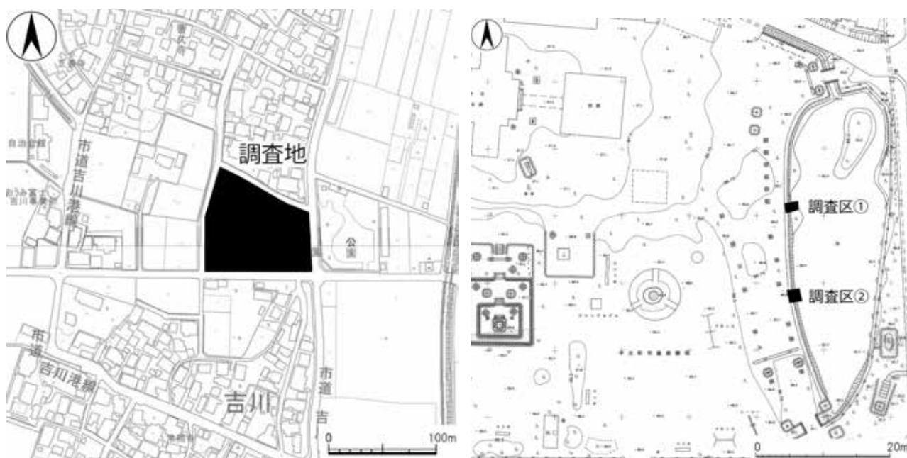
図 1 調査区位置図・調査区配置図

掘り下げを行った結果、表土（1 層）が約 0.5m 堆積しており、その下層にオリーブ灰色の粗い砂層（2 層）が堆積していた。このオリーブ灰色の粗い砂層が池底の最上層にあたり、池底から約 0.4 m まで掘り下げてもオリーブ灰色の粗い砂の堆積が続いていた。岸部の壁面及び平面で精査を行ったが、池の護岸設備等は確認できず、岸部の壁面にピンポールを刺しても板材等のあたりはなかった。下層確認のため池底を約 1.0m まで掘り下げたが、大きな変化はみられなかった。