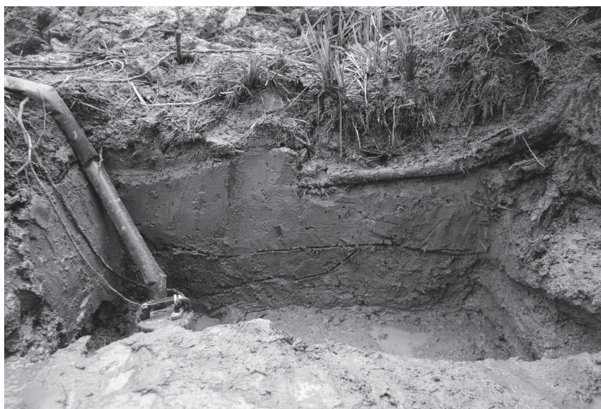
調査区 2 南壁土層断面