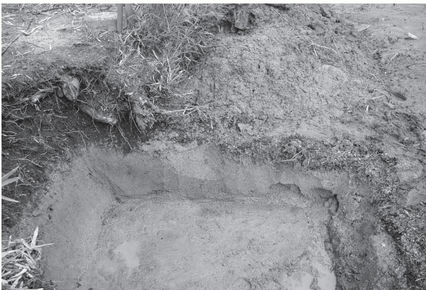
調査区 1 北壁土層断面