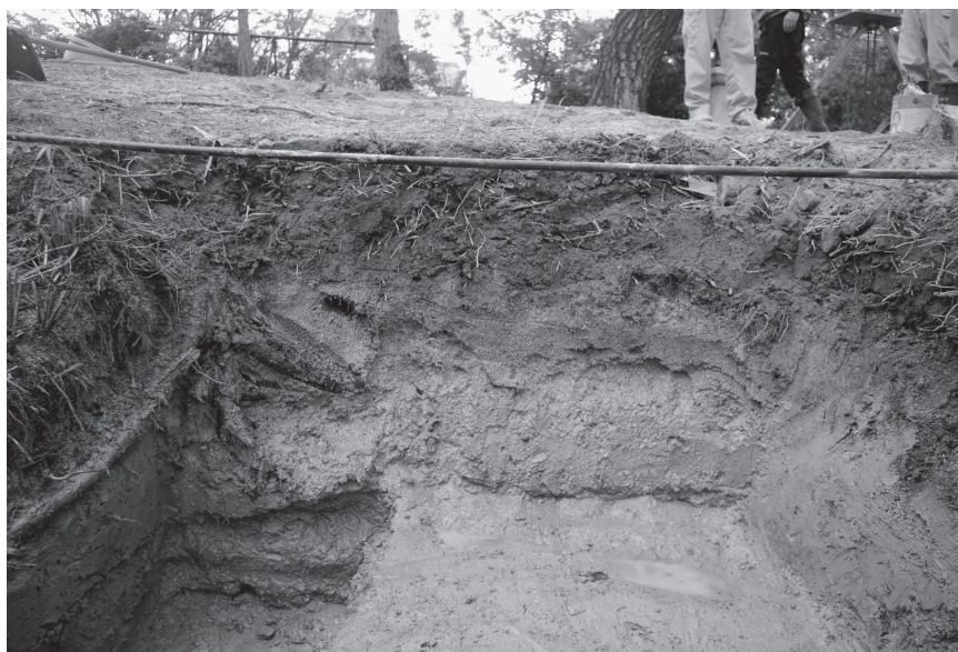
調査区 2 西壁土層断面