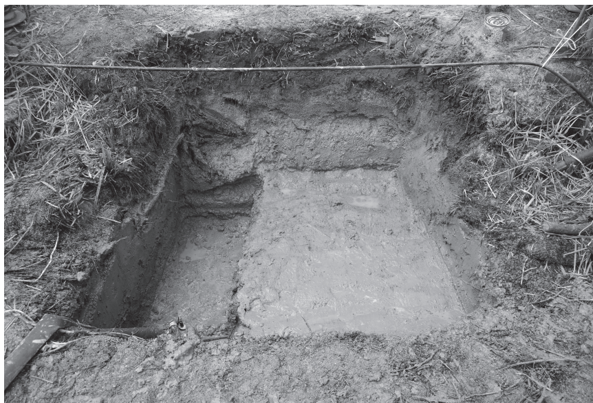
調査区 2 全景（東から）