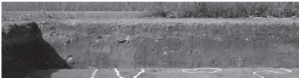
1 調査区1 北壁土層断面（北西から順に①）