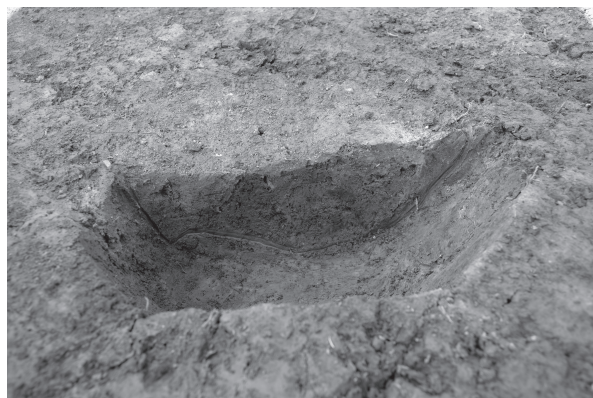
3 SP02 (SA01) 断面（北東から）