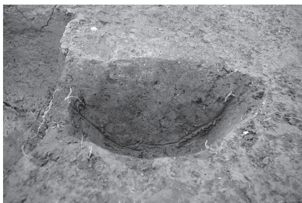
4 SP03 (SA01) 断面（北東から）