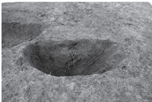
2 SP01 (SA01) 断面（北東から）