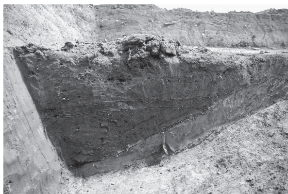
5 SX01 断面（南西から）