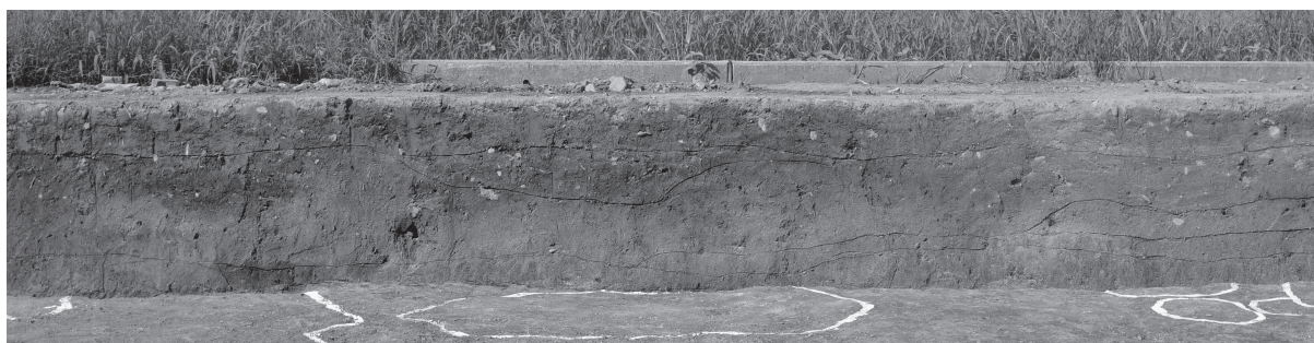
3 同北壁土層断面（北西から順に③）