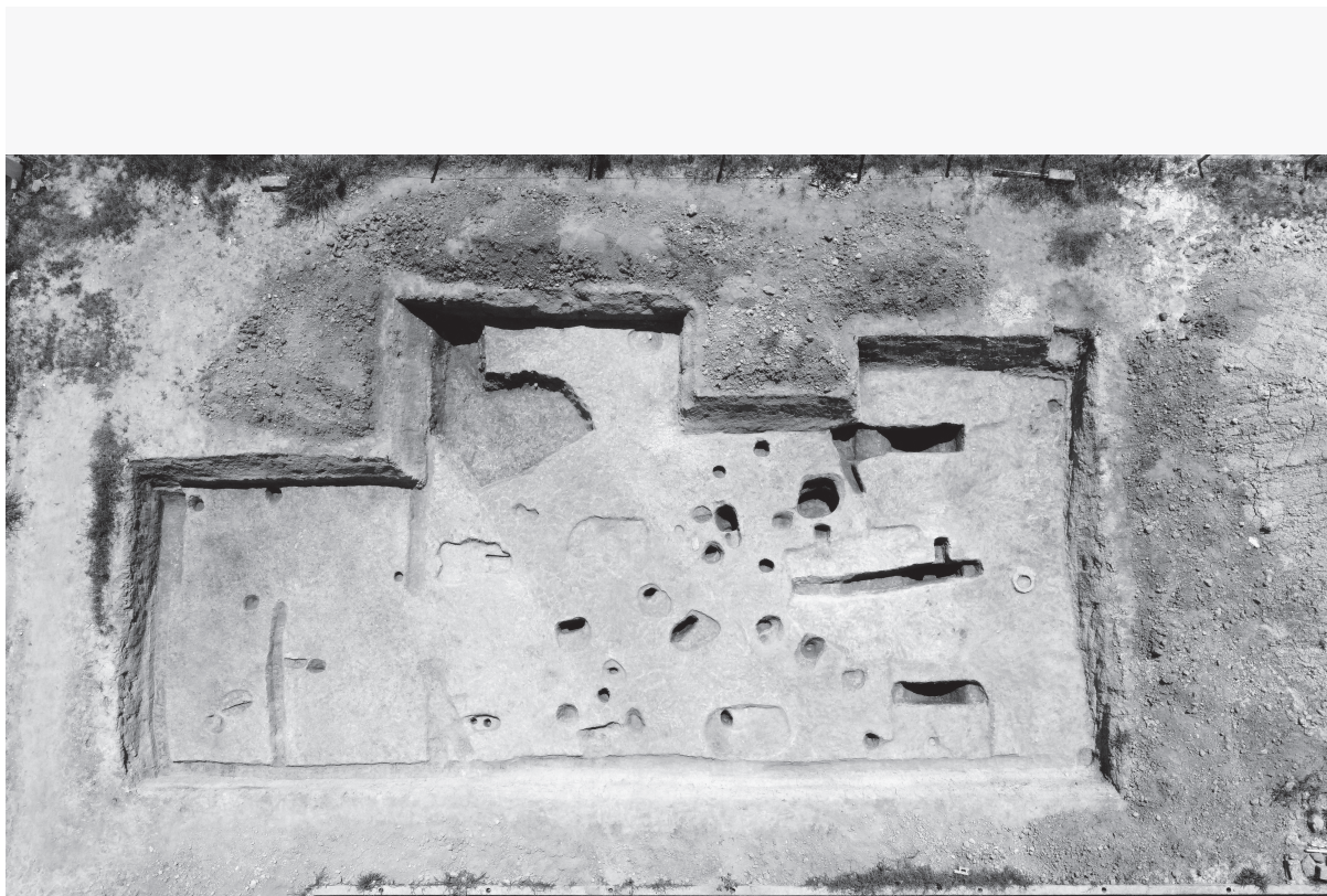
2 同上空写真（上が南西）