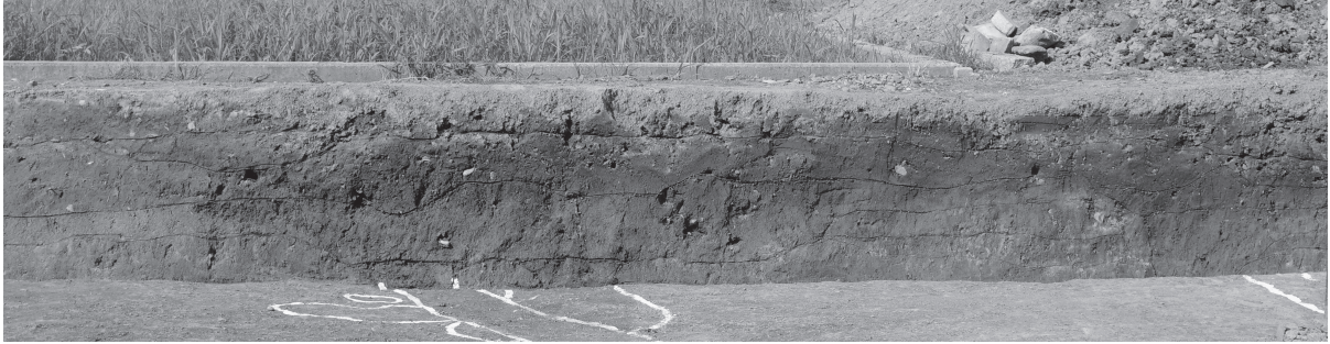
5 同北壁土層断面（北西から順に⑤）