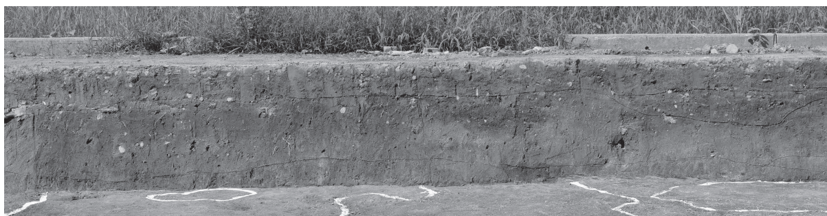
2 同北壁土層断面（北西から順に②）