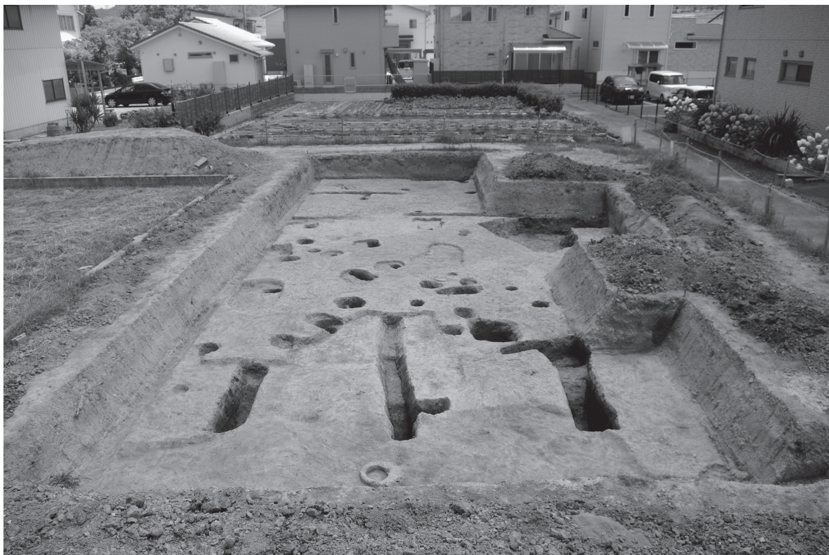
1 調査区1全景1（北西から）