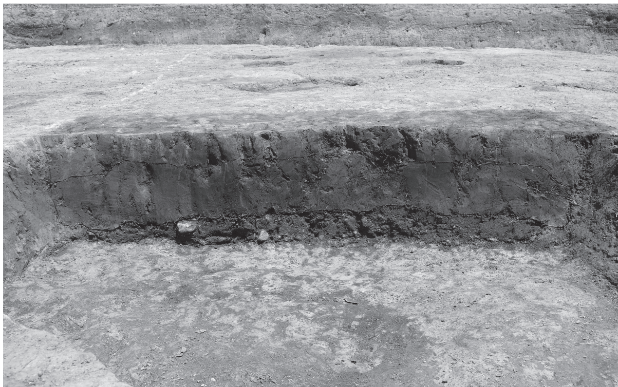
1 SD01 断面（南から）