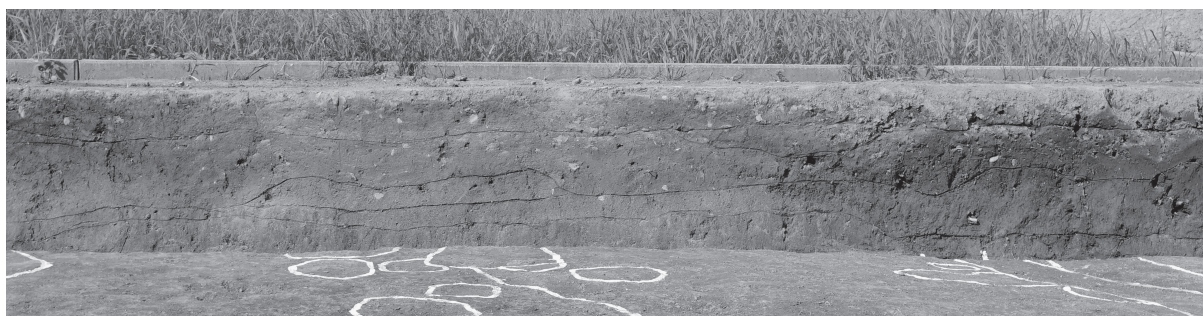
4 同北壁土層断面（北西から順に④）