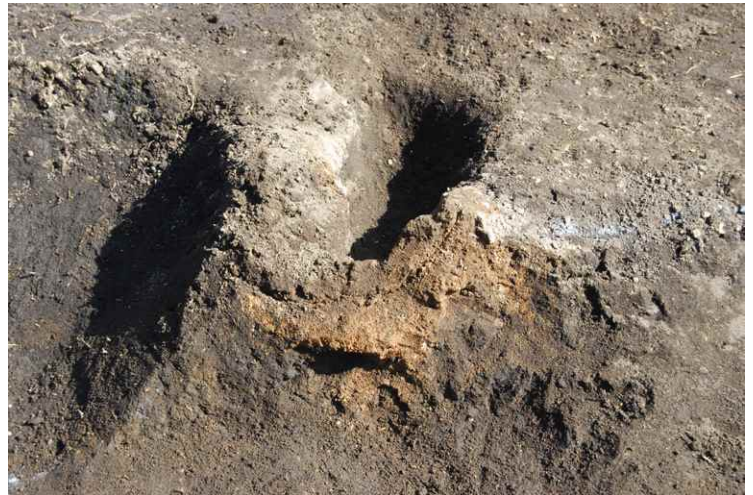
4. SI6 東壁旧カマド近景（西から）