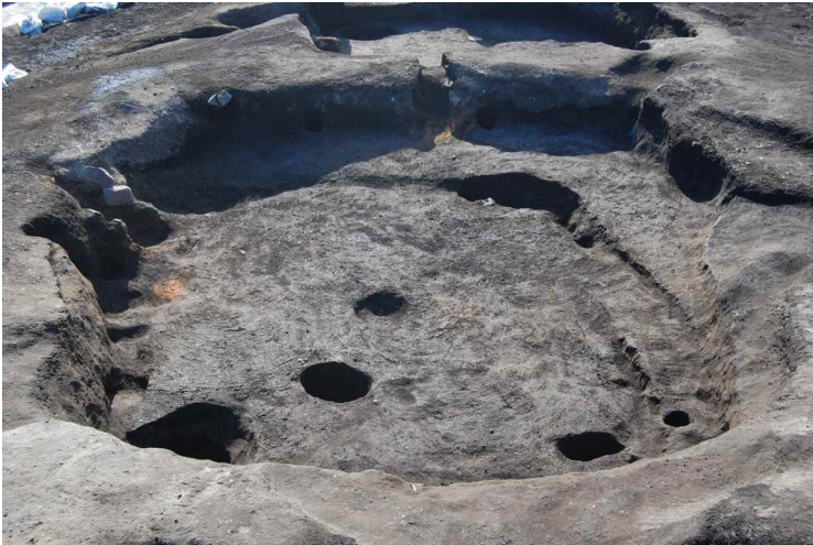
7. SI13-A, B、鍛冶遺構 2 完掘 (北から)