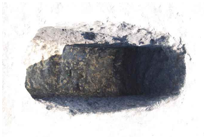
2. SKJ30 完掘 (北から)