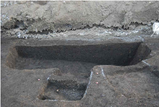
1. SI17断面SPA ^ -A(西から)