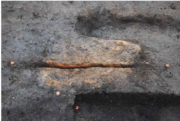
3. SI4 炉断面 SPC-C' (南から)