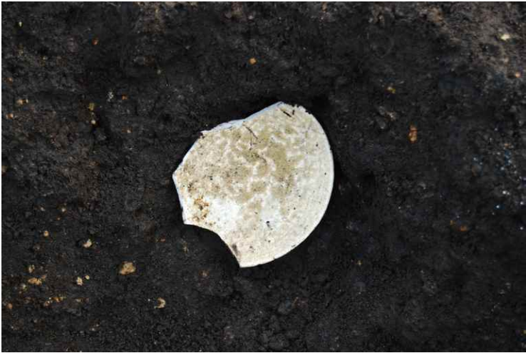
5. SI14-2 灰釉陶器出土状況近景北