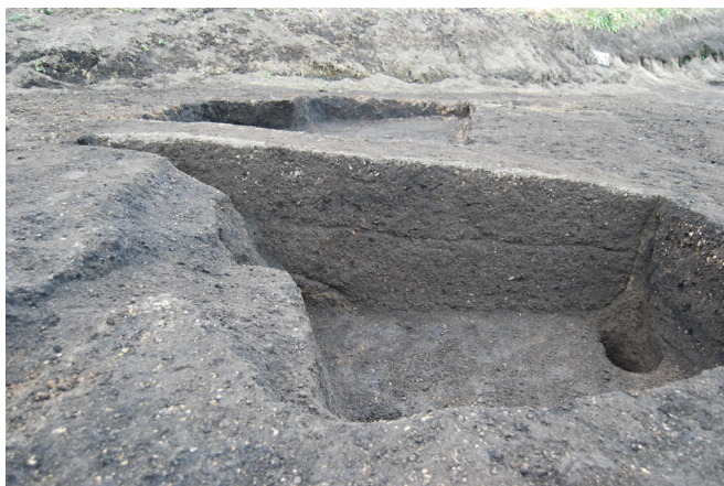
1. SX4 断面(南東から)