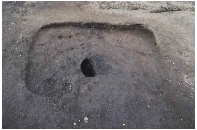
2. SI16 完掘（南東から）