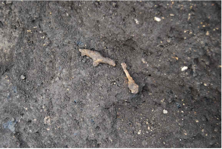
12. SI13-43 棒状鉄製品出土状況