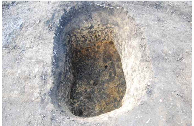
2. SKJ149 完掘（北から）