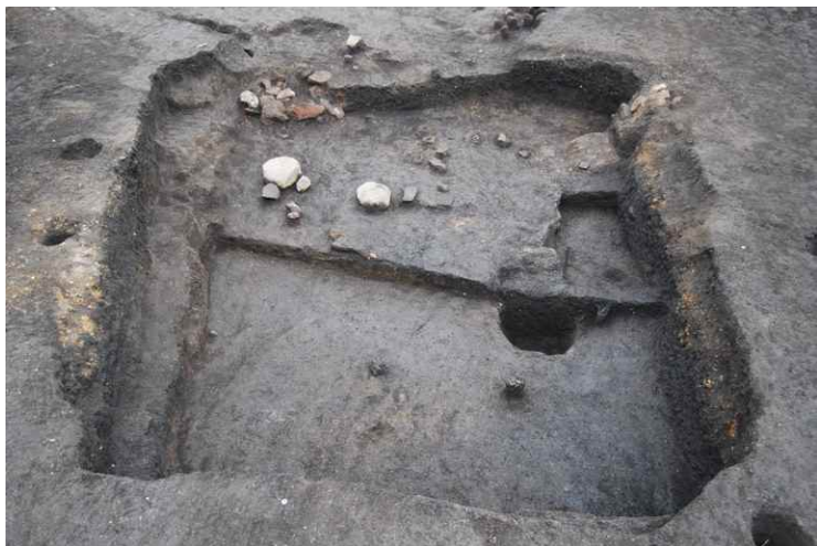
7. SI8-B 遺物出土状況 (南西から)