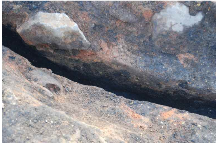
2. SI15 カマド断面 SPB-B' (西北から)