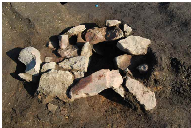
4. SI8-A カマド (南西から)