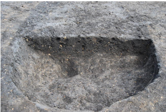
1. SK48 断面 SPA-A' (南から)