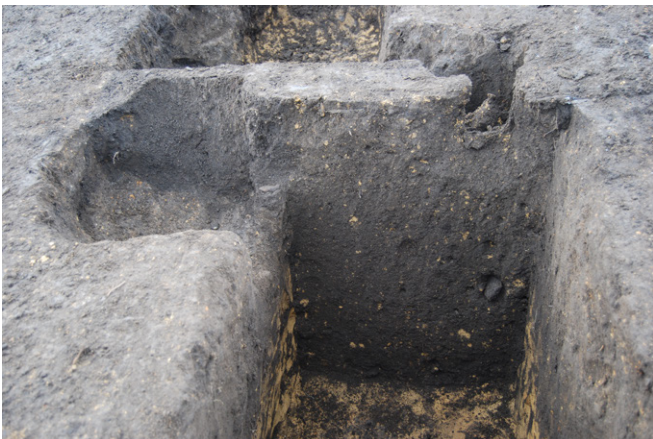
1. SK58, SK59 断面 SPA-A'（東南から）