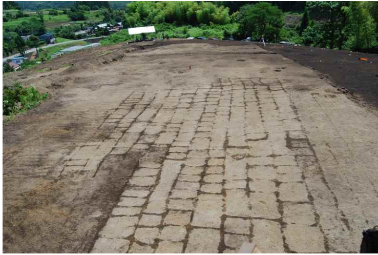
1. As-B 下耕作痕検出状況（西から）