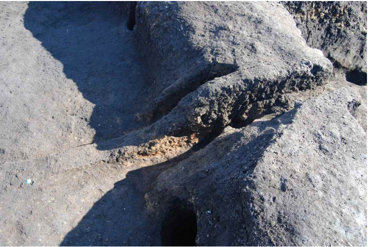
2. SI13-A カマド断面 SPB'-SPB(西から)