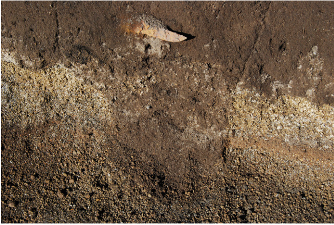
1. SK44短刀出土状況兼断面SPA-A' (東から)