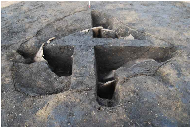
3. SKJ24 断面 SPA-A' (南から)