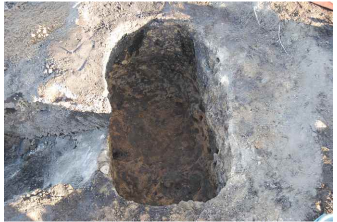
1. SKJ156 断面（西から）