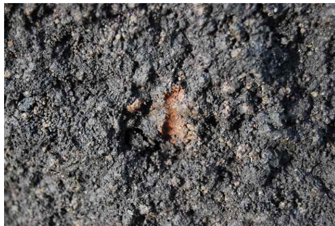
2. SK37遺物 (鉄) 出土状況(東から)