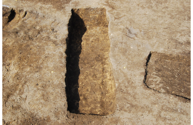
2. SK46 完掘 (南から)