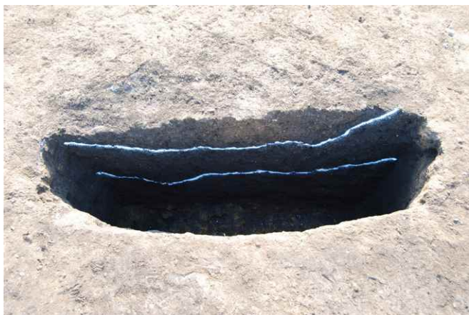
1. SKJ30 断面 SPA-A (東から)