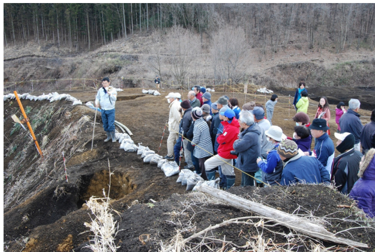
5. 2012. 3. 25現地説明会