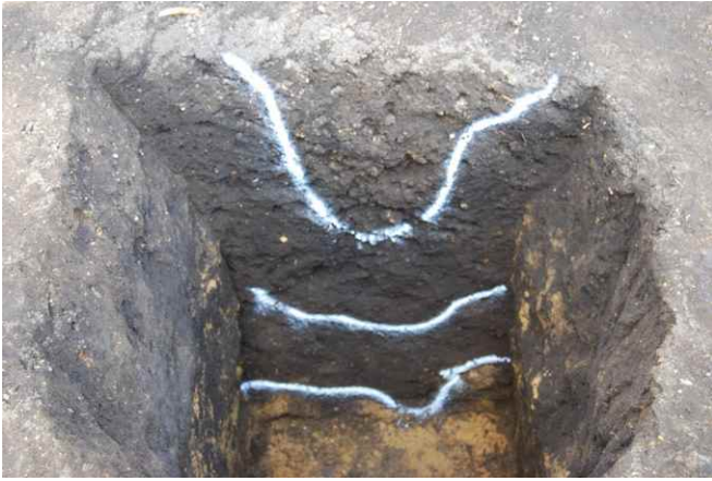
1. SKJ43 断面（南から）