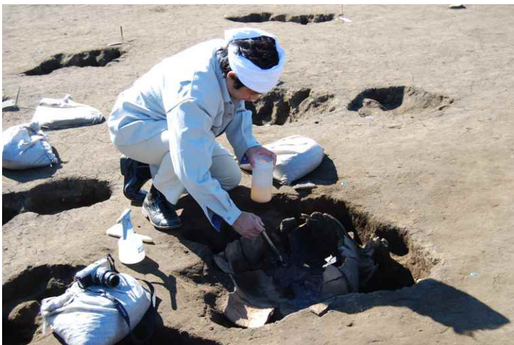
7. SKJ24 保存処理作業