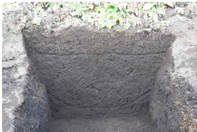
2. SK30 断面 (東から)