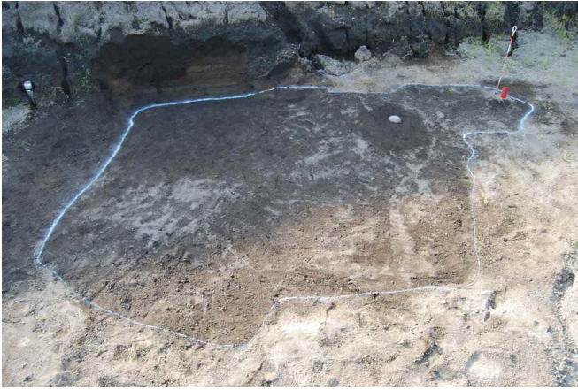
1. SI11確認および遺物出土状況(東から)