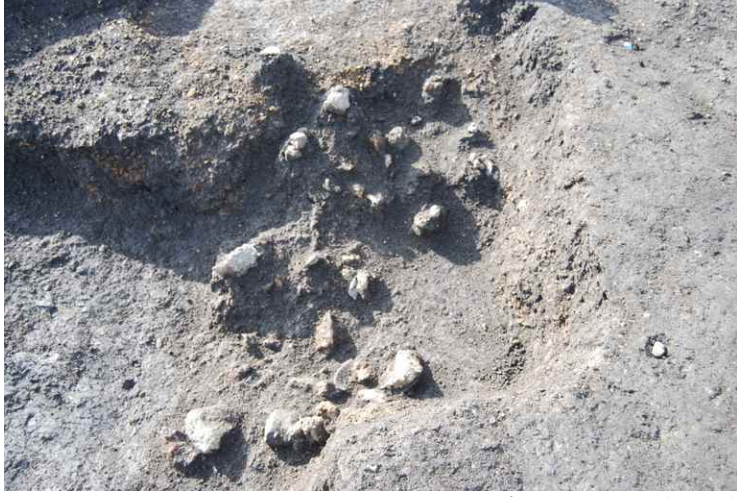
1. 上面遺物出土状況（東から）