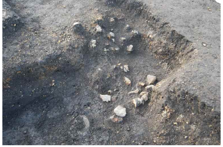
2. 中面遺物出土状況（東から）