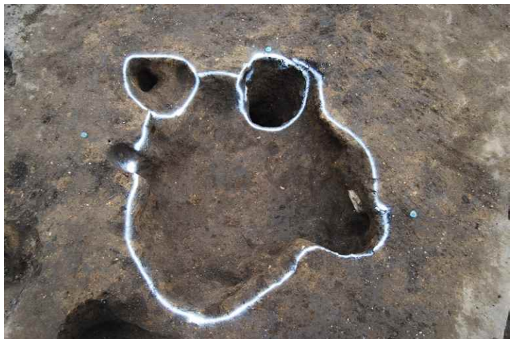
8. SKJ24 完掘 (東から)