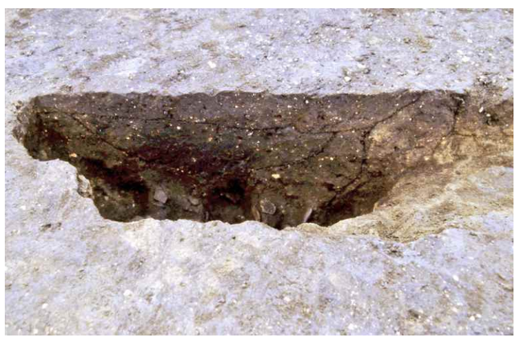
4. SKJ97 断面 SPA-A'（東から）