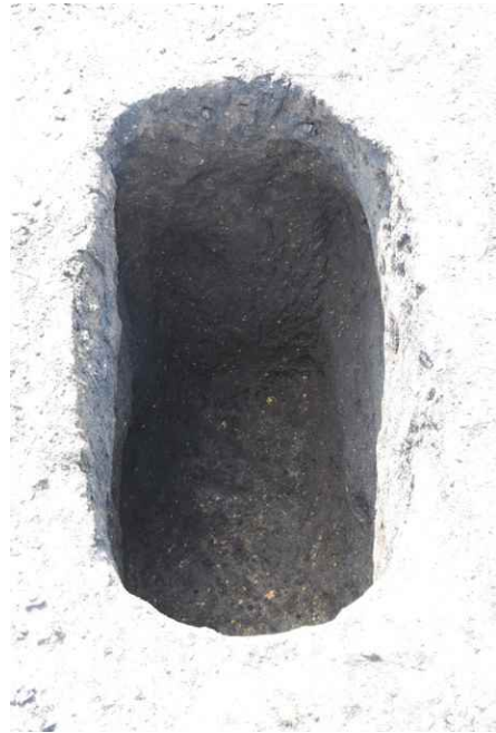
2. SKJ165 完掘（南から）