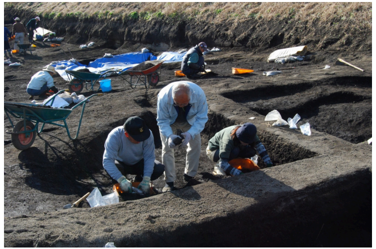
10. SI13作業風景(北東から)