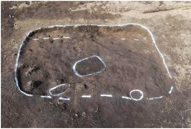
1. SI16 遺物出土状況（南東から）