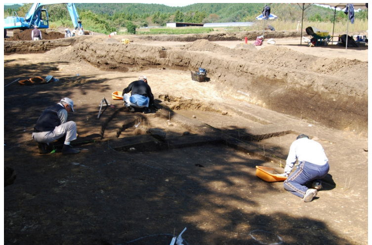
6. SIJ6作業風景(東南から)