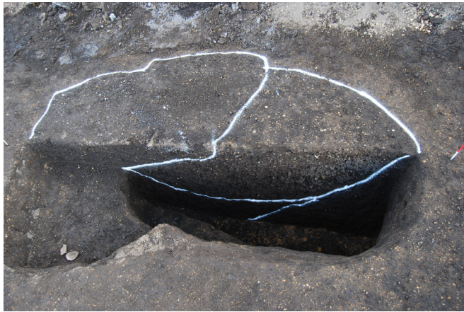
1. SKJ153-1(右深), 153-2(左浅) 断面(西から)