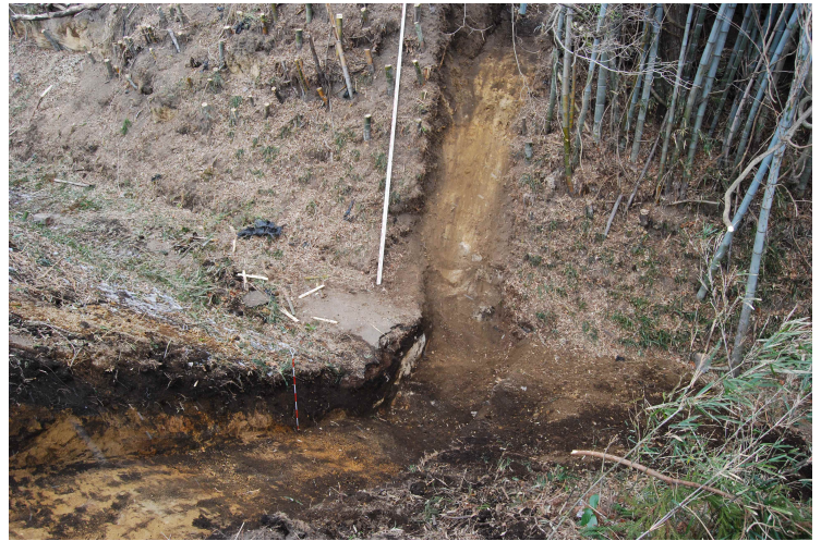
4. 堀切東側トレンチSPA-A(東南から)