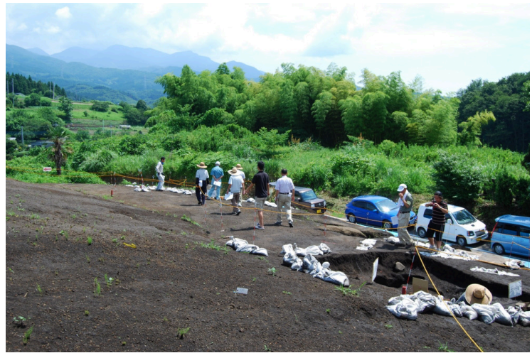
2. 2011. 8. 7現地説明会