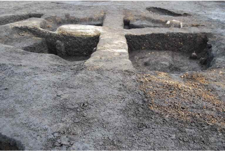
2. SI14 断面 SPB-B' (西南から)