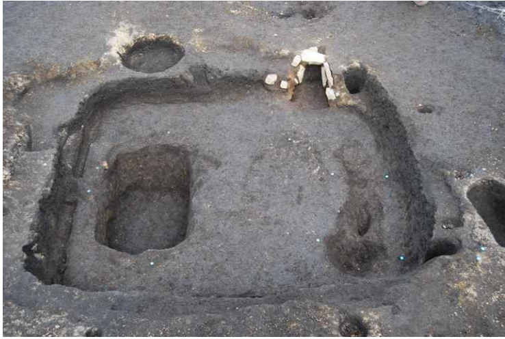
11. SI14 完掘 (西から)