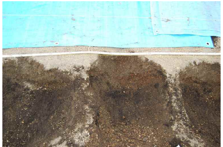
6. As-B 下耕作痕軽石堆積状況（北から）