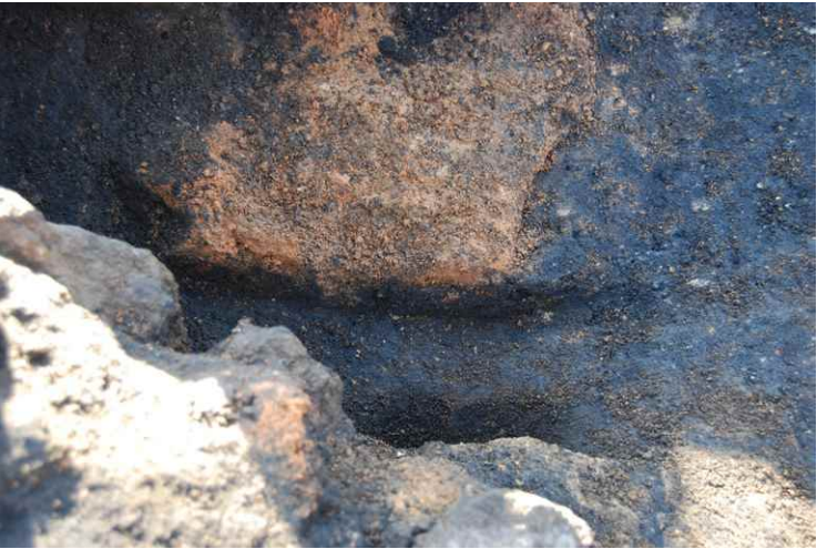
4. SI14 カマド追加断面 SPC-C' (北から)