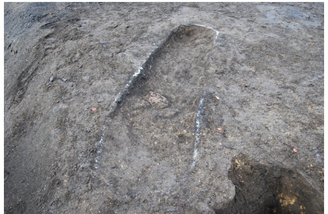
2. SK56 完掘（東から）