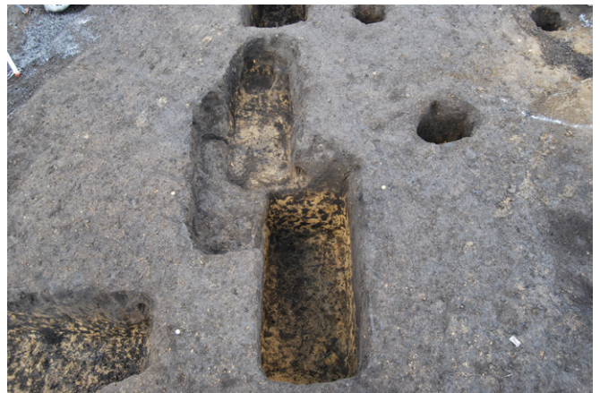
2. SK58( 奥 ) ,SK59 完掘（東から）