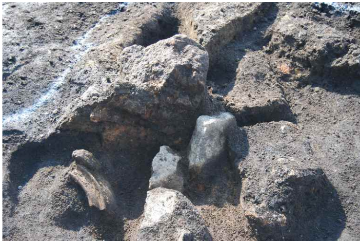
5. SI4 カマド断面 SPE-E' (南東から)