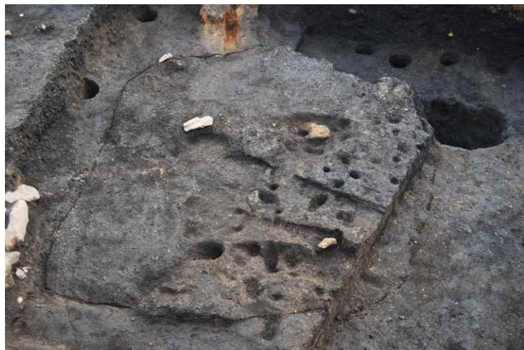
8. 鍛冶遺構 1 (西から)