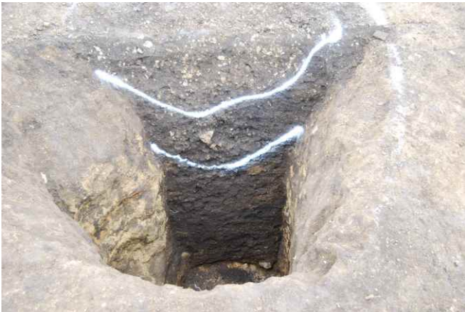
1. SKJ115 断面 SPA-A'（南から）