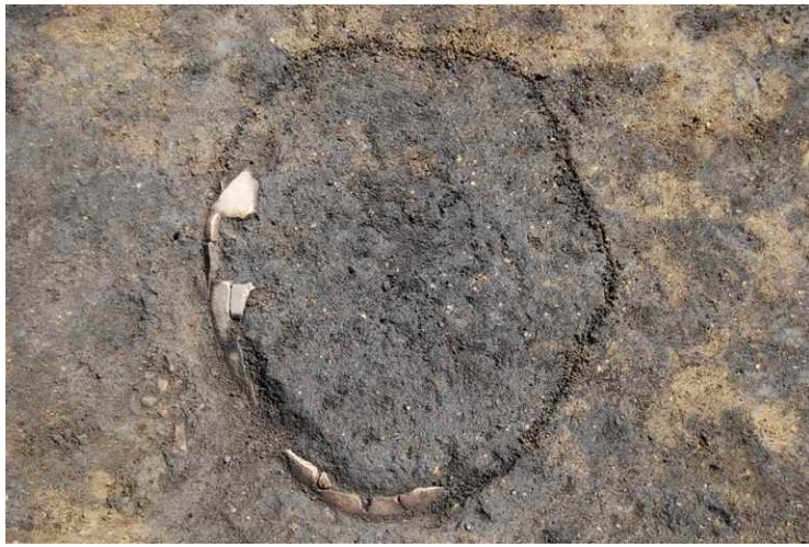
1. SKJ24 確認 (西から)