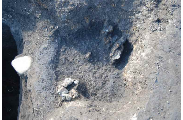
4. 床面遺物出土状況（北から）