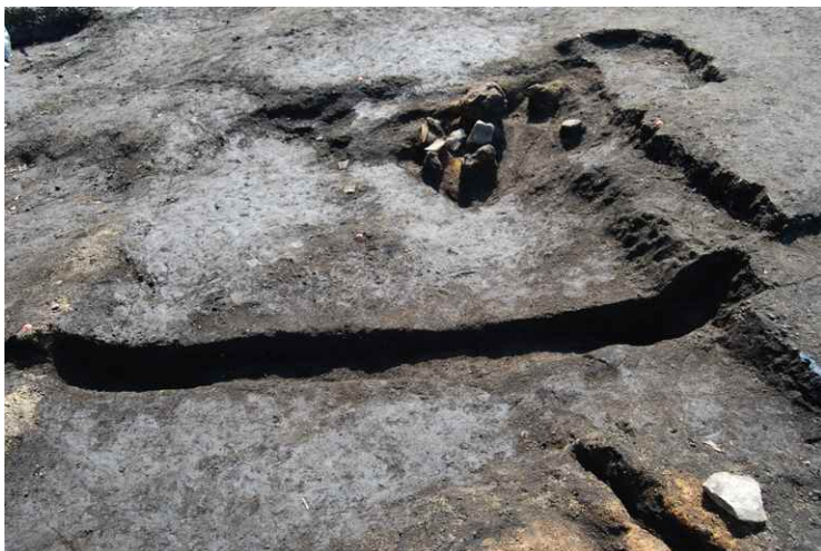
7. SI4 遺物出土状況 (東から)