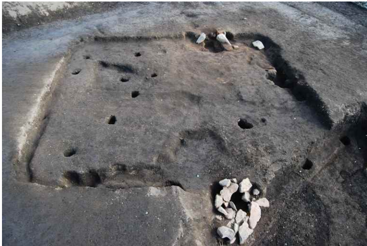
7. SI9 完掘（西から）