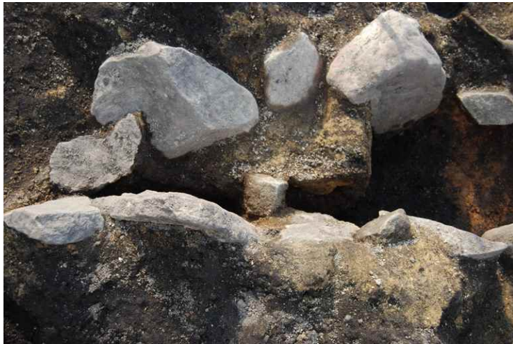
3. SI3 カマド断面 SPB-B'（東から）