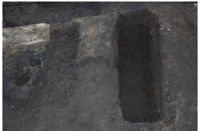
16-2. SK22（左浅）,23（右深）完掘（東から）