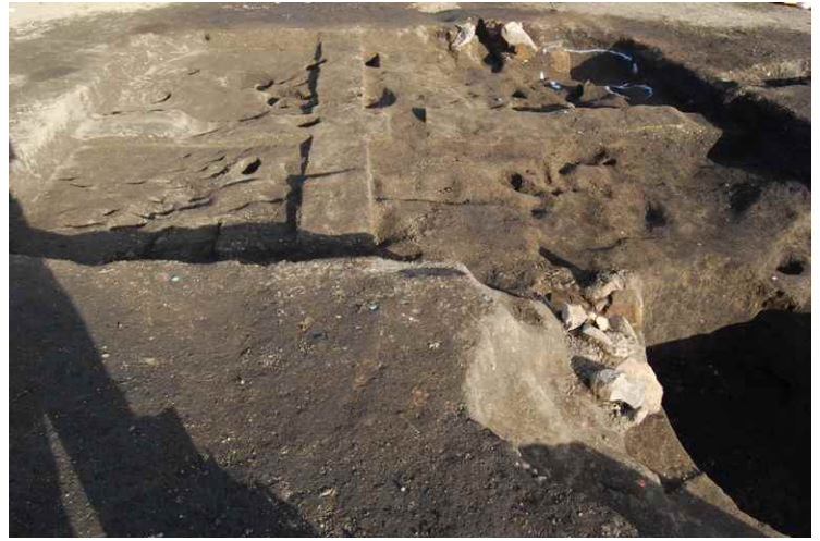
2. SI9 断面 SPA-A'（南から）