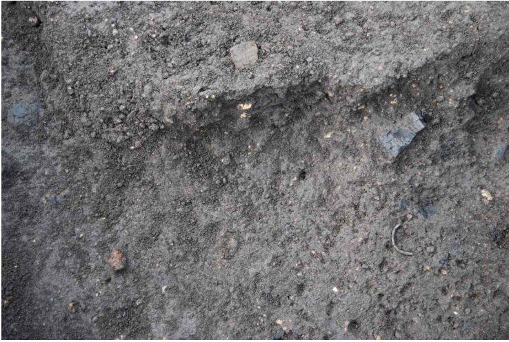
11. SI13-34 銅釧出土状況 (東南から)