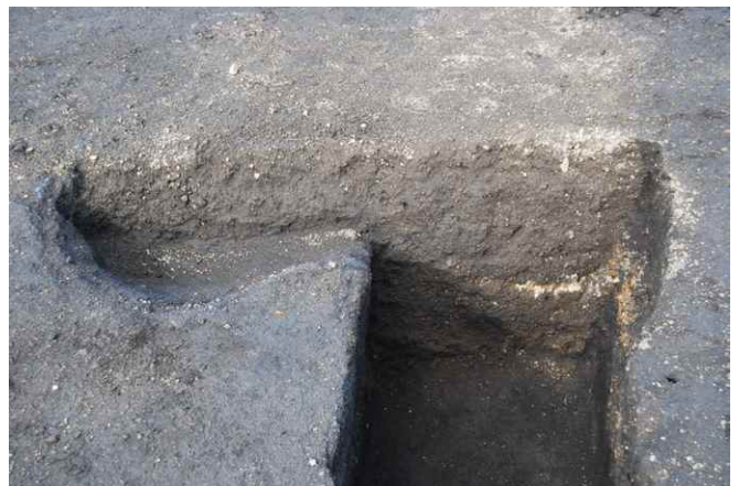
1. SK16 断面（東から）