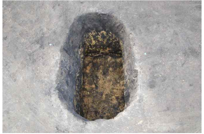
2. SKJ43 完掘（南から）