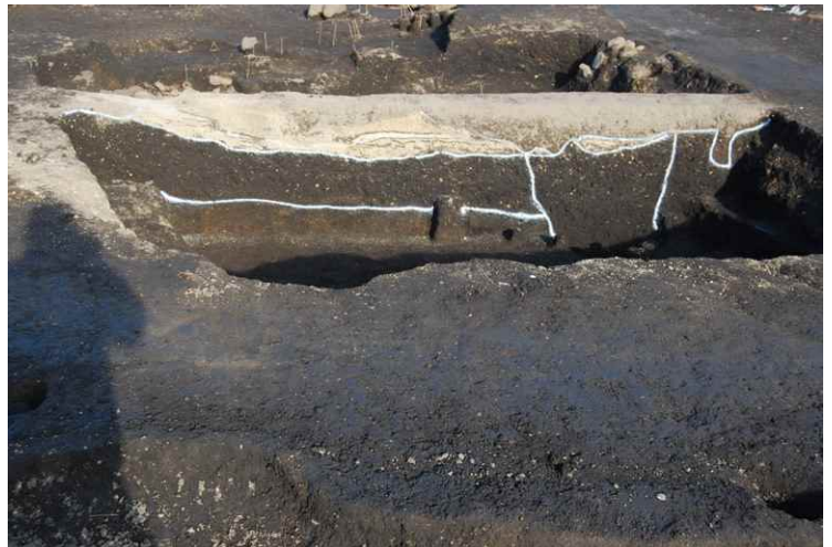
2. SI8-A 断面 SPB-B'（南西から）