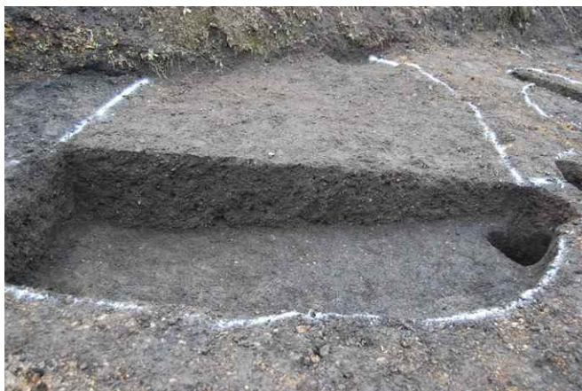
1. SK37断面 (B混) (東から)