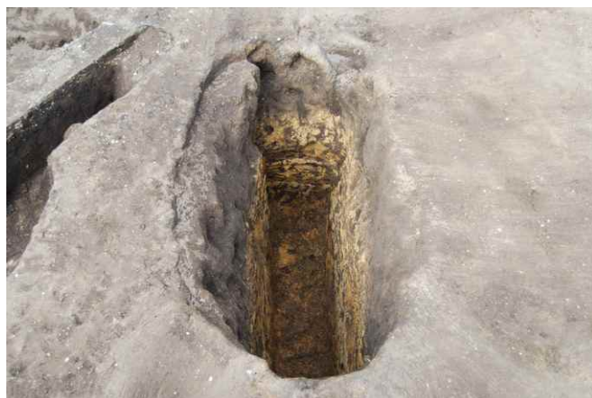
2. SKJ28 完掘 (南西から)