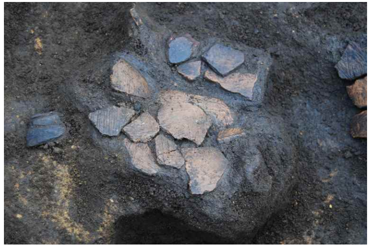
2. SKJ97 遺物出土状況近接（東から）