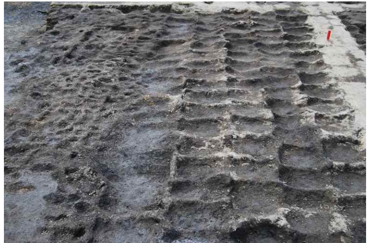
4. As-B 下耕作痕完掘南限（東から）