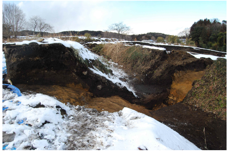
2. 堀切西側トレンチ(東から)