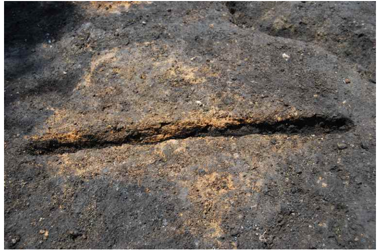
2. SI4 炉断面 SPB-B' (東から)