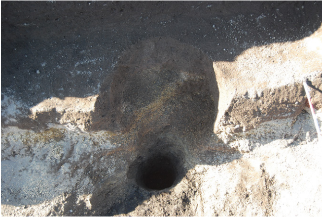
3. SK44完掘 (東から)