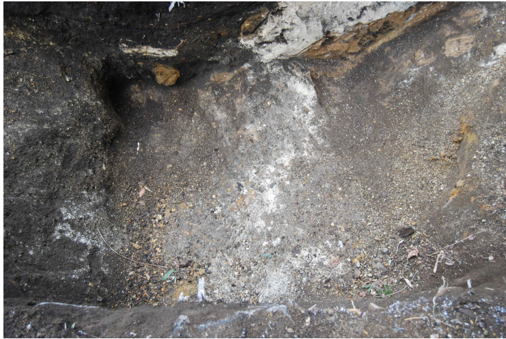
5. 堀切東側トレンチSPA-A底部(東から)