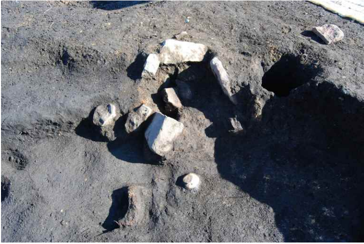
9. SI14 カマド遺物出土状況 (南西から)