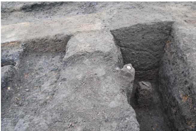
16. SK22（左浅）,SK23（右深）断面 SPA-A' と遺物出土状況（東から）