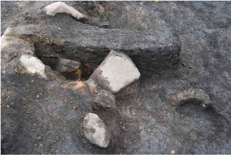
3. SI14 カマド断面 SPC-C' (北から)