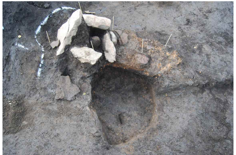
6. SI1 貯蔵穴付近遺物出土状況 (南から)