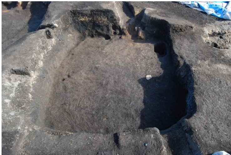
5. SI15 完掘 (南西から)