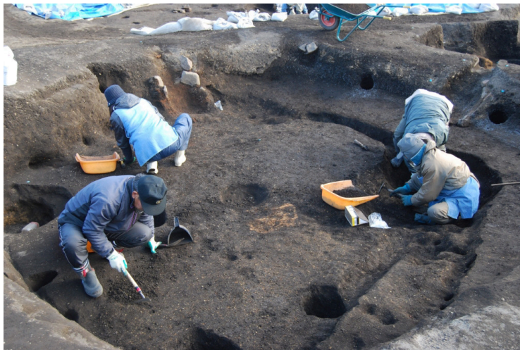
11. SI13作業風景(北西から)