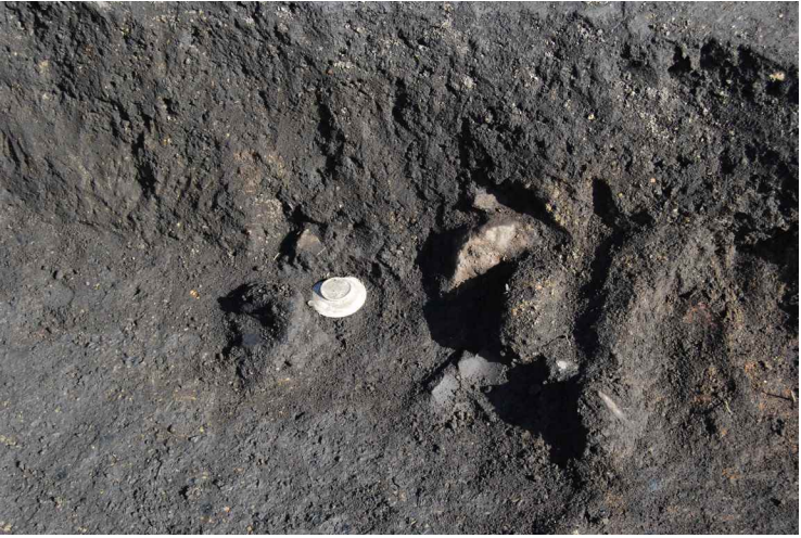
10. SI13-8 灰釉陶器出土状況 (南西から)