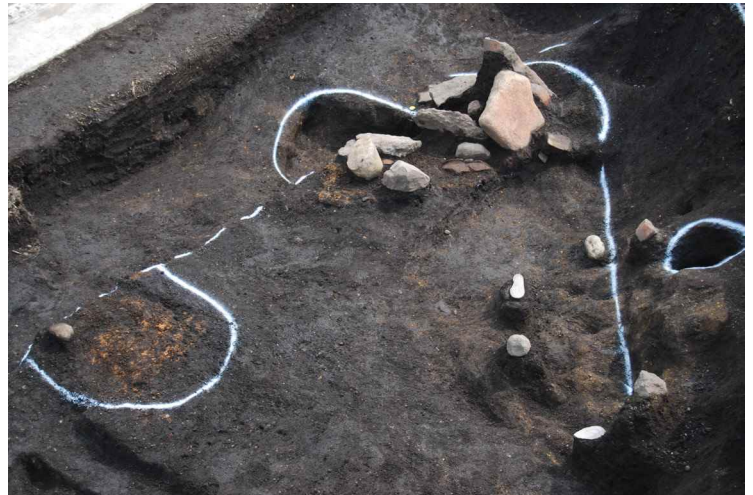
4. SI1 貯蔵穴付近物出土状況および炉 (北東から)