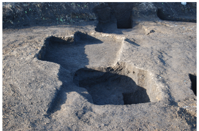
2. SX4 完掘(東から)