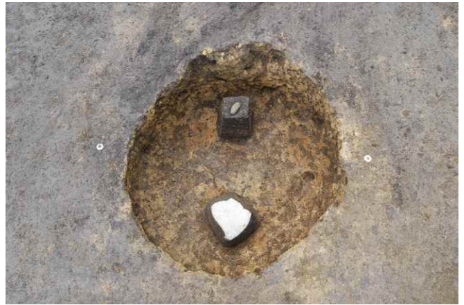
2. SKJ75 遺物出土状況（北から）