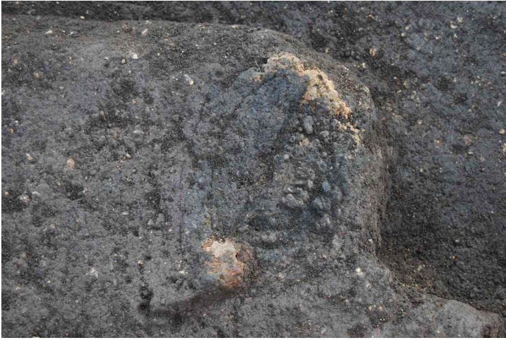
9. 鍛冶遺構 2 鍛冶炉 (北から)