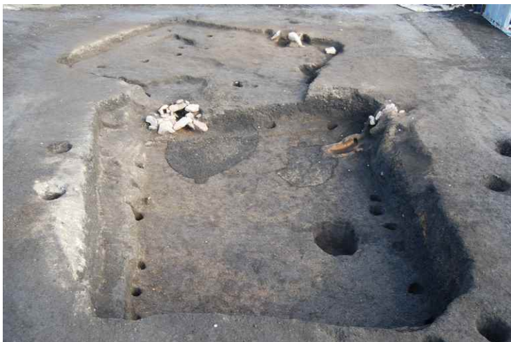
9. SI8-A, B, 鍛冶遺構 1 完掘 (南西から)