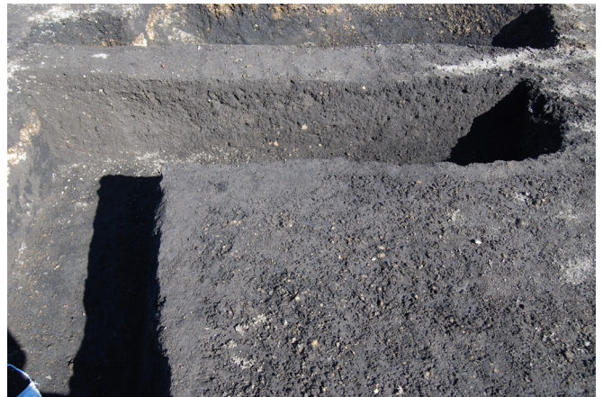
2. SX2 断面 SPA-A' 南側(西から)