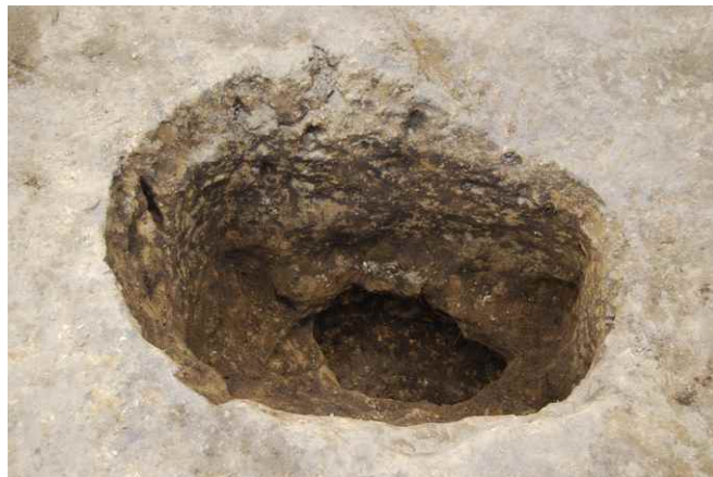
2. SKJ13 完掘 (東から)