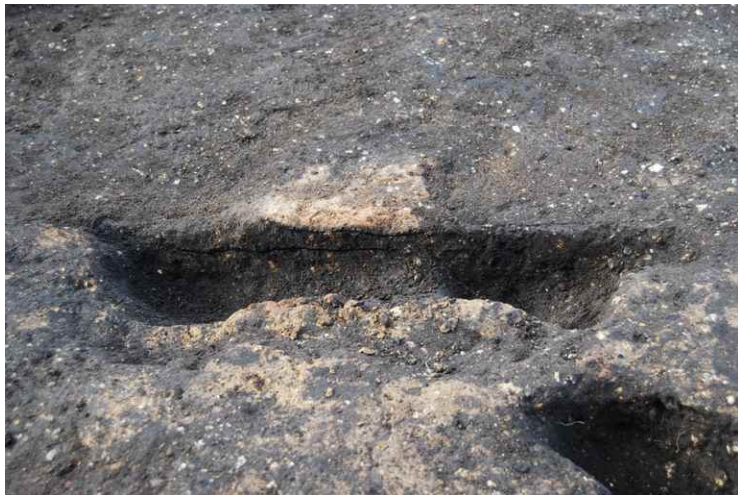
5. SI9 炉断面 SPD-D'（東南から）