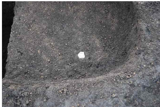
2. SK33遺物出土状況(東から)