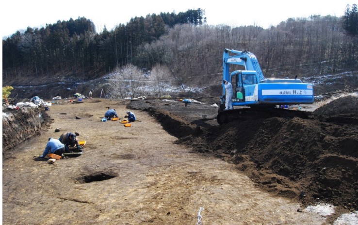
13. 2区3面掘削作業(南西から)