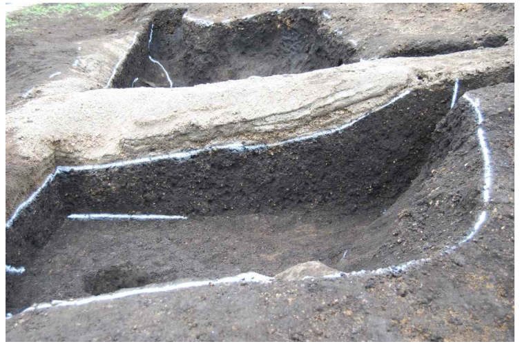
2 .SI1 断面 (東から)