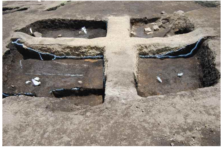
2. SI3- 断面 SPA'-SPA（北から）