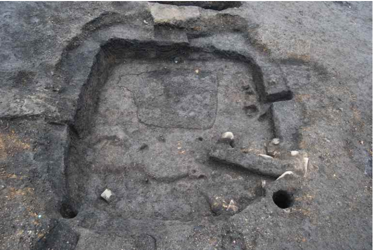
8. 鍛冶遺構2 鍛冶炉検出 (南から)