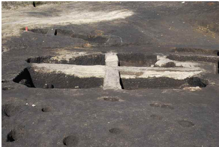
1. SI8-A 断面 SPA-A'（東南から）