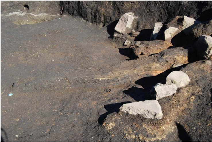
5. SI13-B カマド断面 (南から)