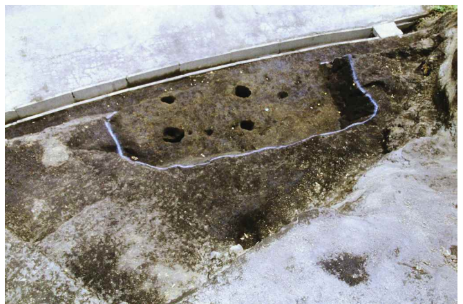
2. 451-SI3 完掘（北から）