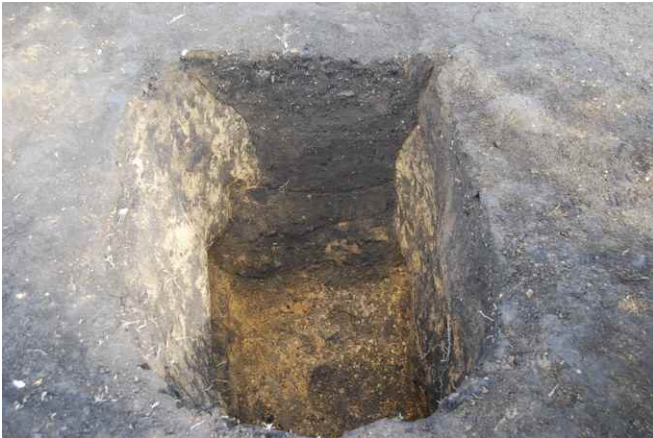
1. SKJ149 断面（南から）