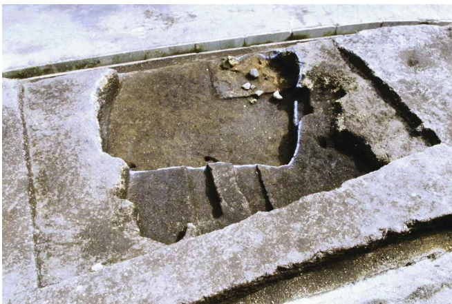
1. 451-SI2 遺物出土状況（西から）