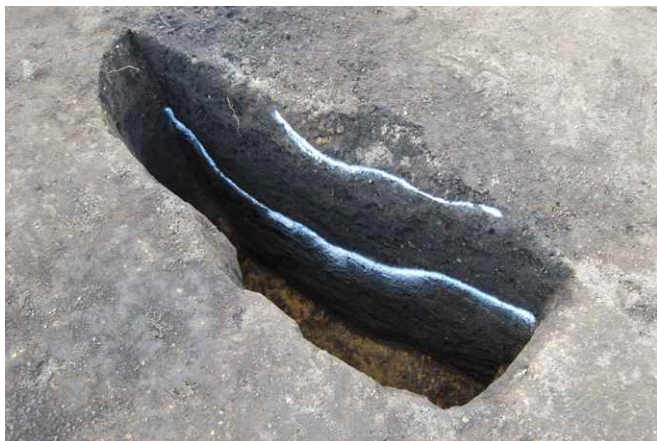
1. SKJ21 断面 SPA-A (南から)