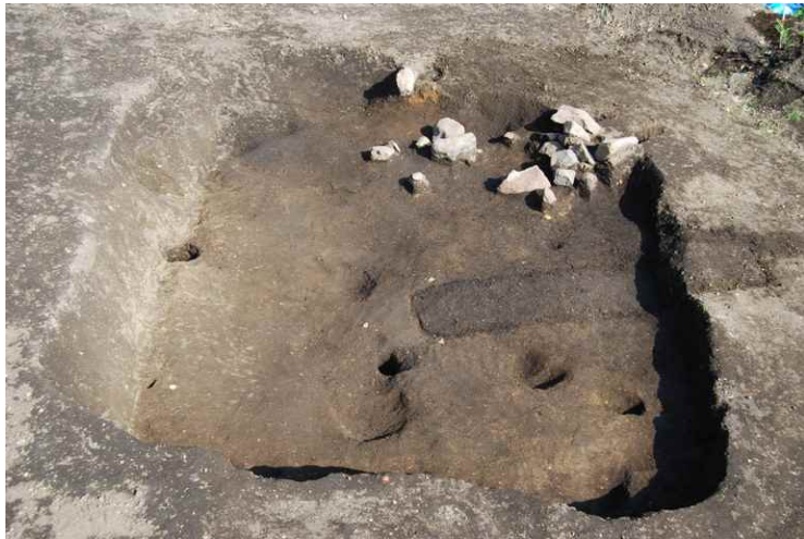
3. SI6 遺物出土状況（南西から）