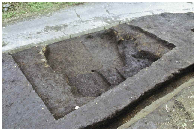
2. 451-SI2 完掘（西から）