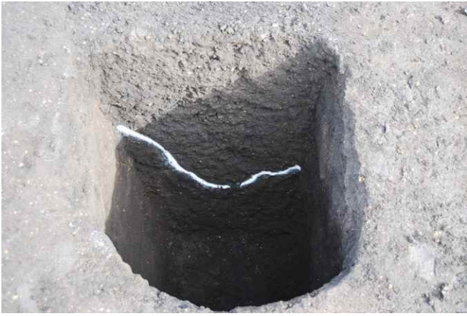
1. SKJ165 断面（西から）