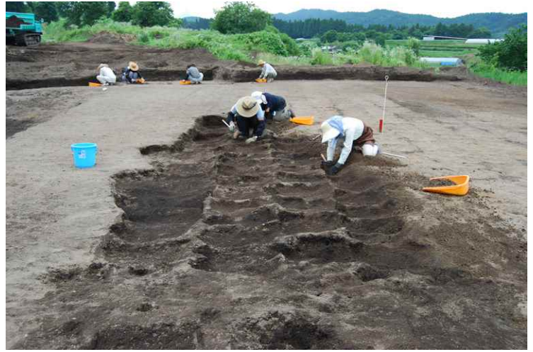
2. As-B 下耕作痕作業風景（南から）