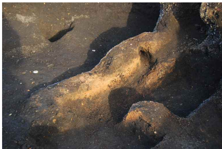
6. SI8-B カマド断面 SPA-A' (南西から)