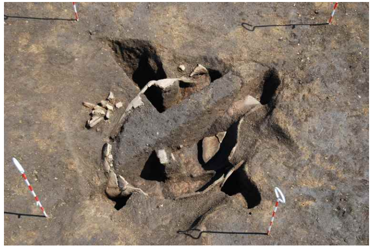
2. SKJ24 調査中全景 (南西から)