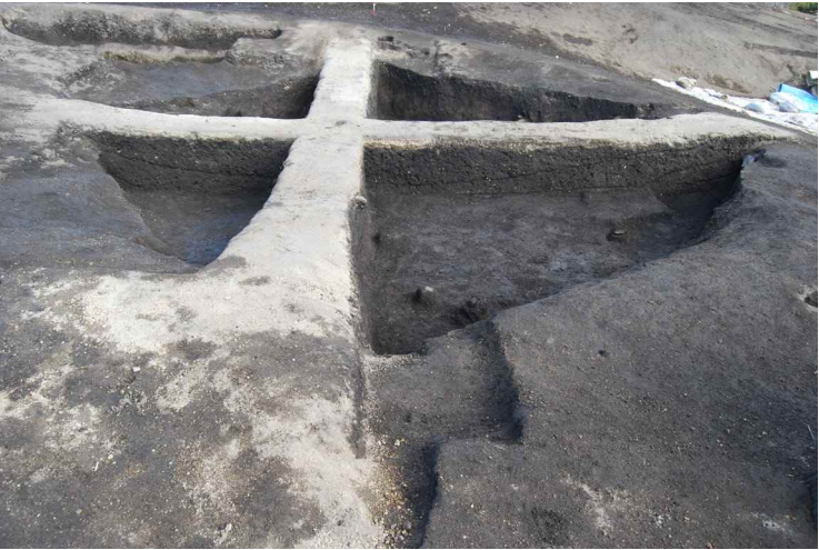
4. SI13-B 断面 SPB-B' (南西から)