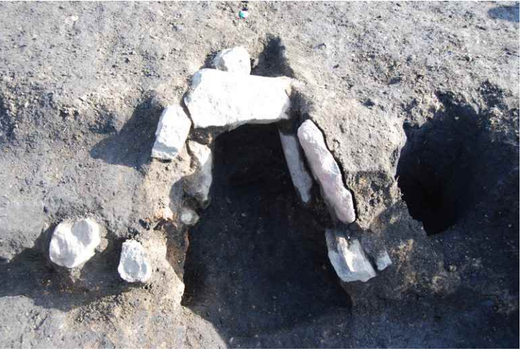
10. SI14 カマド完掘 (西から)