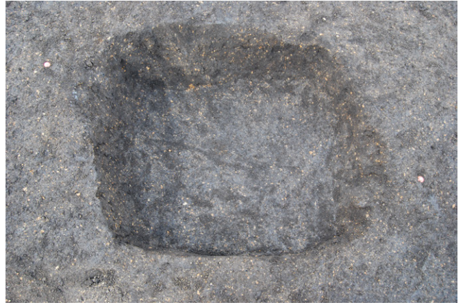
2. SK52 完掘（東から）