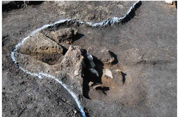
4. SI4 カマド断面 SPD-D' (南から)