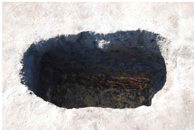
2. SKJ21 完掘 (北から)