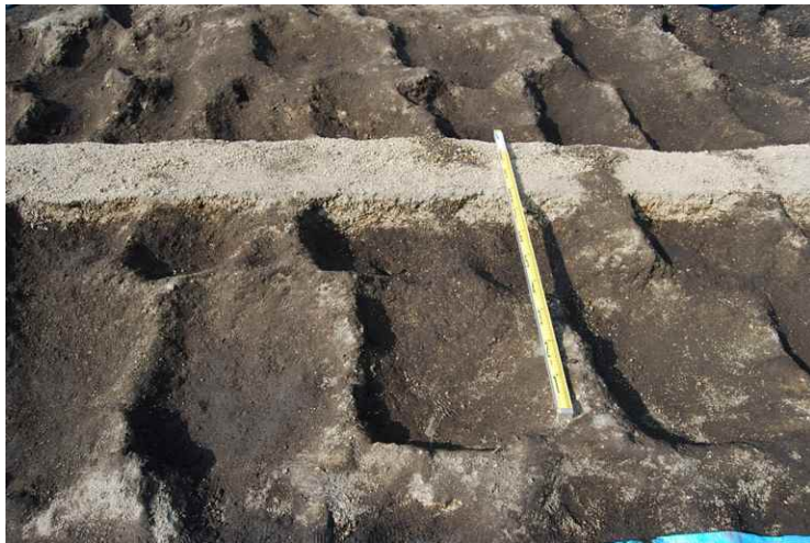
5. As-B 下耕作痕軽石堆積状況（南から）