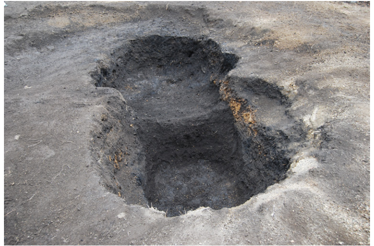
11. SZ1(手前深), SZ2(奥浅)完掘(北から)