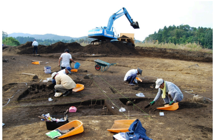
8. SIJ12作業風景(東南から)