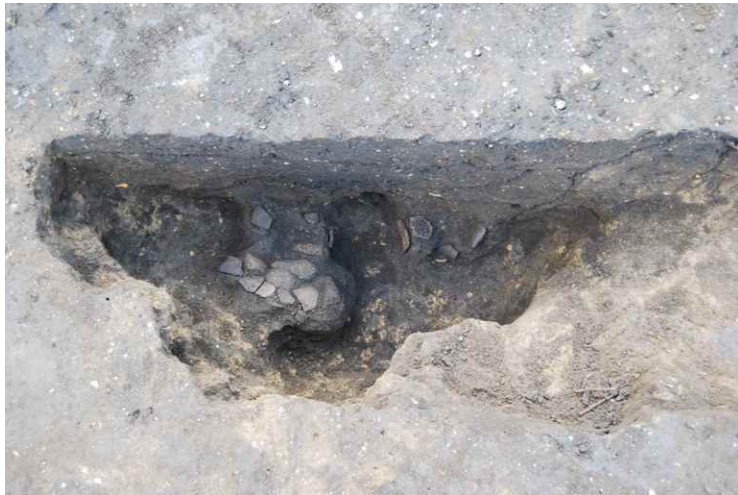
3. SKJ97 断面兼遺物出土状況（東から）