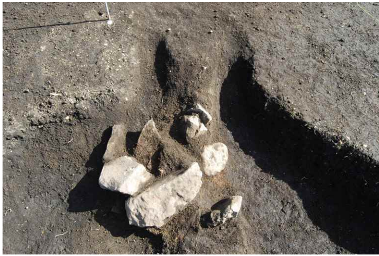
1. SI6 隅カマド近景（西から）