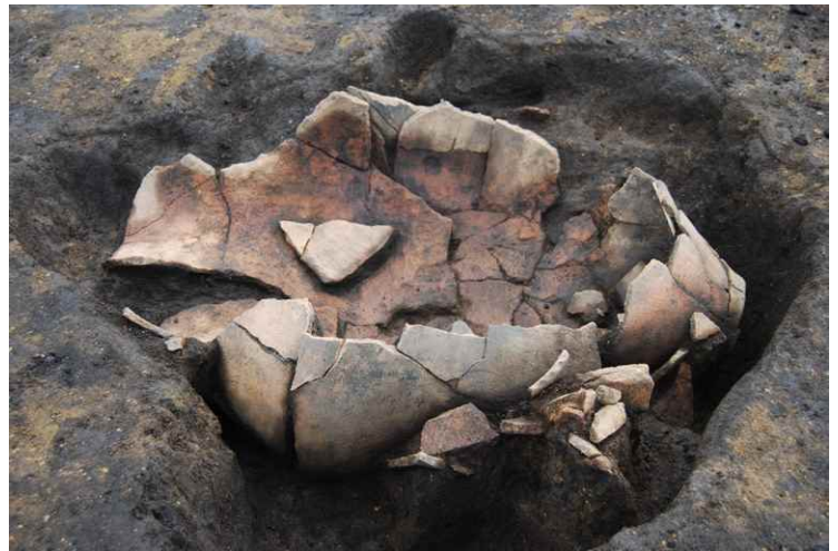
6. SKJ24 遺物出土状況 (北から)