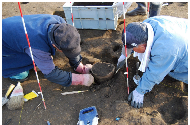
14. SIJ17-1深鉢取上作業(北から)