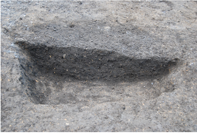
1. SK52 断面（東から）