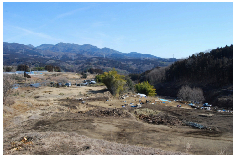
16. 2012. 2. 21調査中全景(南西から)