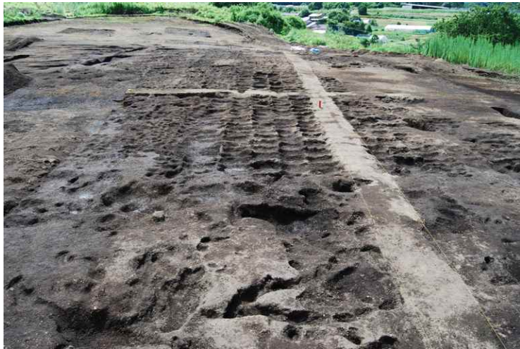
3. As-B 下耕作痕（東から）