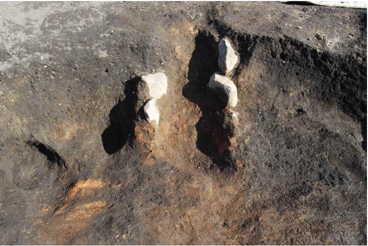
6. SI13-B カマド完掘 (西から)