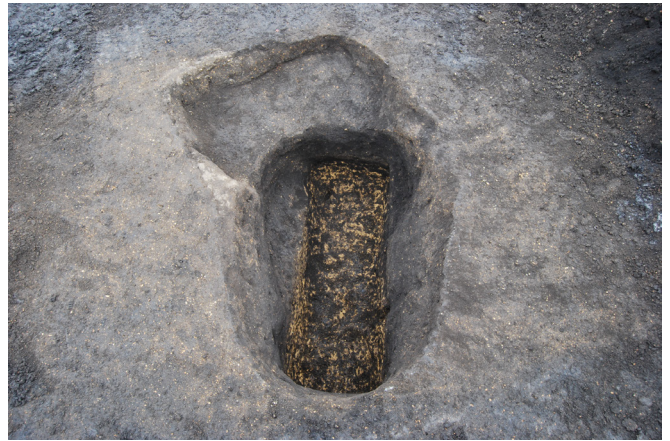
2. SKJ153-1(下深), 153-2(上浅) 完掘(南から)