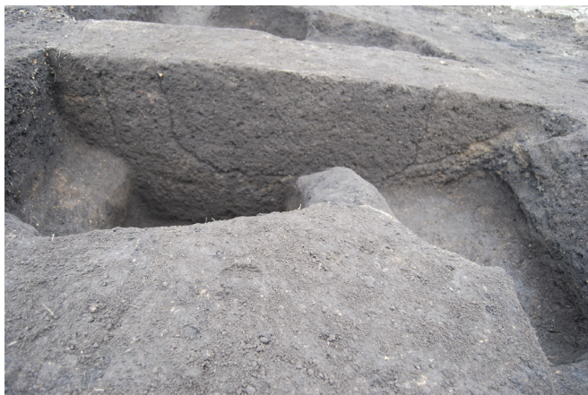
1. SX3 断面(西から)