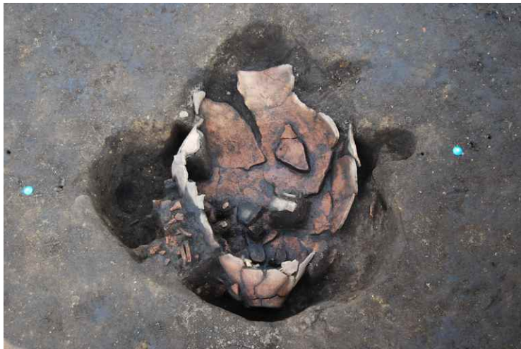
5. SKJ24 遺物出土状況 (西から)