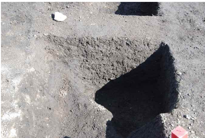
1. SK14 断面 SPA-A'（東から）