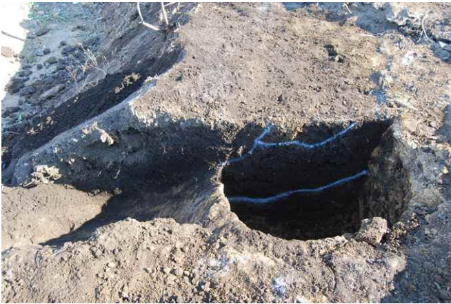
1. SKJ156 断面（西から）