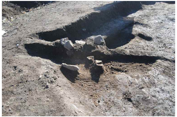
2. SI6 隅カマド断面 SPA-A'（北から）