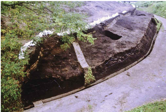
73. 一次調査（451）調査区 As-B 除去後全景（南から）