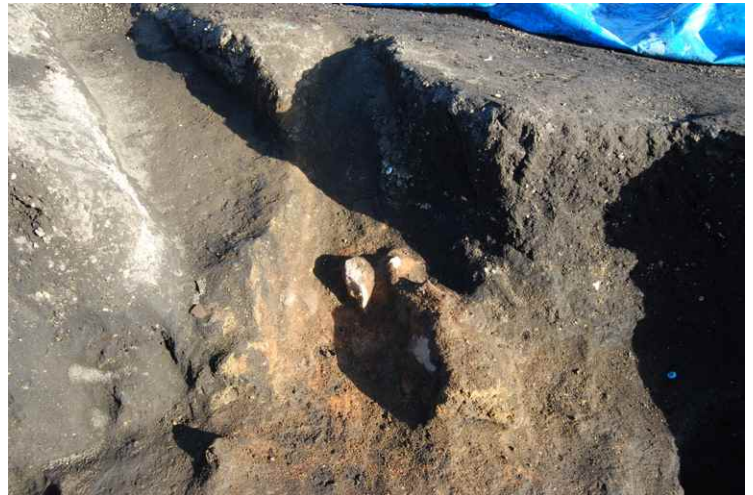
4. SI15 カマド完掘 (南西から)