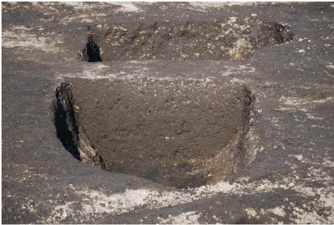
1. SK9 断面（南から）