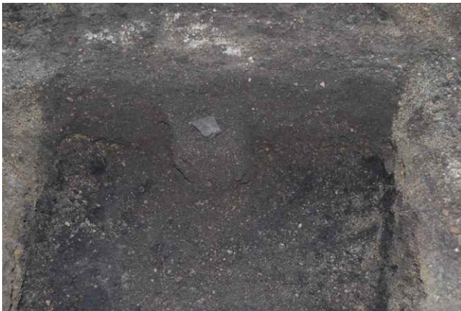
1. SK11 断面（北から）