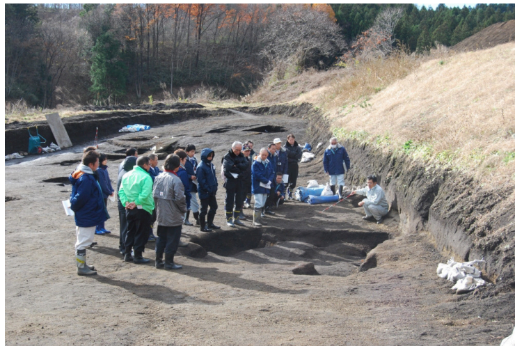
3. 2011. 12. 5現地見学会