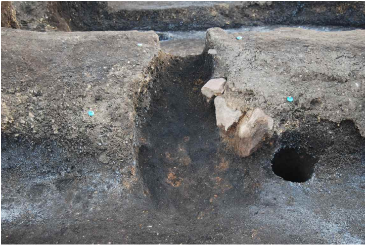
3. SI13-A カマド完掘 (北から)