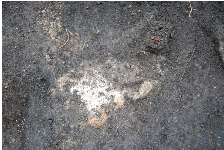
10. SZ2灰・釘出土状況(北から)