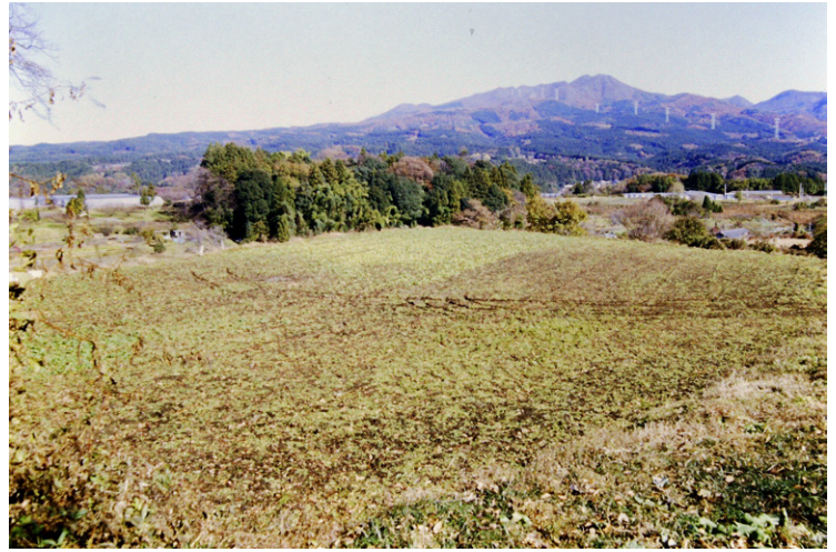
2. 2次調査着手前全景(南西から)