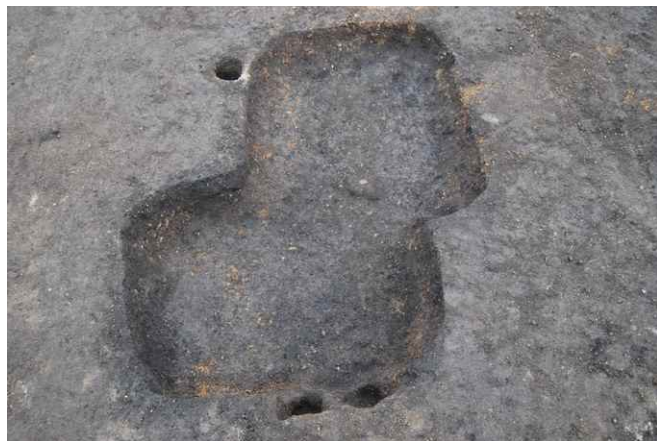
2. SK27, SK28 完掘 (北から)