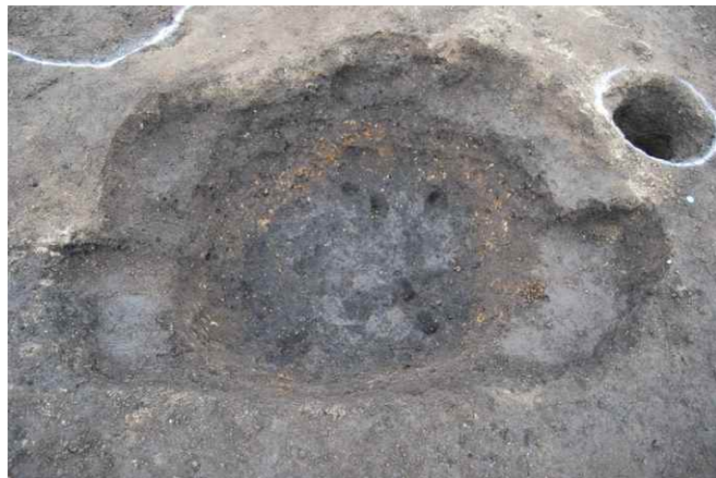
2. SK24 完掘 (南から)