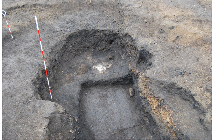
9. SZ2焼土・釘等出土状況(北から)