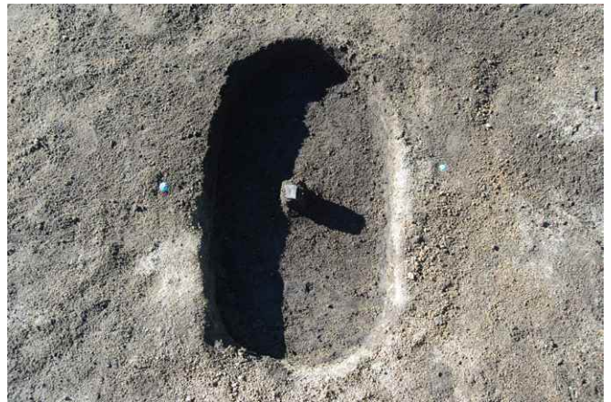
2. SK11 遺物出土状況（北から）