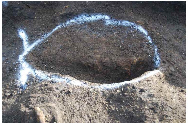
6. SI9 貯蔵穴断面 SPE'-SPE（北から）