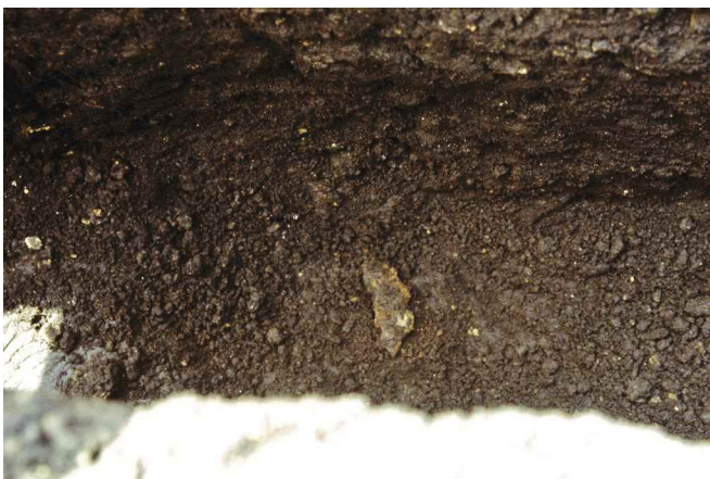
1. 451-SI3 鉄製品出土状況（東から）