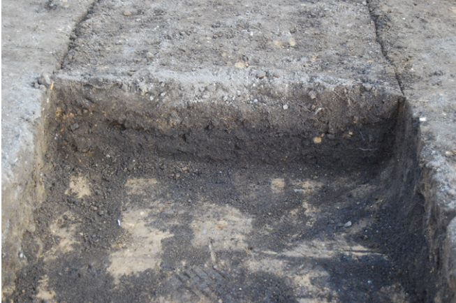
1. SK46 断面 (北から)