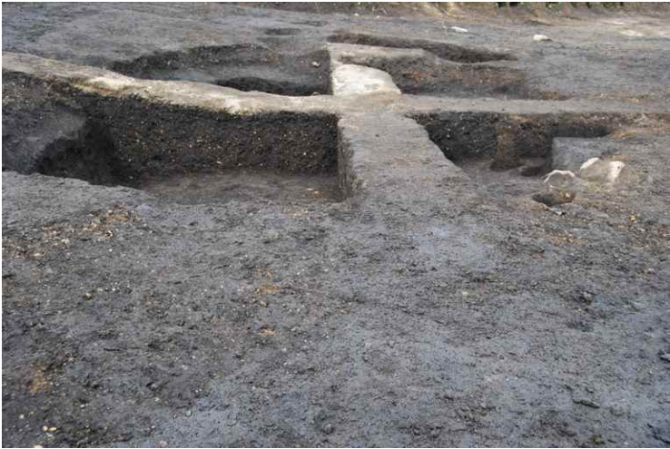
1. SI14 断面 SPA-A' (南東から)