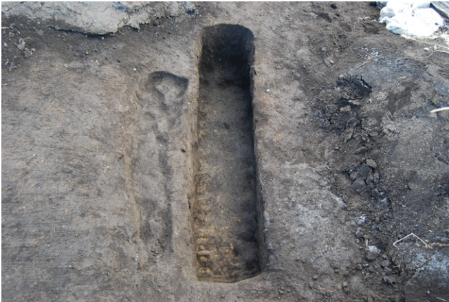
1. SK54( 右深 ) ,SK55 完掘（北西から）