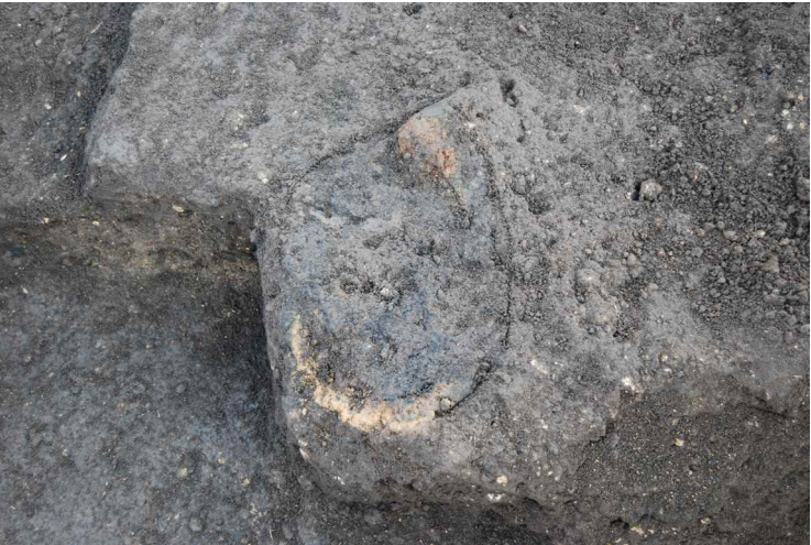
8. 鍛冶遺構 2 鍛冶炉検出 (南から)