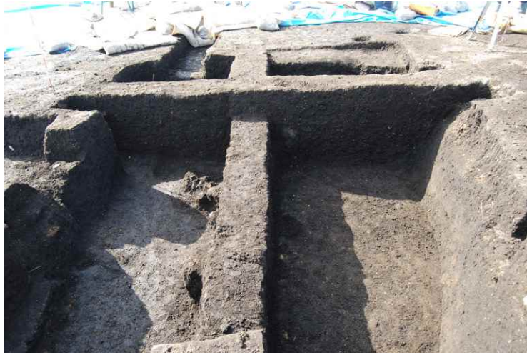
1. SI15 断面 SPA-A' (東から)