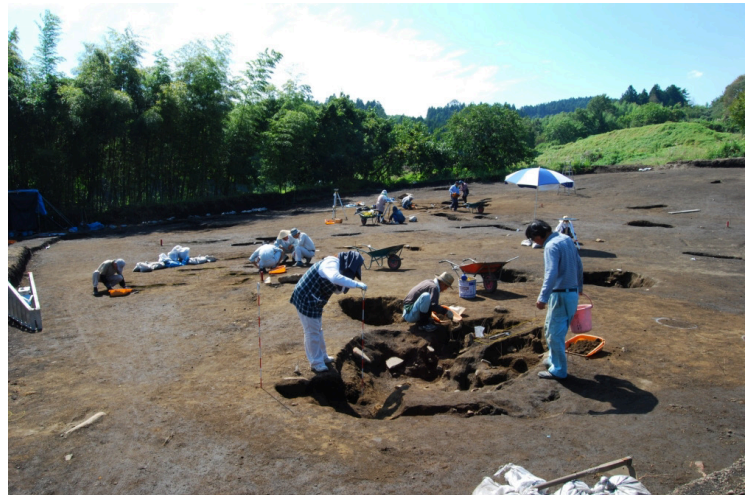
4. 1区西作業風景(北東から)