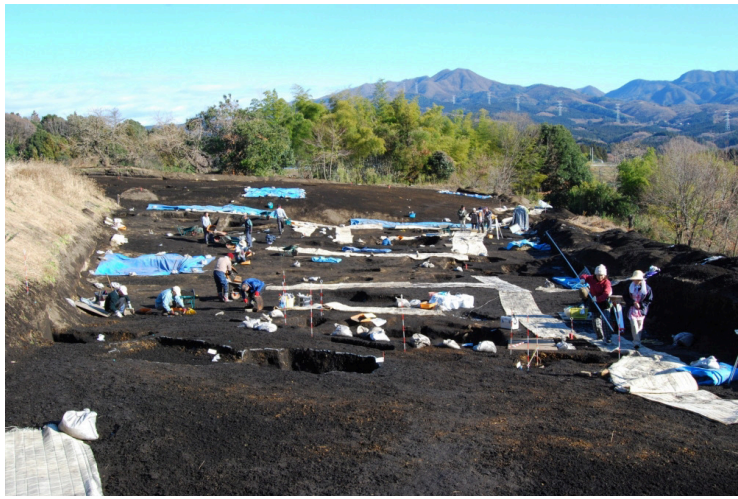
9. 2区作業風景(南から)