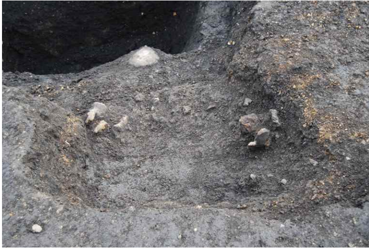
3. 遺物（羽口）出土状況（西から）