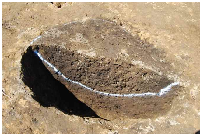
1. SKJ13 断面 SPA-A (東から)