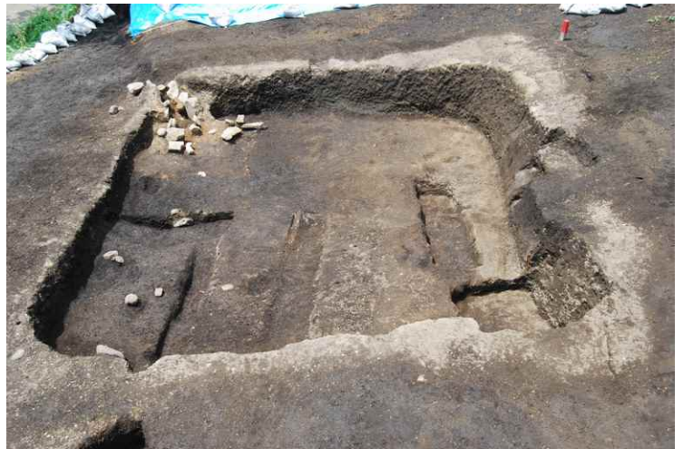
6. SI3 完掘（東から）