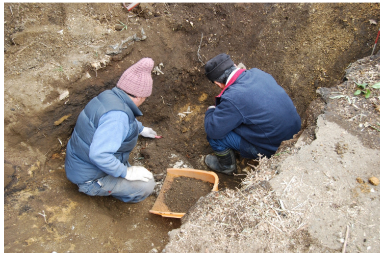
12. 堀切トレンチ作業風景(北西から)