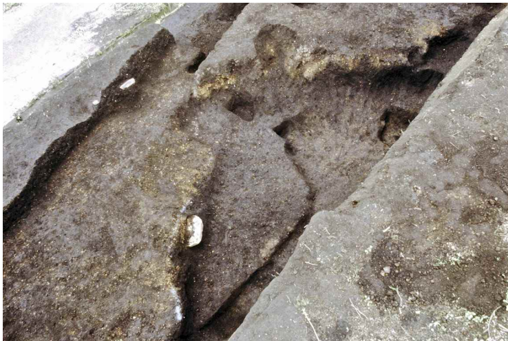
5. SI1 完掘 (1次調査) (北から)