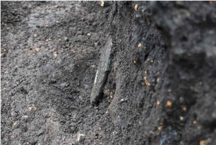
7. SI14-6 八稜鏡出土状況近景 (東から)