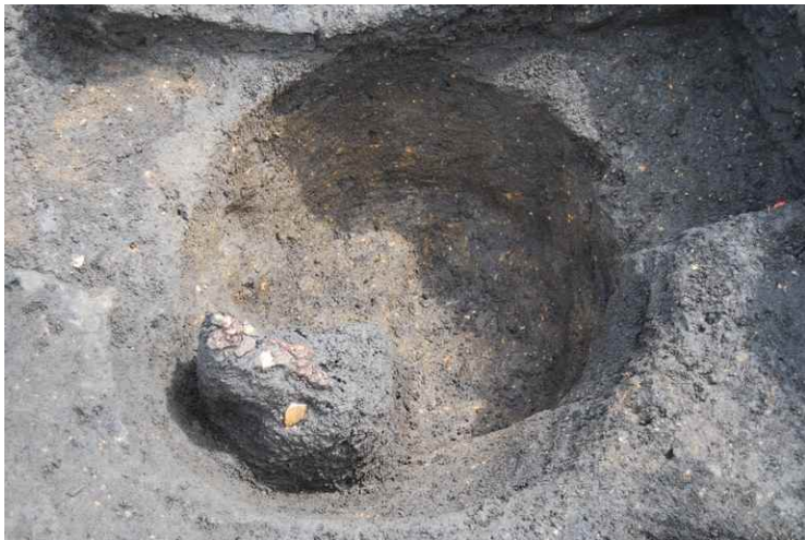
5. SI3 貯蔵穴内遺物（鎌）出土状況（西から）