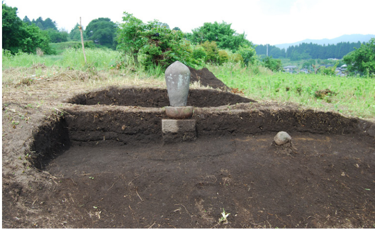
3. SZ1断面SPA-A' 上半(東から)