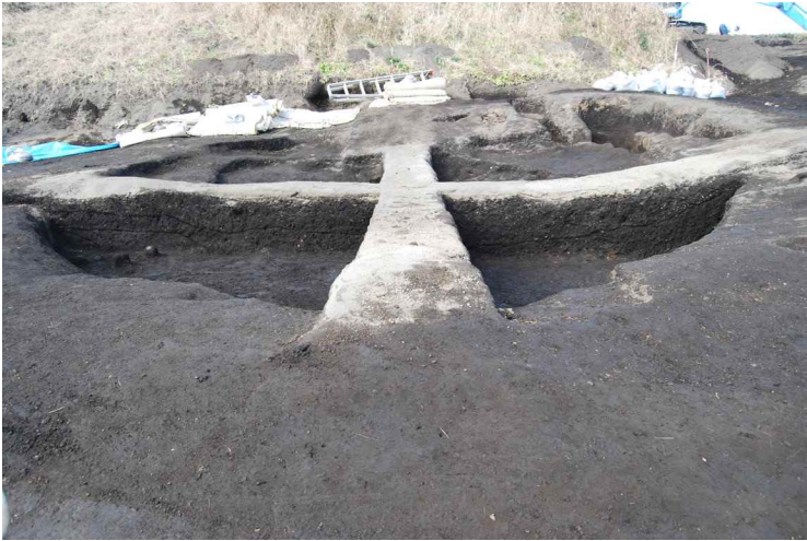
1. SI13-A 断面 SPA-A' (東)