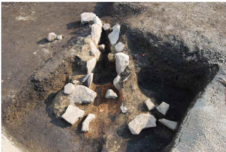
7. SI3 カマド完掘（北東から）