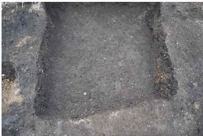
1. SK30 洪武通宝出土状況 (東から)