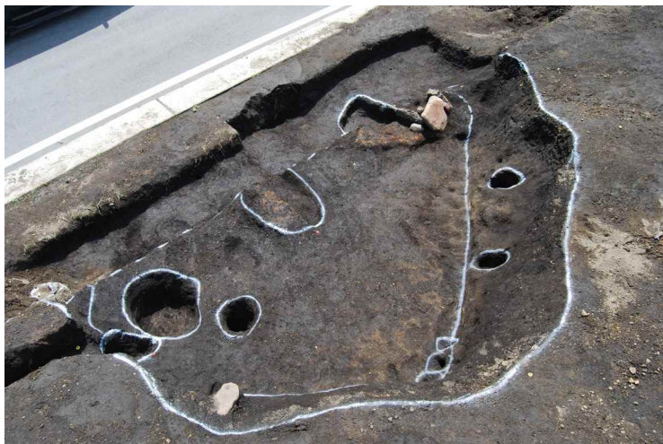
7. SI1 完掘 (北から)