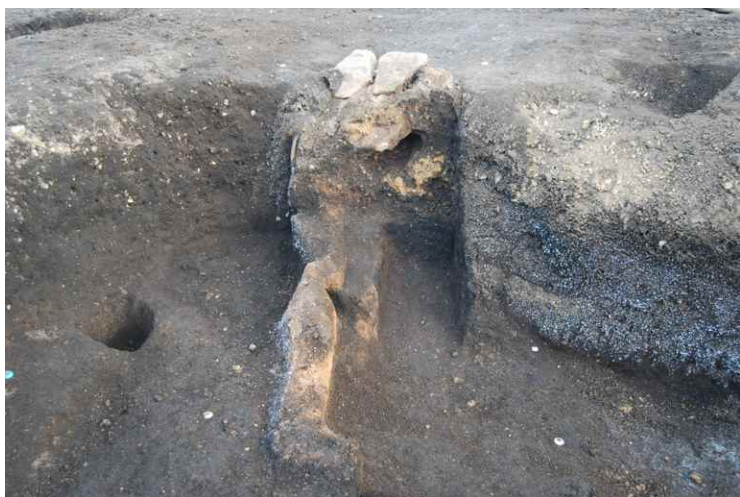
5. SI8-B カマド断面 SPB-B' (西北から)