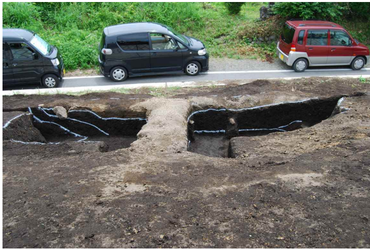
1. SI1 断面 SPA-A' (北から)