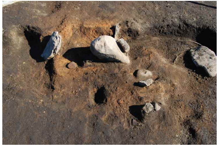
4. SI9 カマド断面 SPC-C'（南西から）