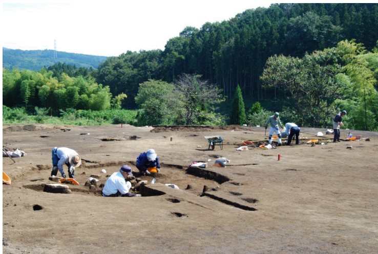
5. 1区東側作業風景(北西から)