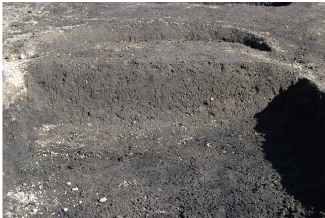
1. SX2 断面 SPA-A' 北側(西から)