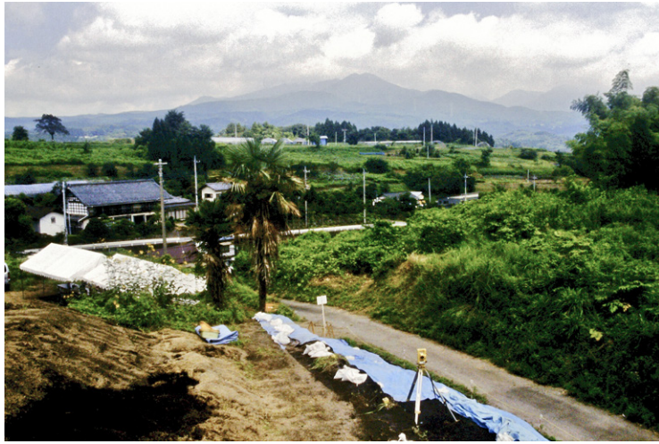
1. 1次調査発掘区より榛名山を望む（西から）