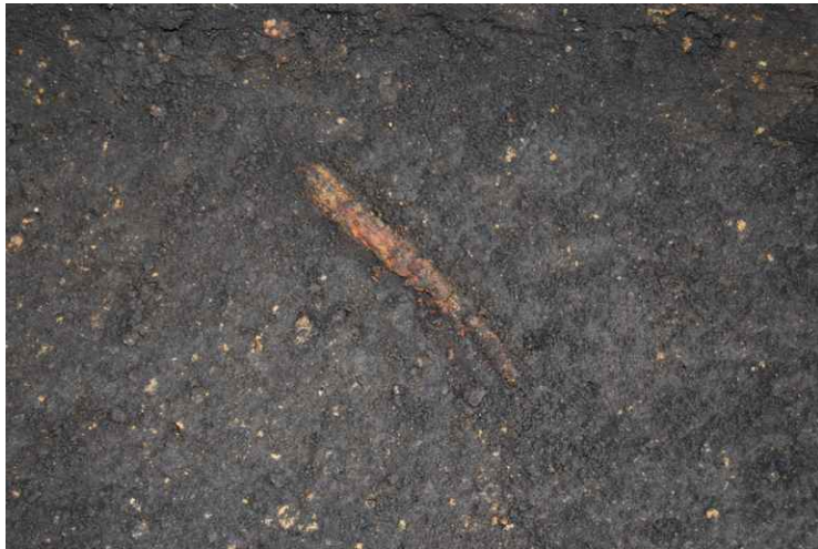
3. SI15-25 刀子近景 (西から)