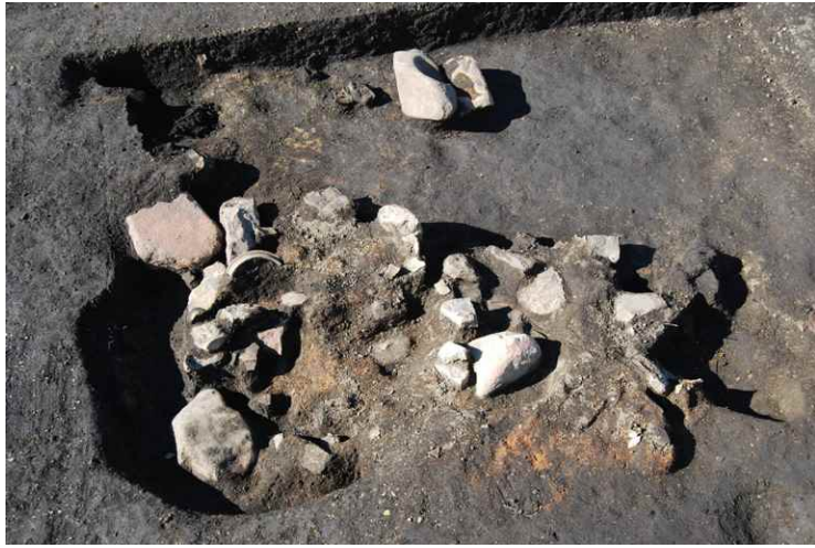
1. SI9- カマド付近遺物出土状況（北東から）