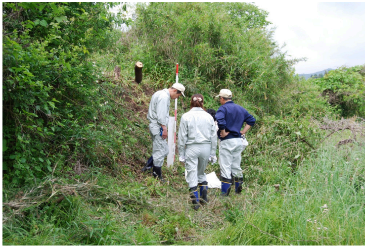
1. 県土木立会急傾斜標柱確認