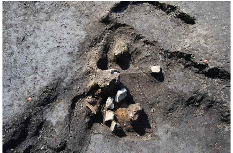
6. SI4 カマド遺物出土状況 (南から)