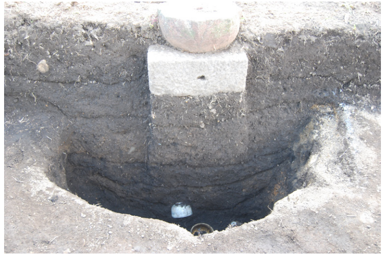
4. SZ1断面SPA-A' 近接(東から)