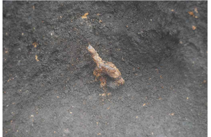
2. SI17-3ヤス先出土状況(北から)