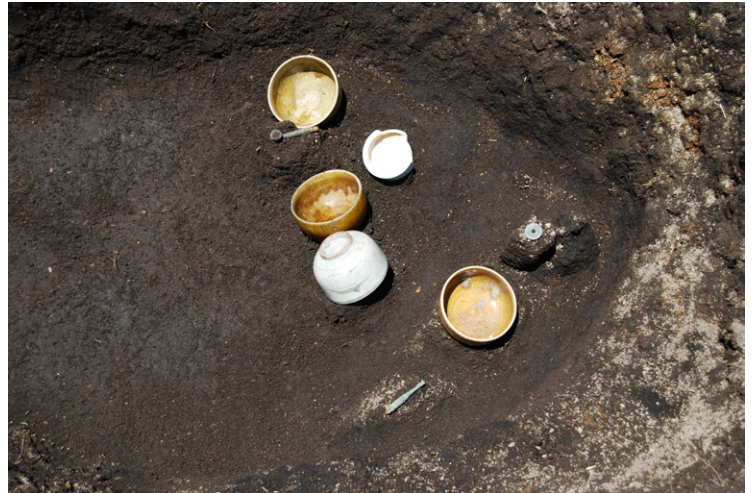
6. SZ1遺物出土状況近接(南から)