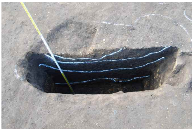
1. SKJ28 断面 SPA-A (東から)