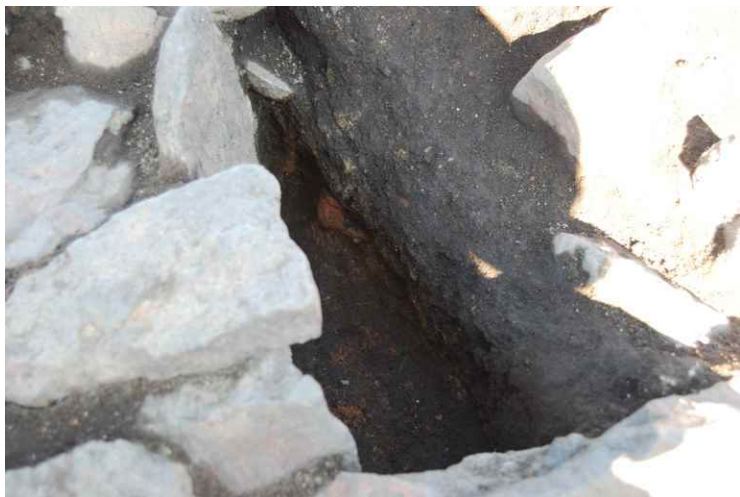
3. SI8-A カマド断面 SPC-C' (南西から)