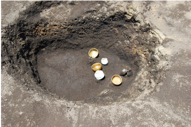
5. SZ1遺物出土状況(南から)