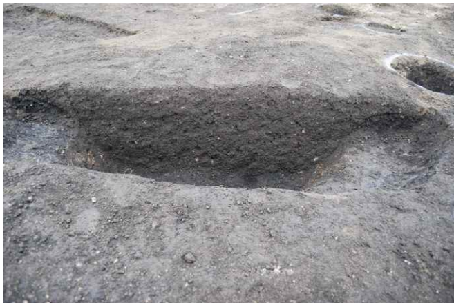
1. SK24 断面 SPA-A (南から)