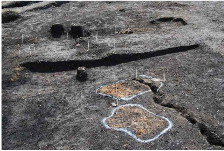
1. SI4 断面 SPA-A' (東から)