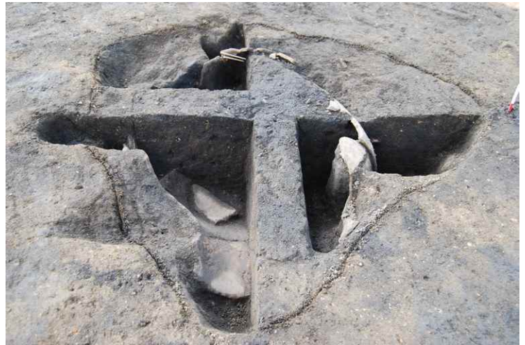
4. SKJ24 断面 SPB-B' (東から)