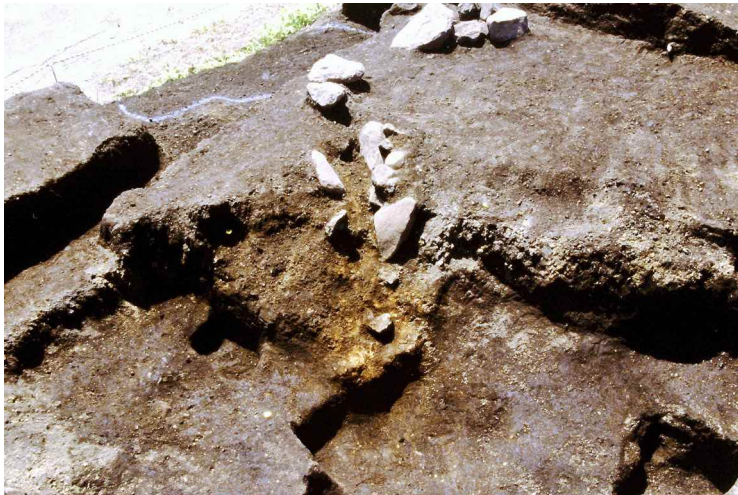
3. SI1 カマド完掘 (一次調査) (北から)