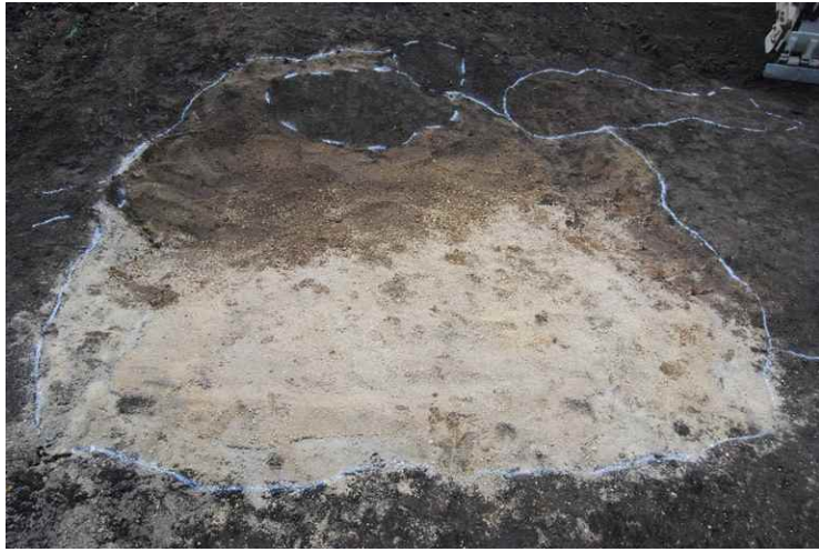
1. SI3 住居プラン確認（南から）