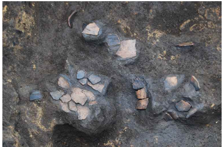
6. SKJ97 遺物出土状況近接（東から）