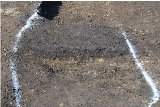
1. SK56 断面 SPA-A'（南から）