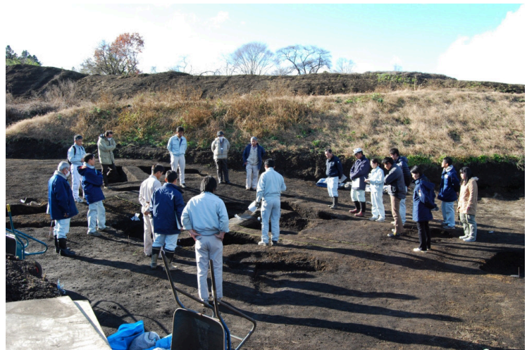
4. 2011. 12. 5文化財保護課検討会