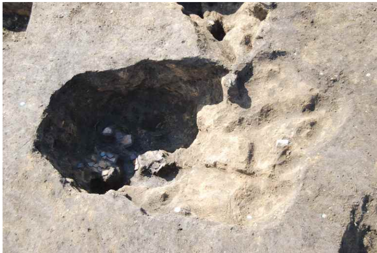
5. SKJ97 遺物出土状況（東から）