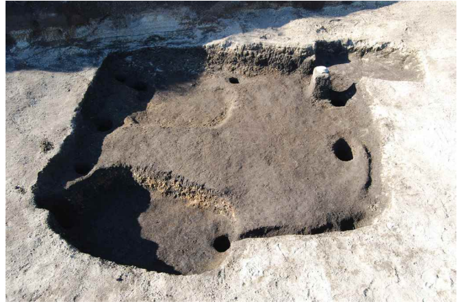
2. SI11遺物出土状況(東から)