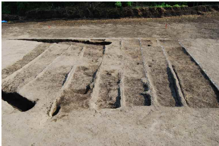
7. As-B 上畝状遺構（北から）