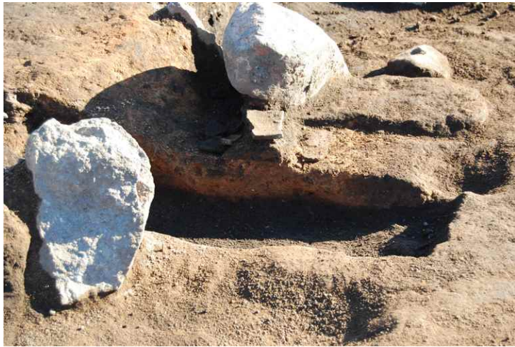
3. SI9 カマド断面 SPB-B'（西から）