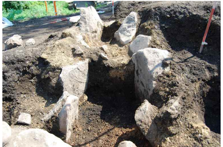
4. SI3 カマド断面 SPC-C'（東から）