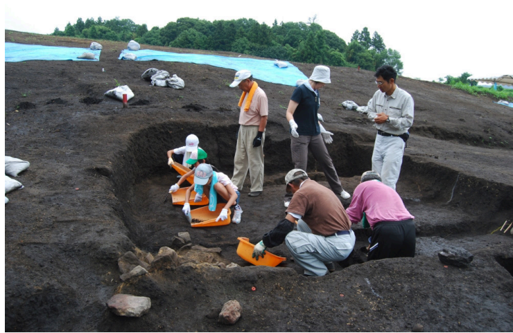
1. 2011. 7. 28体験発掘