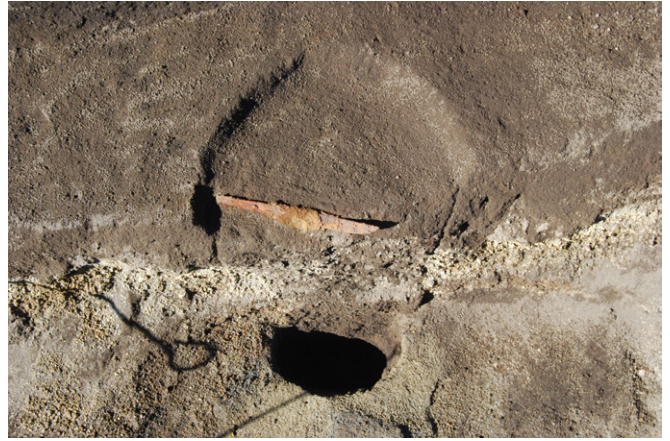
2. SK44短刀出土状況 (東から)