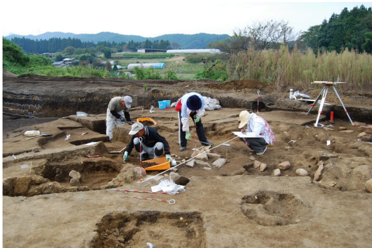
7. SIJ11作業風景(東南から)