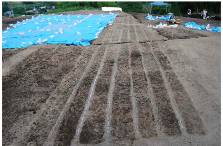
8. As-B 上畝状遺構（西から）