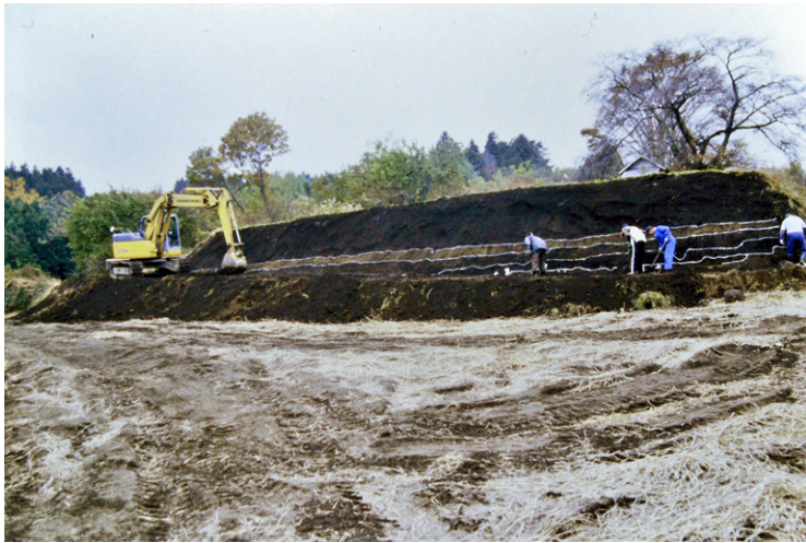
3. 2次調査作業風景(南から)