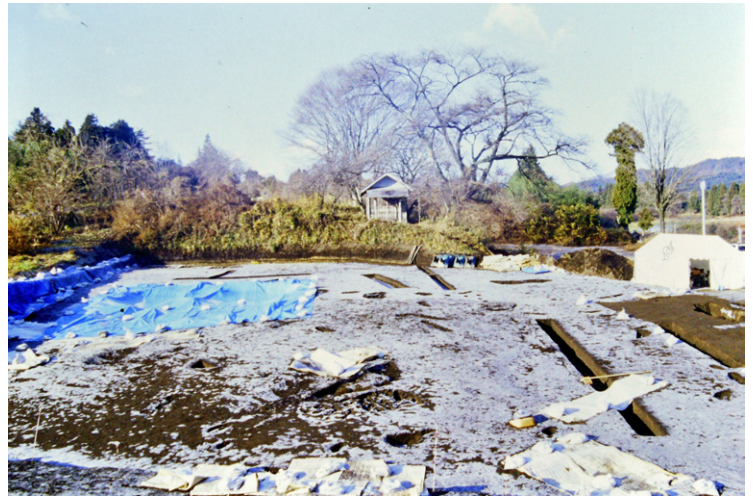
4. 2次調査発掘区凍結(東から)