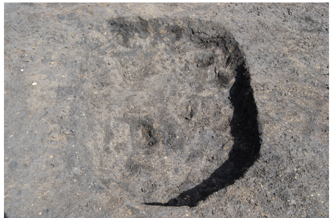
2. SK48 完掘 (南西から)