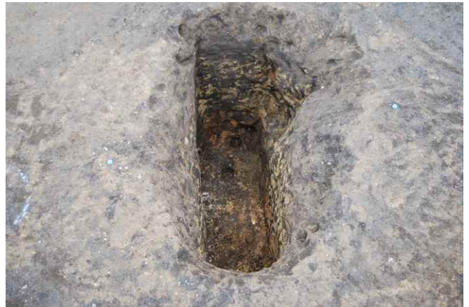
2. SKJ115 完掘（北から）