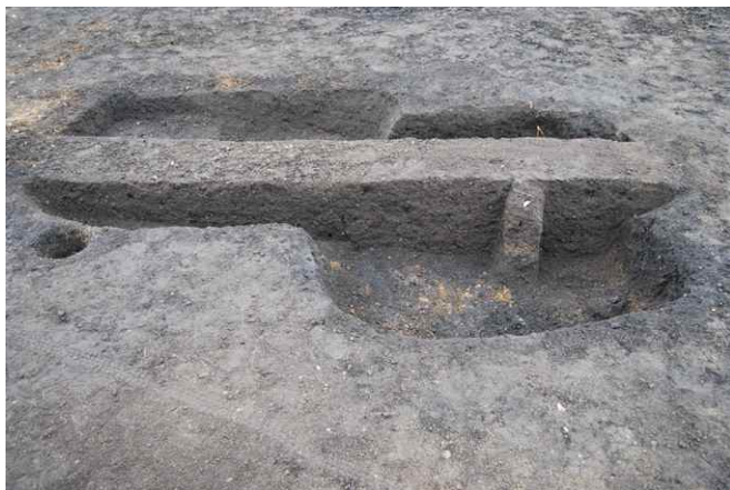
1. SK27, SK28 断面 SPA-A と遺物出土状況 (東から)