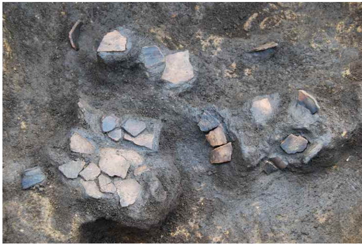
1. SKJ97 遺物出土状況（東から）