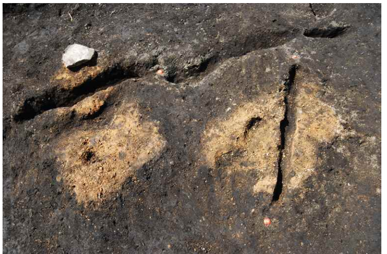
8. SI4 焼土完掘 (南から)