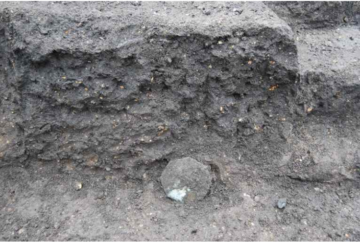
6. SI14-6 八稜鏡出土状況 (南から)