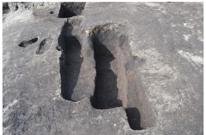
2. SX3 完掘(東から)