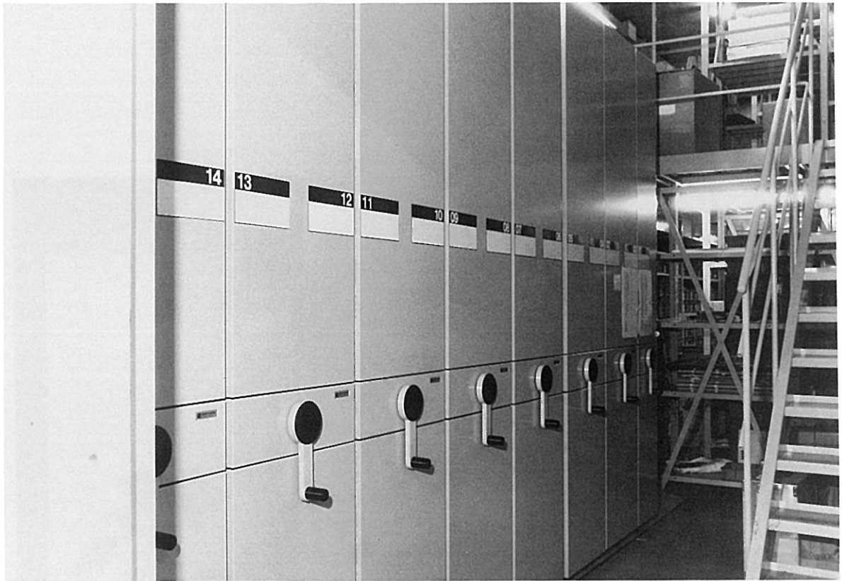
第3 収蔵庫 スタックランナー購入