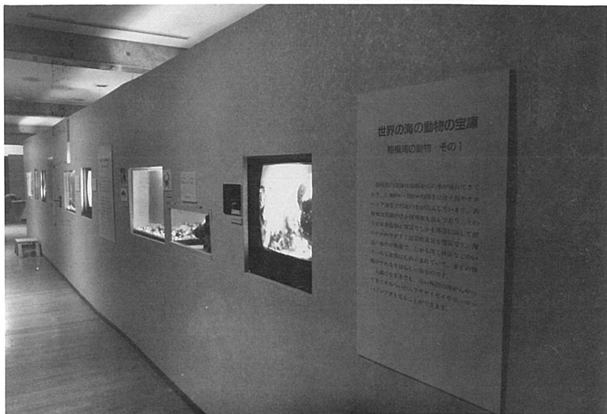
特別展「相模湾の動物」