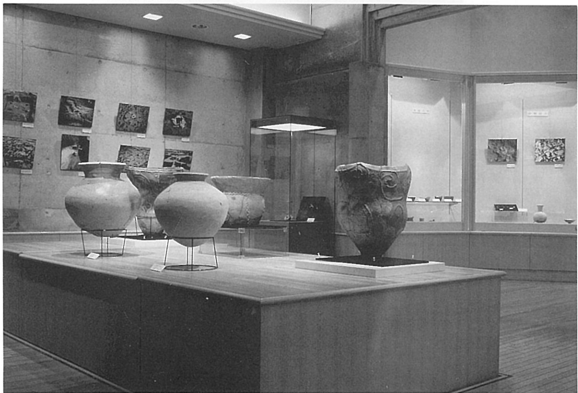
企画展「湘南の考古資料」