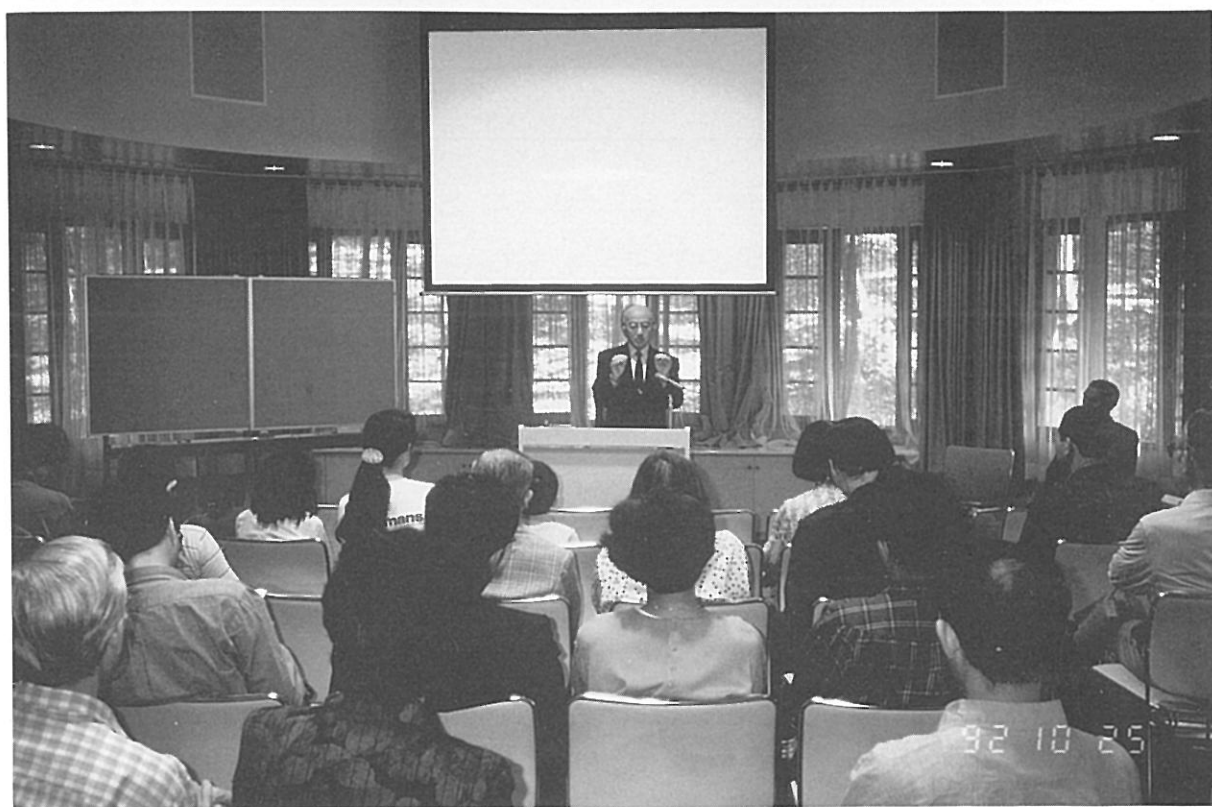
特別展 記念講演会