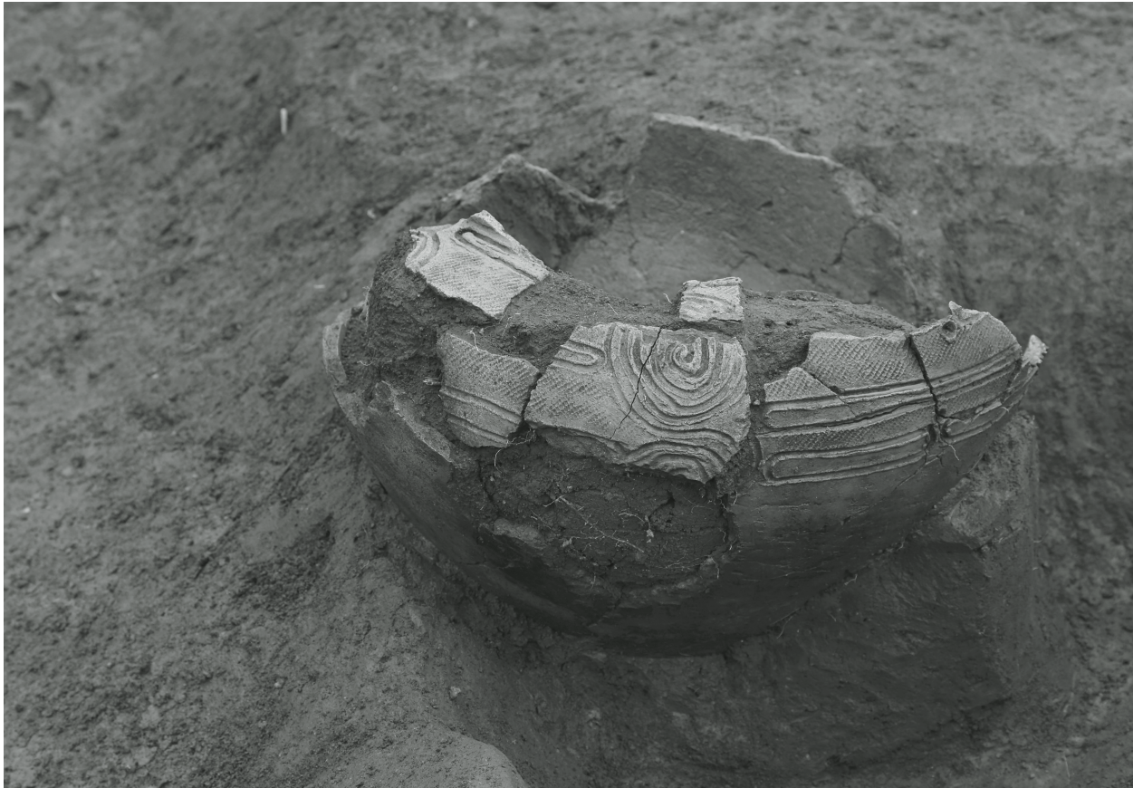
1. J 1 号埋設土器 (西から)