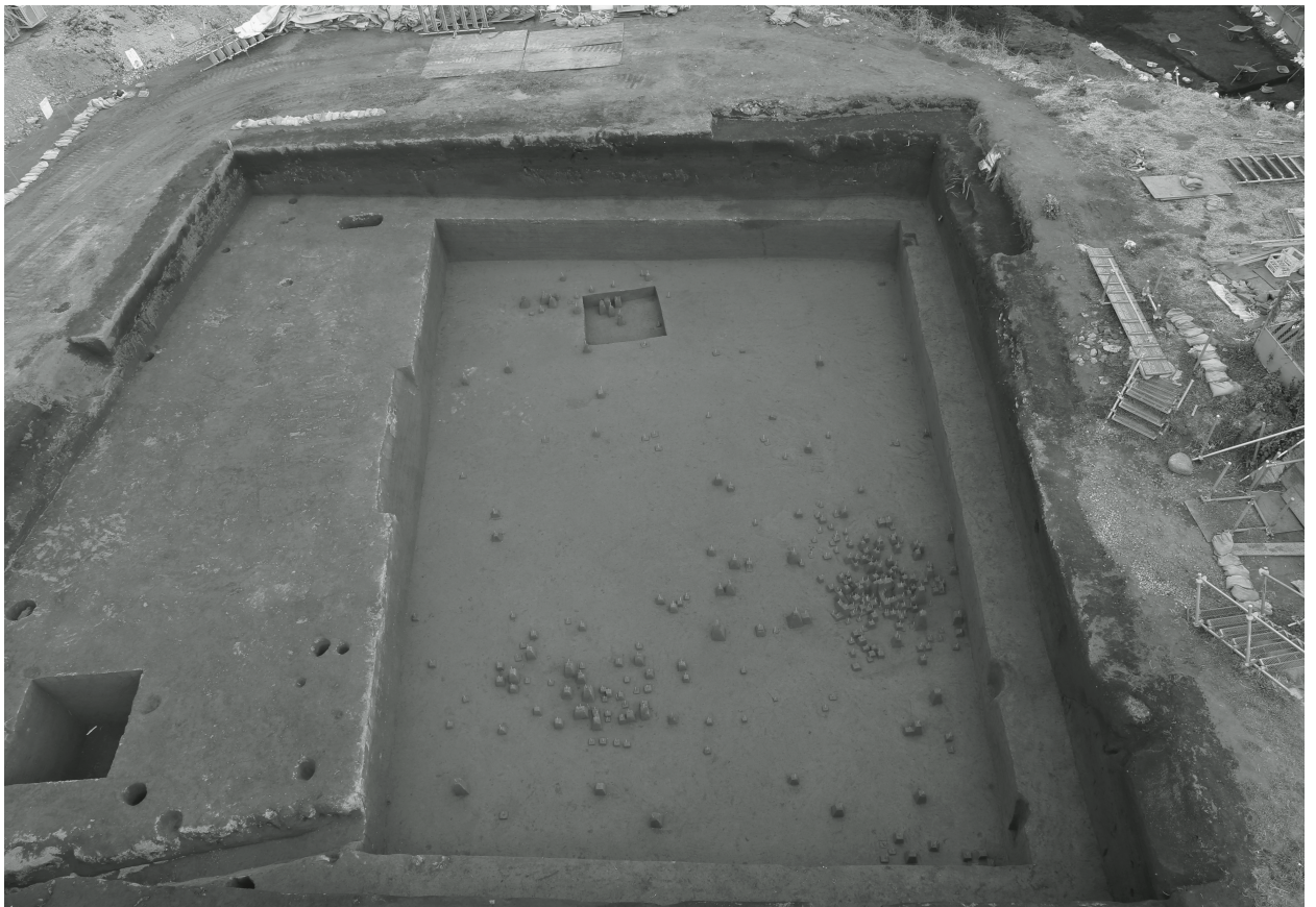
2. 旧石器時代全景（西から）