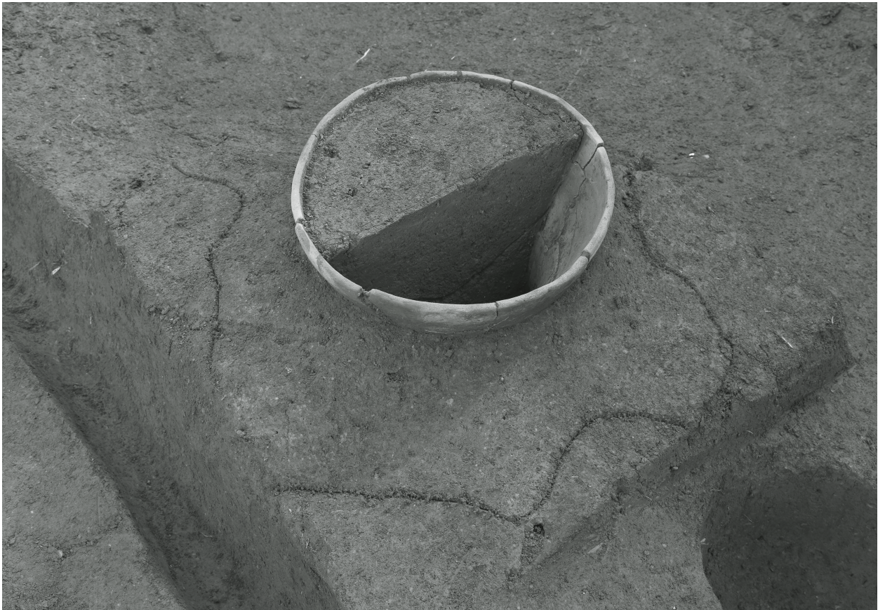
2. J 4 号埋設土器周辺焼土 (南から)