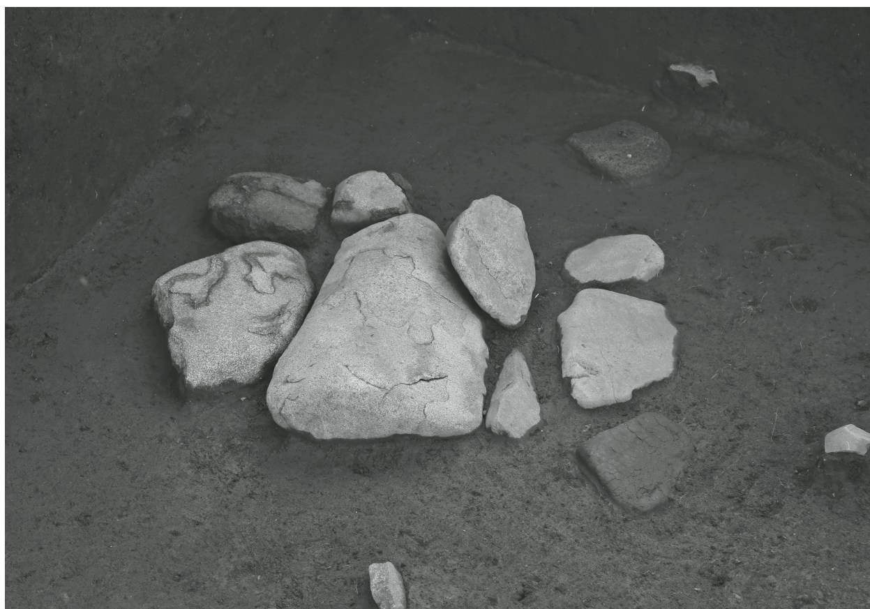
2. J 3 号配石 (東から)