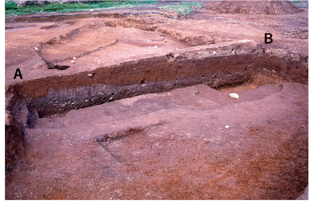
第 3 地点 ベルト土層断面 (A-B)