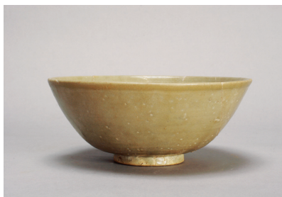
NSJ 9 SE080 3002