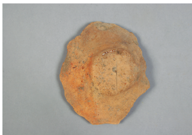
NSJ 4 S1096 968