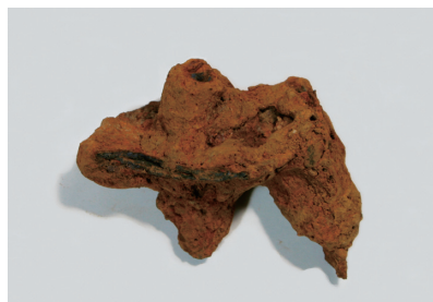
NSJ10 ST012 3039