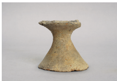
NSJ 1 SD015 321