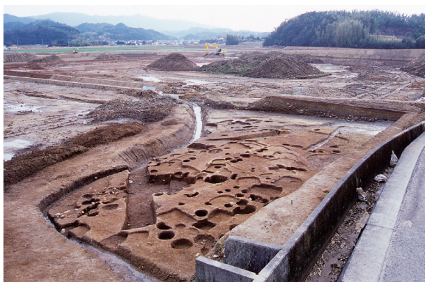
第 8 地点 近景