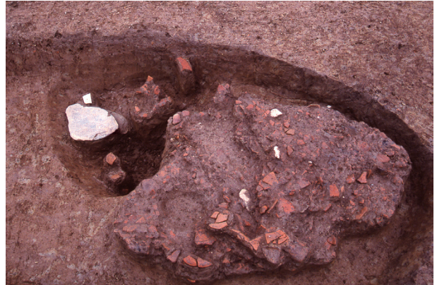
第 9 地点 SK115 土器破砕状況