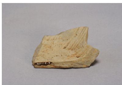
NSJ11 SP008 2668