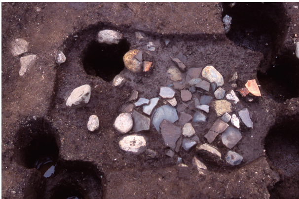
第 4 地点 SK1695 出土状況