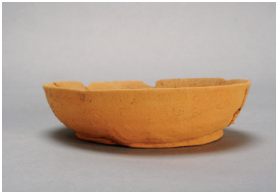
NSJ13 SK005 2699