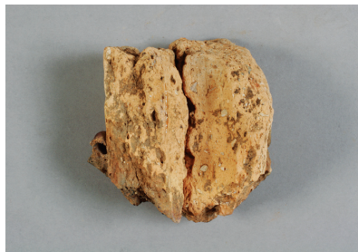
NSJ 6 SK015 1549 裏