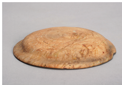
NSJ 8 S025 1348