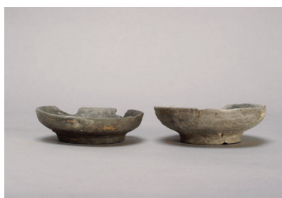
NSJ 9 SK140 3028・3029