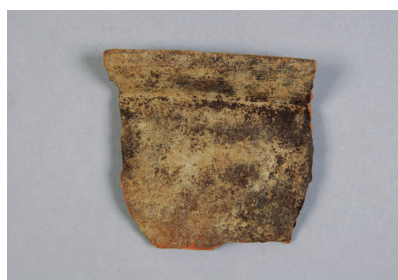
NSJ11 SP013 2673