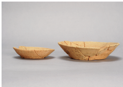
NSJ 4 SK1265 1246・1354