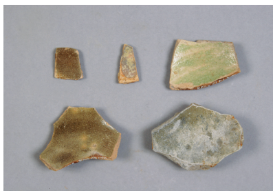
NSJ 8 S001・包含層 1383・1384・ 1387・1393・1410 裏