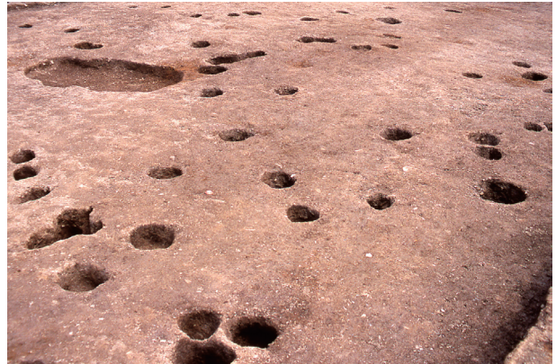
第 11 地点 遺構完掘状況