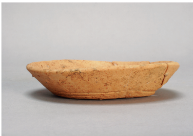
NSJ 4 SK005 500