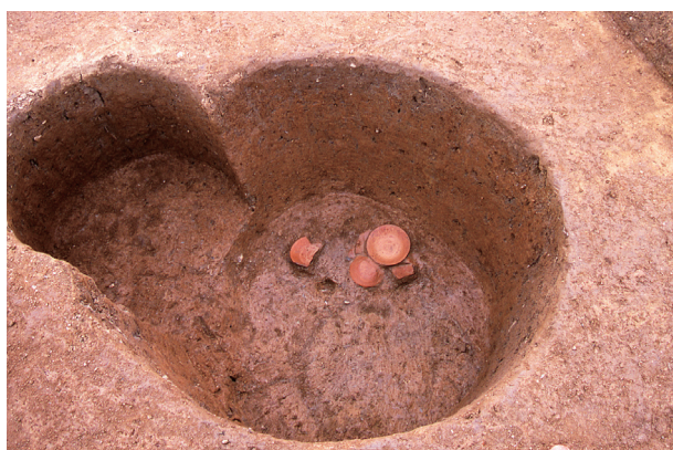
第 6 地点 SK707 遺物出土状況