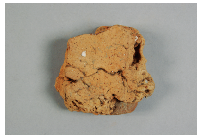
NSJ 7 SX001 2865