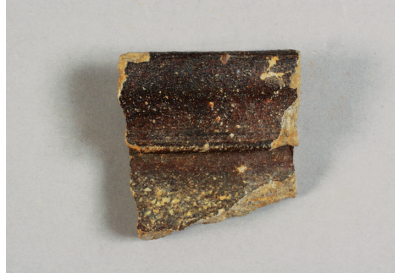
NSJ 6 SD555 668