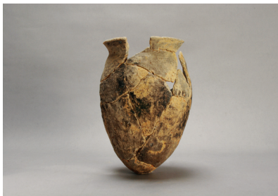
NSJ 1 SR 354