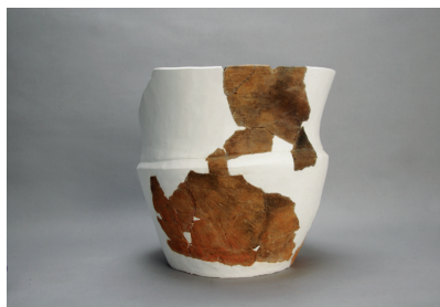
NSJ10 SK011 2997