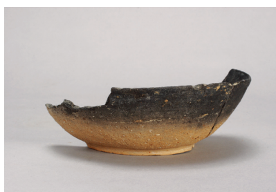
NSJ 9 SK040 2998