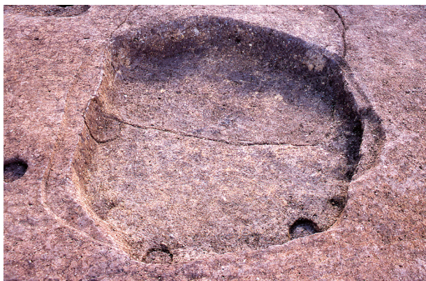
第 13 地点 SK001 完掘状況