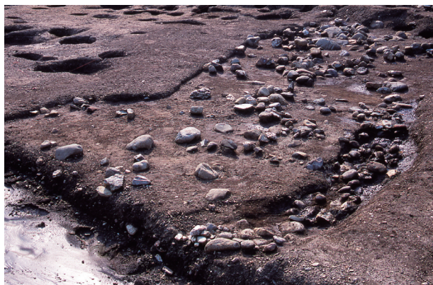
第 4 地点 SD2200 出土状況