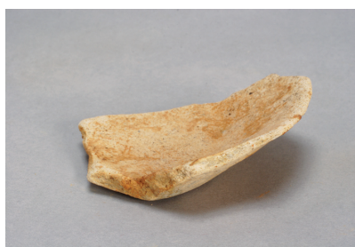
NSJ 8 SD020 1368