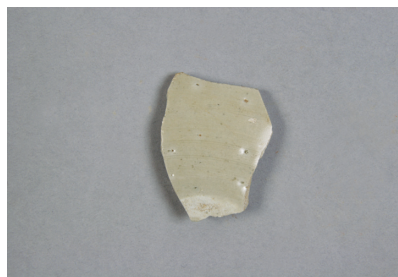
NSJ10 ST012 2678