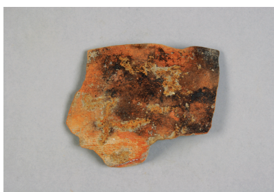
NSJ 8 SK030 1335