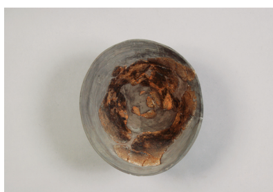
NSJ 3 SK001 3044 上から