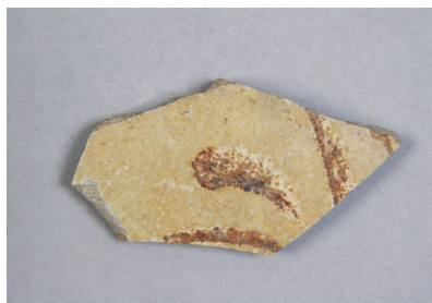
NSJ 9 SK125 3015