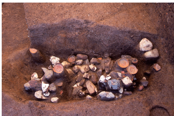
第 6 地点 SK015 遺物出土状況