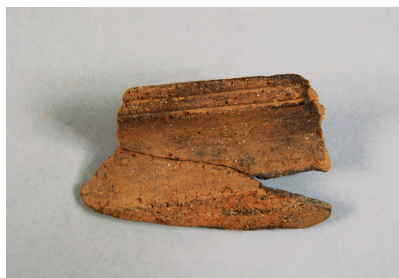
NSJ 7 SD020 2895