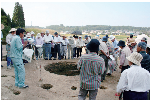
NSJ9 2006.09.30 現地説明会風景