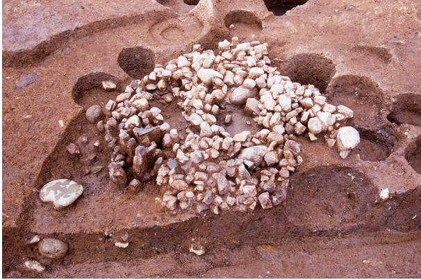
第 8 地点 SK040 出土状況