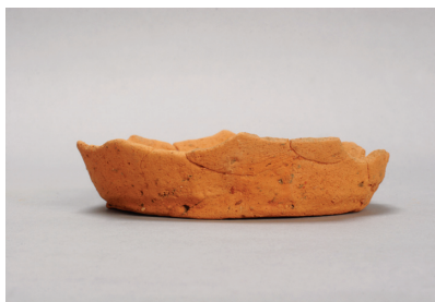
NSJ 3 SX100 445