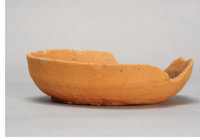
NSJ 6 SK035 1521