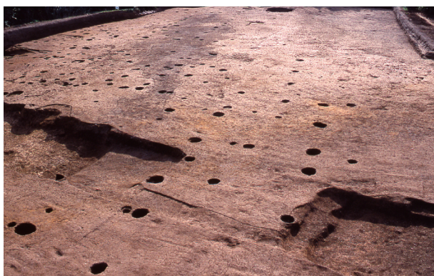
第 13 地点 SD010 周辺完掘状況