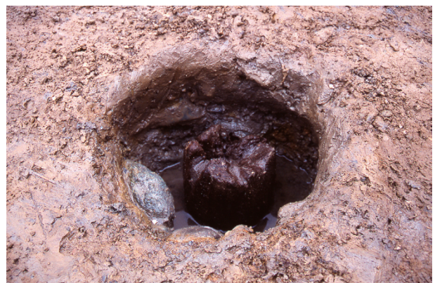
第2地点 SP012 柱木出土状況