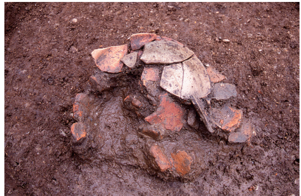
第 4 地点 SK1029 出土状況