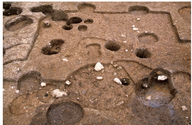
第 4 地点 SH1035 完掘状況