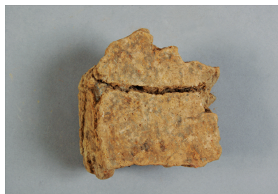
NSJ 7 SX001 2994