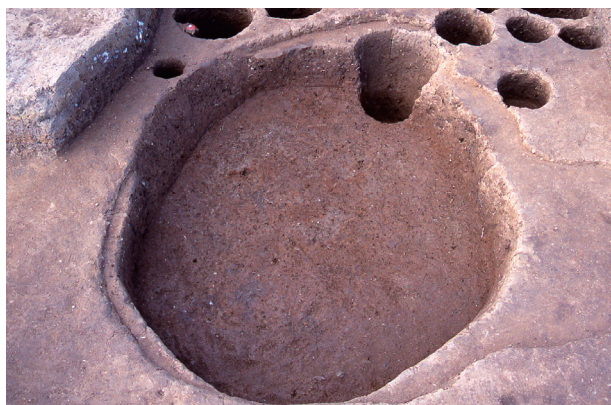
第 6 地点 SK510 完掘状況