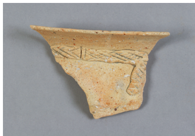
NSJT207 S1 327