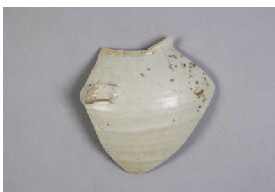
NSJ 9 SK120 3006