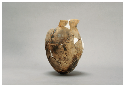
NSJ 1 SD015 361