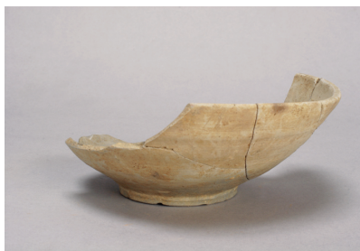
NSJ 9 SK125 2058