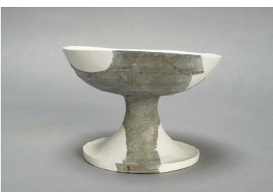
NSJ 4 S1703 921