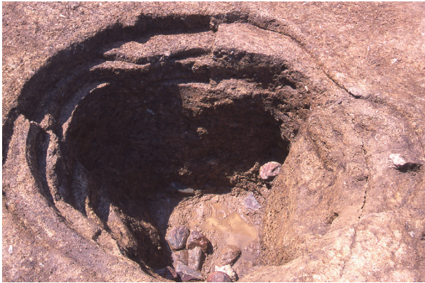
第 9 地点 SE080 検出状況