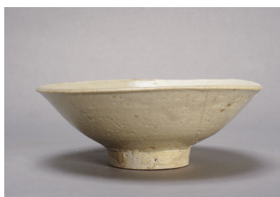
NSJ 9 SK140 3031