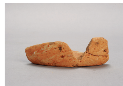
NSJ 3 SB001 444