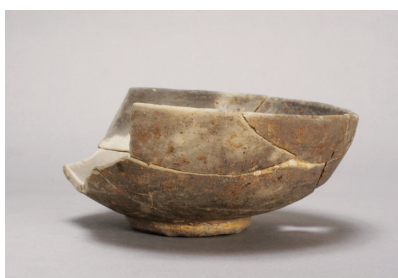
NSJ 9 SK140 3030