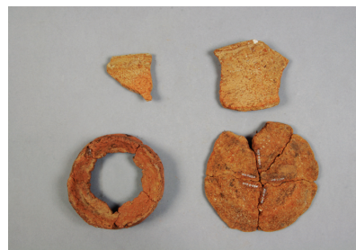
NSJ 3 包含層 461 ~ 463、452