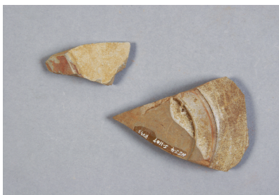
NSJ 4 S1107・1499 888・953 裏