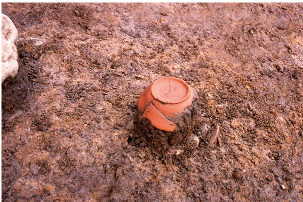
第 12 地点 SX003 遺物出土状況