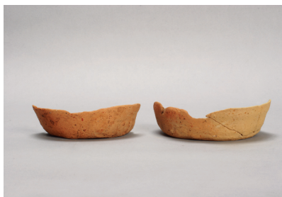
NSJ 3 ピット 446・447