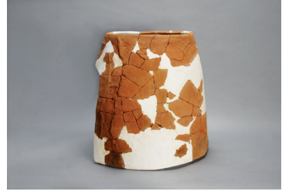
NSJ12 SX003 2975 横から