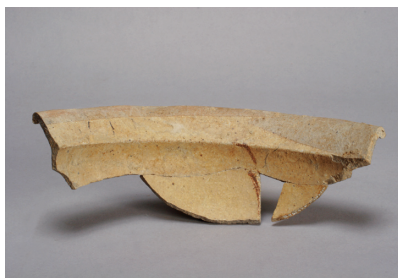
NSJ 9 SK125 3014 裏