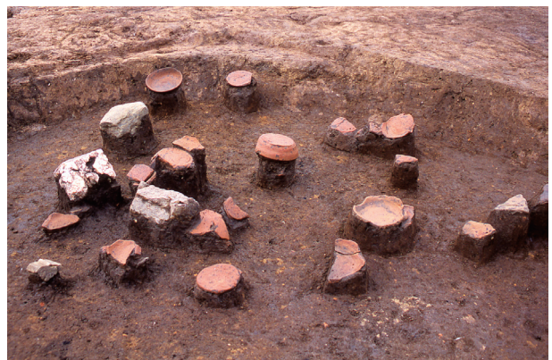
第 13 地点 SK005 上層出土状況