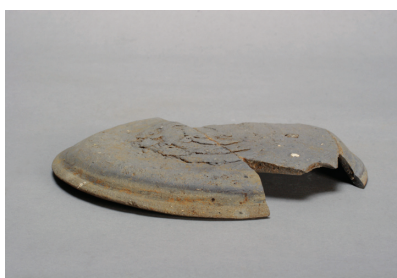
NSJ12 SX002 2815