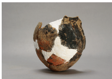
NSJ 1 SD015 368