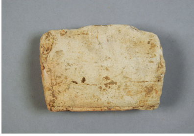
NSJ 6 SD001 1461