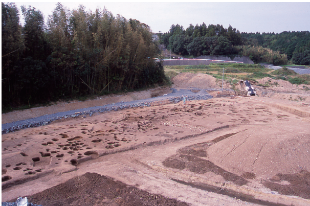
第 4 地点 近景