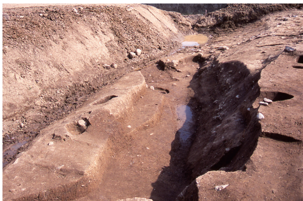
第 7 地点 SD020 完掘状況