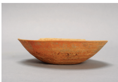
NSJ 4 S1890 801