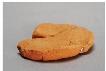
NSJ 5 S009 171