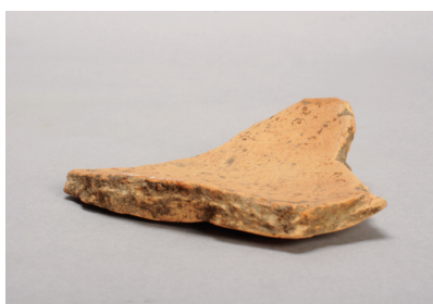
NSJ 4 S1703 908