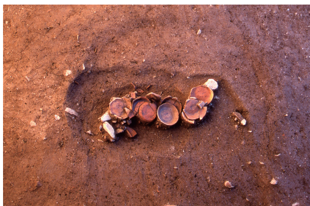
第 6 地点 SK010 遺物出土状況