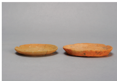
NSJ 9 SK140 2156・3023