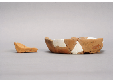
NSJ 3 SK004 436・449