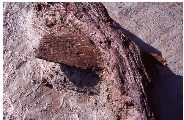
第1地点 自然流路（板材出土状況）