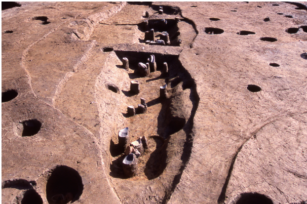
第 9 地点 SK125 検出状況