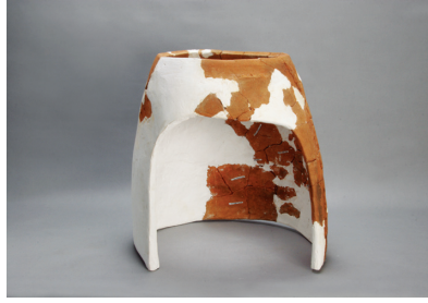
NSJ12 SX003 2975 正面から