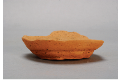
NSJ13 SK005 2702