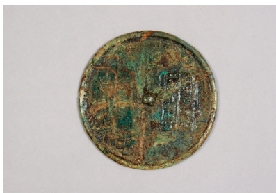
NSJ10 ST012 2978 表