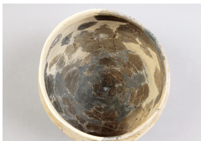
NSJ 3 SK002 484 上から