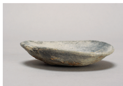
NSJ 9 SK145 1997