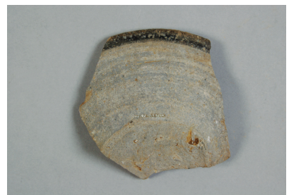
NSJ 6 SE580 1623