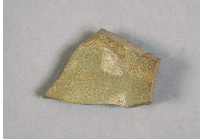
NSJ13 SD010 2761