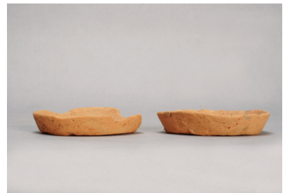
NSJ 6 SK510 2571・2580