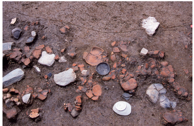
第 9 地点 SK145 遺物出土状況