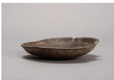
NSJ 9 SK140 3026