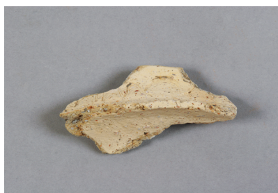
NSJ 2 SK015 386