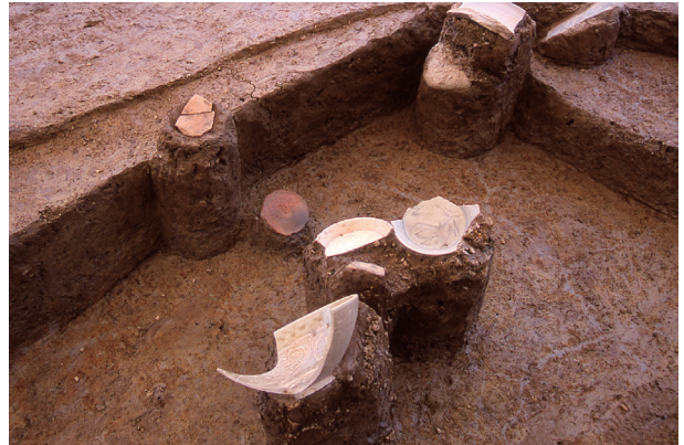
第 9 地点 SK135 遺物出土状況