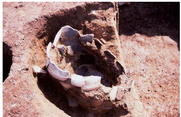
第3地点 SK002 出土状況