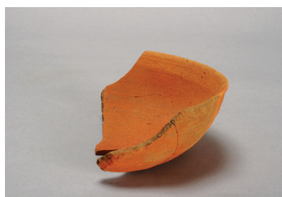
NSJ12 SX003 2823