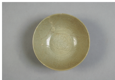
NSJ 9 SE080 3002 上から