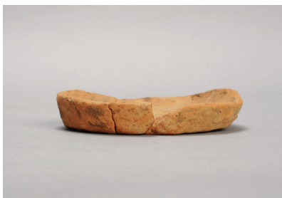
NSJ 3 SX100 392