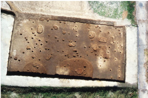
第 10 地点 調査区全景