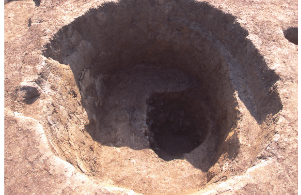
第 9 地点 SE015 完掘状況