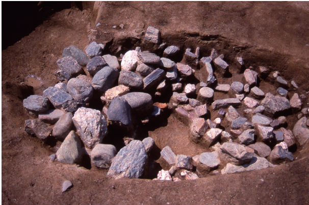
第 9 地点 SK065 検出状況