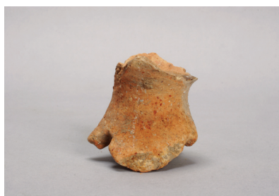
NSJ 2 包含層 387