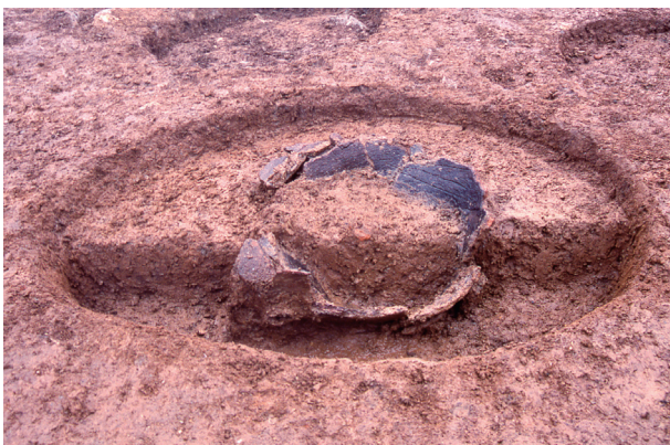
第3地点 SK001 土層断面