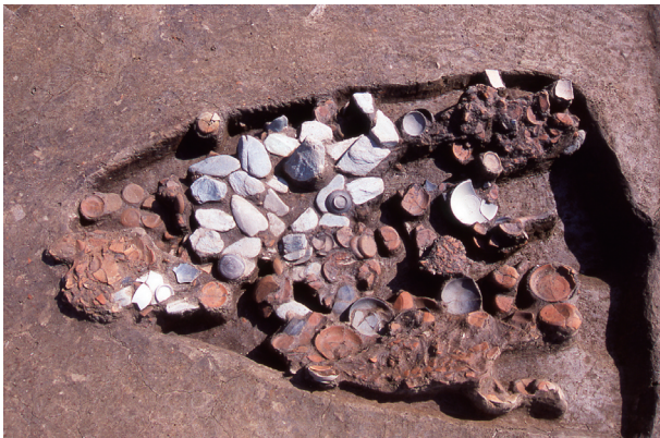
第 9 地点 SK140 上層検出状況