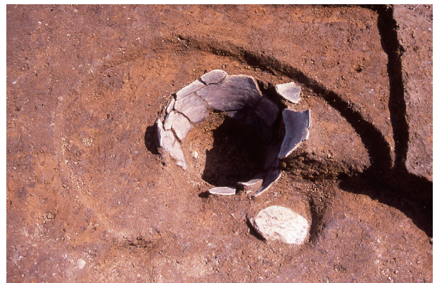
第 10 地点 SK011 出土状況