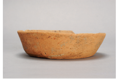
NSJ 6 SK010 1491