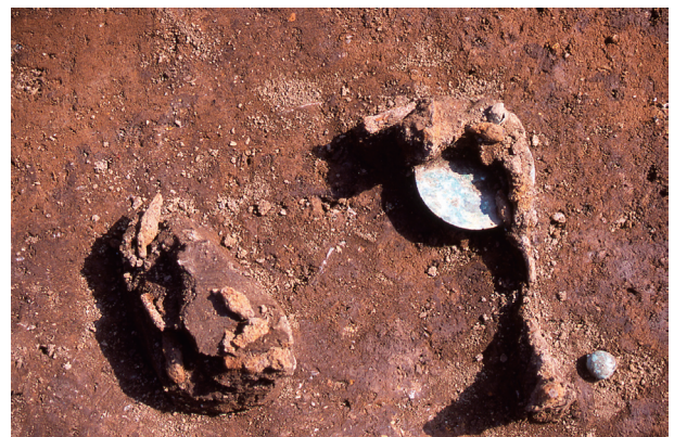
第 10 地点 ST012 出土状況