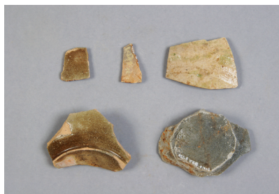
NSJ 8 S001・包含層 1383・1384・ 1387・1393・1410 表