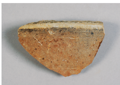
NSJ 6 SD001 1440 表