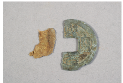
NSJ 4 SK1265 銭09