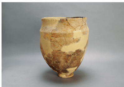
NSJ 3 SK002 484