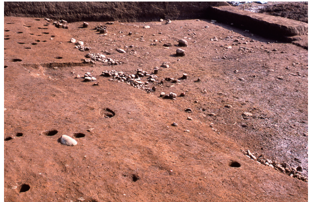
第 12 地点 集石遺構近景