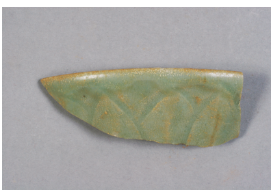
NSJ 6 SP018 1481