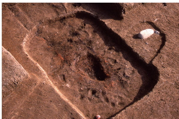
第 6 地点 SK515 下層検出状況