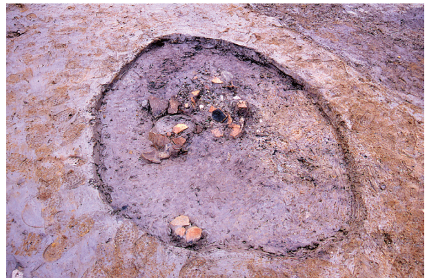
第1地点 SK010 出土状況