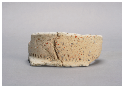
NSJ 1 SR 371