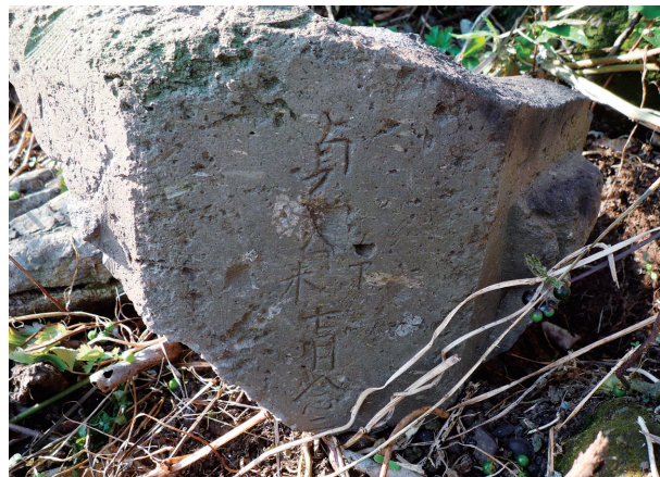
字「光蓮寺」周辺所在の無縫塔の竿片