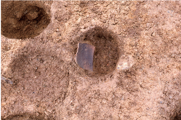
第 11 地点 SP013 出土状況