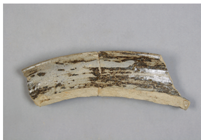
NSJ 9 SE015 2996