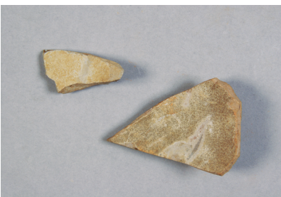
NSJ 4 S1107・1499 888・953 表