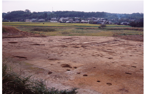
第 9 地点 調査区近景