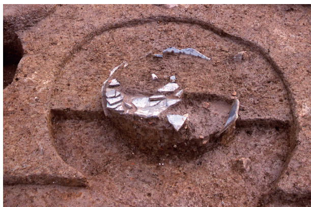
第 6 地点 SK525 検出状況