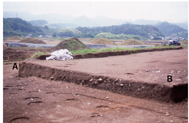
第 4 地点 土層断面 (A-B)