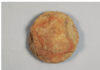
NSJ 7 SX001 2881