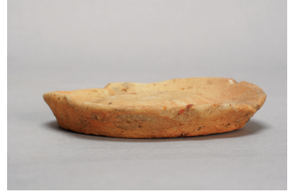
NSJ 6 SK015 1531