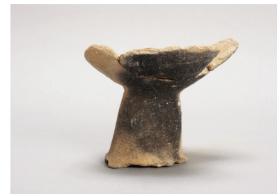
NSJ 1 SR 337