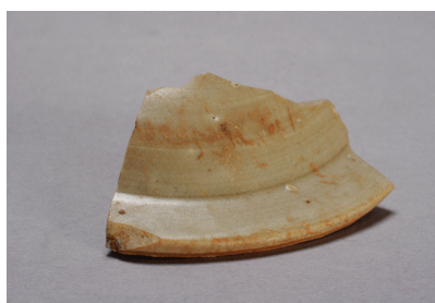
NSJ12 SX002 2773