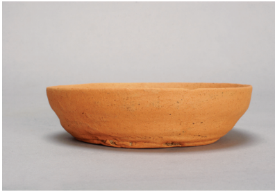
NSJ 6 SK035 1519