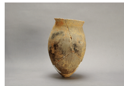
NSJ 1 SD015 358