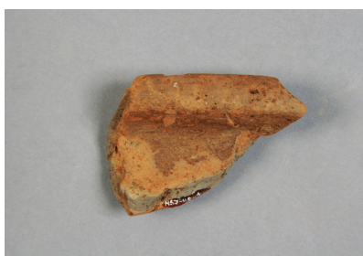
NSJ11 SP004 2665