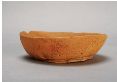
NSJ13 SK005 2700