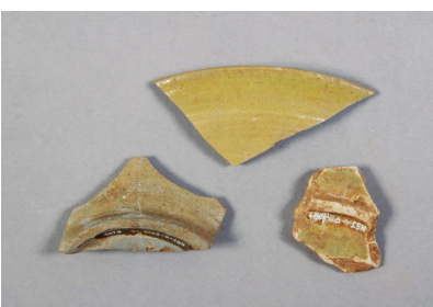
NSJ 4 S400・1451・中世造成土 655・879・1242 表