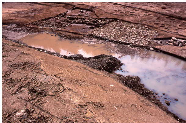
第 4 地点 SX001 出土状況