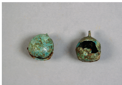
NSJ10 ST012 2979・2980