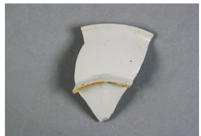
NSJ13 SX019 2713