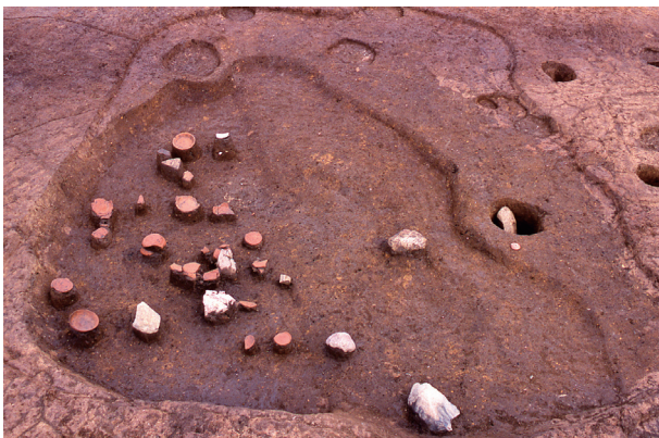
第 13 地点 SK005 上層検出状況