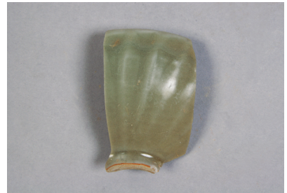
NSJ13 SK005 2682