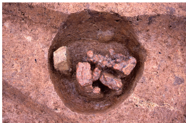
第 7 地点 SP077 検出状況