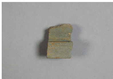
NSJ 7 SX001 2844