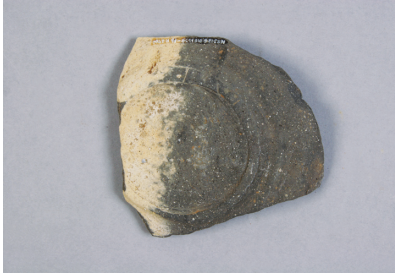
NSJ13 SD010 2760