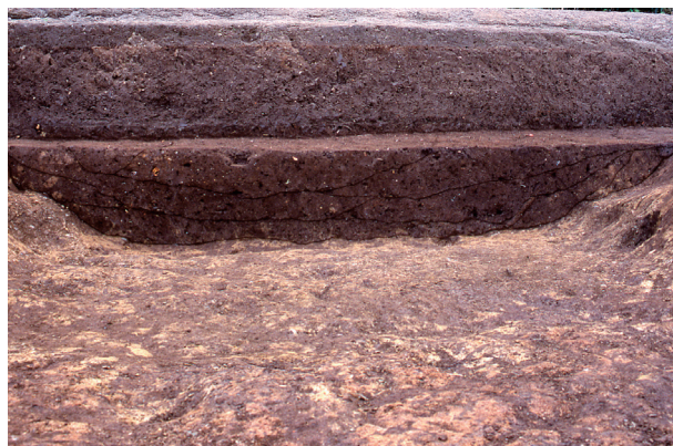
第 13 地点 SD001 土層断面