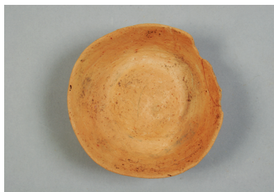
NSJ 6 SK510 2486 上から