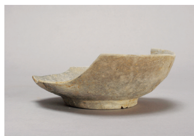
NSJ 9 SK140 2142