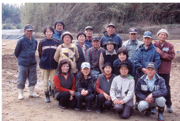
第 7・8 地点作業員と調査員