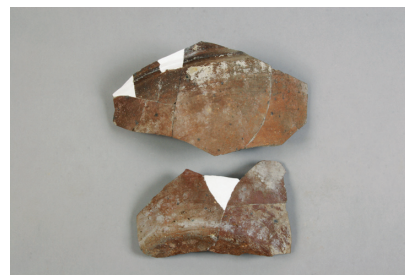
NSJT111 SE001 3034・3035