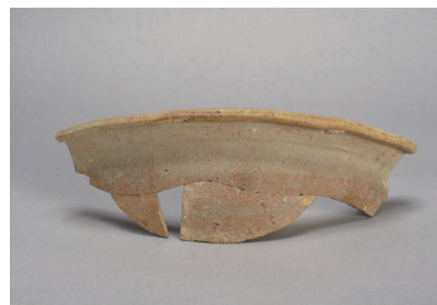
NSJ 9 SK125 3014 表