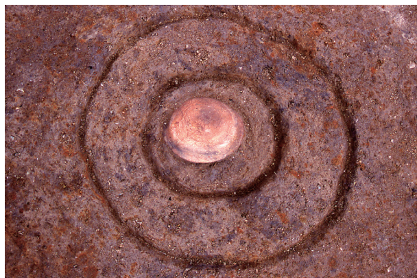
第 8 地点 SP025 (SB004) 出土状況