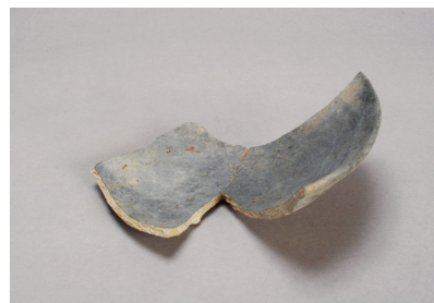
NSJ 9 SK125 3007