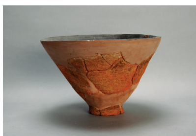
NSJ 3 SK001 3044