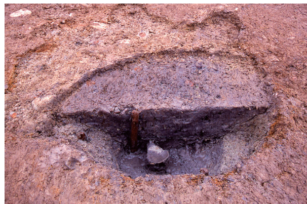
第2地点 SK015 出土状況（杭は現代）