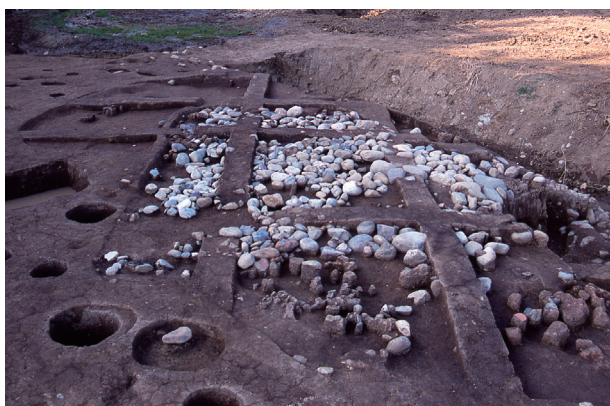
第 7 地点 SX001 検出状況