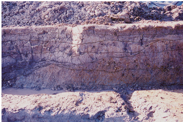
第1地点 北壁土層断面（自然流路立ち上がり）