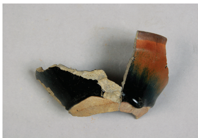
NSJ 9 SK125 3012