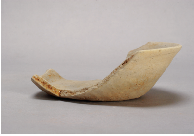
NSJ12 SX003 2818