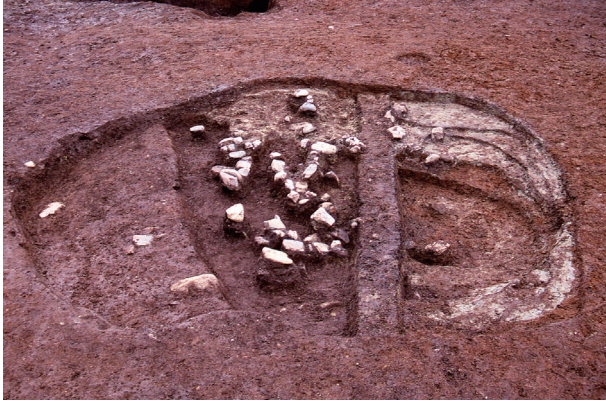
第 3 地点 SK004 出土状況