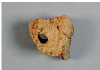
NSJ 7 SX001 2869