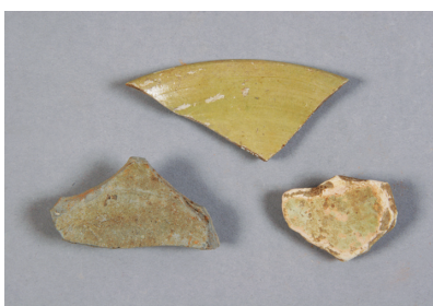
NSJ 4 S400・1451・中世造成土 655・879・1242 裏