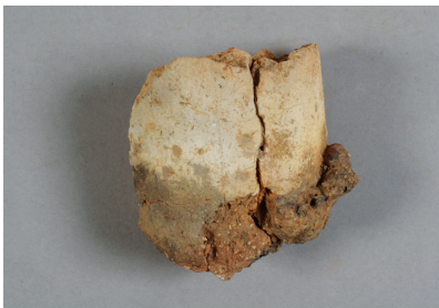
NSJ 6 SK015 1549 表