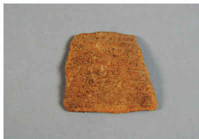
NSJ 7 S014 2920