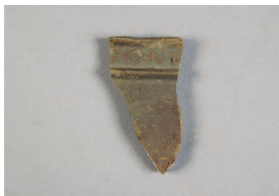
NSJ13 SK024 2728