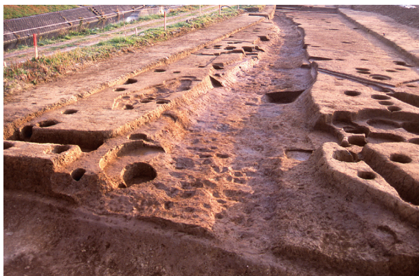
第 6 地点 SD500 完掘状況