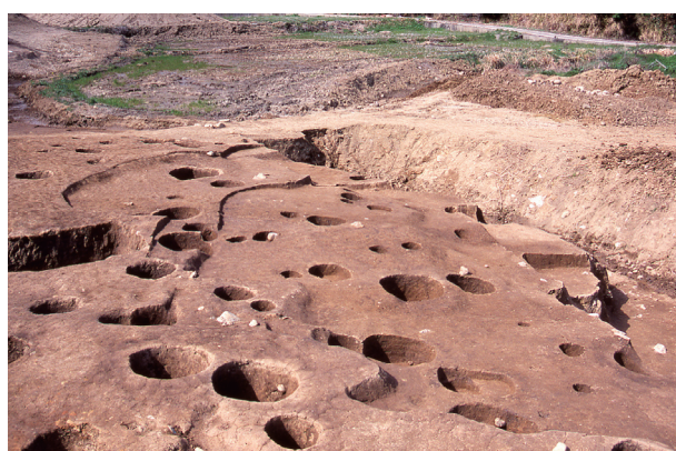
第 7 地点 SX001・005 完掘状況