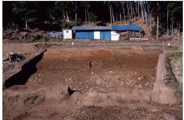
第 12 地点 調査区近景