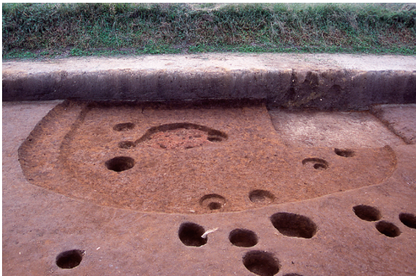
第 10 地点 SH001 出土状況