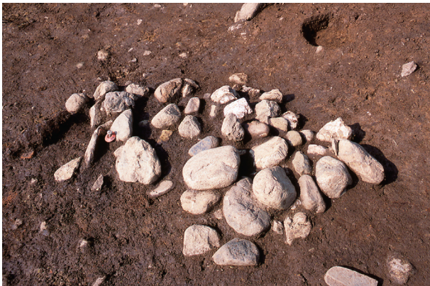
第 12 地点 集石 1 検出状況