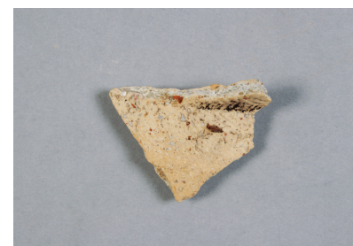
NSJ 2 SK015 390