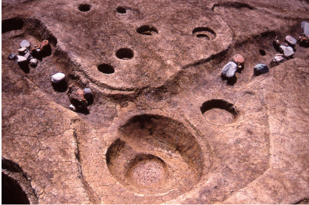
第 9 地点 SD070 検出状況