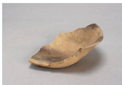
NSJ 8 SK030 1327