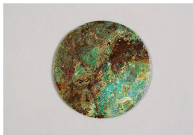
NSJ10 ST012 2978 裏