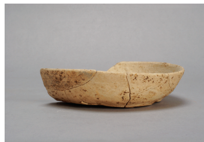
NSJ 9 SK140 3024