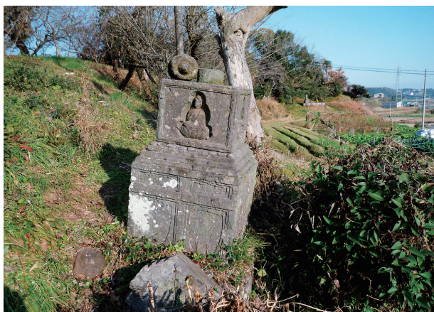
字「光蓮寺」周辺所在の宝篋印塔