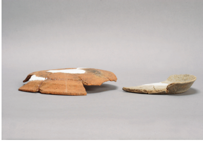
NSJ 4 S840・1209 910・974