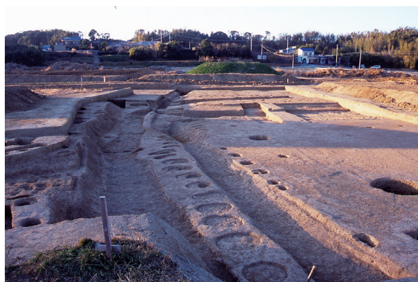
第 6 地点 SD555・SF1000 完掘状況