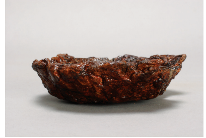
NSJ 4 SK005 591