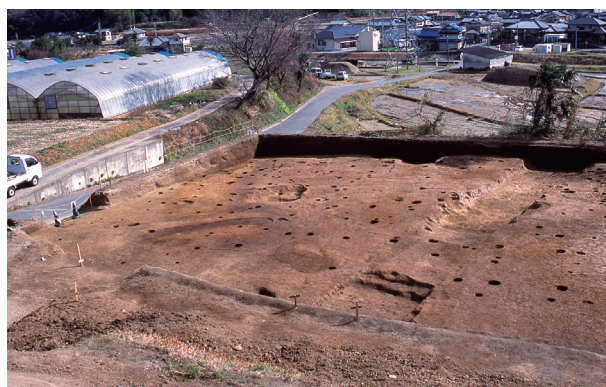
第 13 地点 調査区近景