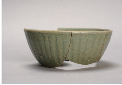
NSJ 4 SK004 592