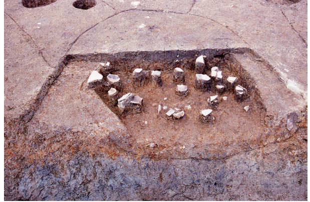
第 8 地点 SK030 土層及び出土状況