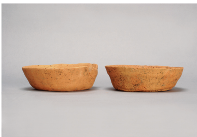
NSJ 6 SK510 2486・2517