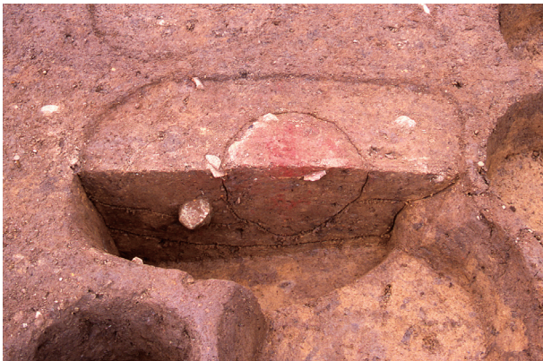
第 4 地点 SK006 出土状況