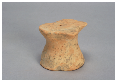
NSJ 9 SK125 3011