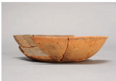
NSJ 7 SX005 889