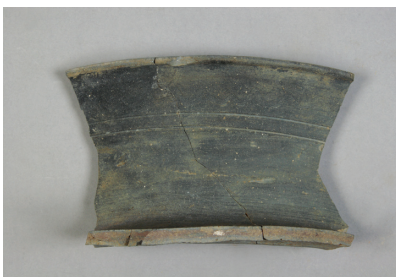
NSJ 7 SP015 2965