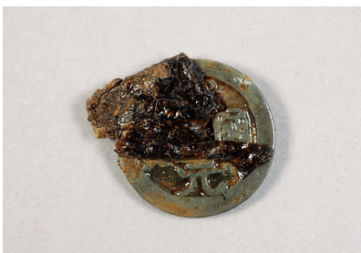
NSJ 4 SK1265 銭08