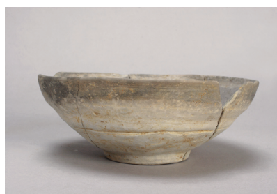
NSJ 9 SK125 3008