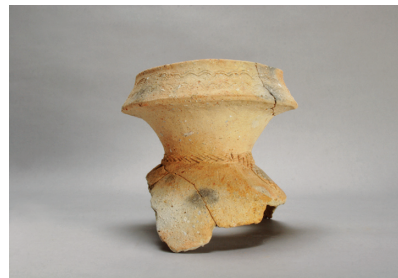
NSJ 1 SR 350