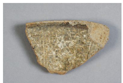
NSJ 6 SD001 1440 裏