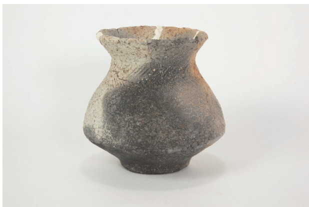
3. 第 27 次調査区出土遺物 17-5