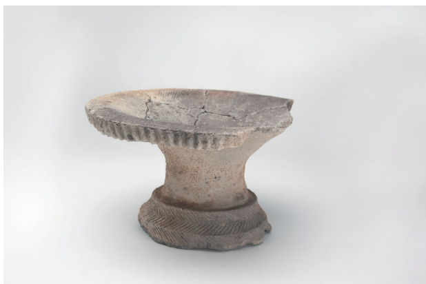
3. 第 20 次調査区出土遺物 10-20