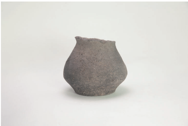
7. 第 19 次調査区出土遺物 9-17