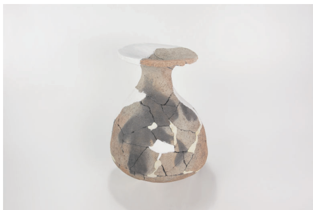
1. 第 24 次調査区出土遺物 14-17