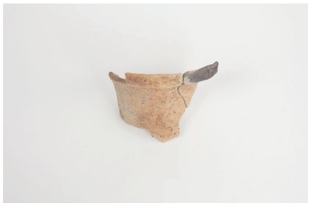
8. 第 20 次調査区出土遺物 10-16