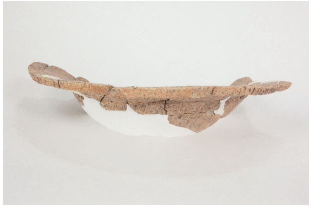
2. 第 24 次調査区出土遺物 14-1