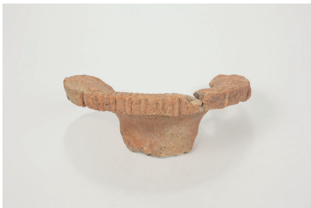
7. 第 24 次調査区出土遺物 14-15