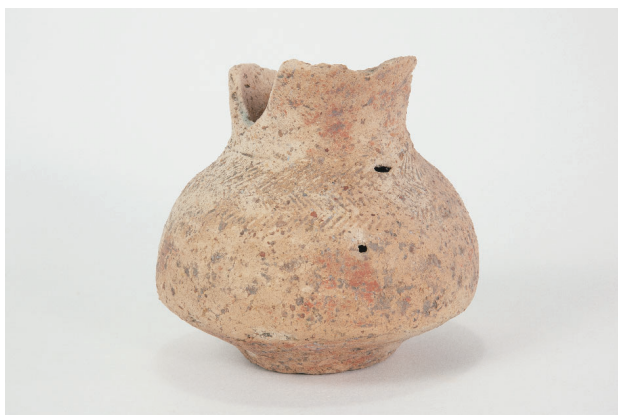
1. 第 24 次調査区出土遺物 14-8