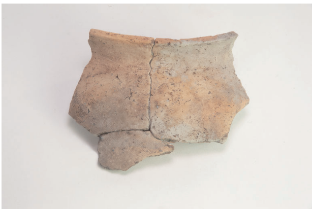
7. 第 18 次調査区出土遺物 8-10