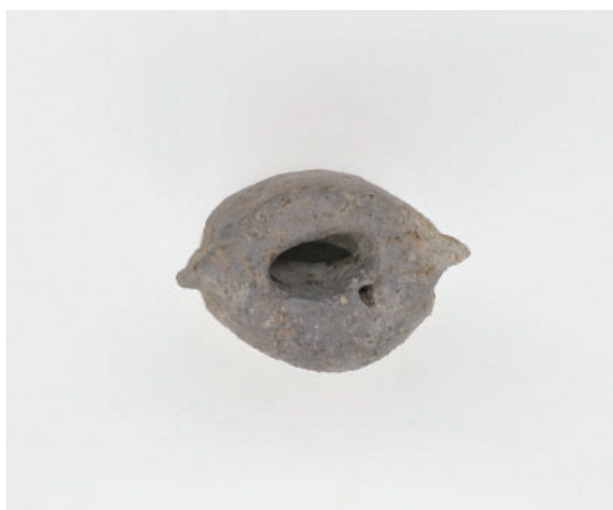
6. 第17次調査区 SK11 銅鐸形土製品 底部