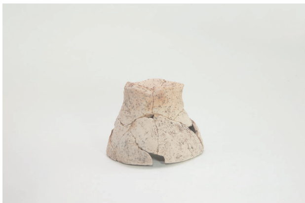
7. 第 19 次調査区出土遺物 9-8