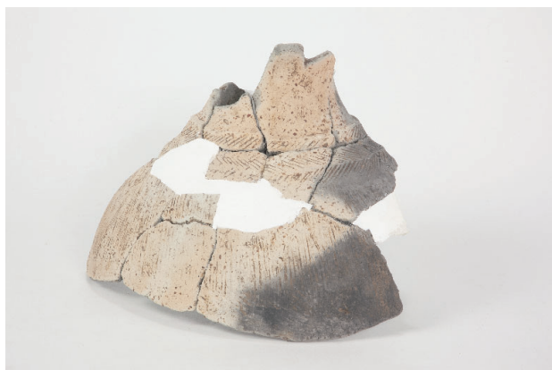
3. 第 23 次調査区出土遺物 13-2