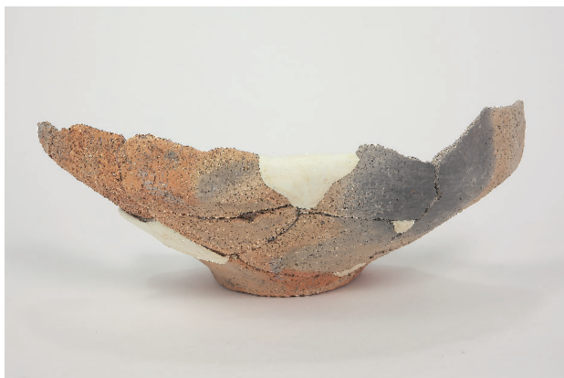
5. 第 23 次調査区出土遺物 13-4