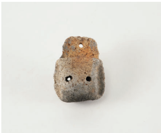
1. 第17次調査区 SK11 銅鐸形土製品 正面