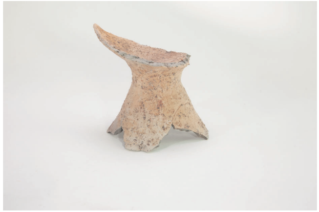
2. 第 19 次調査区出土遺物 9-11