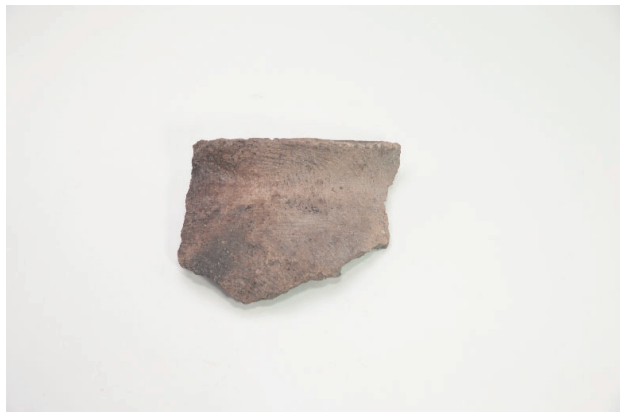
8. 第 19 次調査区出土遺物 9-18