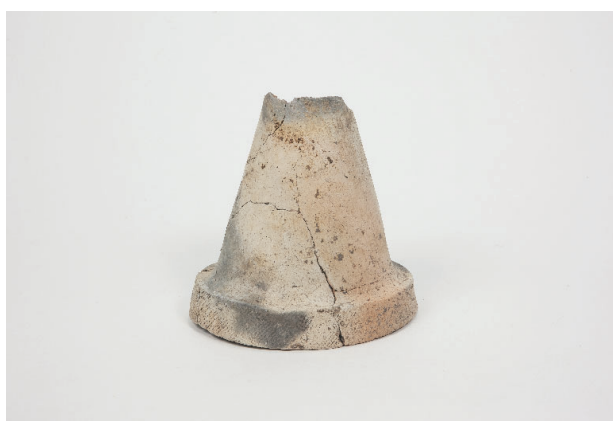
2. 第 19 次調査区出土遺物 9-2