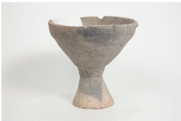
7. 第 24 次調査区出土遺物 14-24