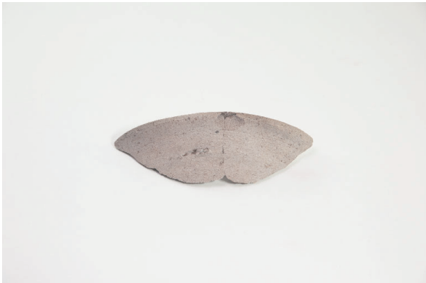
3. 第 17 次調査区出土遺物 7-56