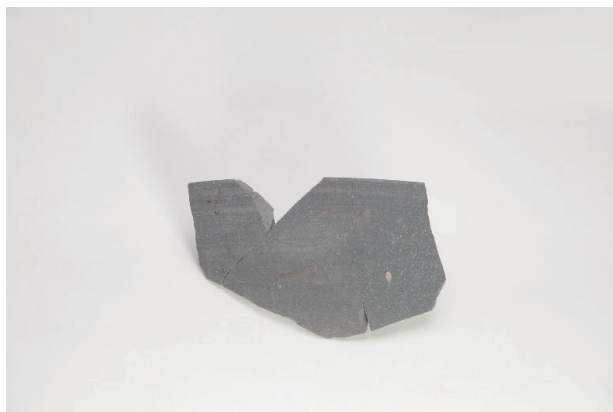
6. 第 19 次調査区出土遺物 9-26