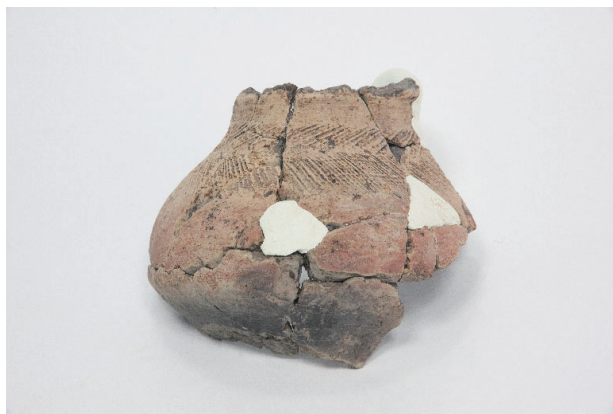
8. 第 28 次調査区出土遺物 18-2