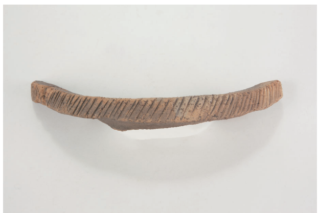
4. 第 24 次調査区出土遺物 14-3