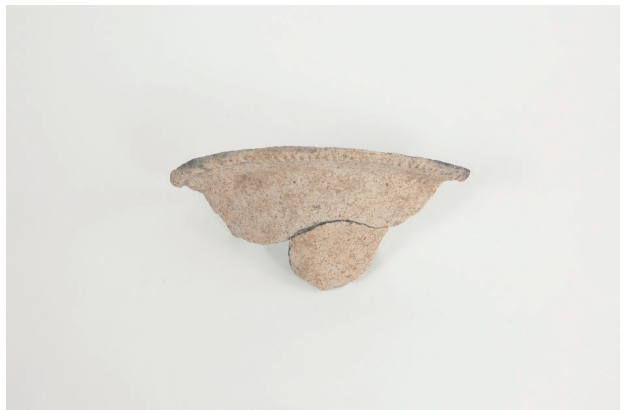
6. 第 20 次調査区出土遺物 10-14