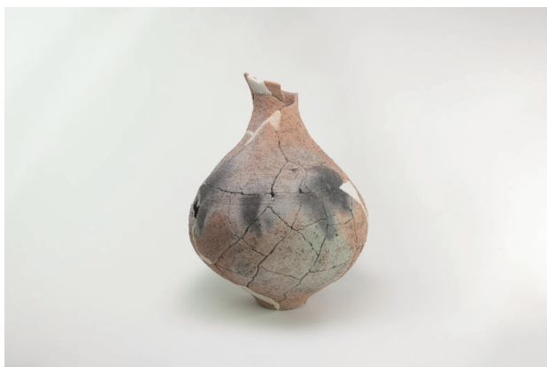
1. 第 23 次調査区出土遺物 13-8