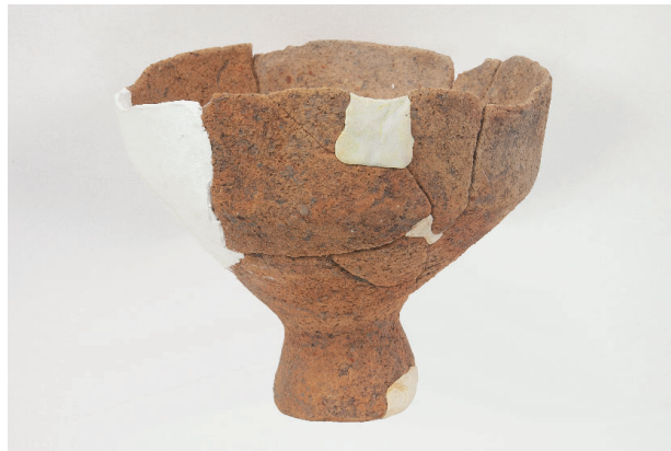
8. 第 25 次調査区出土遺物 15-1