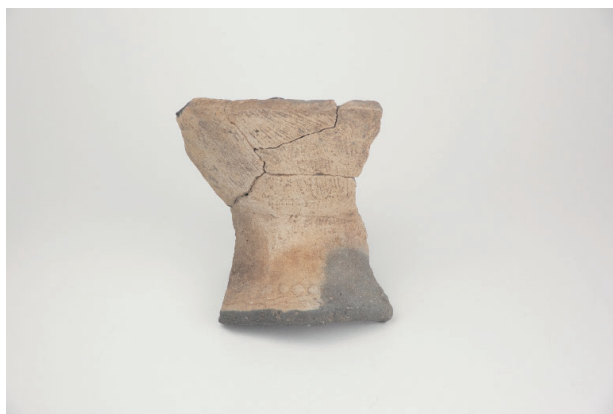
8. 第 20 次調査区出土遺物 10-4