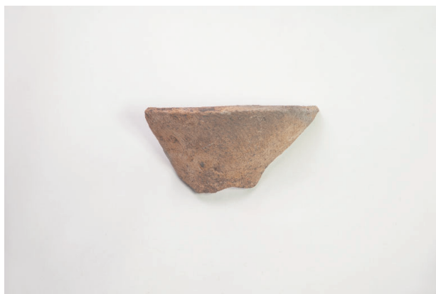
4. 第 19 次調査区出土遺物 9-4