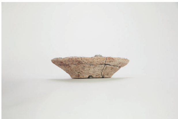
5. 第 19 次調査区出土遺物 9-6