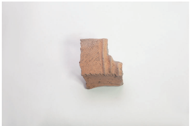
6. 第 19 次調査区出土遺物 9-15