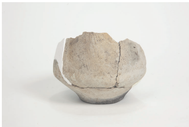
6. 第 24 次調査区出土遺物 14-14