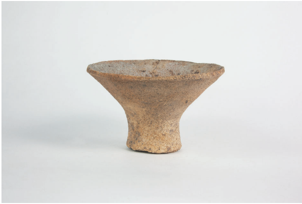
1. 第 20 次調査区出土遺物 10-5