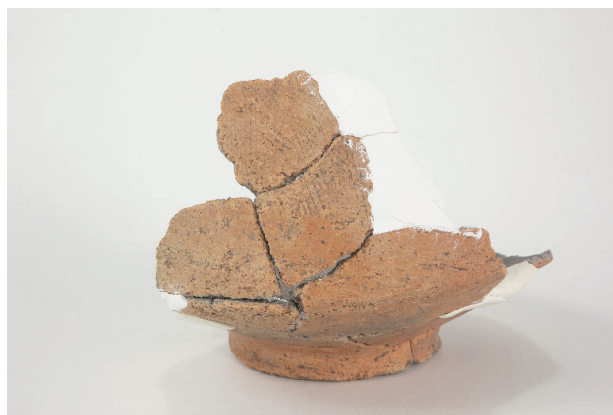
2. 第 24 次調査区出土遺物 14-10