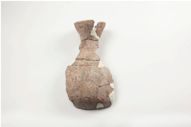
3. 第 20 次調査区出土遺物 10-9