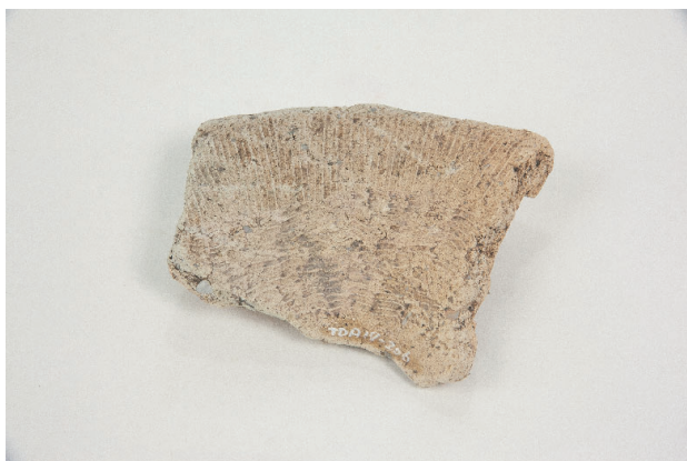
1. 第 27 次調査区出土遺物 17-3