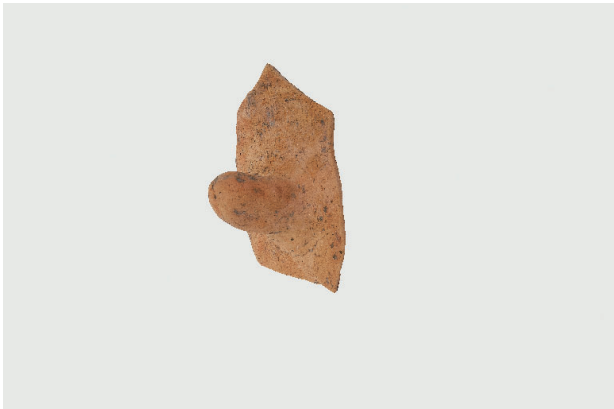
3. 第 25 次調査区出土遺物 15-4