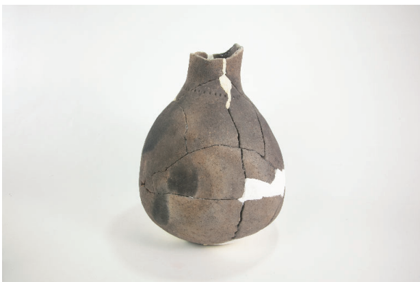
7. 第 27 次調査区出土遺物 17-1