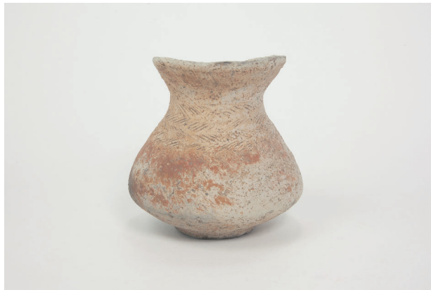
4. 第 23 次調査区出土遺物 13-3