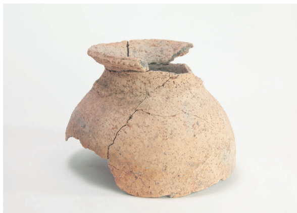
2. 第 20 次調査区出土遺物 10-19