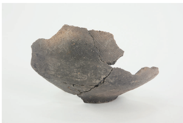
4. 第 24 次調査区出土遺物 14-30