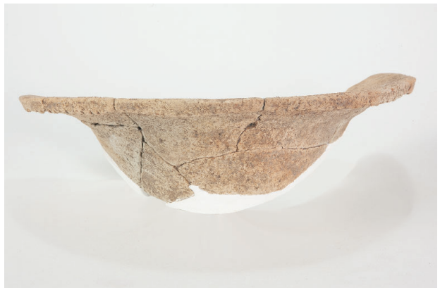
4. 第 26 次調査区出土遺物 16-1