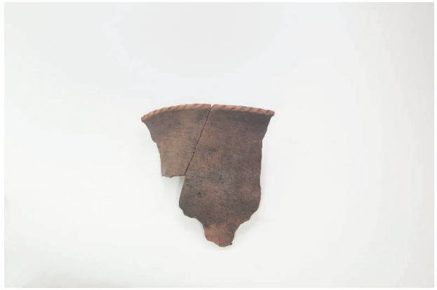
2. 第 17 次調査区出土遺物 7-55