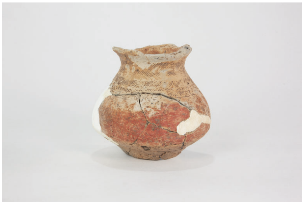
1. 第 28 次調査区出土遺物 18-3