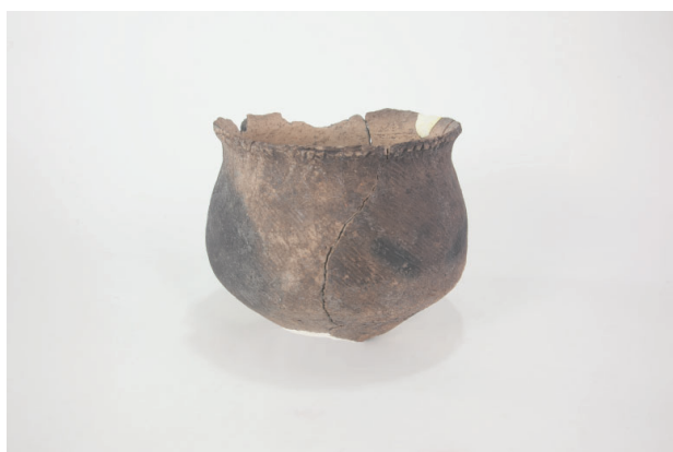
4. 第 24 次調査区出土遺物 14-20