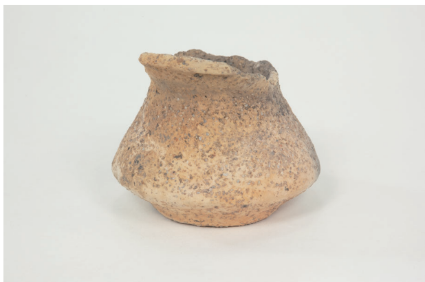
5. 第 24 次調査区出土遺物 14-31