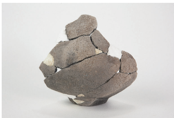
4. 第 27 次調査区出土遺物 17-6