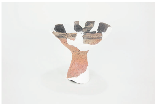
2. 第 23 次調査区出土遺物 13-1