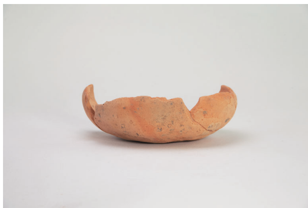
4. 第 19 次調査区出土遺物 9-23