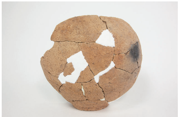
6. 第 26 次調査区出土遺物 16-3