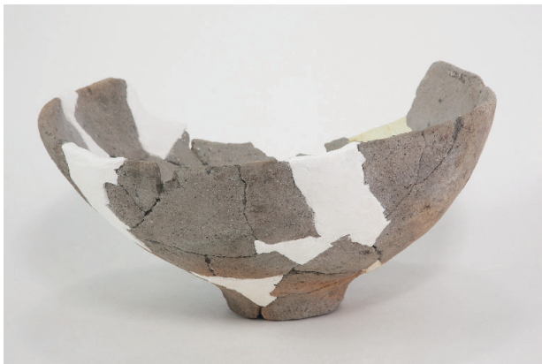
8. 第 29 次調査区出土遺物 19-2