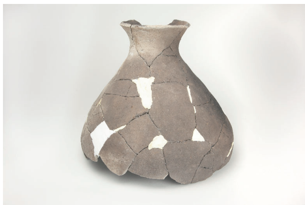
1. 第 22 次調査区出土遺物 12-5