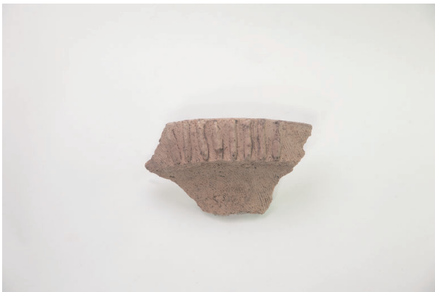
5. 第 19 次調査区出土遺物 9-14