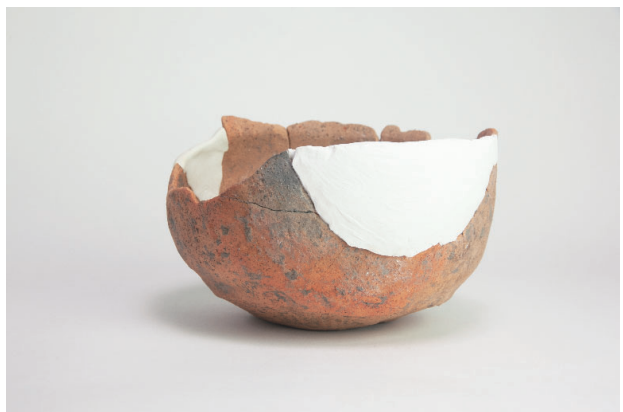
8. 第 18 次調査区出土遺物 8-12