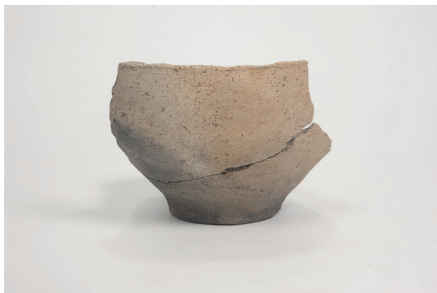
6. 第 24 次調査区出土遺物 14-22