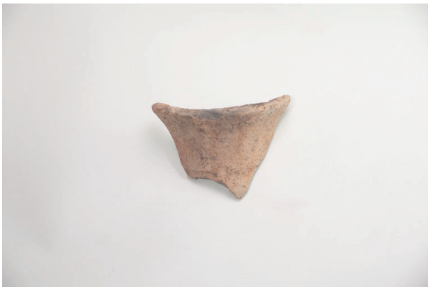
3. 第 19 次調査区出土遺物 9-12