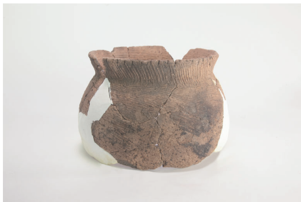
8. 第 23 次調査区出土遺物 13-7