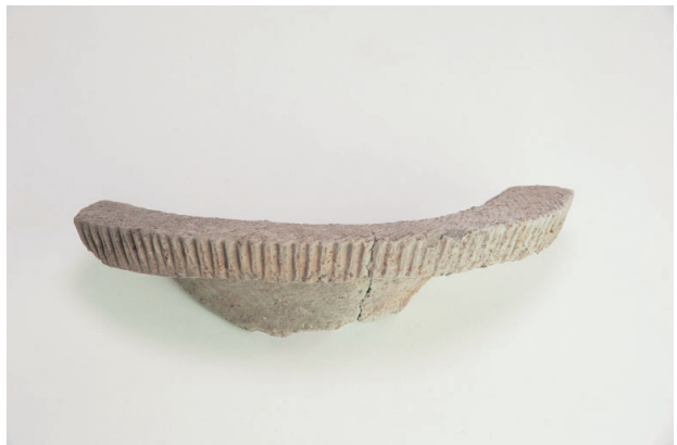
6. 第 18 次調査区出土遺物 8-3