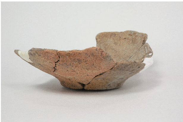
5. 第 28 次調査区出土遺物 18-7