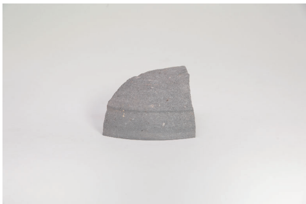
5. 第 19 次調査区出土遺物 9-25