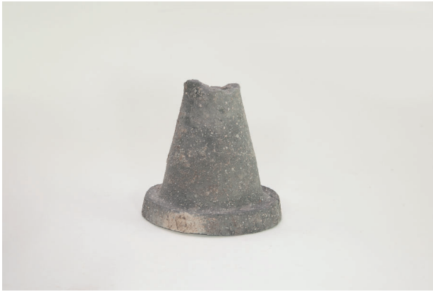
1. 第 19 次調査区出土遺物 9-10