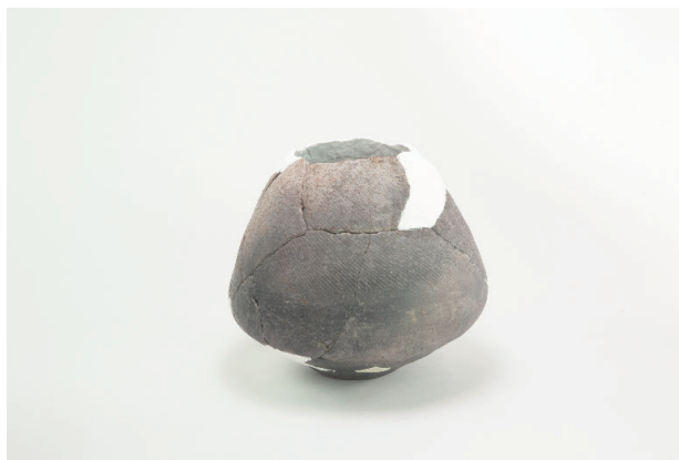
2. 第 23 次調査区出土遺物 13-9