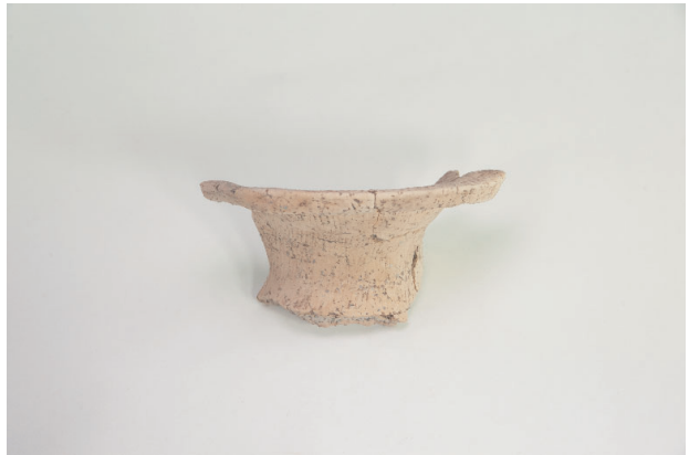
4. 第 19 次調査区出土遺物 9-13