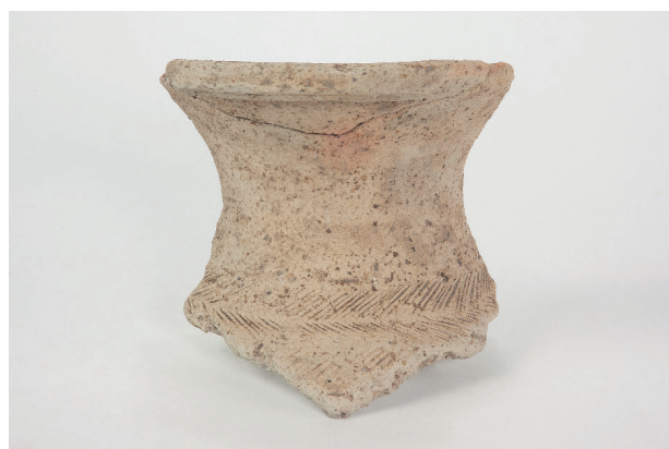
8. 第 22 次調査区出土遺物 12-2