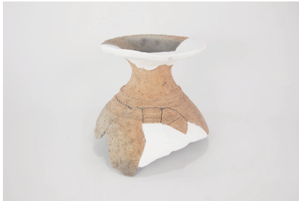
6. 第 23 次調査区出土遺物 13-5