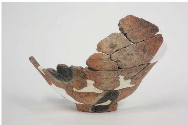
5. 第 23 次調査区出土遺物 13-14