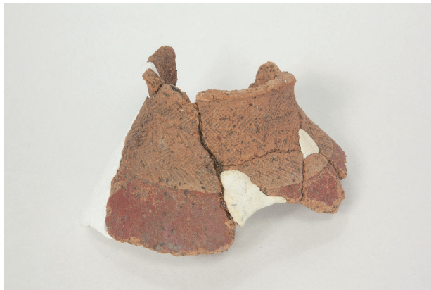
2. 第 28 次調査区出土遺物 18-4