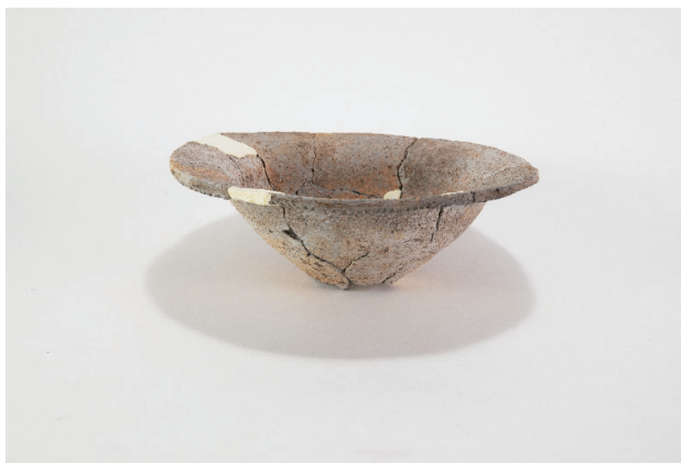
1. 第 19 次調査区出土遺物 9-1