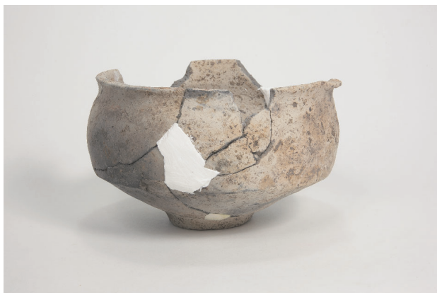
5. 第 24 次調査区出土遺物 14-21