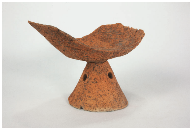
6. 第 27 次調査区出土遺物 17-8