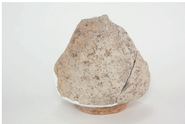
6. 第 24 次調査区出土遺物 14-32