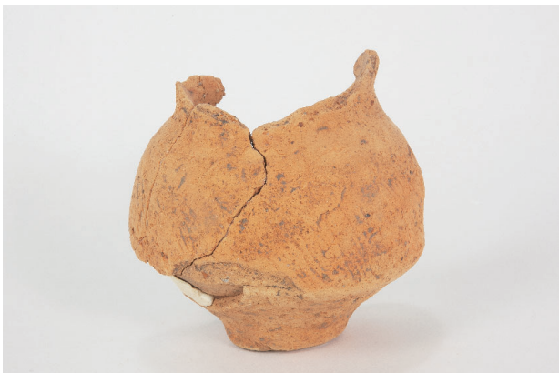
5. 第 26 次調査区出土遺物 16-2