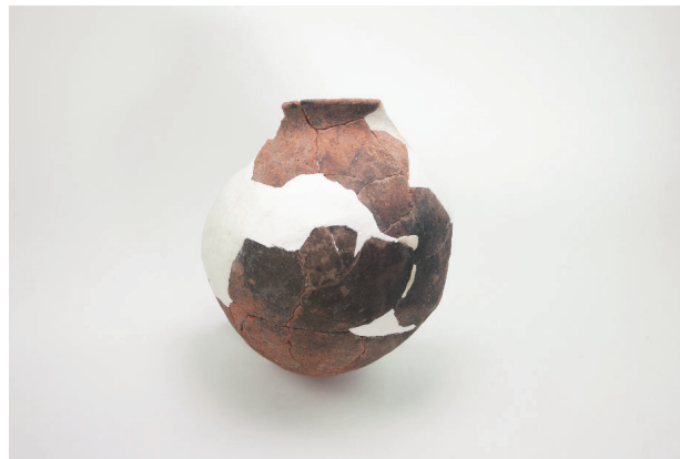
6. 第 20 次調査区出土遺物 10-26