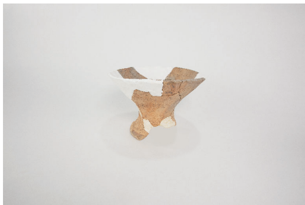
6. 第 23 次調査区出土遺物 13-16