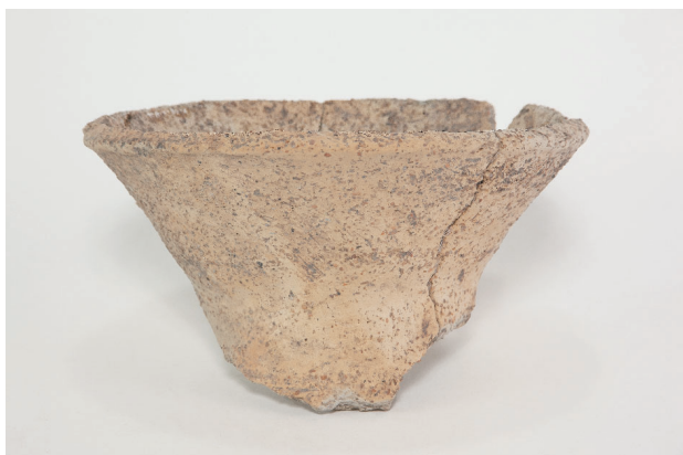
3. 第 24 次調査区出土遺物 14-29