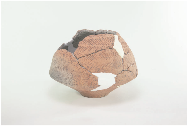
1. 第 23 次調査区出土遺物 13-22