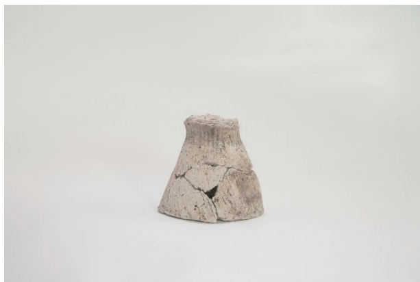
6. 第 19 次調査区出土遺物 9-7