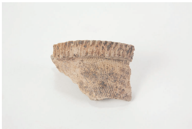
2. 第 24 次調査区出土遺物 14-28