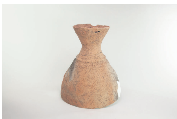
4. 第 24 次調査区出土遺物 14-12