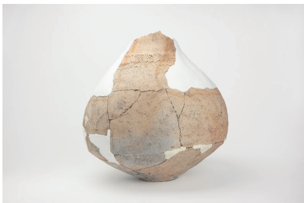
3. 第 24 次調査区出土遺物 14-11