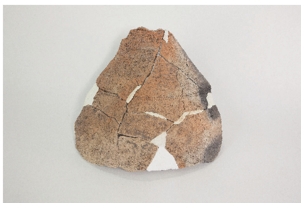
4. 第 23 次調査区出土遺物 13-13