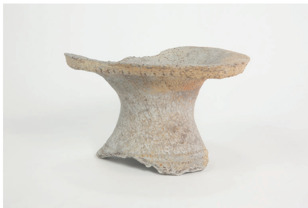
8. 第 24 次調査区出土遺物 14-16