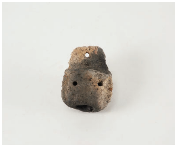
2. 第17次調査区 SK11 銅鐸形土製品 背面