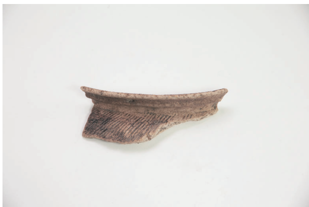
3. 第 19 次調査区出土遺物 9-21