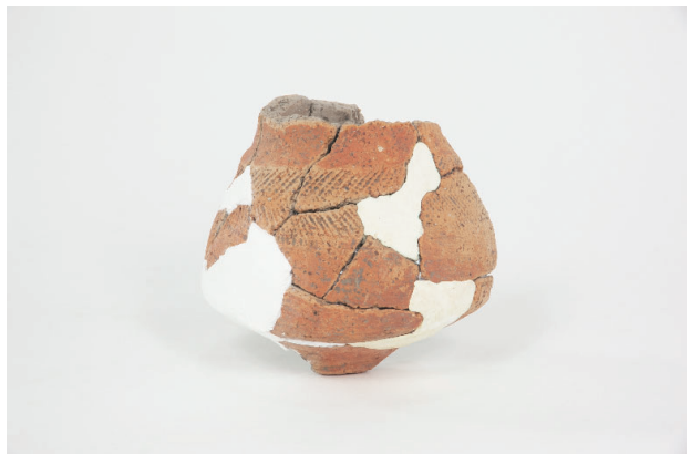
8. 第 24 次調査区出土遺物 14-7