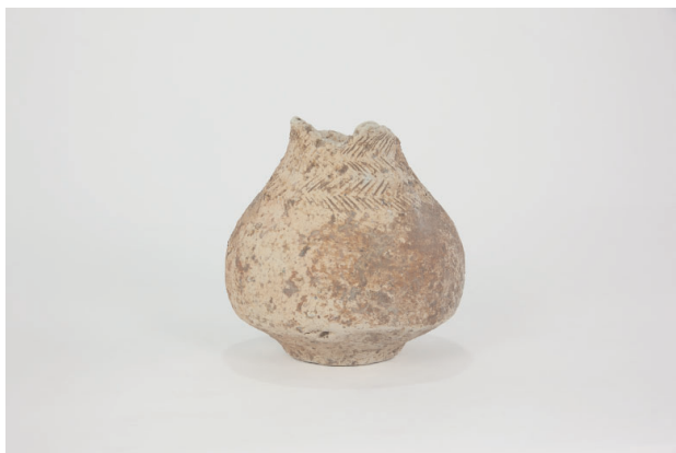
7. 第 28 次調査区出土遺物 18-1