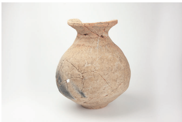
3. 第 23 次調査区出土遺物 13-10