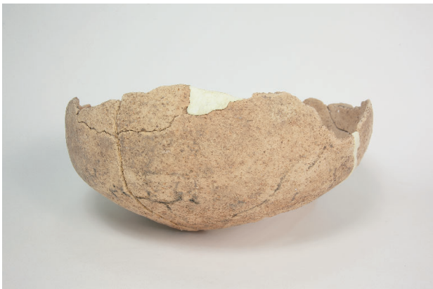
3. 第 28 次調査区出土遺物 18-5