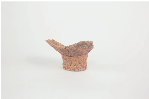
7. 第 20 次調査区出土遺物 10-15