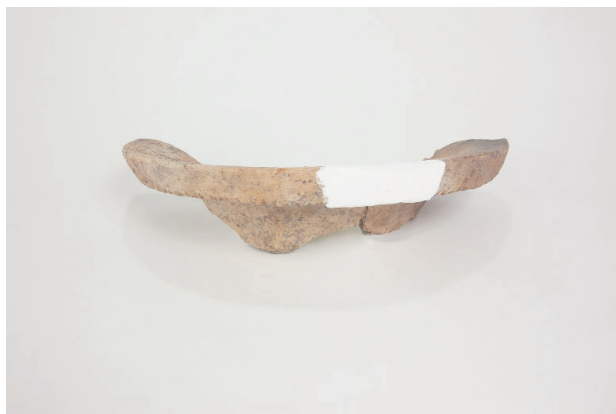
8. 第 24 次調査区出土遺物 14-26