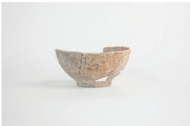
5. 第 20 次調査区出土遺物 10-24