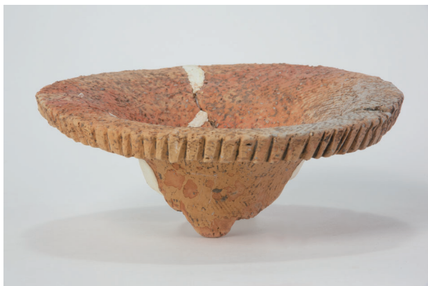
7. 第 23 次調査区出土遺物 13-17