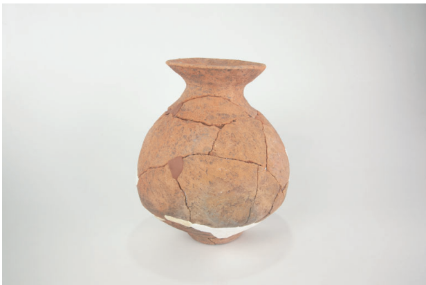
7. 第 29 次調査区出土遺物 19-1