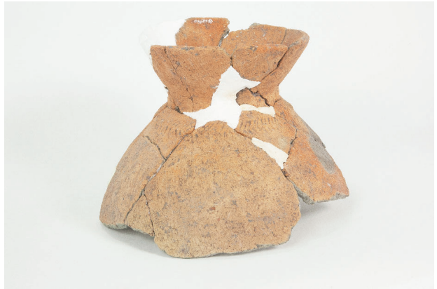
2. 第 25 次調査区出土遺物 15-3