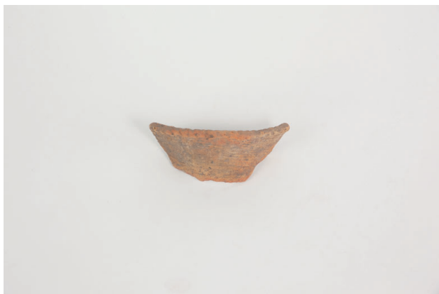
7. 第 20 次調査区出土遺物 10-2