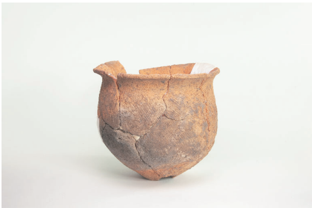
5. 第 20 次調査区出土遺物 10-13