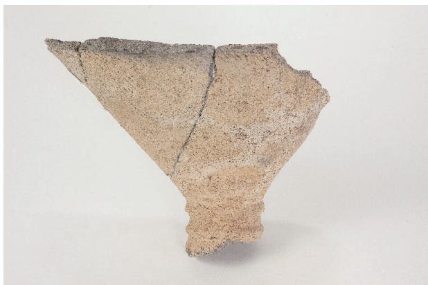
5. 第 24 次調査区出土遺物 14-13