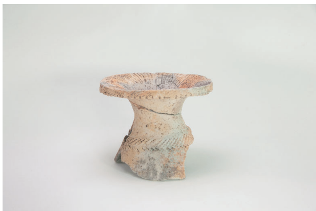
3. 第 19 次調査区出土遺物 9-3