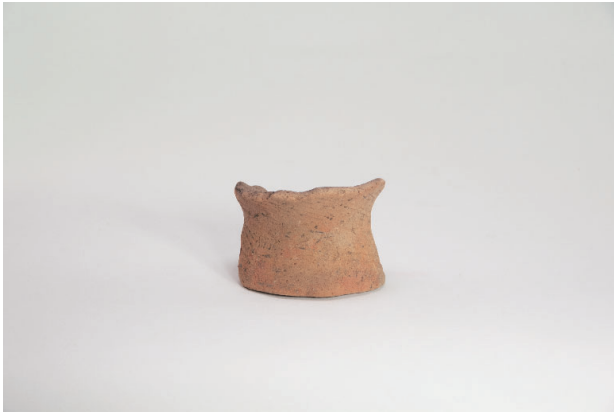
1. 第 17 次調査区出土遺物 7-54