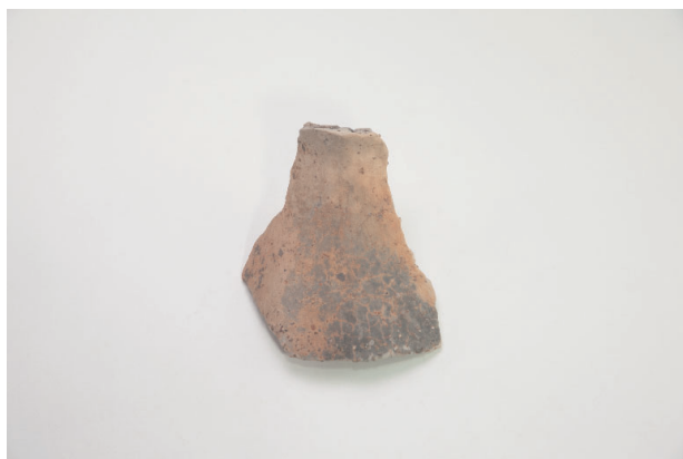
8. 第 19 次調査区出土遺物 9-9