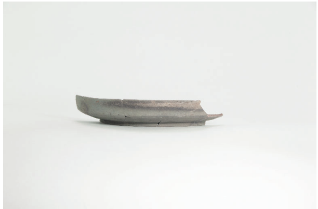
4. 第 17 次調査区出土遺物 7-57