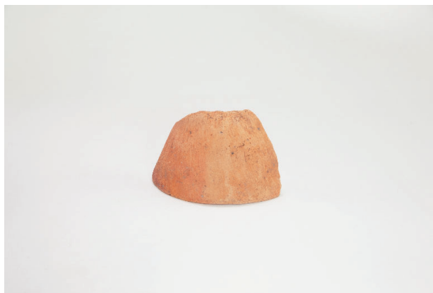
2. 第 19 次調査区出土遺物 9-20