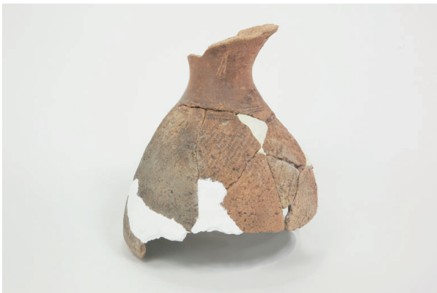
5. 第 24 次調査区出土遺物 14-4