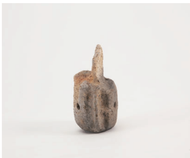
4. 第17次調査区 SK11 銅鐸形土製品 左側面