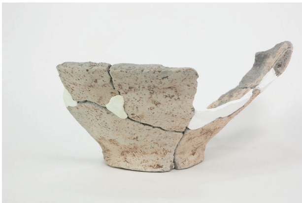
6. 第 28 次調査区出土遺物 18-8