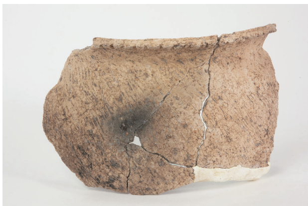
3. 第 24 次調査区出土遺物 14-19