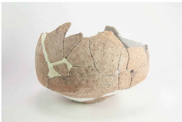
7. 第 23 次調査区出土遺物 13-6