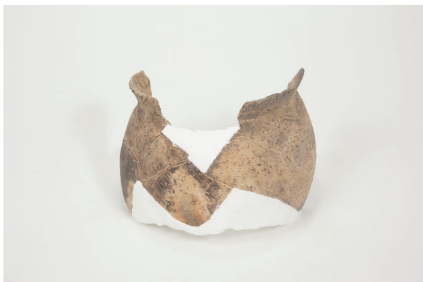
7. 第 24 次調査区出土遺物 14-33