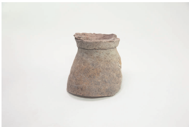
1. 第 19 次調査区出土遺物 9-19