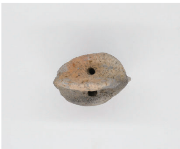
5. 第17次調査区 SK11 銅鐸形土製品 上部