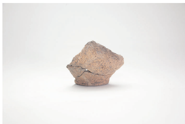
4. 第 20 次調査区出土遺物 10-22