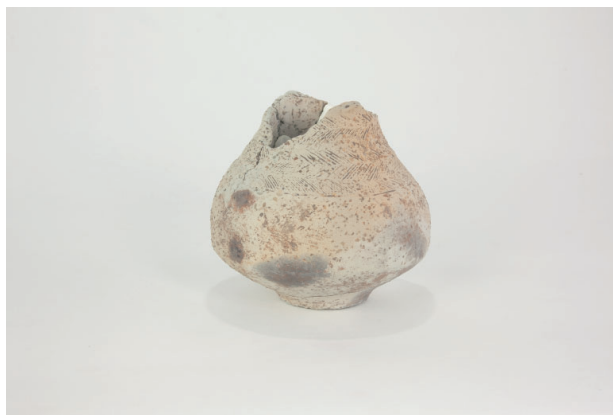
2. 第 27 次調査区出土遺物 17-4