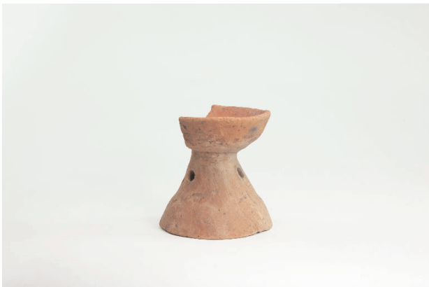
5. 第 17 次調査区出土遺物 7-58