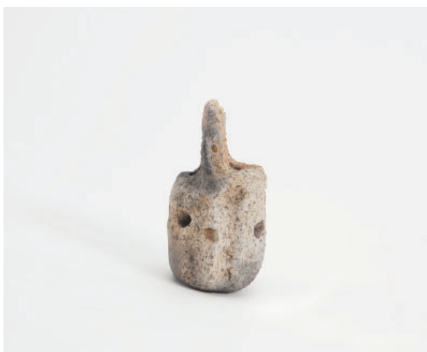
3. 第17次調査区 SK11 銅鐸形土製品 右側面