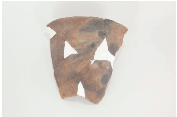
8. 第 27 次調査区出土遺物 17-2