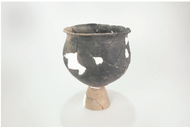
7. 第 24 次調査区出土遺物 14-6