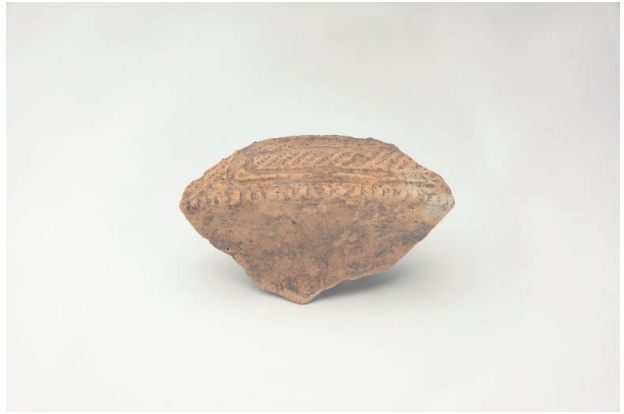
2. 第 20 次調査区出土遺物 10-6