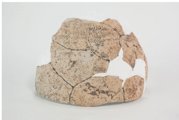
4. 第 28 次調査区出土遺物 18-6