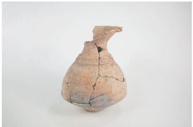
6. 第 24 次調査区出土遺物 14-5