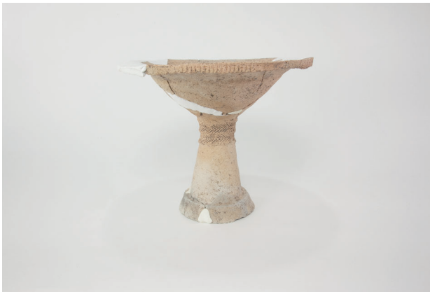
3. 第 24 次調査区出土遺物 14-2