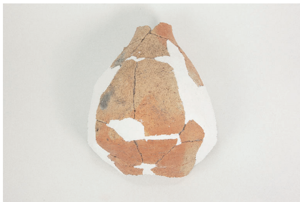
2. 第 24 次調査区出土遺物 14-18