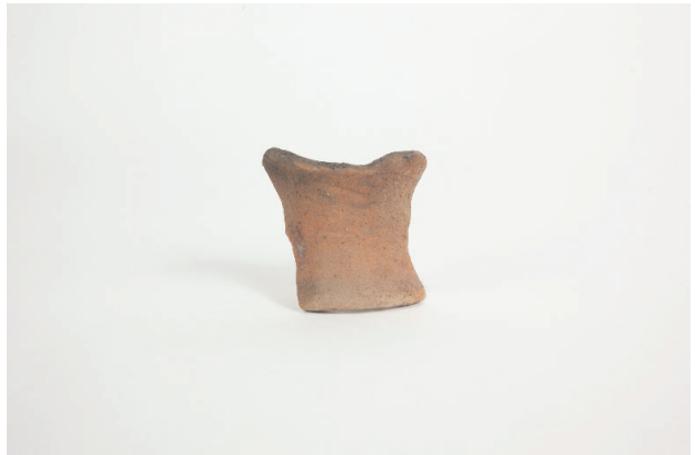
4. 第 20 次調査区出土遺物 10-11