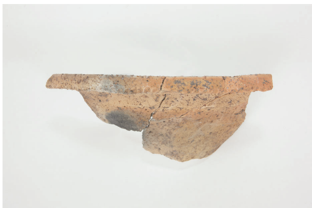
1. 第 24 次調査区出土遺物 14-27