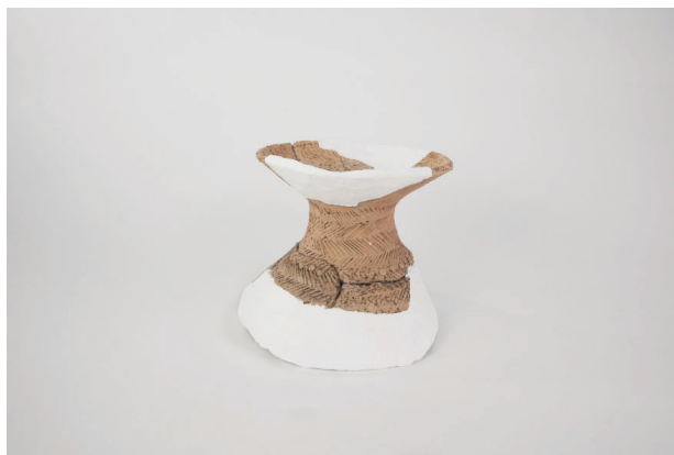
8. 第 23 次調査区出土遺物 13-18