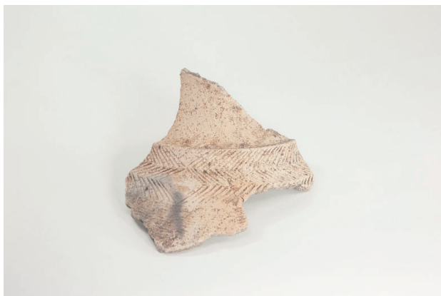
1. 第 20 次調査区出土遺物 10-18