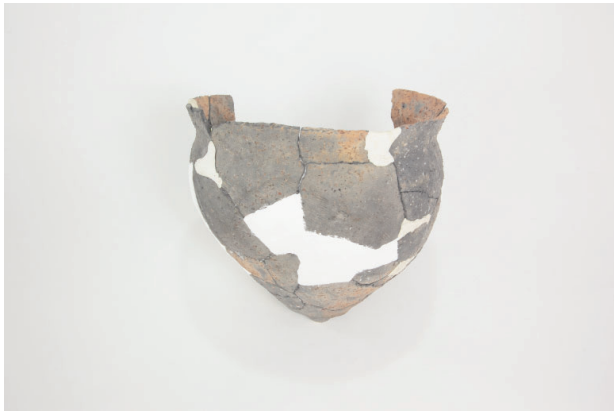
1. 第 25 次調査区出土遺物 15-2