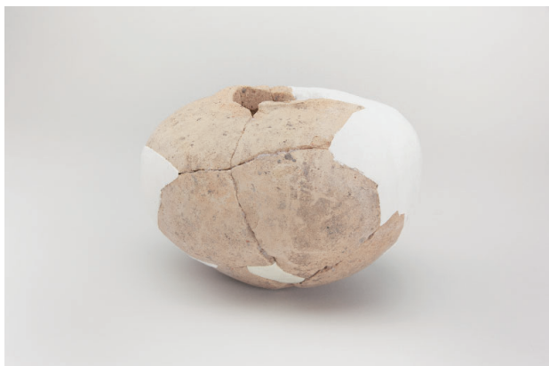
7. 第 20 次調査区出土遺物 10-29