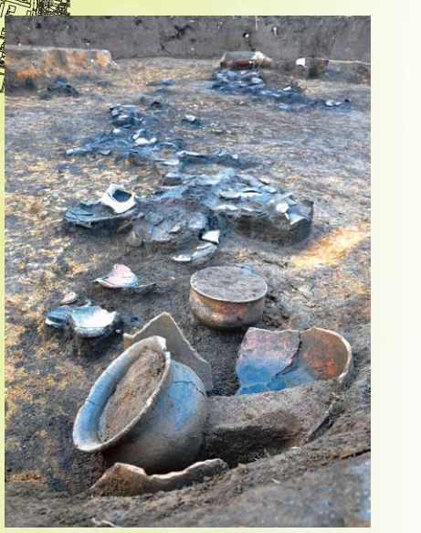
93. 夏見台遺跡 弥生時代の竪穴住居跡。