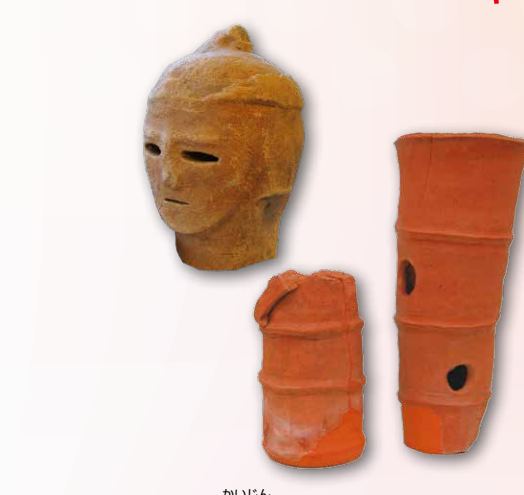
海神地区で出土した 人物埴輪・円筒埴輪(6世紀) 船橋駅周辺の本町や海神では、古墳に並べられた埴輪が見つかりました。古墳時代の海神一帯には砂州が広がり、そこに古墳群が築かれました。