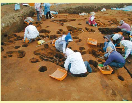
中世の建物跡の発掘調査 (東中山台遺跡群)