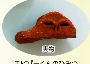
実物 エビソークンのひみつ エビソークンは海老ヶ作貝塚から出土した縄文土器のふちについていたと考えられる人面のかざりがモデルです。