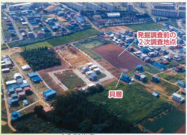
40. 海老ヶ作貝塚(昭和40年代撮影) 縄文時代中期の大型環状集落・貝塚です。白くみえる部分は縄文人が貝を捨てた場所です。