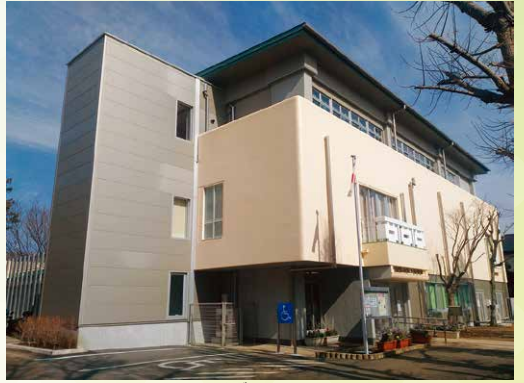
郷土資料館 旧石器時代から現代までの船橋の歴史を楽しく学ぶことができます。(薬門台4丁目)

編集・発行 船橋市教育委員会 生涯学習部 文化課 〒273-8501 千葉県船橋市湊町 2-10-25 電話 047-436-2887・2898 発行日 令和7年6月13日(第10版)