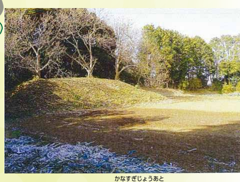
150. 金杉城跡 中世後半、15～16世紀の城跡。東西約47m、南北約43mの土塁に囲まれています。調査の結果、城の堀は幅約8m、深さ約3mの薬研堀であることがわかりました。