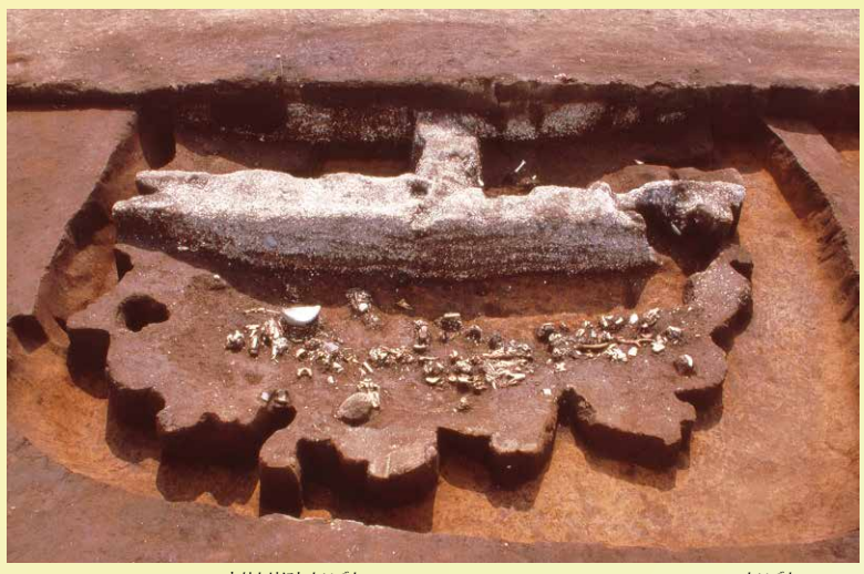
60. 国史跡 取掛西貝塚(5) 調査地点 約1万年前の貝塚 東京湾東岸部最古の貝塚。市内ではめずらしいヤマトシジミ主体の貝層下から10体以上のイノシシの頭蓋骨、シカの頭蓋骨などが見つかり、動物を使ったまつりがおこなわれていた可能性があります。今までの発掘調査の結果、たくさんの竪穴住居跡とともに、豊富な生活の道具や装飾品が見つかり、約1万年前の生活の様子がわかってきました。取掛西貝塚は令和3年10月、国の史跡に指定されました。