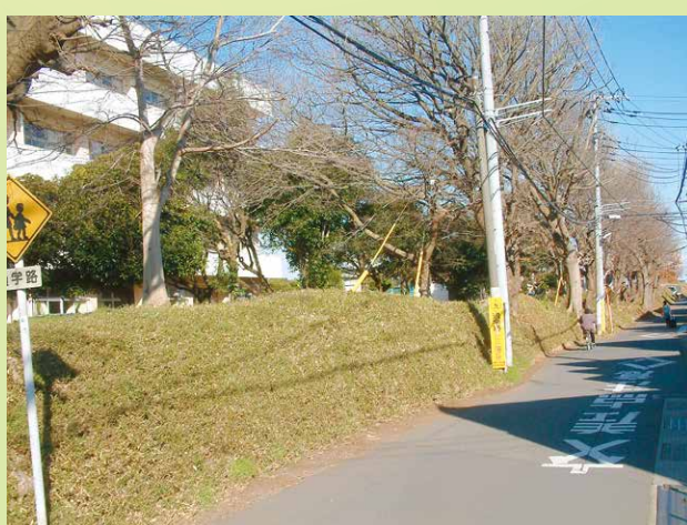
140. 土手際遺跡(市指定文化財 下野牧二和野馬土手) 江戸時代、徳川幕府の馬牧跡。市内各地に牧をかこった土手が残っています。