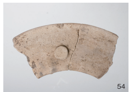
下郡遺跡群第 151 次調査 2 区出土遺物