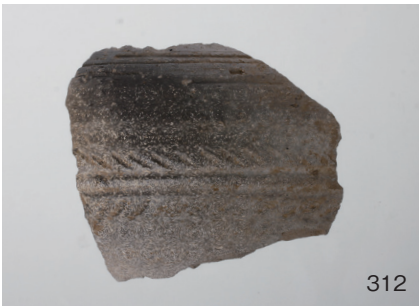
下郡遺跡群第 151 次調査 2 区出土遺物