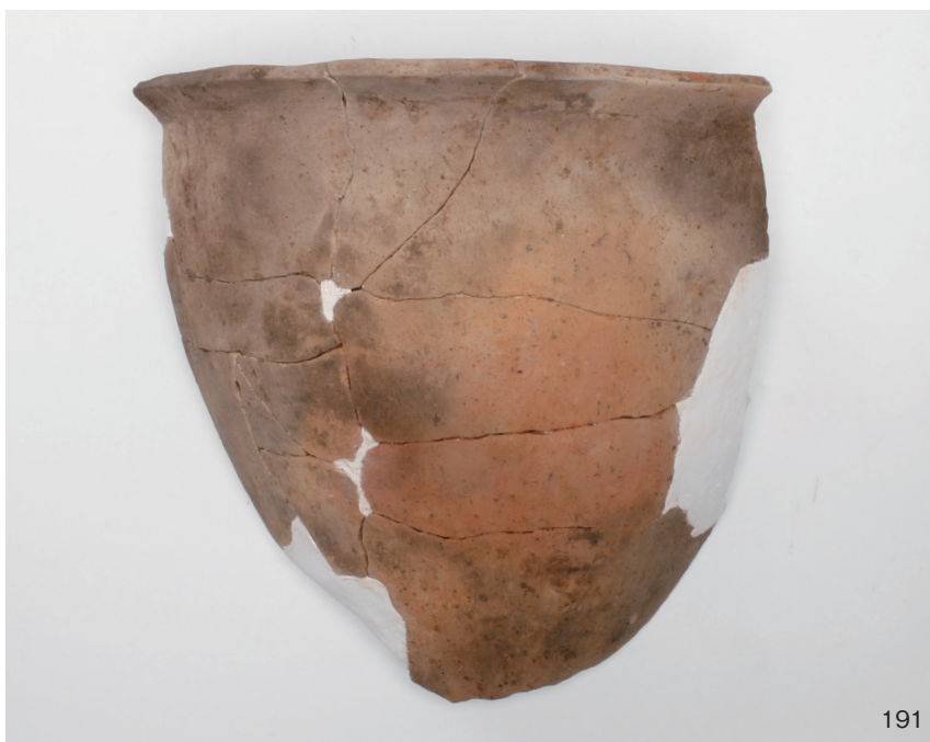
下郡遺跡群第 151 次調査 2 区出土遺物