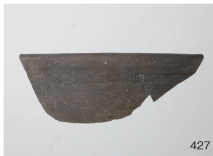
下郡遺跡群第 151 次調査 2 区出土遺物