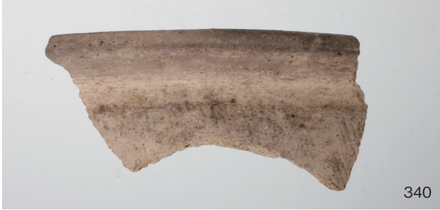
下郡遺跡群第 151 次調査 2 区出土遺物