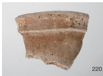
下郡遺跡群第 151 次調査 2 区出土遺物