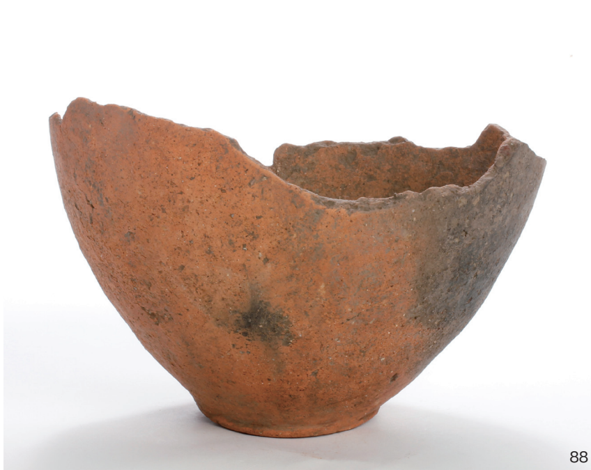
下郡遺跡群第 151 次調査 2 区出土遺物