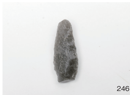
下郡遺跡群第 151 次調査 2 区出土遺物