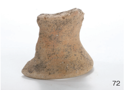
下郡遺跡群第 151 次調査 2 区出土遺物