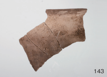
下郡遺跡群第 151 次調査 2 区出土遺物