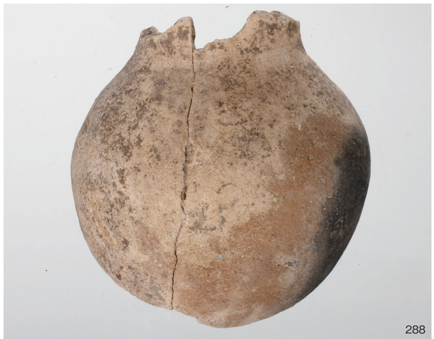
下郡遺跡群第 151 次調査 2 区出土遺物