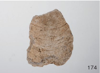
下郡遺跡群第 151 次調査 2 区出土遺物