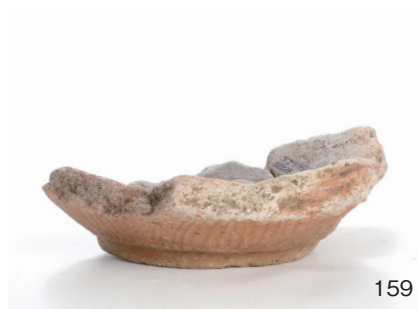
下郡遺跡群第 151 次調査 2 区出土遺物