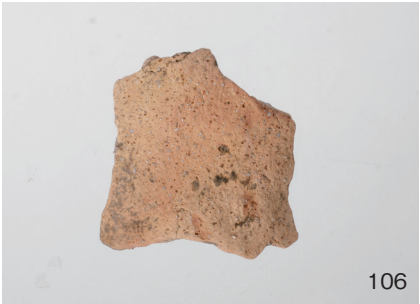
下郡遺跡群第 151 次調査 2 区出土遺物