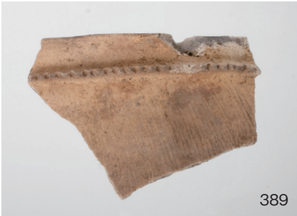
下郡遺跡群第 151 次調査 2 区出土遺物