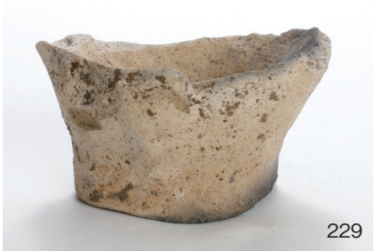
下郡遺跡群第 151 次調査 2 区出土遺物