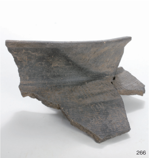
下郡遺跡群第 151 次調査 2 区出土遺物