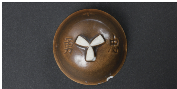
下郡遺跡群第 151 次調査 1 区表土出土遺物