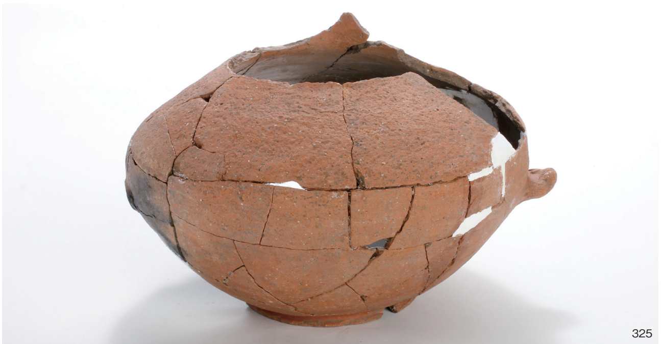
下郡遺跡群第 151 次調査 2 区出土遺物