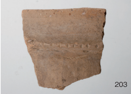
下郡遺跡群第 151 次調査 2 区出土遺物