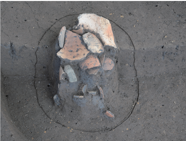
26 151-SK2040 遺物出土状況