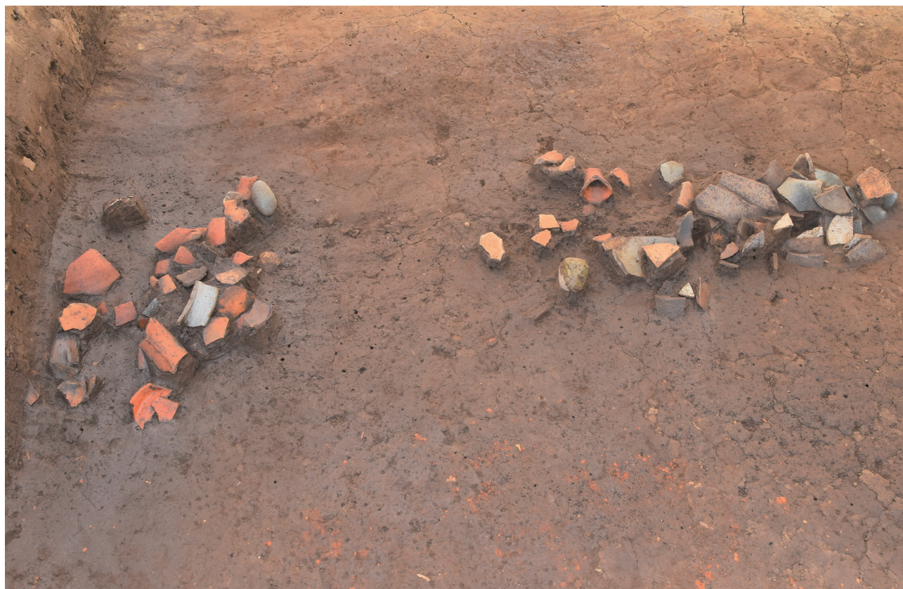
13 151-SX2029 遺物出土状況