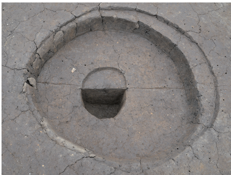
45 152-SK4025 (SK4075)