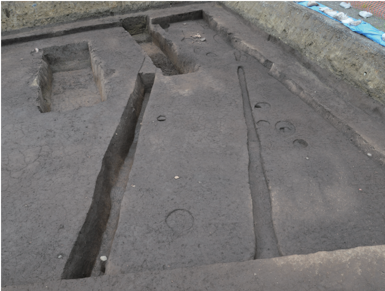
14 151-SD2003 (左側溝)