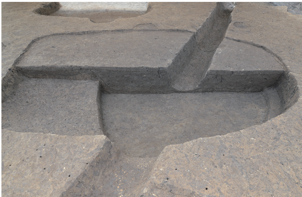
29 151-SK2090 完掘