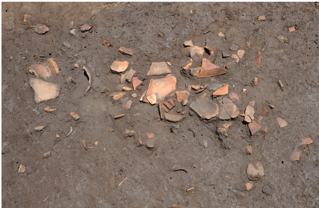
12 151-SX2004 遺物出土状況