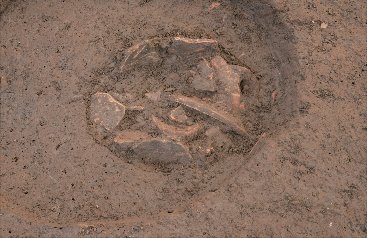
39 151-SP2228 遺物出土状況