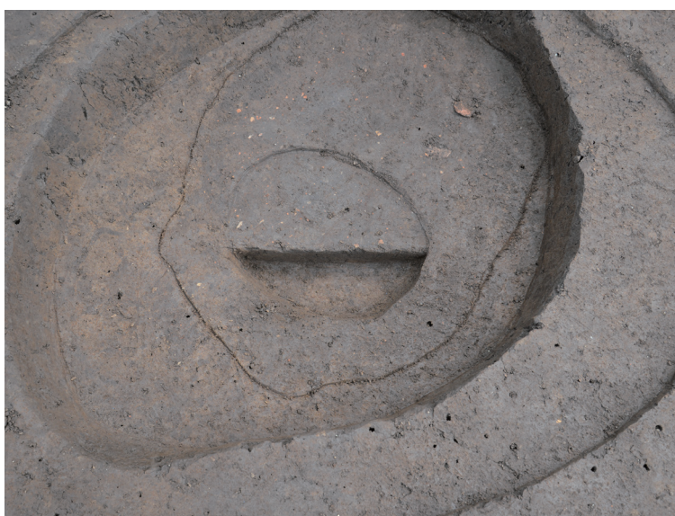
46 152-SK4035 (SK4075)