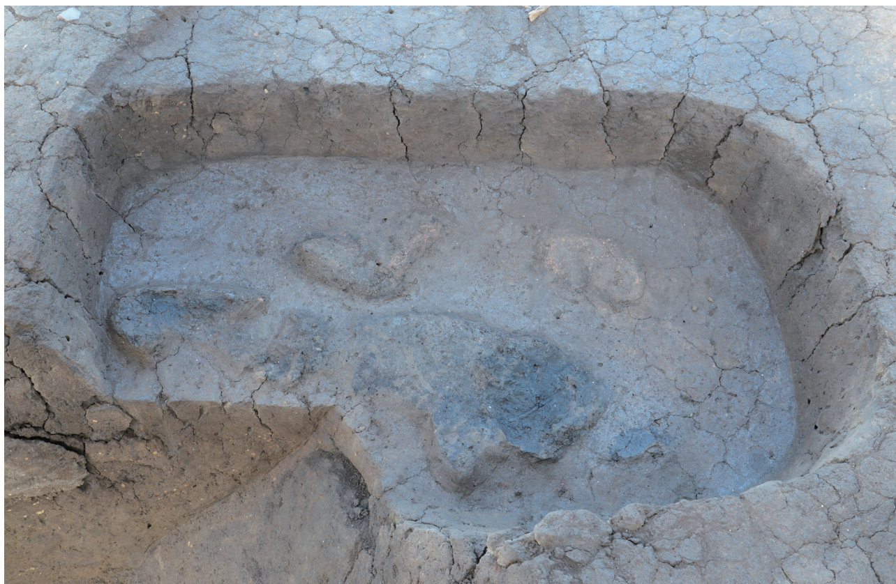
21 151-SK2013 完掘状況