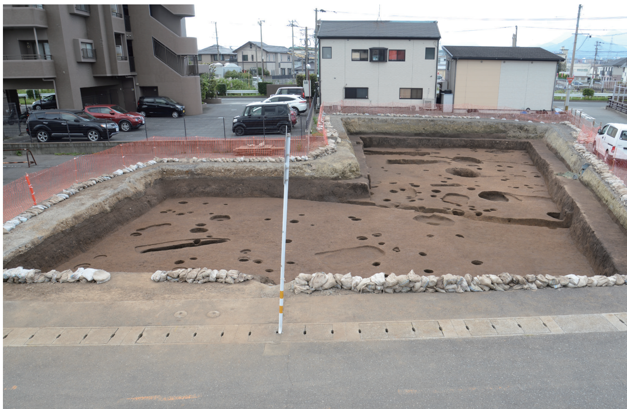
8 第151次調査2区完掘後全景