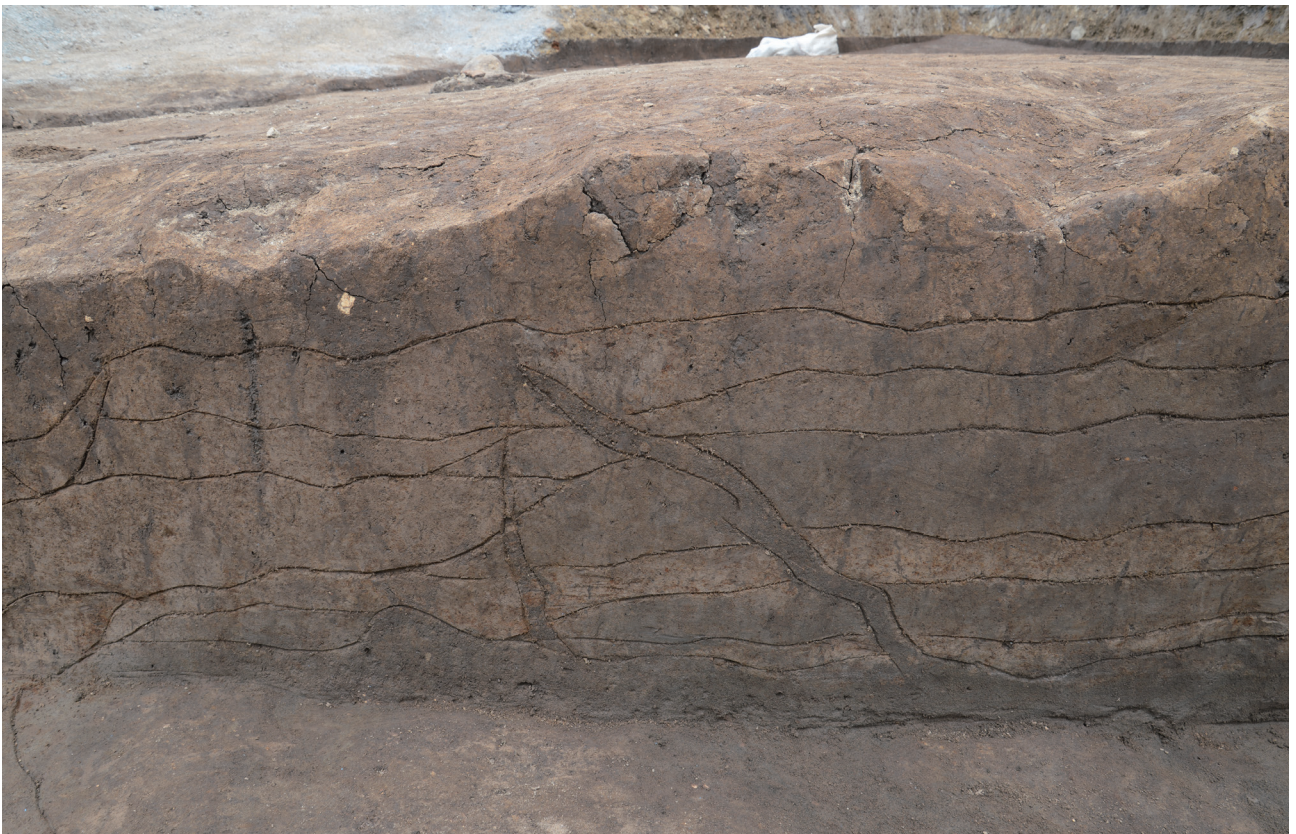
3 第151次調査1区土層断面（西側）