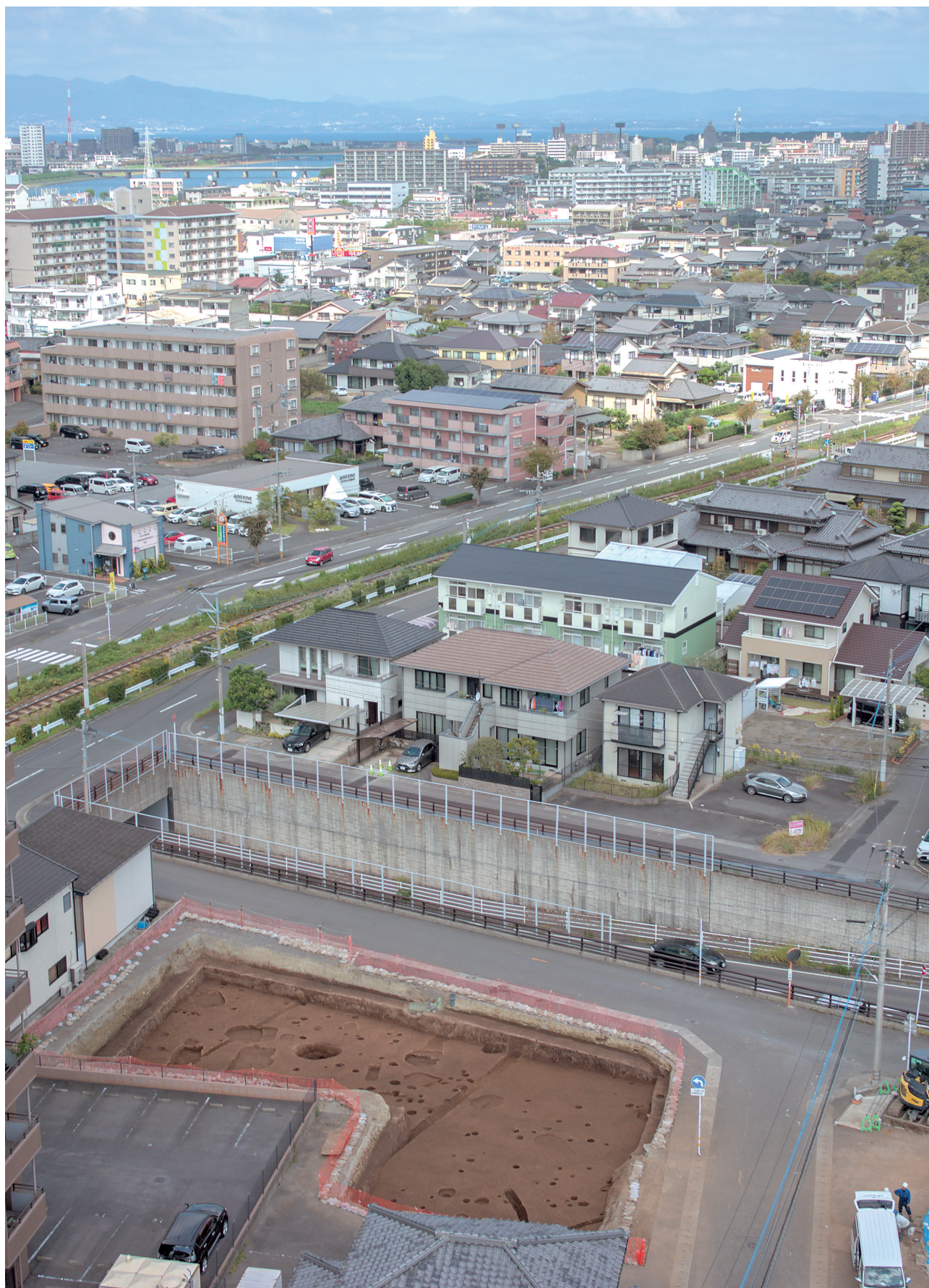
1 第151次調査地から別府湾を望む（手前側に151次2区）