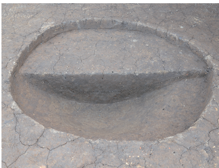
6 151-SK1025 (土層断面)