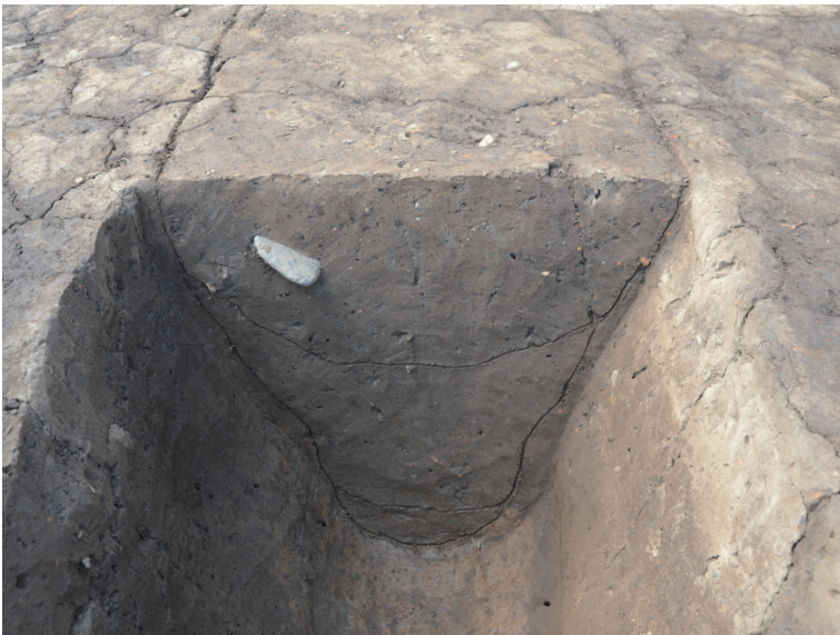
15 151-SD2003 土層断面