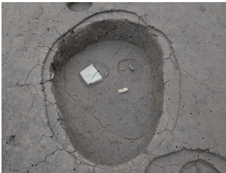
44 152-SK4015 (SK4075)