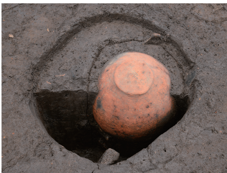
24 151-SK2027 半裁状況