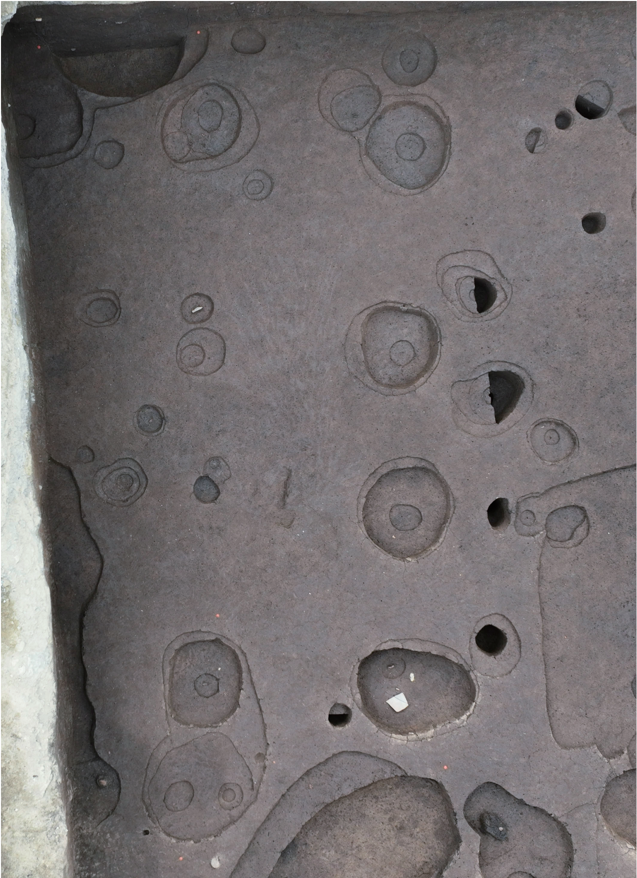
43 152-SB4075 空撮