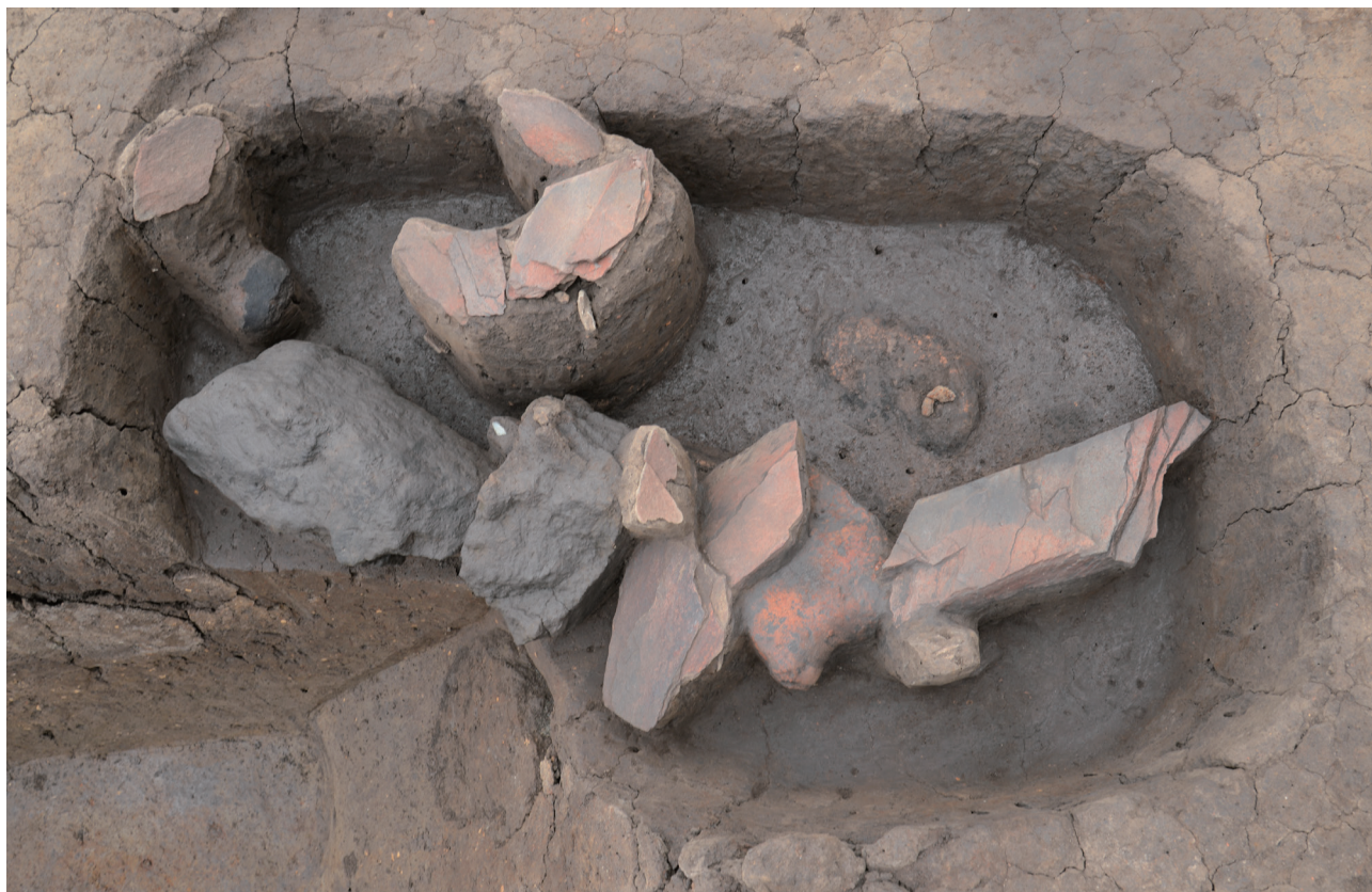
20 151-SK2013 遺物出土状況