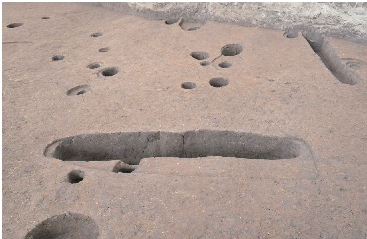
36 151-SK2256 完掘状況