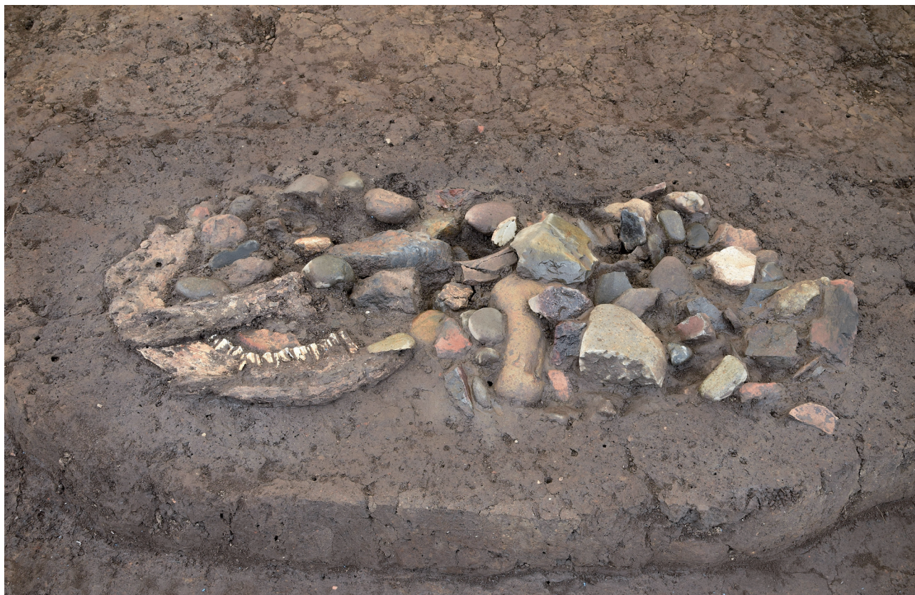
28 151-SK2044 遺物出土状況