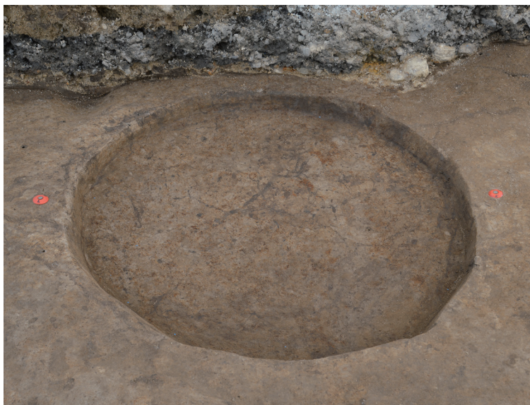
4 151-SK1020 (完掘状況)