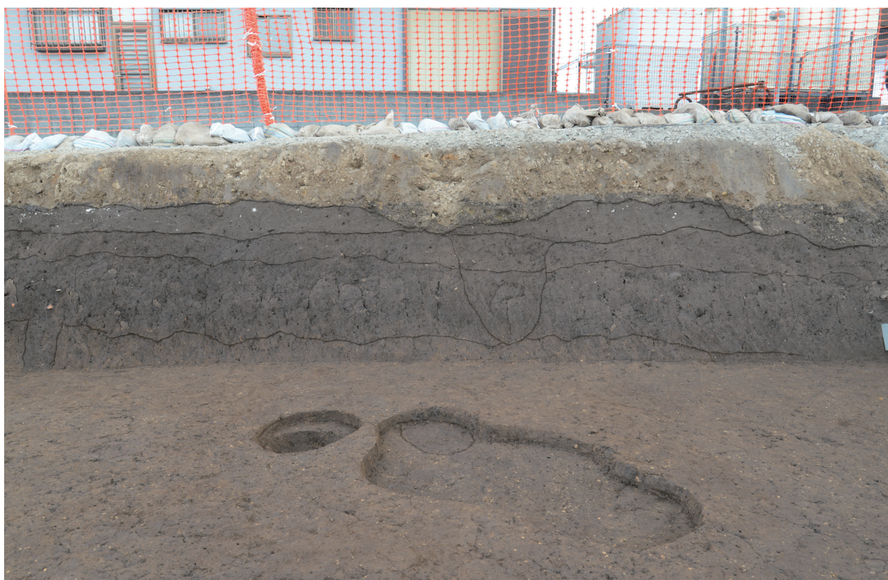
9 第151次調査2区土層断面