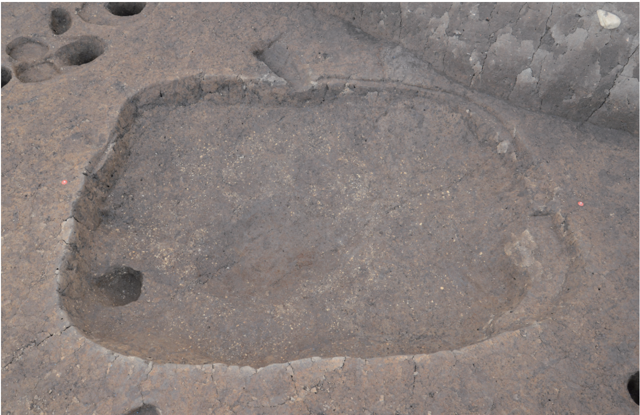
36 151-SK2224 完掘状況