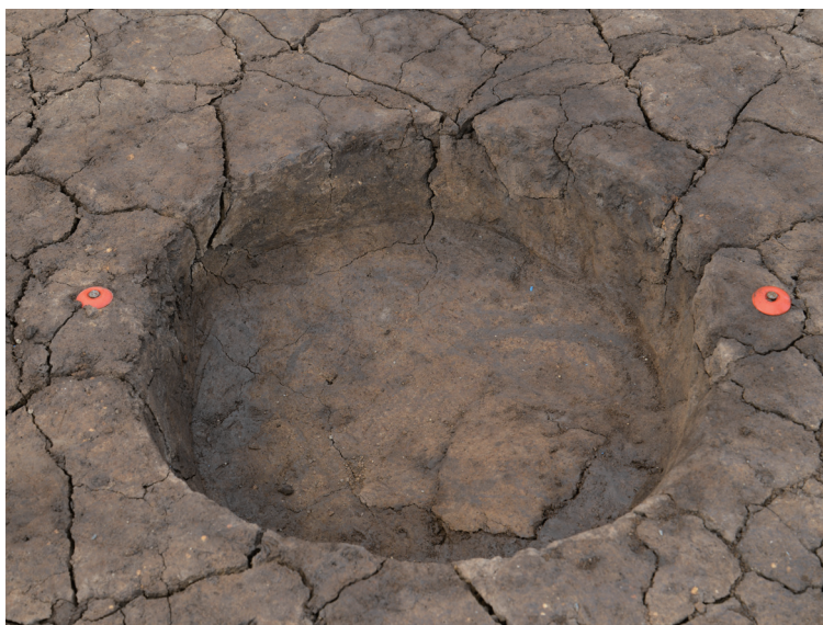
5 151-SK1024 (完掘状況)