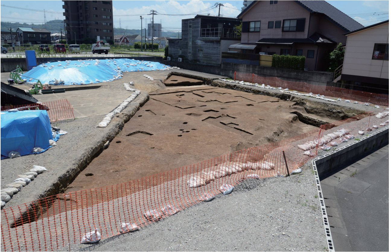
2 第151次調査1区完掘後全景