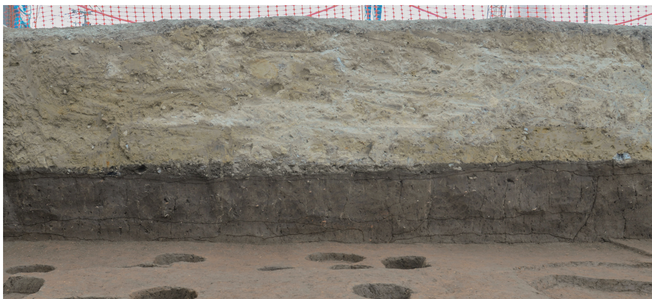
42 第152次調査4区調査区土層