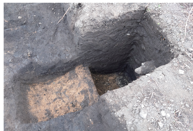
SD360 サブトレンチ 4 断面 (東から)