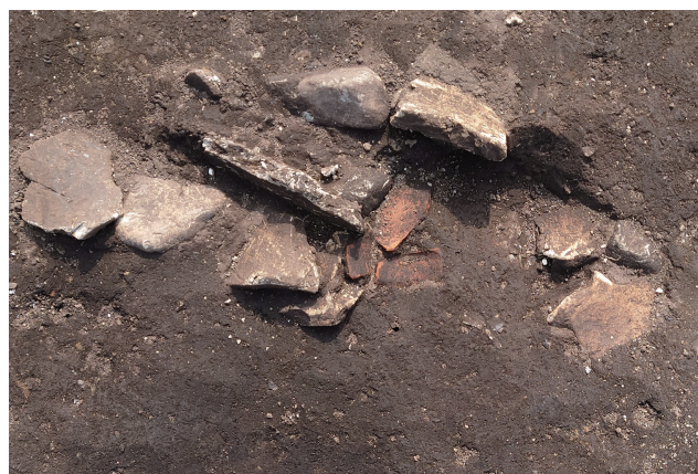
SD365 土師器坏・瓦出土（北から）