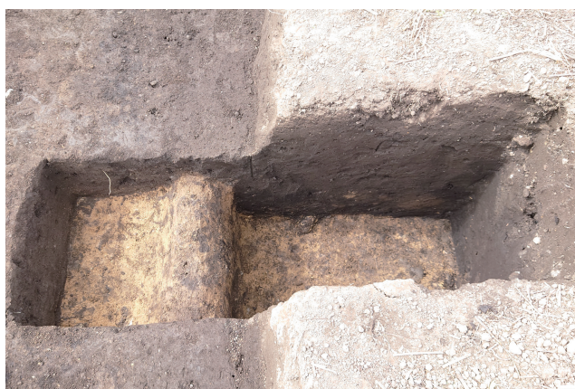
SD360 サブトレンチ 7 (東から)