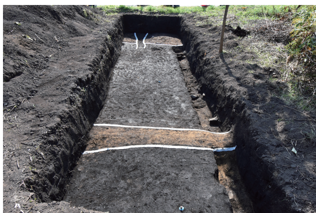
6AFG-A 区全景 (北から)