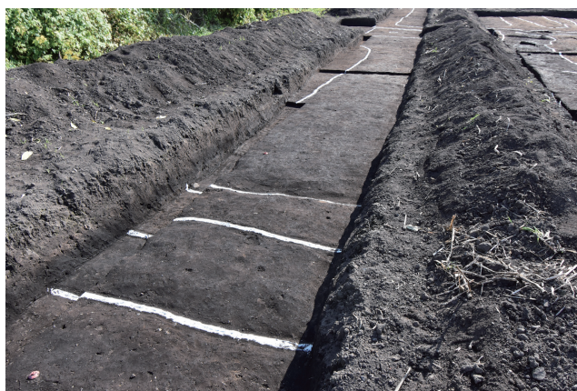
SB370 掘込地業 d・SD362（北から）