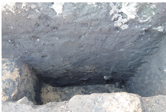
SD360 サブトレンチ 1 断面 (東から)