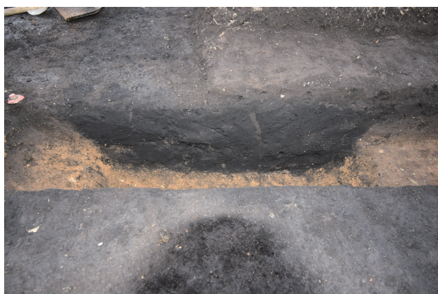
SD366 サブトレンチ 21 断面 (南から)