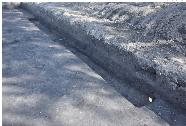
SD362・掘込地業 d サブトレンチ 17 断面 (南西から)