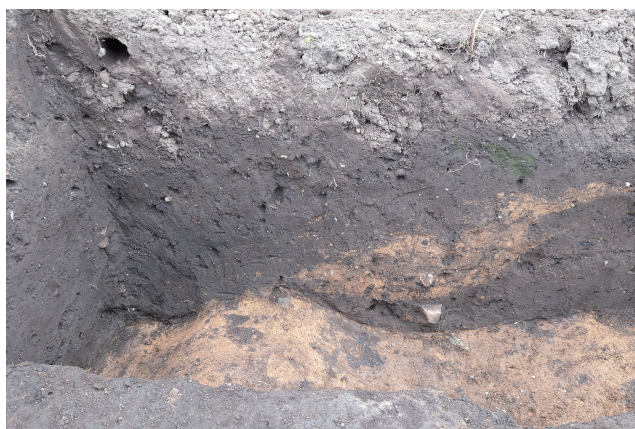
SD360 サブトレンチ 2 断面 (西から)