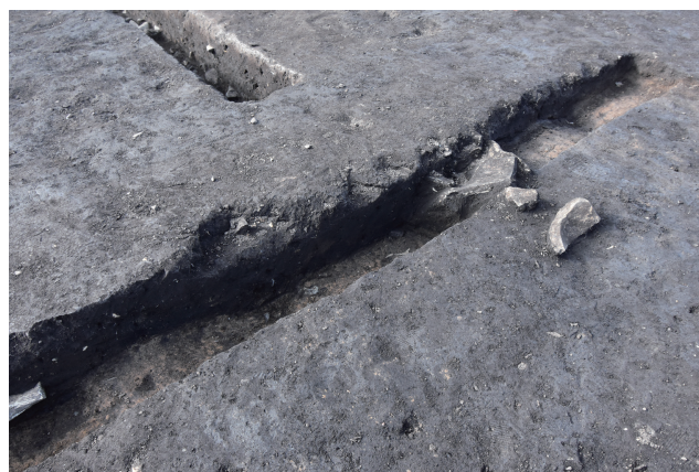
SK374・攪乱土坑サブトレンチ 14 断面 (南東から)