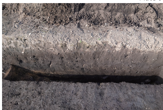
SD363 サブトレンチ 9 断面 (南から)