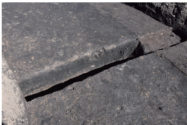
掘込地業 d サブトレンチ 20 断面 (南西から)