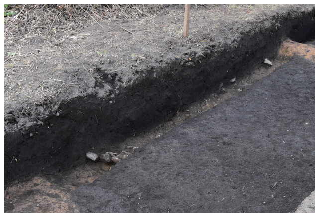
SD374 サブトレンチ 26 断面 (東から)