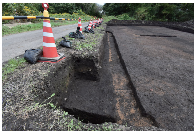
SD360( 西から )