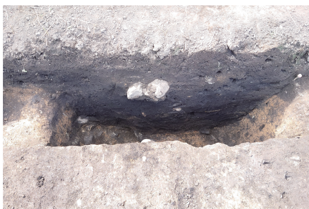
SD361 サブトレンチ 5 断面（西から）