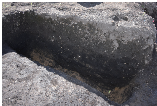
SD366 サブトレンチ 19 断面 (北西から)