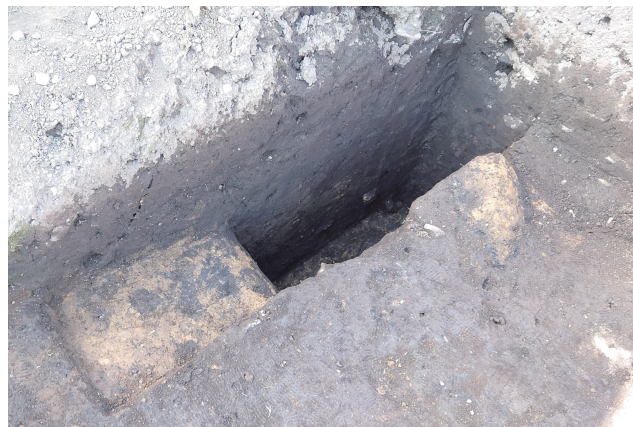
SD360 サブトレンチ 1 断面 (南東から)