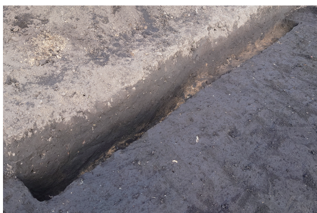
SK (SD) 364 サブトレンチ 10 断面 (南西から)