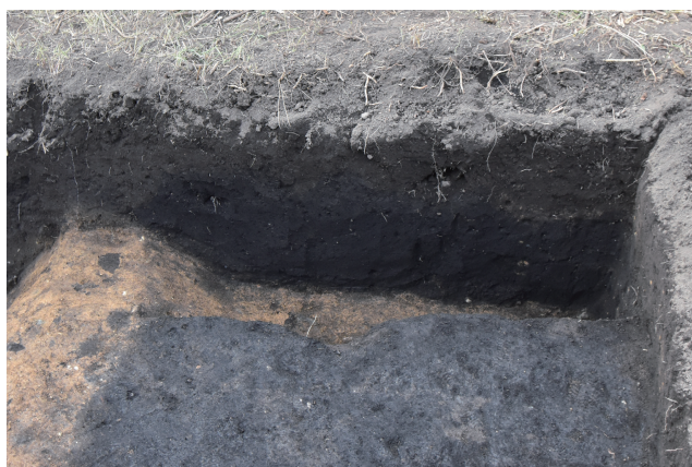
SX (SB) 375 地業サブトレンチ 26 断面 (東から)