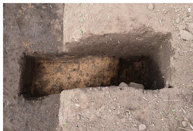
SD360 サブトレンチ 27 (東から)