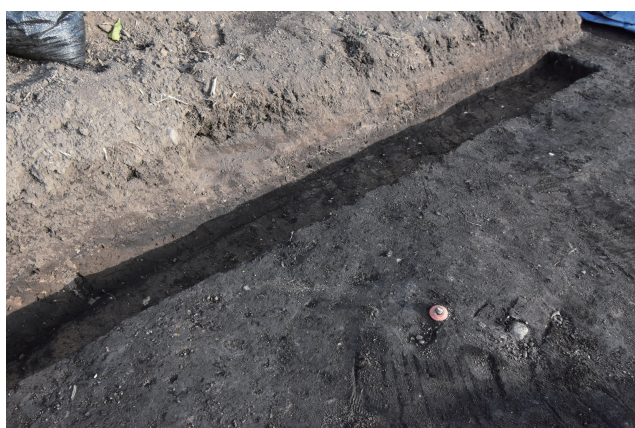
掘込地業 d サブトレンチ 18 断面 (北西から)