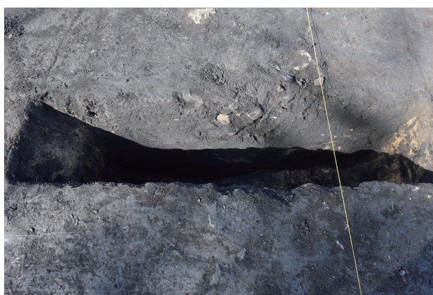
SD361 サブトレンチ 3 断面（東から）