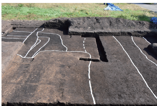
SD368・攪乱土坑 (西から)