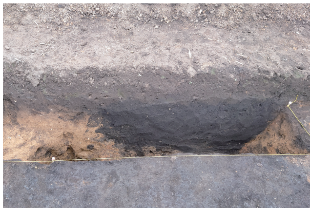
SD361 サブトレンチ 2 断面 (西から)