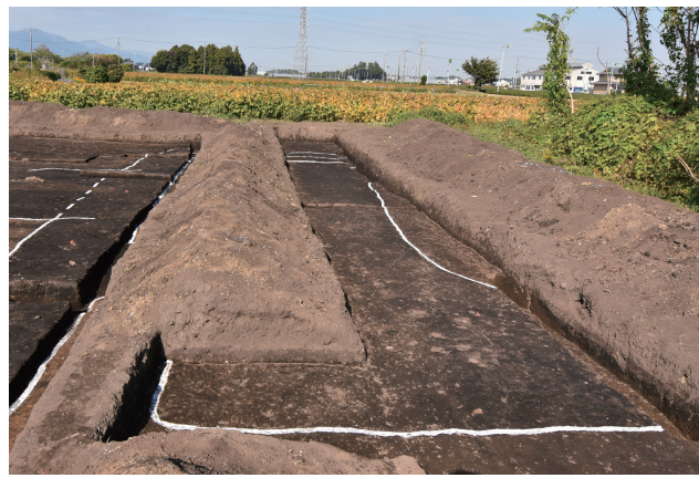
SB370 掘込地業 d（南から）