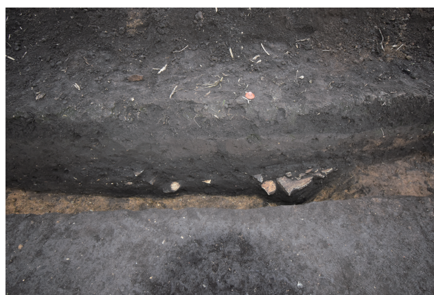
SD368 サブトレンチ 15 断面 (北東から)