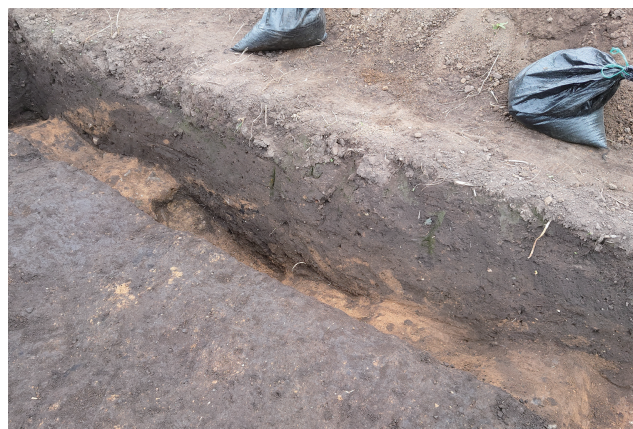
SA372 基底部サブトレンチ 2 (南西から)