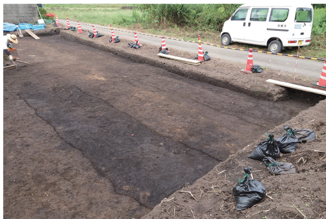
6AIA-F 区遺構検出作業（南東から）