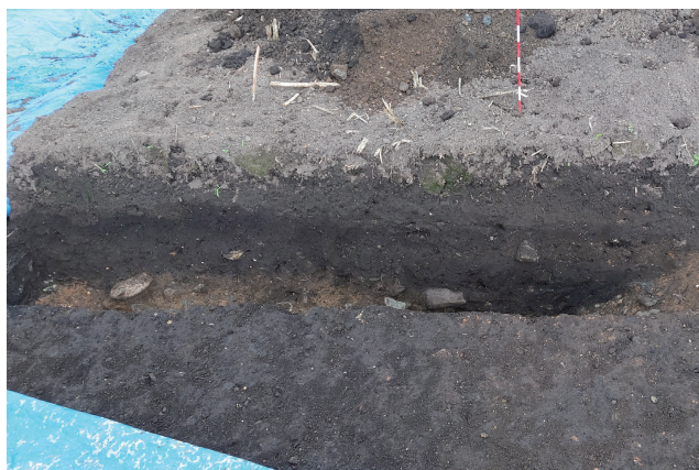
SD363 サブトレンチ 8 断面 (北東から)