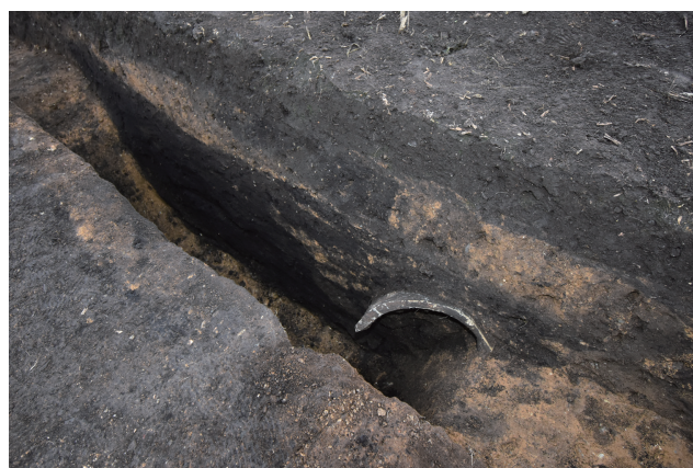
SD366 サブトレンチ 15 断面 (北東から)