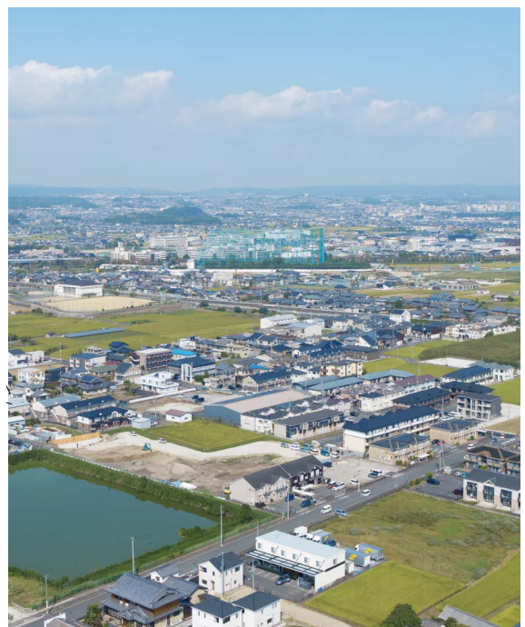
現在の六坪周辺航空写真 (南東から)