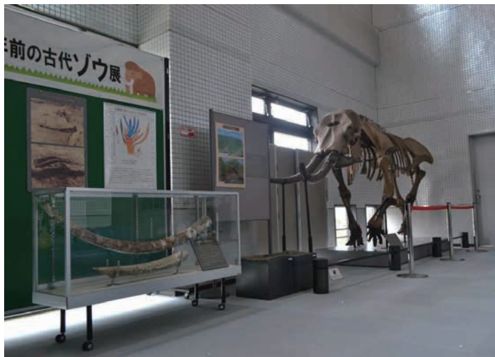
切歯化石のレプリカと骨格標本(すばるホール)

このたび文化財指定した化石2点は保存状態が比較的良好で、富田林市域で初めて発見された長鼻類化石であることに加えて、特に2号切歯の根本の部分には歯髓腔(神経の通っていたあと)が残っていて、古生物学上において貴重な資料といえます。