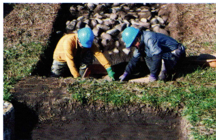
周溝の様子(東から)