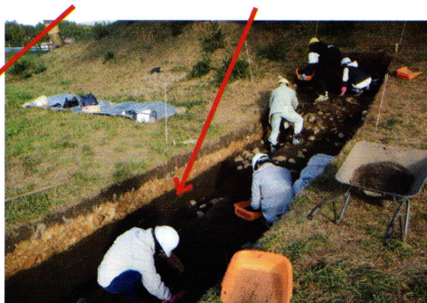
火山灰が確認された様子(南西から)