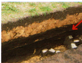
火山灰が層状に堆積しています。

周溝の土層の堆積状態を見ると、火山灰が薄く層状に堆積しています。この火山灰を調べることで埋没した年代がわかるので、今後分析する予定です。