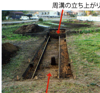
周溝の立ち上がり