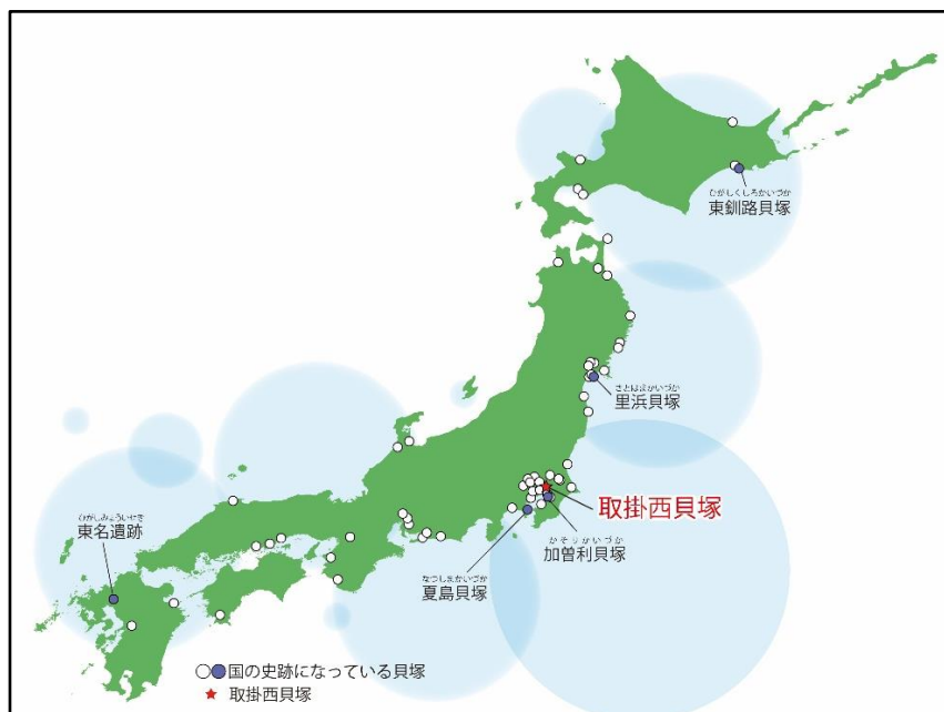
国史跡に指定された貝塚

将来の史跡整備計画の策定に際し、商業・観光と連携した史跡活用の視点も取り入れるよう検討する。