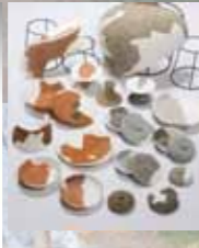
上) 大型建物等の復元イラスト 右) 出土瓦 左) 出土した土器