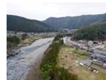
宮滝遺跡の調査の様子