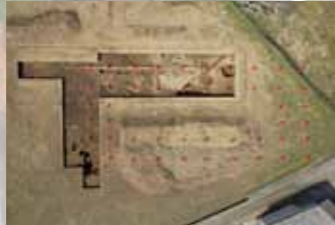
右) 大型建物の確認状況

宮滝遺跡の第41次調査と第69次調査で、東西9間(23.7m)・南北5間(9.6m)の大型建物(掘立柱建物)を検出しました。四面に廂をもつ立派な建物で、屋根の一部には瓦が葺かれていた可能性があります。奈良時代頃の宮滝遺跡の中心施設とみられます。