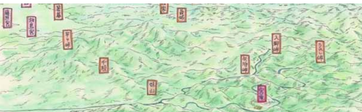
宮滝付近から北東を望む（鳥瞰図）