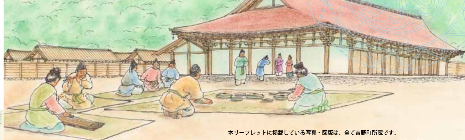
本リーフレットに掲載している写真・図版は、全て吉野町所蔵です。 （復元作画：早川和子氏 航空写真撮影：株式会社アクセス 遺物等撮影：PlusWan）