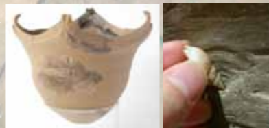
右) 宮滝式と施文方法

宮滝遺跡の第1次調査では、後に宮滝式と名付けられる縄文土器が出土しました。土器の側面に、扇形の文様がつく土器です。この”宮滝で初めて見つかったデザインの土器”は、今日、近畿の縄文時代後期を代表する土器であることが分かっています。