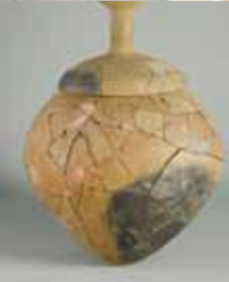
右) 宮滝出土の土器棺

宮滝遺跡では、縄文時代に続いて弥生時代にも人が住んでいたようです。今の宮滝の中央部やや東側で建物の跡が、中央部やや西側～北西部でお墓の跡が見つかっています。第1次調査では、子供用?とみられる土器の棺も見つかっています。この土器棺は近畿初の発見でした。