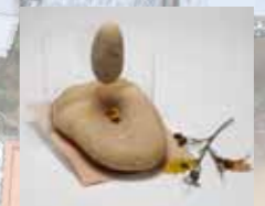
右) 縄文時代の製粉具(石皿・磨石)

およそ1万年続く縄文時代のうち、一体いつ頃から宮滝に人が住んでいたのでしょうか。第58次調査で縄文時代早期(縄文時代が始まった頃)の土器がみつき、この頃から人びとの営みがあったことが分かりました。山と川に囲まれた宮滝は、縄文時代の人びとが過ごしやすい場所だったことでしょう。