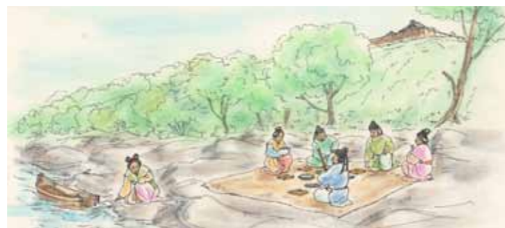
宮滝付近の川辺での宴の様子（イメージ）