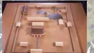
右) 吉野宮(飛鳥時代)復元模型

第43次・第44次調査で飛鳥時代の池状遺構が確認されました。その形や深さから、お庭の池(苑池)のようなものとみられます。周辺ではピッタリと向きがそろった建物が数棟が確認されており、これらは飛鳥時代・斉明天皇の吉野宮にあたると思われると考えられています。