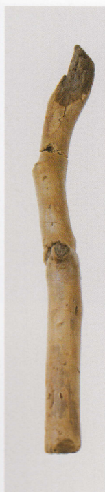
5 第 435 图 245