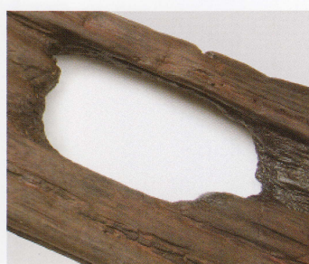
2 第 479 图 56