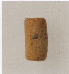
5 第 24 号墳 (第 552 图 10)