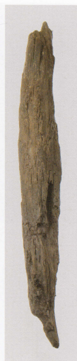
6 第 435 图 250