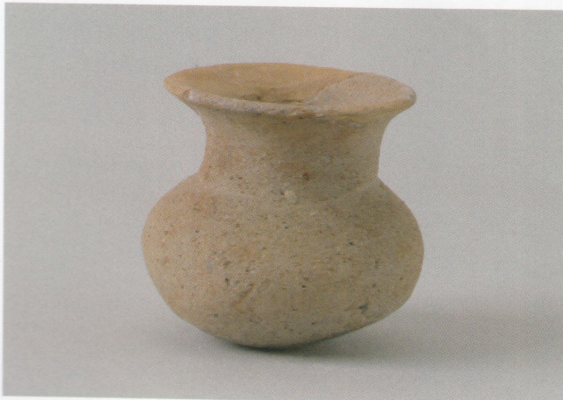
5 第14号墳 (第499图3)