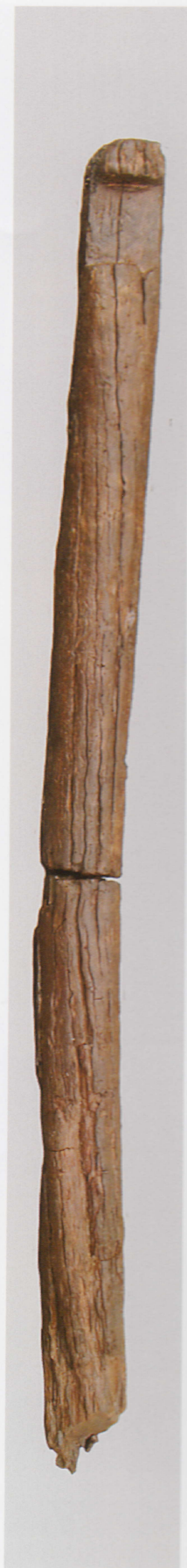
3 第 476 図 38