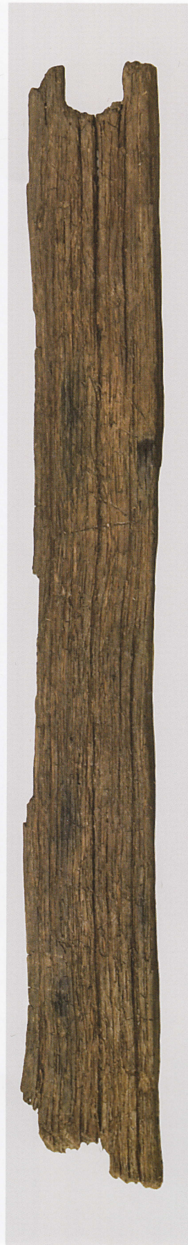
4 第 477 图 46