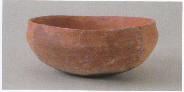
6 第15号墳 (第502图1)