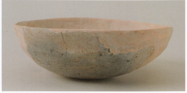
8 第 27 号墳 (第 564 图 4)