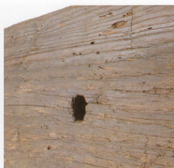
1 第 479 图 55