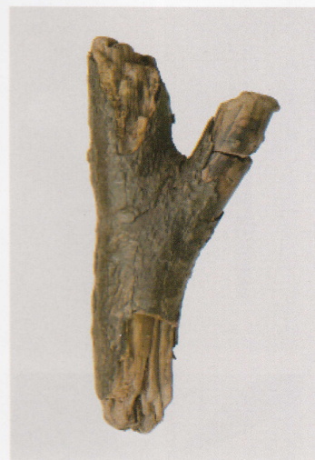
13 第 430 図 119