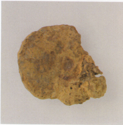
2 第13号墳 (第488图7)