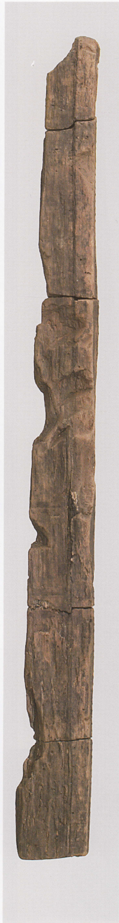
3 第 477 图 45