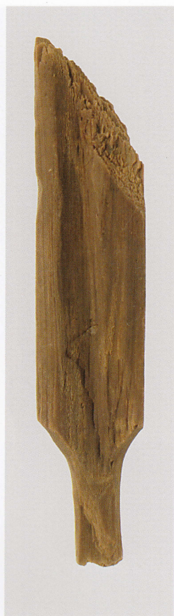
6 第 482 图 88