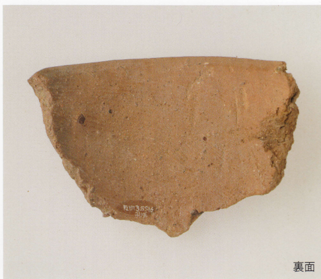
1 第16号墳 (第507图19)