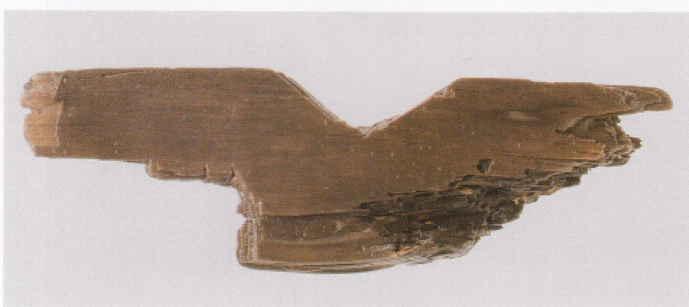
4 第 479 图 61