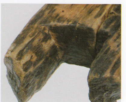
1 第 475 图 31