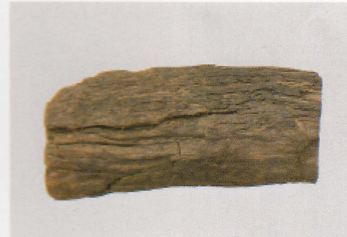
12 第 430 図 110