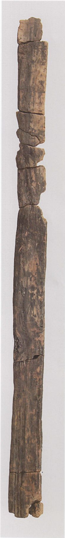
1 第 477 图 43