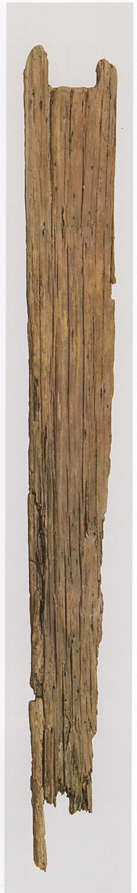
5 第 477 图 47