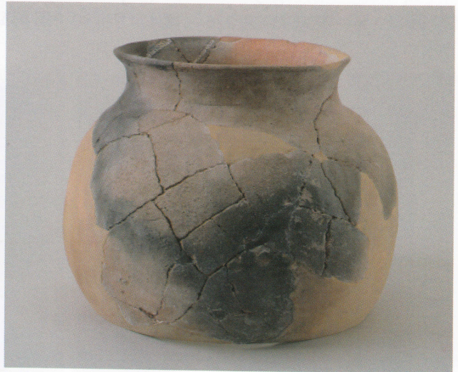
8 第16号墳 (第506图11)