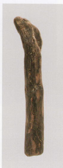
5 第 480 図 76