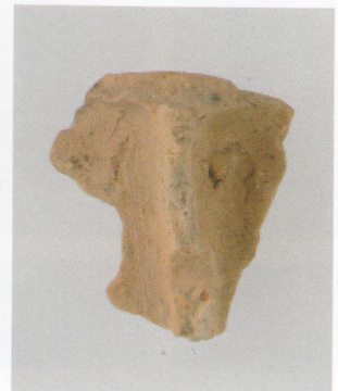
10 第17号墳 (第515图8)