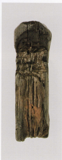
6 第 480 図 75