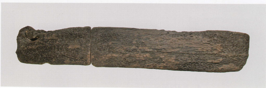
4 第 478 図 53