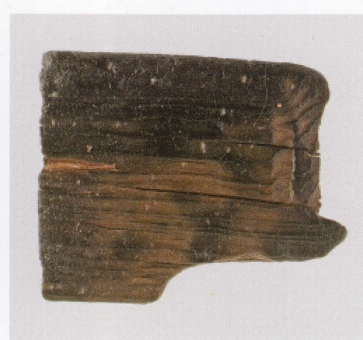
7 第 479 图 63