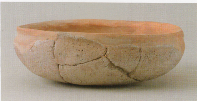
7 第 27 号墳 (第 564 图 2)