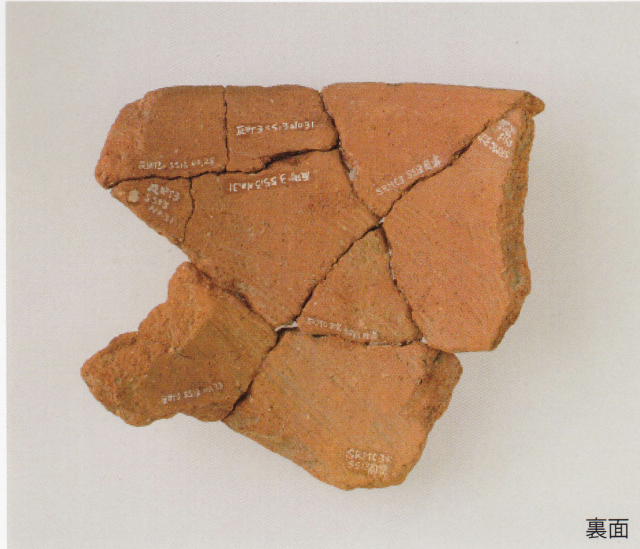
3 第 13 号墳 (第 489 图 11)