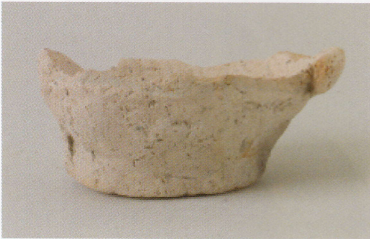
4 第 24 号墳 (第 552 图 9)