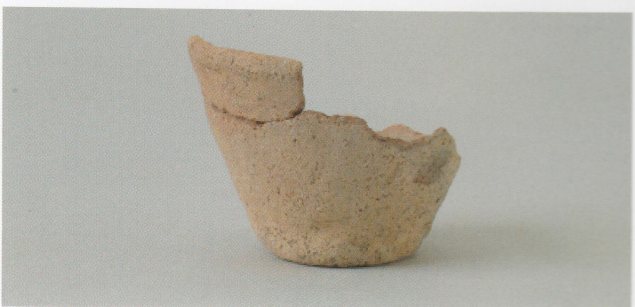
4 第19号墳 (第531图4)