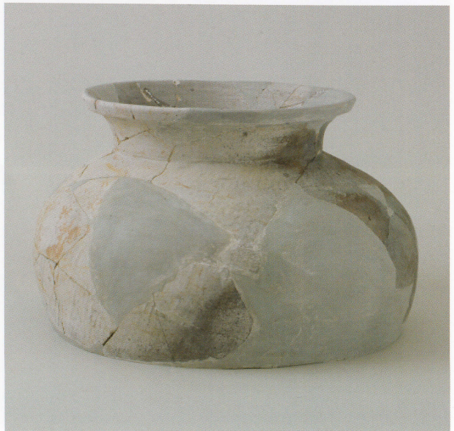
10 第 27 号墳 (第 564 图 9)