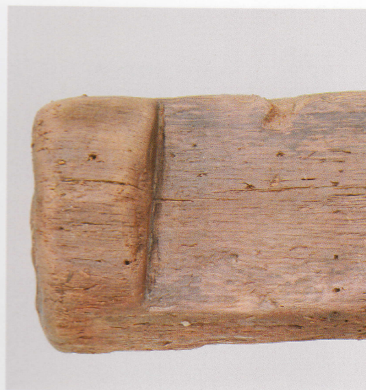
4 第 476 図 36