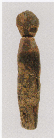
4 第 480 図 74