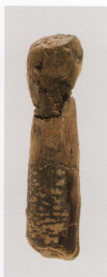
3 第 480 図 73