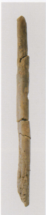
8 第 436 图 267