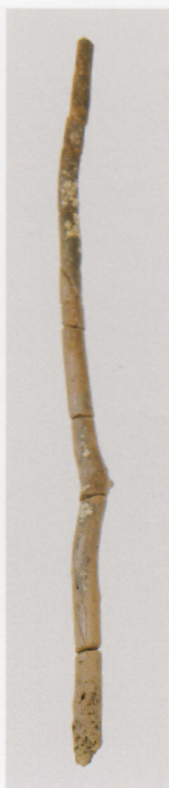
2 第 434 图 226