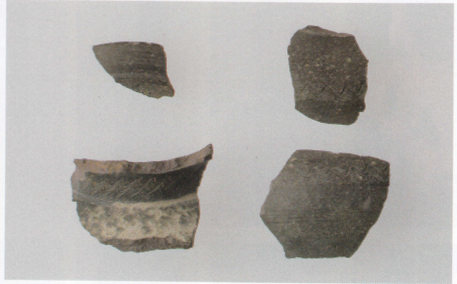
7 第16号墳 (第506图5)