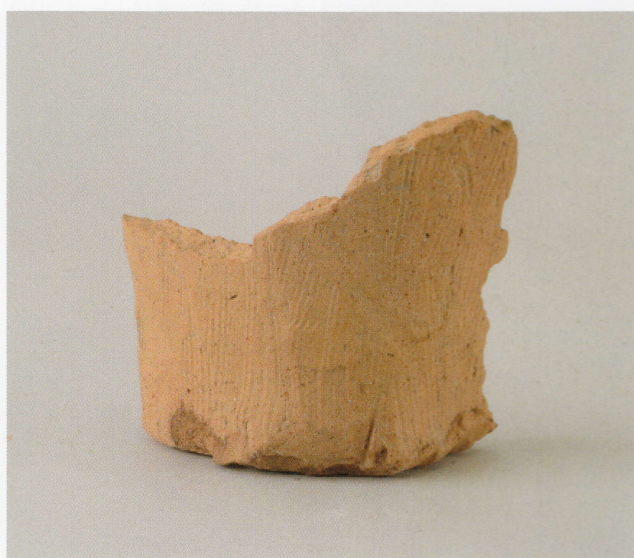
5 第13号墳 (第490图22)