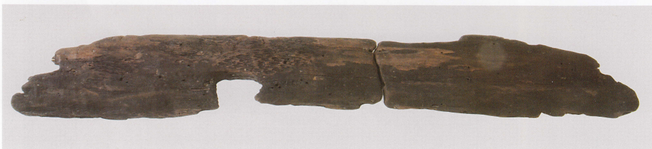
3 第 479 图 57