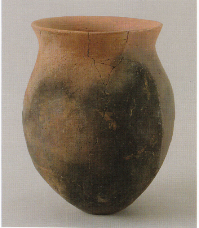
9 第 27 号墳 (第 564 图 6)