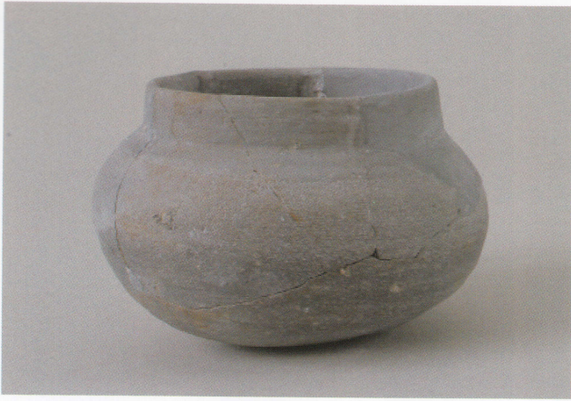
1 第13号墳 (第488图3)