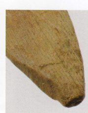
6 第 426 图 11