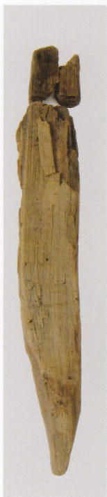
1 第 433 图 210