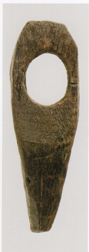
7 第 482 图 84