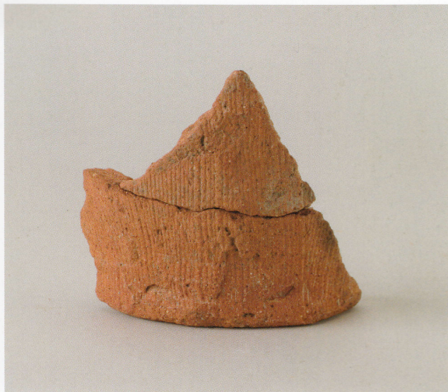
4 第13号墳 (第490图21)