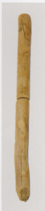
12 第 436 图 278