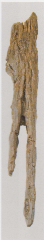
4 第 435 图 236