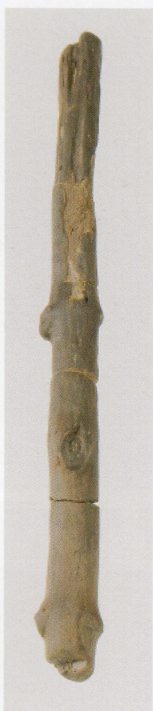
9 第 436 图 268