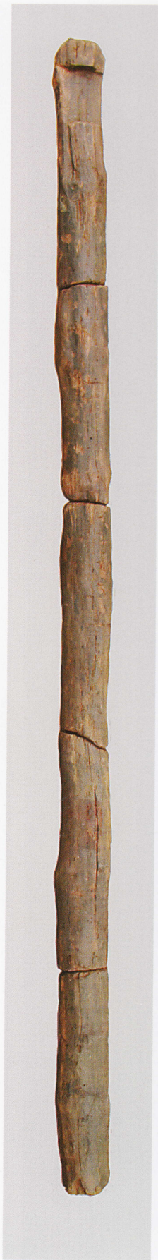
2 第 476 図 37