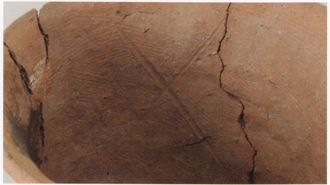
2 第16号墳(第507図17) ヘラ描き