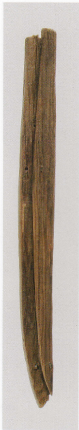
1 第 482 图 80