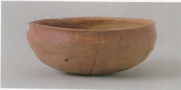
4 第14号墳 (第499图2)