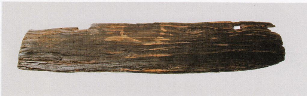
2 第 478 図 49