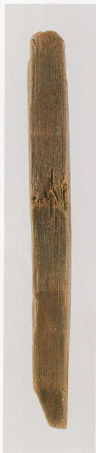
4 第 482 图 83