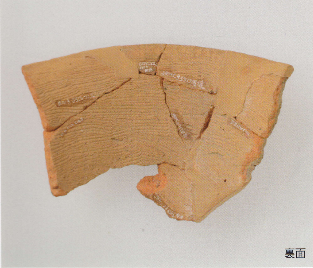
1 第 13 号墳 (第 489 图 9)