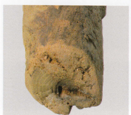
1 第 426 图 4