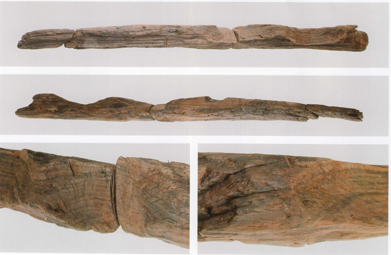
2 第 480 図 67