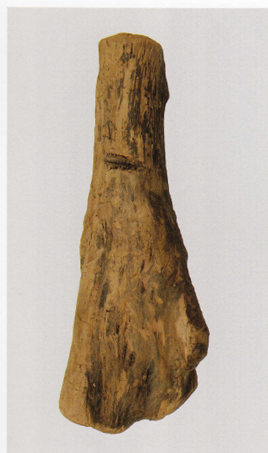
4 第 426 图 9