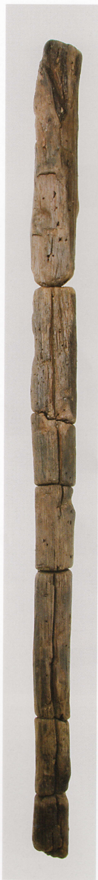
1 第 480 図 70