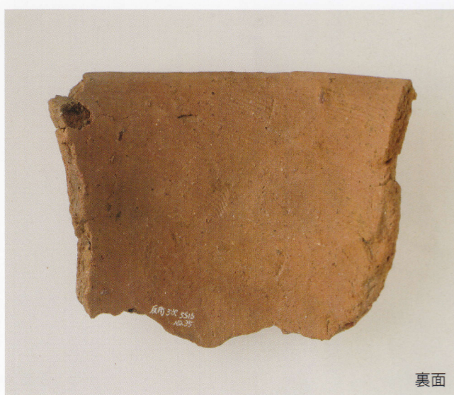
2 第16号墳 (第507图20)