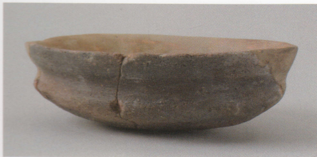
5 第20号墳 (第534图1)