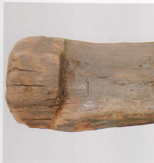
5 第 476 図 37