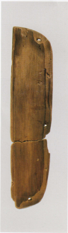
2 第 482 图 81