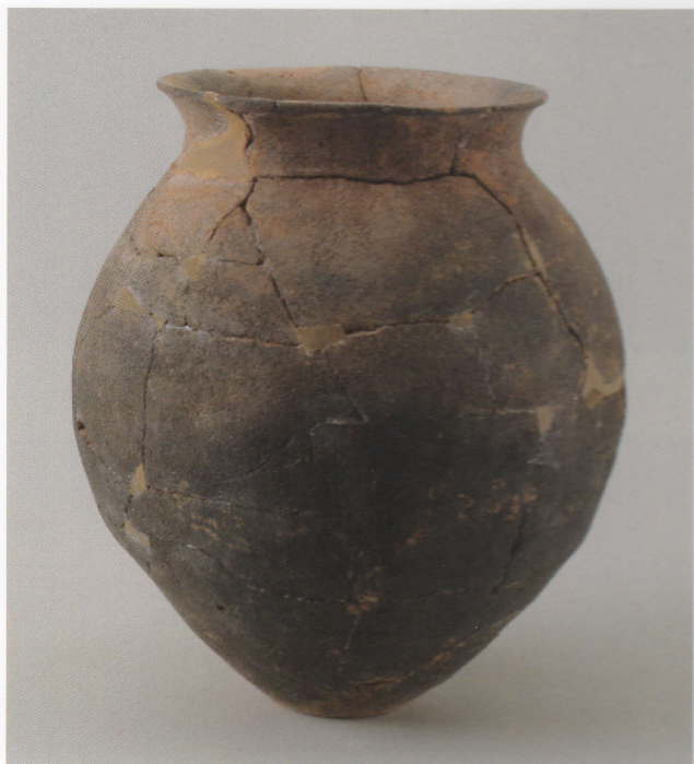
1 第17号墳 (第515图3)