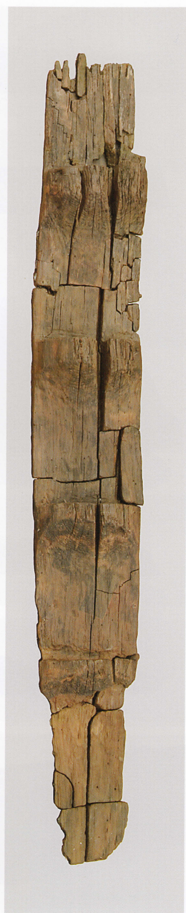
7 第 480 図 77