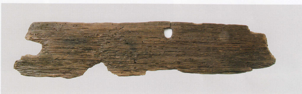
3 第 478 図 50