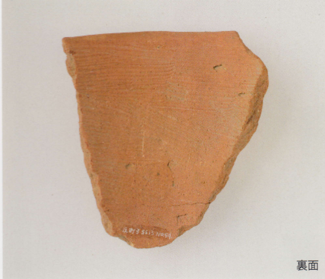
2 第 13 号墳 (第 489 图 10)