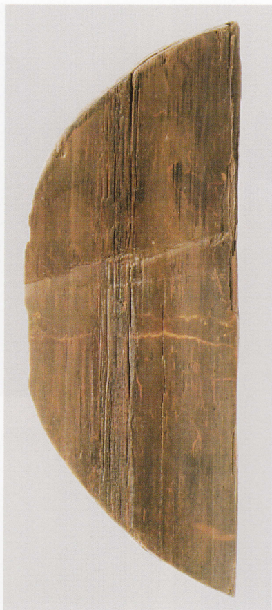
3 第 482 图 82