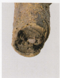
1 第 430 图 115