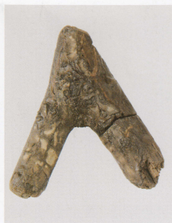
13 第 433 图 235