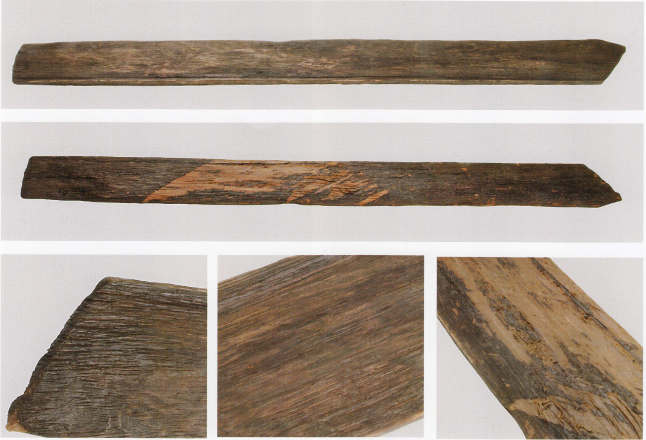
1 第 479 図 66