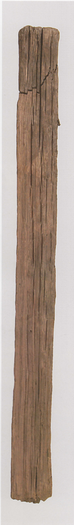
2 第 477 图 44