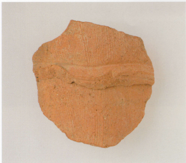
1 第13号墳 (第489图15)