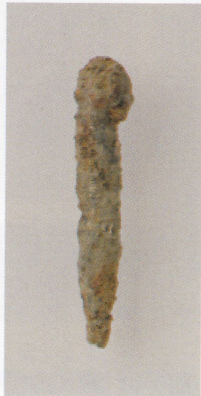
3 第13号墳 (第488图8)