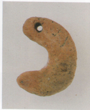
9 第16号墳 (第506图15)