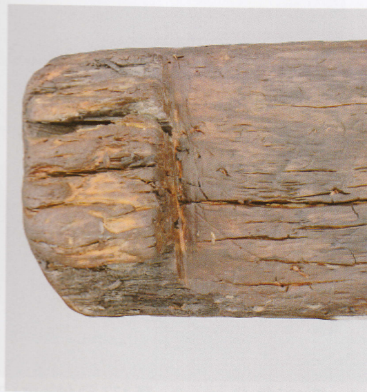
6 第 476 図 38