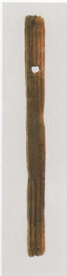
5 第 482 图 85