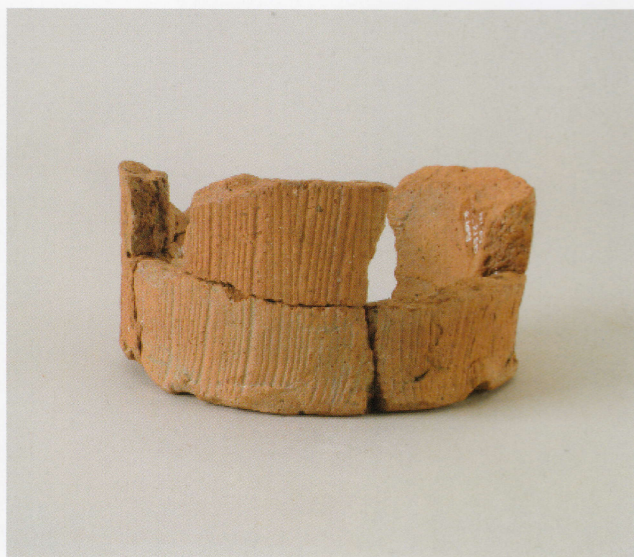
6 第13号墳 (第490图23)