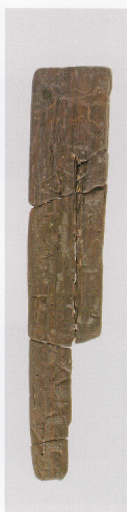
6 第 479 图 58