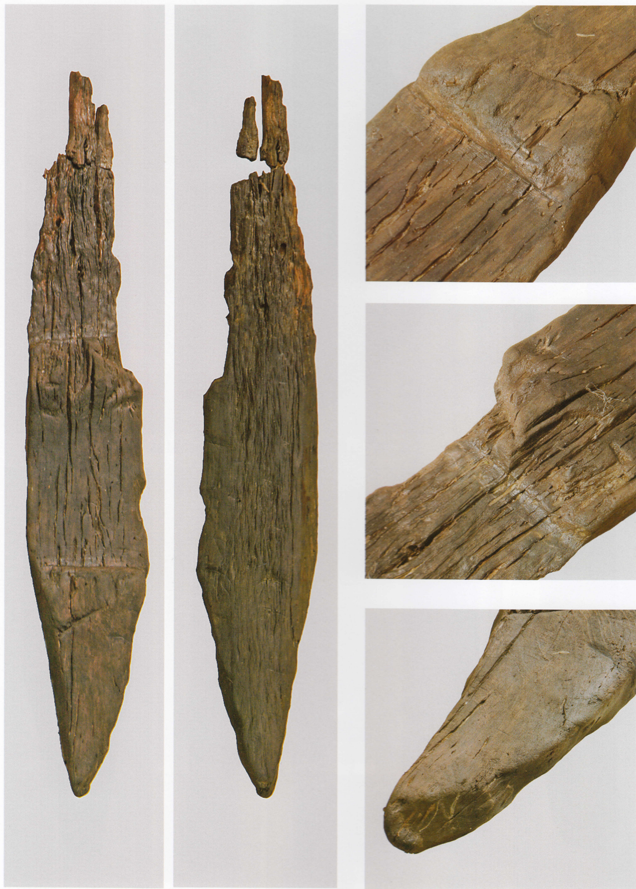
1 第 481 图 79