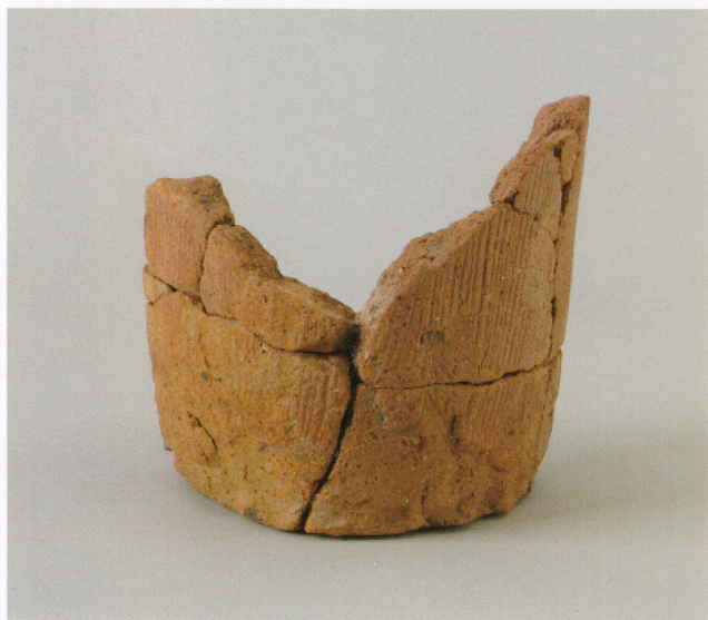
3 第13号墳 (第490图20)