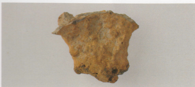
7 第22号墳 (第543图6)