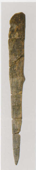
10 第 436 图 270