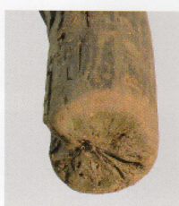
2 第 426 图 5