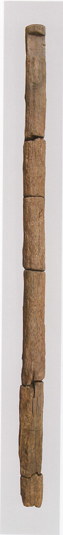
1 第 476 図 36