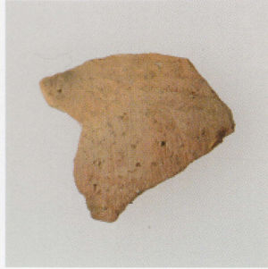
3 第 24 号墳 (第 552 图 5)