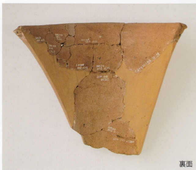
3 第16号墳 (第507图21)