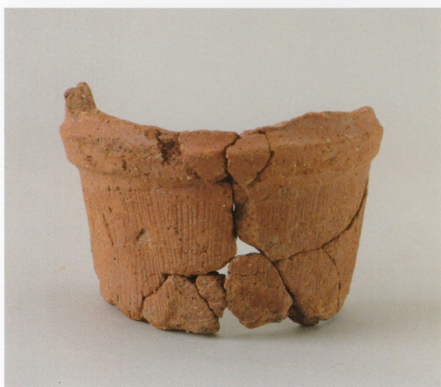
2 第13号墳 (第489图18)