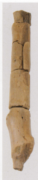
7 第 435 图 251