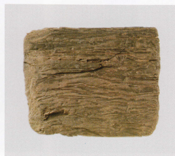
8 第 479 图 64