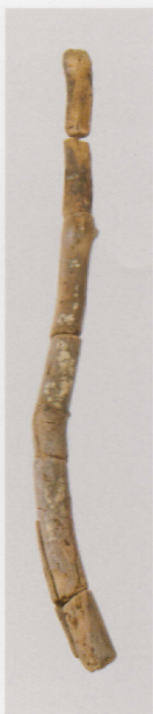
3 第 434 图 230