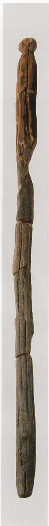
2 第 480 図 71