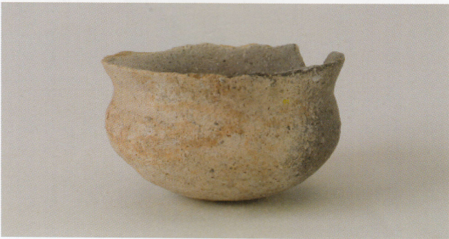
6 第 25 号墳 (第 557 图 1)