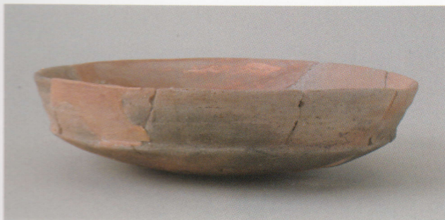
6 第21号墳 (第538图1)