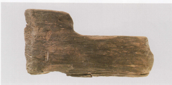
5 第 479 图 62