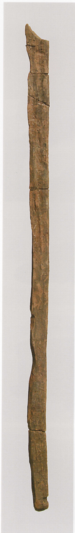
1 第 478 図 48