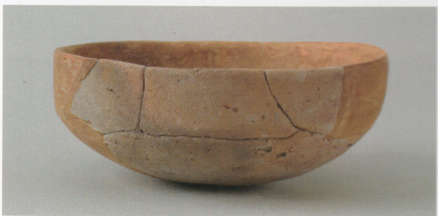
3 第19号墳 (第531图1)