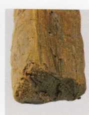
5 第 426 图 10