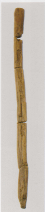
11 第 436 图 276