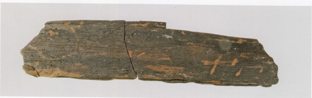
5 第 478 図 54