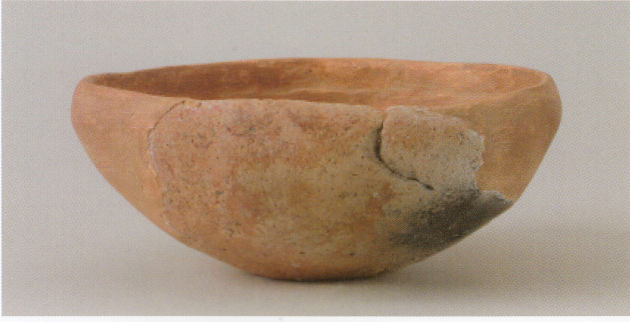
1 第 24 号墳 (第 552 图 1)