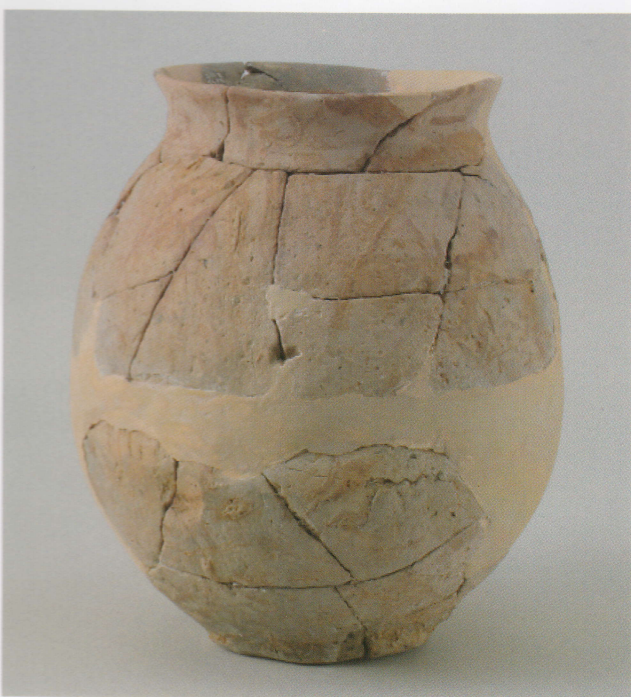
8 第23号墳 (第548图1)