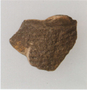
2 第 24 号墳 (第 552 图 4)