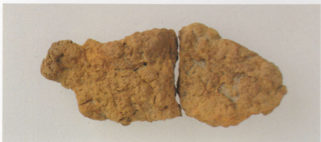
2 第17号墳 (第515图9)