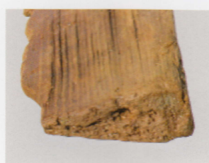
3 第 426 图 6