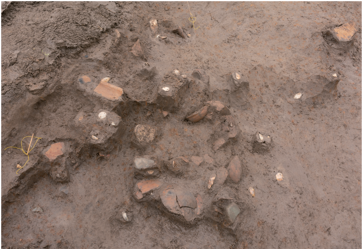
36 4号流路跡遺物集中域1出土状況（北から）