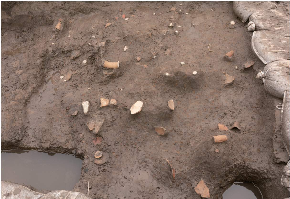
37 4号流路跡遺物集中域1出土状況（北西から）