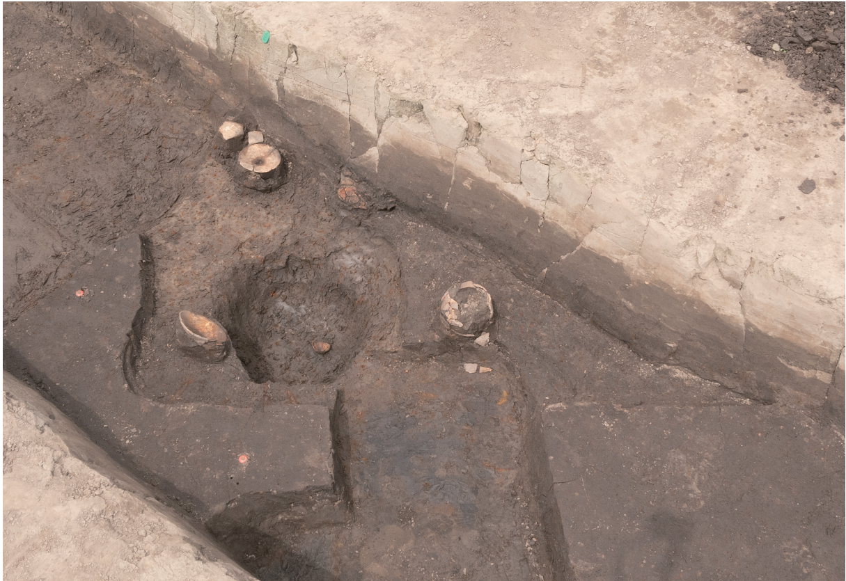
29 12号住居跡全景（南東から）