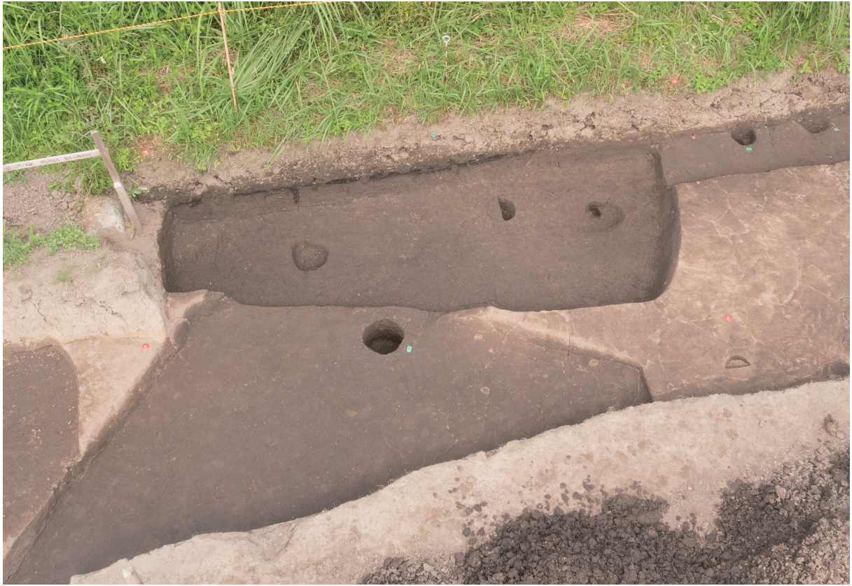
27 11号住居跡全景（西から）