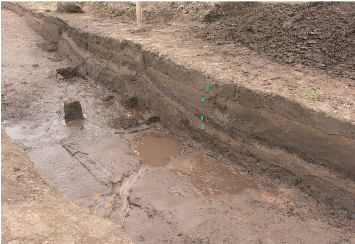
35 4号流路跡遺物集中域1 出土状況（南東から）