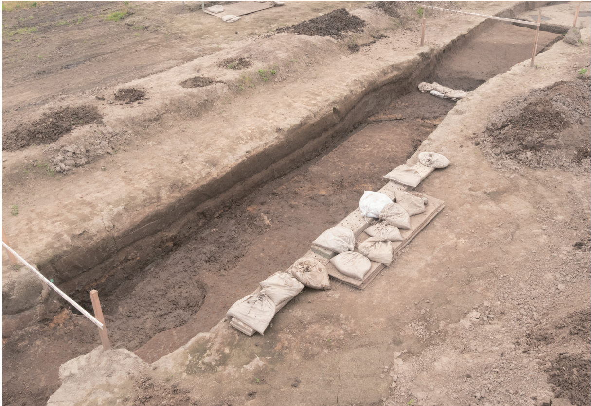
34 4号流路跡全景（南から）