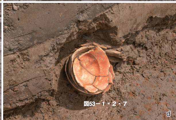
39 4号流路跡遺物集中域2細部