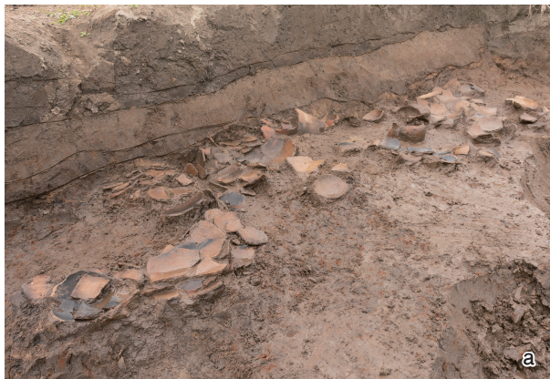
a 断面(南から) b \phi 8~10分布範囲検出状況(南から) c 遺物出土状況(北東から) d 遺物出土状況(南西から)