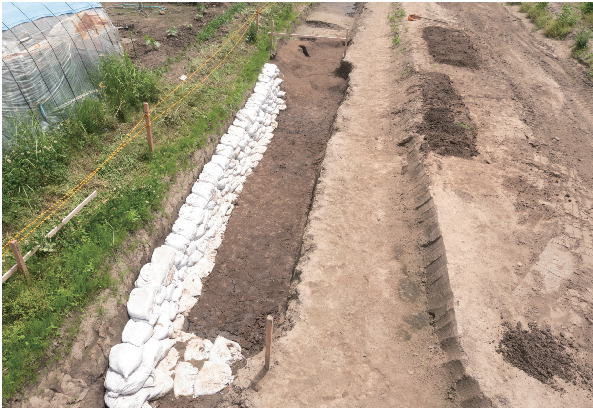
32 1号流路跡全景(西から)

a 検出(南西から) b 全景(南西から) c 土師器出土状況(南西から) d 全景(南西から)