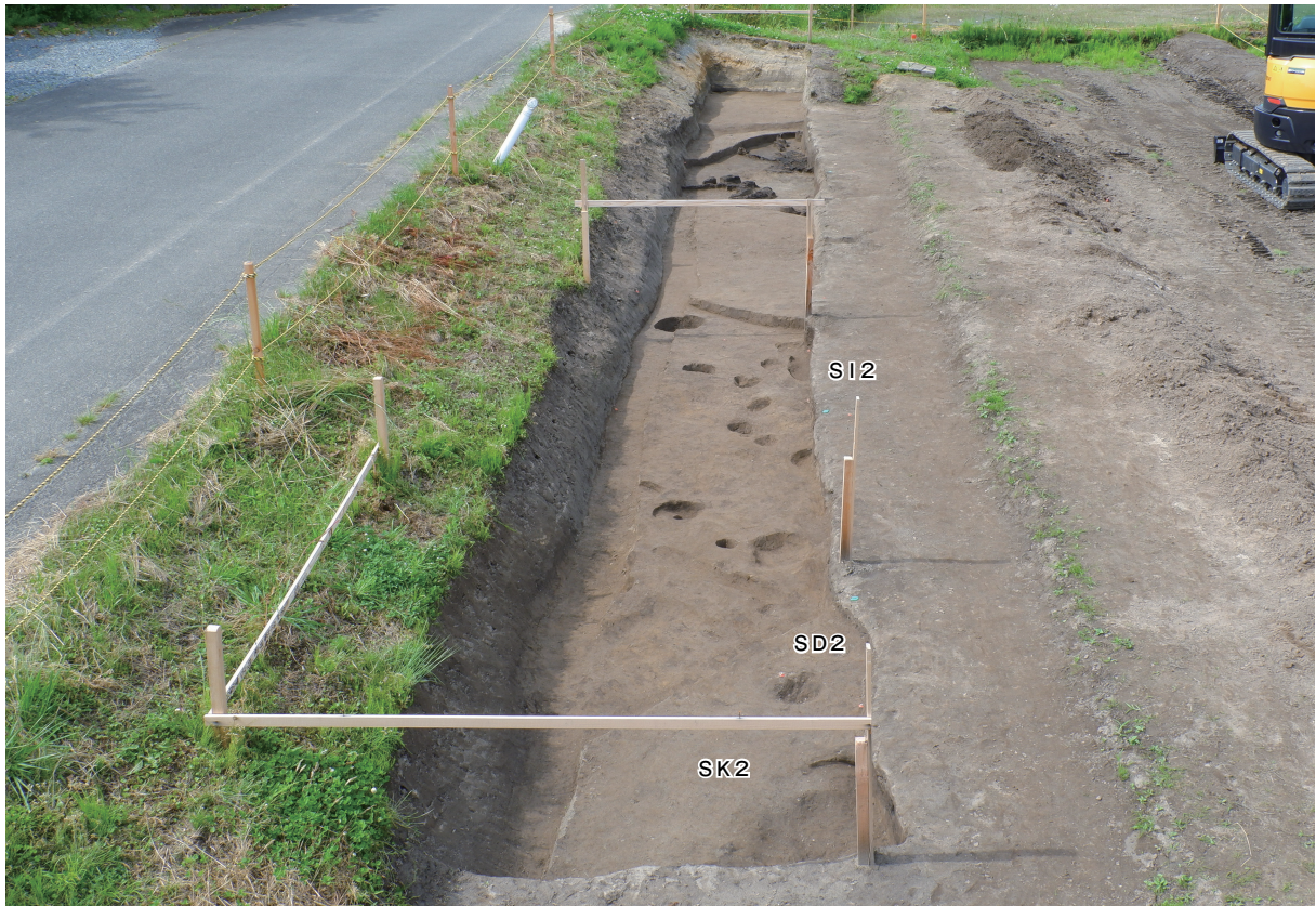
9 2号住居跡・2号土坑・2号溝跡全景（南から）