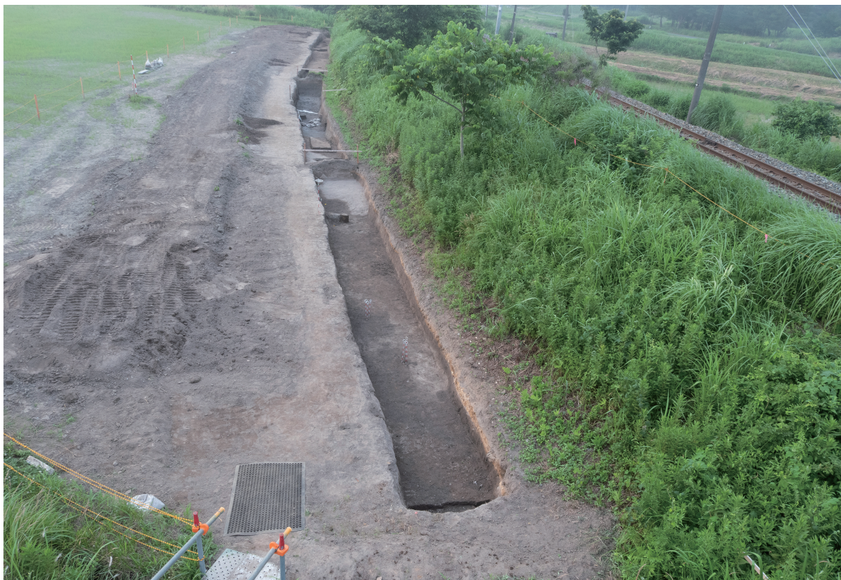
2 115号水路調査区 近景（南から）