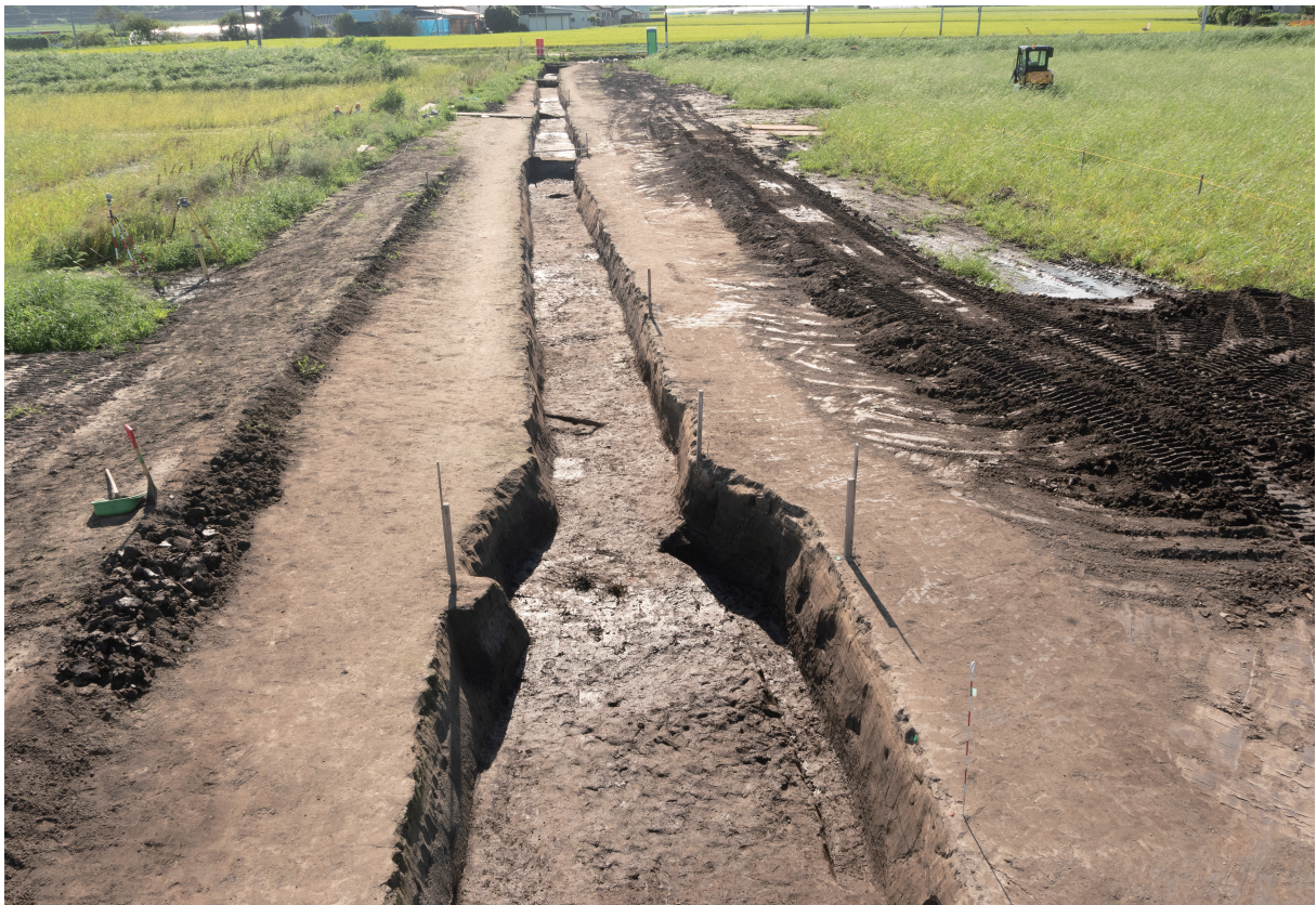
4 116号水路調査区 近景（北東から）