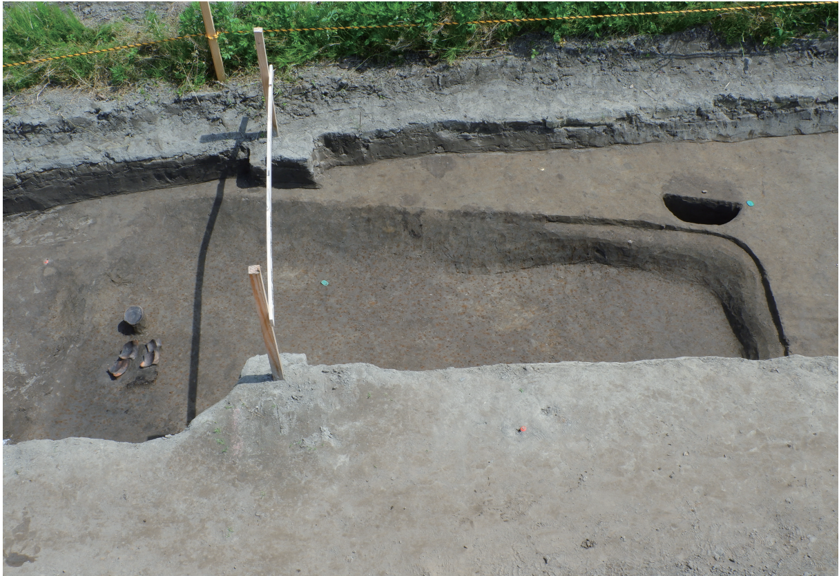
13 4号住居跡全景（南西から）