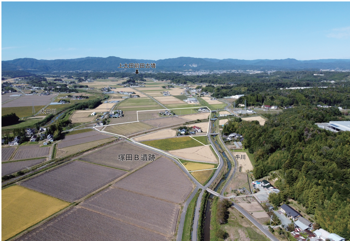
1 遺跡 遠景（東から）