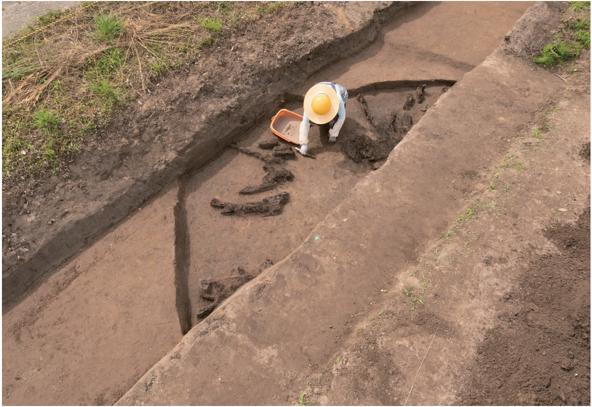
7 1号住居跡全景（南東から）