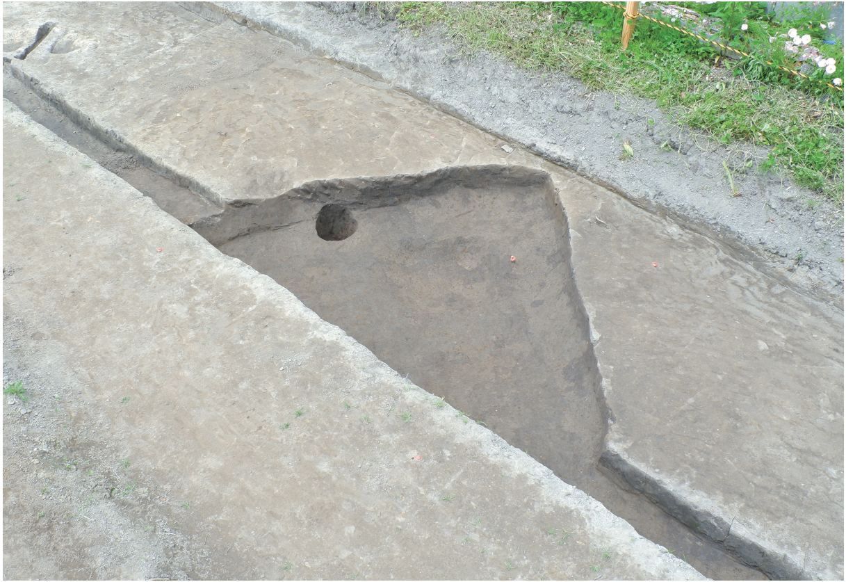
11 3号住居跡全景（南東から）