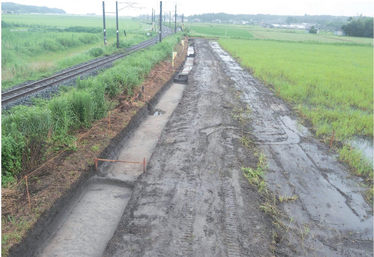
3 115号水路調査区 近景（北から）