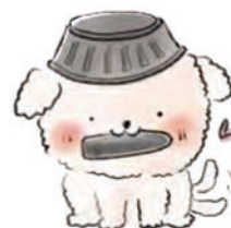
えんめん けん 犬

えんめん けん 円面碗のようせい。 さるまるに何かを書いてほしい時は墨をくわえてやってくる。ほかにもいろんな「けん」種がいるらしい…。