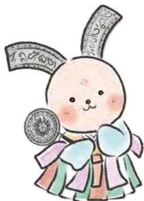
かわらびつとちゃん

かわらのようせい。 「がれき」とよばれがちな出土遺物をこよなく愛し、宮都のキュートさを伝えることをライフワークとしている。 チャームポイントは、頭の「のきひらがわら」と、「のきまるがわら」のさしば（うちわ）。