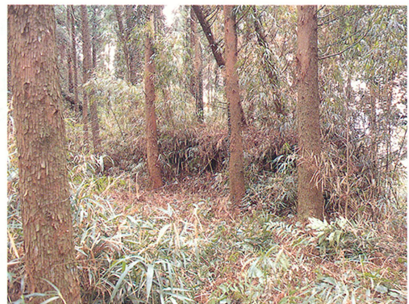
高原城址内の土塁