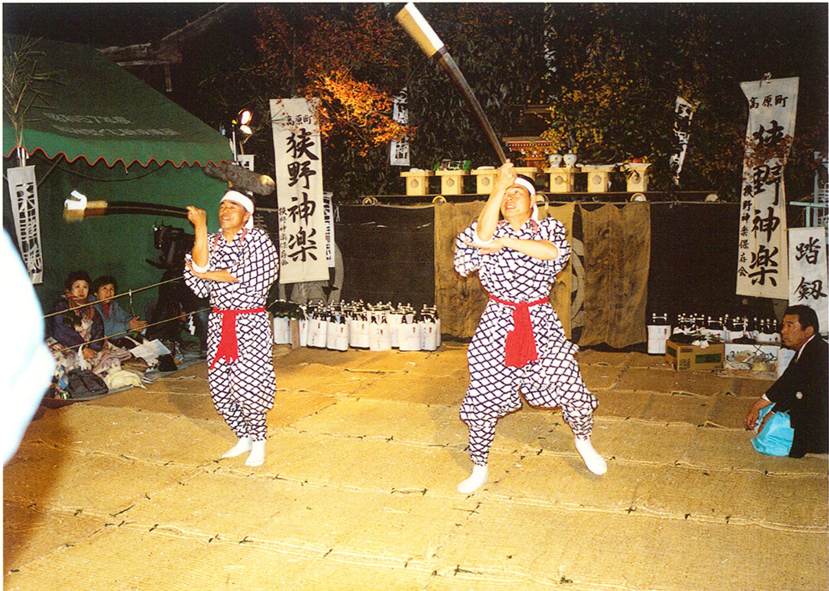
狭野神楽(昭和61年4月1日町無形文化財指定)のうち『踏剣』