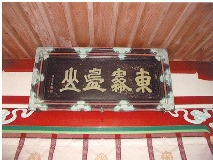
島津光久奉納の扁額

狭野神社と同じく、霧島山の噴火の被害を度々受け、天永3年(1112)、文暦元年(1234)の噴火により焼失・廃絶しましたが、文明18年(1486)、島津忠昌により再興され、以後、島津氏の庇護を受けて繁栄しました。特に島津吉貴以後には、藩主家督相続の際に白銀が献納された他、寛文6年(1666)に島津光久により額が奉納されました。