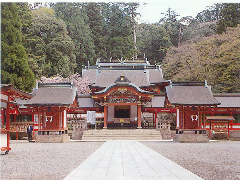
霧島神宮(鹿児島県霧島町)