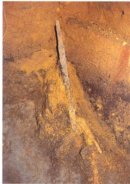
日守97-1号墓蛇行剣検出状況