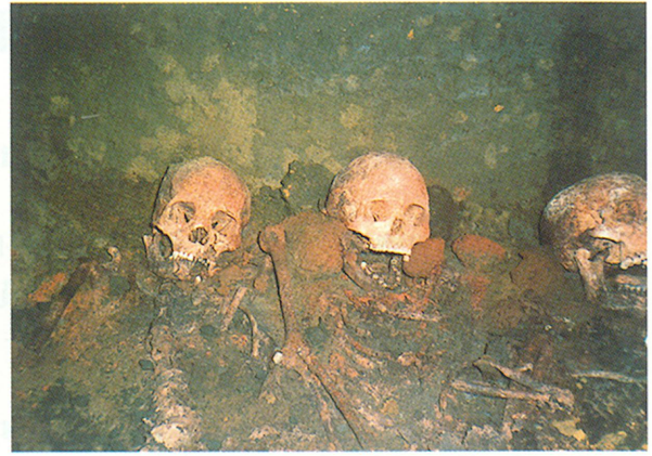
立切3号墓玄室内人骨