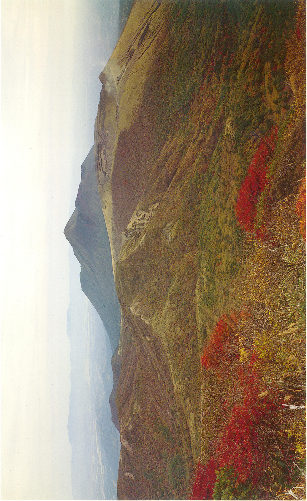
韓国岳より霧島連山を望む