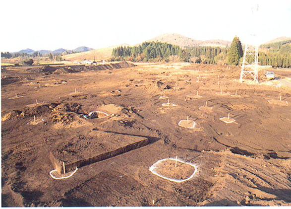
立切地下式横穴群の竪坑分布状況