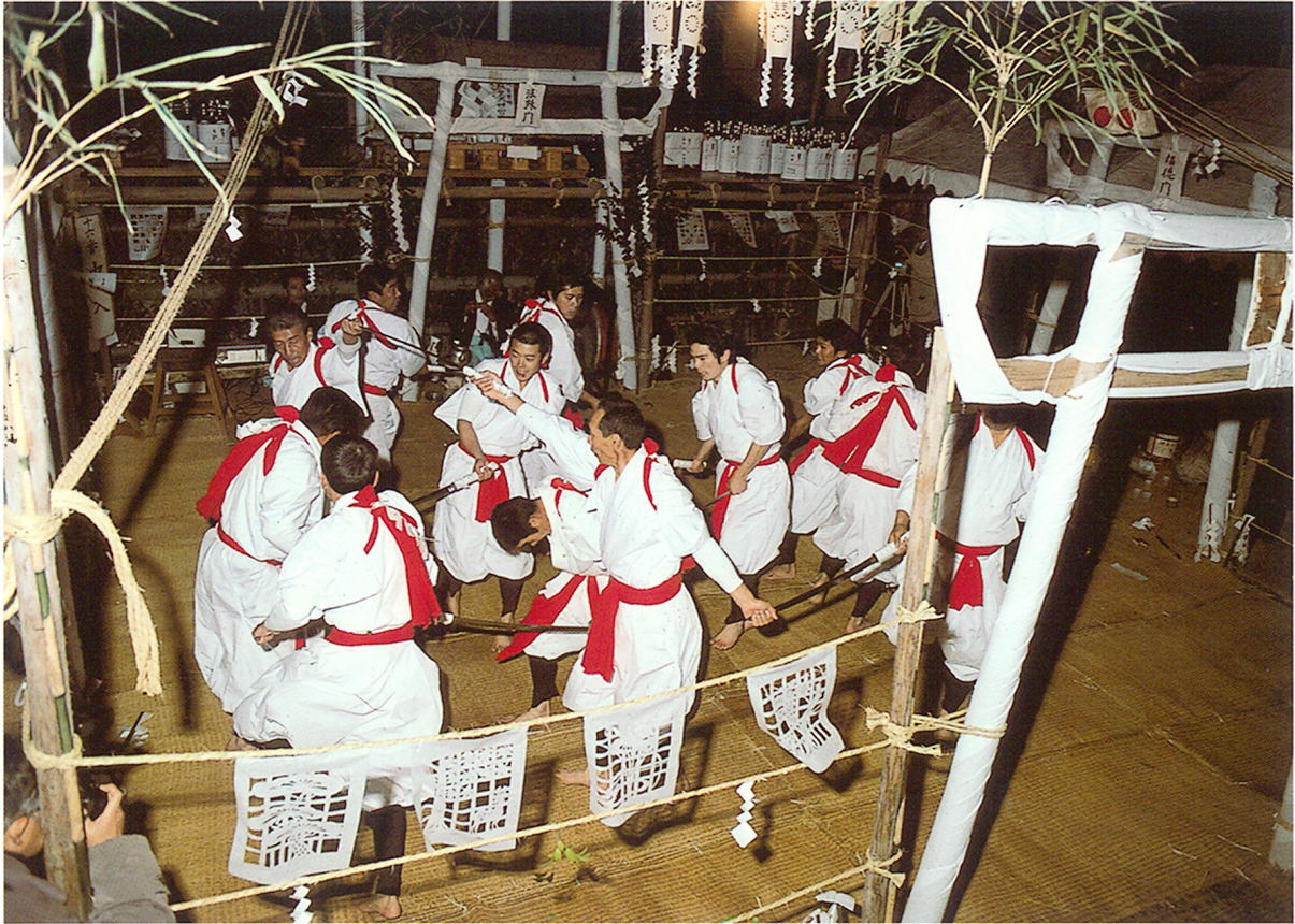
祓川神楽(昭和49年12月4日国選択無形民俗文化財指定)のうち『十二人剣』