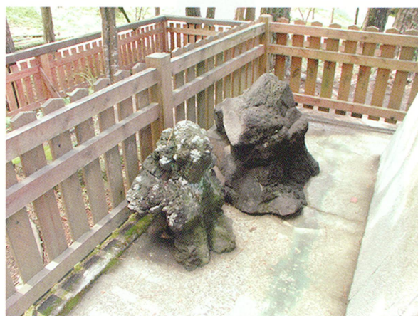
皇子原神社裏の産場石