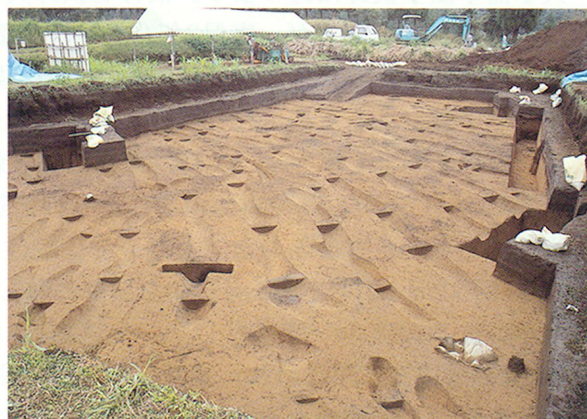
梡粉山遺跡畠遺構出土状況