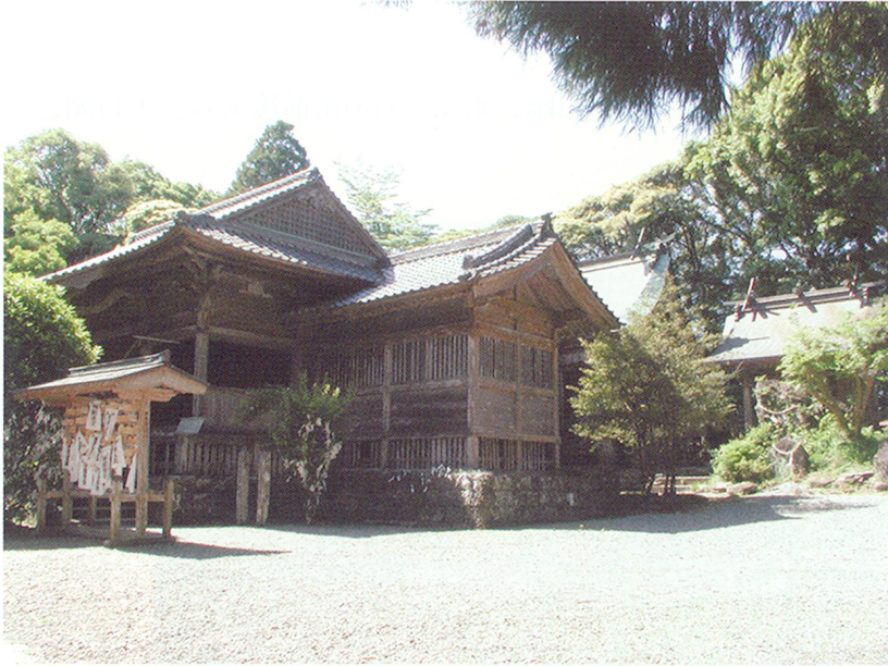
東霧島神社(高崎町)