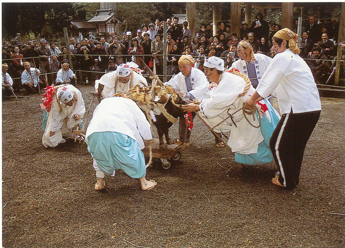
苗代田祭(平成11年9月27日宮崎県無形民俗文化財指定)