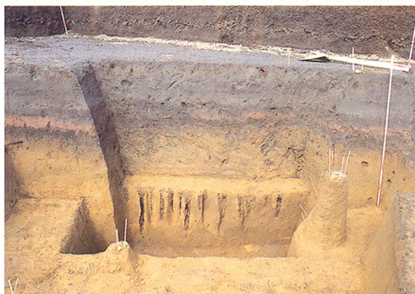
梡粉山遺跡陥し穴出土状況

大字蒲牟田字狭野にありました。狭野地区の圃場整備に伴い、平成11年11月から平成12年12月にかけて、町教委により発掘調査が行われました。調査区からは、平安時代初頭の畠跡、鎌倉時代初頭から15世紀頃にかけての狩猟用の陥し穴が検出された他、縄文土器や石器・平安時代の土師器が大量に出土しました。出土した縄文土器は2万点にのぼり、四国や瀬戸内地方の文化の影響が見られます。又、中世の陥し穴については、これまで発見例がなく、全国初とも言えます。