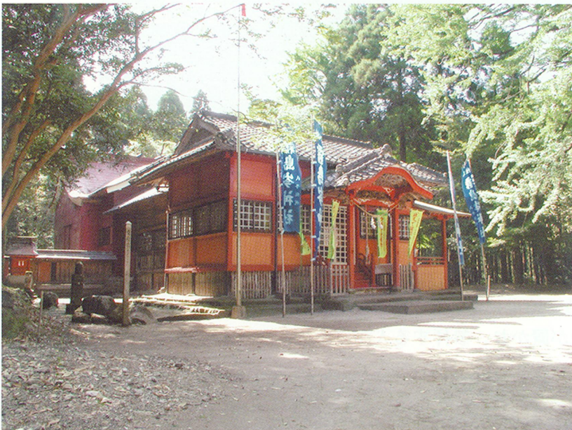
夷守・霧島岑神社(小林市)