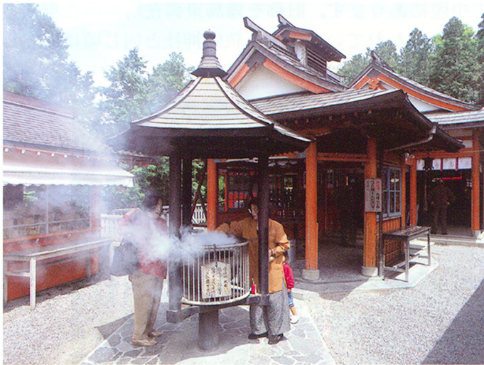
霞 神 社

ました。元々は馬頭観音が祀られており、霞ヶ丘にある大きな岩が御神体とされていました。江戸時代の辺りから、丘の岩に五色の蛇が住むと云われ、この蛇は霧島六所権現の使いとされたことから、社殿こそありませんでしたが、霧島六所権現に参拝する人は、必ずここにも参詣したと云われています。