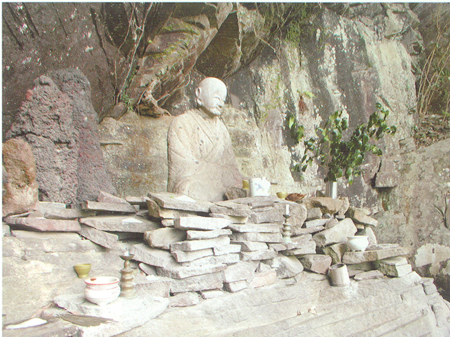
護摩壇港の性空上人石像

『三国名勝図會』によると、御池のまわりには、松・軀瀬・皇子・劔崎・刈茅・柳・護摩壇、7つの港があり、そのうち、護摩壇港には、性空上人が護摩を焚いたという伝承があります。現在そこには、性空上人の石像が置かれ、参拝する人が跡を絶ちません。