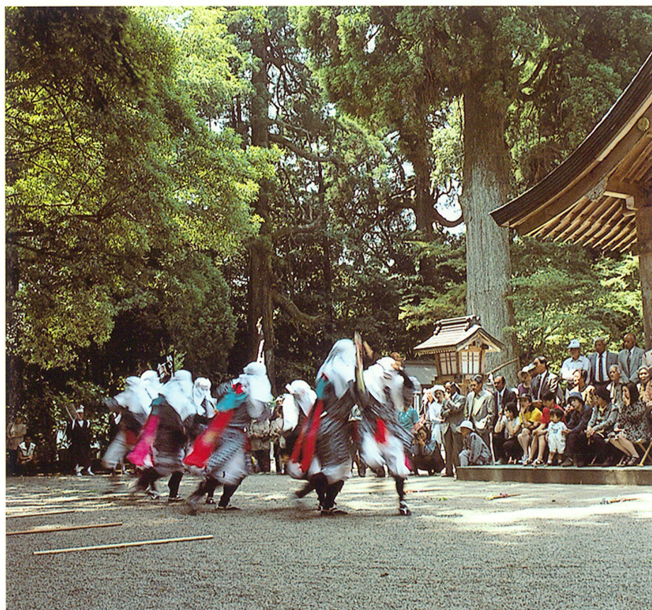
狭野の棒踊り(平成10年4月1日町無形文化財指定)