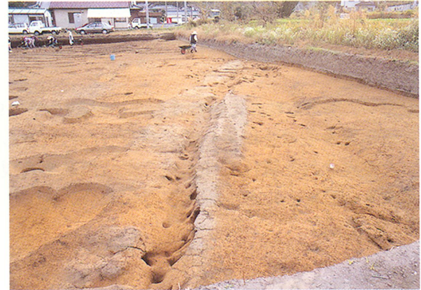
川除遺跡道路遺構

調査区からは、平安時代初期の畝の跡や中世の道路跡が検出された他、縄文時代前期から平安時代の土器や石器・鉄鏃の他、「洪武通宝」 (註8) という貨幣も発見されました。この調査により、この辺りでも縄文時代前期から集落があったことや、平安時代初頭のほぼ同時期に町域で一斉に開拓が行われたことが判明しました。