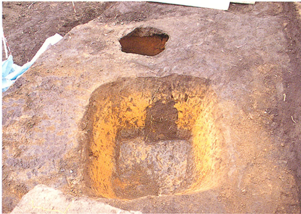
日守97-1号墓検出状況