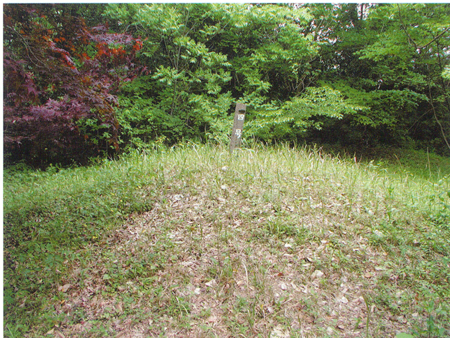
高原古墳(写真は4号墳)

皇子原公園の敷地内にあります。指定されているのは6基ですが、周囲には、同じような土饅頭が多く見られます。早くに指定されたため、墓の時期及び内部の状態は不明ですが、諸県特有の古墳形態である地下式横穴墓と思われます。