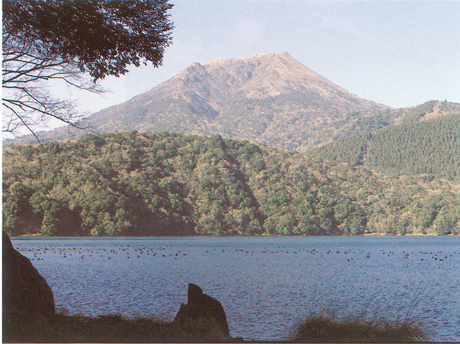
皇子港より御池・高千穂峰を望む

御池は、霧島山系の中でも最大の火口湖で、周囲4.3km、水深が100m前後あり、火口湖として日本で最も深いとされています。