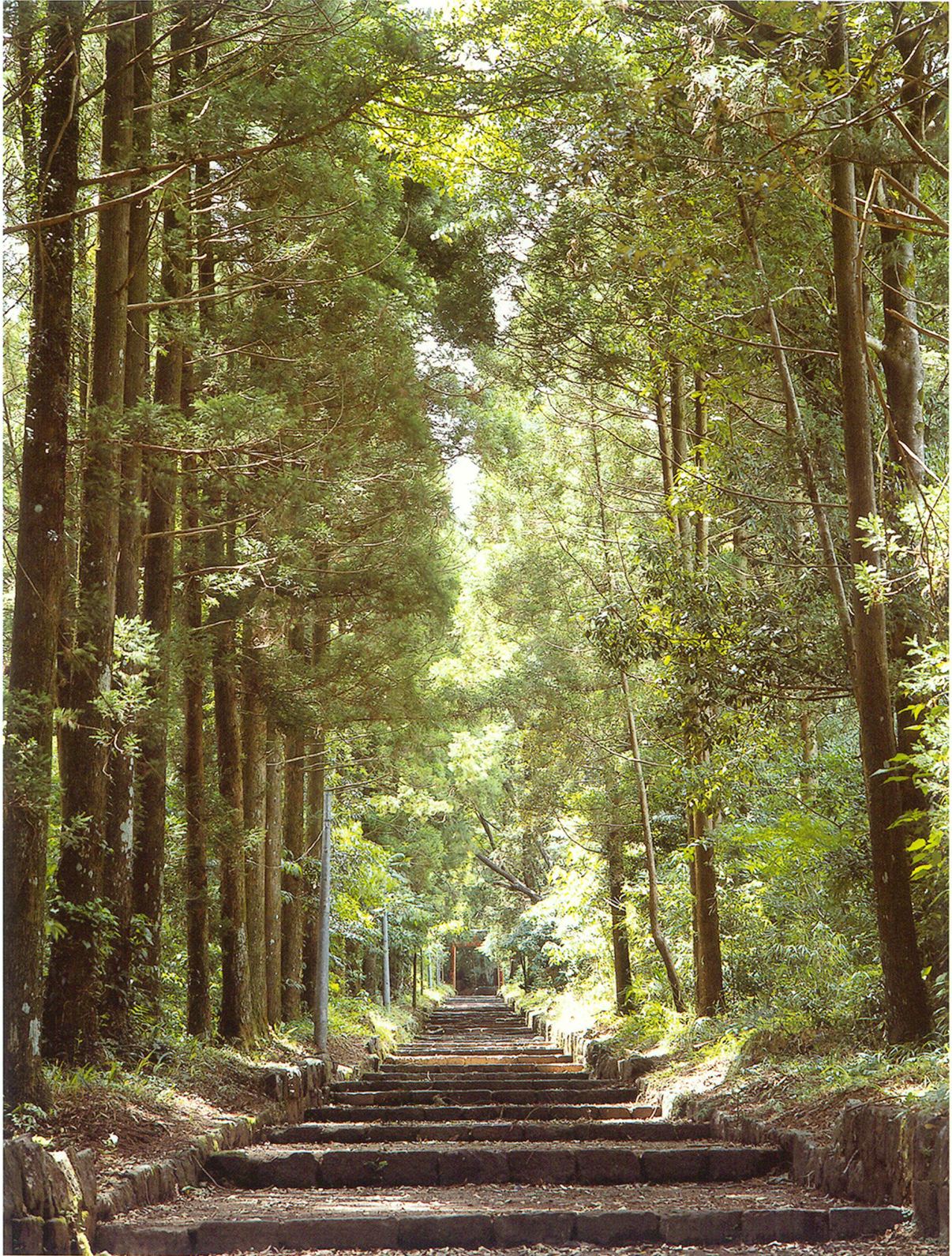
狭野神社杉並木(大正13年12月9日国天然記念物指定)