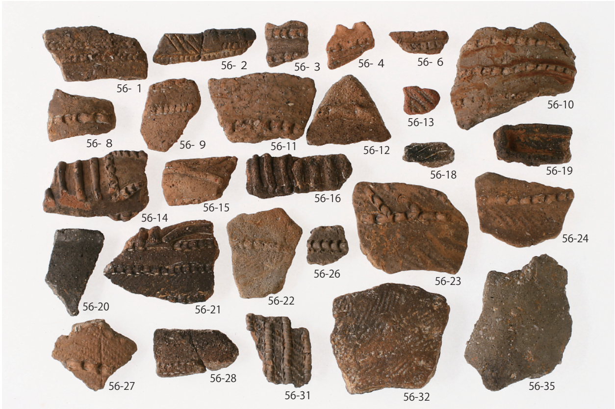
1 グリッド出土遺物 (1) (第 56 図 1 ~ 4 · 6 · 8 ~ 16 · 18 ~ 24 · 26 ~ 28 · 31 · 32 · 35)