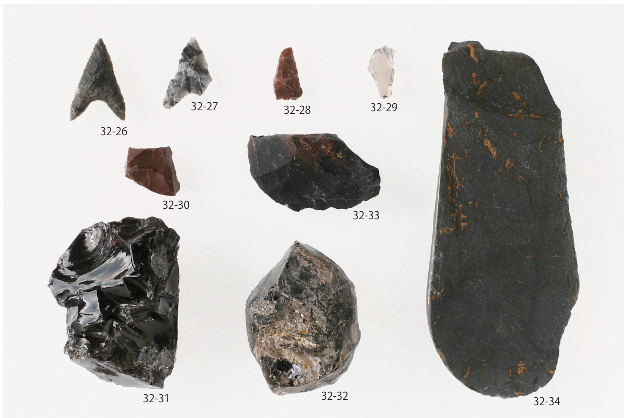
2 第8号住居跡出土遺物(2)(第32図26~34)