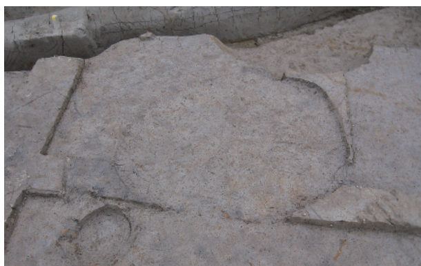
3 第 20 号土壙