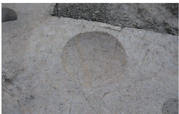
8 第 32 号土壤