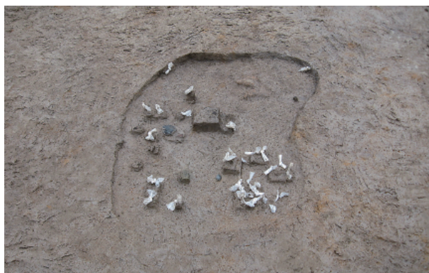
8 第 1 号性格不明遺構遺物出土狀況