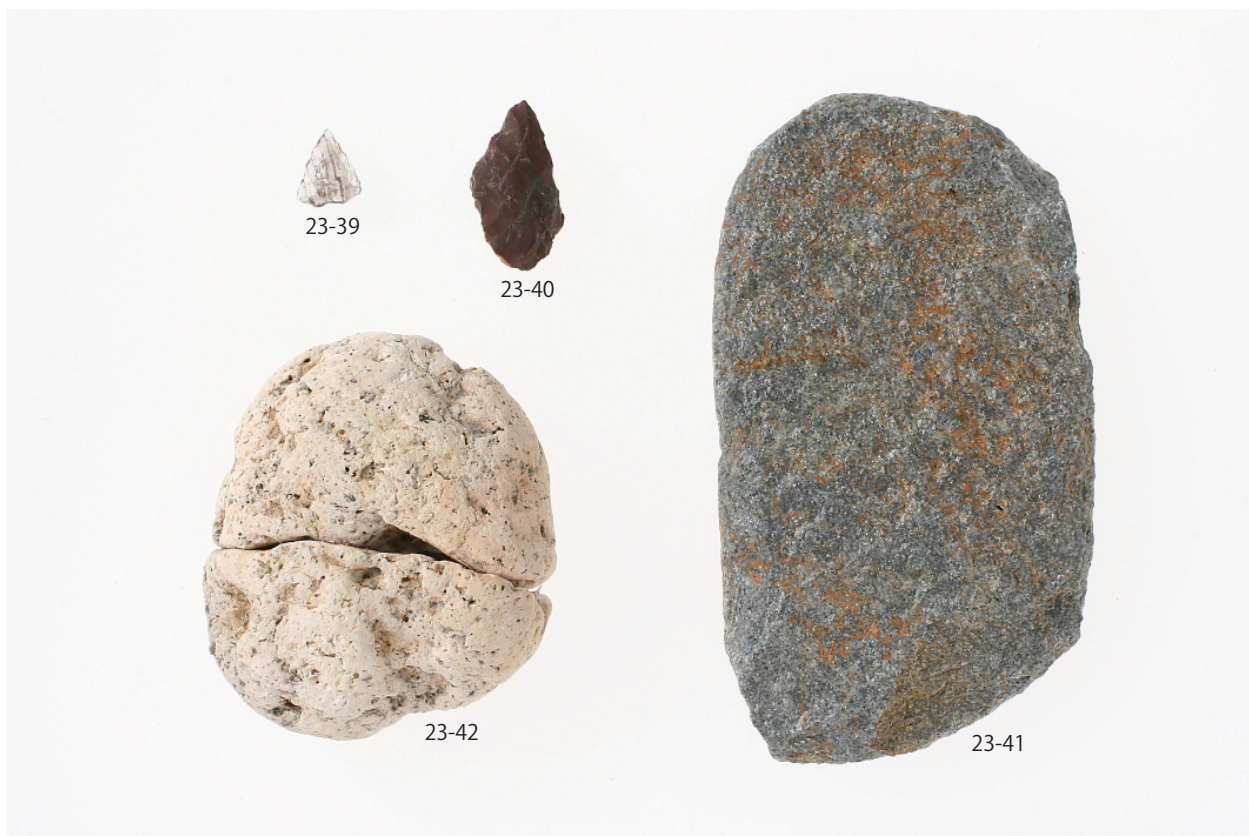
1 第5号住居跡出土遺物(2)(第23图)