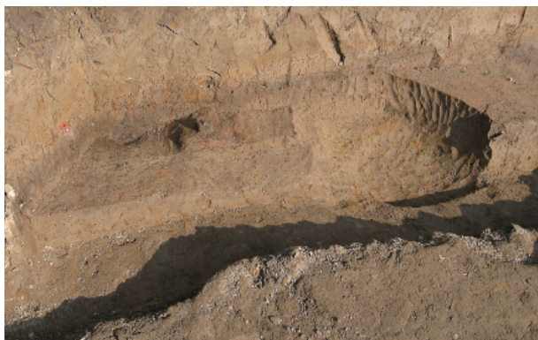
1 第 38·39 号土壤