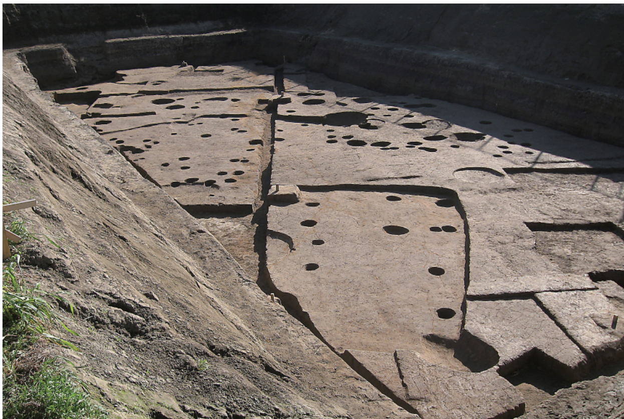
1 調査区全景（西から）