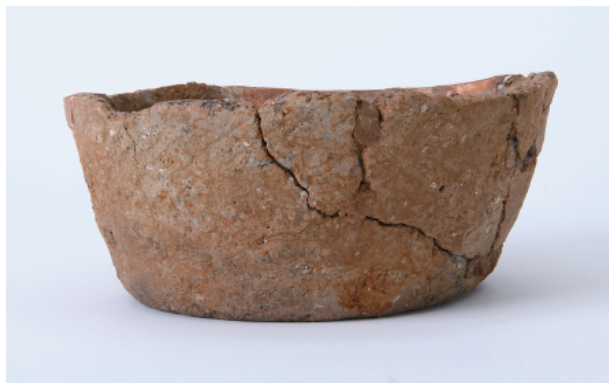
3 第17号土壙出土遺物 (第38图2)