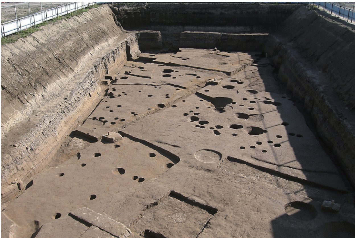
1 調査区全景（北から）