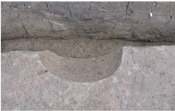
2 第 12 号土壤