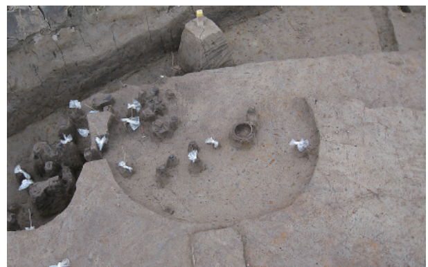
8 第 17 号土壤遺物出土狀況