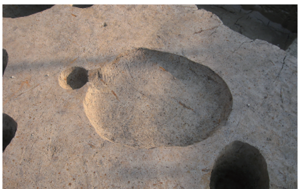
7 第 31 号土壤