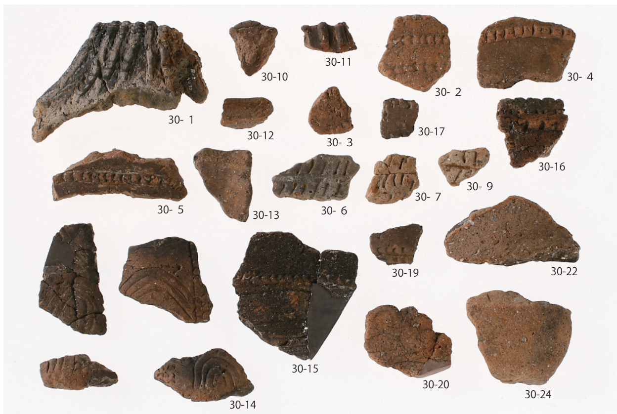
1 第8号住居跡出土遺物(1)(第30図1~7・9~17・19・20・22・24)