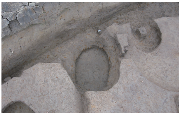
1 第 18 号土壙