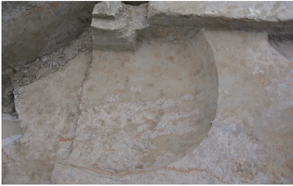
1 第 10 号土壤