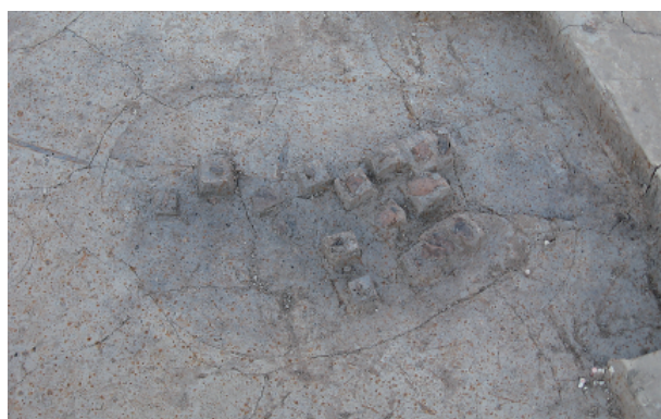
8 第 22 号土壙遺物出土狀況