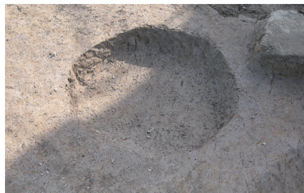
4 第 42 号土壤