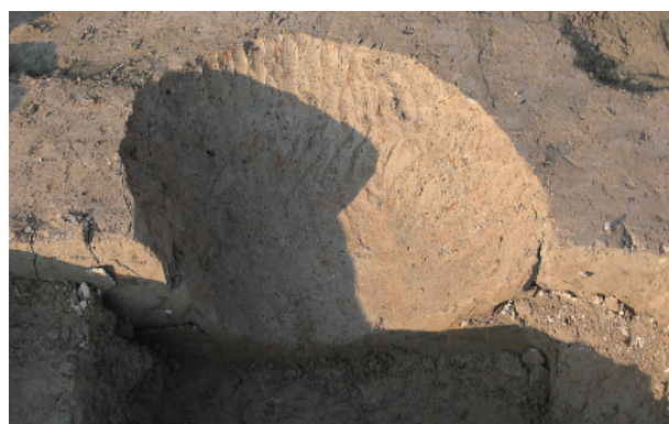
2 第 40 号土壤