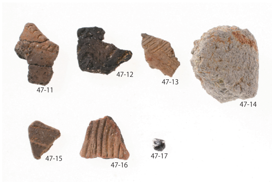
1 第 41・46 号土壙出土遺物 (第 47 図 11 ~ 17)