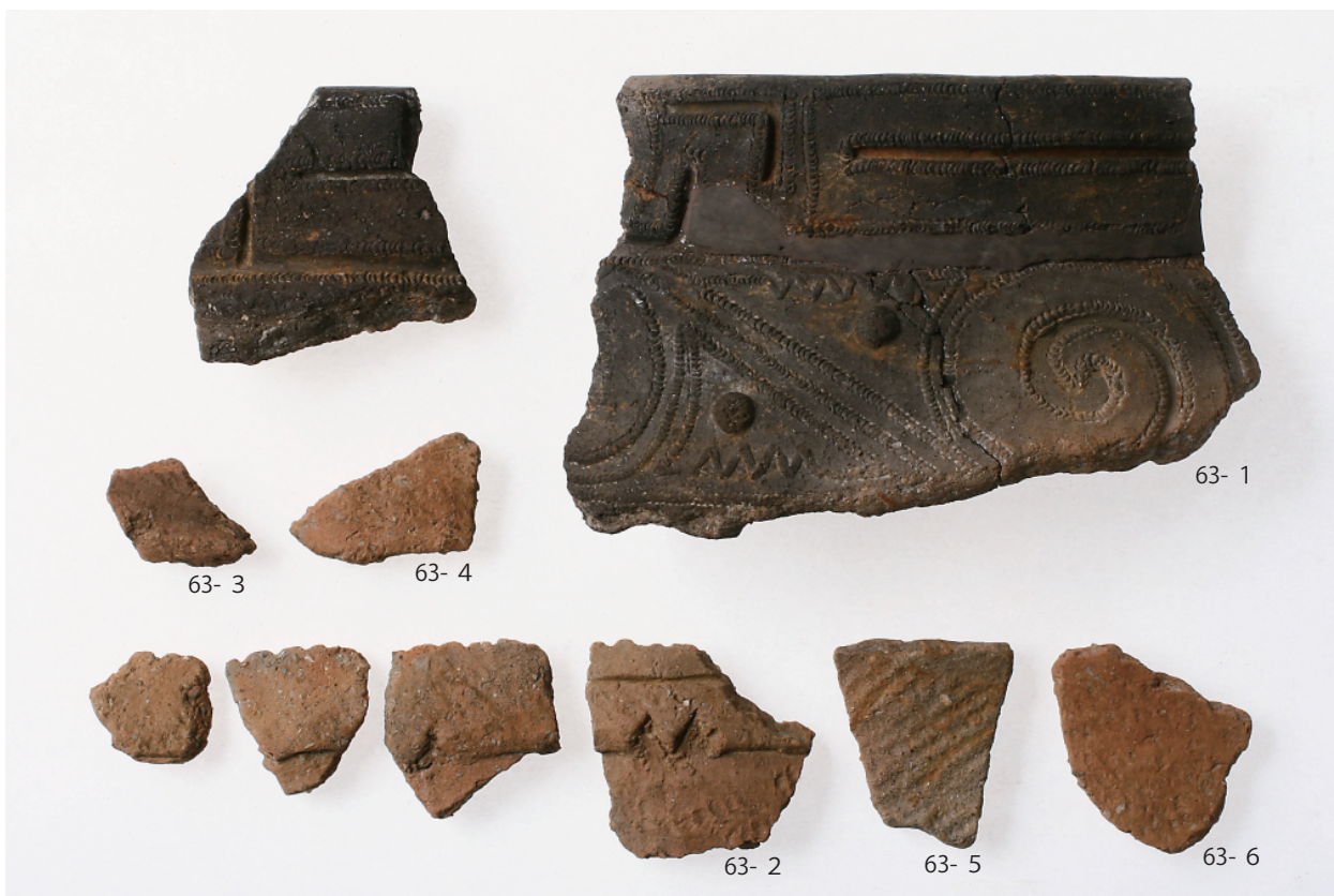
2 試掘出土遺物 (第 63 図 1～6)