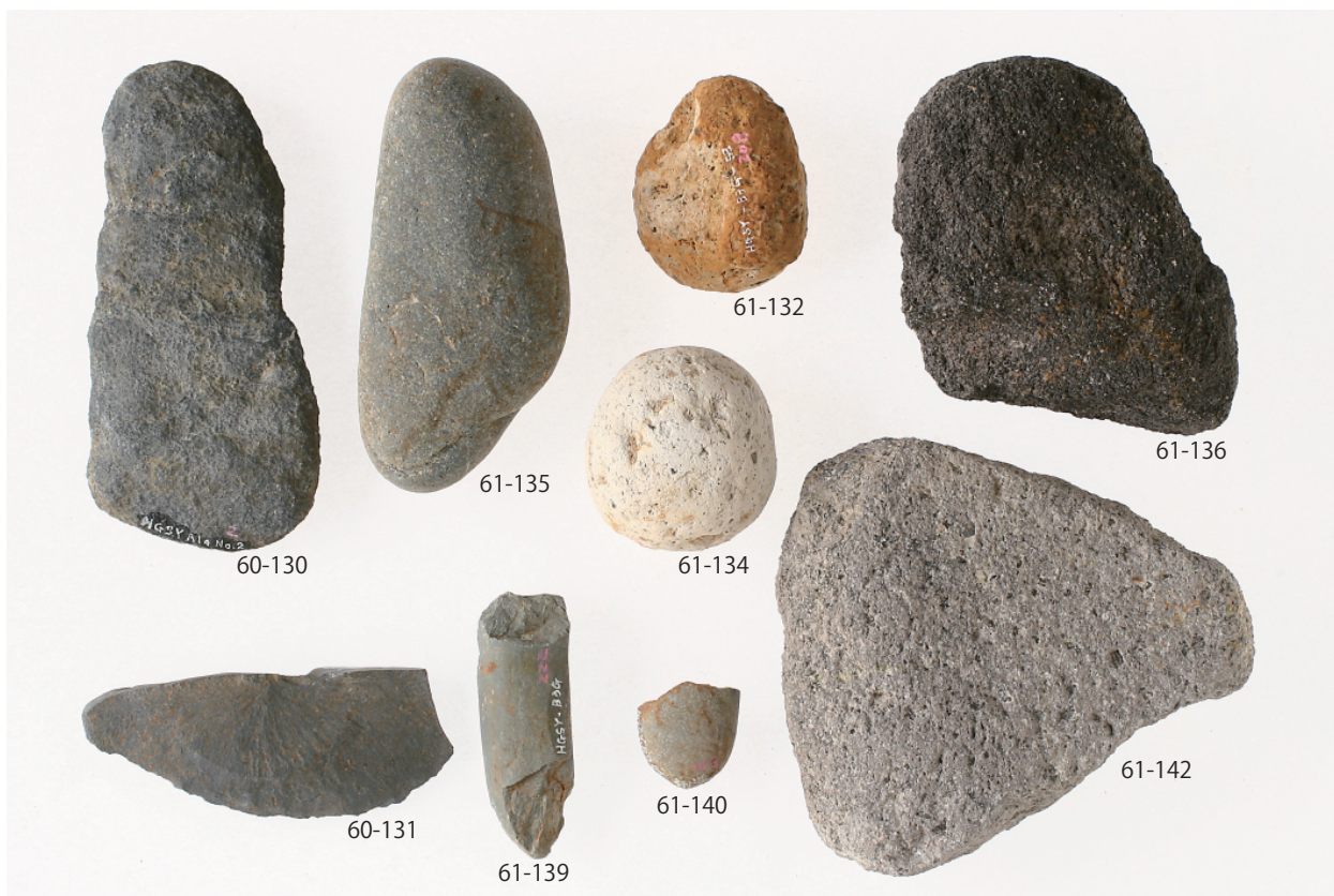
1 グリッド出土遺物 (5) (第 60 図 130・131、第 61 図 132・134～136・139・140・142)