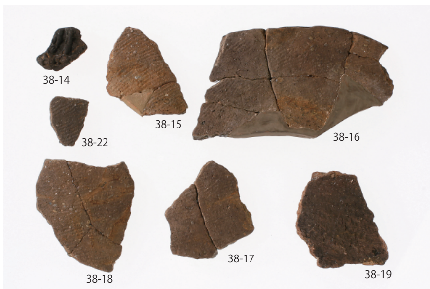
2 第 18 号土壙出土遺物 (第 38 图 14~19・22)