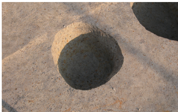
5 第 29 号土壤