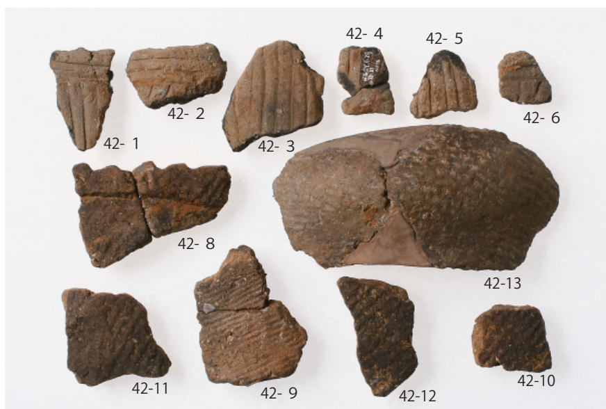
3 第 21 号土壙出土遺物 (第 42 图 1~6・8~13)