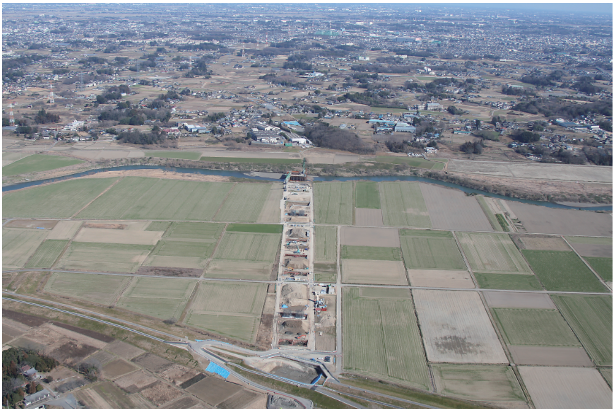
2 調査区遠景（西から）