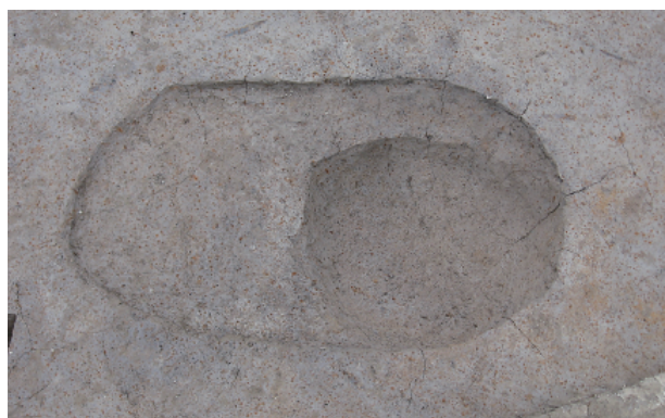
3 第 26 号土壤