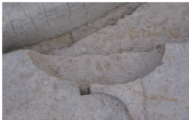
5 第 21 号土壙