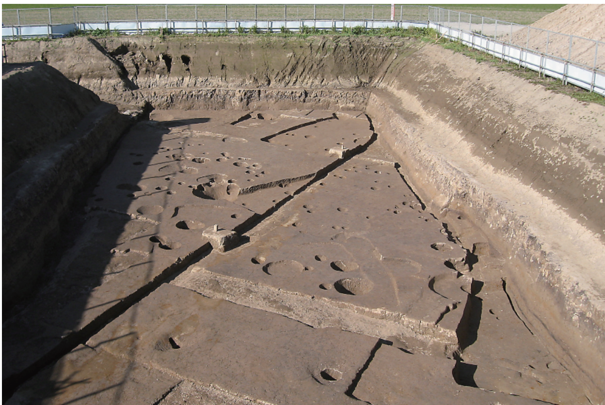
2 調査区全景（南から）