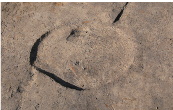
3 第 13 号土壤