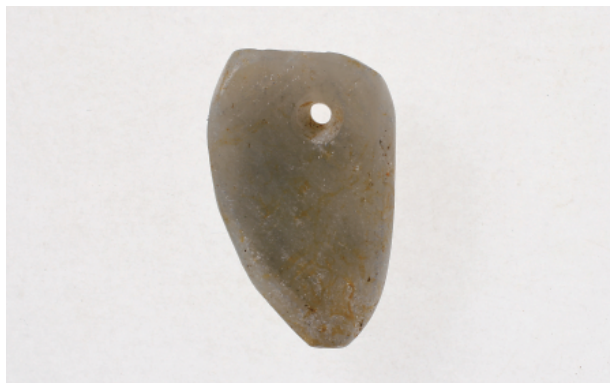
1 第8号住居跡出土遺物 (第32图25)