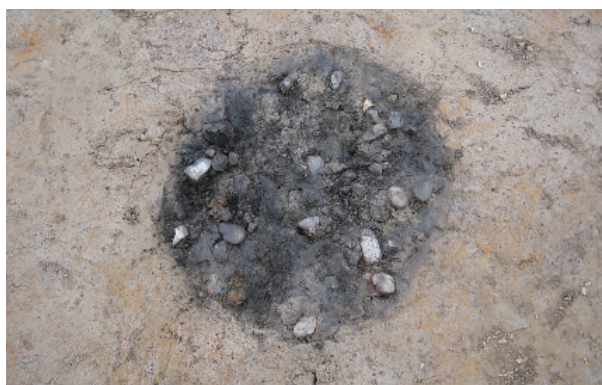
5 第 1 号集石土壤