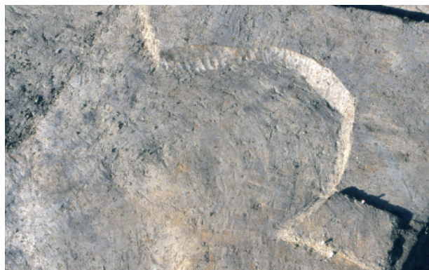
1 第 23 号土壤