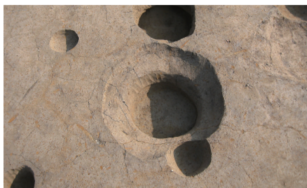
2 第 24 号土壤