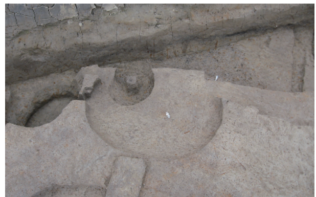
7 第 17 号土壤