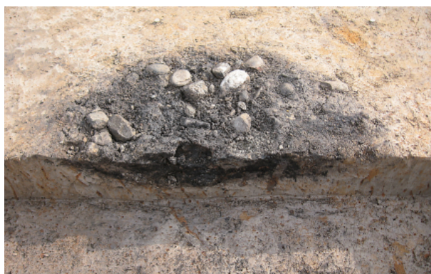
6 第 1 号集石土壤土层断面图