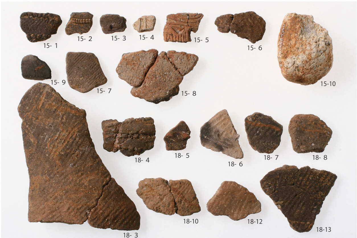
2 第3号住居跡出土遺物 (第15图)・4号住居跡出土遺物 (1) (第18图3~8・10・12・13)