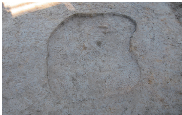
7 第 1 号性格不明遺構