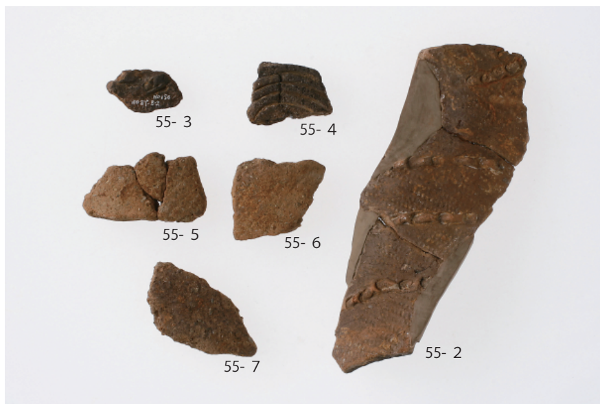
3 トレンチ出土遺物 (第 55 図 2 ~ 7)