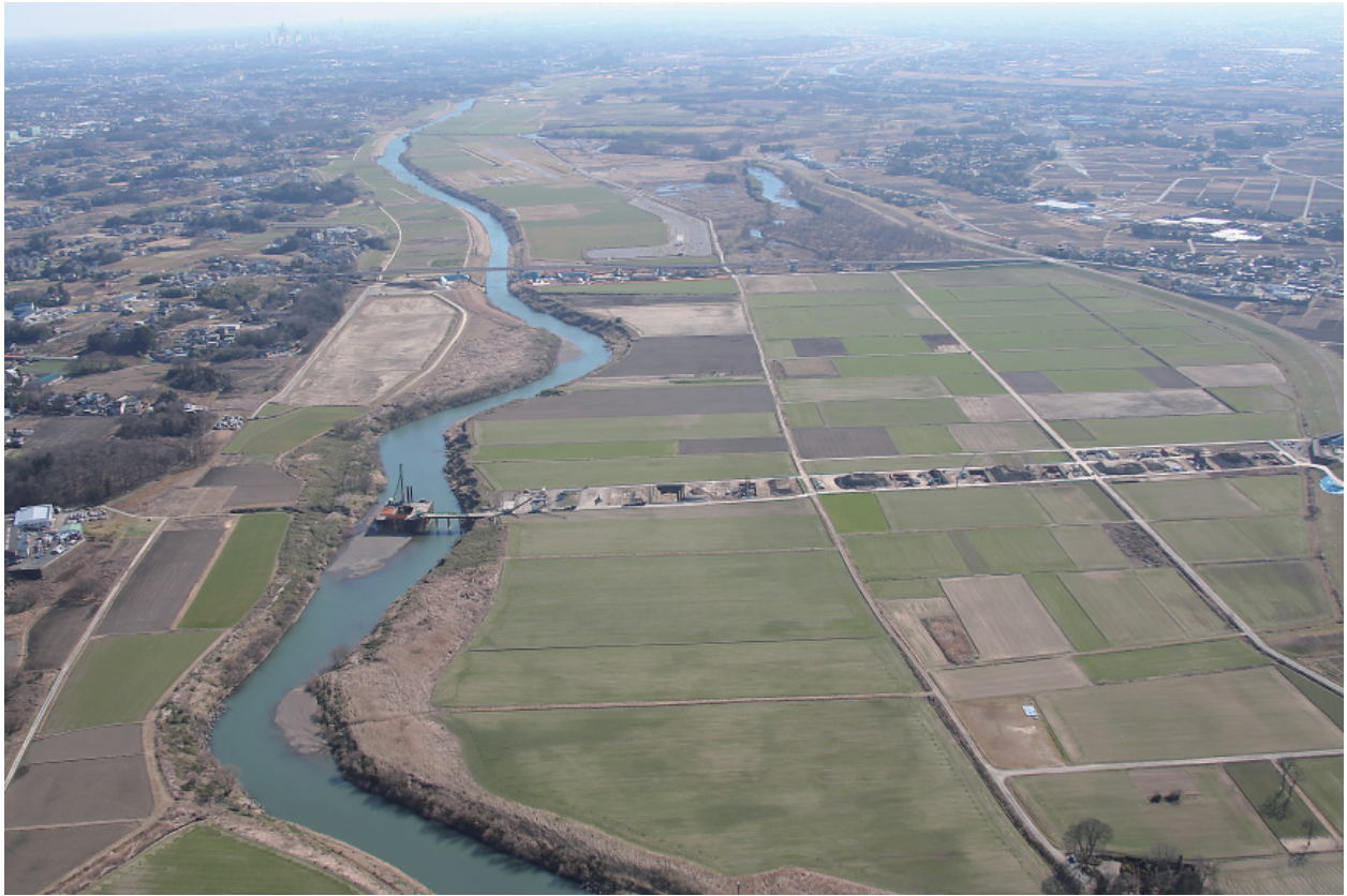
1 調査区遠景（北から）