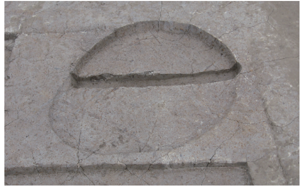
5 第 15 号土壤