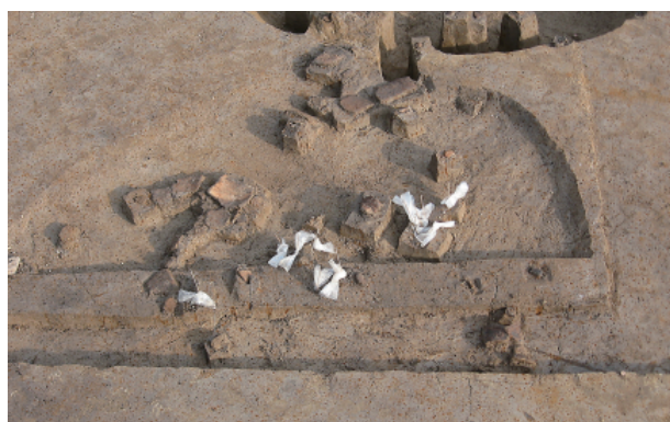
4 第 20 号土壙遺物出土狀況