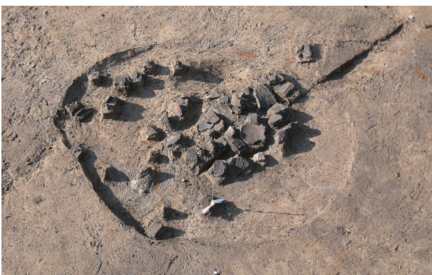
4 第 13 号土壤遺物出土狀況