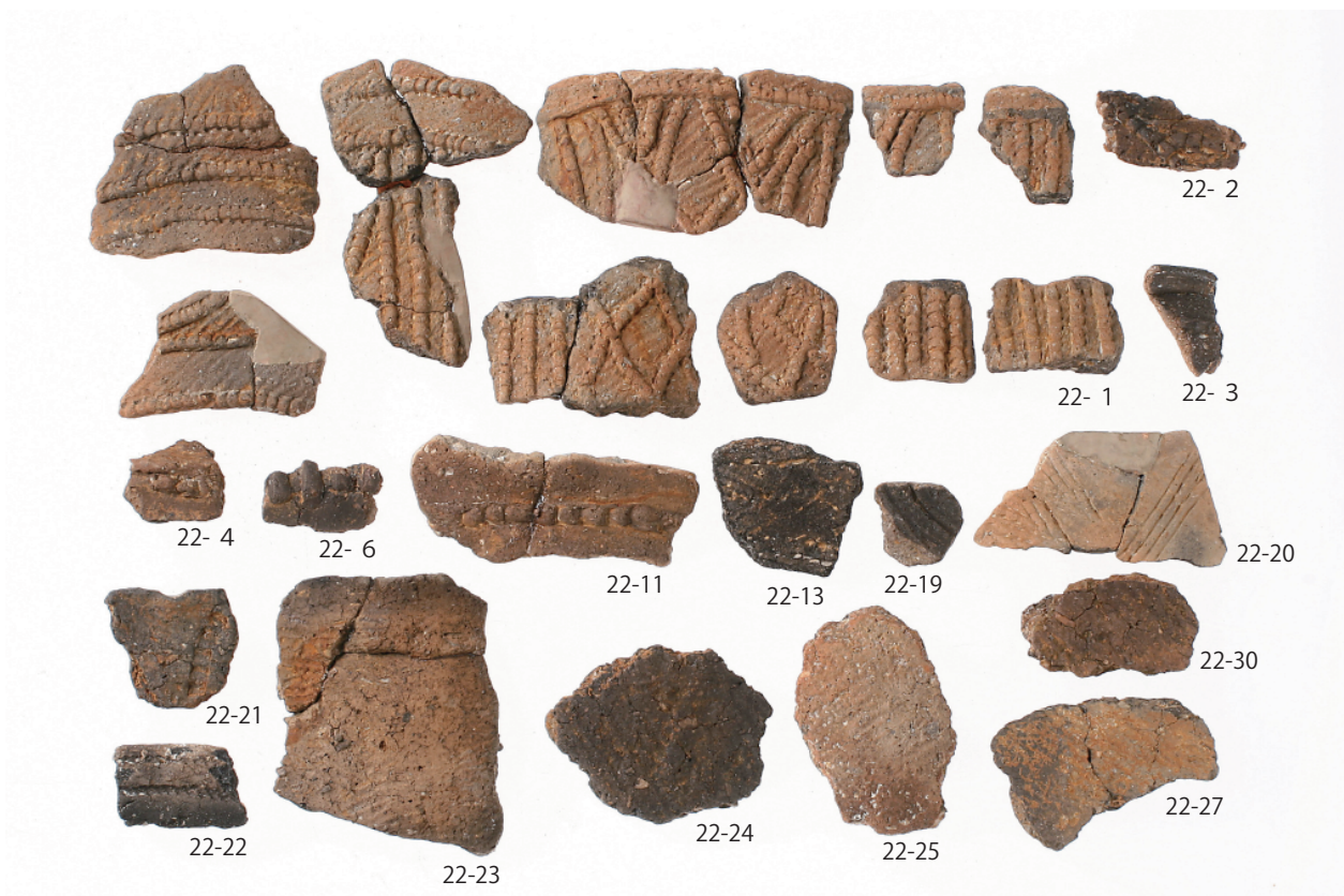
2 第5号住居跡出土遺物(1)(第22図1~4・6・11・13・19~25・27・30)