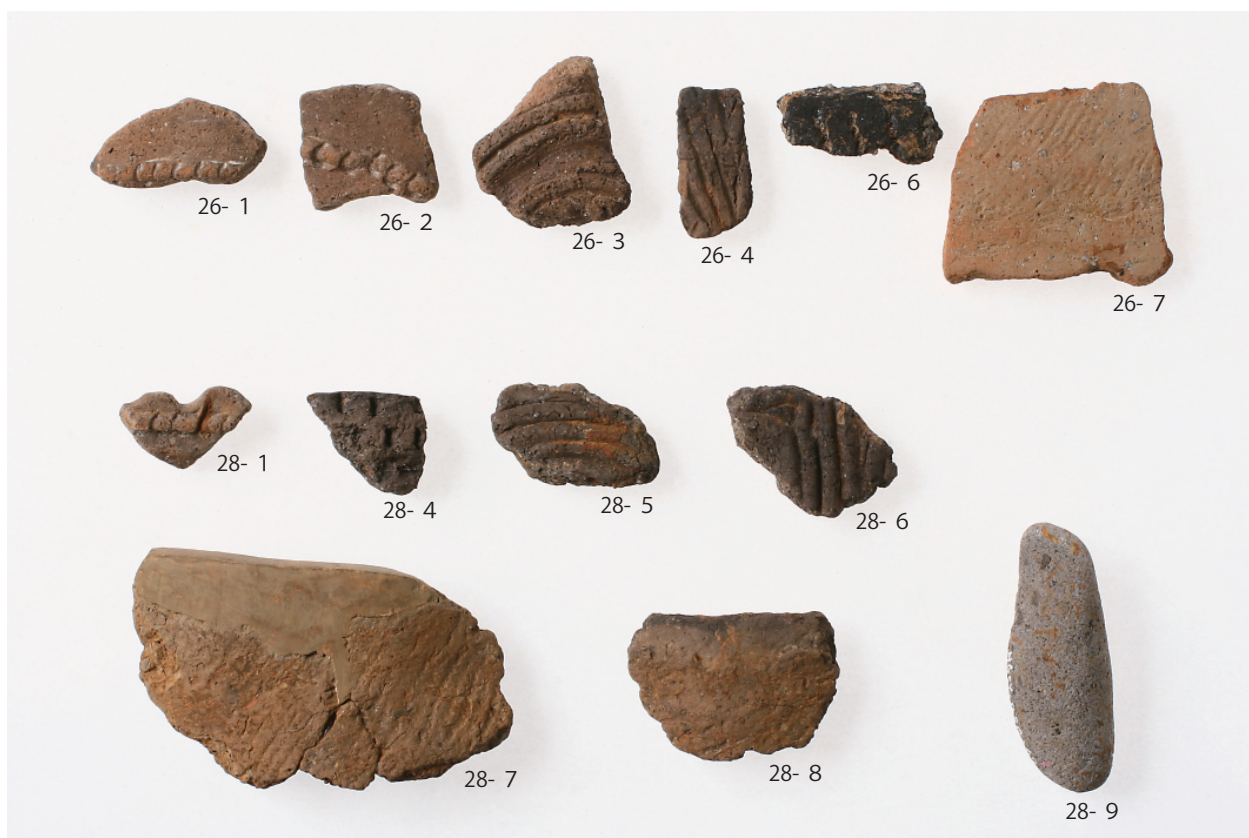
2 第6・7号住居跡出土遺物(第26图1~4・6・7、第28图1・4~9)