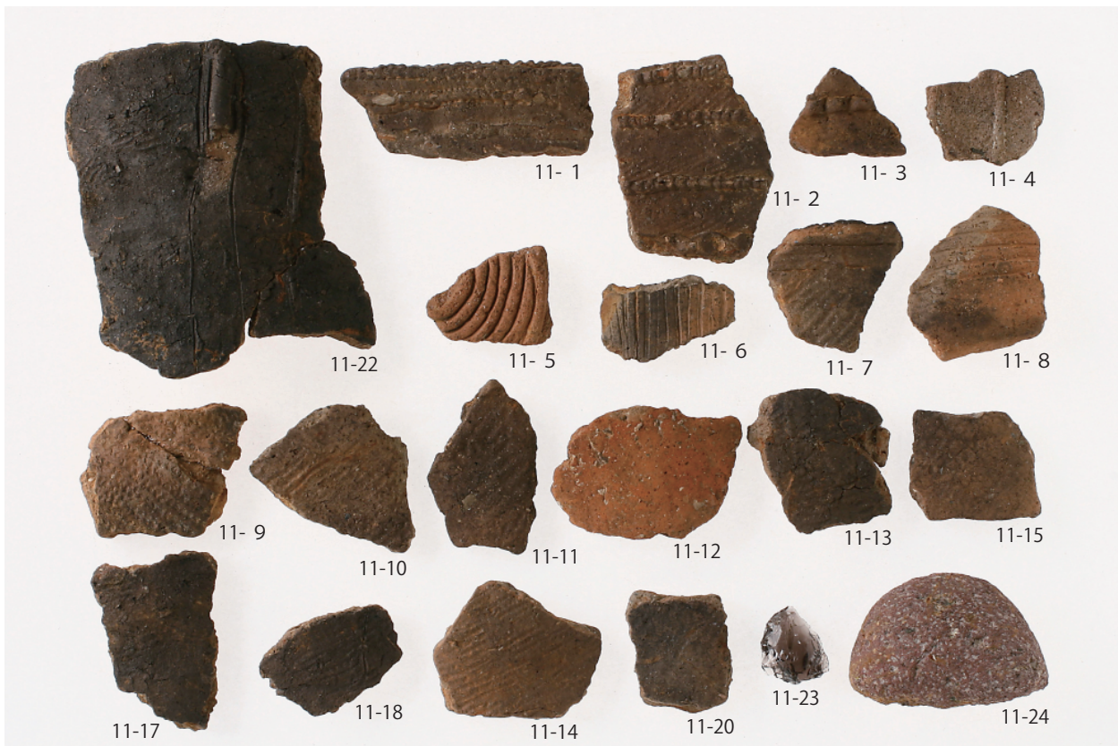
5 第1号住居跡出土遺物 (第11图1~15·17·18·20·22~24)