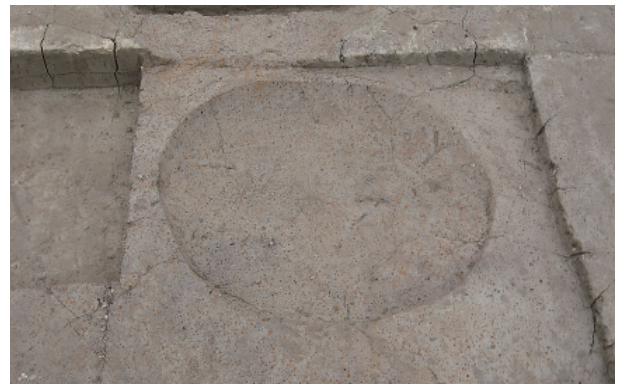
6 第 16 号土壤