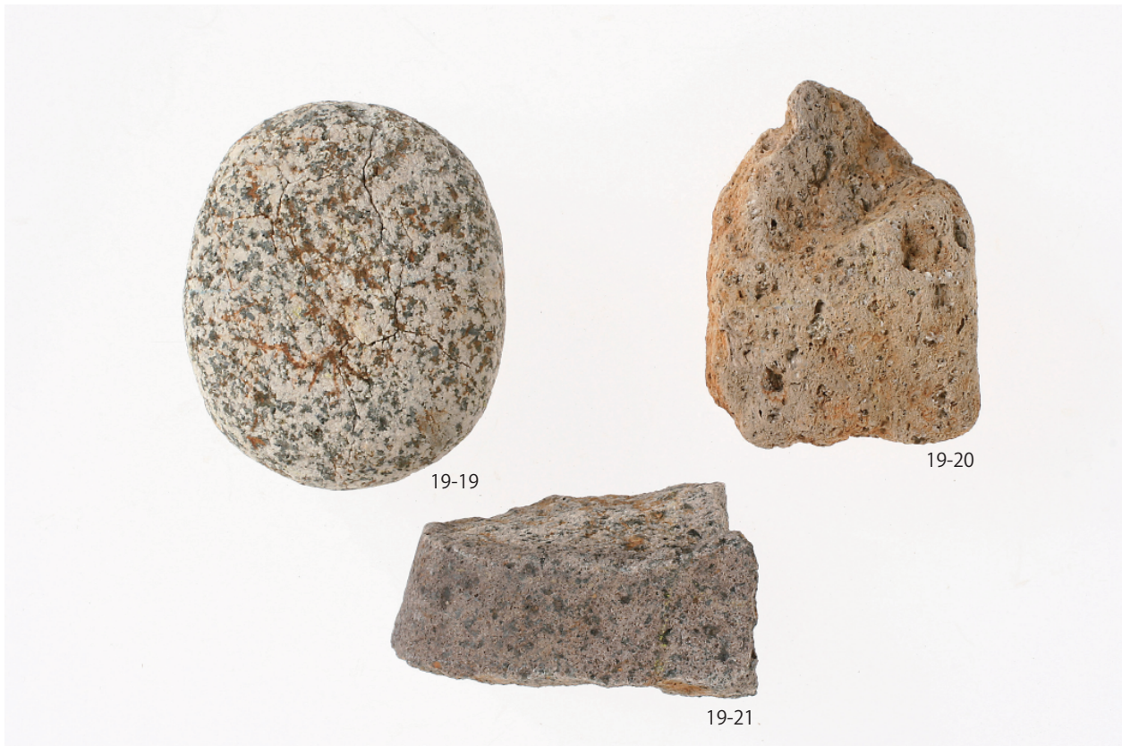
1 第4号住居跡出土遺物(2)(第19図)