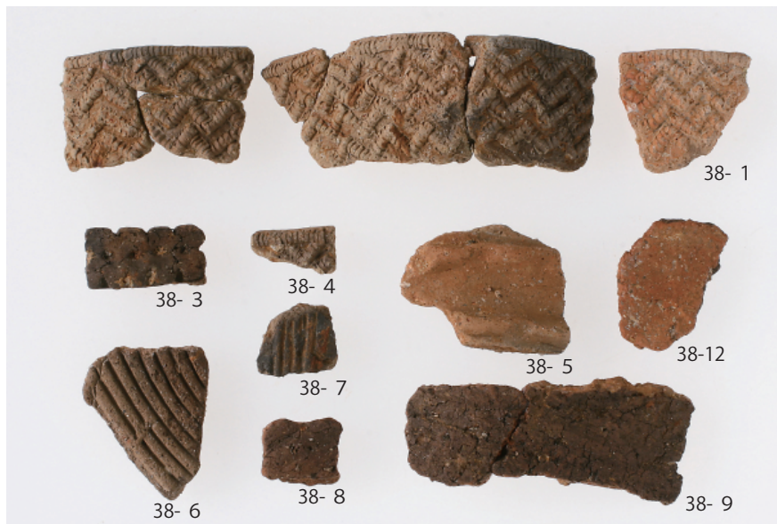
1 第 17 号土壙出土遺物 (第 38 图 1・3~9・12)