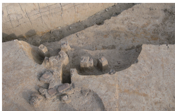
6 第 21 号土壙遺物出土狀況