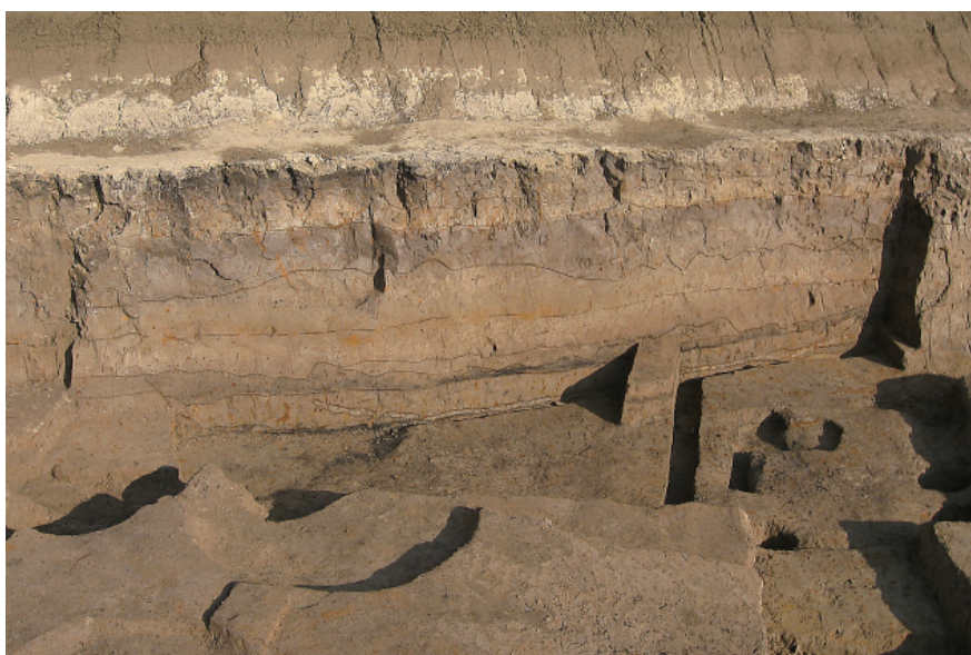
2 第1号住居跡土層断面