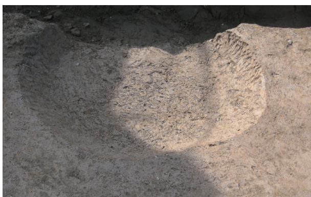
3 第 41 号土壤