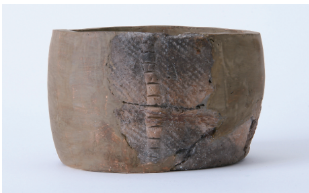
2 第3号土壙出土遺物 (第36图9)