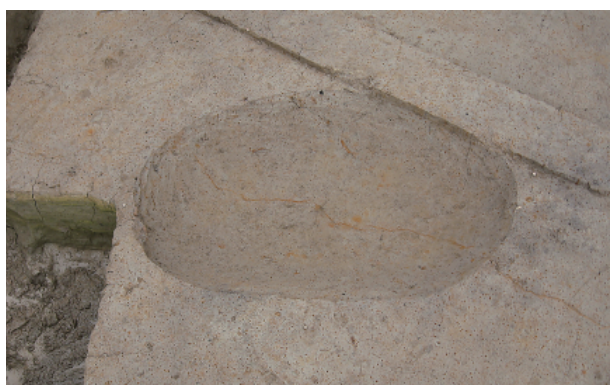
2 第 19 号土壙