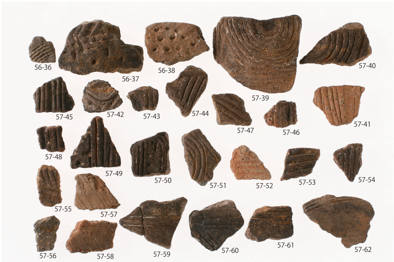
2 グリッド出土遺物 (2) (第 56 図 36 ~ 38、第 57 図 39 ~ 62)