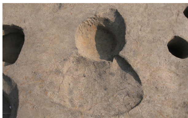
4 第 27·28 号土壤