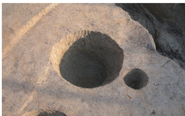
6 第 30 号土壤