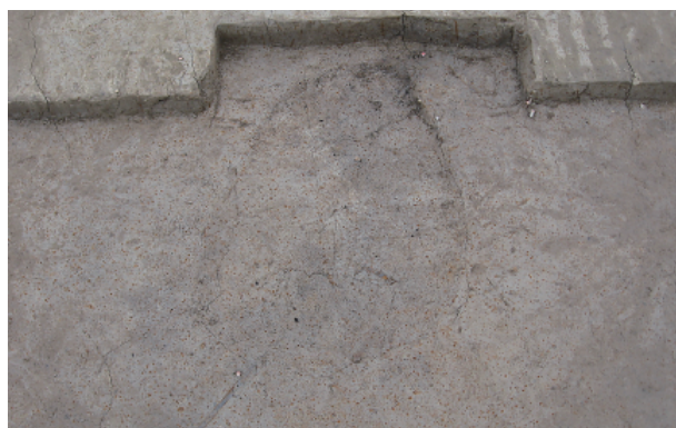
7 第 22 号土壙