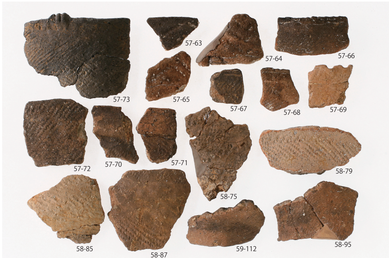
1 グリッド出土遺物 (3) (第 57 図 63 ~ 73、第 58 図 75・79・85・87・95、第 59 図 112)