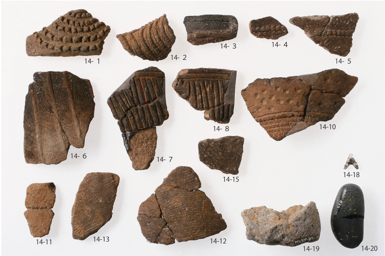
1 第2号住居跡出土遺物 (第14图1~8・10~13・15・18~20)