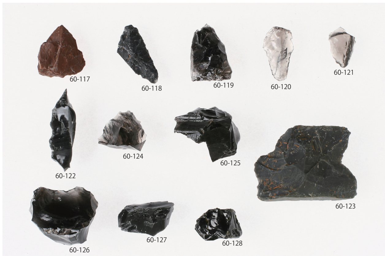
2 グリッド出土遺物 (4) (第 60 図 117 ~ 128)