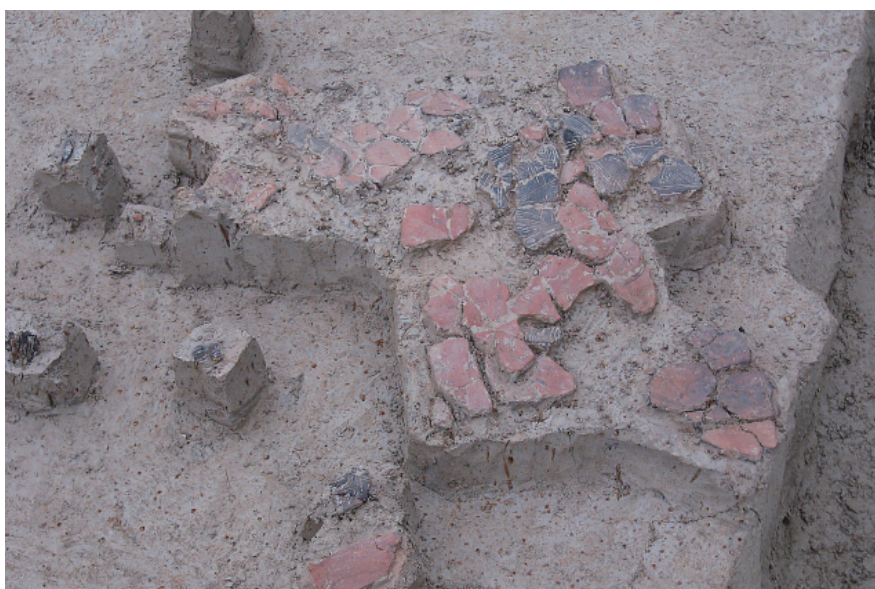
2 第4号住居跡遺物出土状況