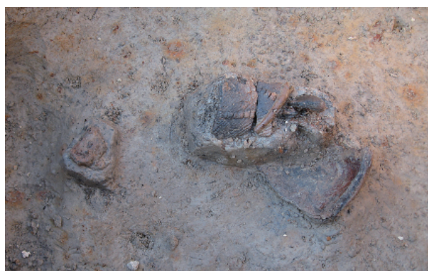
4 第3号土壤遺物出土狀況