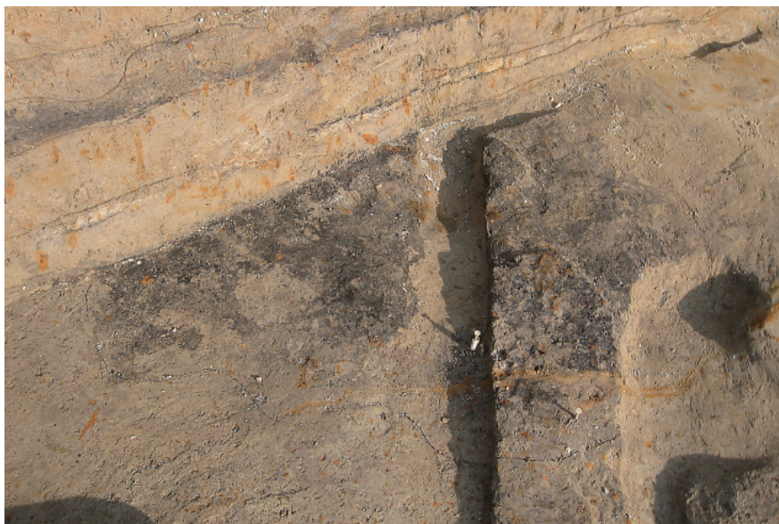
1 第1号住居跡下面炭化物 検出状況