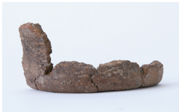
4 第21号土壙出土遺物 (第42图13)