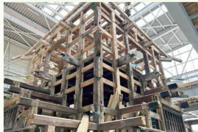
軸組みがあらわになった宇土櫓(五階櫓)