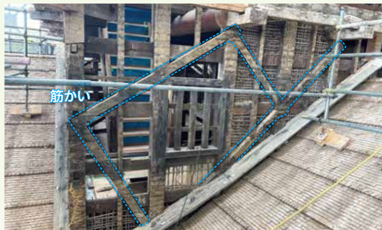
土壁の解体で見えてきた鉄骨の筋かい