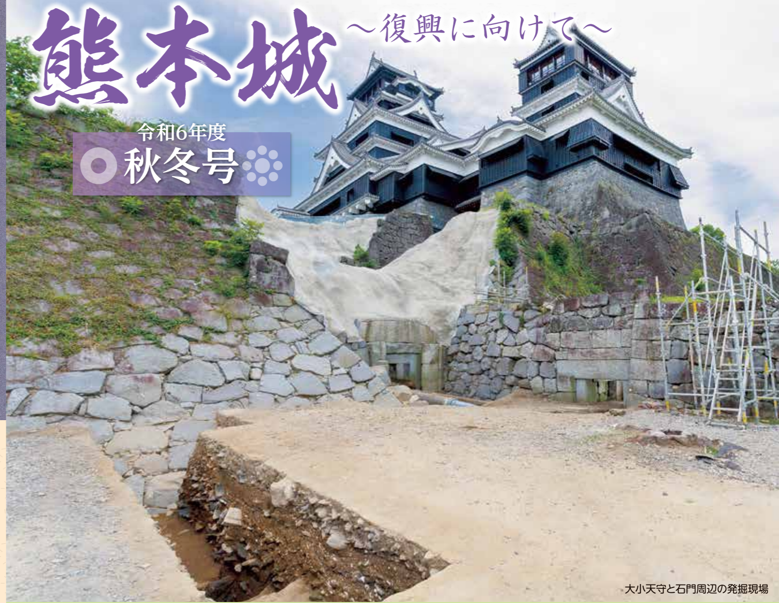
大小天守と石門周辺の発掘現場