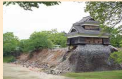
被災直後の戌亥櫓と崩落した石垣