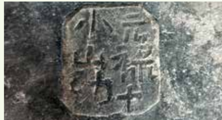
瓦に付けられた刻印(元禄十 小山勘)