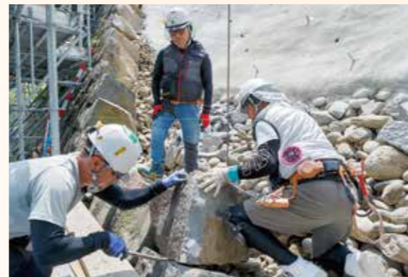
微調整を繰り返して石を積む様子

石垣外面の築石は、解体前の写真や図面等を参考に、一つ一つ微調整を繰り返しながら丁寧に積み上げています。また、今後の地震で平櫓や石垣が崩れることがないように、石垣内部を特殊なシートや鉄筋で補強しています。積み直しは、令和7年度に完了する予定です。