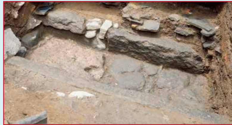
石を組み合わせて造られた排水溝