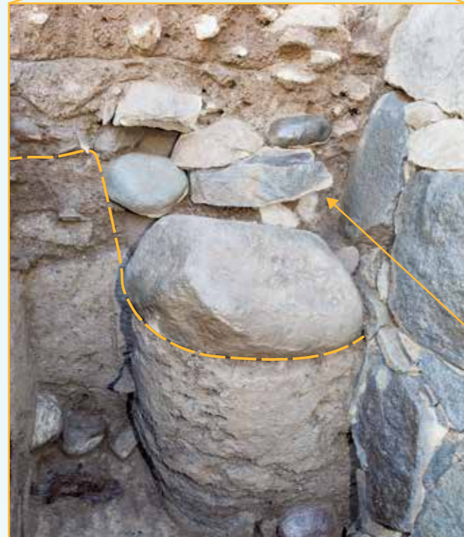
石門北側にある石垣(右)の修理痕跡