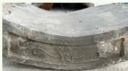
江戸時代初期とみられる瓦(桔梗紋)

今後は軸組みの状態を過去に行った修理の痕跡調査や復旧時に必要な寸法等の確認を行った後、全ての部材を解体していきます。