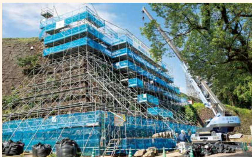
平櫓下石垣の積み直し工事