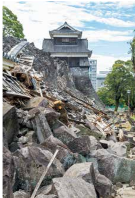
6 崩落した奉行丸西側の石垣