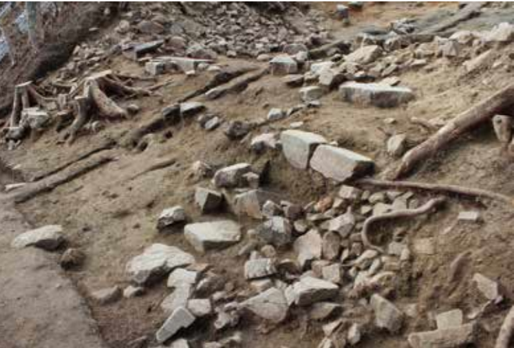
伝三の丸虎口の下方の石階段