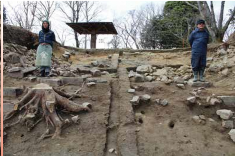
伝三の丸虎口の門（人が立っているのが礎石）