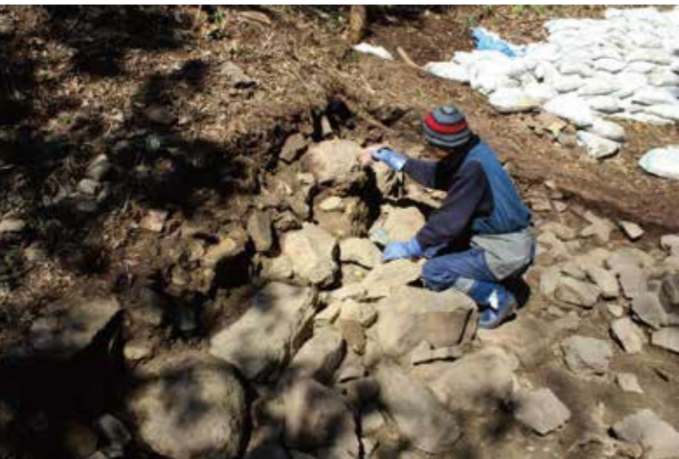
垂直に積まれた枡形虎口の石垣