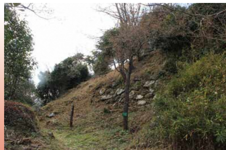
伝本丸北面の食い違い虎口と石垣