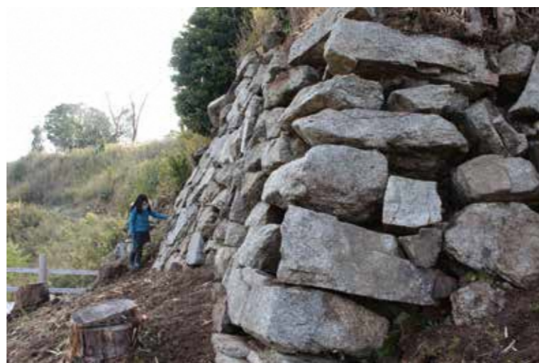
伝本丸北面の下段の石垣