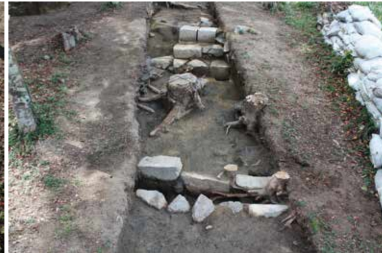
西櫓台の石階段と石組溝