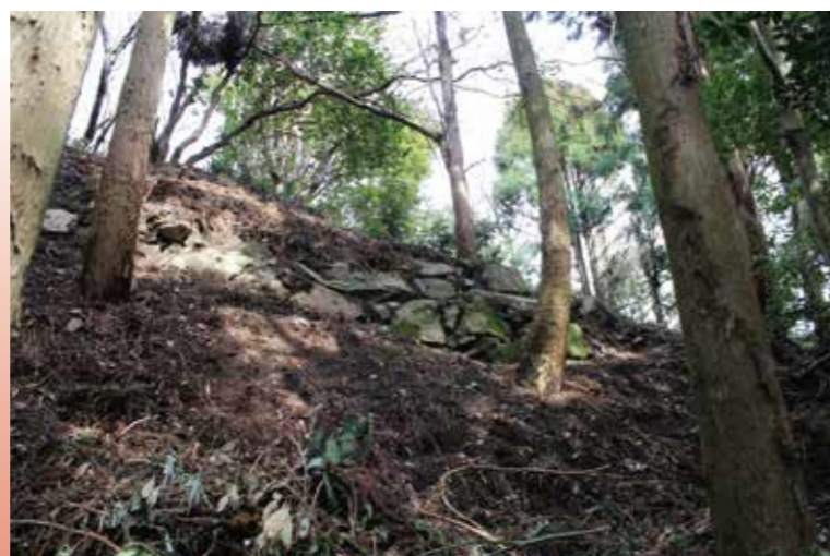
推定大手道沿いの曲輪の石垣