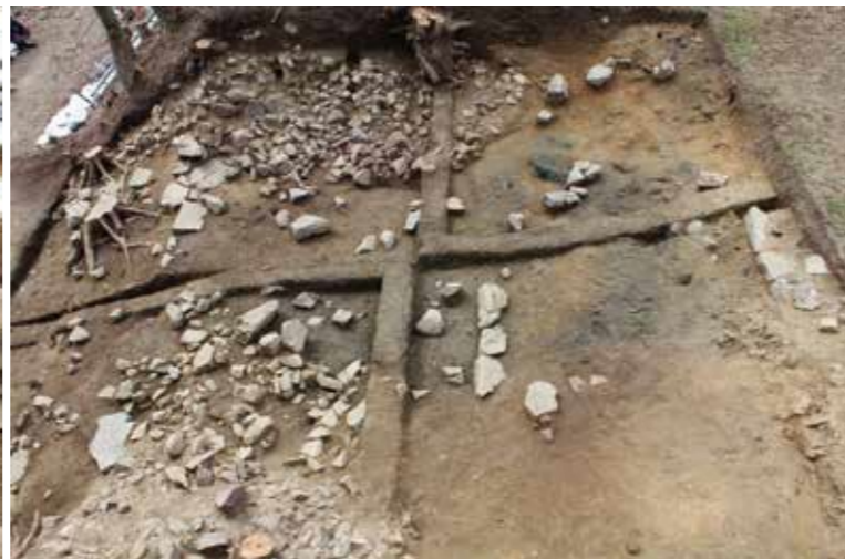
発掘された伝三の丸の虎口全景