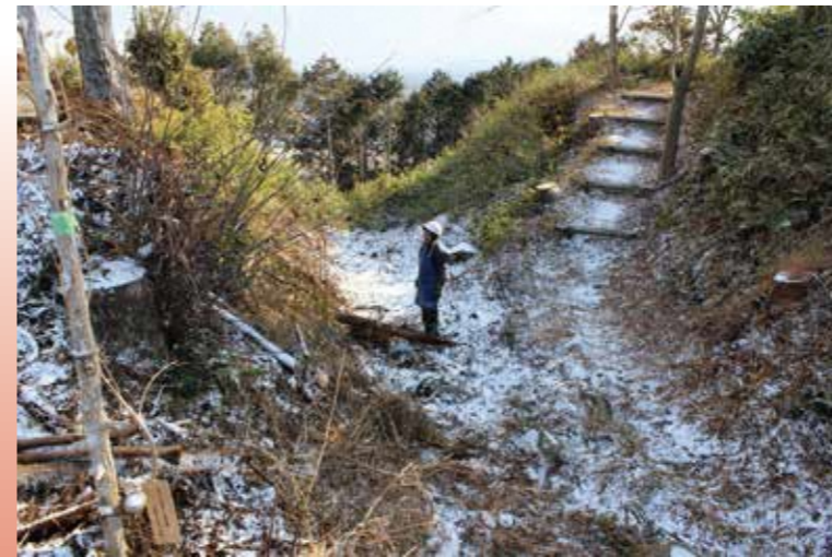
伝本丸と伝西の丸を区切る竪堀