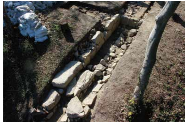
東櫓台のL字状の石垣

このように、二つの櫓台は構造や石の使い方に違いがみられます。しかし、櫓台の規模に大きな違いはありません。高さも伝本丸の内側から見ると、どちらも1m程度であったと推定されます。