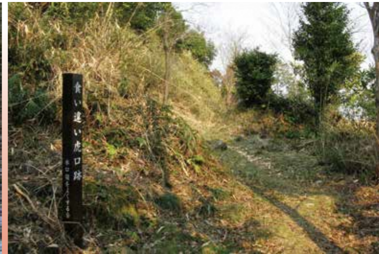
伝本丸の北面の食い違い虎口