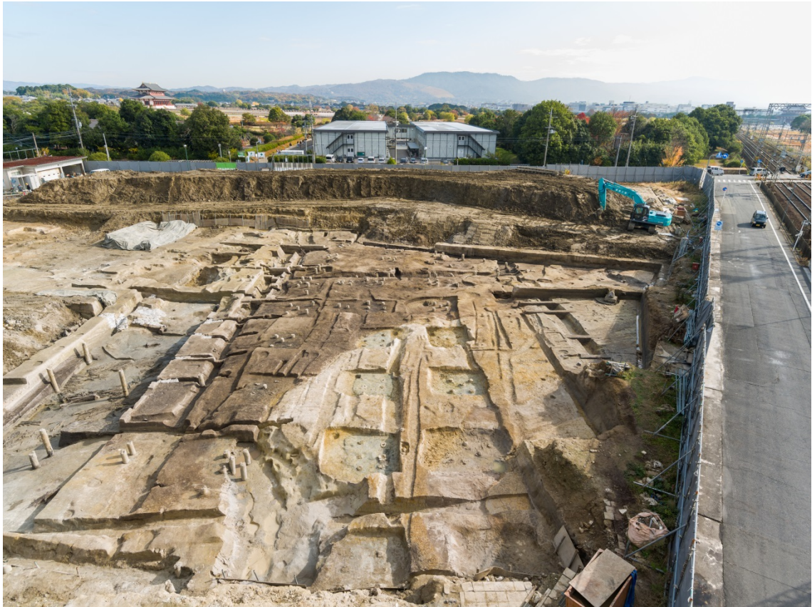
一条南大路と南北両側溝（西から）