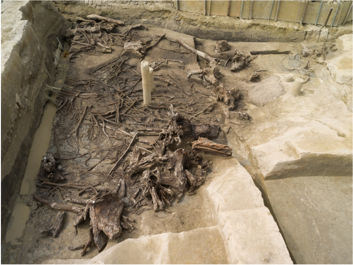
調査区西部の下層敷粗朶と切株（東から）