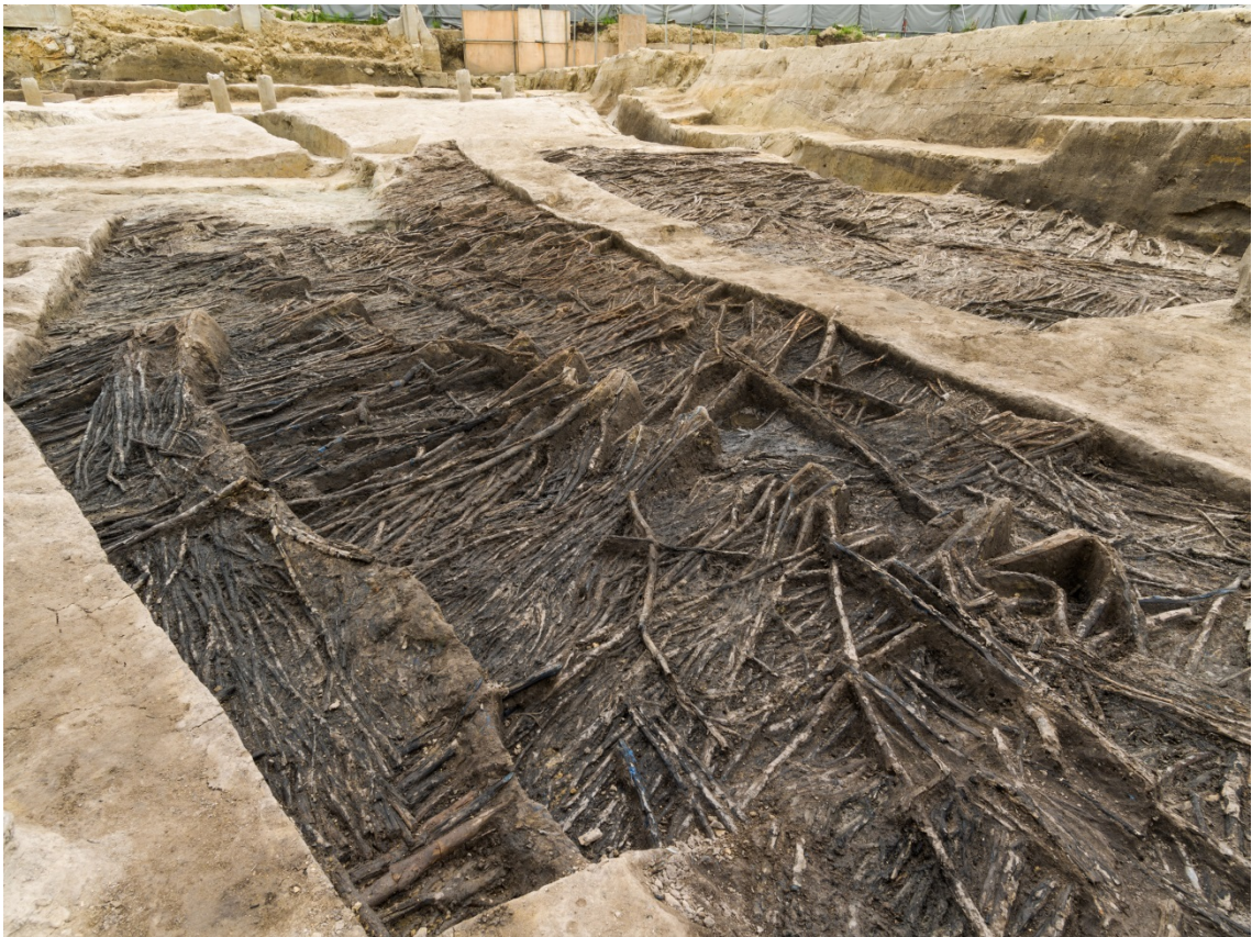
調査区東南部の敷粗朶（北東から）