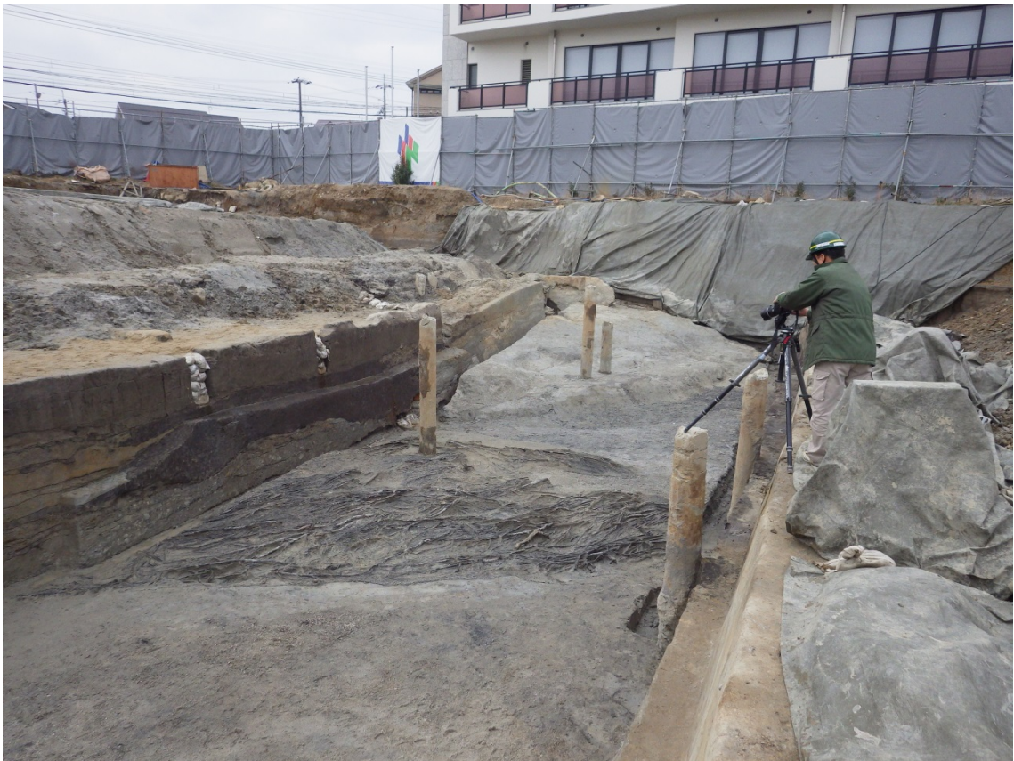
調査区中央部の最下層敷葉・敷粗朶（東から）