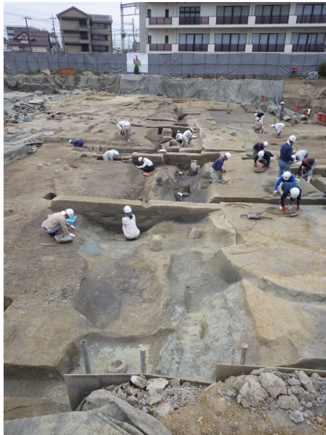
一条南大路北側溝（東から）