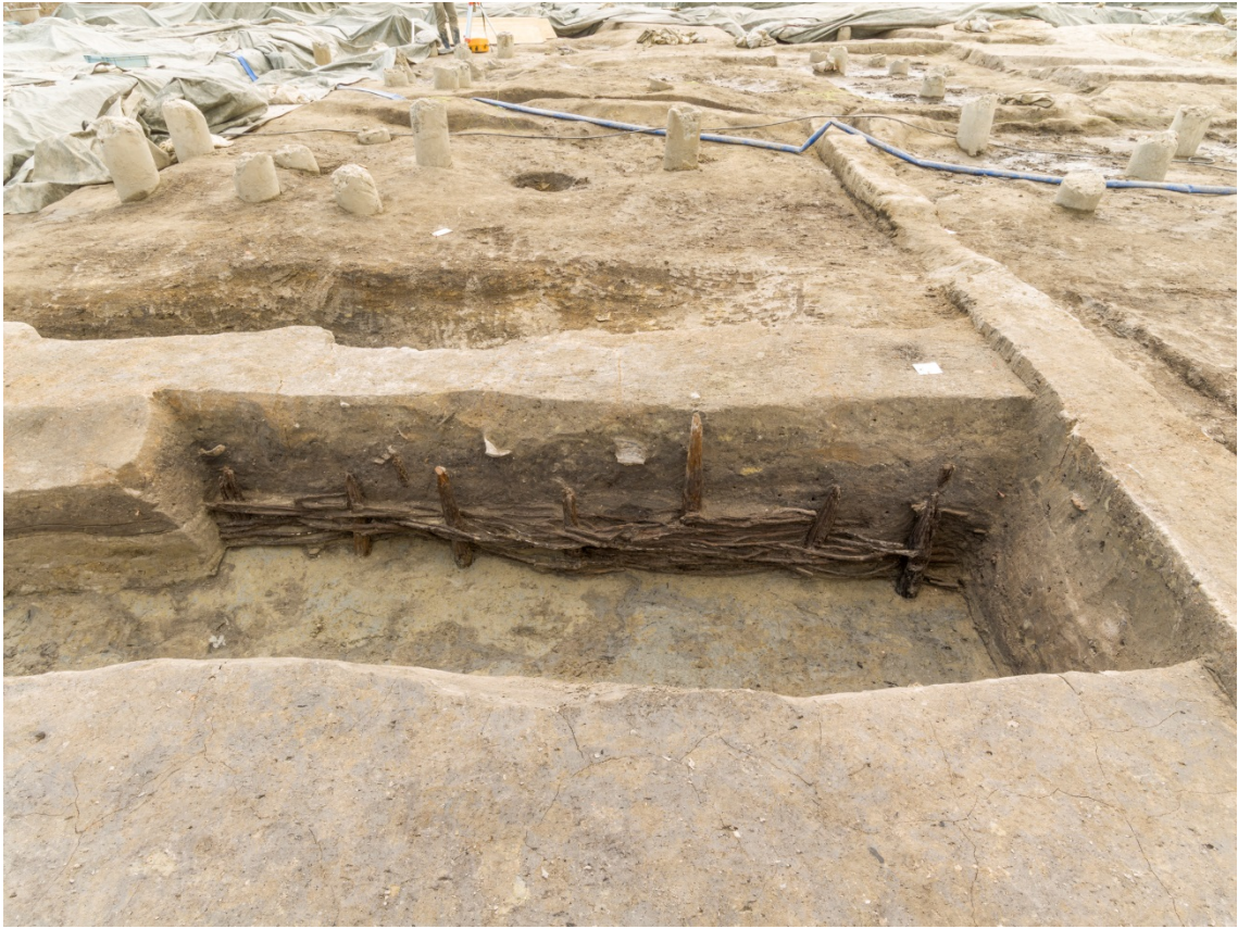
一条南大路北側溝のしがらみによる護岸（北から）