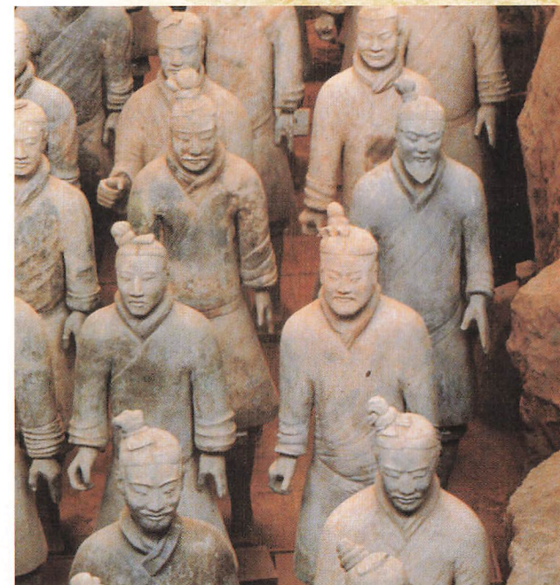
秦の始皇帝陵兵馬俑博物館での展示状況