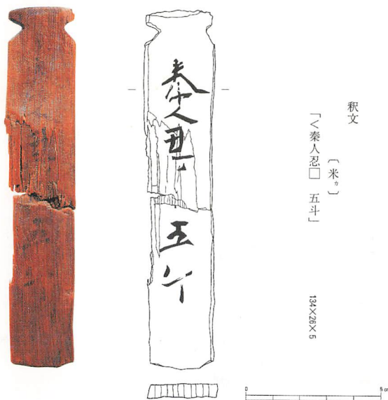
貯水池跡から出土の木簡