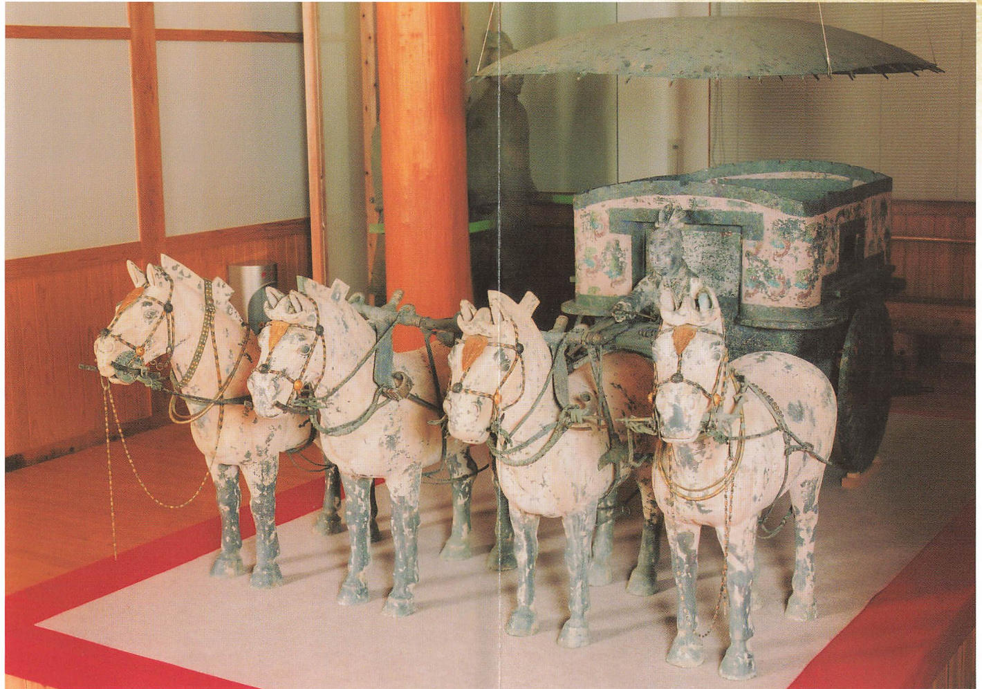
2号銅車馬（複製） [全長：3.17m 高さ：160cm 総重量：1000kg]

2号車は、始皇帝が乗るのに相応しく、車体には赤、緑、青、白、黒の彩りで美しい文様が描かれており、前面には御者が配されています。「温涼車」とも呼ばれ、車内の空気を調節するための小さな穴を開けた窓が設置されています。温故創生館では2号車の複製品を展示しています。