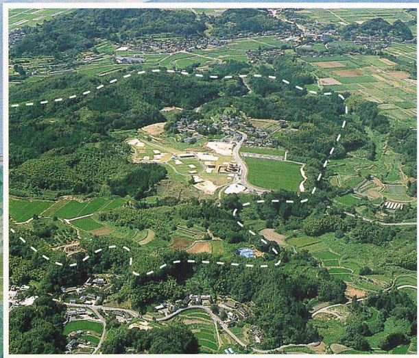
鞠智城跡全景(南上空から)