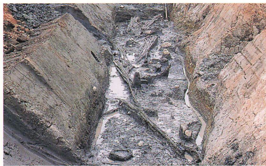
木簡や建築用材が見つかった貯水池跡

貯水池跡は、長者原地区の北西部の谷部にあり、約5,300㎡の広さがあります。木簡や建築用材などの貴重な遺物が数多く発見されました。