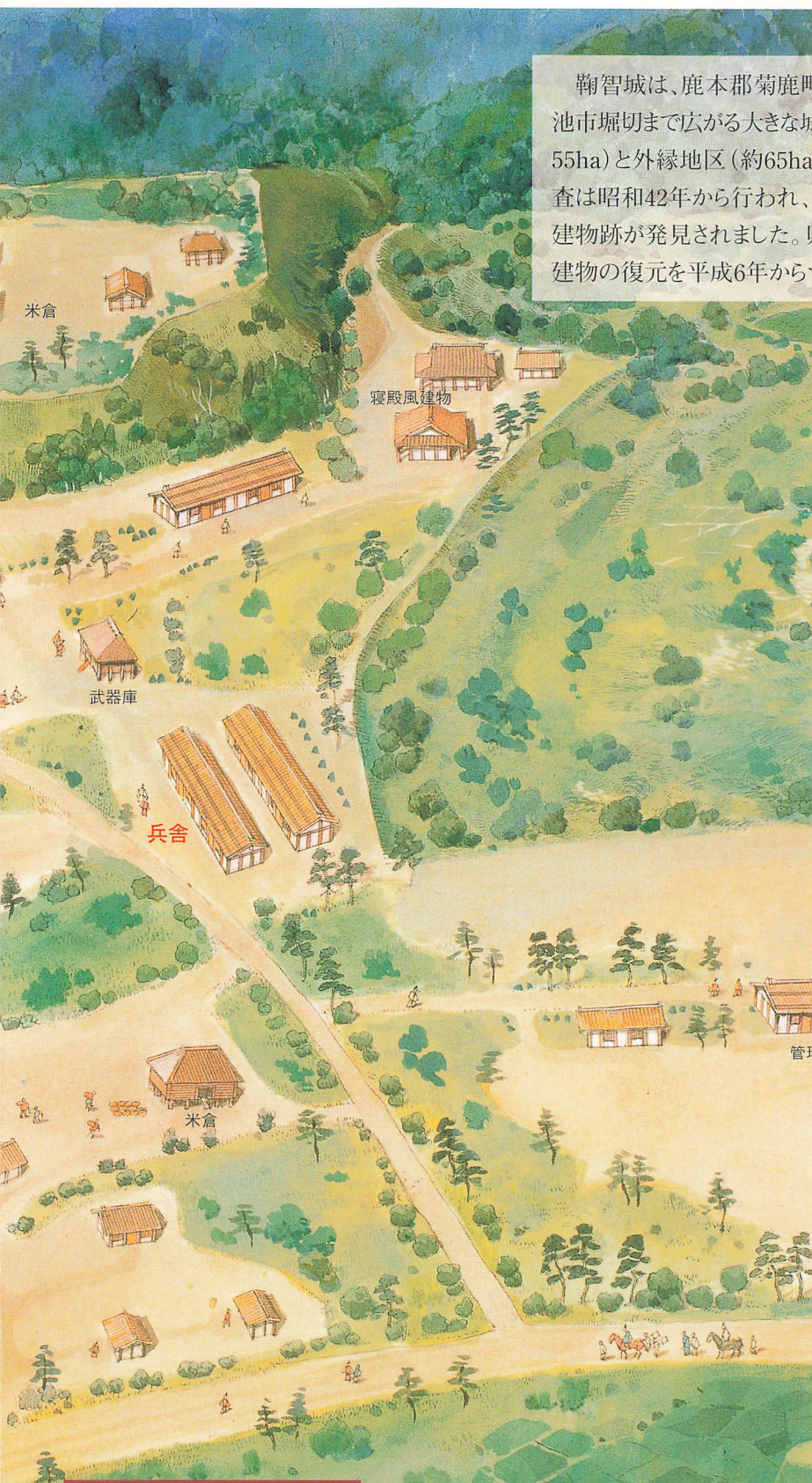
鞠智城(698年頃)の想像図

鞠智城は、鹿本郡菊鹿町池市堀切まで広がる大きな城跡(約55ha)と外縁地区(約65ha)を占める。発掘調査は昭和42年から行われ、多くの建物跡が発見されました。近年、建物の復元を平成6年から行っています。