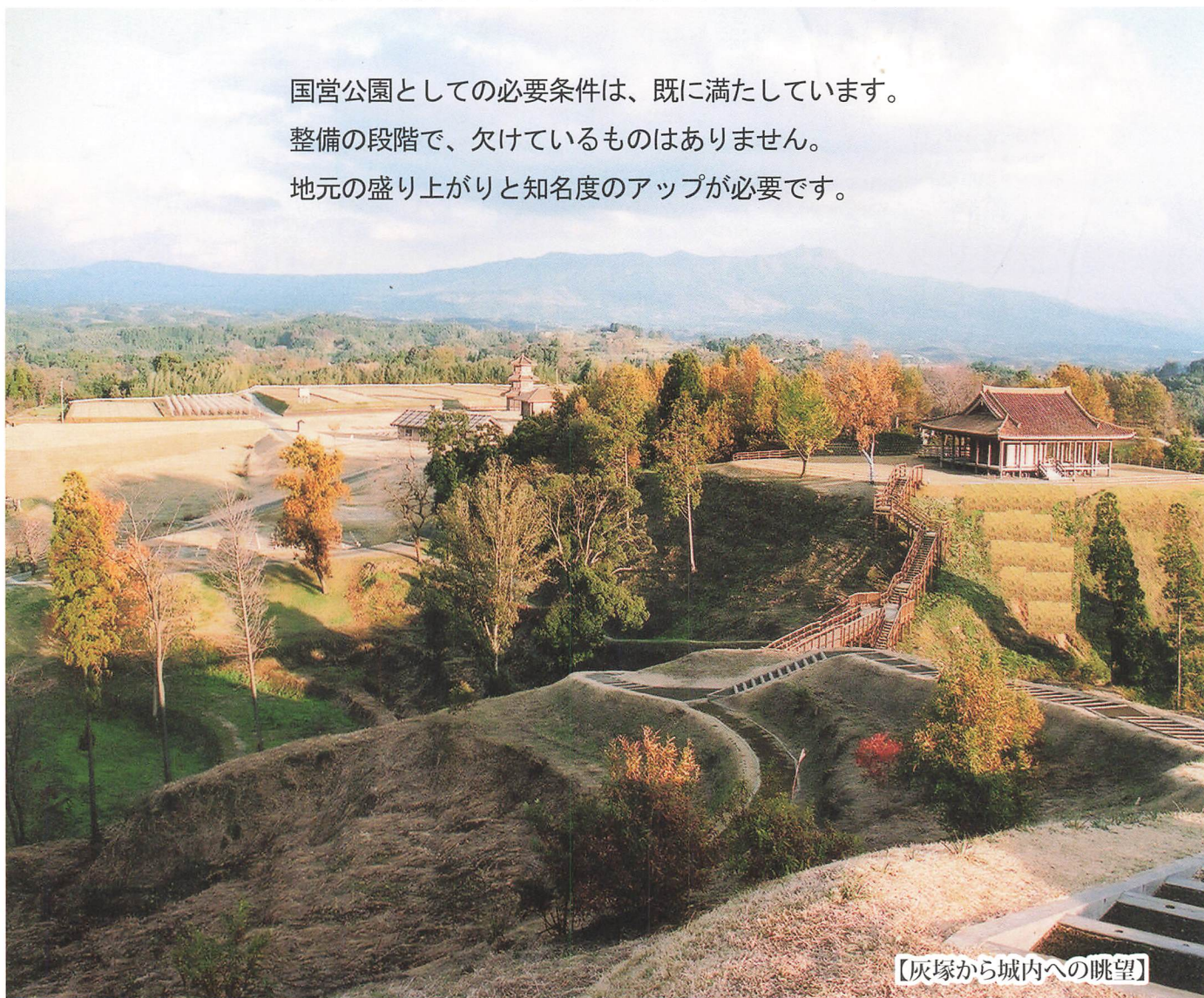
【灰塚から城内への眺望】

国営公園としての必要条件是、既に満たしています。 整備の段階で、欠けているものはありません。 地元の盛り上がりと知名度のアップが必要です。