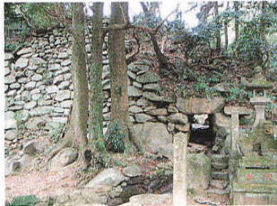
基肄城(佐賀県基山町)