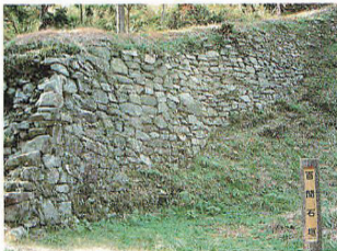
大野城(福岡県大野城市等)