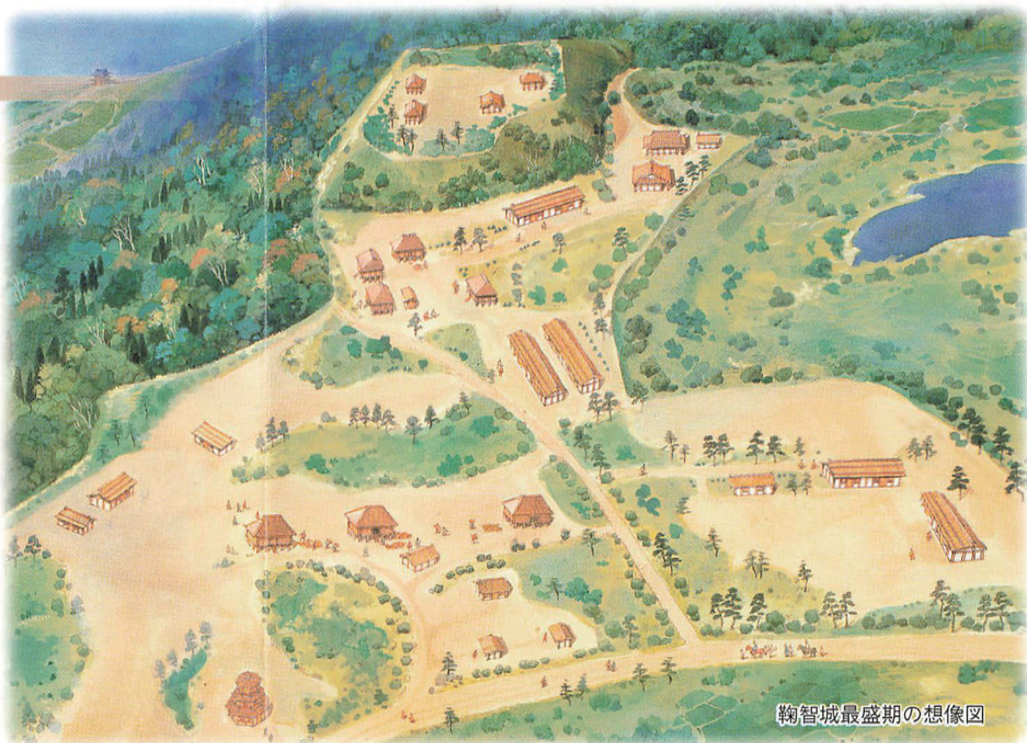
鞠智城最盛期の想像図