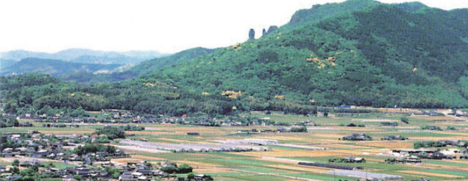
灰塚展望所から鹿本方面の眺望