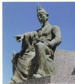
鞠智城の築城を指揮したと推定される百済の貴族