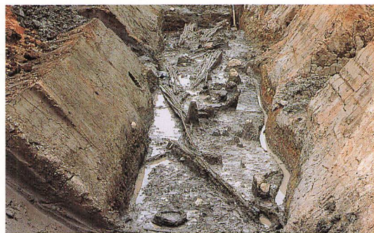
木簡や建築用材が見つかった貯水池跡

貯水池跡は、長者原地区の北西部の谷部にあり、約5,300㎡の広さがあります。木簡や建築用材などの貴重な遺物が数多く発見されました。