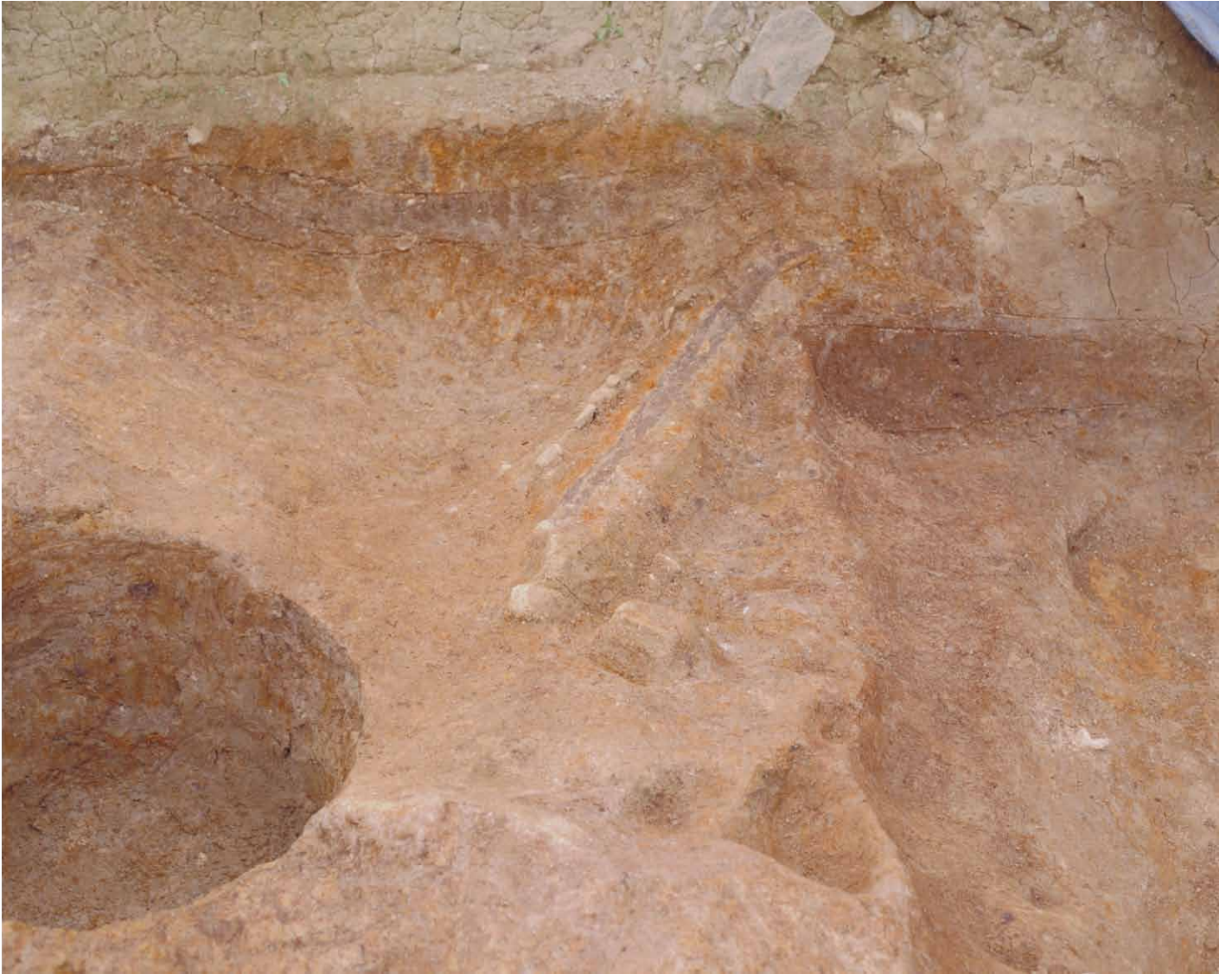
写真 35. 条坊跡第 275 次調査 275SX060 検出状況（南東から）