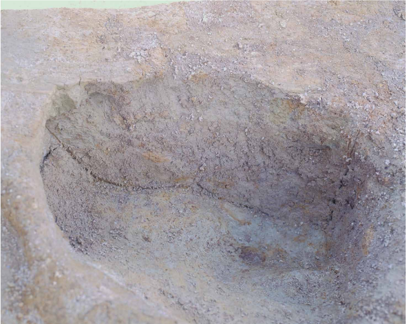
写真 57. 条坊跡第 275 次調査 275SB400d 土層観察（南から）