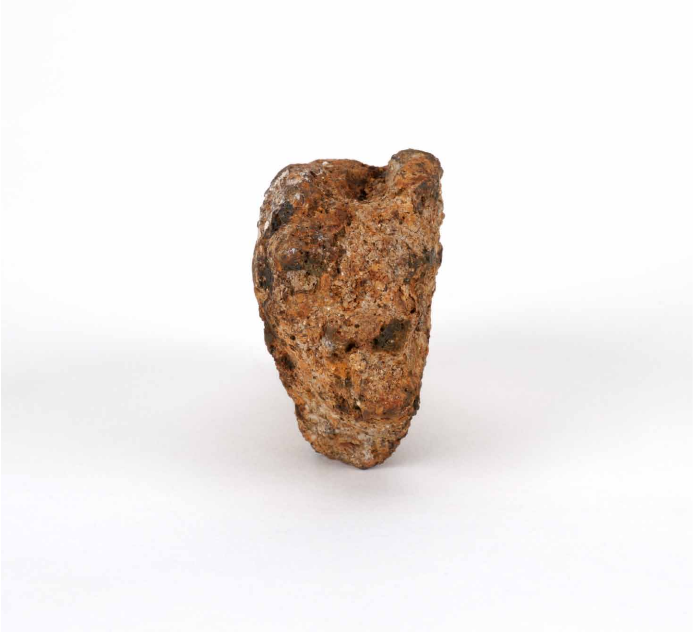
写真 94. 条 275SD050 茶灰色粘質土 側面