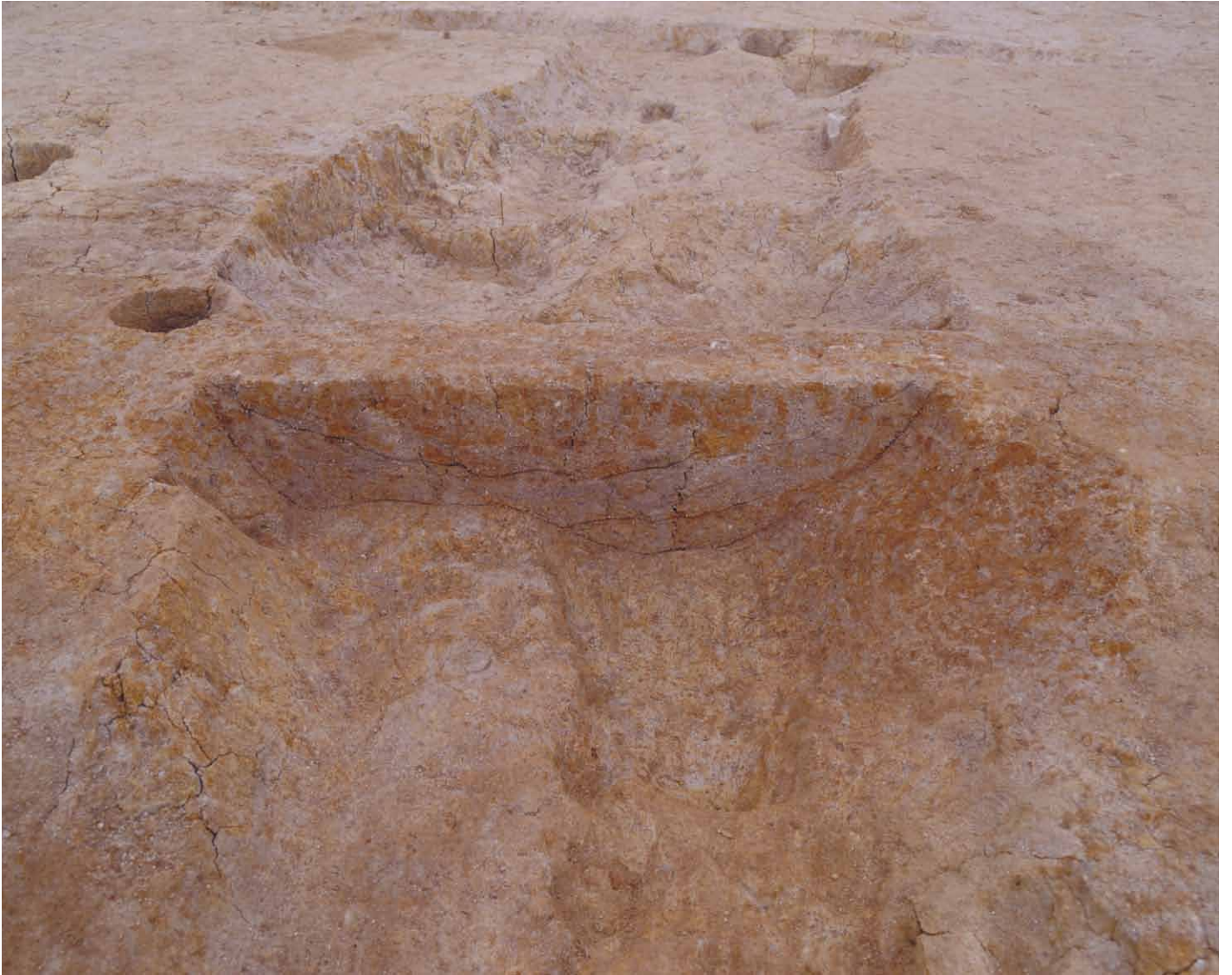
写真 11. 条坊跡第 275 次調査 275SD015 土層観察 4(南から)