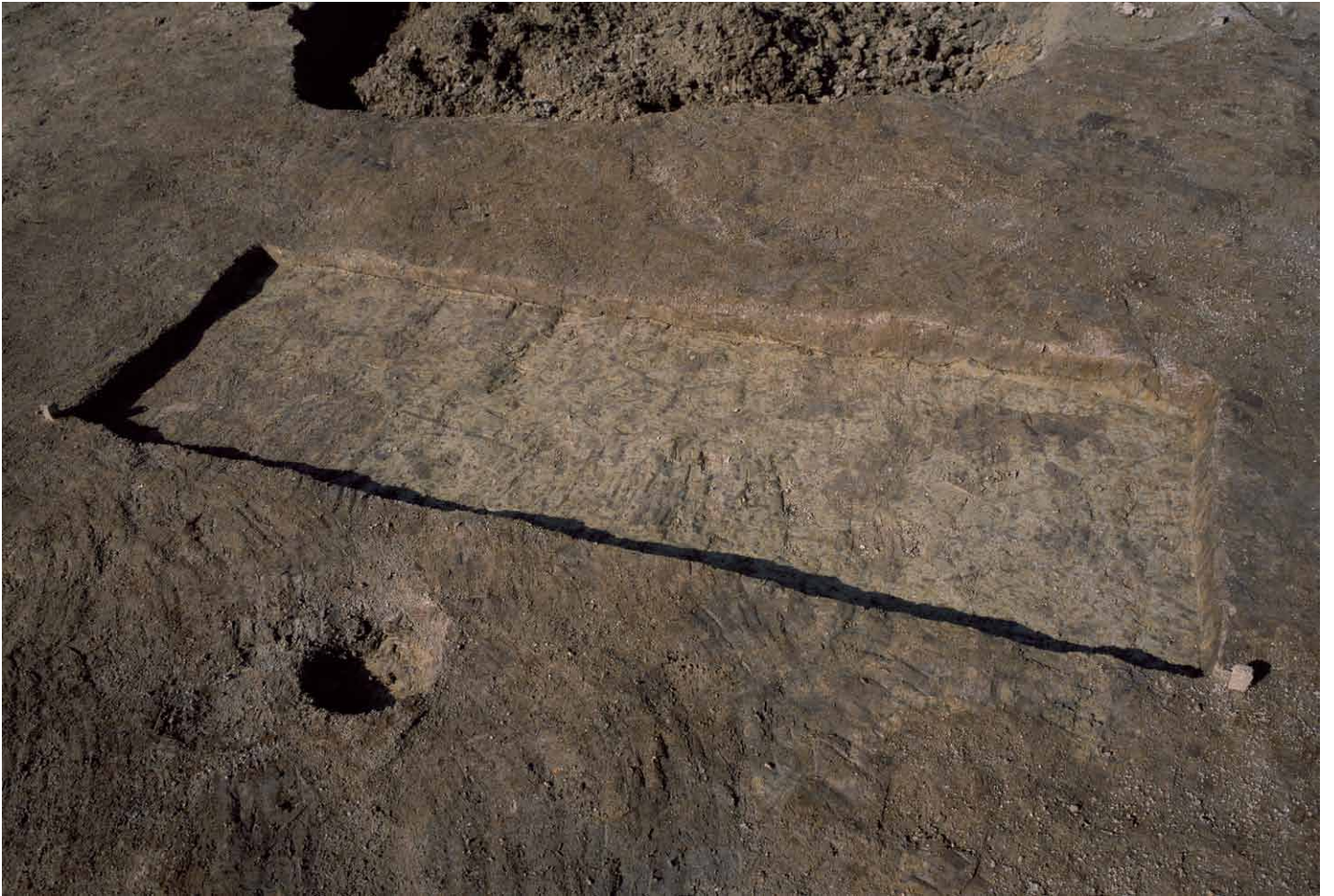
写真 303. 条坊跡第 285 次調査 調査区南部トレンチ 1 暗茶色土除去後（南から）