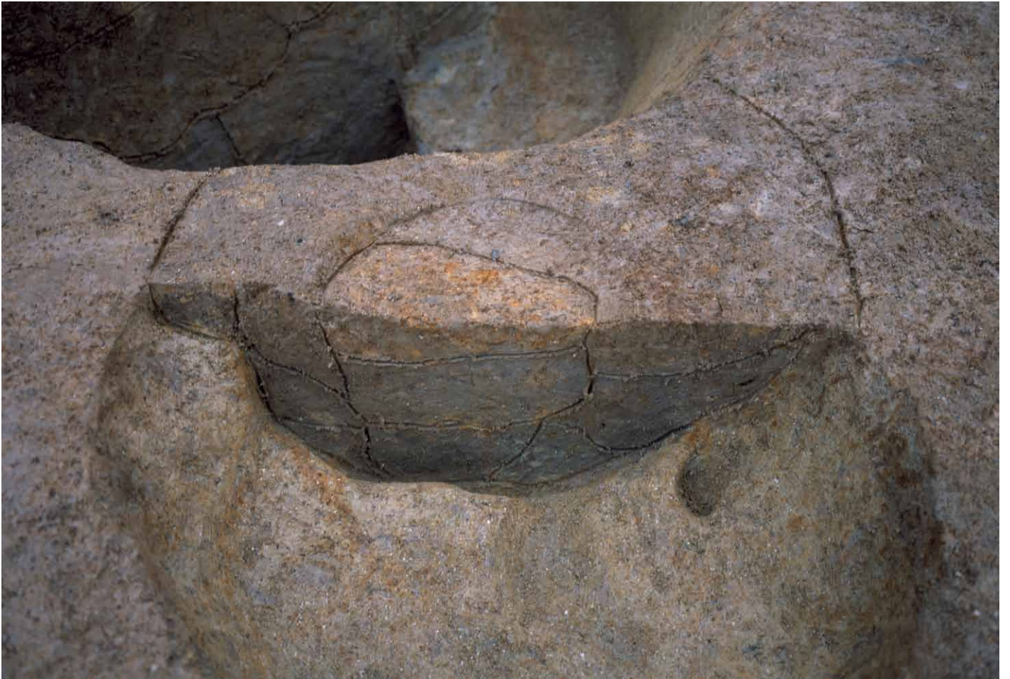
写真 287. 条坊跡第 285 次調査 285SX090 半裁（北から）