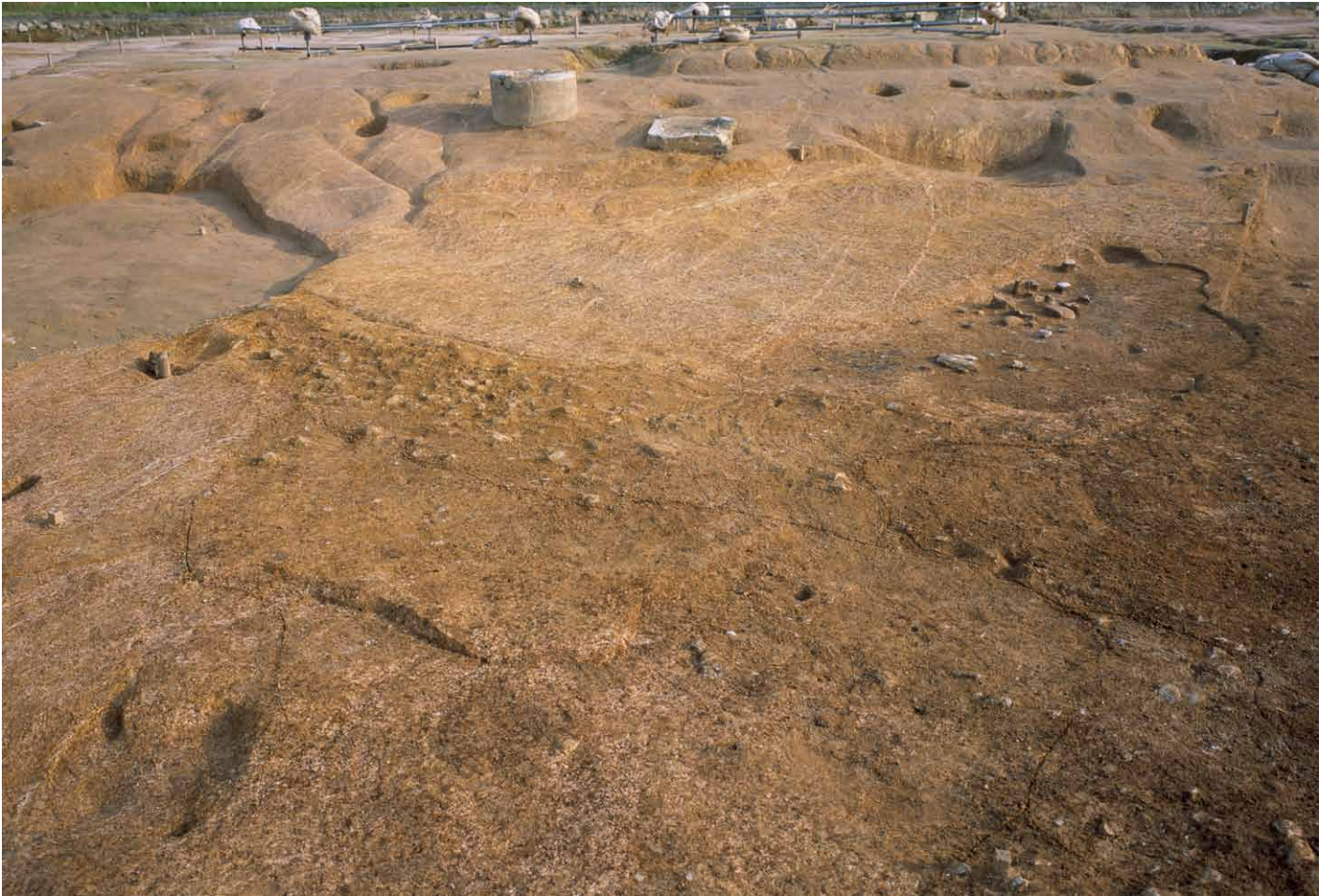
写真 278. 条坊跡第 285 次調査 285SD070 検出状況（北から）