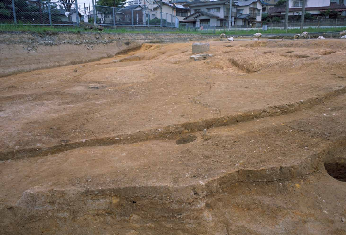
写真 266. 条坊跡第 285 次調査 285SX045 検出状況②（西から）