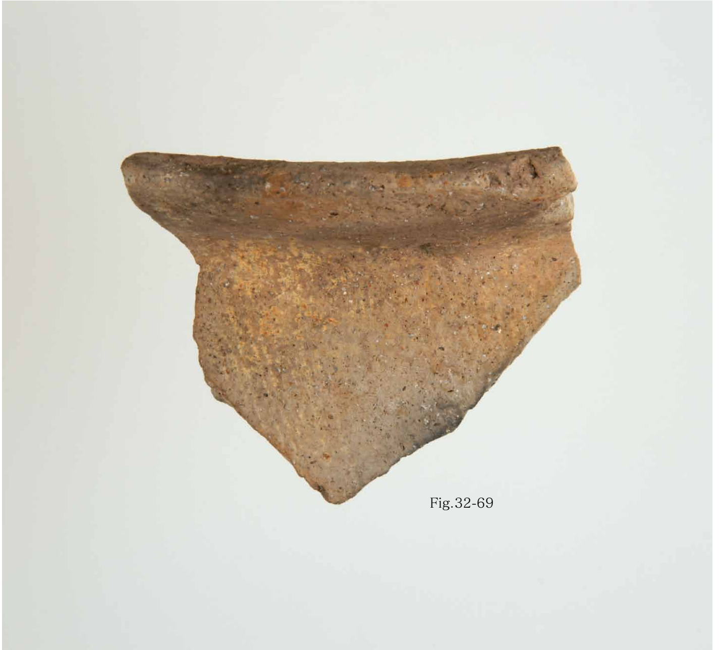
写真 118. 条 275SD265 灰色砂 口縁部