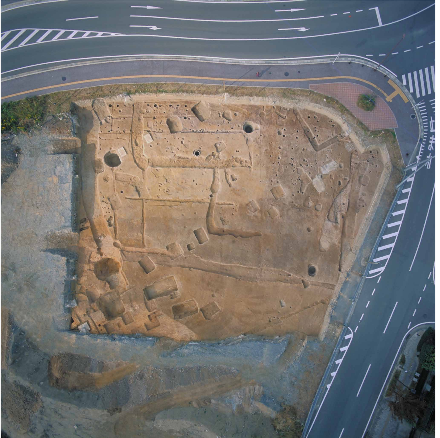
写真 2. 条坊跡第 275 次調査 空中写真 第 1 面調査区全景（上が西）