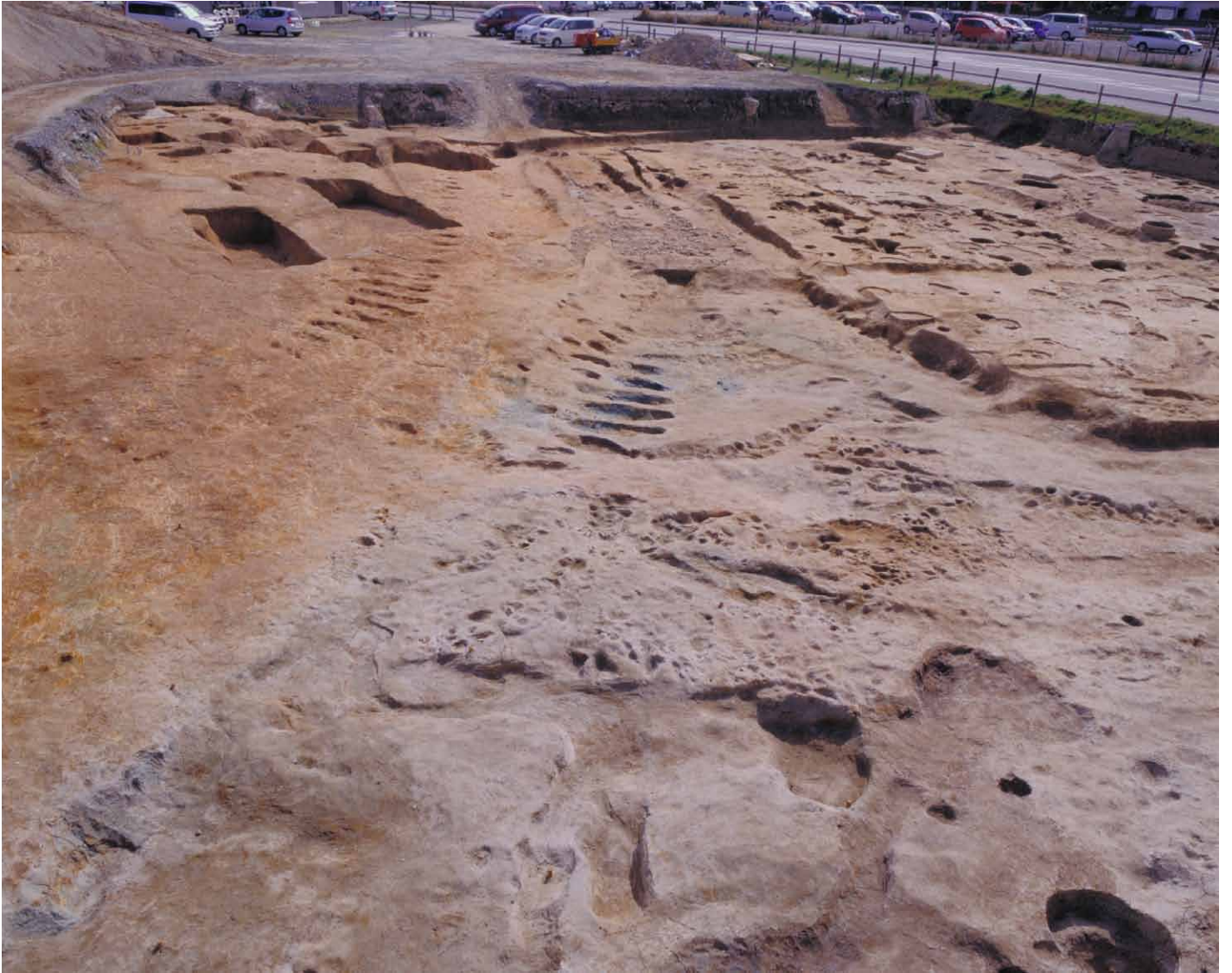
写真 61. 条坊跡第 275 次調査 坊路、交差点完掘（北から）