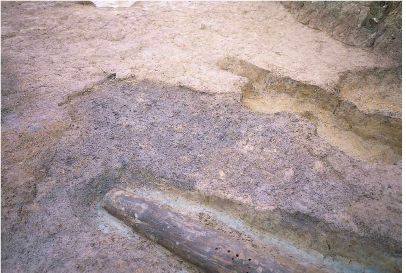
写真 286. 条坊跡第 285 次調査 285SX085 完掘状況（南から）