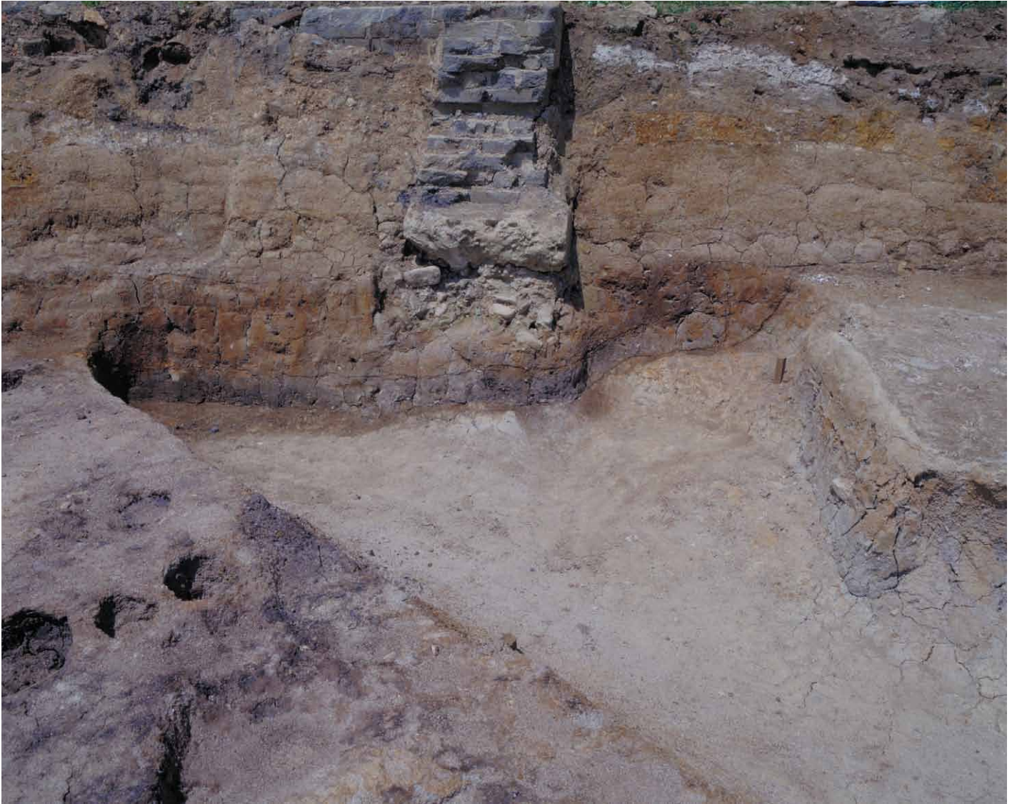
写真 26. 条坊跡第 275 次調査 275SD045 西壁土層観察（東から）