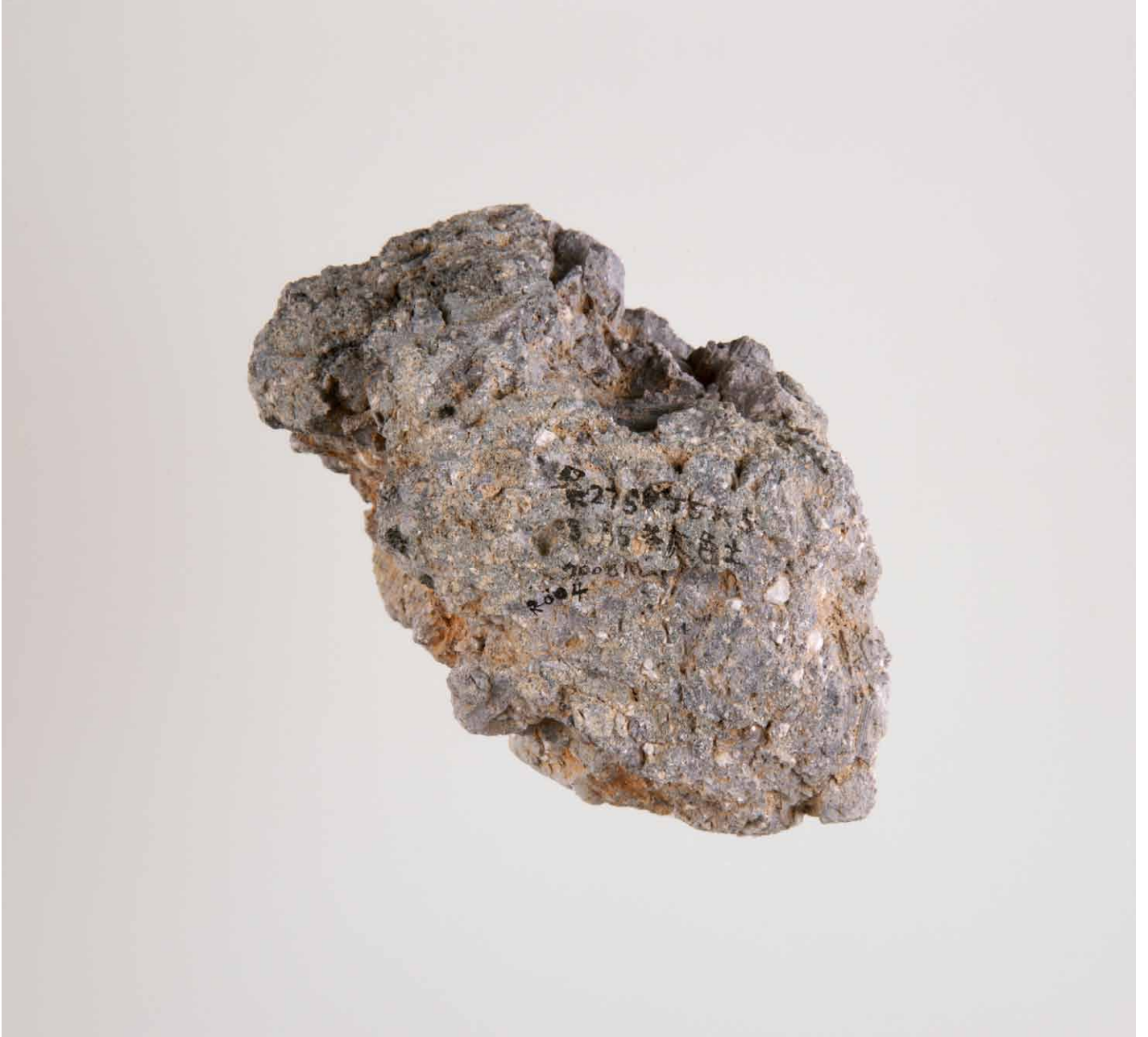
写真 84. 条 275SD035 茶灰色土