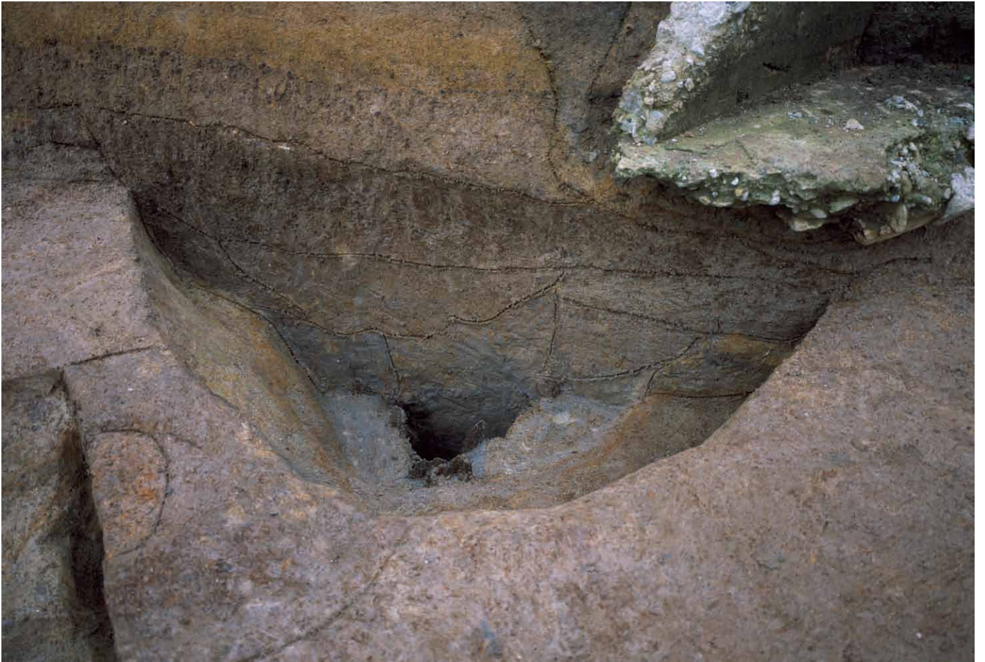
写真 226. 条坊跡第 285 次調査 285SE001 井戸枠検出状況（東から）