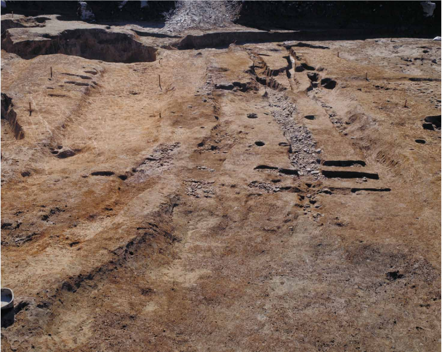
写真 58. 条坊跡第 275 次調査 275SD211. 212. 220. 224 完掘状況 K ライン以南 (北から)