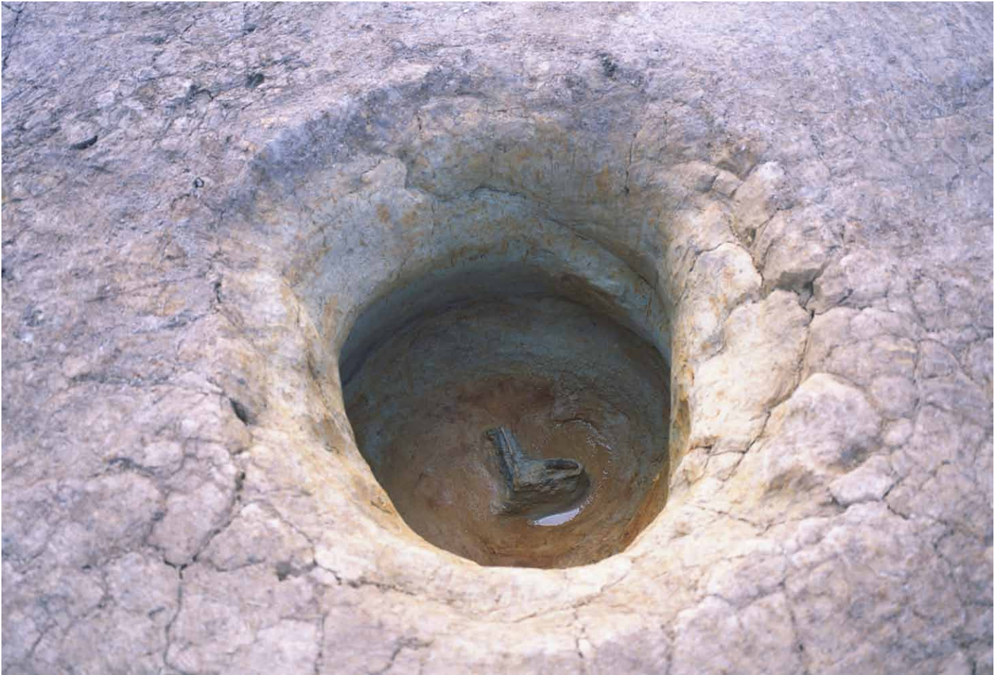
写真 250. 条坊跡第 285 次調査 285SE025 木製品陽物出土状況（東から）