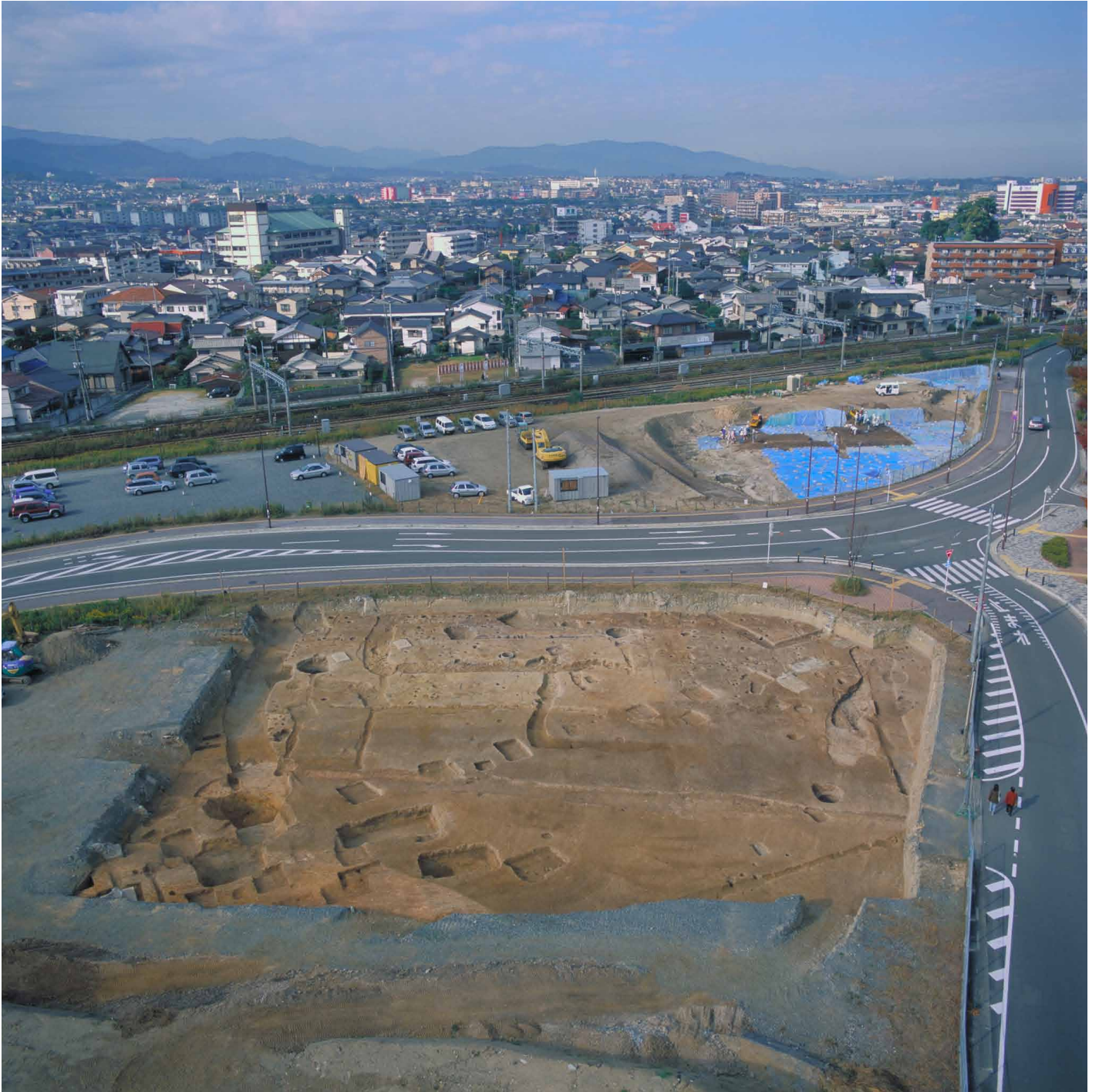
写真 3. 条坊跡第 275 次調査 空中写真 第 1 面調査区全景（東より）