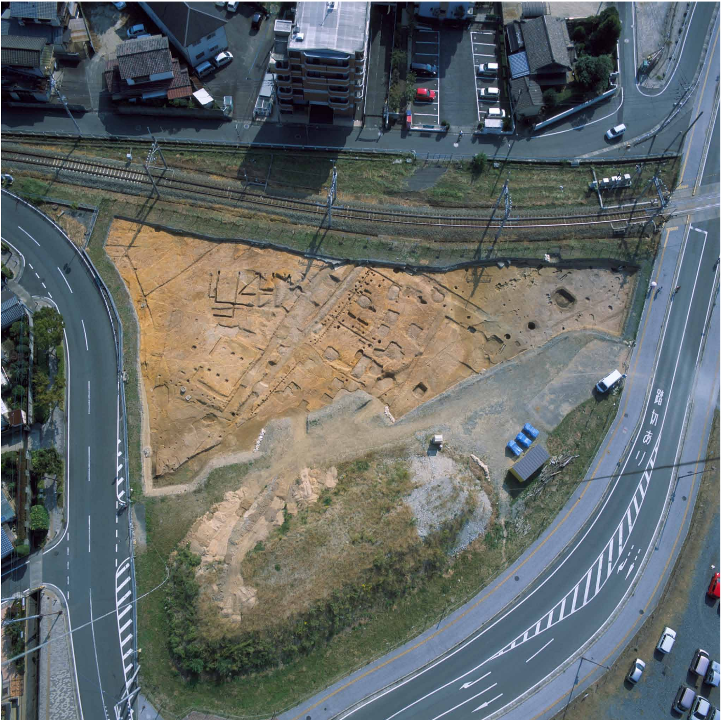
写真 215. 条坊跡第 285 次調査 空中写真 調査区 全景（上が東）