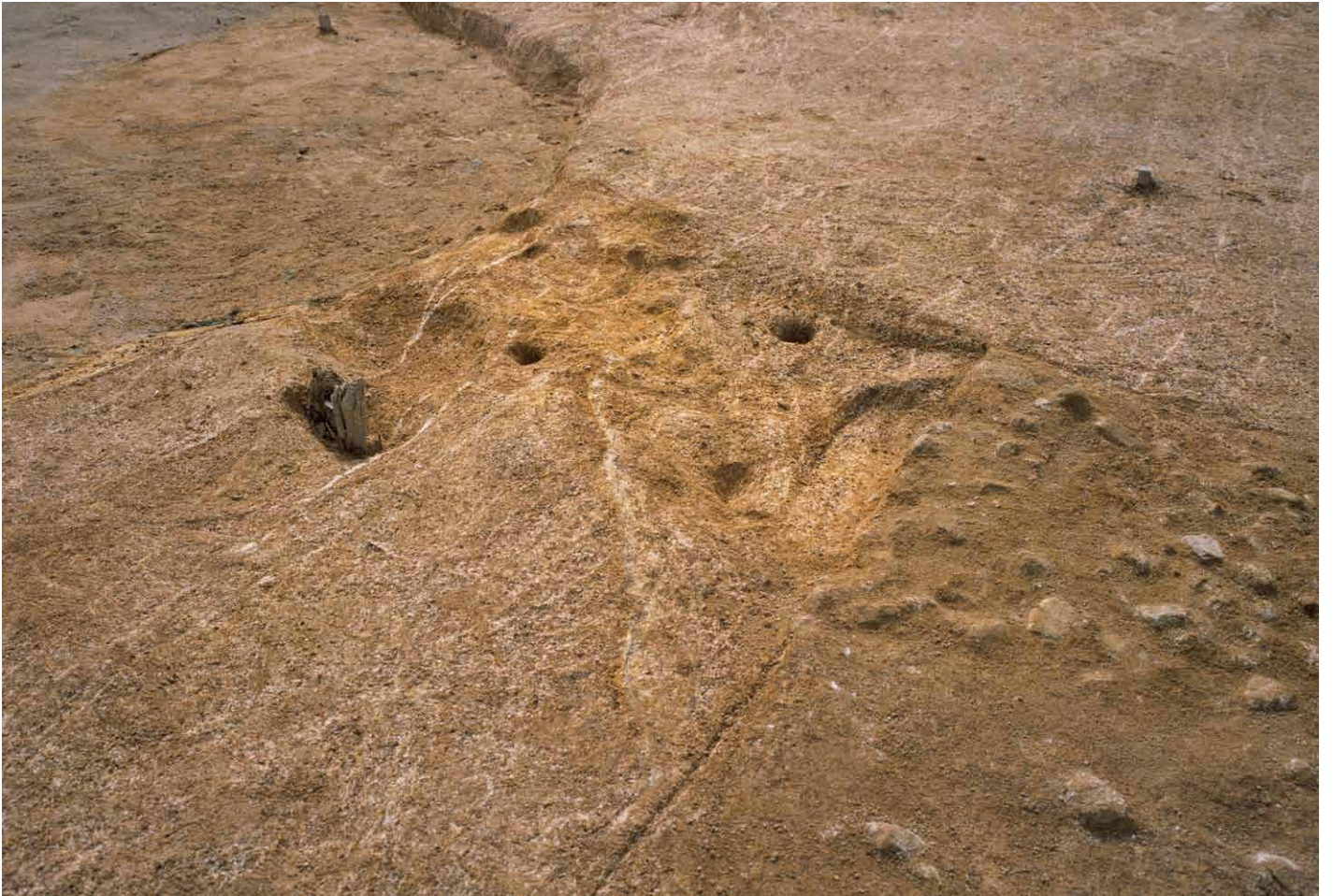
写真 279. 条坊跡第 285 次調査 285SD070 完掘状況（北西から）