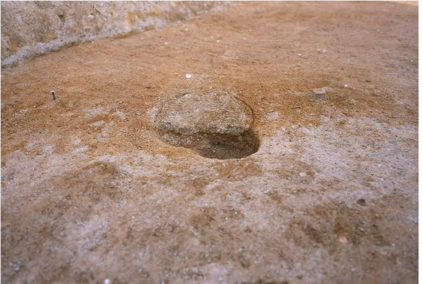
写真 270. 条坊跡第 285 次調査 285SX065a 波板状痕跡 半裁（西から）