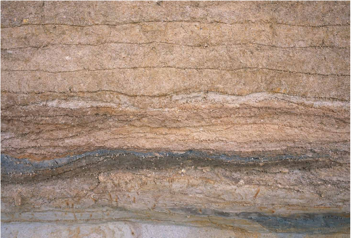
写真 294. 条坊跡第 285 次調査 調査区北壁トレンチ 土層観察②（南から）