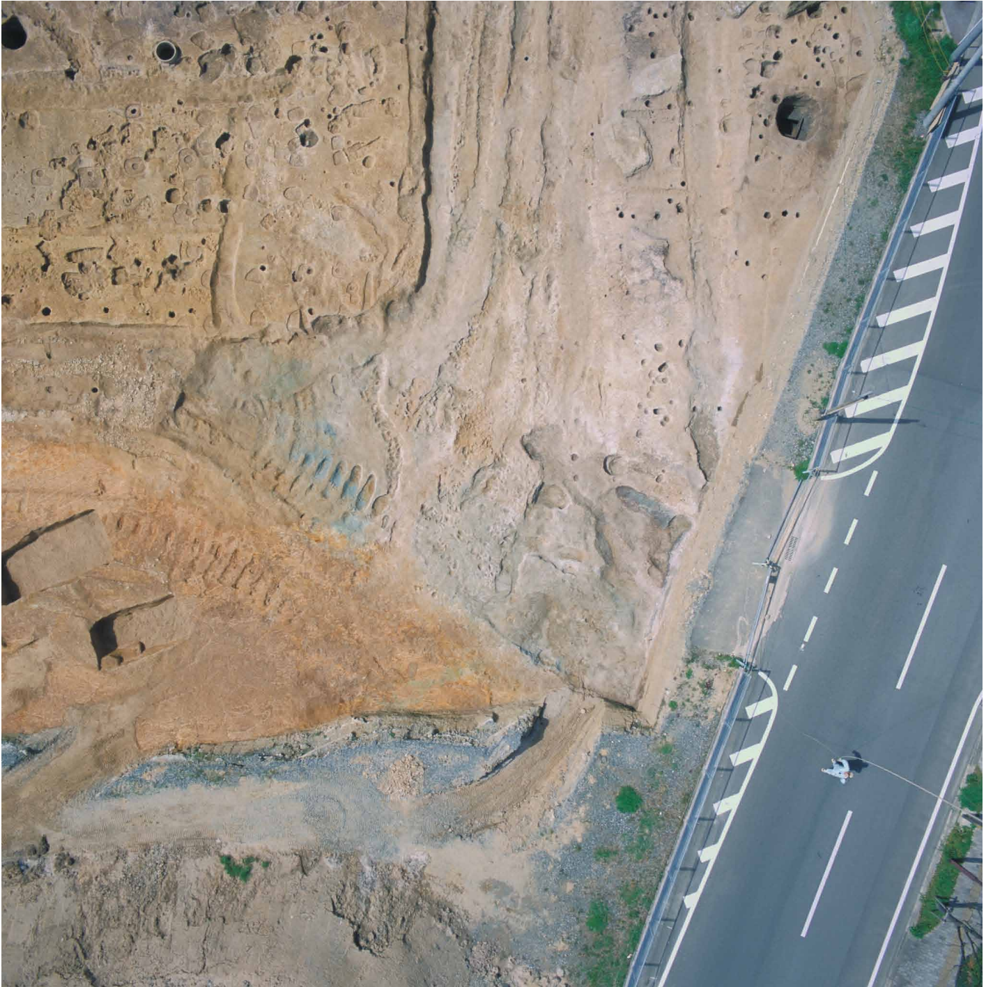
写真7. 条坊跡第275次調査 空中写真 第2面調査区全景 条坊路交差点（上が西）