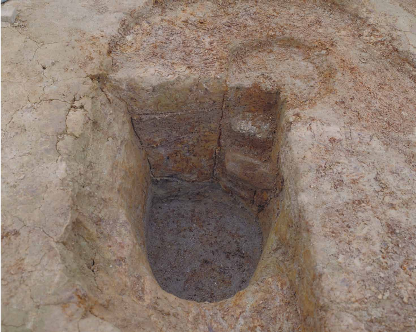
写真 45. 条坊跡第 275 次調査 275SB385a 土層観察（北から）