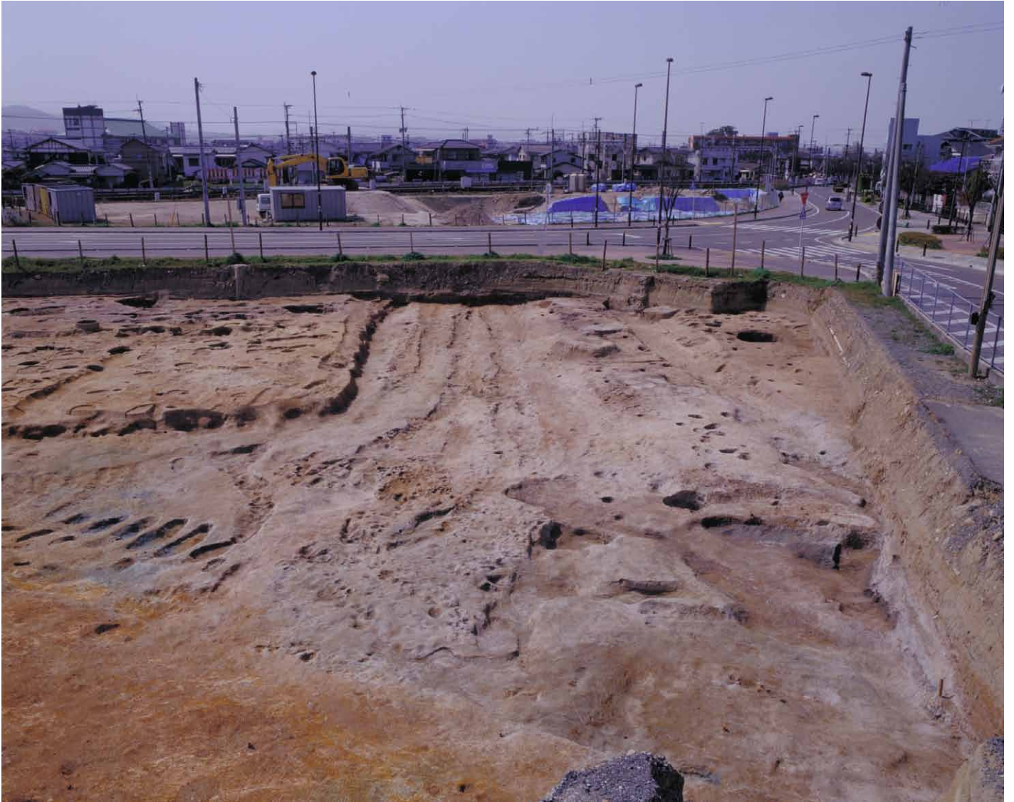
写真 62. 条坊跡第 275 次調査 条坊路交差点完掘（東から）