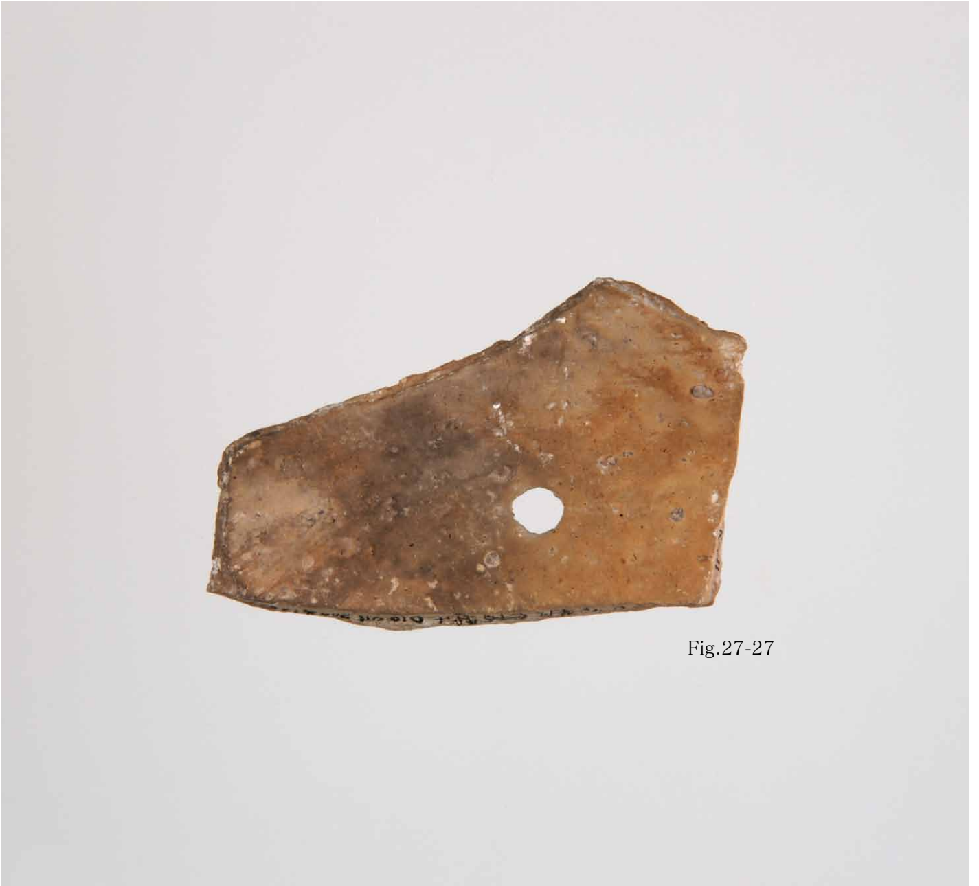
写真 88. 条 275SD045 茶灰色粘質土 R011