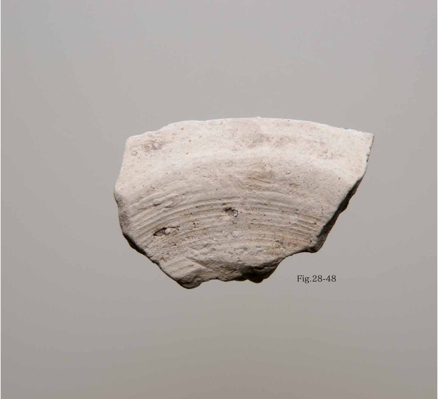
写真 92. 条 275SD045 青灰色砂