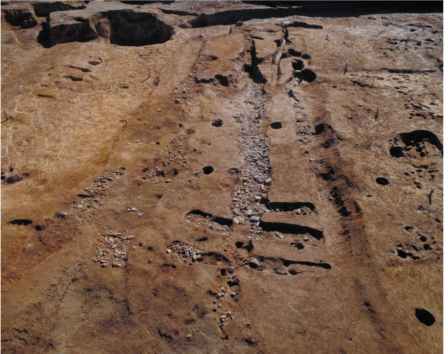
写真 59. 条坊跡第 275 次調査 275SD211. 212. 220. 222. 224 完掘状況 H ライン以南 (北から)