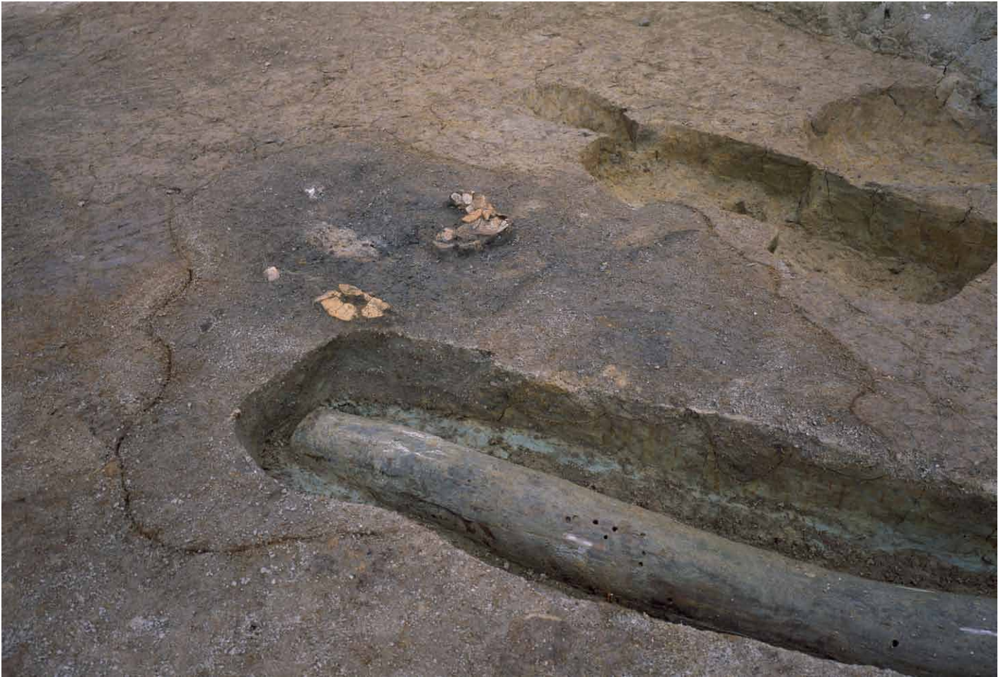
写真 285. 条坊跡第 285 次調査 285SX085 検出状況（南から）