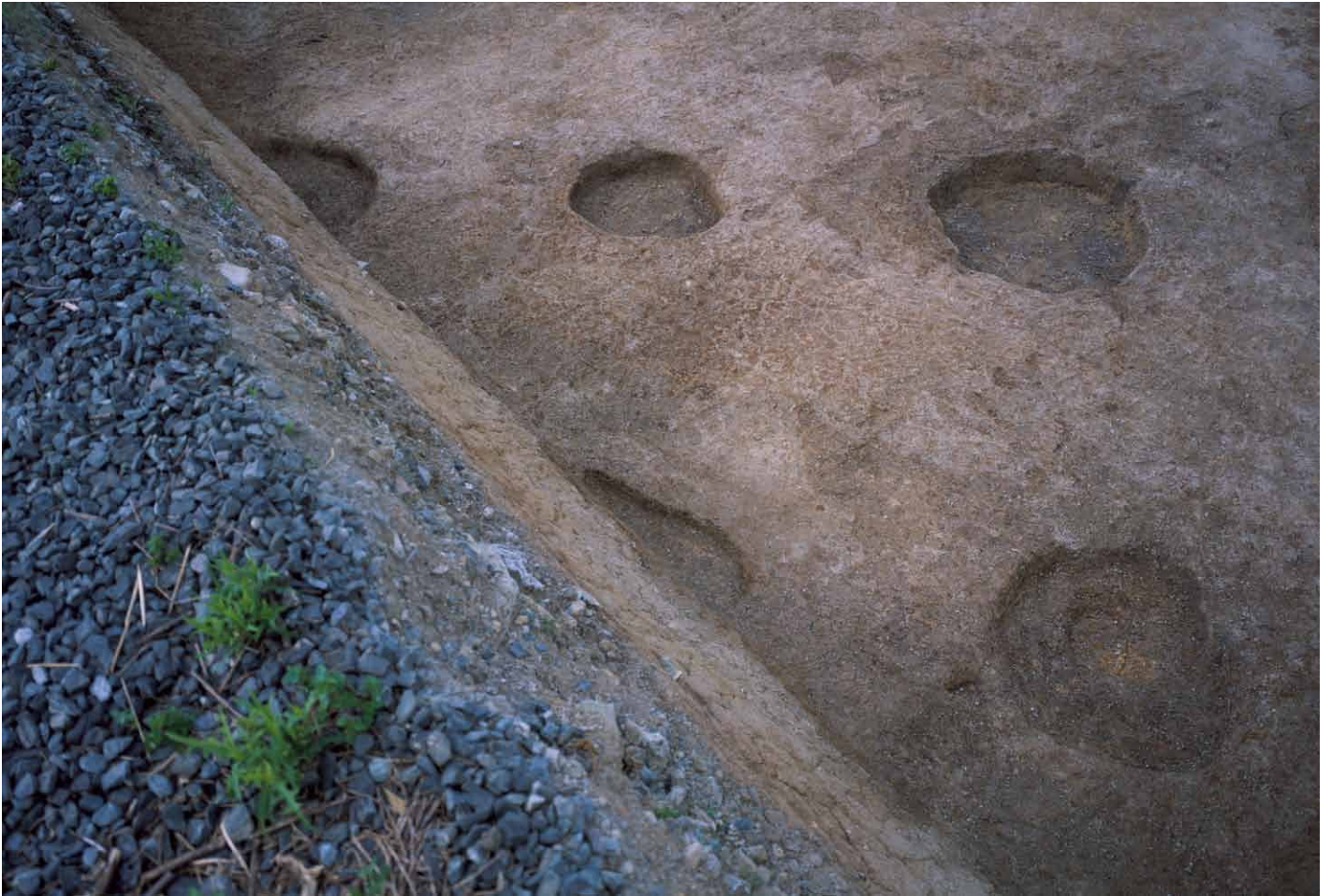
写真 233. 条坊跡第 285 次調査 285SB015 柱痕検出状況（南から）