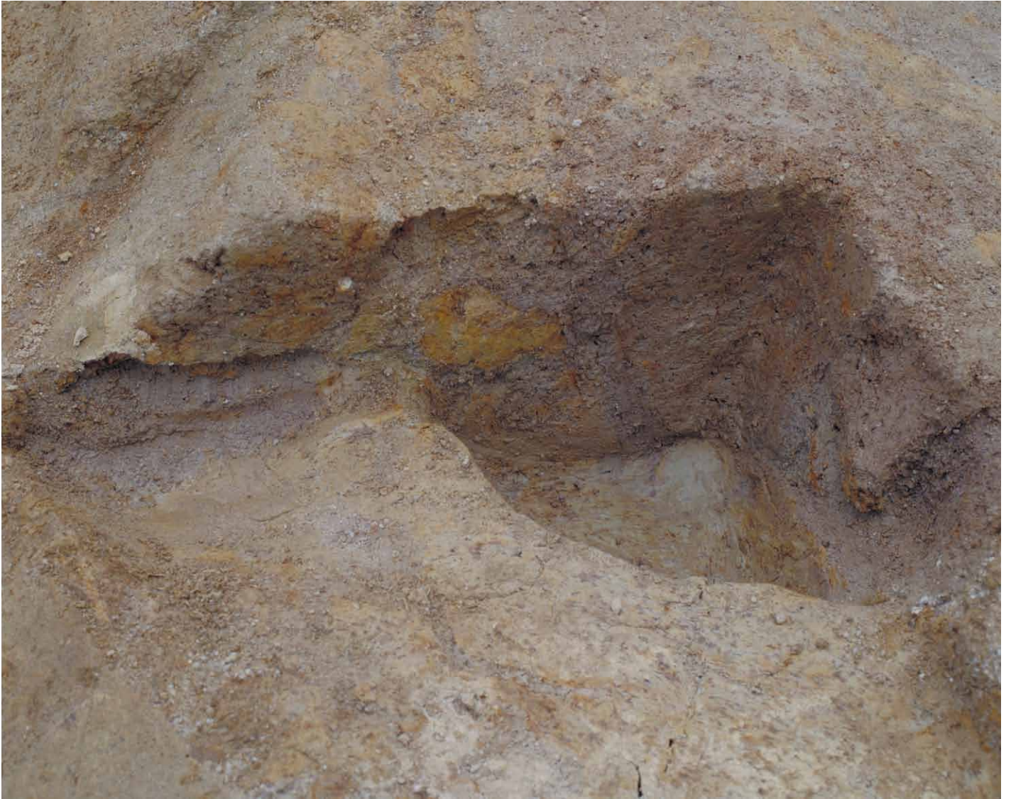
写真 53. 条坊跡第 275 次調査 275SB395d 土層観察（南から）