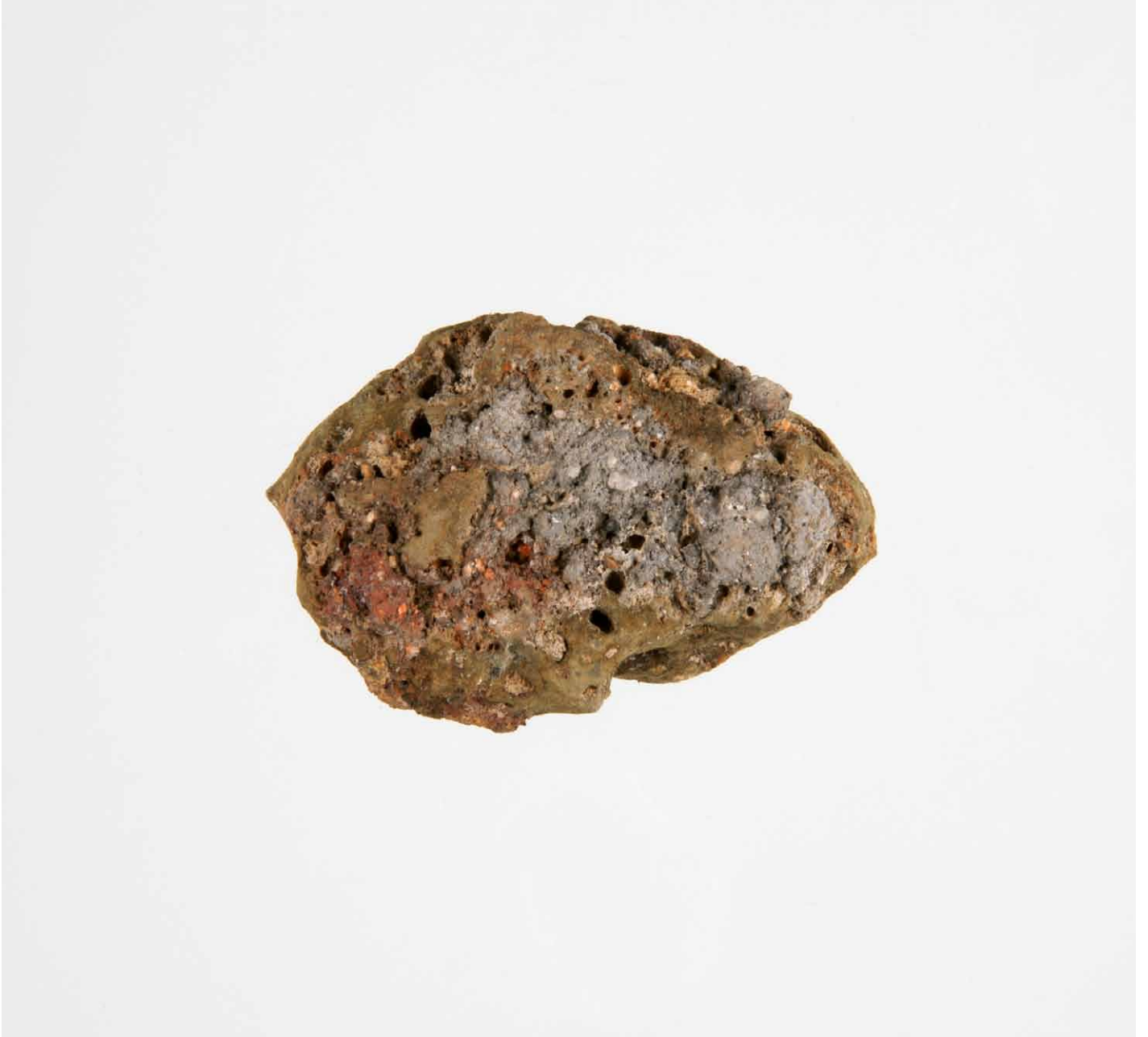
写真 97. 条 275SD065 灰色粘質土