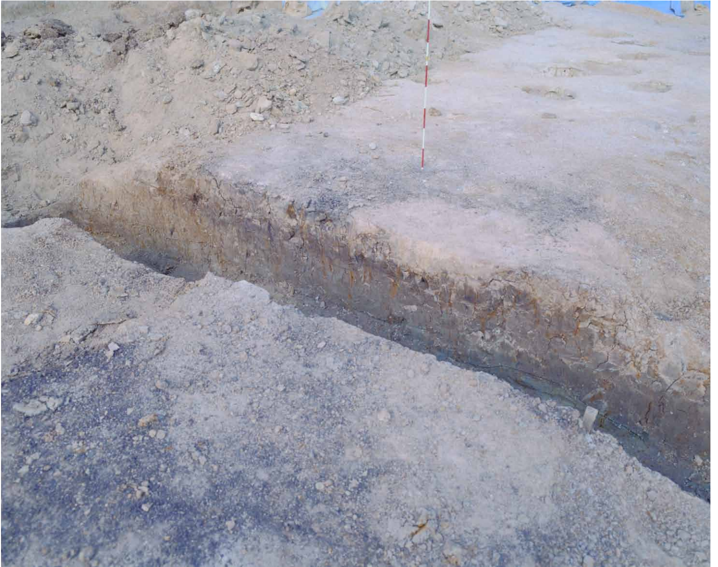
写真 77. 条坊跡第 275 次調査 断割 2 土層断面（南西から）