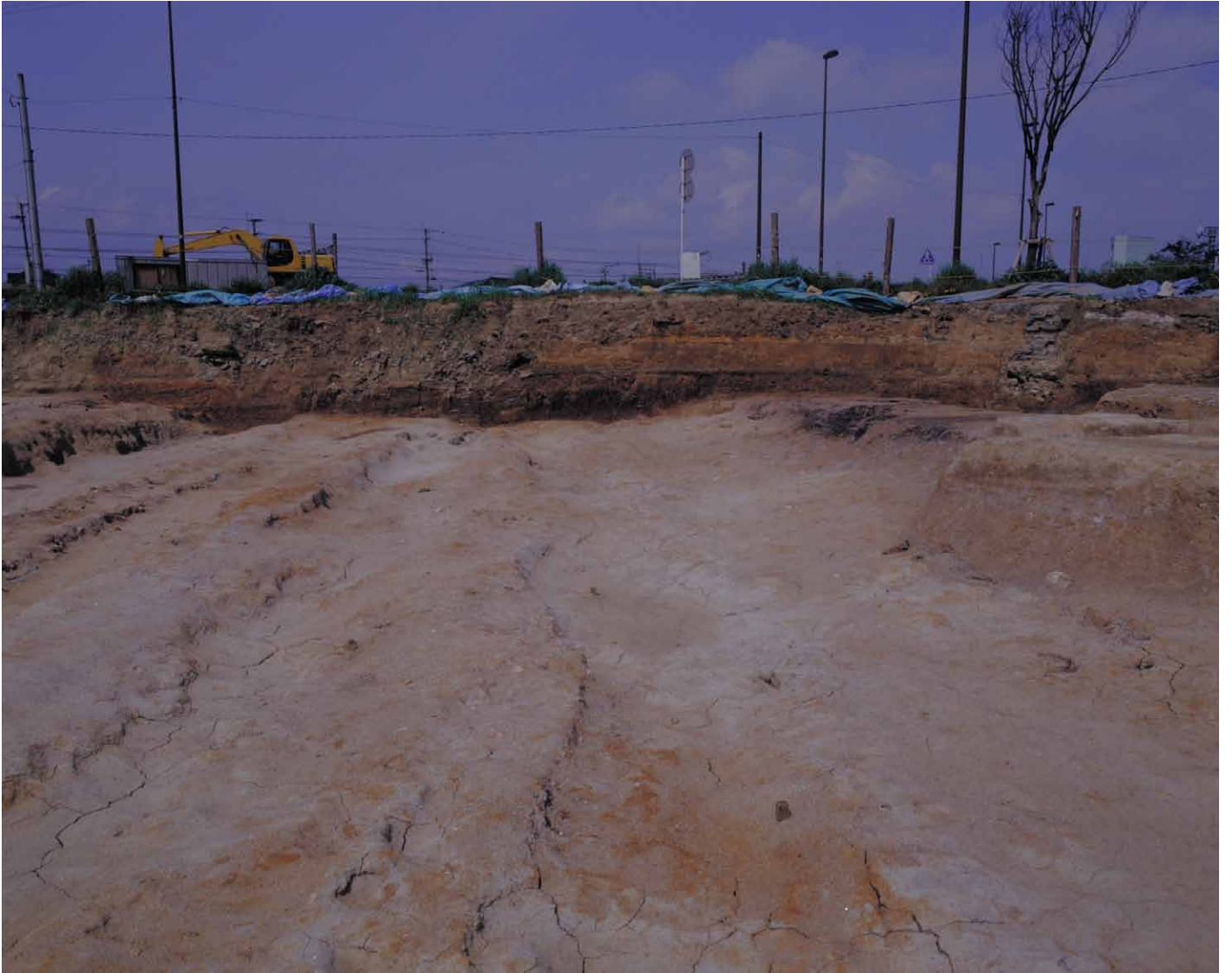
写真 74. 条坊跡第 275 次調査 西壁土層断面 K ライン以北 (東から)