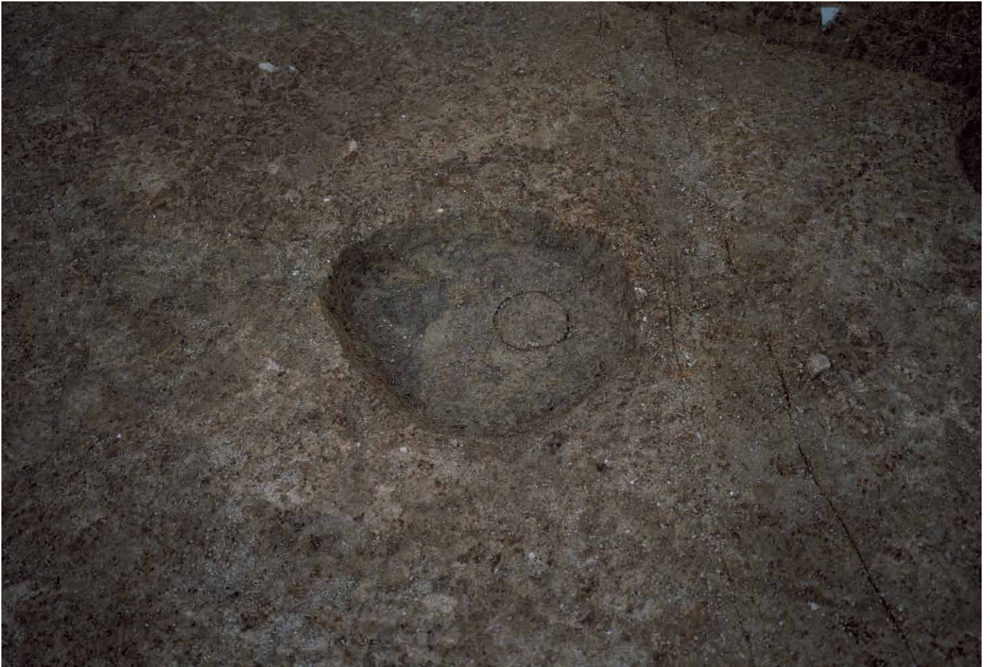
写真 238. 条坊跡第 285 次調査 285SB015c 柱痕検出状況（北から）