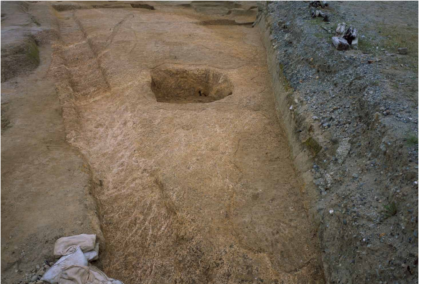
写真 283. 条坊跡第 285 次調査 285SX075・080 検出状況（北から）