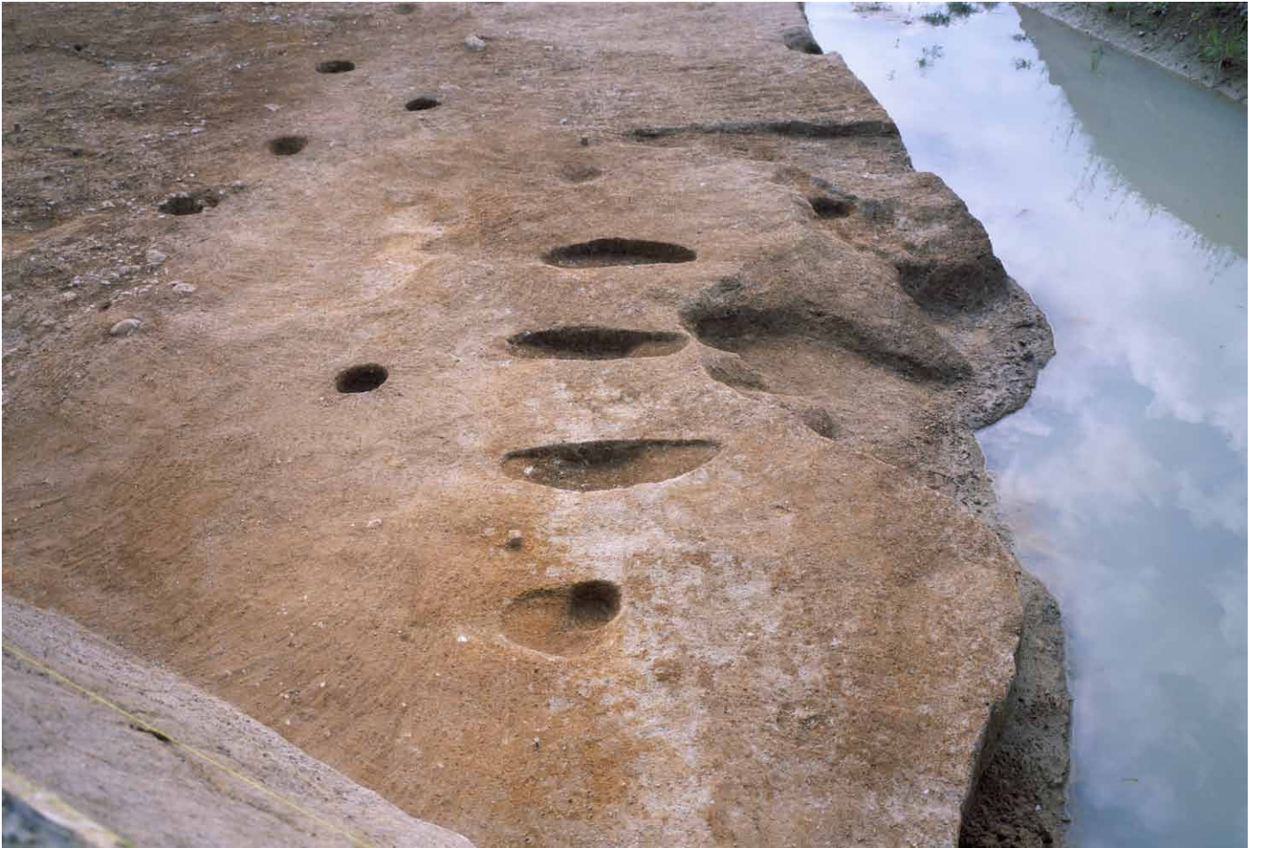
写真 276. 条坊跡第 285 次調査 285SX065a ~ d 完掘状況（北から）