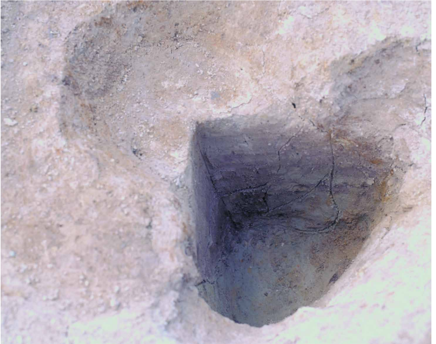
写真 43. 条坊跡第 275 次調査 275SB195f 土層観察（北から）