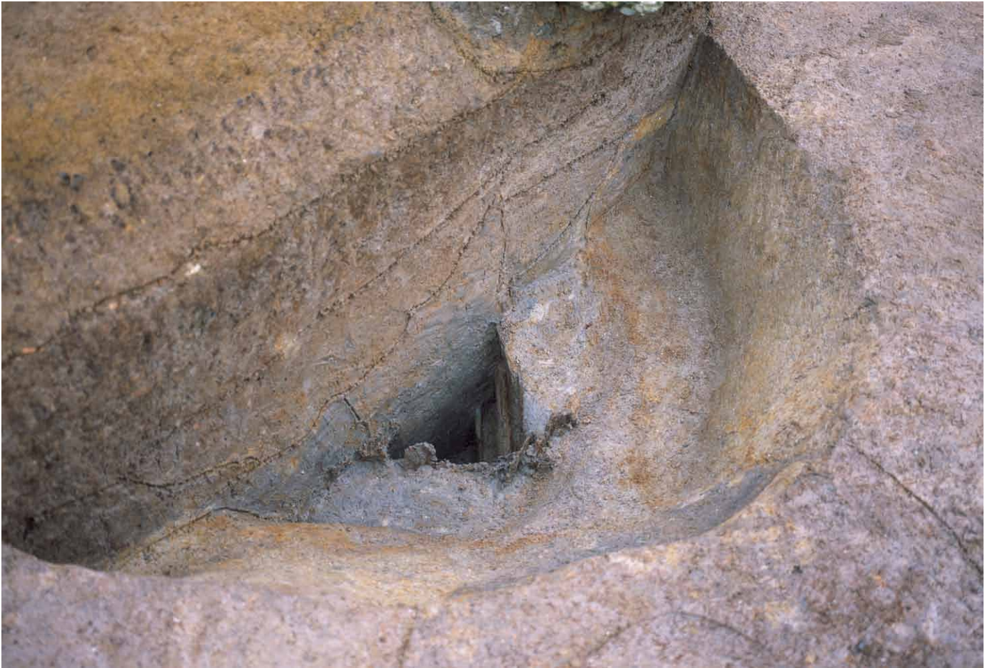
写真 227. 条坊跡第 285 次調査 285SE001 井戸枠内掘り下げ（北から）