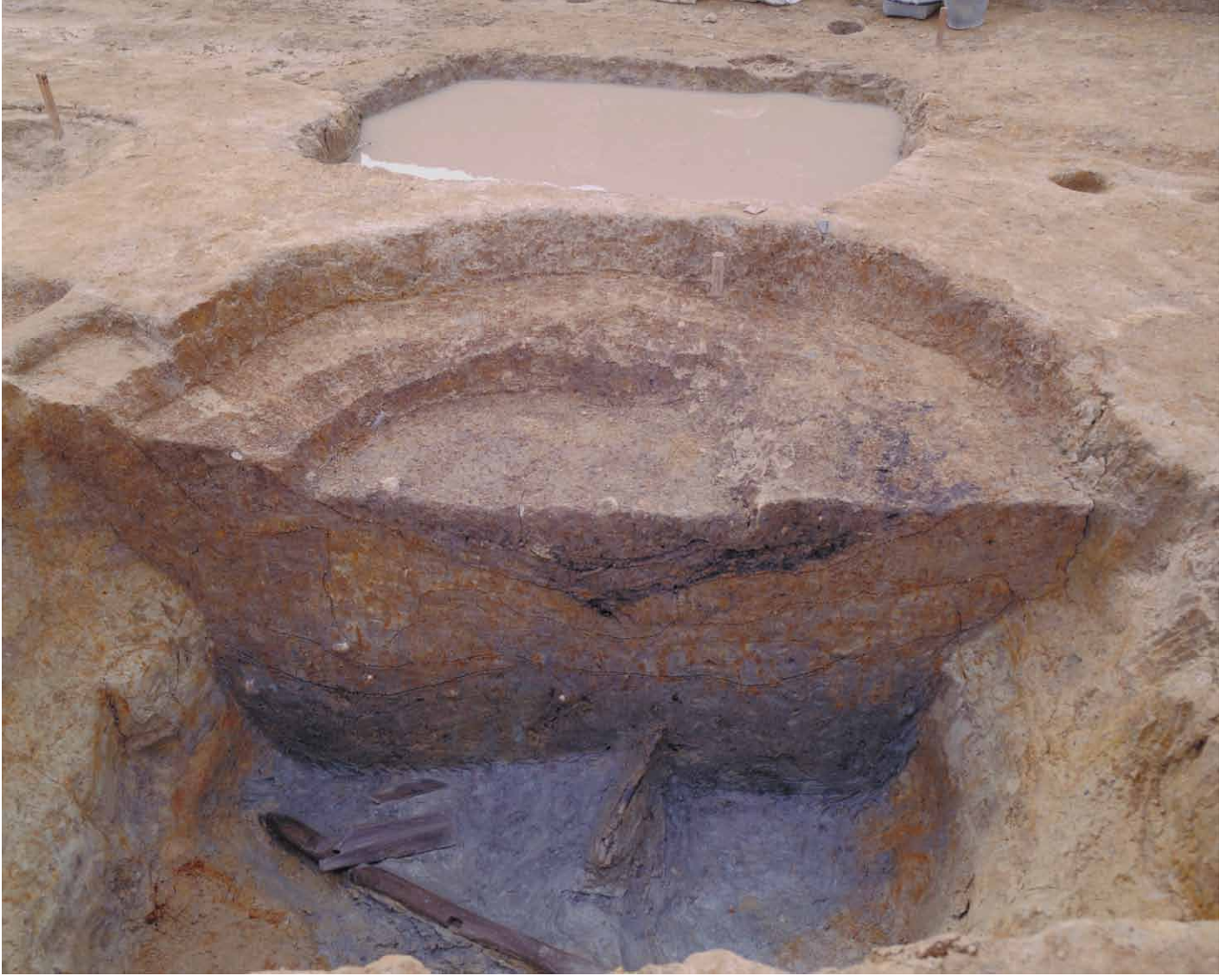
写真 9. 条坊跡第 275 次調査 275SE005 土層観察 1(北西から)