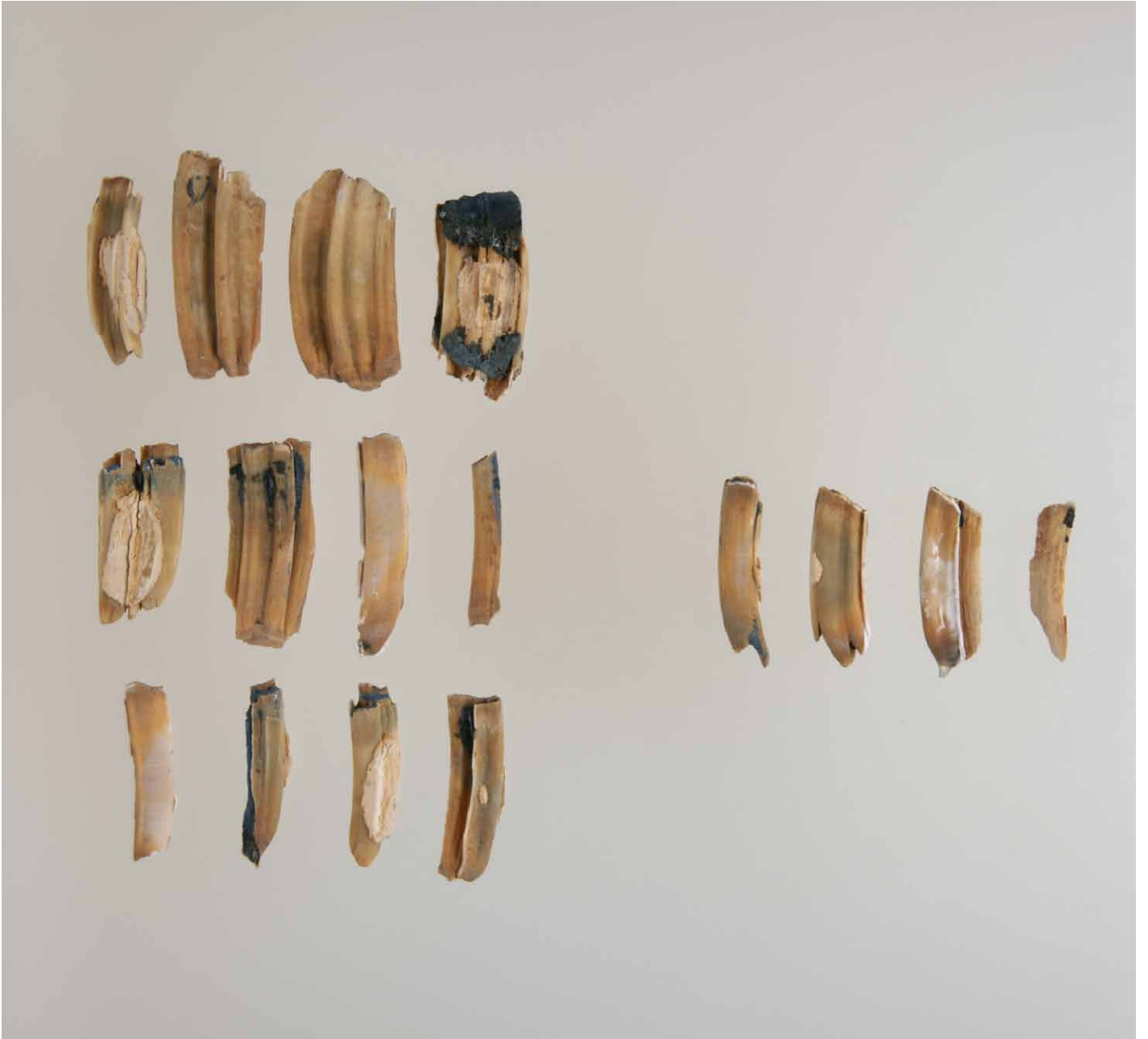
写真 173. 条 275SX360 骨集合