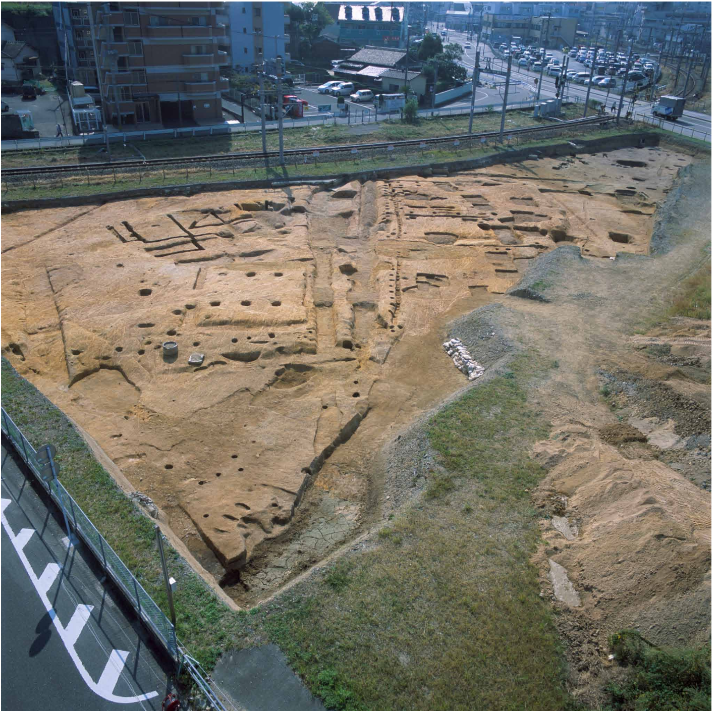
写真 220. 条坊跡第 285 次調査 空中写真 調査区中央 西鉄操車場跡関係（上が東）