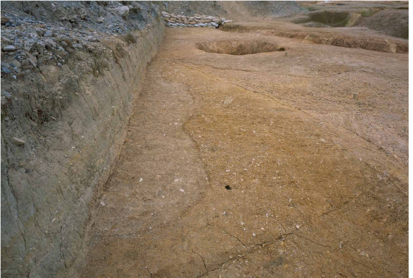
写真 284. 条坊跡第 285 次調査 285SX075・080 検出状況（南から）