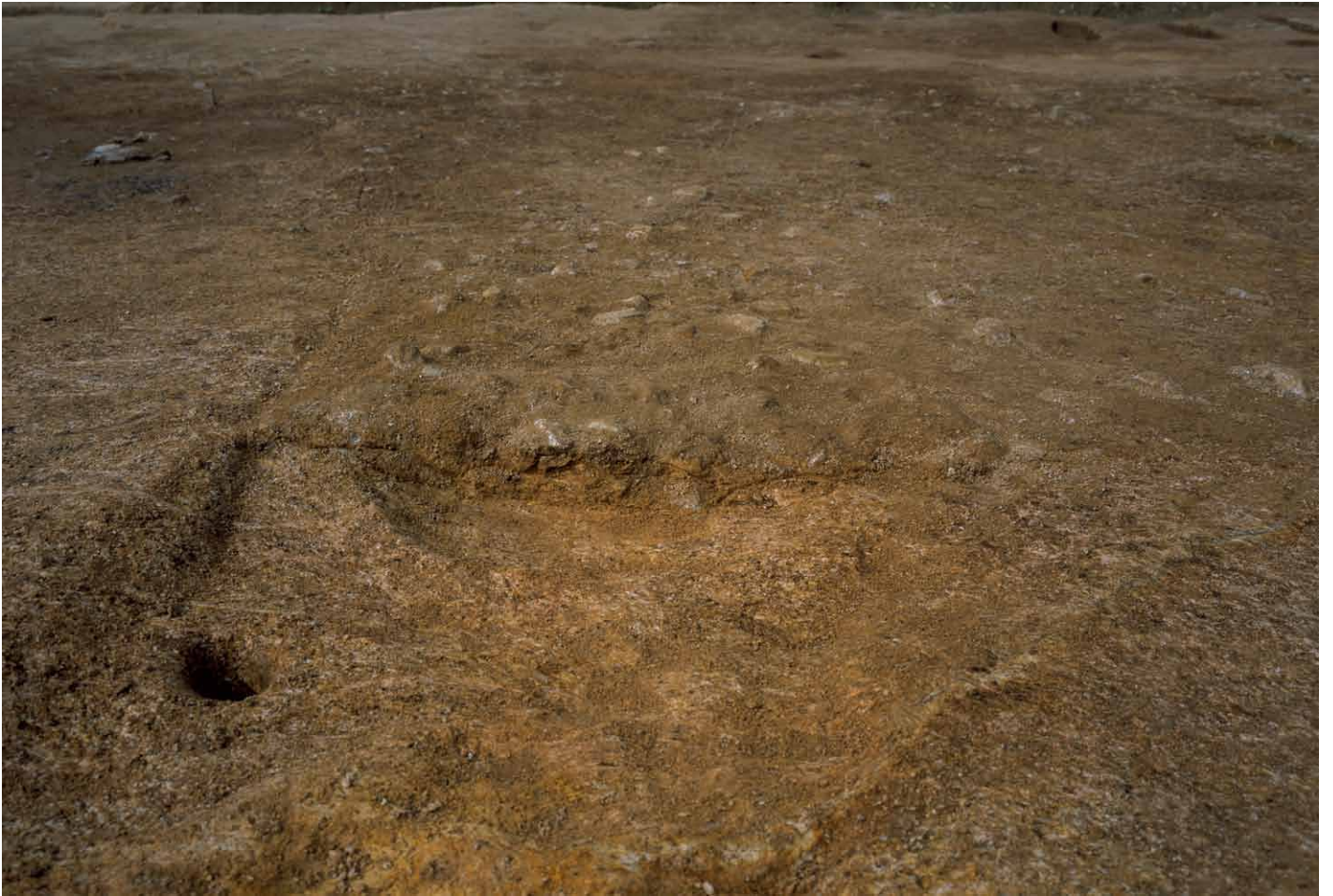
写真 280. 条坊跡第 285 次調査 285SD070 半裁後 土層観察（東から）