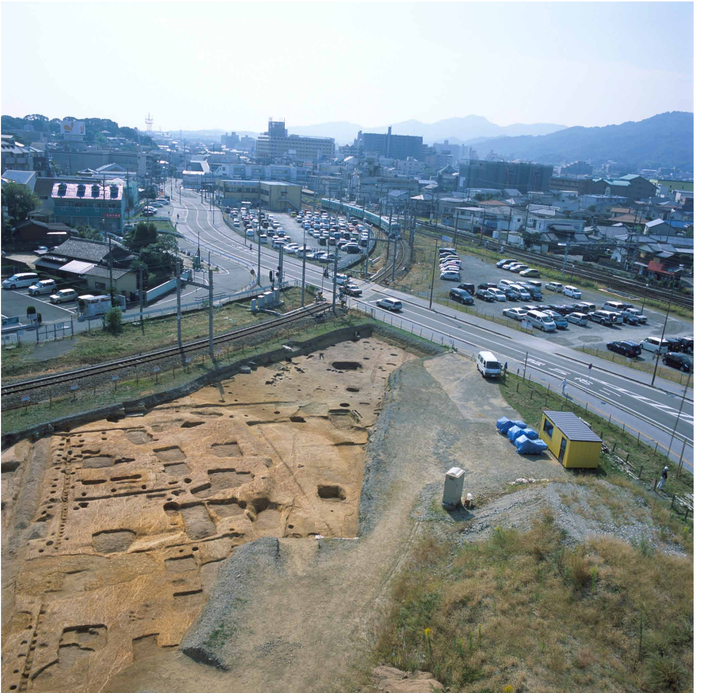
写真 217. 条坊跡第 285 次調査 空中写真 調査区から二坊路を望む（上が南）