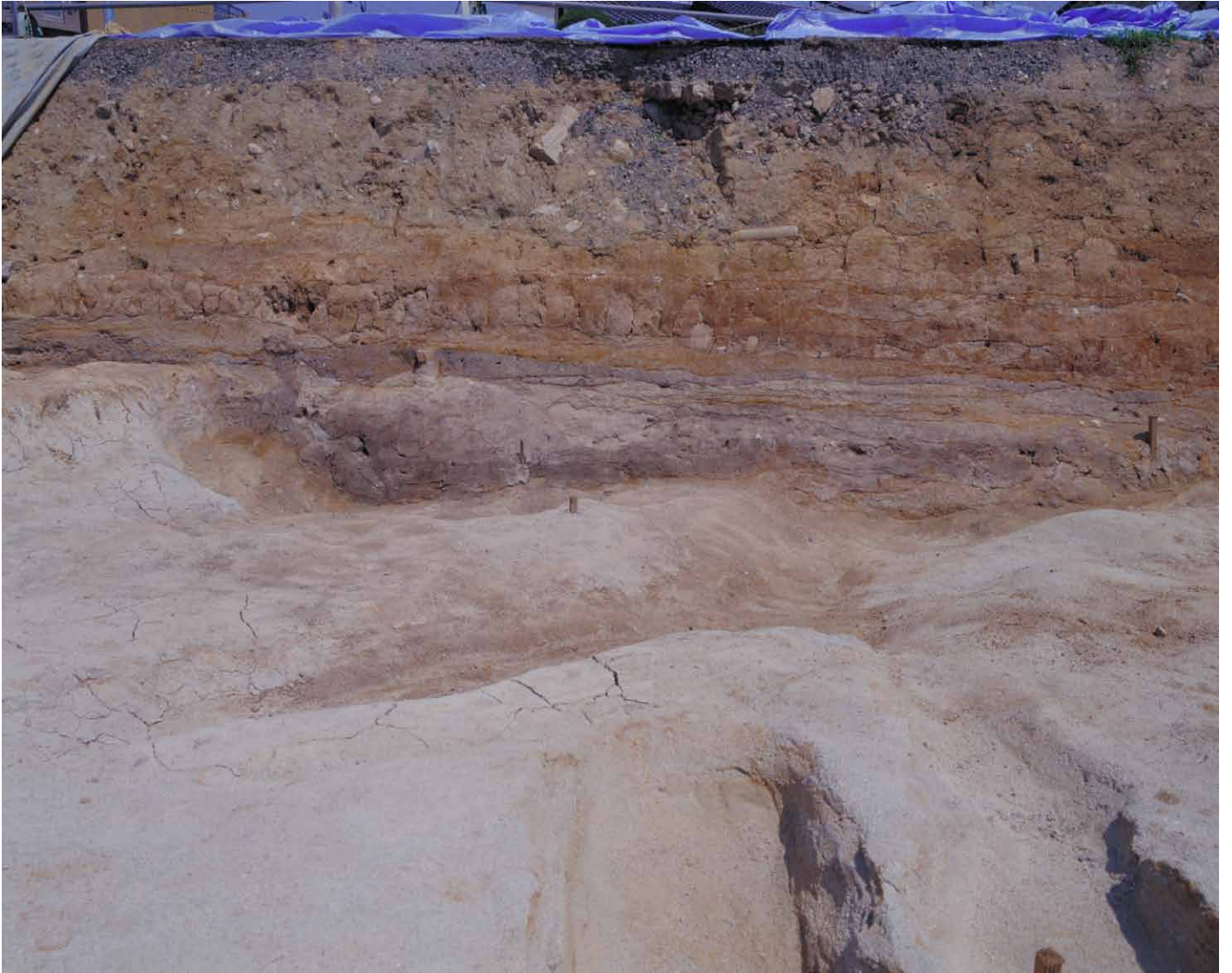
写真 73. 条坊跡第 275 次調査 北壁土層観察 4.5 ライン付近 (南から)