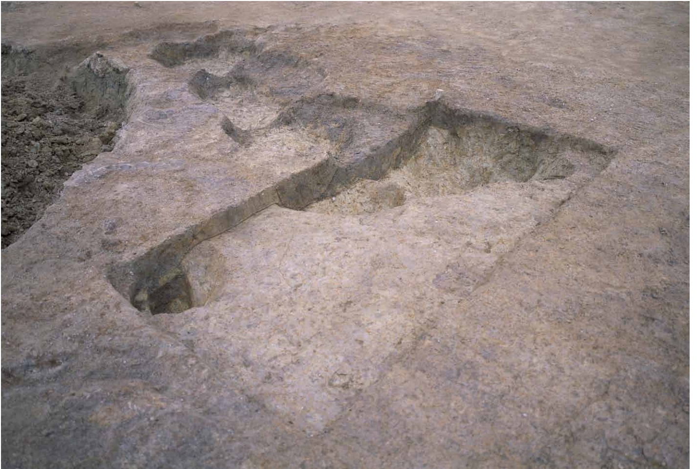
写真 307. 条坊跡第 285 次調査 調査区南部トレンチ 3 ② (南東から)