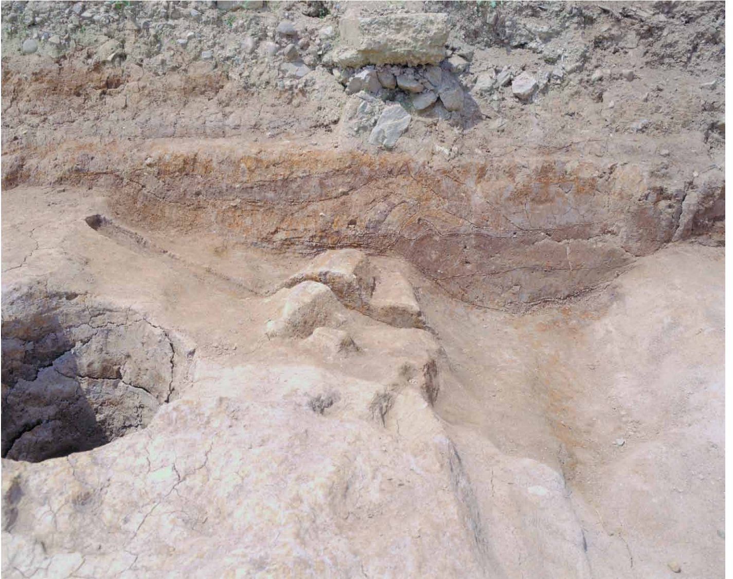
写真 39. 条坊跡第 275 次調査 西壁土層観察 275SX060 付近（東から）