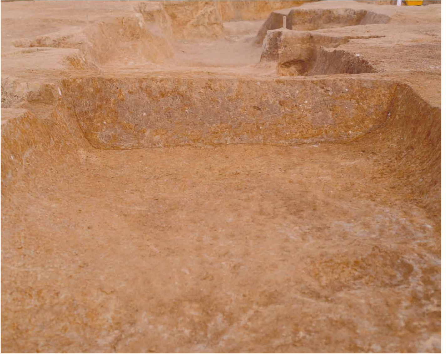
写真 14. 条坊跡第 275 次調査 275SD040 土層観察 1(南から)