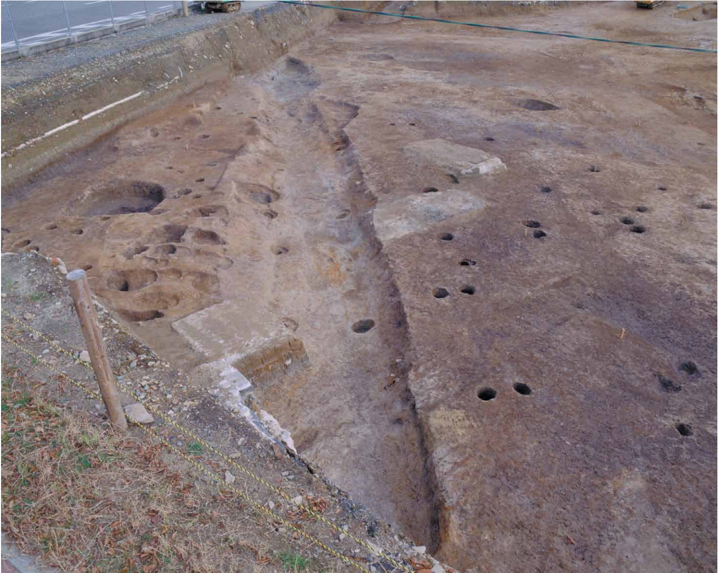
写真 20. 条坊跡第 275 次調査 275SD045 0 ライン完掘 (西から)