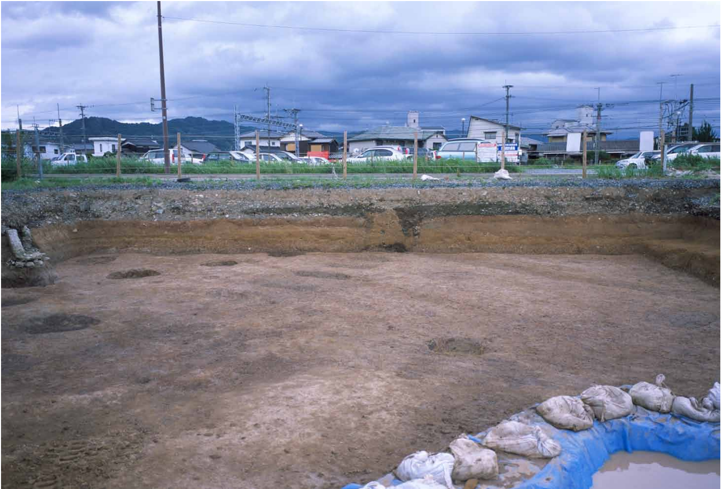
写真 309. 条坊跡第 285 次調査 AB18 ～ AD20 調査区南壁土層（北から）