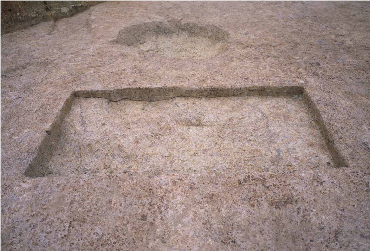
写真 305. 条坊跡第 285 次調査 調査区南部トレンチ 2 ② (南から)