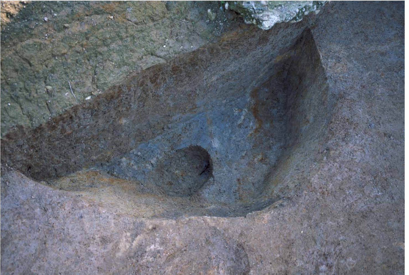
写真 224. 条坊跡第 285 次調査 285SE001 枠内埋土検出状況（北から）