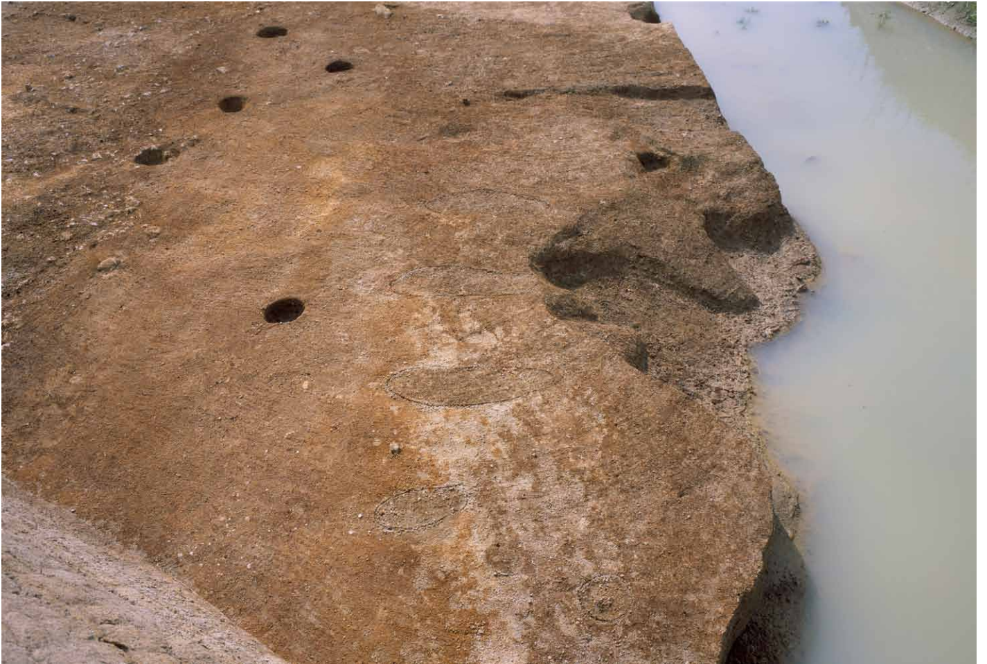
写真 271. 条坊跡第 285 次調査 285SX065a ~ d 波板状痕跡 検出状況 (北から)