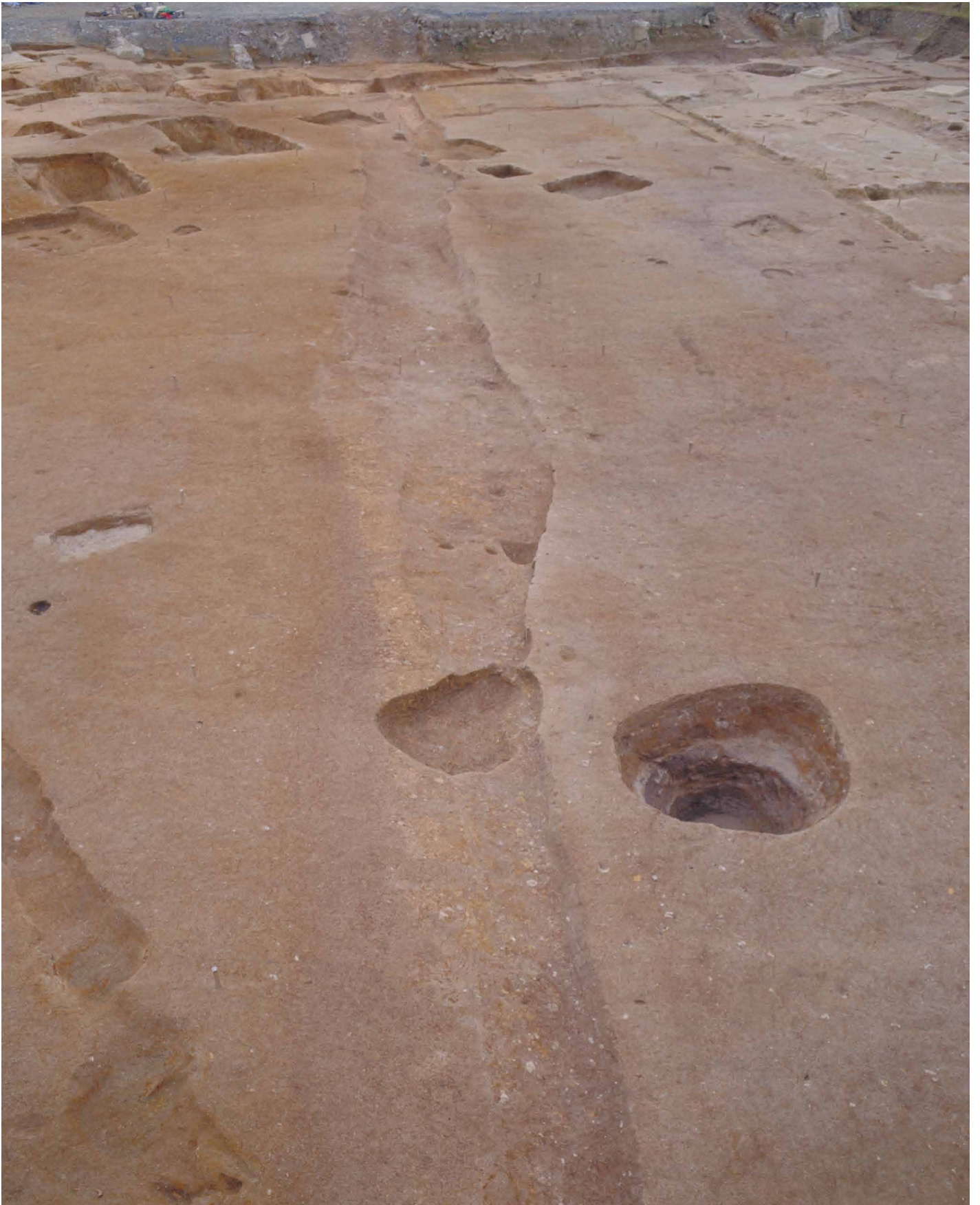
写真 13. 条坊跡第 275 次調査 275SD035 完掘（北から）