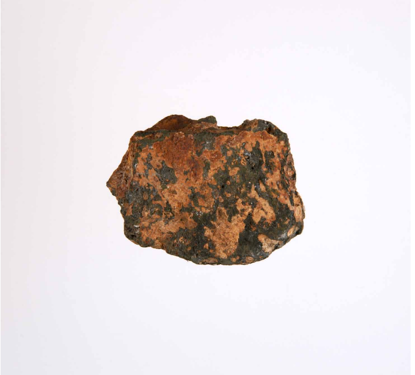
写真 156. 条 275SF270 裏