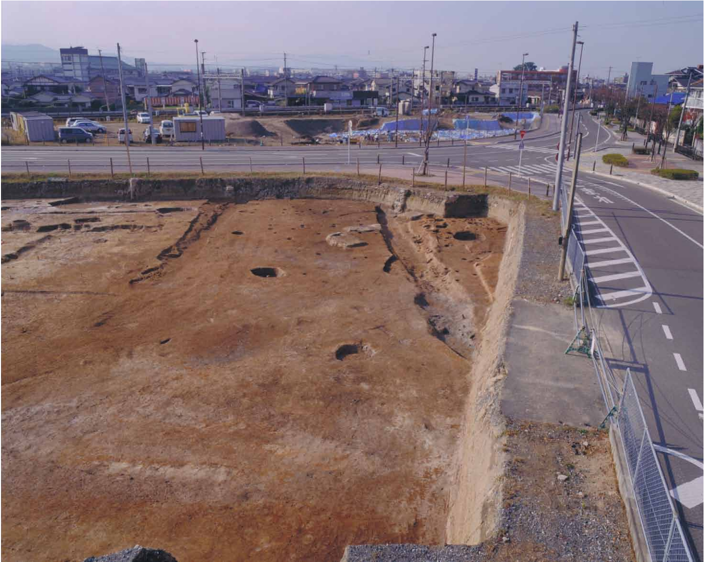
写真 25. 条坊跡第 275 次調査 275SD045-275S050 間完掘（東から）