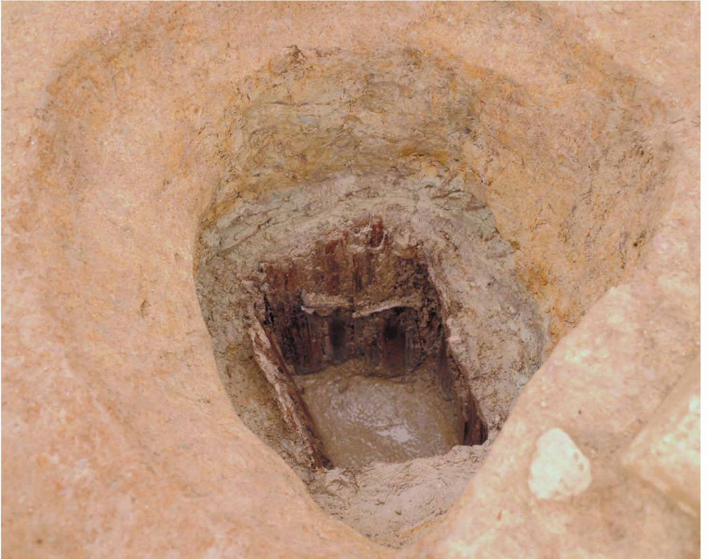
写真 65. 条坊跡第 275 次調査 275SE245 井戸枠出土状況（西から）