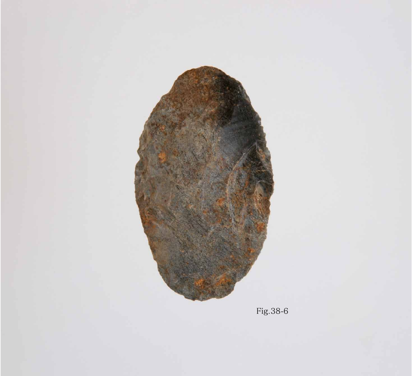
写真 187. 条 275 灰色砂 1 表