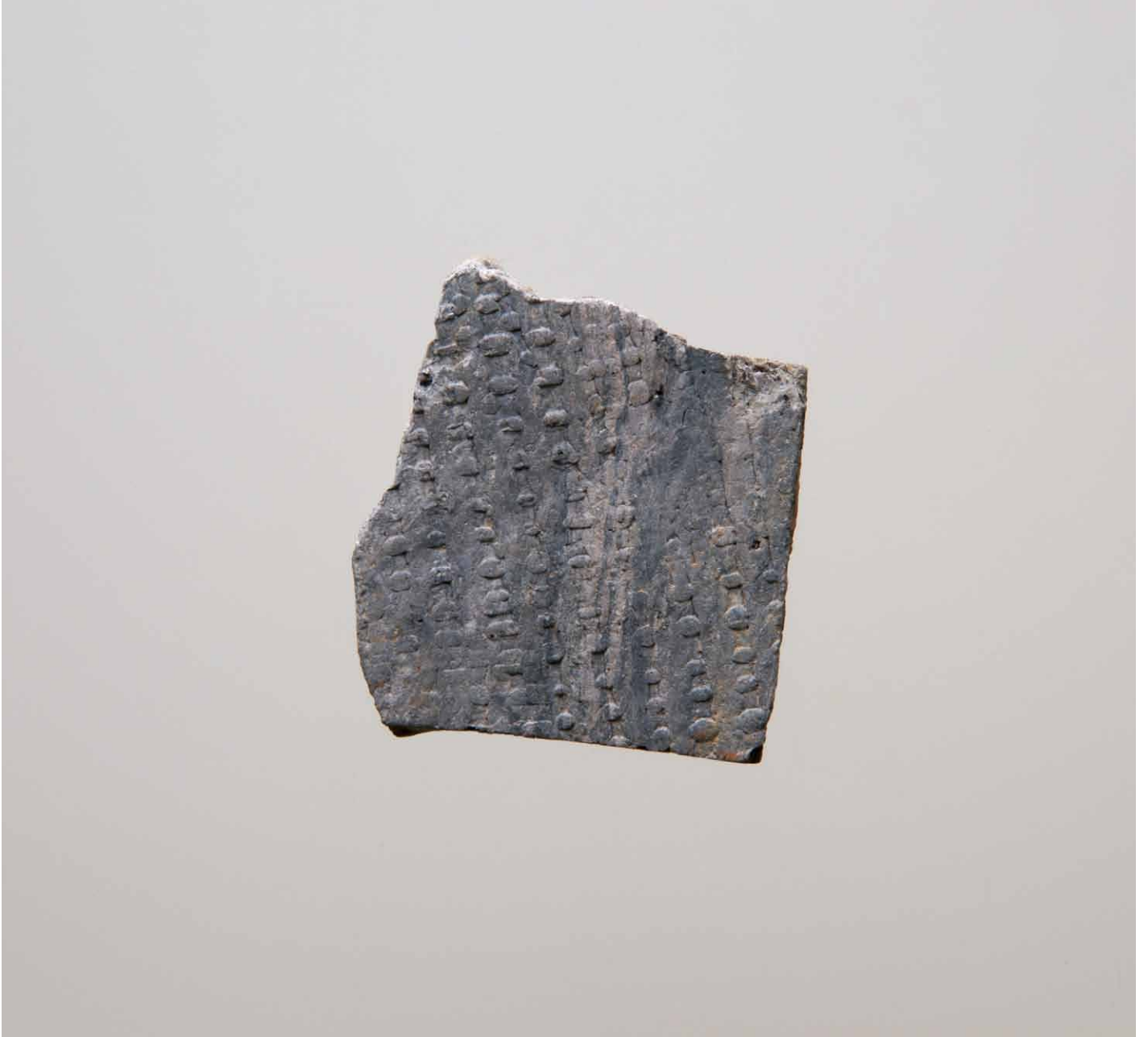
写真 169. 条 275SX284 外面