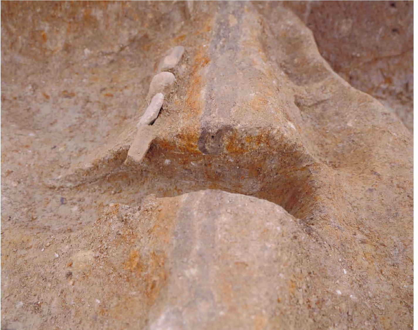
写真 37. 条坊跡第 275 次調査 275SX060 窯壁土層断面図（南西から）