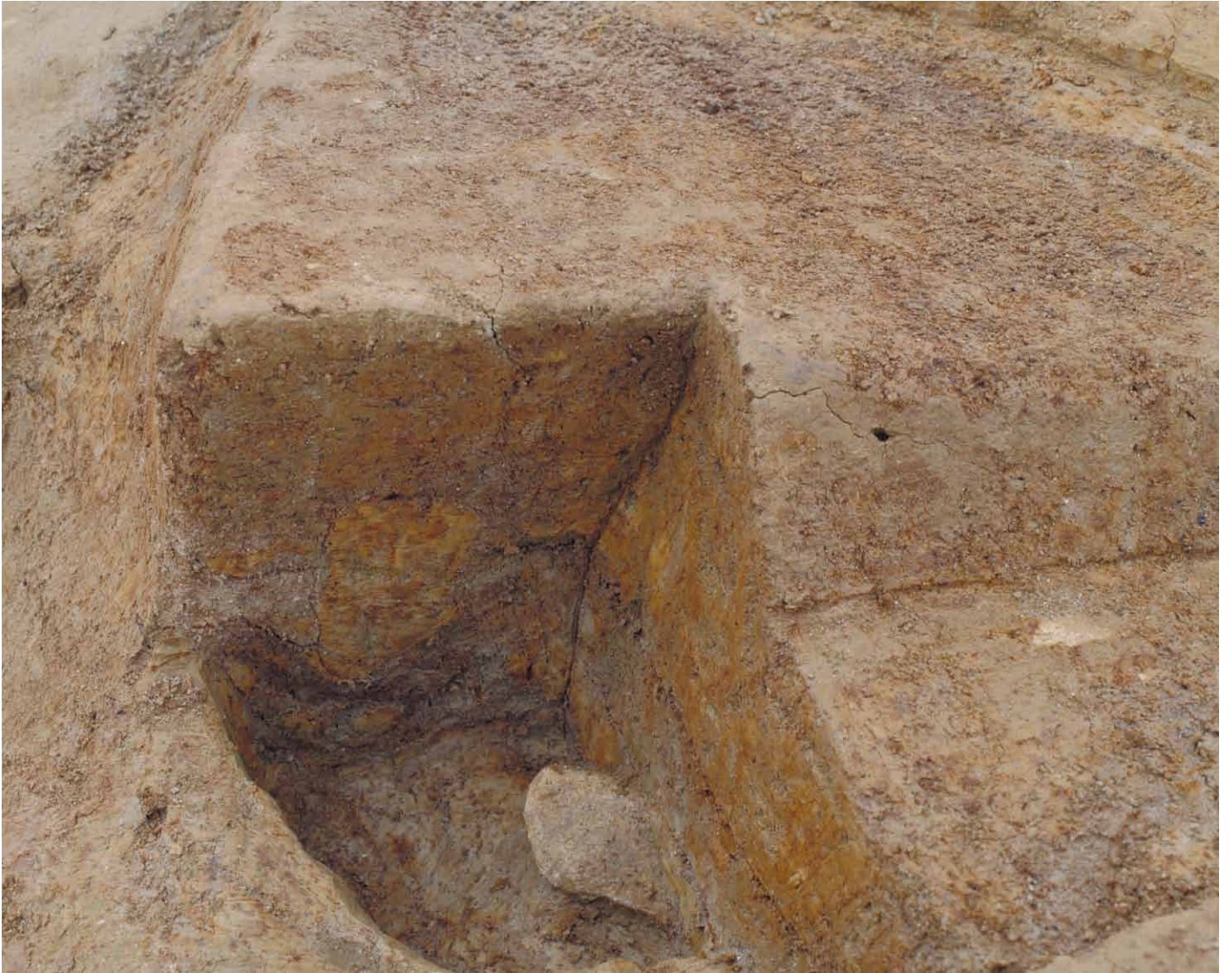
写真 48. 条坊跡第 275 次調査 275SB390a 土層観察（北から）