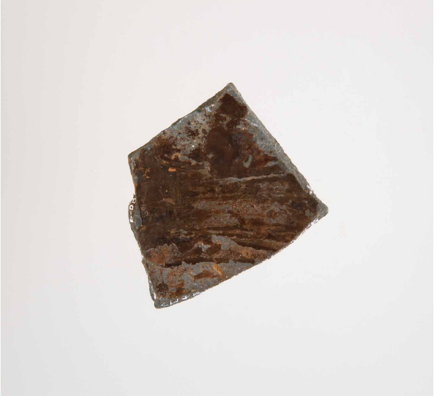
写真 116. 条 275SD260 茶灰色粘質土