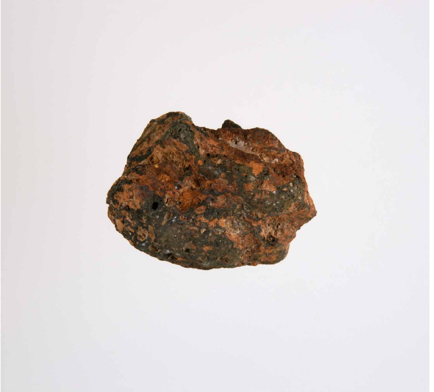
写真 155. 条 275SF270 表