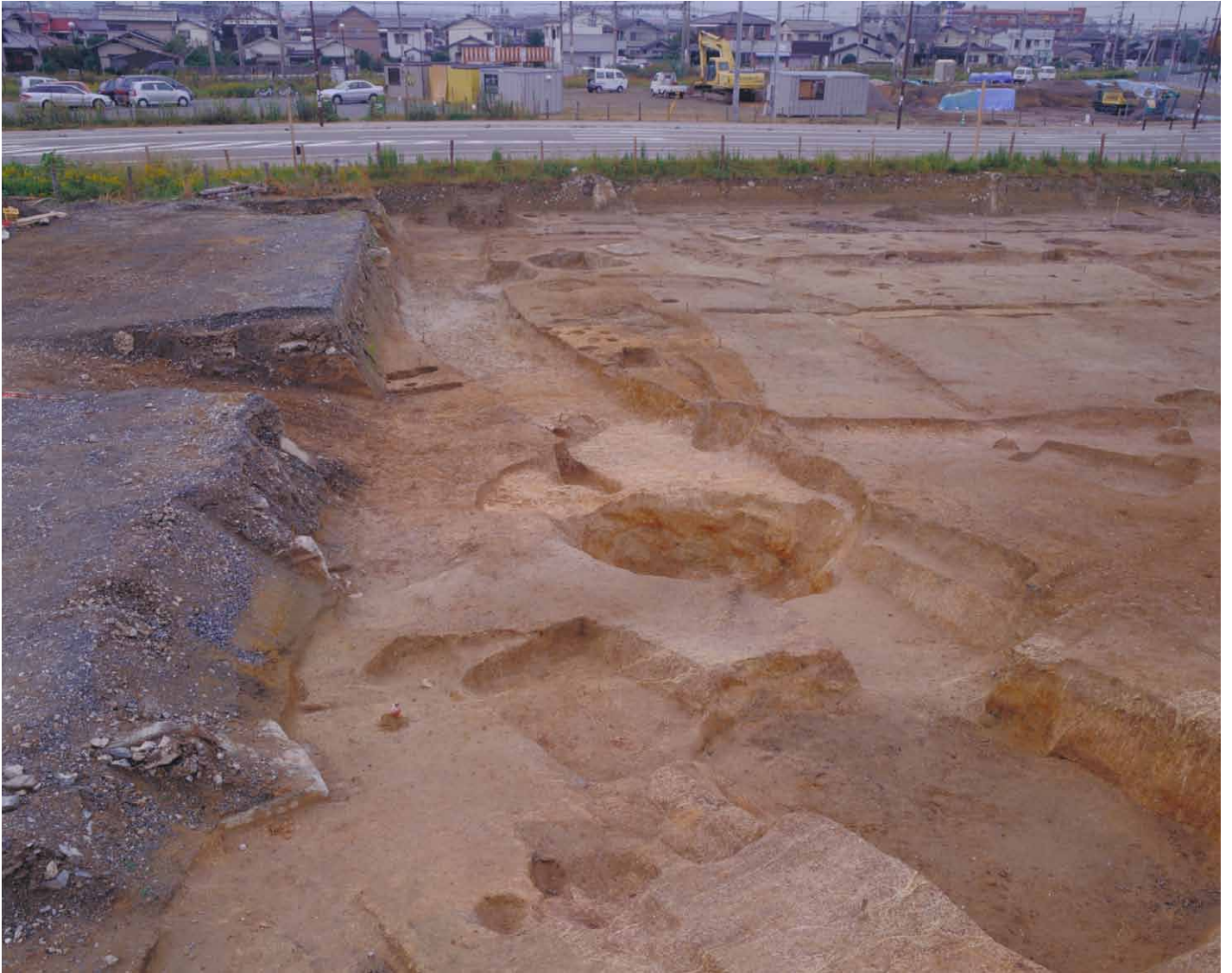
写真 16. 条坊跡第 275 次調査 275SD040 完掘（東から）