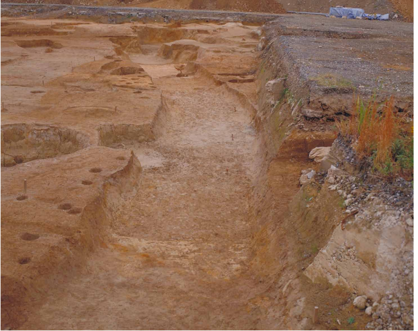
写真 17. 条坊跡第 275 次調査 275SD040 完掘（西から）