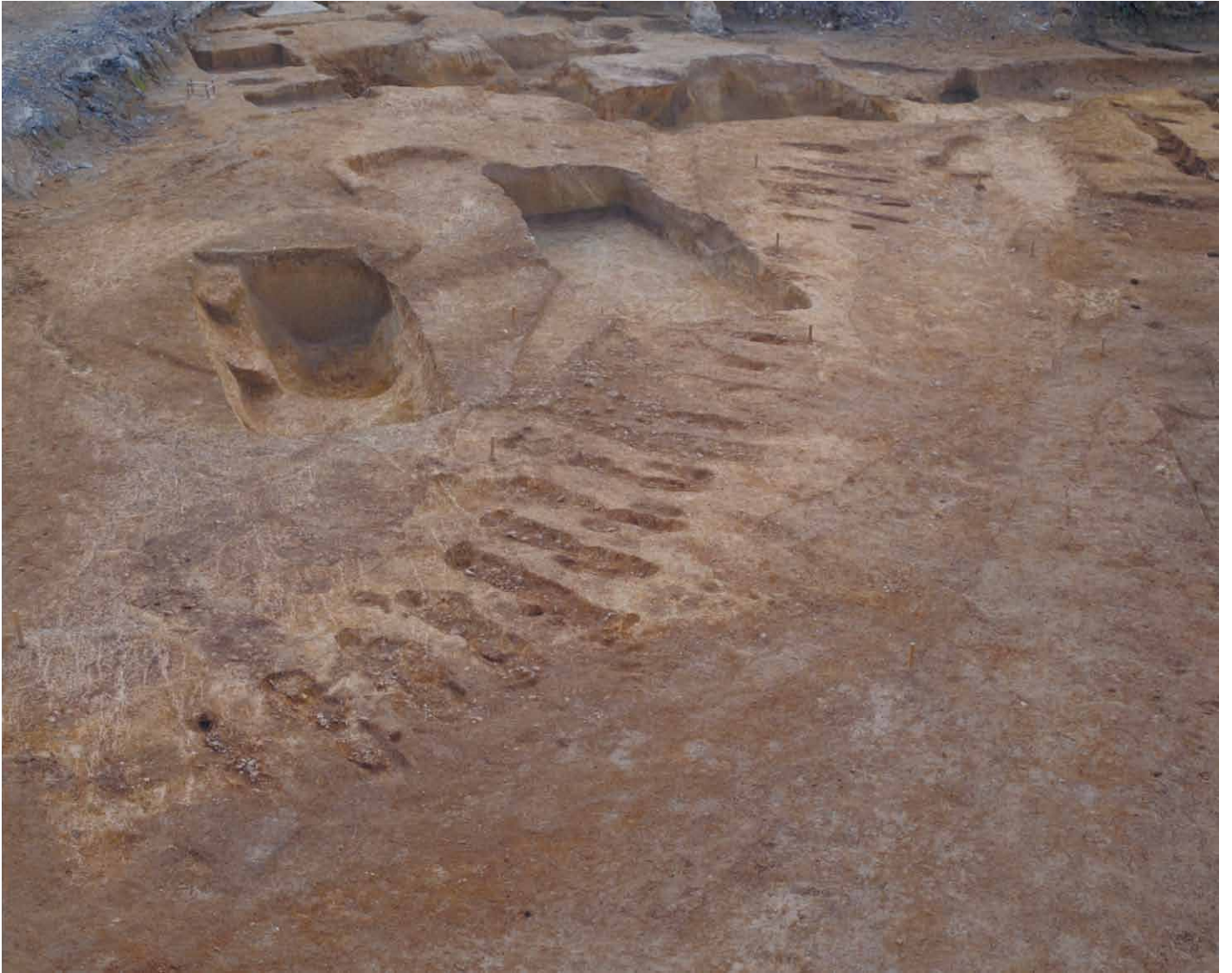
写真 23. 条坊跡第 275 次調査 「波板状」遺構群 Jライン以南（北から）