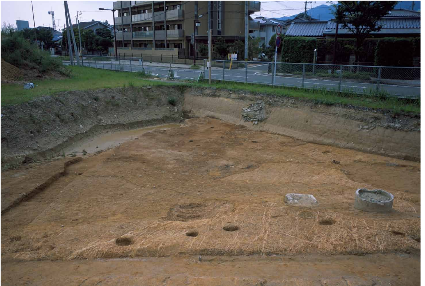
写真 264. 条坊跡第 285 次調査 285SX045 検出状況（南から）