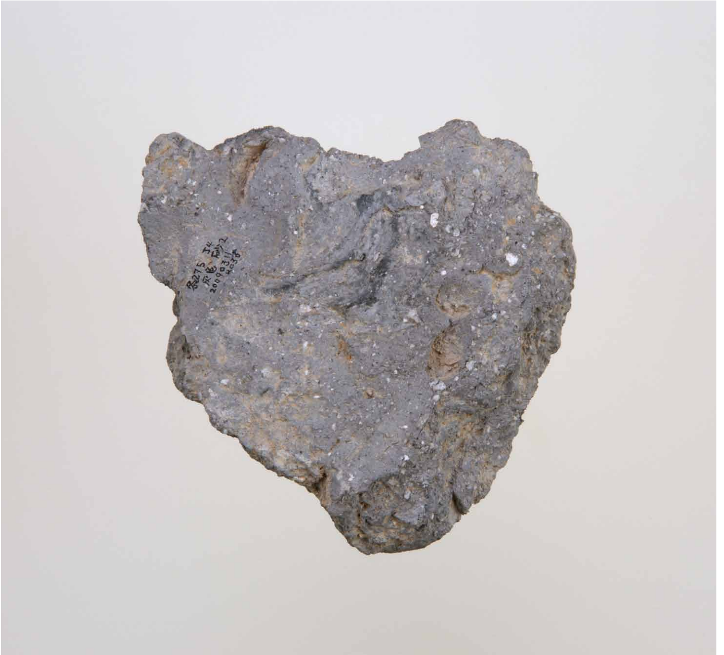
写真 198. 条 275 灰色砂 2 外面