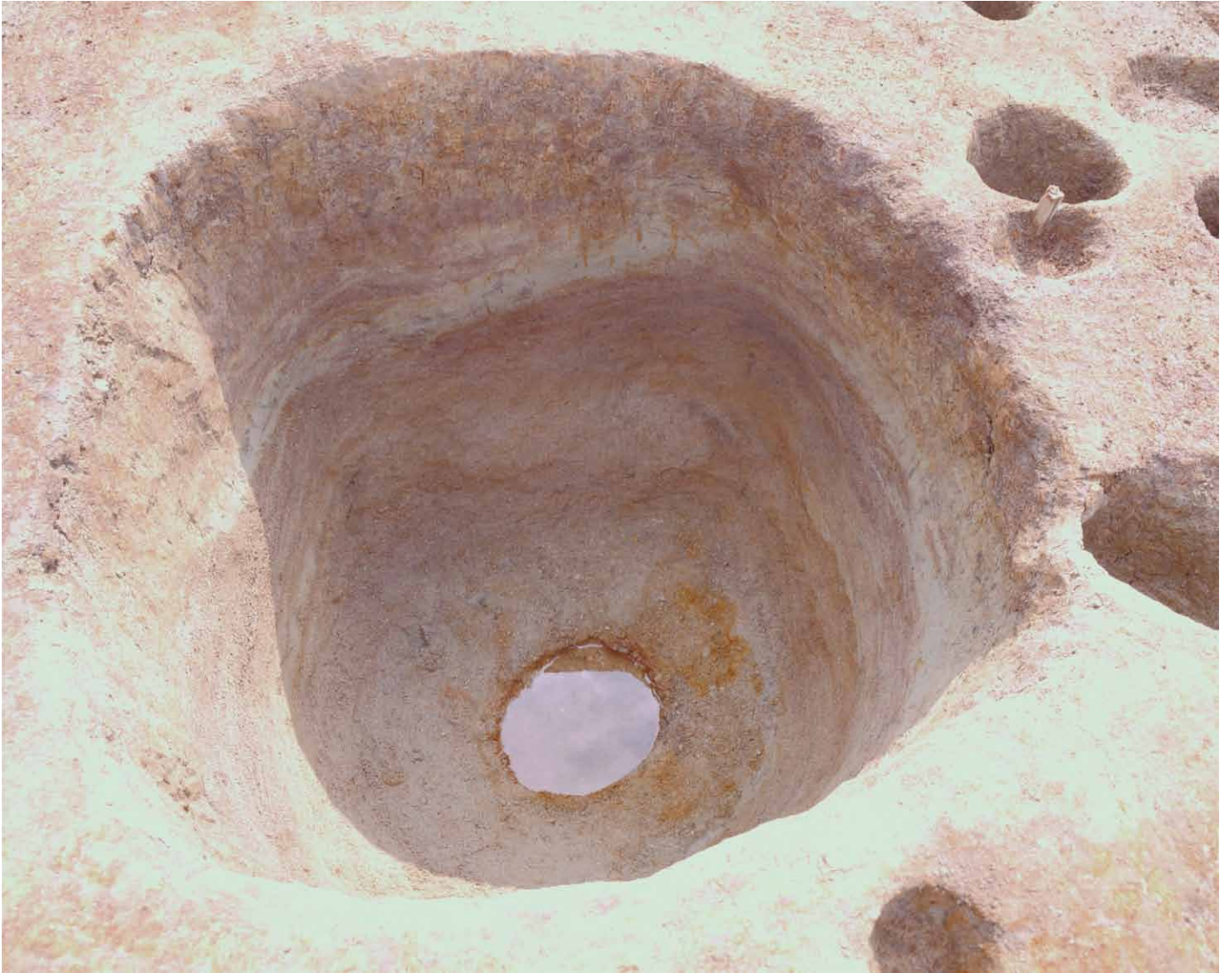
写真 31. 条坊跡第 275 次調査 275SE055 完掘（西から）