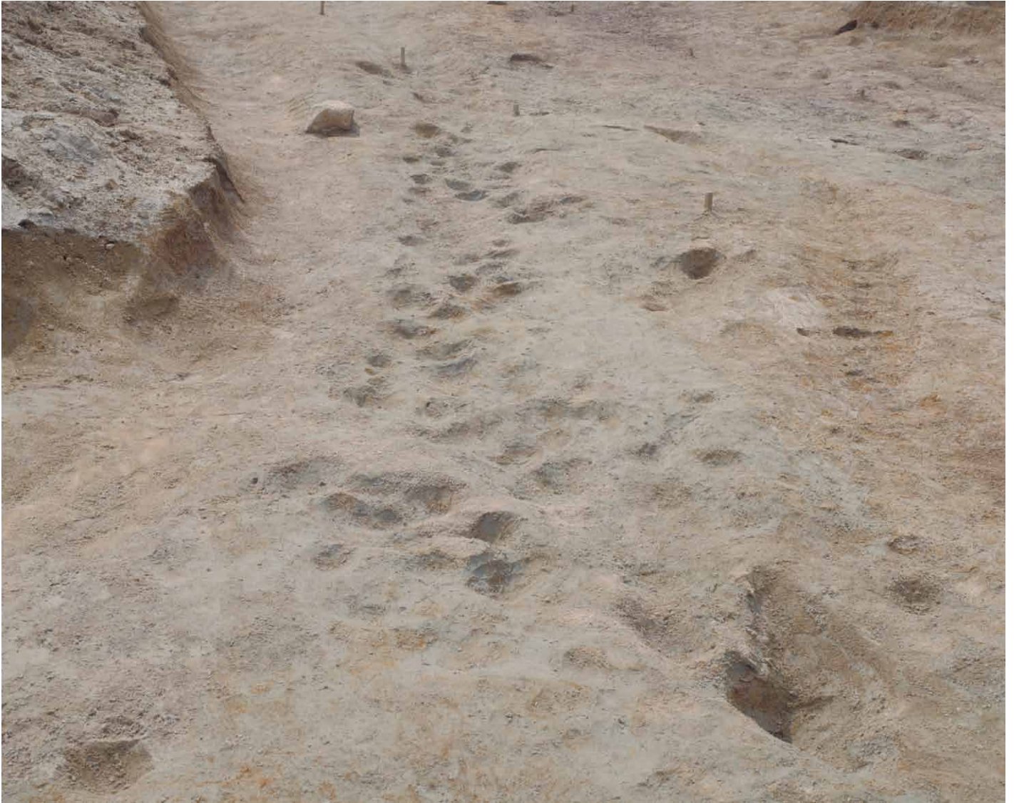
写真 70. 条坊跡第 275 次調査 条坊路交差点（最終面）（東から）