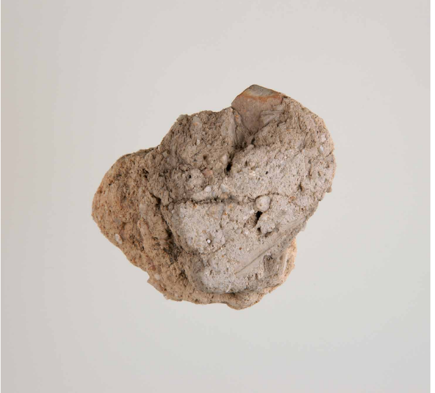
写真 164. 条 275SX106