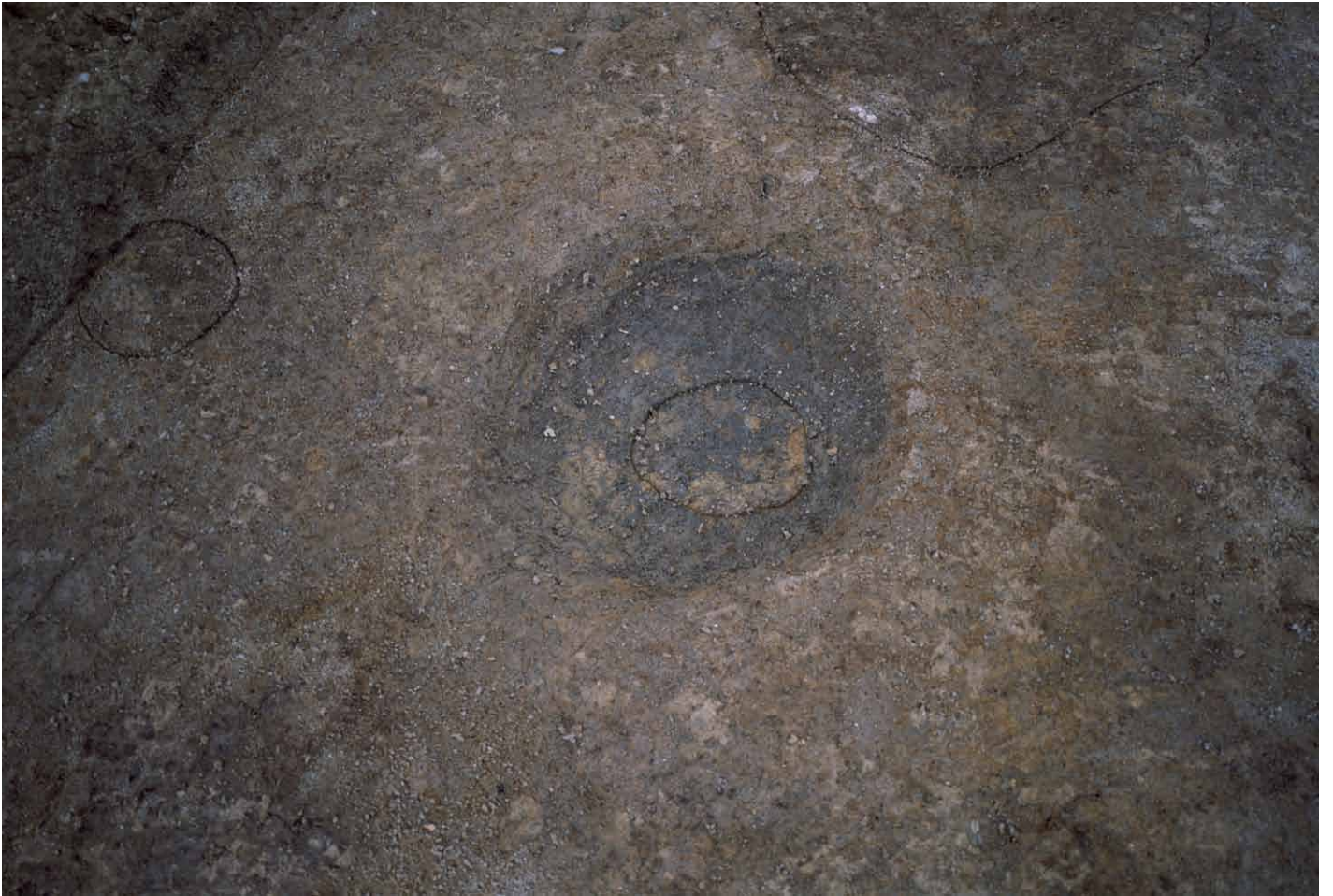
写真 246. 条坊跡第 285 次調査 285SB020c 柱痕検出状況（北から）