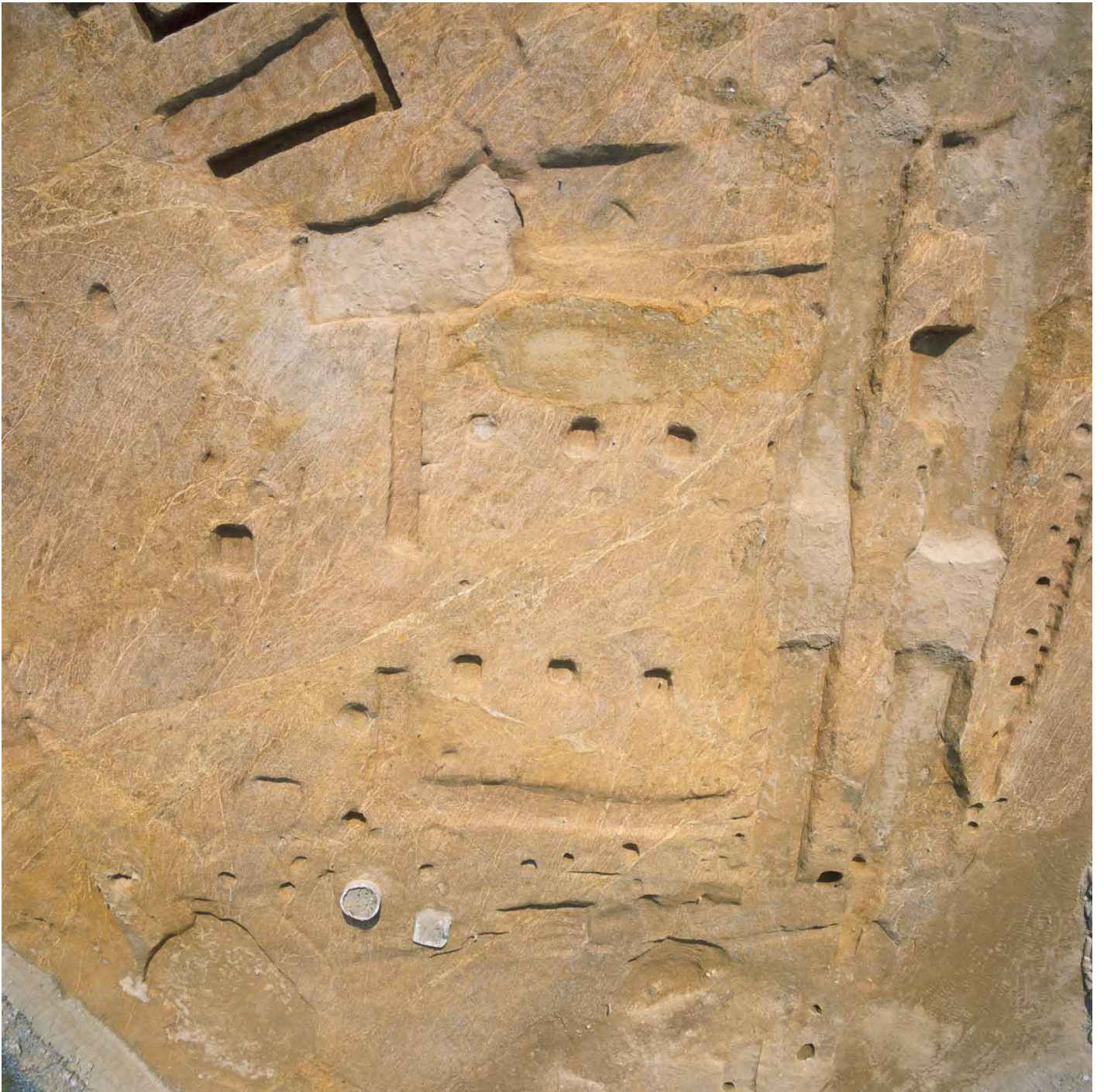
写真 223. 条坊跡第 285 次調査 空中写真 285SX095 全景（上が東）