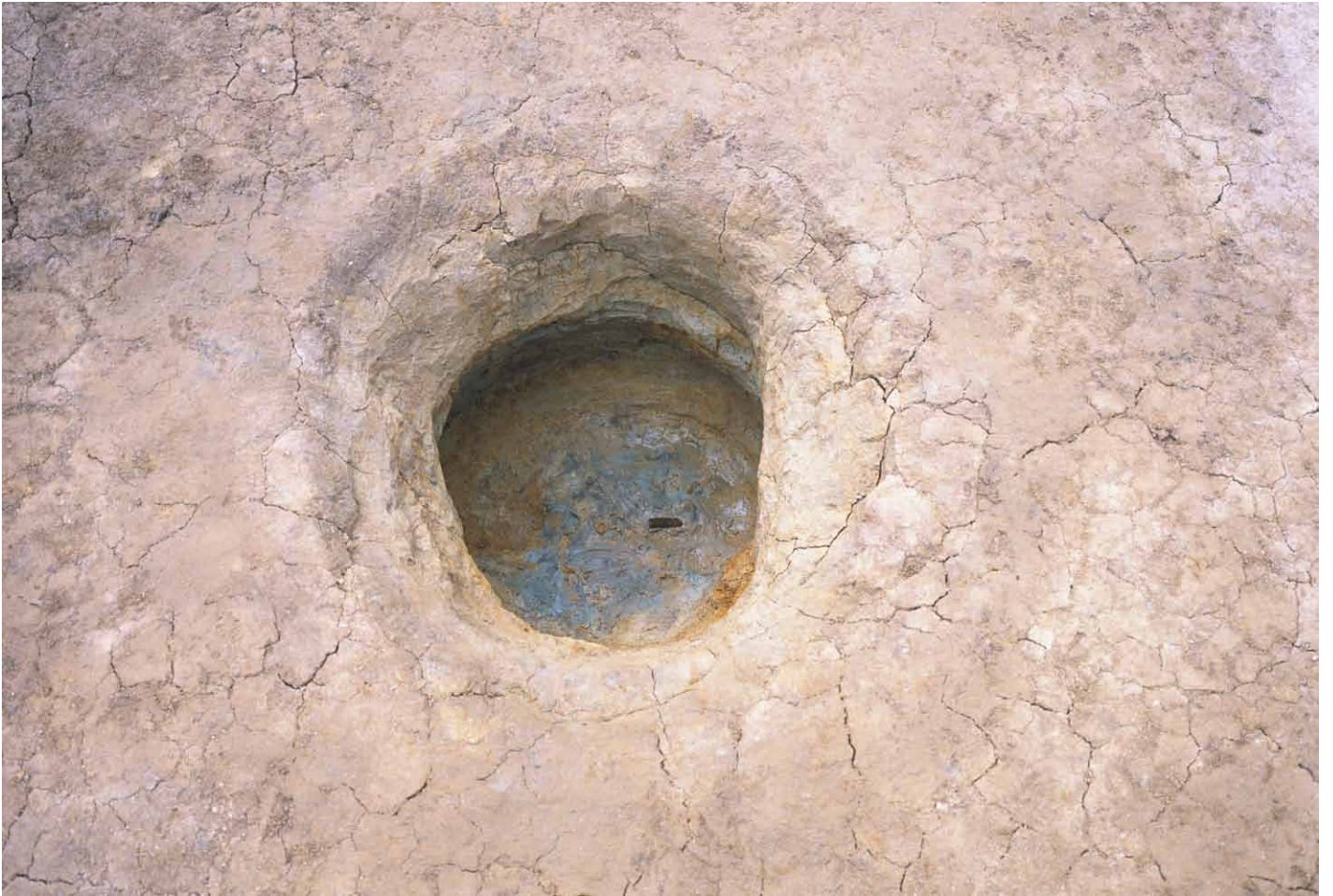
写真 247. 条坊跡第 285 次調査 285SE025 木製品陽物 検出状況（東から）