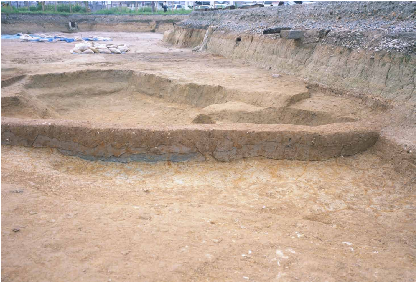
写真 256. 条坊跡第 285 次調査 285SX030・035 東西ベルト土層観察 西半（北から）