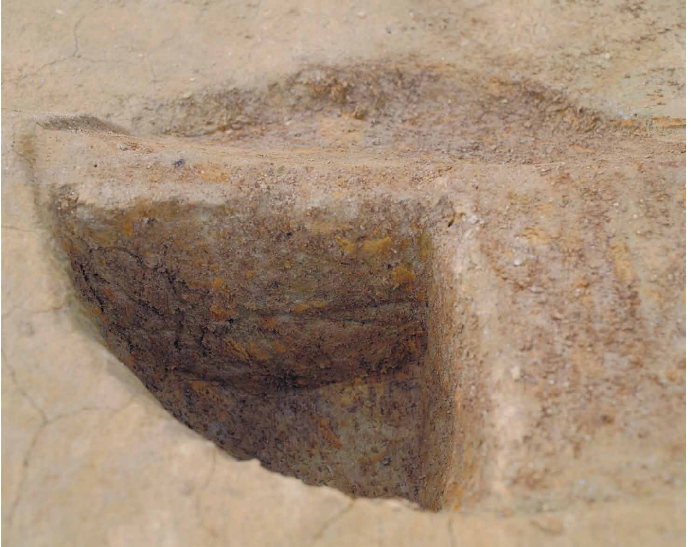
写真 49. 条坊跡第 275 次調査 275SB390d 土層観察（南から）