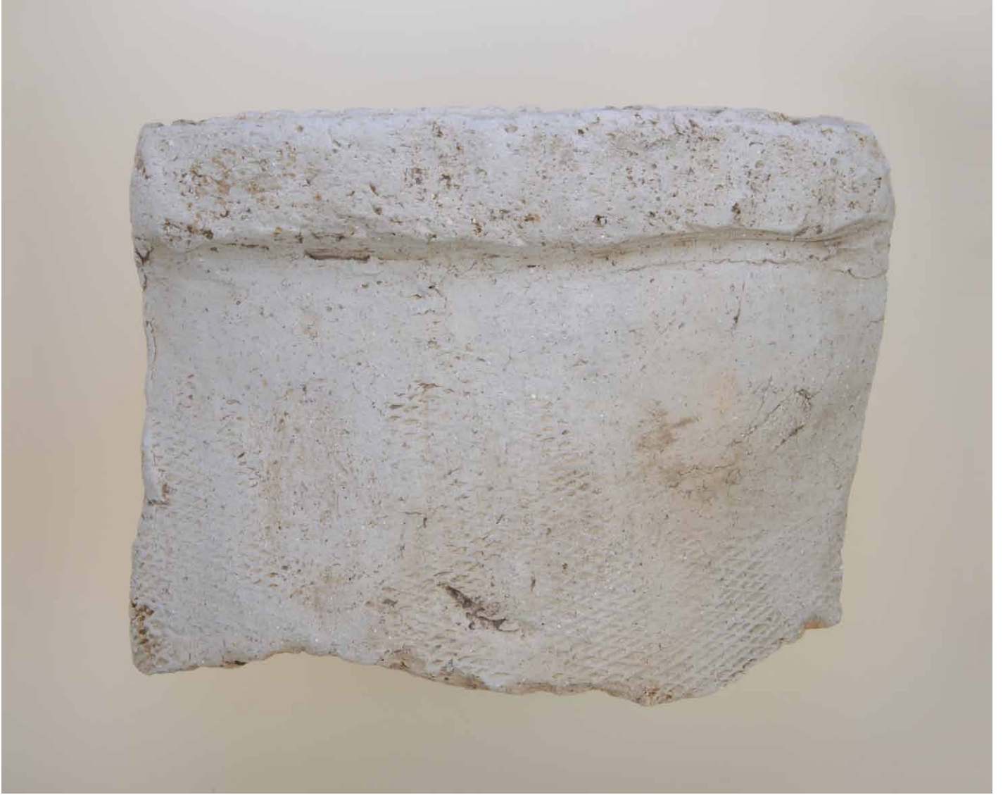
写真 208. 条 275 茶灰色土 2 凸面