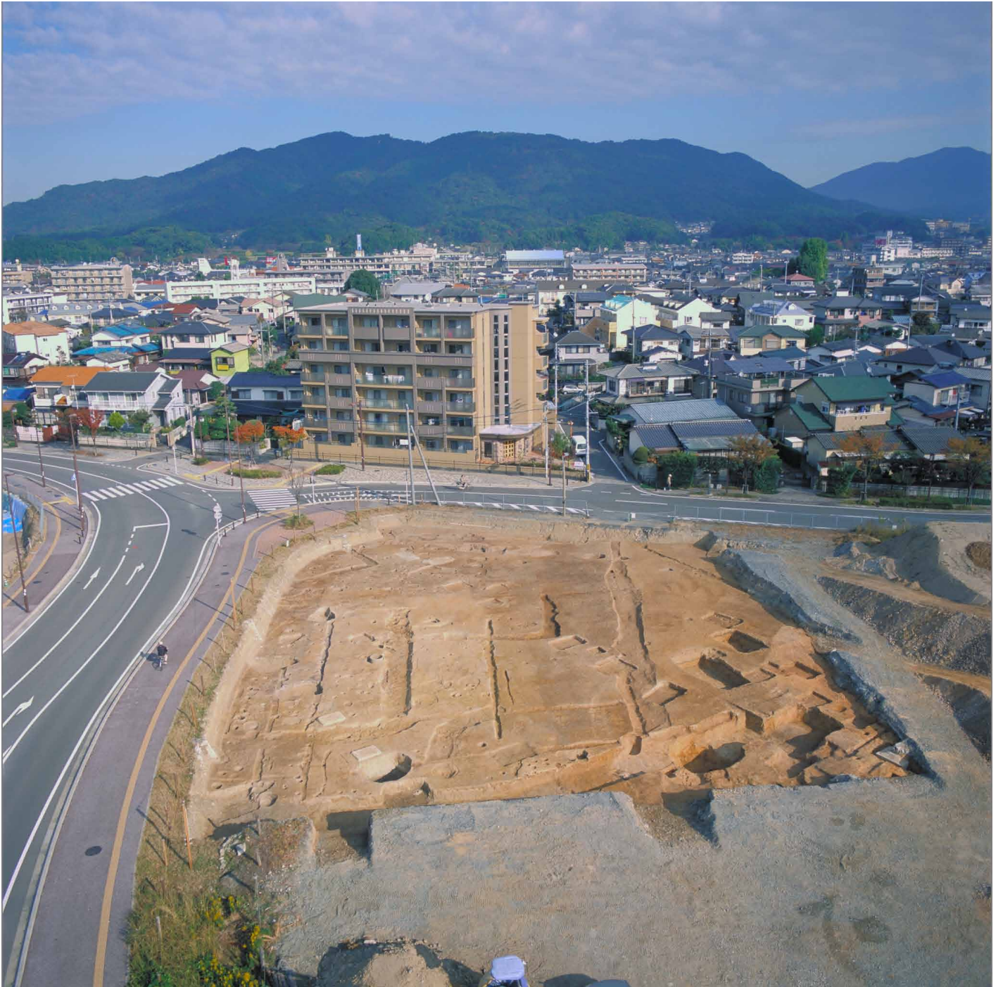
写真 1. 条坊跡第 275 次調査 空中写真 第 1 面調査区全景（南より）