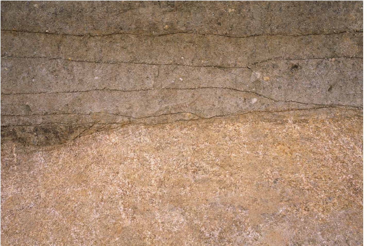
写真 298. 条坊跡第 285 次調査 調査区北壁トレンチ 土層観察②（南から）