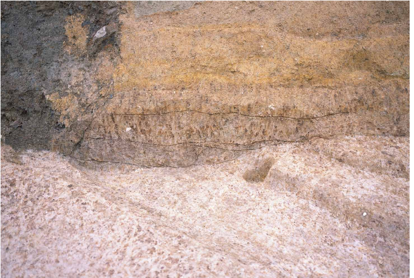
写真 231. 条坊跡第 285 次調査 285SD002・SD005 土層（調査区南壁）（北から）