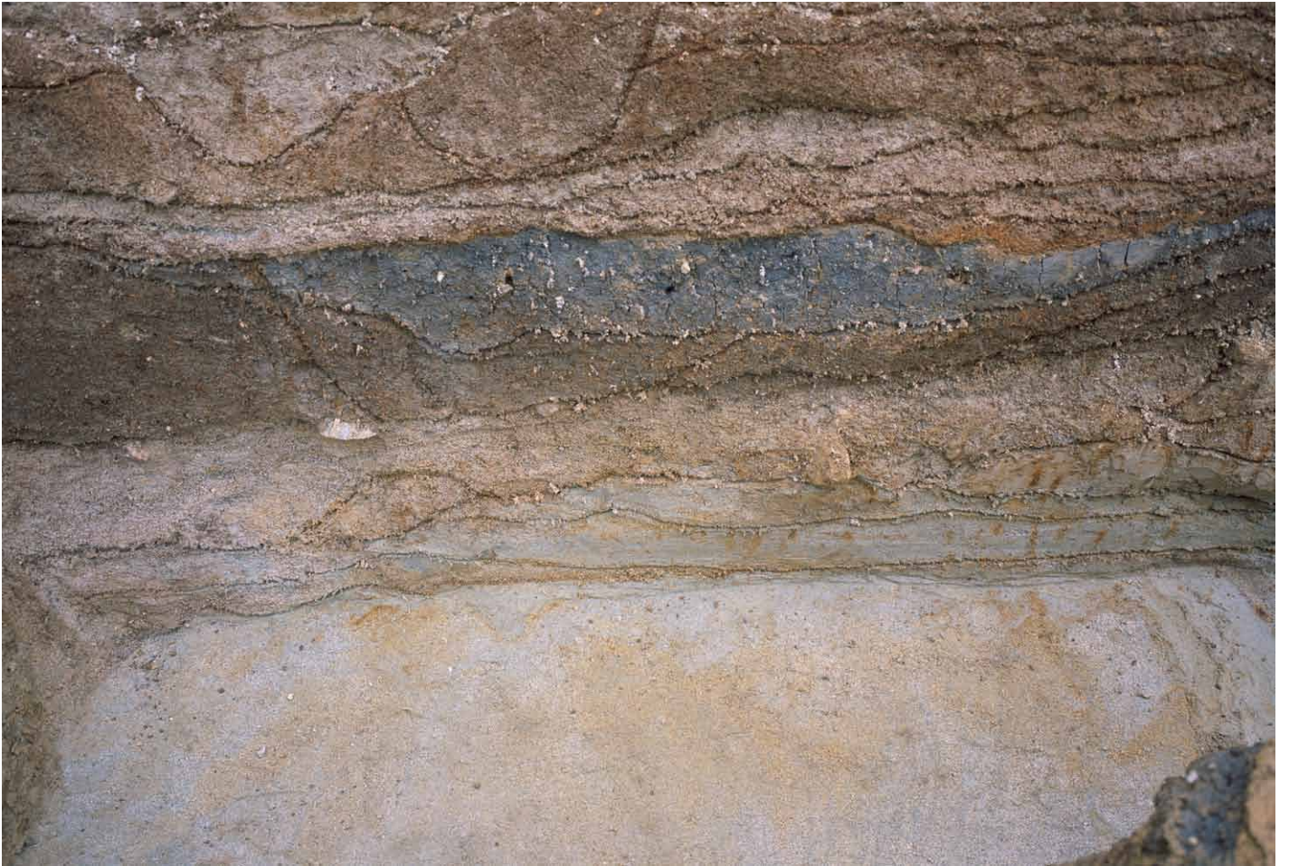
写真 299. 条坊跡第 285 次調査 調査区北壁トレンチ 推定道路路盤 1 段目（南から）