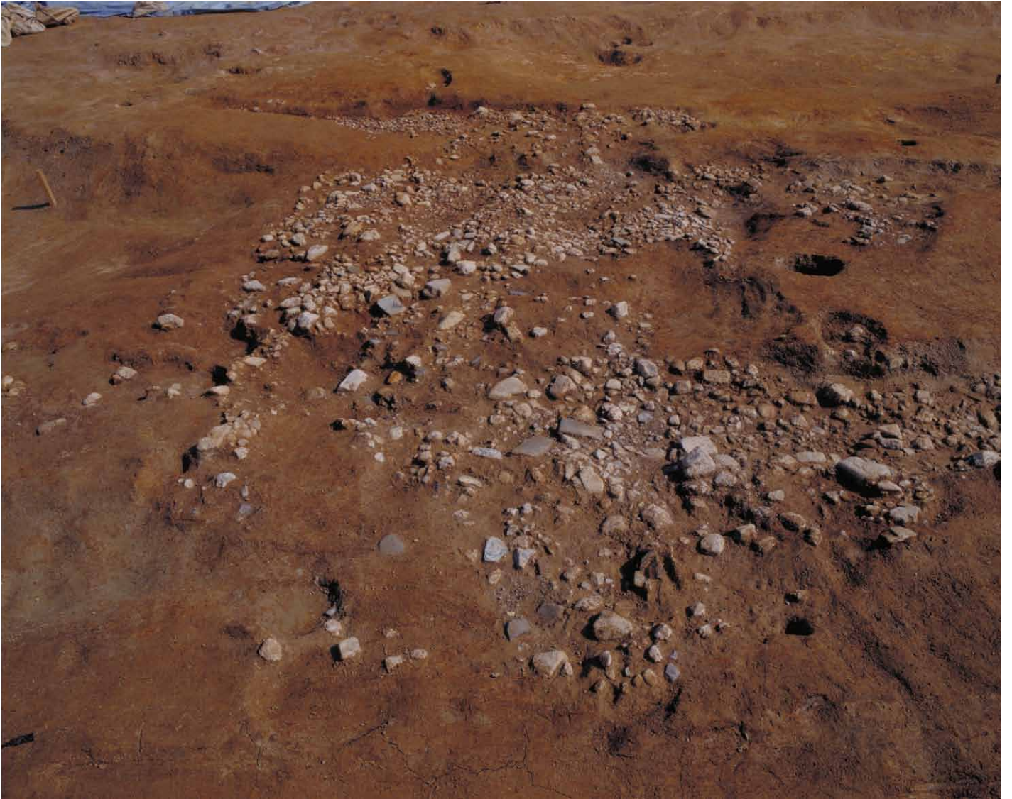
写真 67. 条坊跡第 275 次調査 275SF270 検出状況 8 ラインより南（西より）