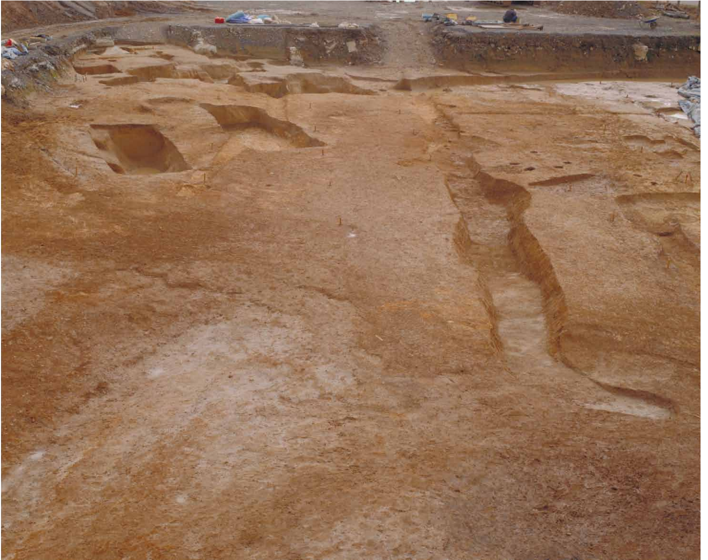
写真 32. 条坊跡第 275 次調査 275SD065-275SD075 4.5.6 ライン (北から)