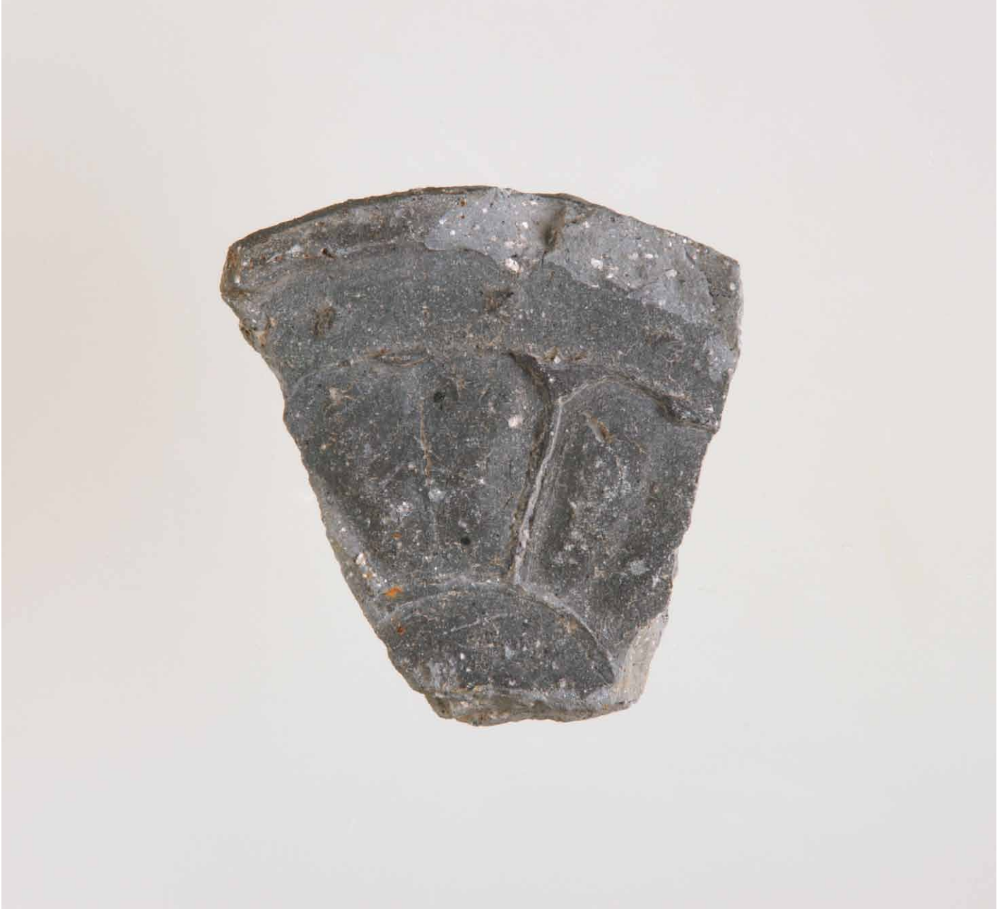
写真 212. 条 275 明灰色粘土