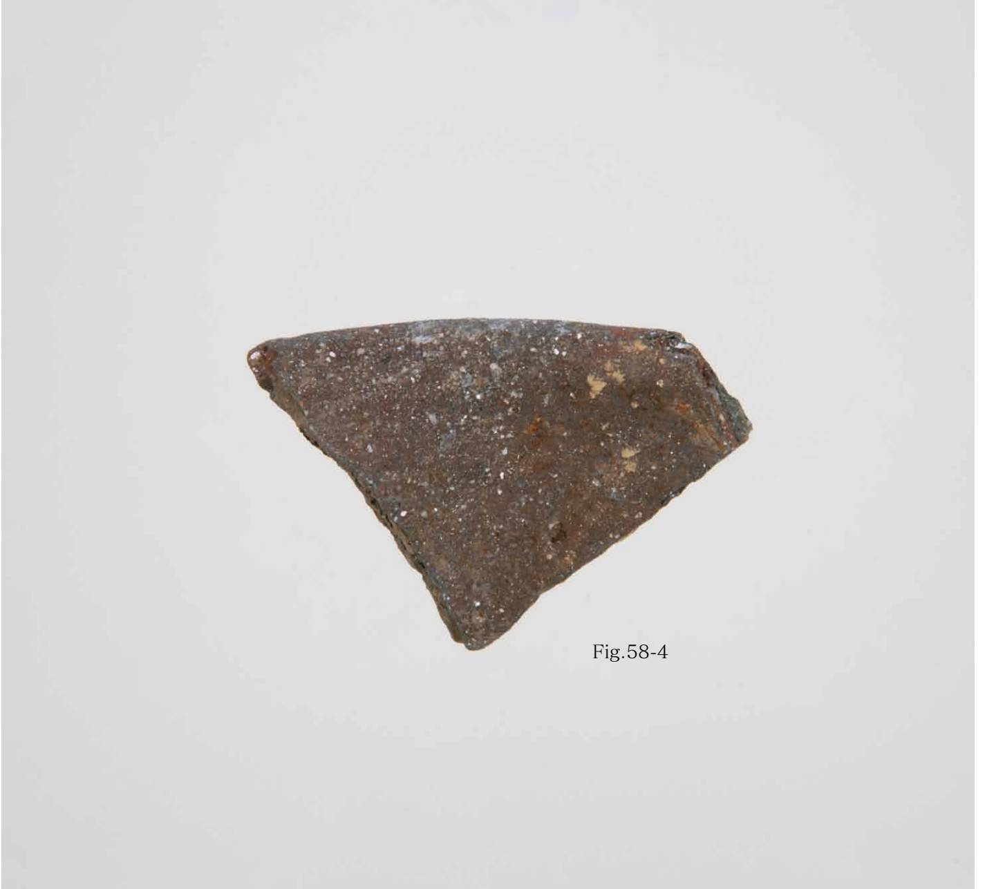
写真 352. 条 285 茶灰土 外面