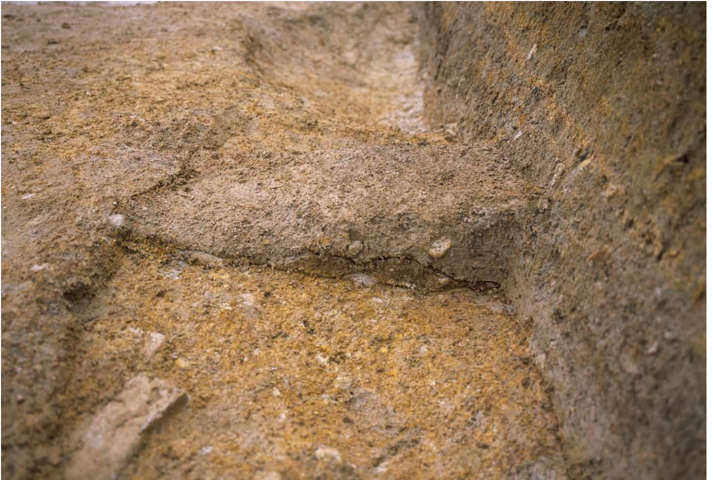
写真 281. 条坊跡第 285 次調査 285SX075 土層観察（北から）