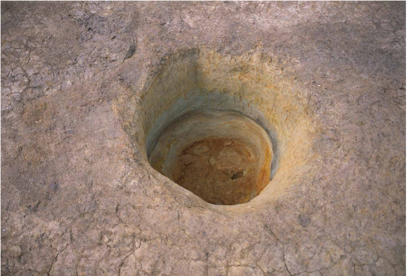
写真 253. 条坊跡第 285 次調査 285SE025 完掘状況（東から）