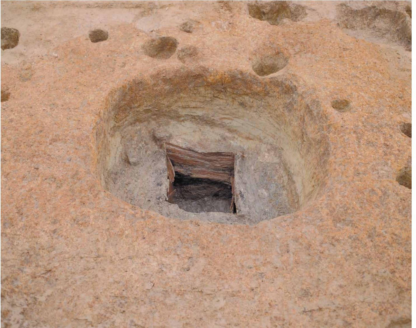
写真 27. 条坊跡第 275 次調査 275SE055 井戸枠検出状況（北から）