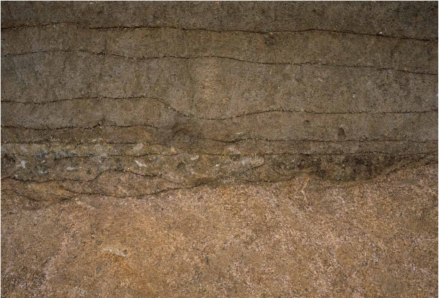
写真 297. 条坊跡第 285 次調査 調査区北壁トレンチ 土層観察 (南から)