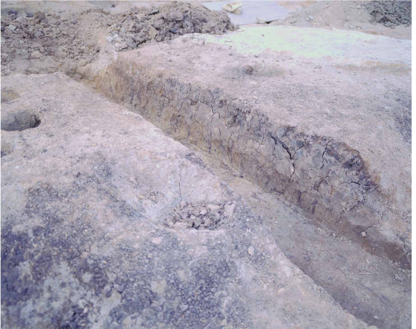
写真 76. 条坊跡第 275 次調査 断割 1 土層断面（南西から）