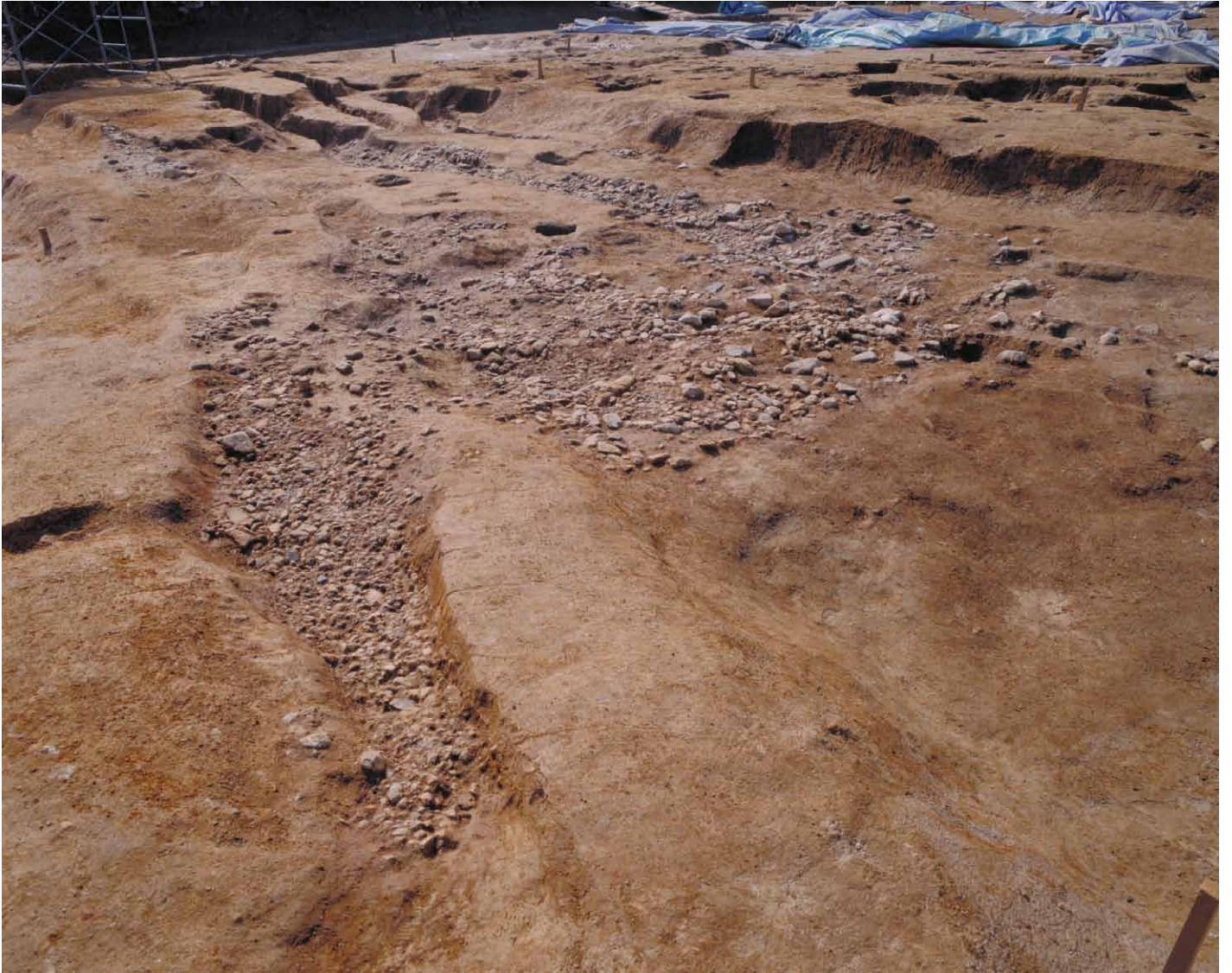
写真 68. 条坊跡第 275 次調査 275SF270 検出状況 8 ラインより南（北東から）