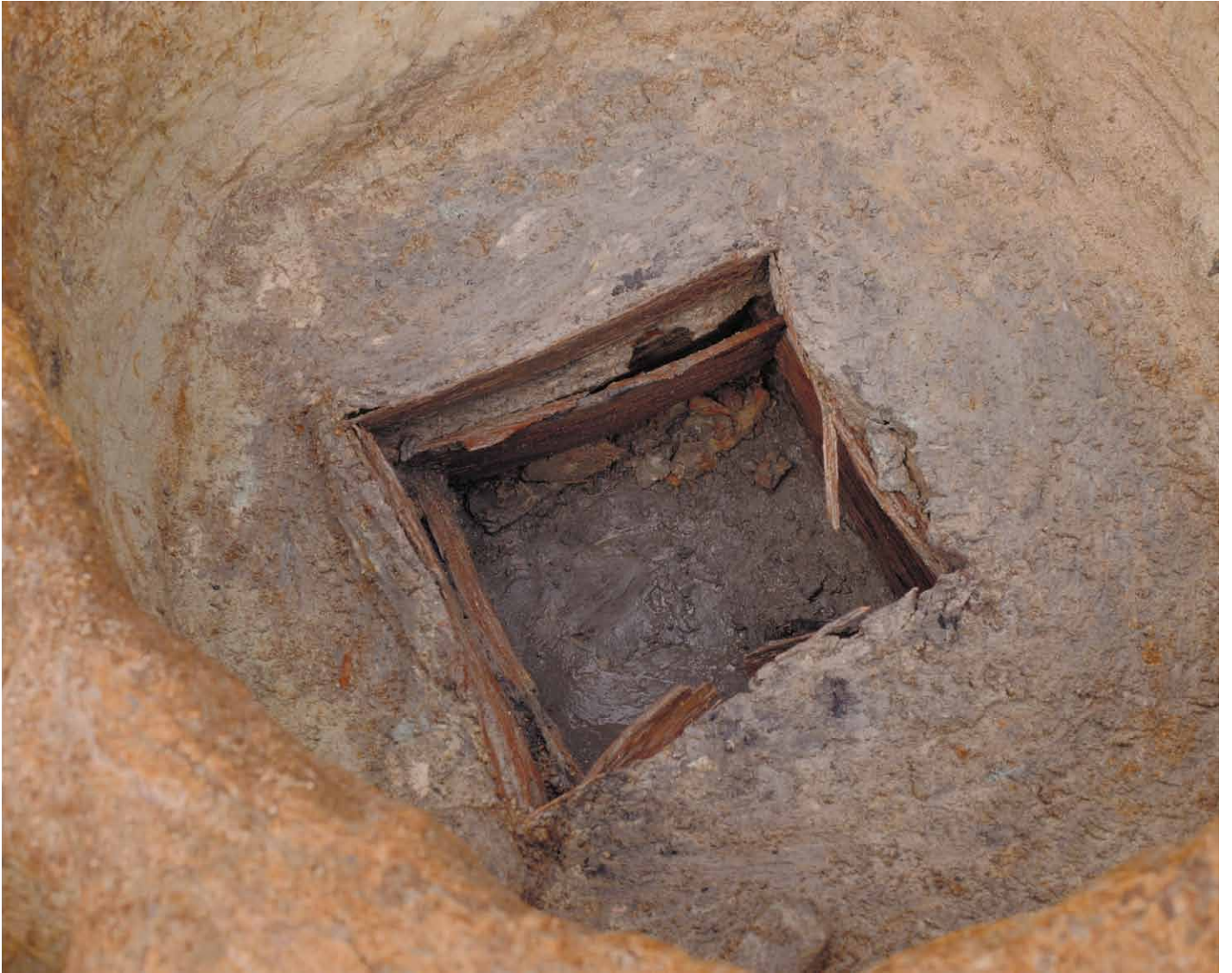
写真 28. 条坊跡第 275 次調査 275SE055 井戸枠検出状況（南東から）