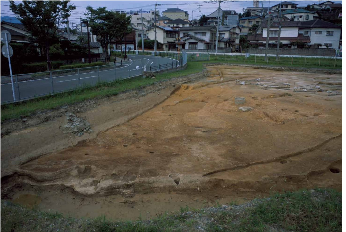
写真 265. 条坊跡第 285 次調査 285SX045 検出状況（西から）