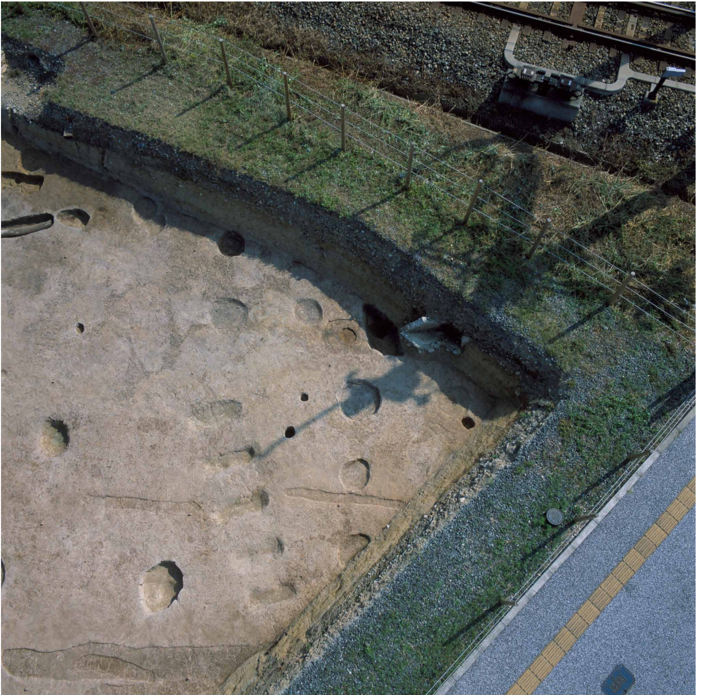
写真 222. 条坊跡第 285 次調査 空中写真 調査区南部 掘立柱建物群と推定二坊路（上が東）