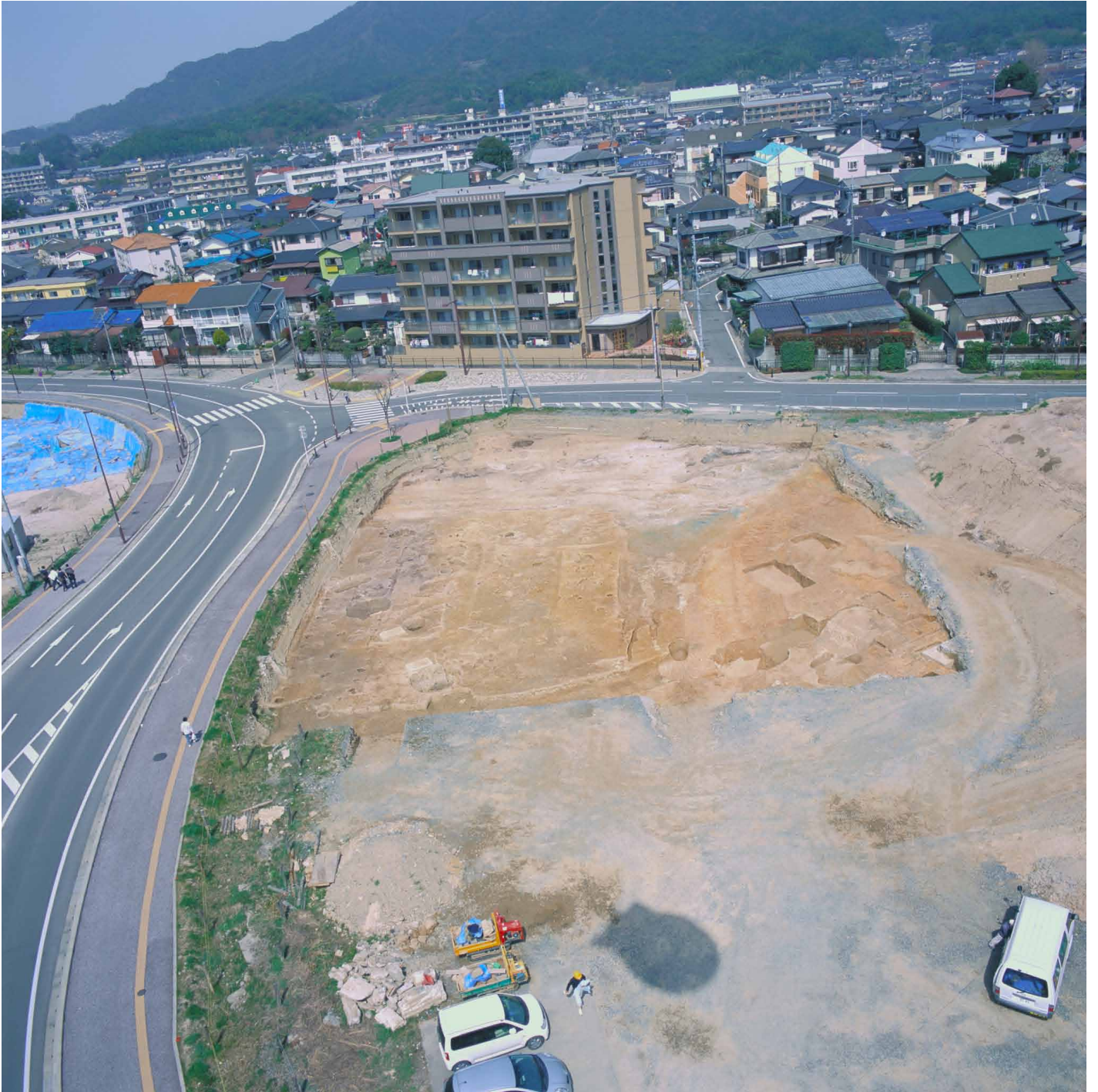
写真 4. 条坊跡第 275 次調査 空中写真 第 2 面調査区全景（南から）