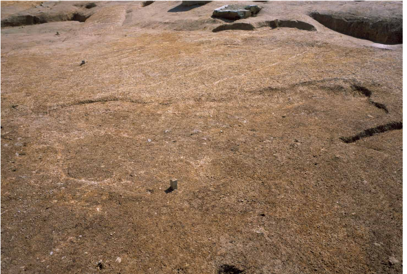
写真 268. 条坊跡第 285 次調査 285SX050 完掘状況（北から）