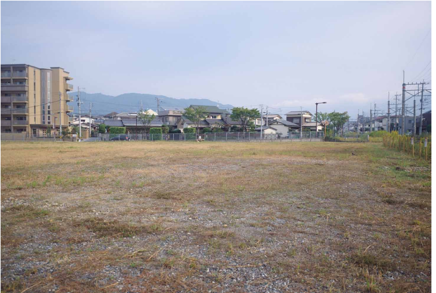
写真 213. 条坊跡第 285 次調査 調査前風景（南から）