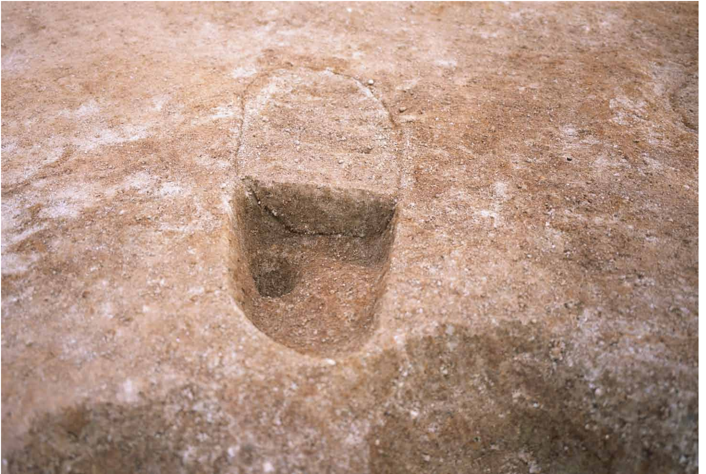
写真 274. 条坊跡第 285 次調査 285SX065c 波板状痕跡 半裁（西から）