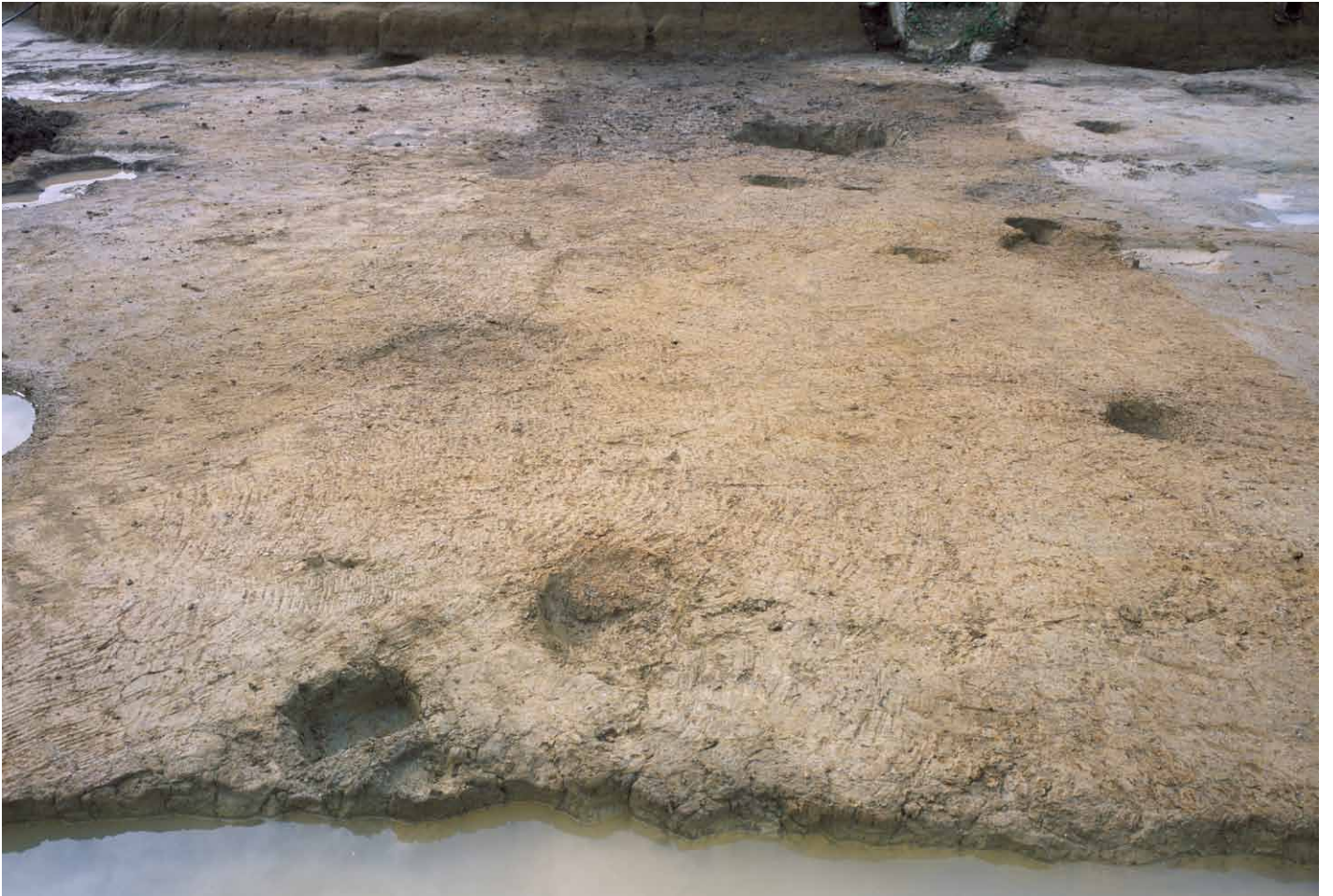
写真 308. 条坊跡第 285 次調査 調査区南部トレンチ 4(東から)