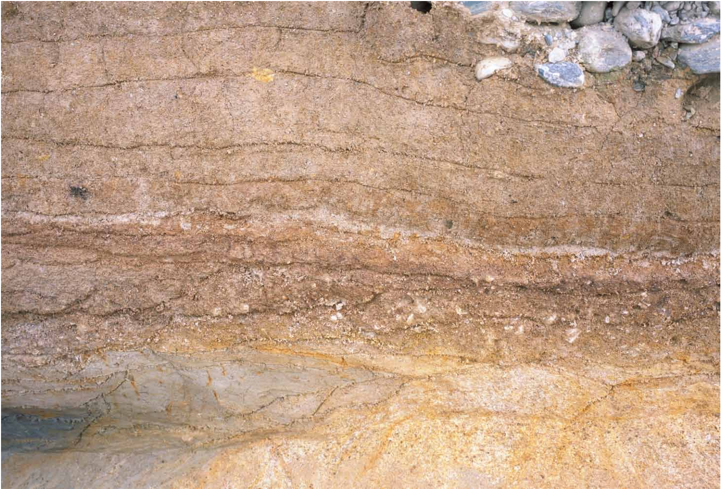
写真 295. 条坊跡第 285 次調査 調査区北壁トレンチ 土層観察 (南から)