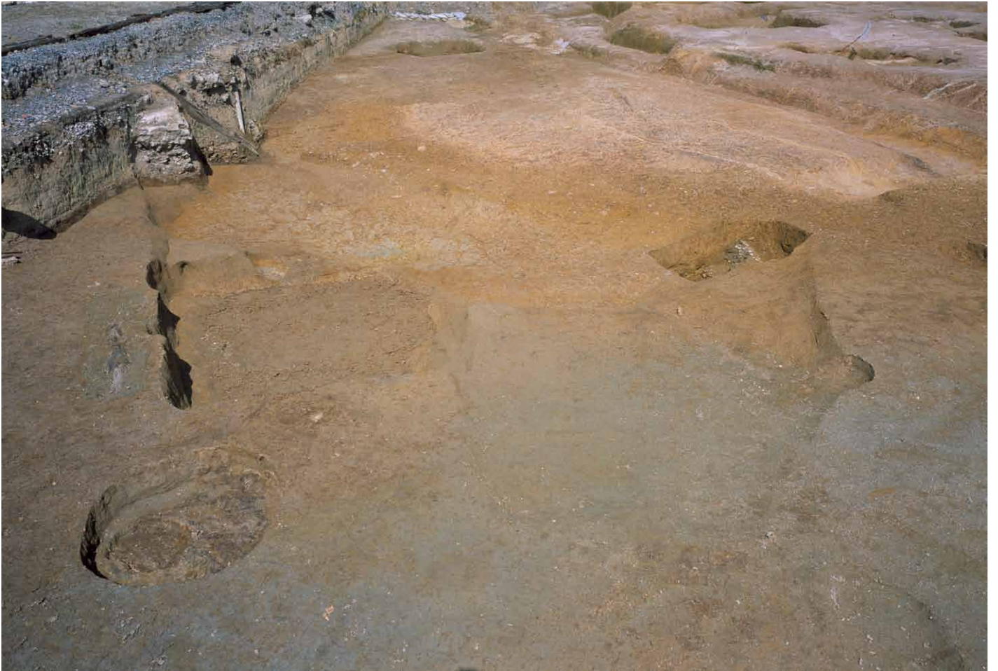
写真 261. 条坊跡第 285 次調査 285SX030・035 完掘状況（南から）