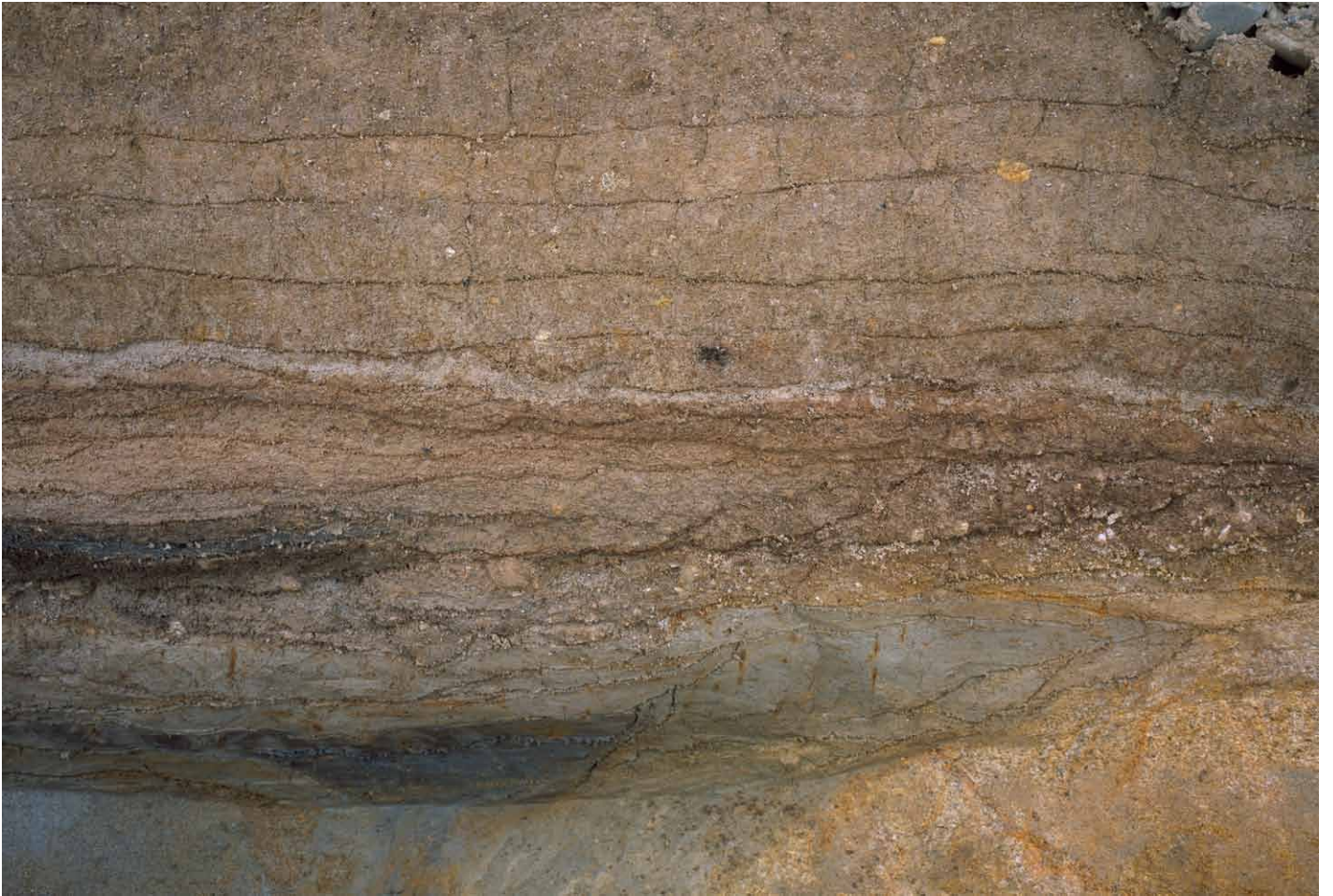
写真 301. 条坊跡第 285 次調査 調査区北壁トレンチ 推定道路路盤 2 段目・3 段目東半（南から）