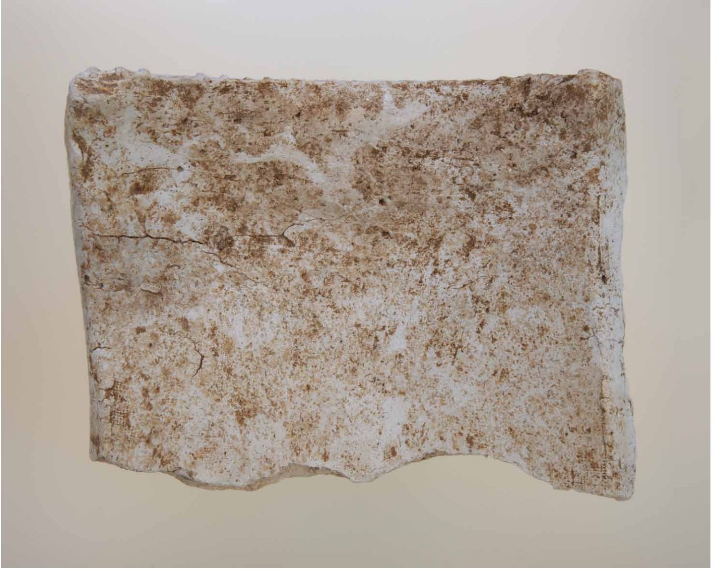
写真 206. 条 275 茶灰色土 2 凹面