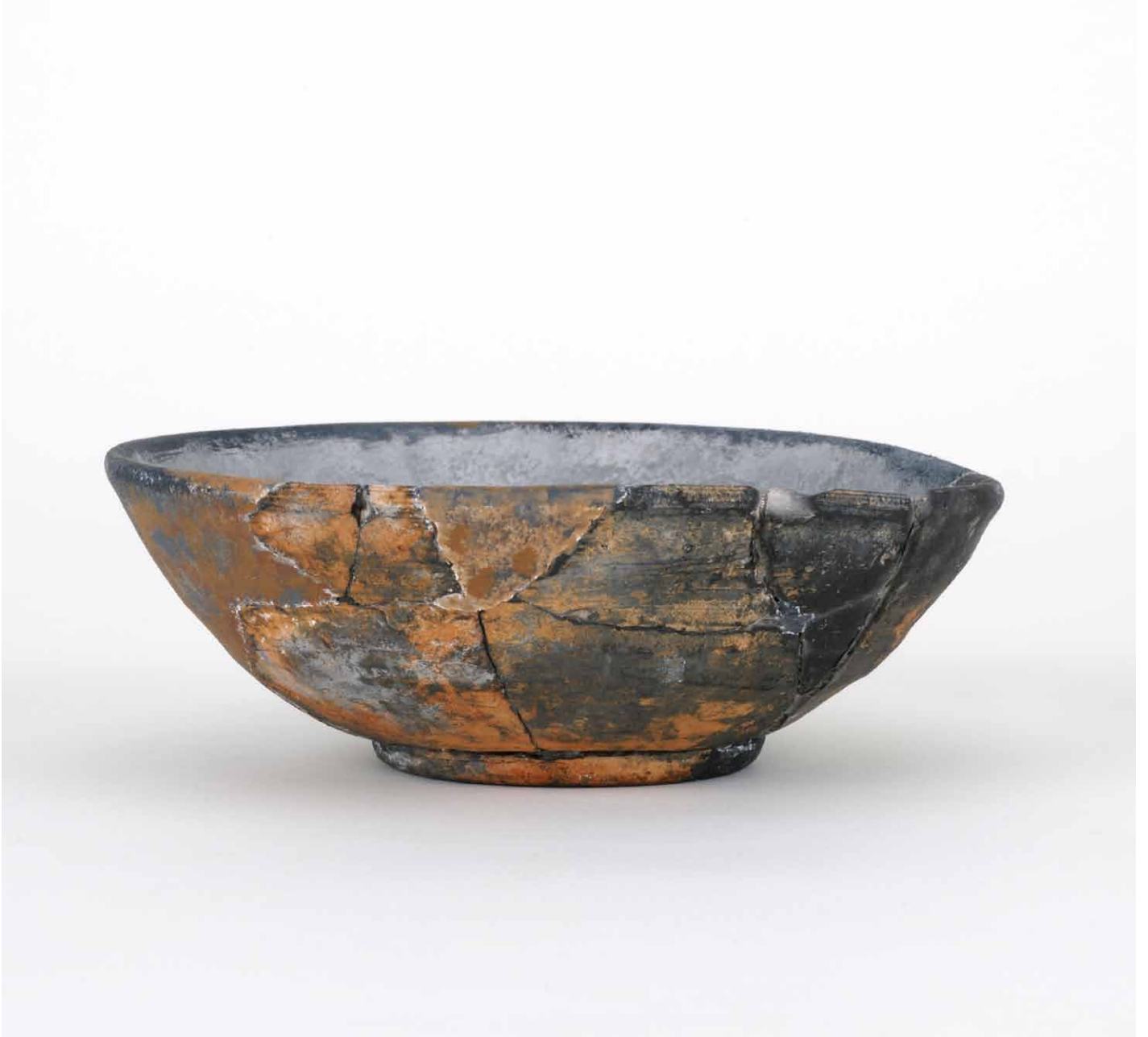
写真 159. 条 275SK096 灰色土