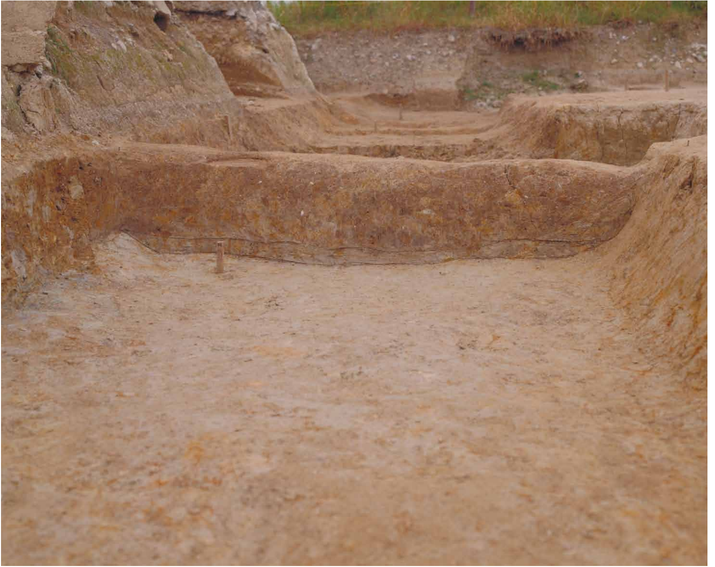
写真 15. 条坊跡第 275 次調査 275SD040 土層観察 2(東から)