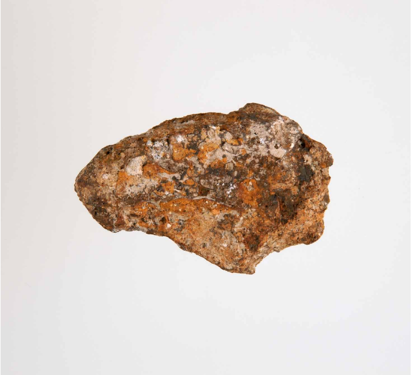
写真 95. 条 275SD050 茶灰色粘質土 内面