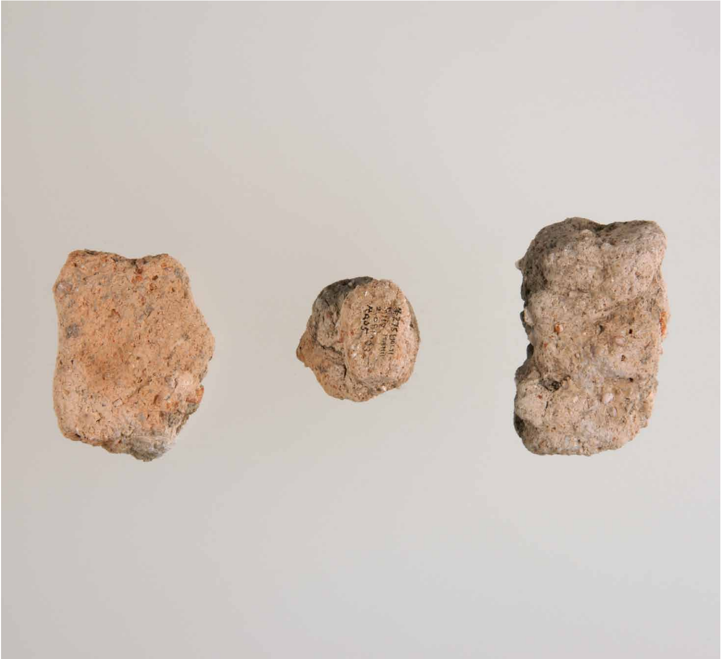
写真 165. 条 275SX119