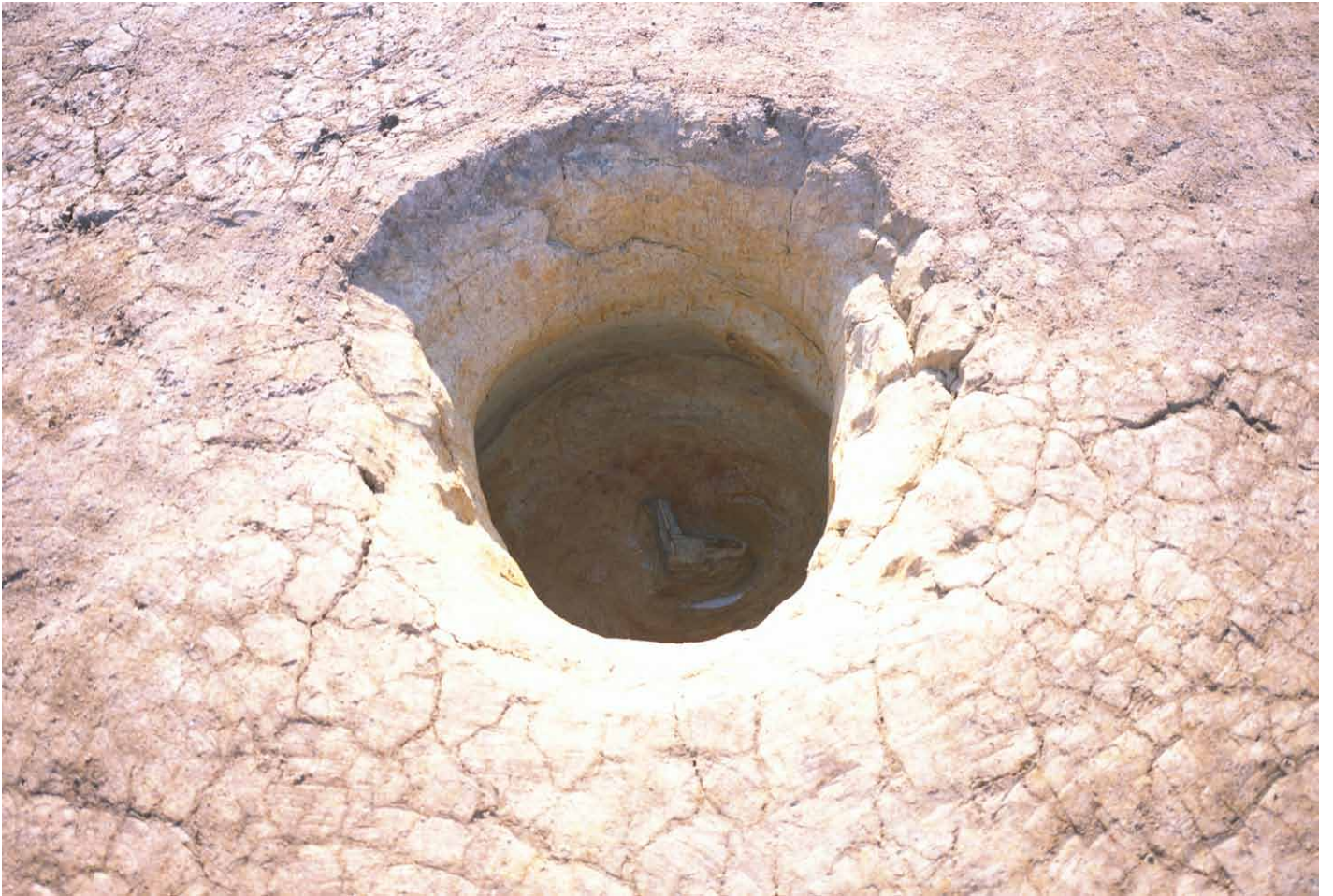
写真 248. 条坊跡第 285 次調査 285SE025 木製品陽物出土状況（東から）