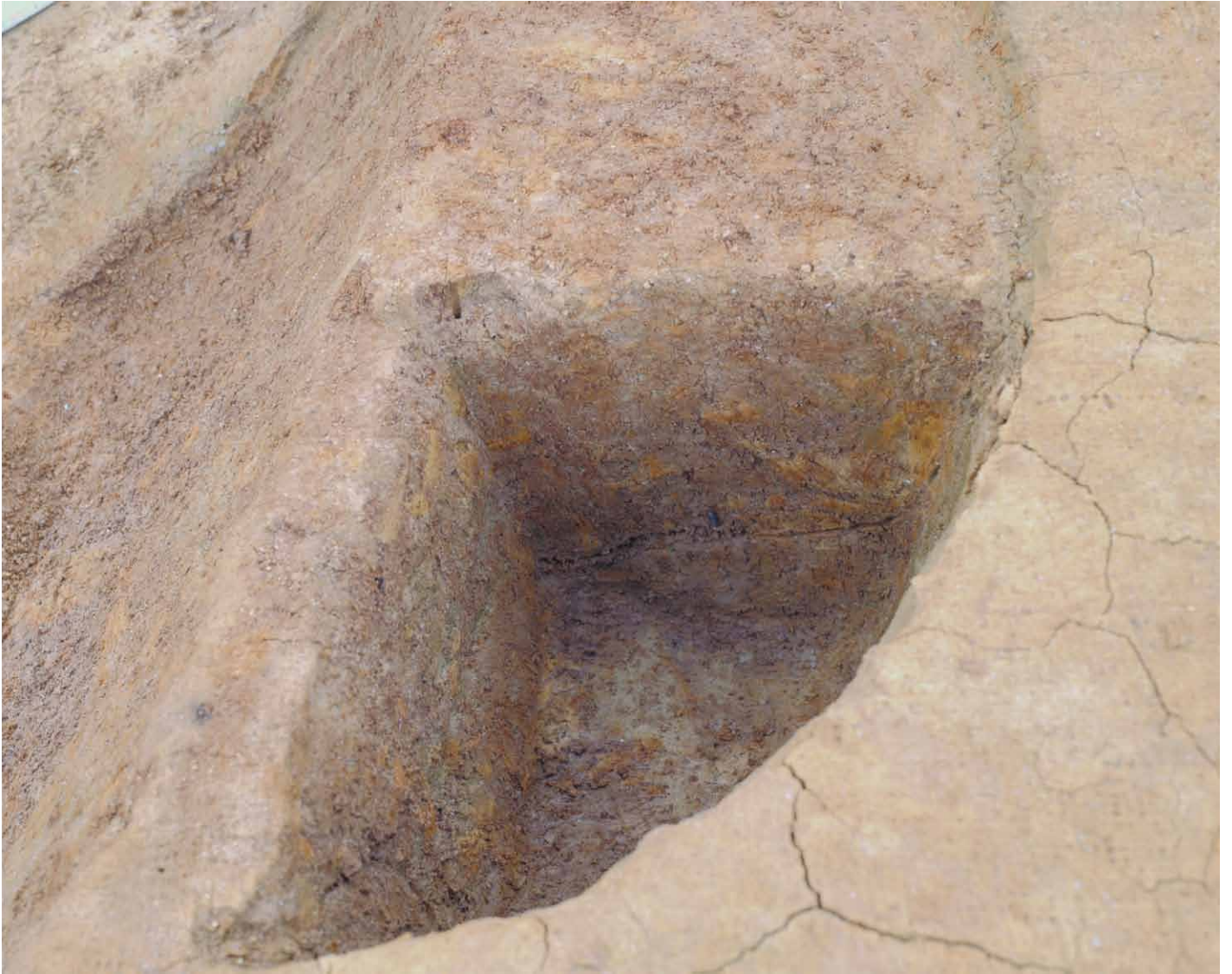
写真 50. 条坊跡第 275 次調査 275SB390d 土層観察（西から）