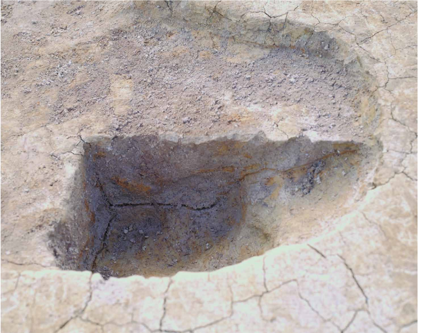
写真 51. 条坊跡第 275 次調査 275SB395a 土層観察（北から）