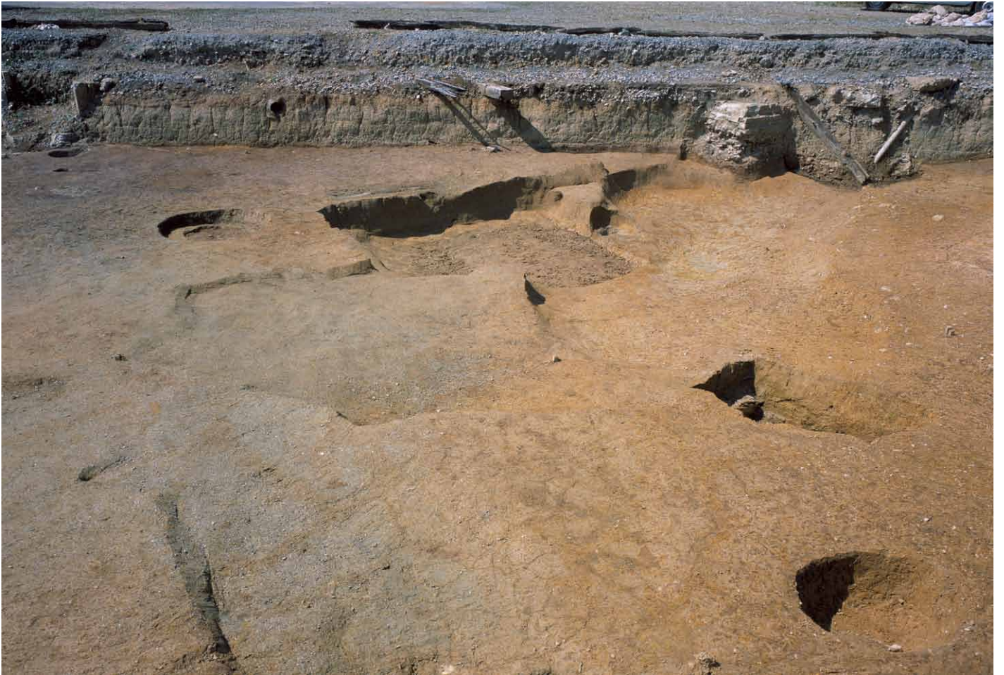
写真 262. 条坊跡第 285 次調査 285SX030・035 完掘状況（東から）