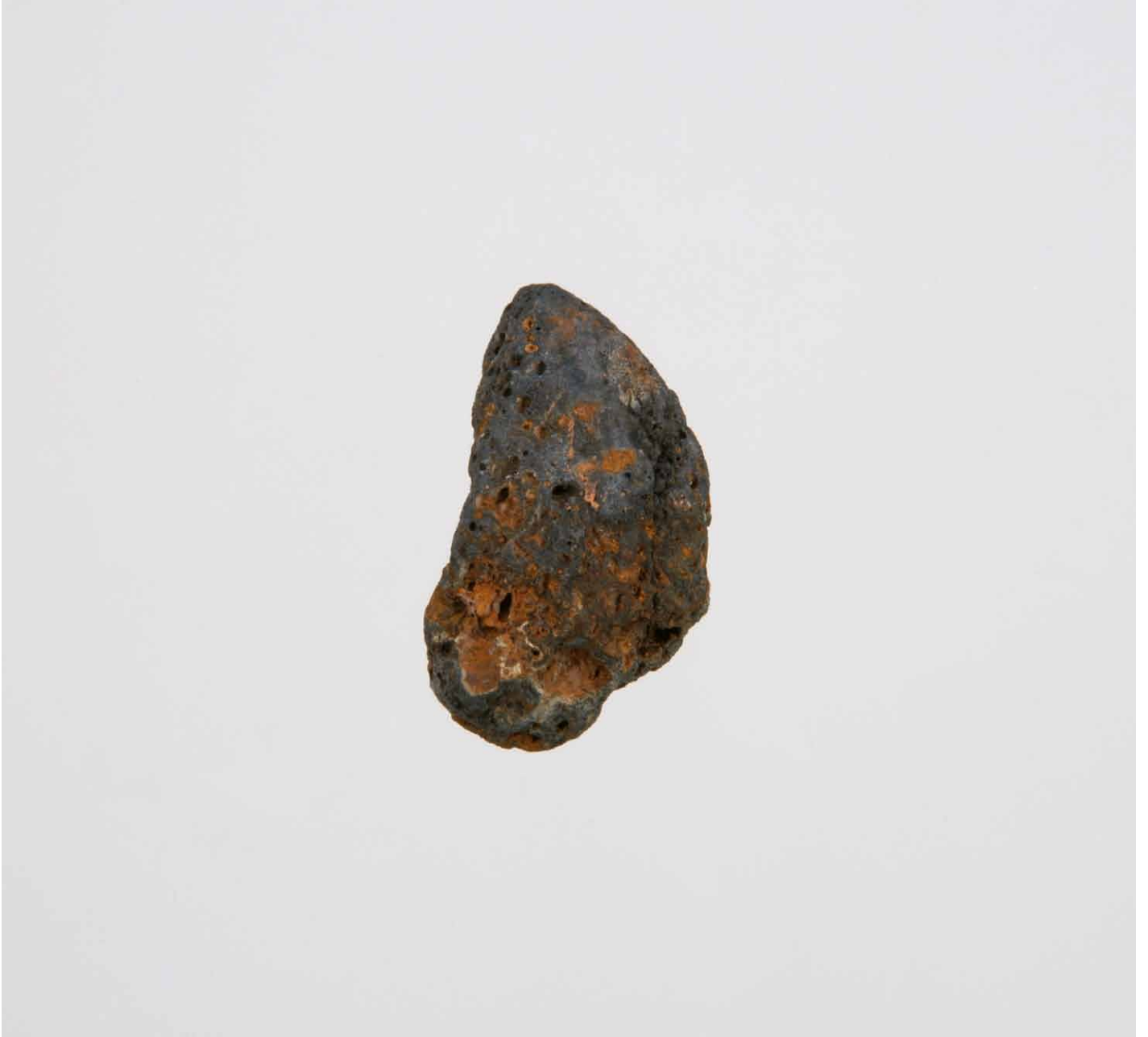
写真 191. 条 275 灰色砂 2