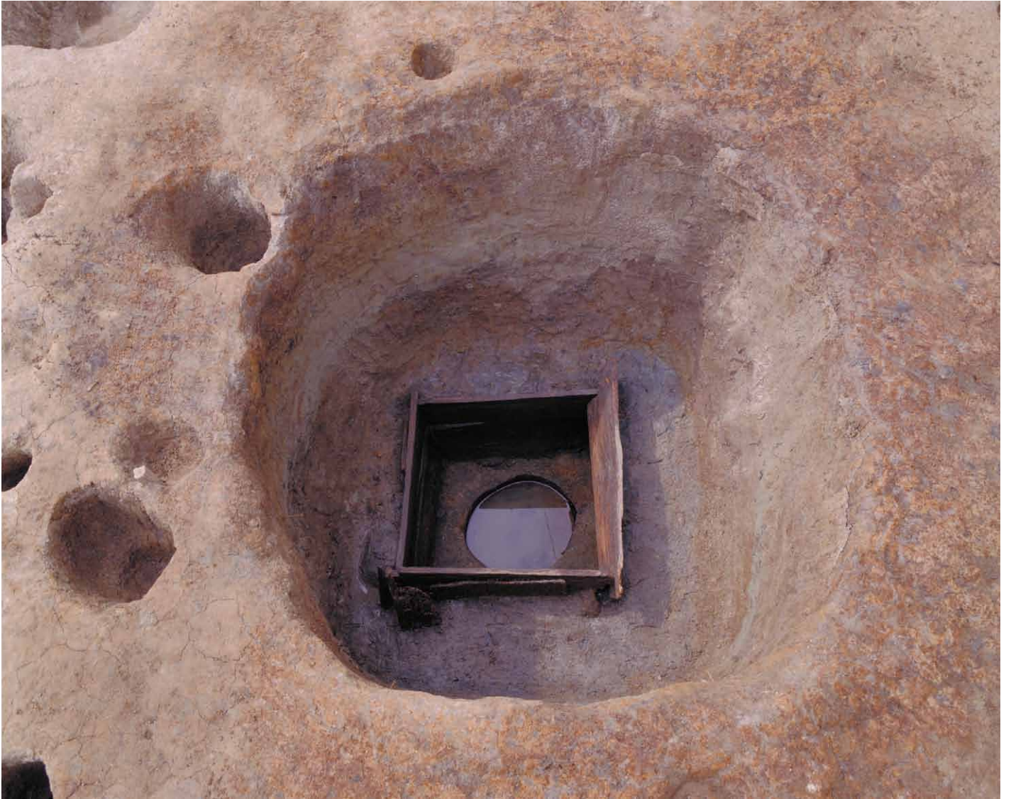
写真 29. 条坊跡第 275 次調査 275SE055 井戸枠・曲物検出状況（東から）