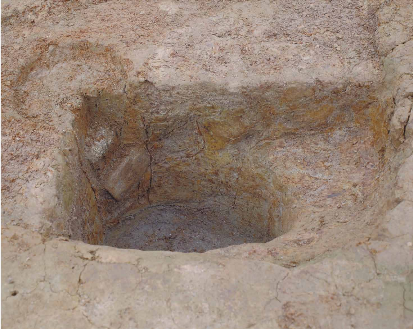
写真 44. 条坊跡第 275 次調査 275SB385a 土層観察（東から）