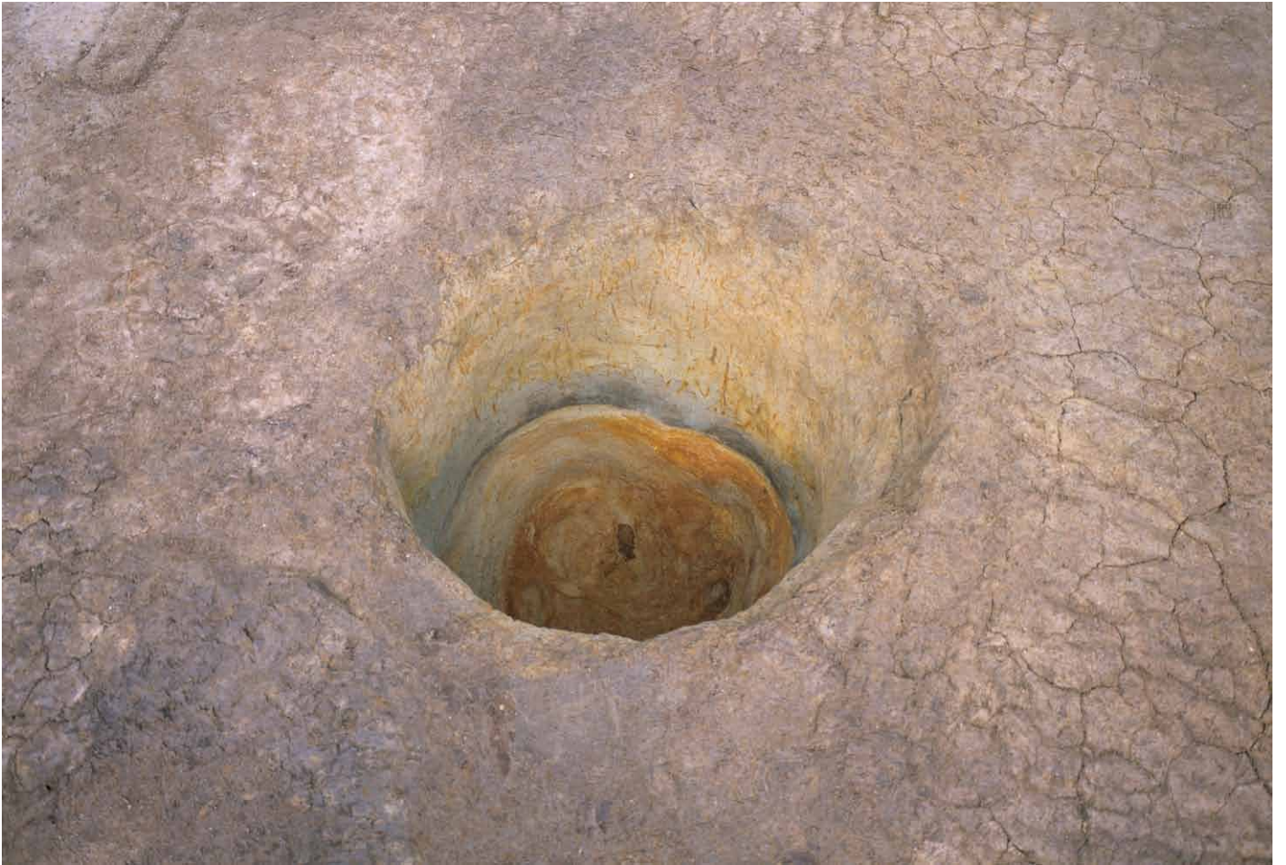
写真 252. 条坊跡第 285 次調査 285SE025 完掘状況（南から）