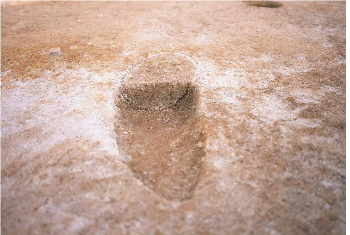
写真 275. 条坊跡第 285 次調査 285SX065b 波板状痕跡 半裁（西から）