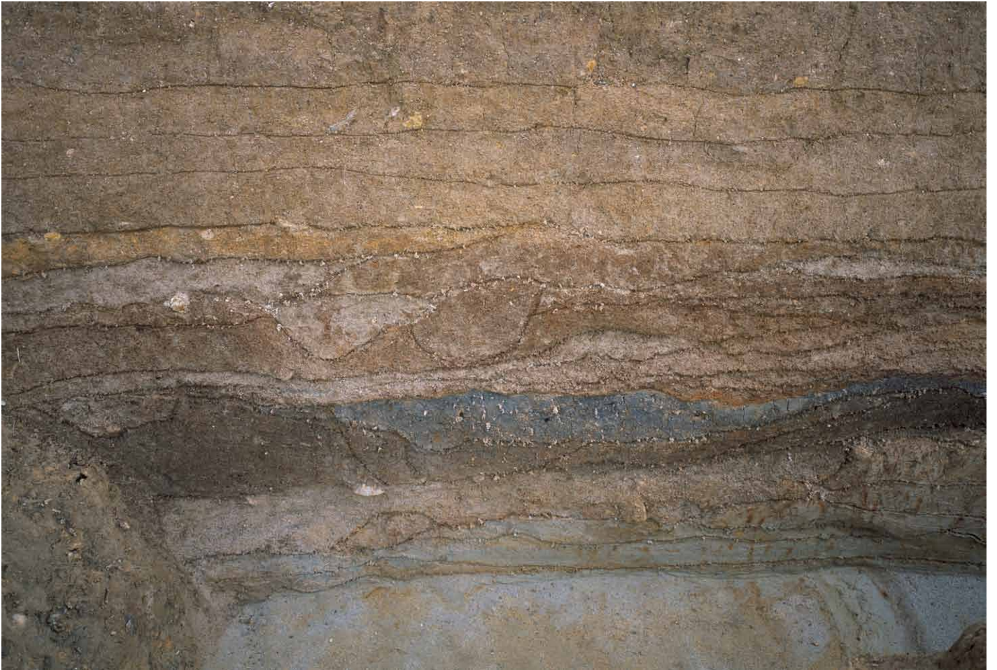
写真 300. 条坊跡第 285 次調査 北壁トレンチ 推定道路路盤 2 段目・3 段目西半 (+4 段目) (南から)