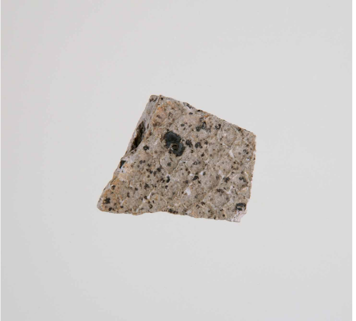
写真 162. 条 275SK278 灰色砂 外面