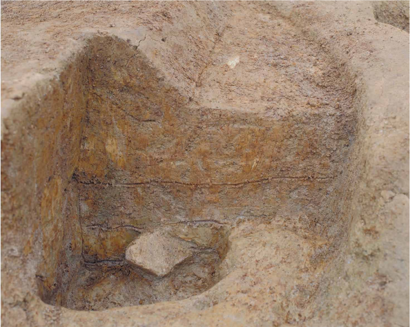
写真 47. 条坊跡第 275 次調査 275SB390a 土層観察（東から）