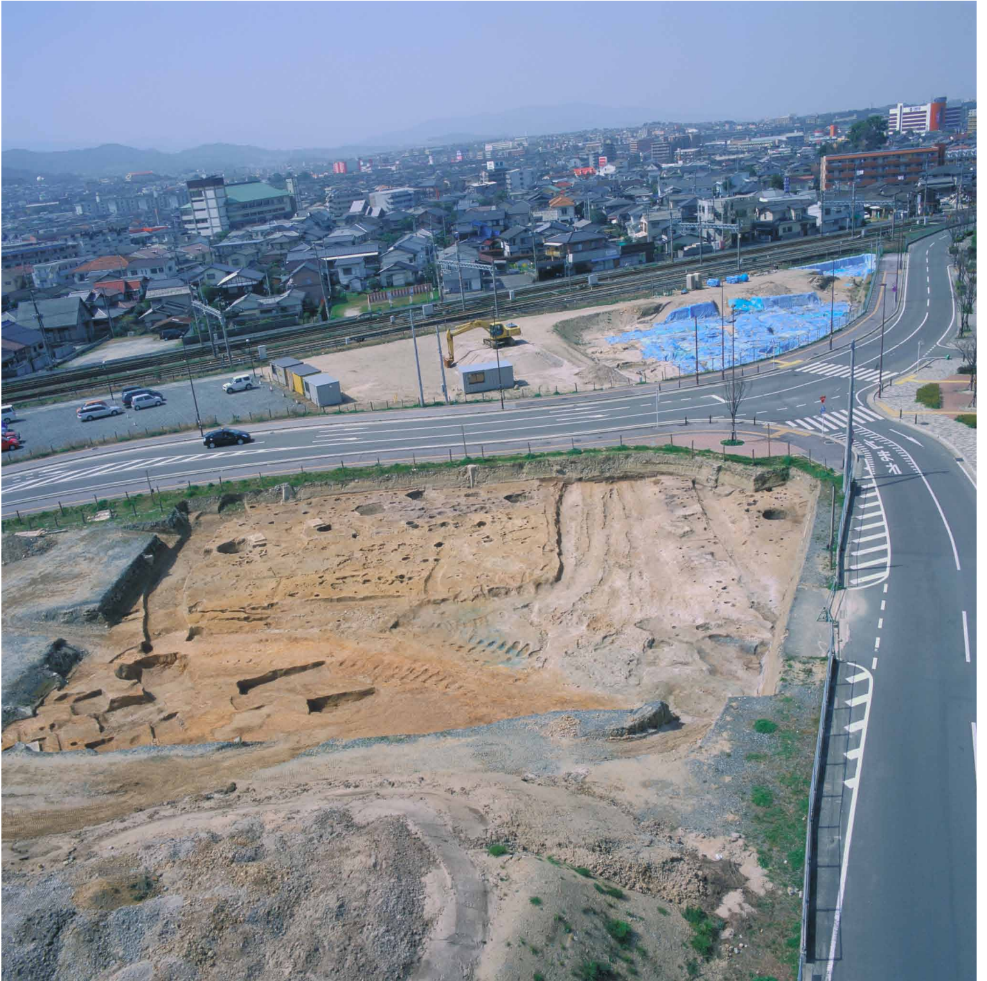
写真 5. 条坊跡第 275 次調査 空中写真 第 2 面調査区全景（東から）