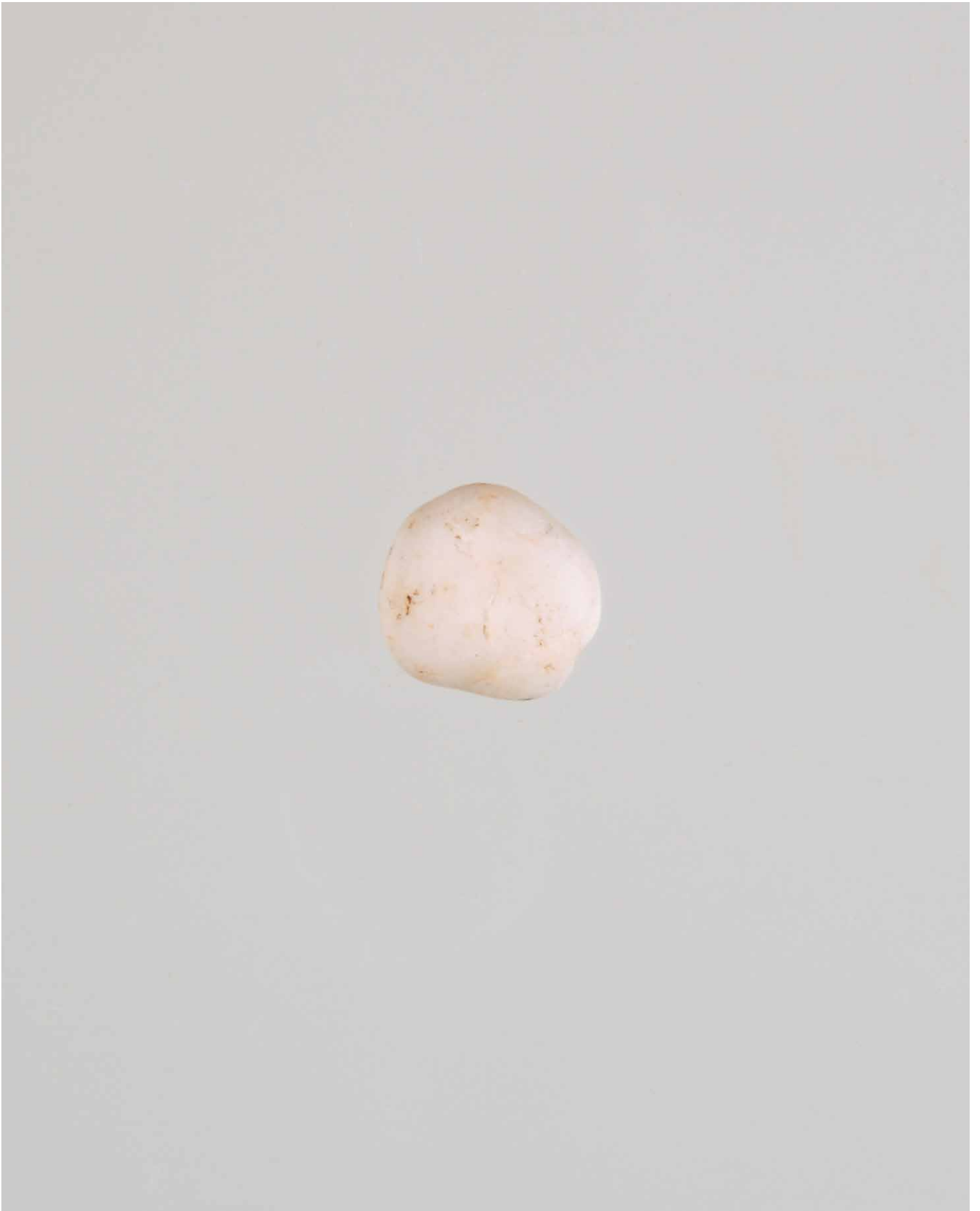
写真 96. 条 275SD050 茶灰色粘質土