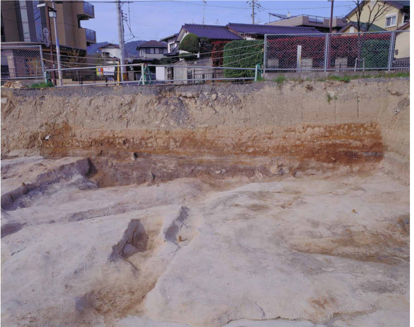
写真 71. 条坊跡第 275 次調査 北壁（条坊路交差点付近）土層観察（南から）