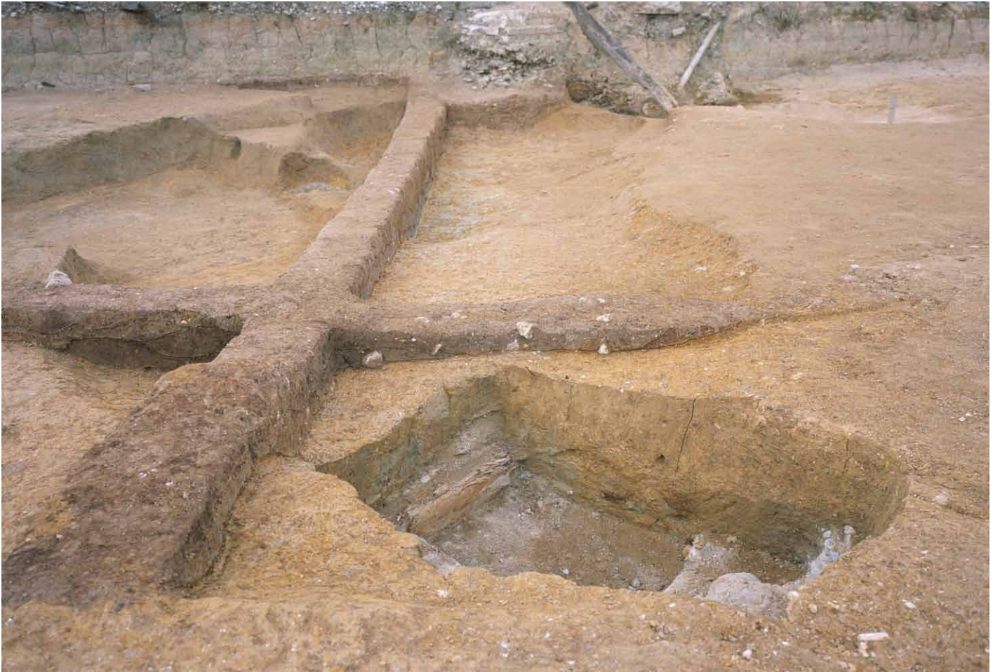
写真 258. 条坊跡第 285 次調査 285SX030・035 南北ベルト土層観察 北半（東から）