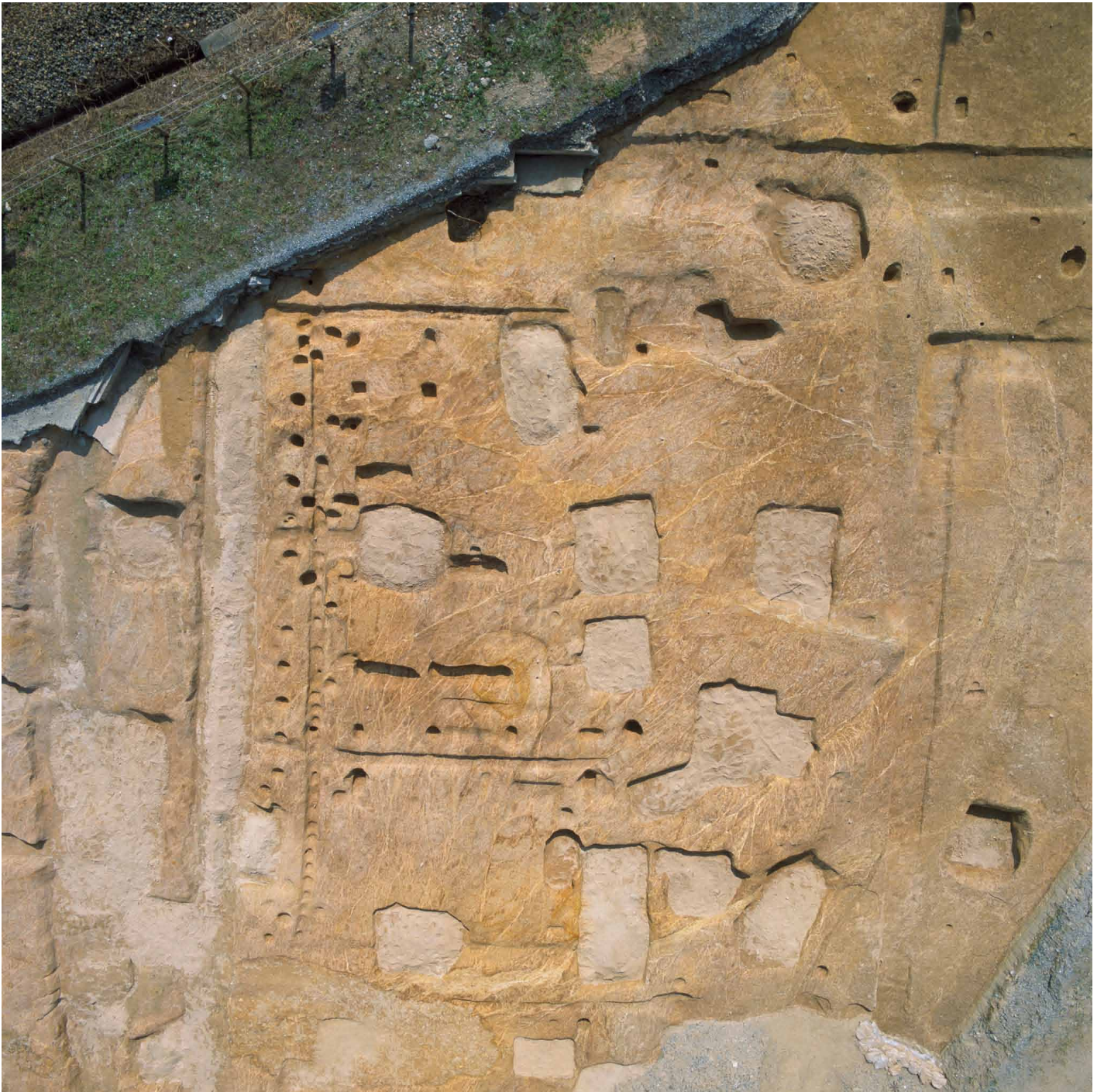
写真 218. 条坊跡第 285 次調査 空中写真 調査中部東側 全景（上が東）