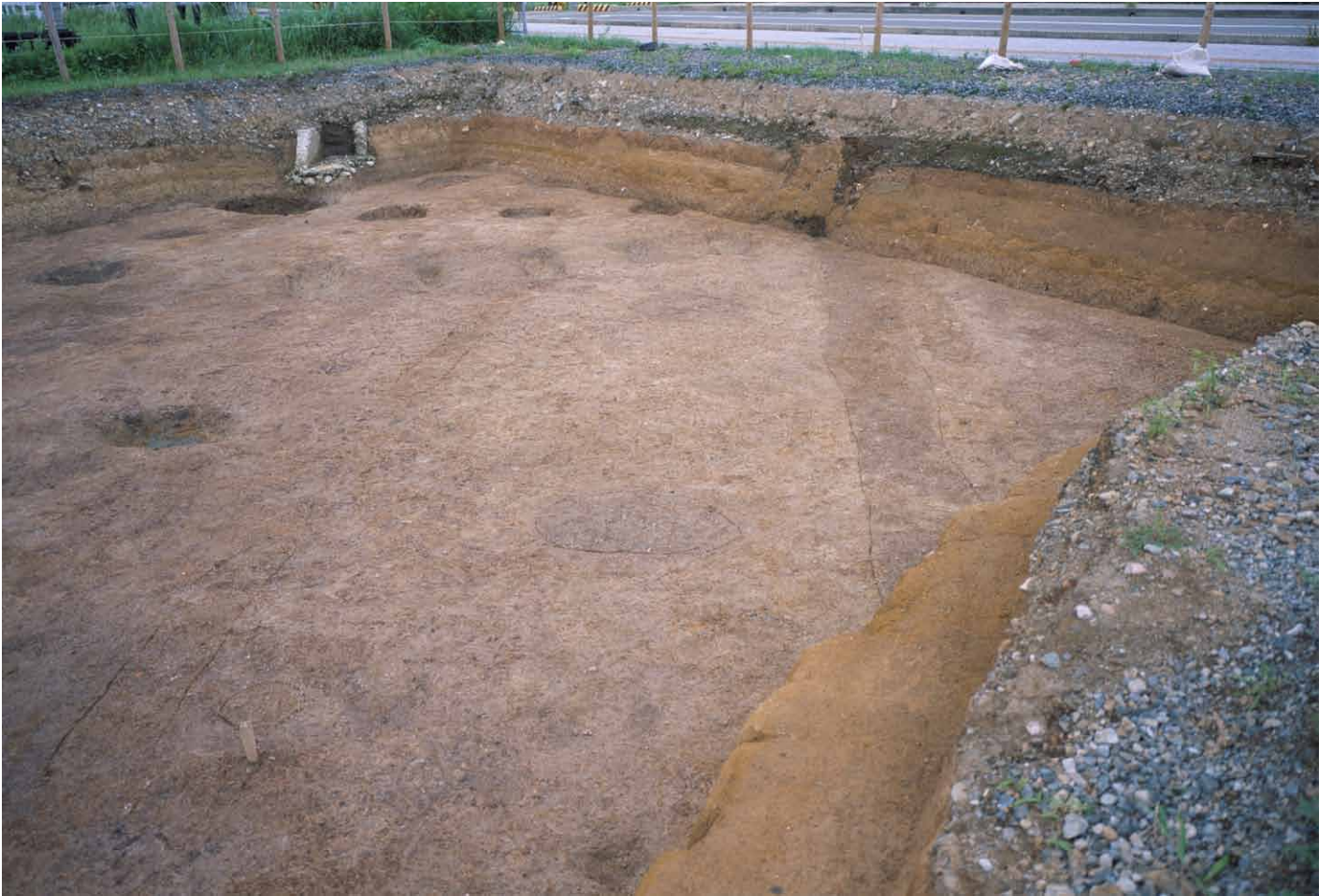
写真 229. 条坊跡第 285 次調査 285SD002・005・010 検出状況（北から）