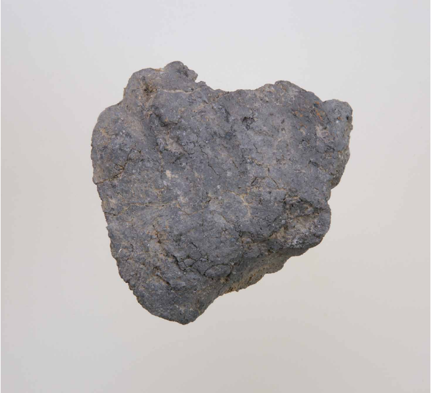
写真 199. 条 275 灰色砂 2 内面