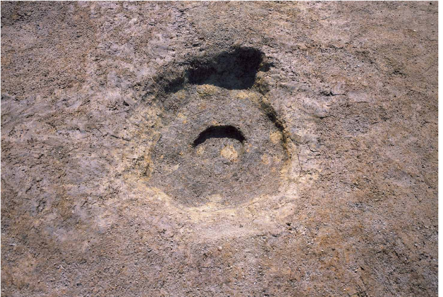
写真 244. 条坊跡第 285 次調査 285SB020b 柱痕検出状況（北から）