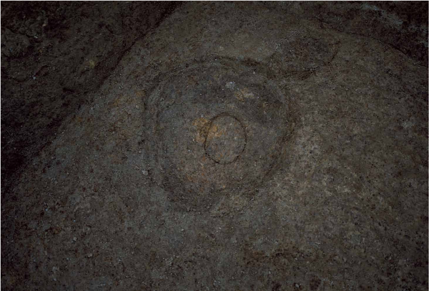
写真 235. 条坊跡第 285 次調査 285SB015a 柱痕検出状況（北から）