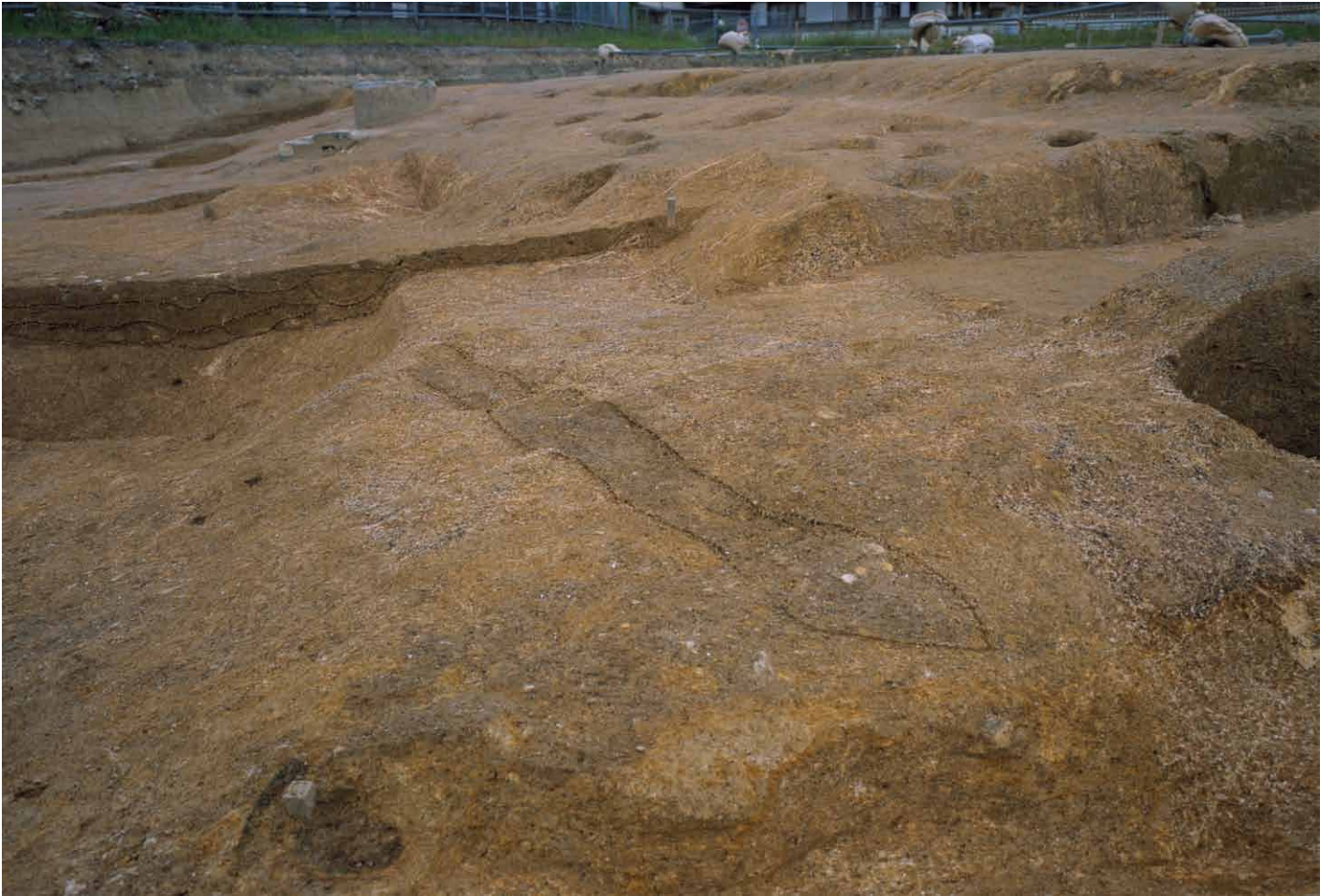
写真 269. 条坊跡第 285 次調査 S-60 検出状況（東から）