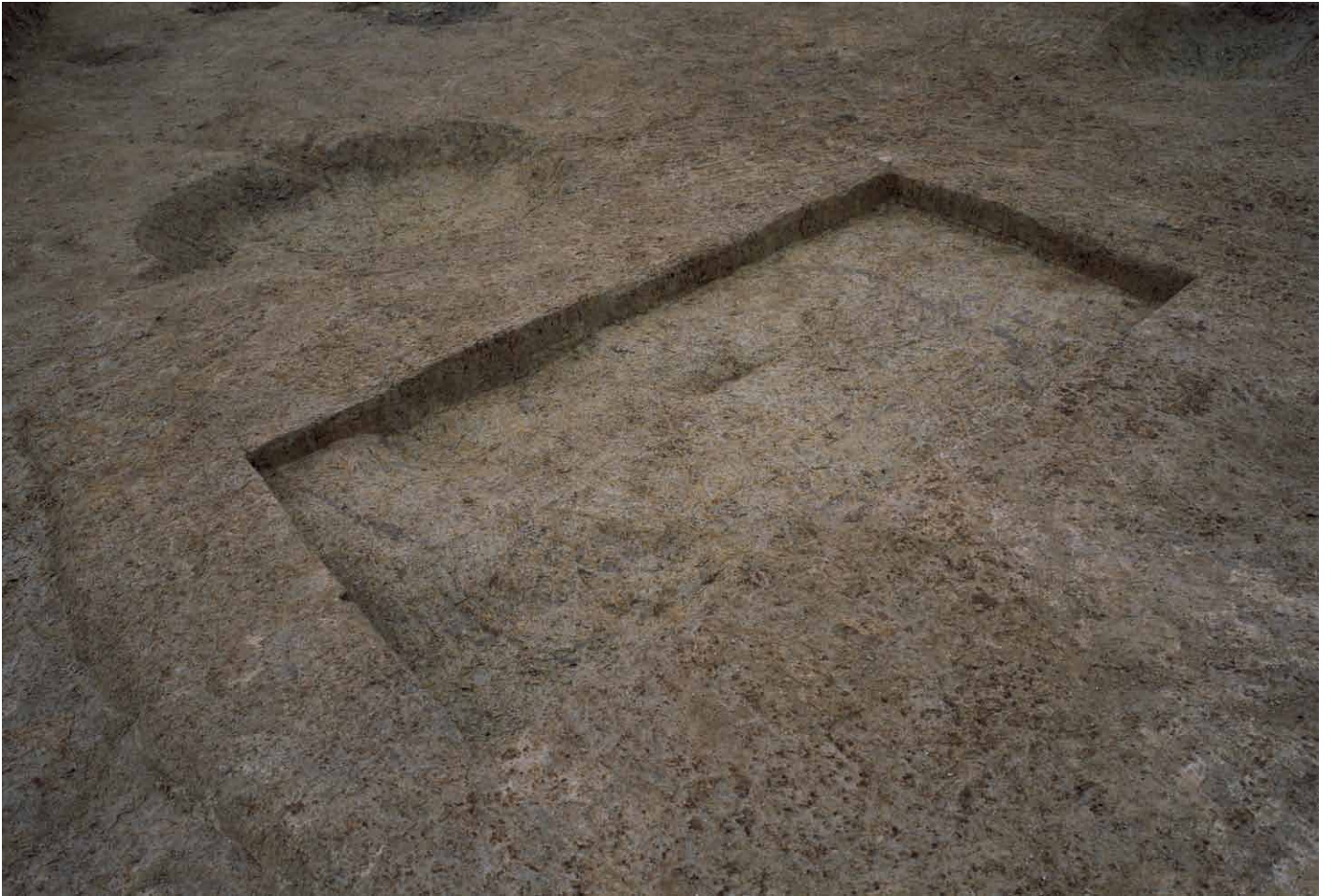
写真 304. 条坊跡第 285 次調査 調査区南部トレンチ 2 (南西から)