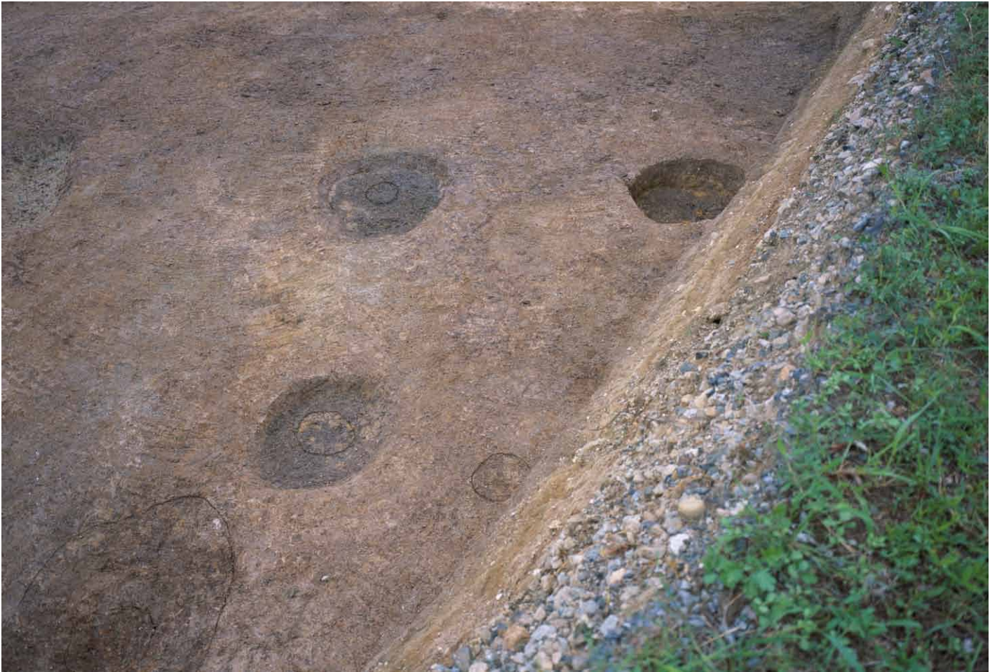
写真 241. 条坊跡第 285 次調査 285SB020 柱痕検出状況（南から）