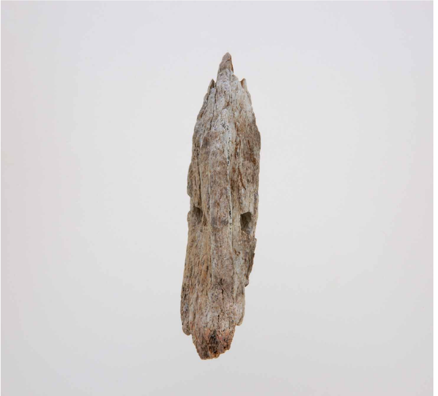
写真 180. 条 275 暗茶灰色土 2 側面