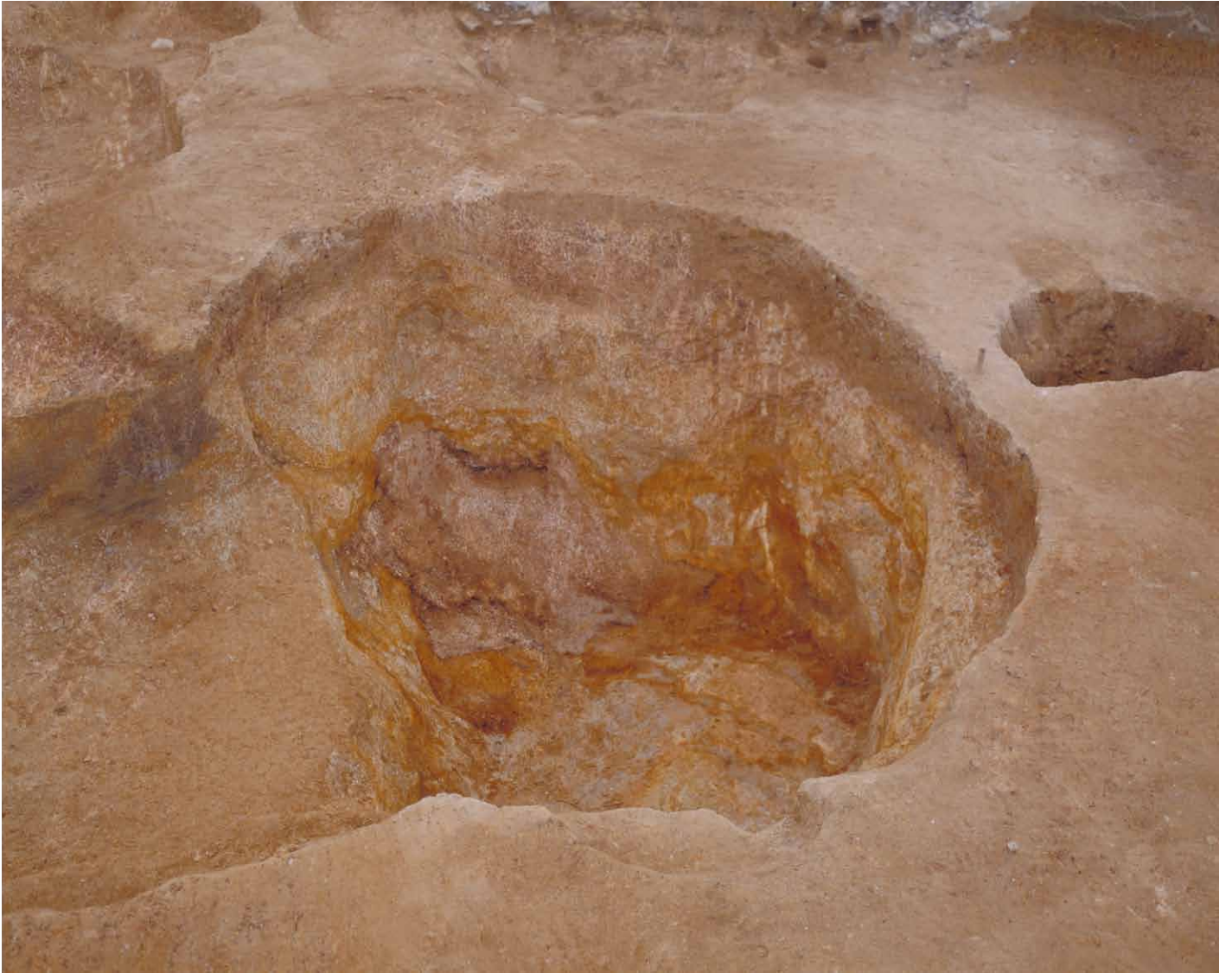
写真 40. 条坊跡第 275 次調査 275SK164 完掘（北から）