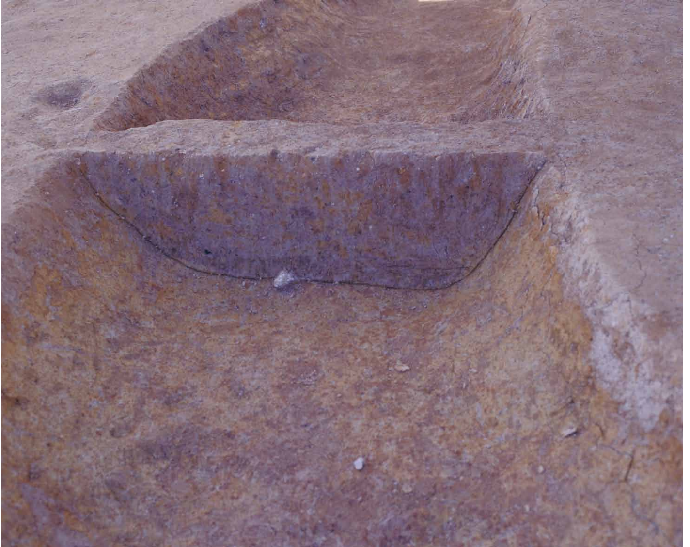
写真 12. 条坊跡第 275 次調査 275SD030 土層観察 3(東から)