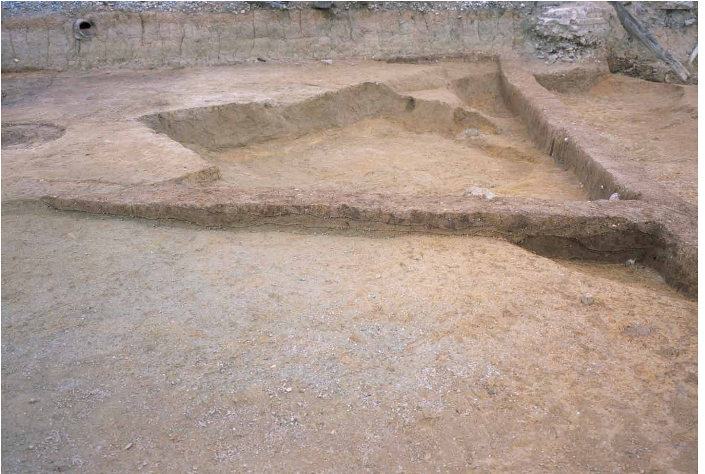
写真 259. 条坊跡第 285 次調査 285SX030・035 南北ベルト土層観察 南半（東から）