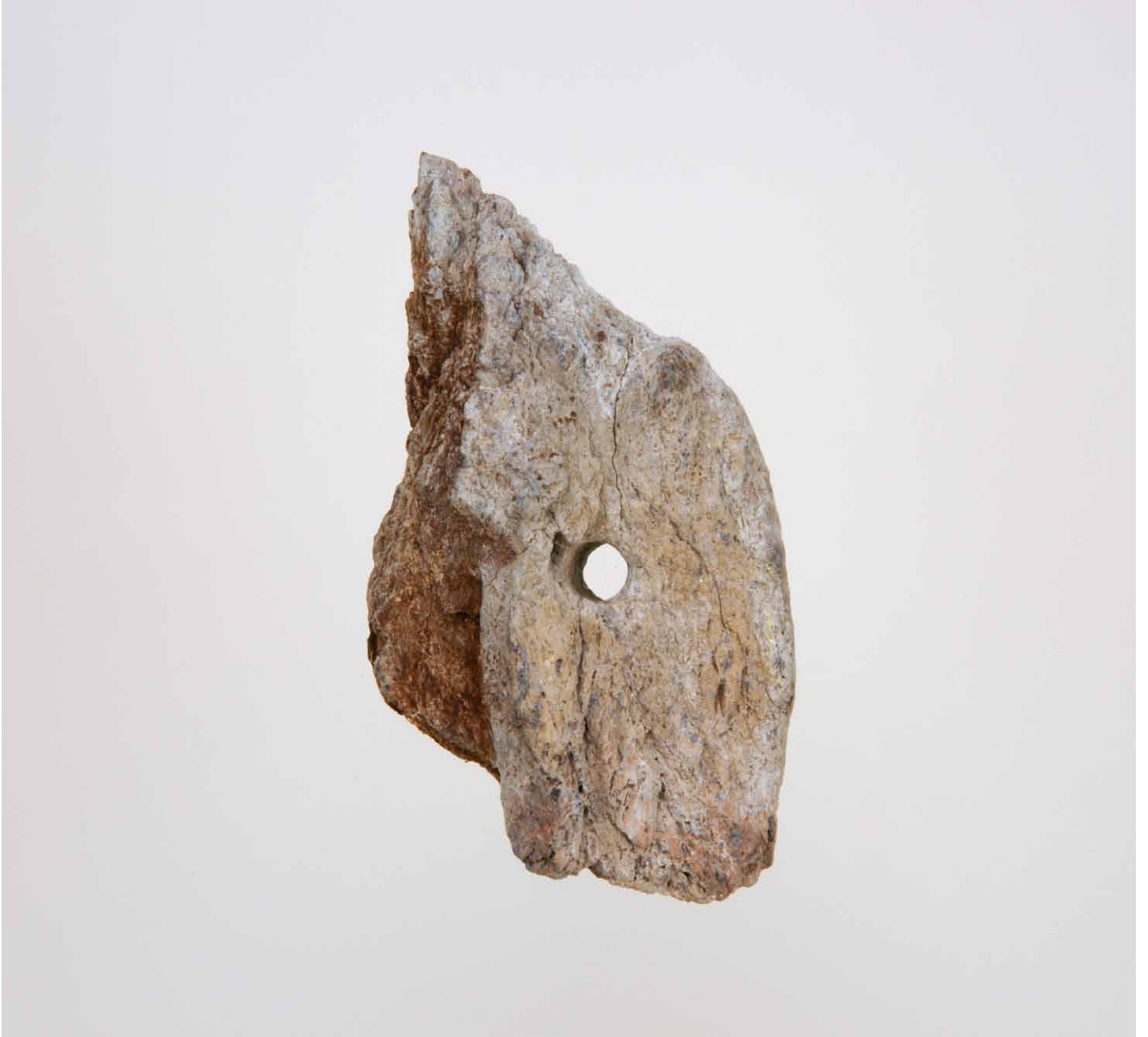
写真 181. 条 275 暗茶灰色土 2 表