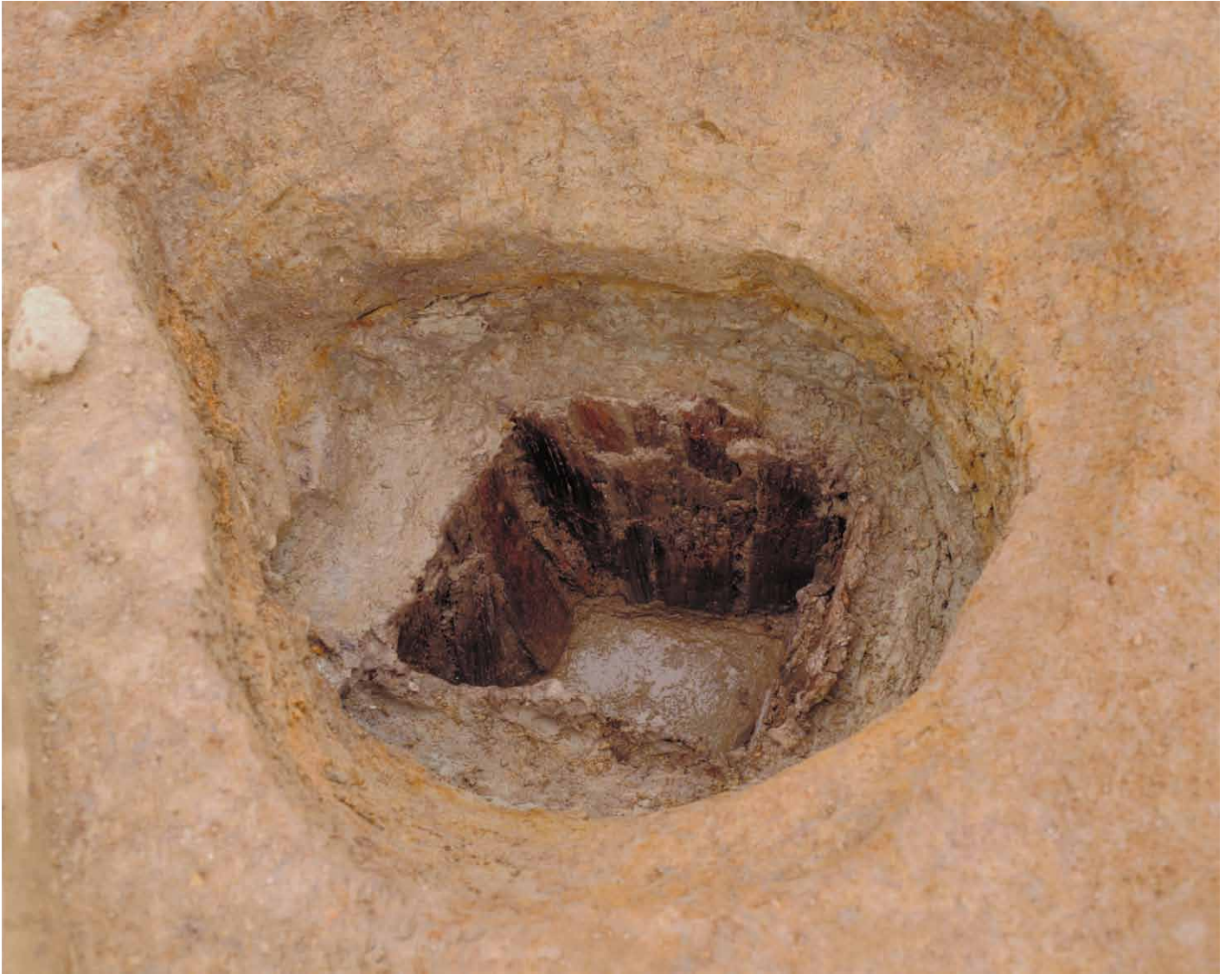
写真 64. 条坊跡第 275 次調査 275SE245 井戸枠出土状況（南から）