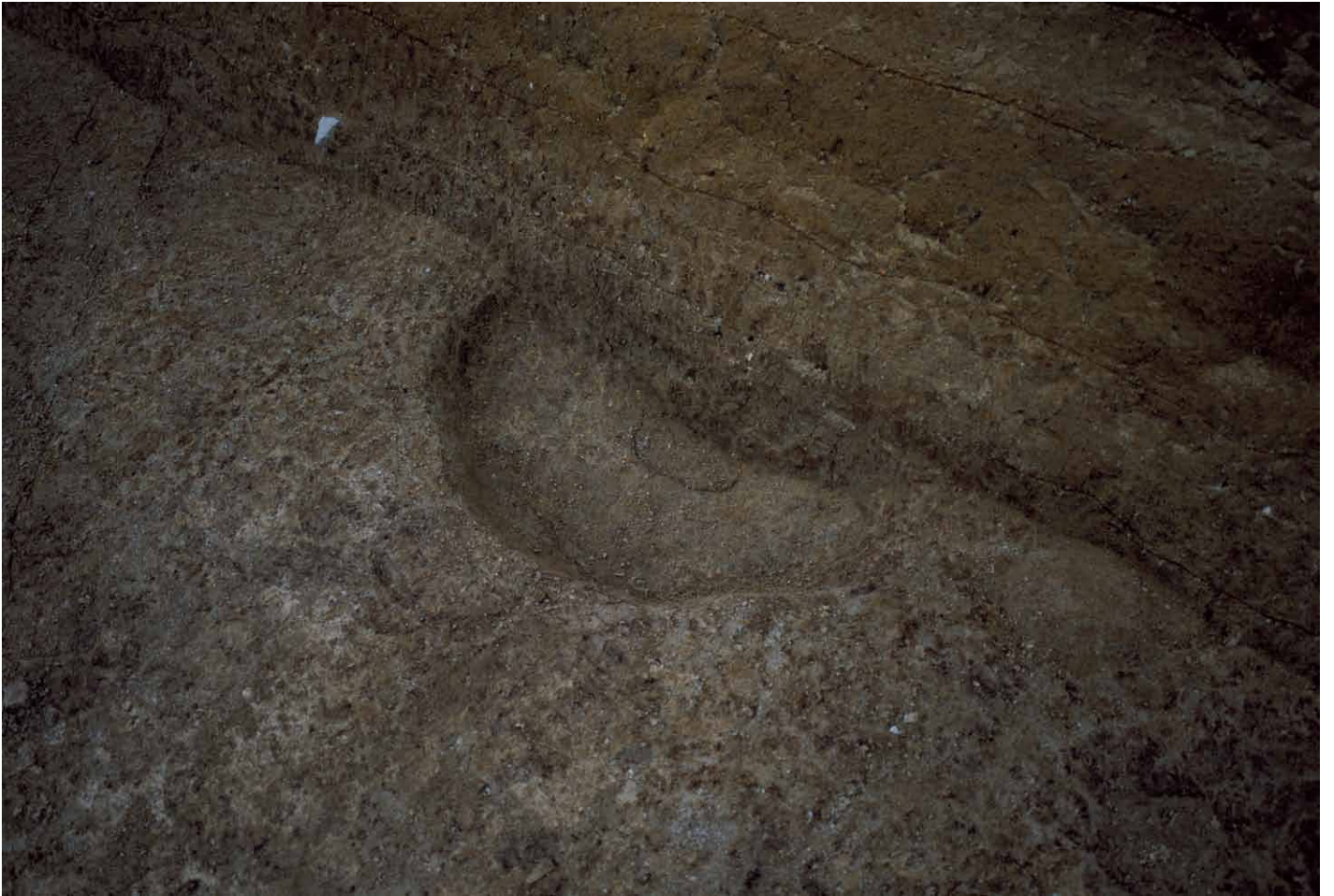
写真 239. 条坊跡第 285 次調査 285SB015d 柱痕検出状況（北から）