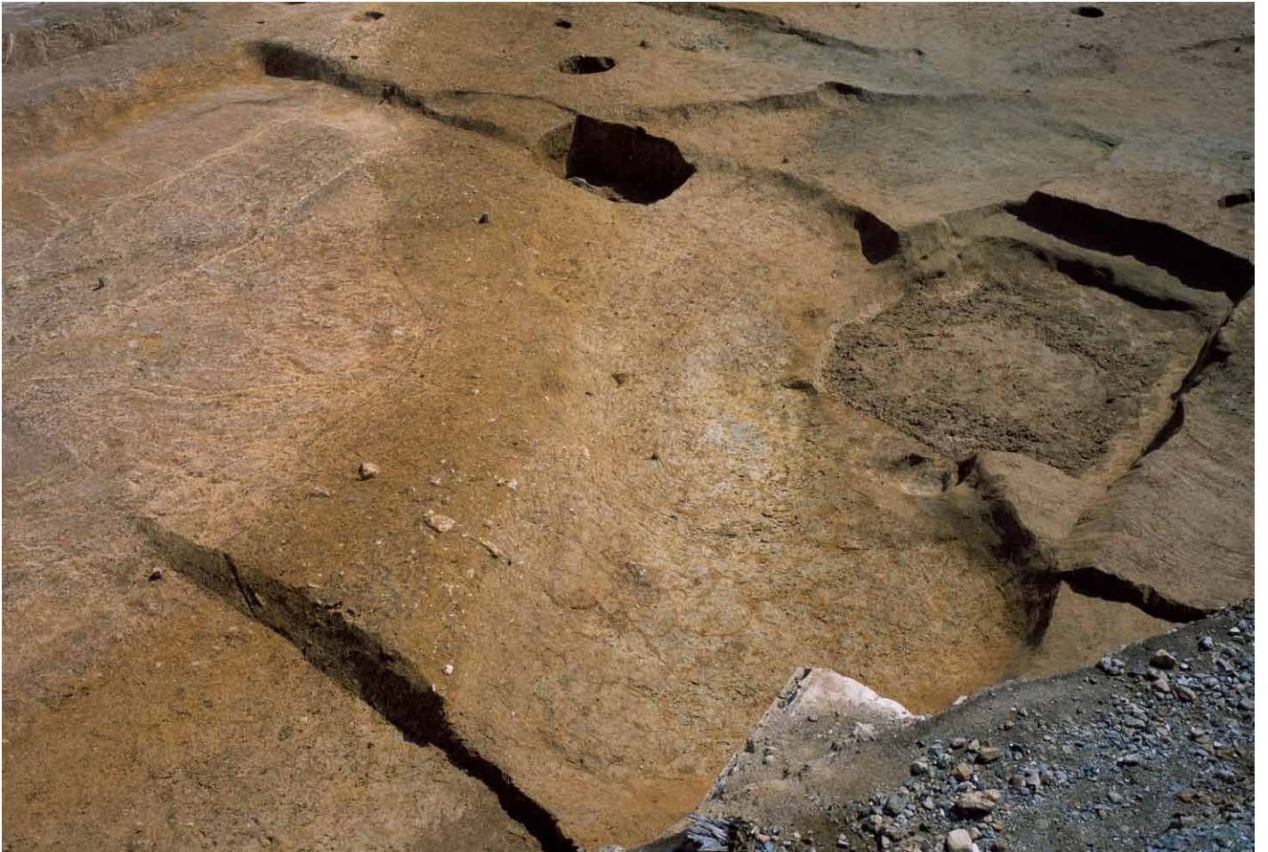
写真 260. 条坊跡第 285 次調査 285SX030 完掘状況（西から）