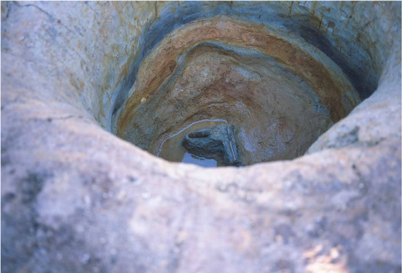
写真 249. 条坊跡第 285 次調査 285SE025 木製品陽物出土状況 近景（西から）