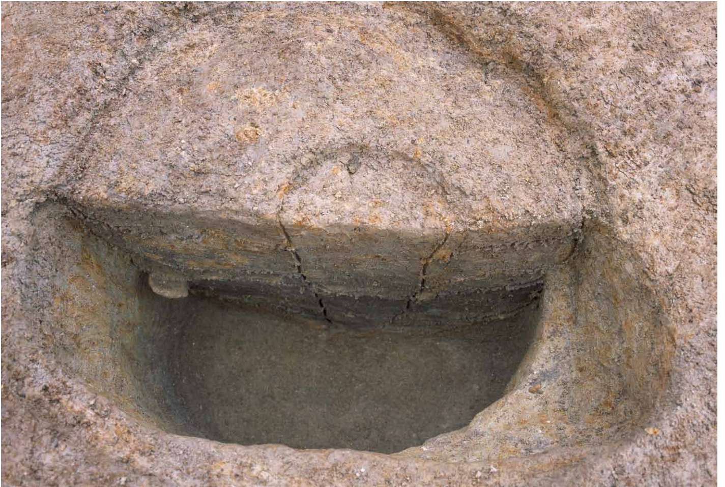
写真 236. 条坊跡第 285 次調査 285SB015a 半裁状況 2(東から)