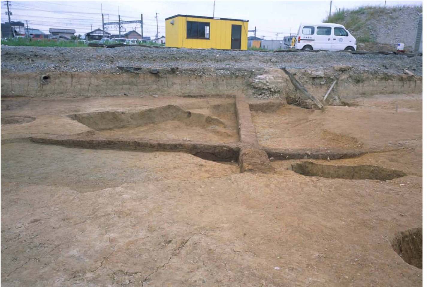
写真 254. 条坊跡第 285 次調査 285SX030・035 南北ベルト土層観察（東から）