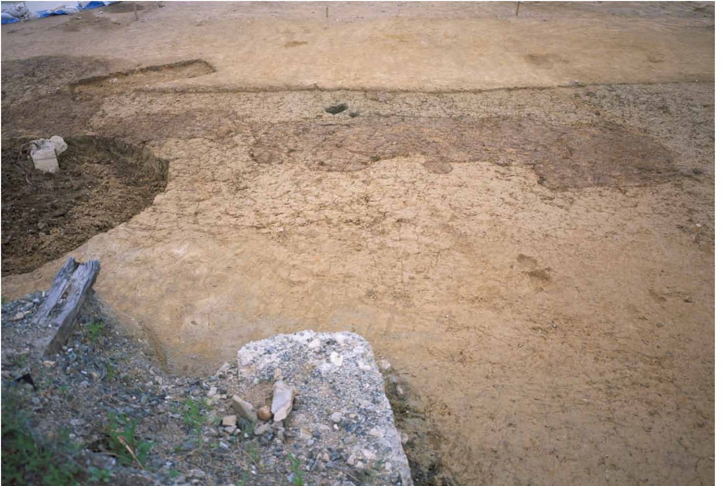
写真 291. 条坊跡第 285 次調査 285SK110 連続土坑状遺構 検出状況（東から）北側