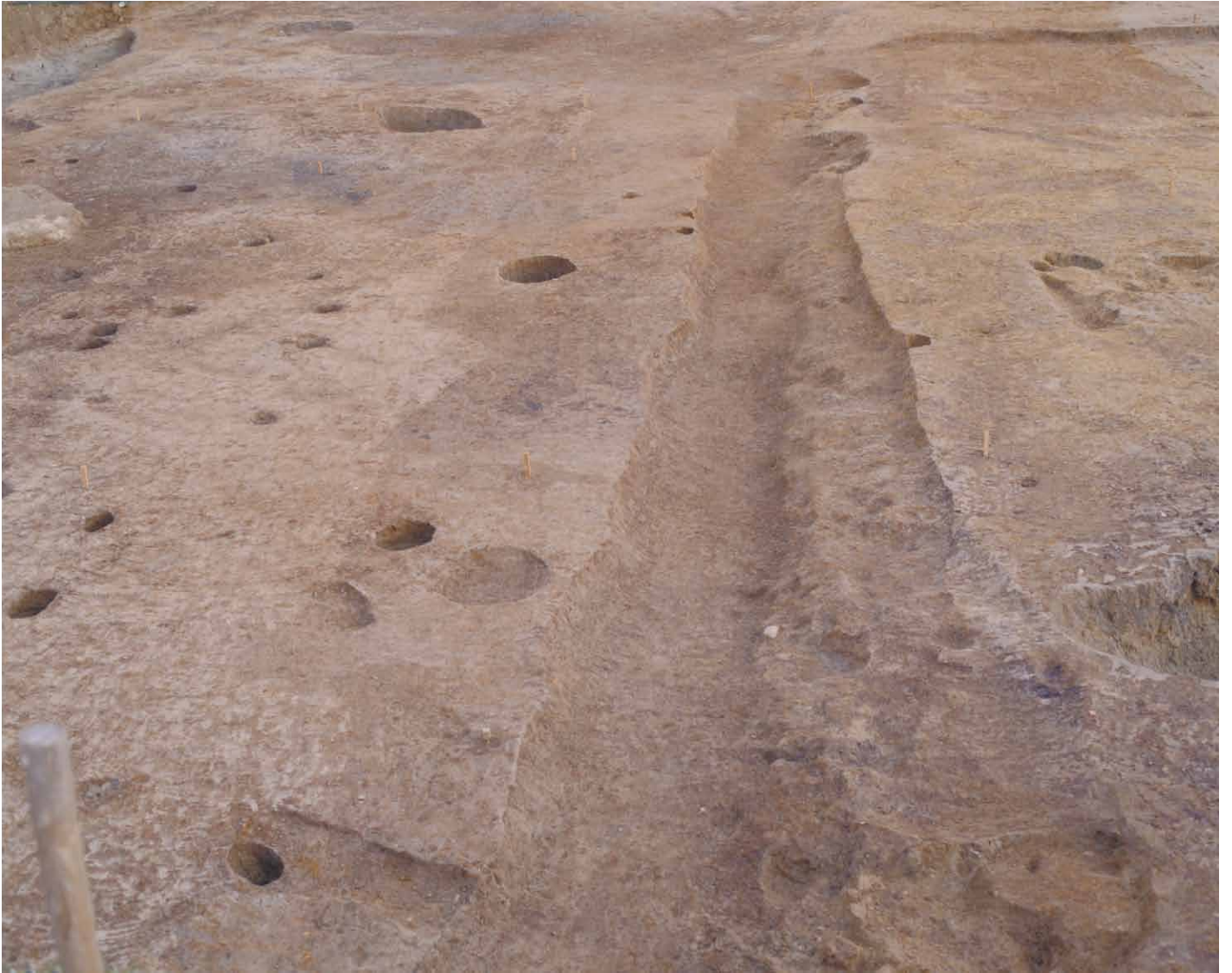
写真 21. 条坊跡第 275 次調査 275SD050 K ライン完掘 (西から)