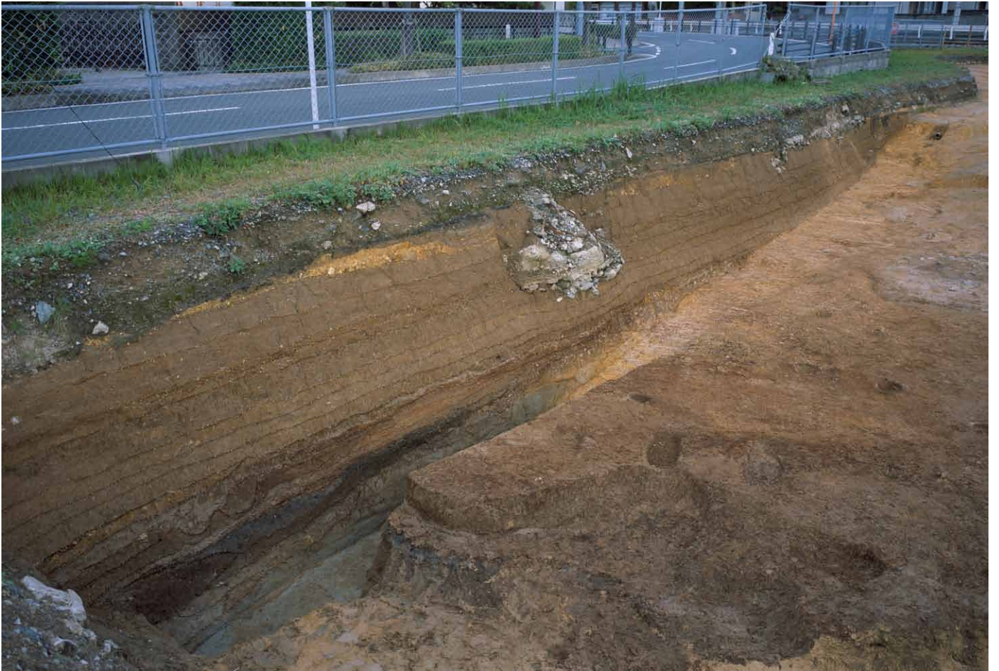
写真 292. 条坊跡第 285 次調査 調査区北壁トレンチ 土層観察（西から）