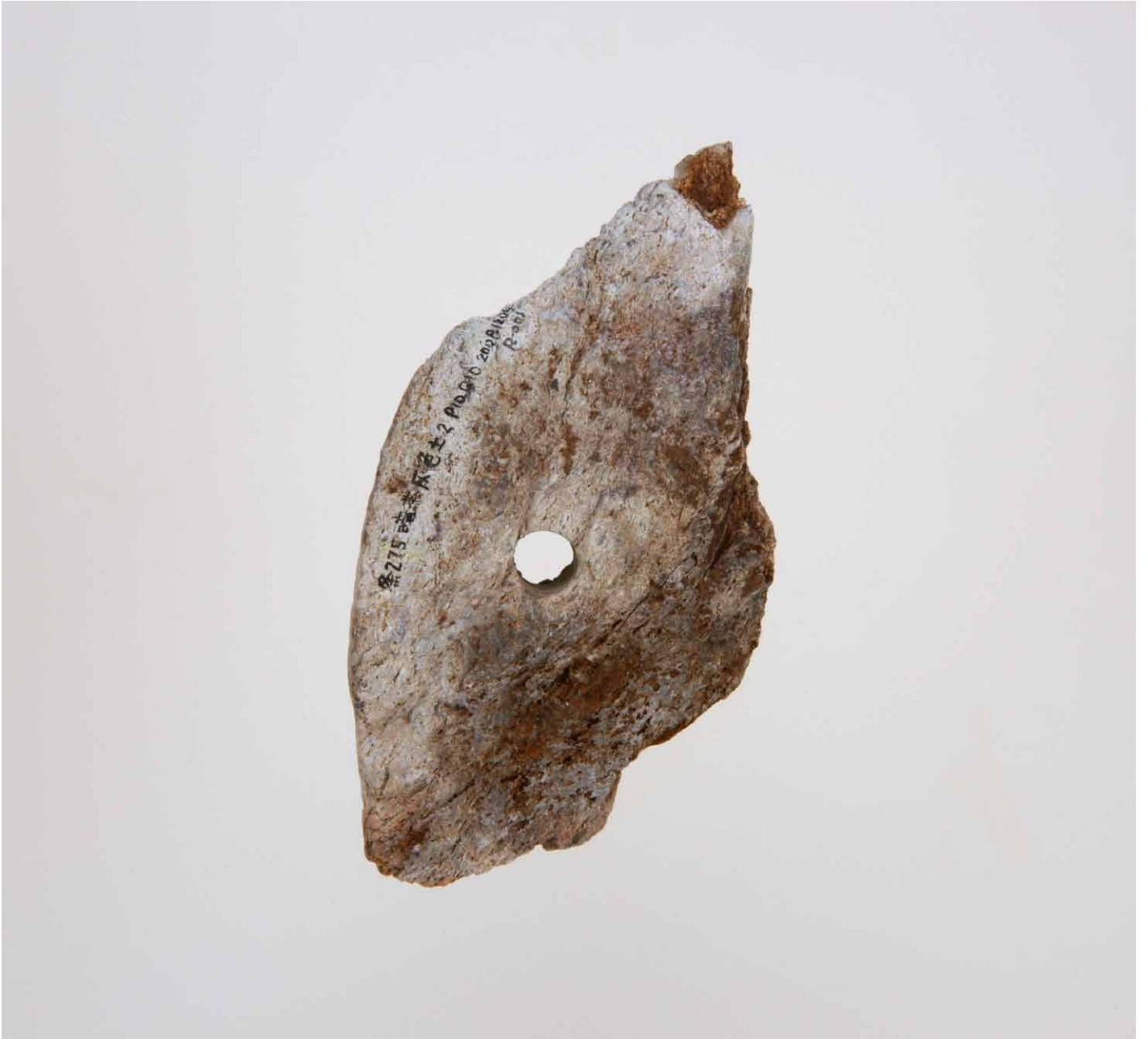
写真 182. 条 275 暗茶灰色土 2 裏