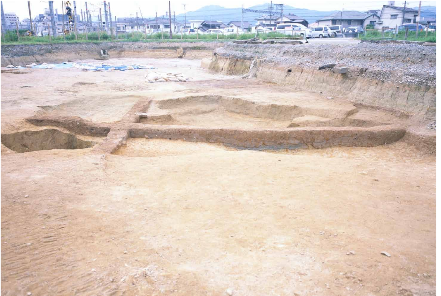
写真 255. 条坊跡第 285 次調査 285SX030・035 東西ベルト土層観察（北から）