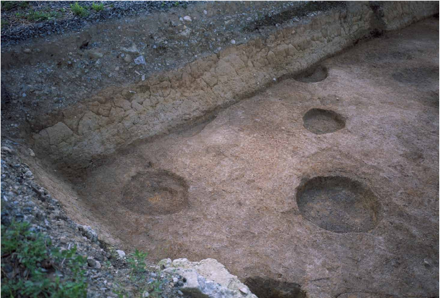
写真 234. 条坊跡第 285 次調査 285SB015 柱痕検出状況（東から）