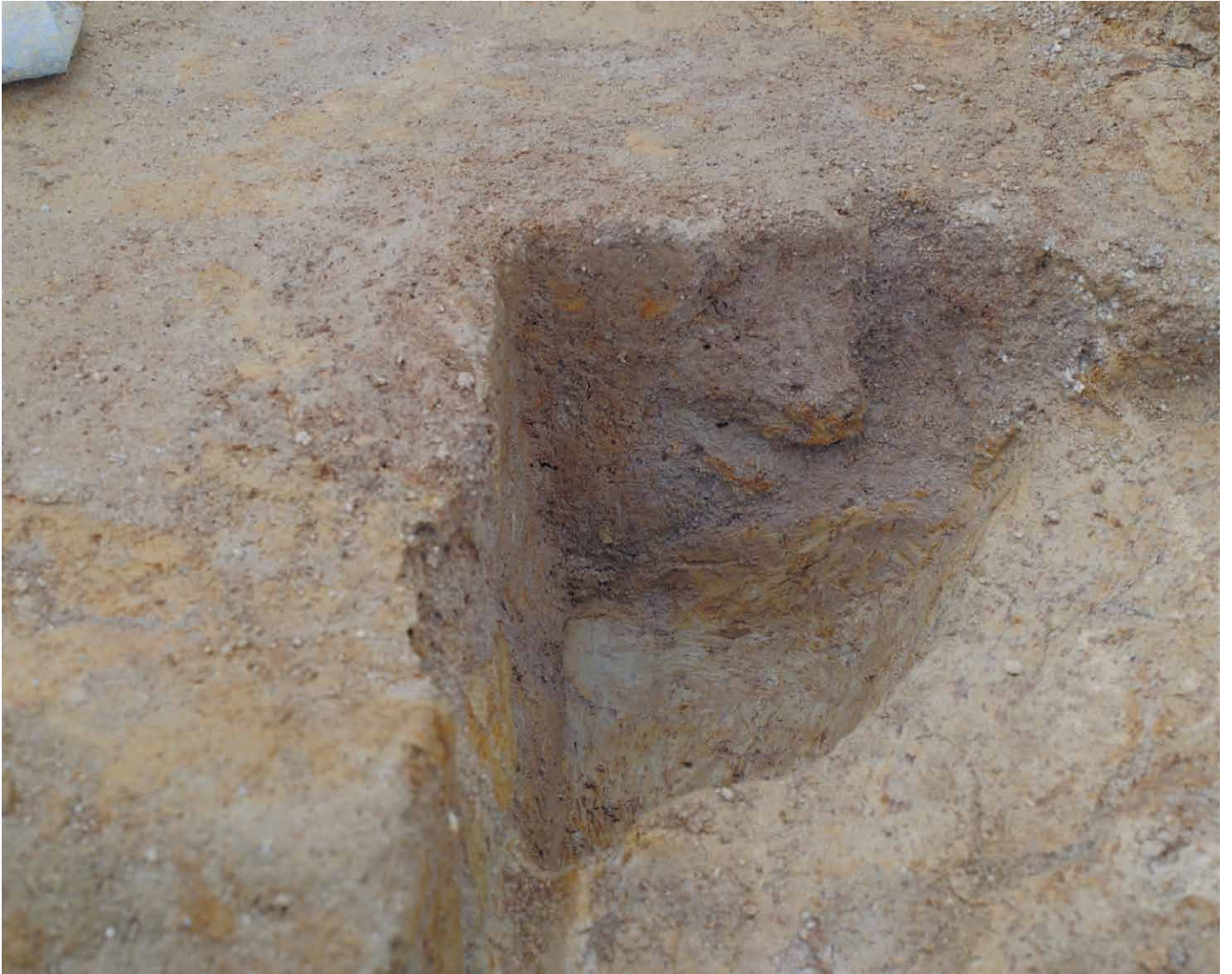
写真 52. 条坊跡第 275 次調査 275SB395d 土層観察（西から）