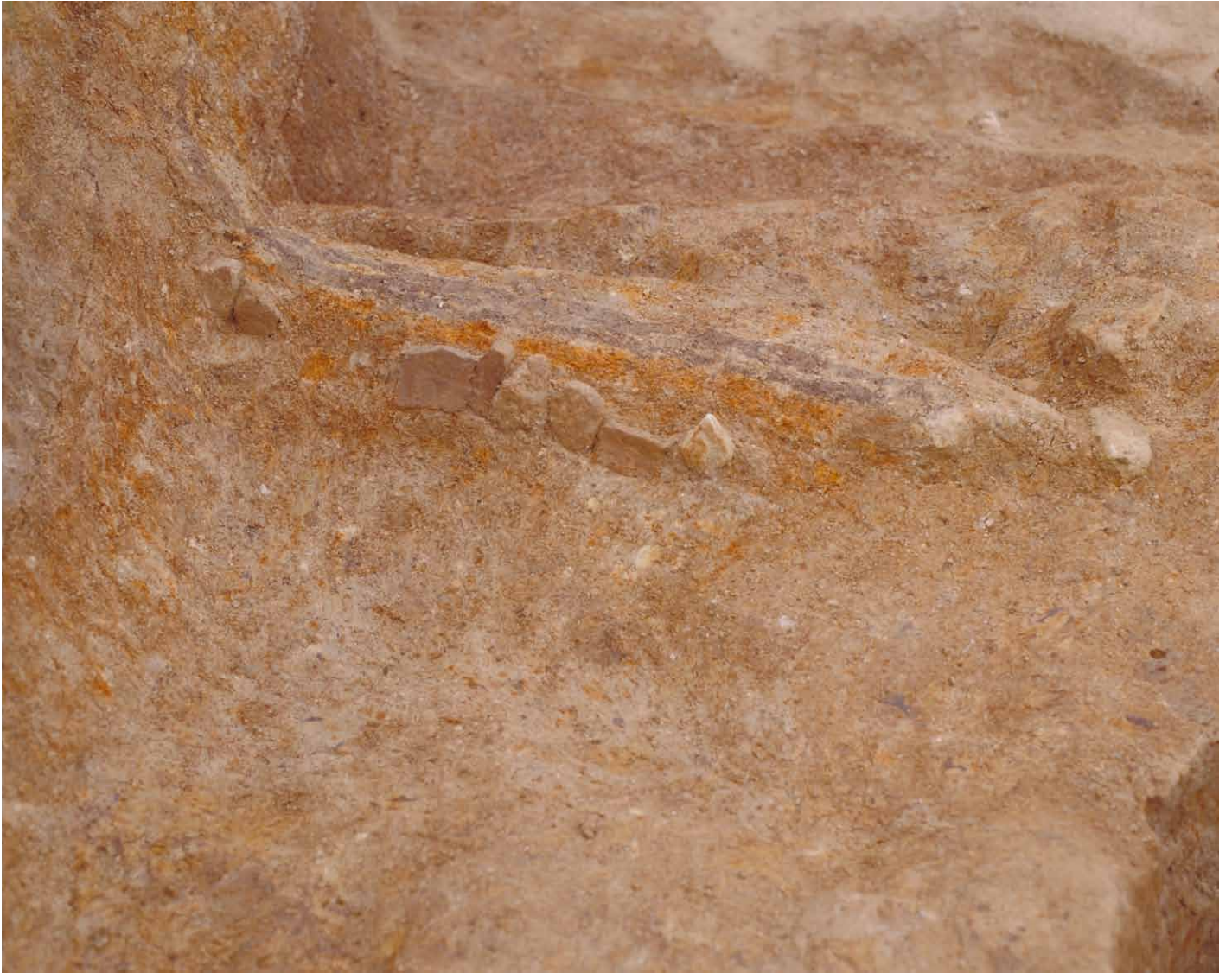
写真 36. 条坊跡第 275 次調査 275SX060 外壁一部（南から）