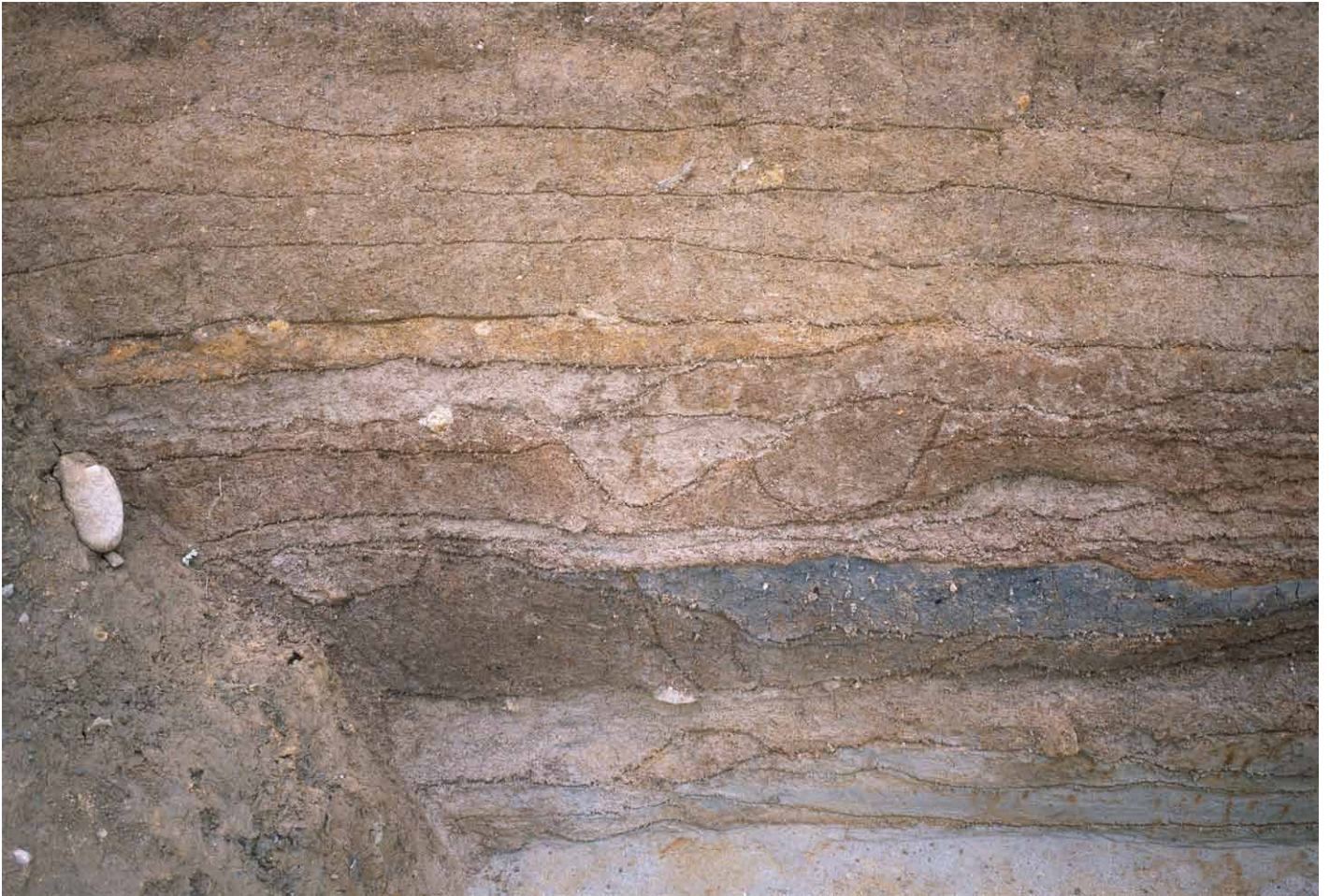
写真 293. 条坊跡第 285 次調査 調査区北壁トレンチ 土層観察（南から）