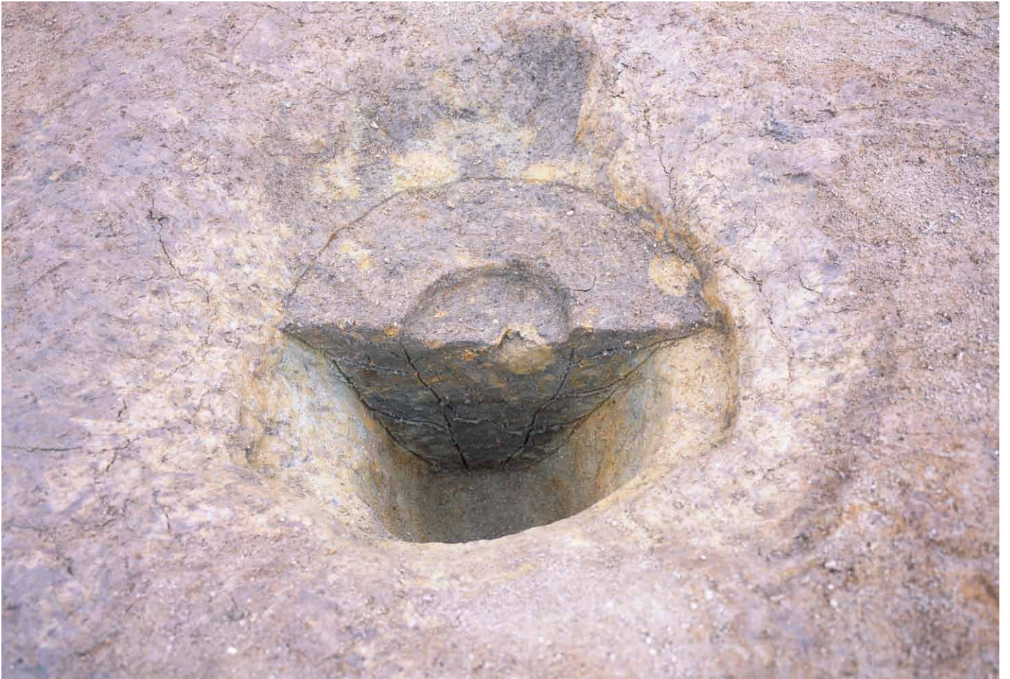
写真 245. 条坊跡第 285 次調査 285SB020b 柱穴半裁状況（北から）