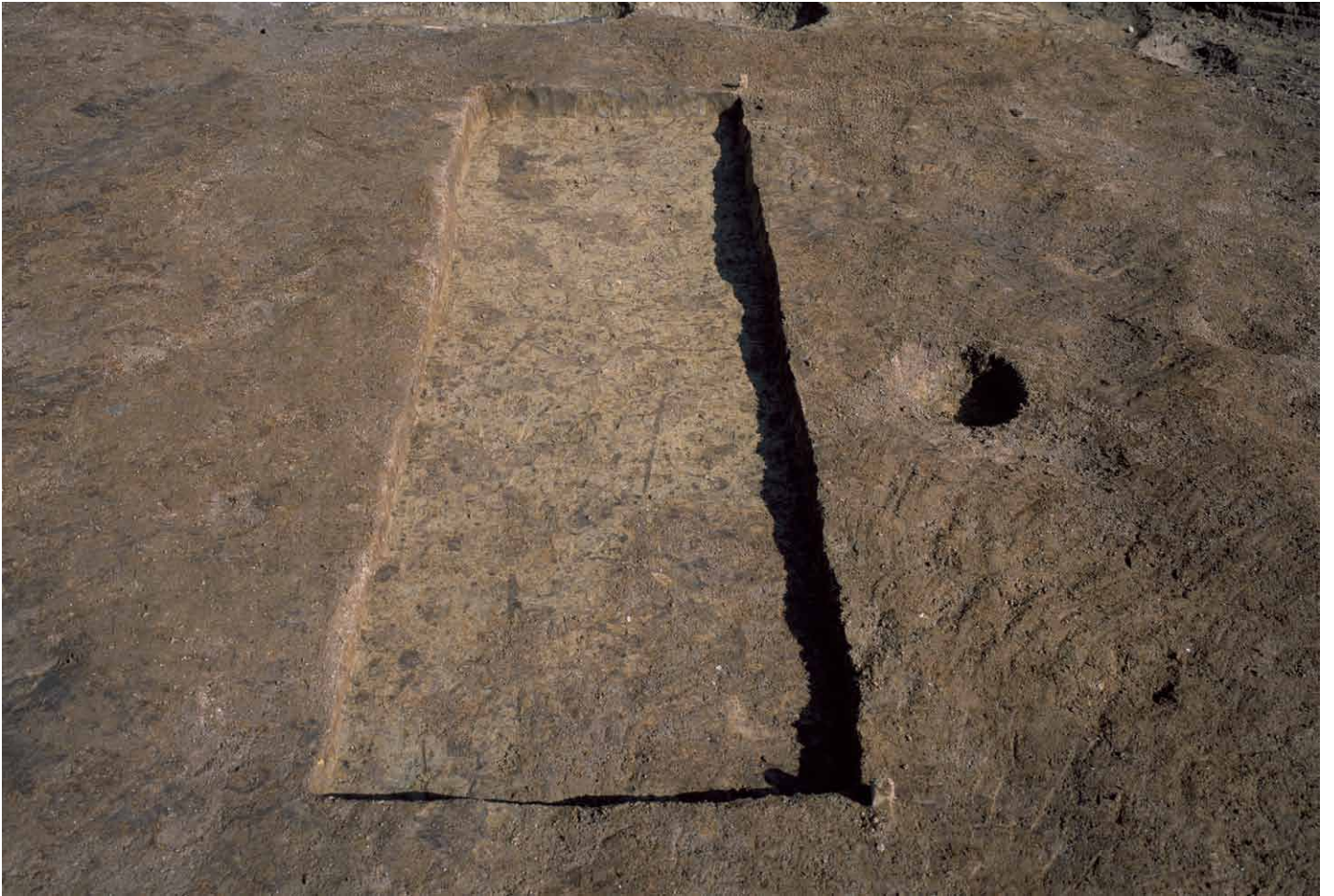
写真 302. 条坊跡第 285 次調査 調査区南部トレンチ 1 暗茶色土除去後（西から）