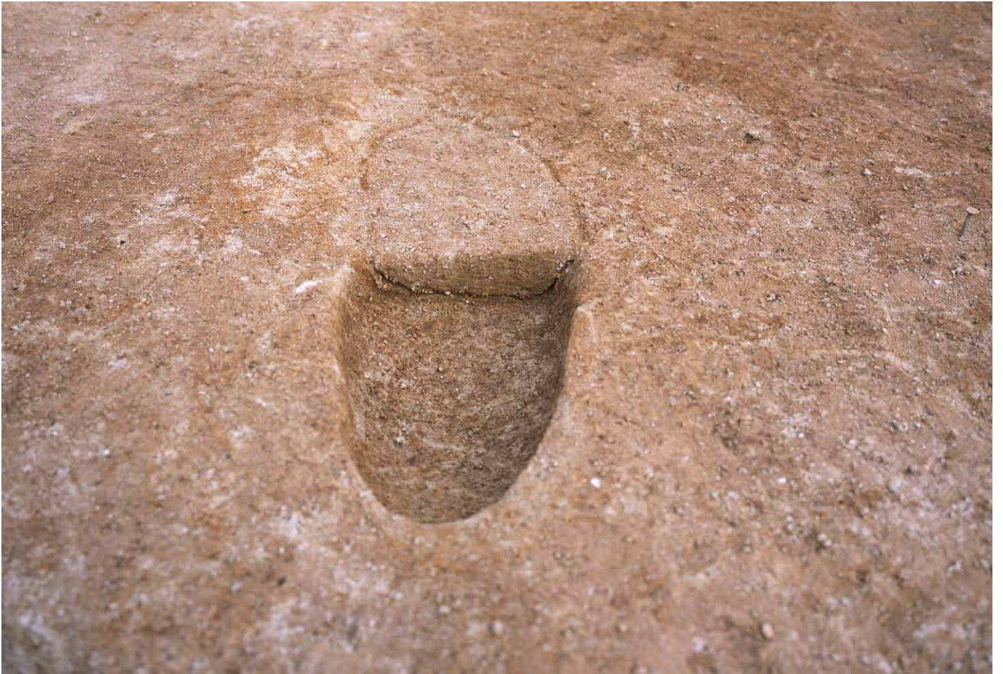
写真 273. 条坊跡第 285 次調査 285SX065d 波板状痕跡 半裁（西から）