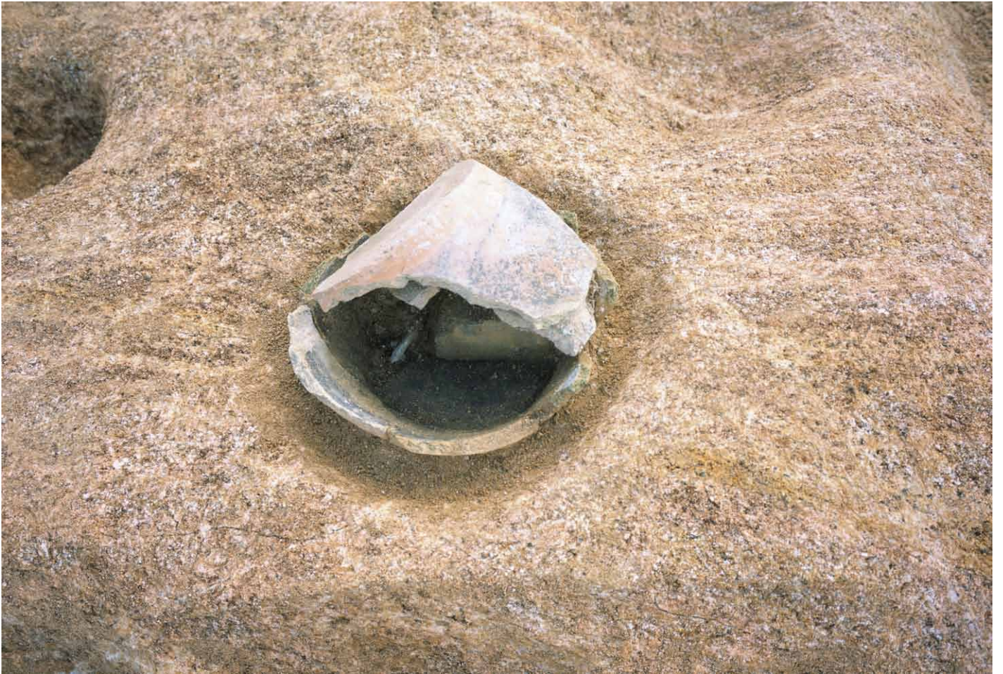
写真 263. 条坊跡第 285 次調査 285SX040 西鉄関連土坑内 甕検出状況（南から）