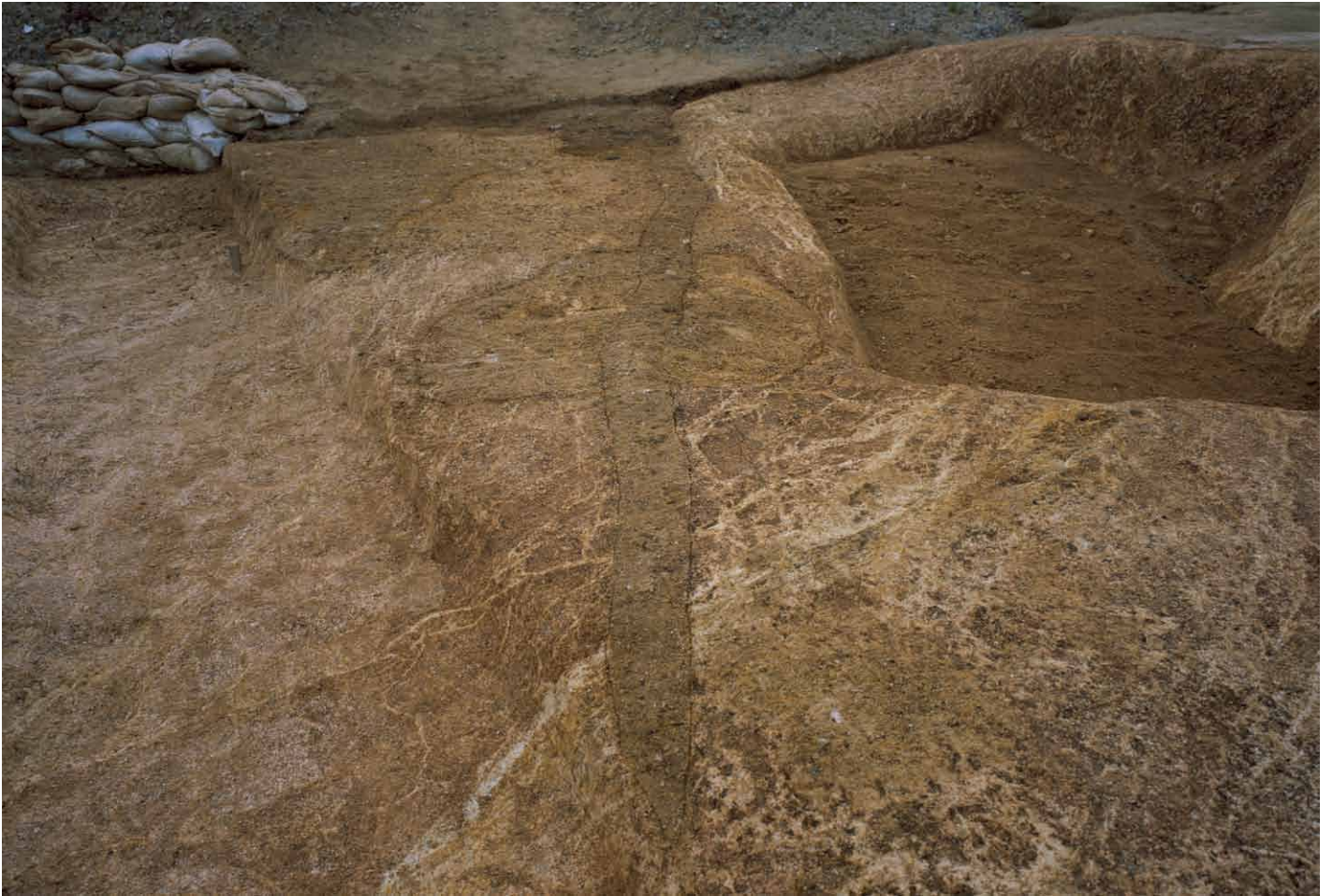
写真 267. 条坊跡第 285 次調査 285SD047 検出状況（南から）