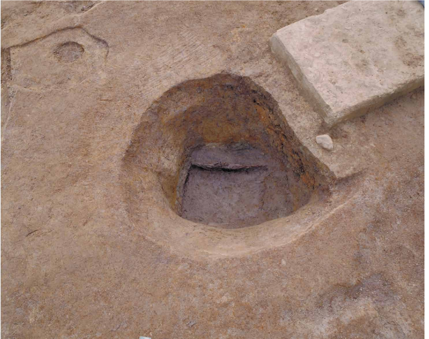
写真 63. 条坊跡第 275 次調査 275SE245 井戸枠検出状況（北から）