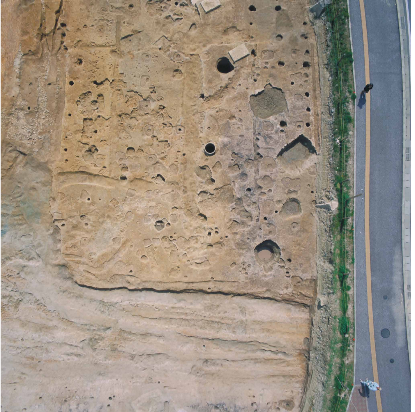
写真 8. 条坊跡第 275 次調査 空中写真 第 2 面調査区全景 掘立柱建物跡（上が南）