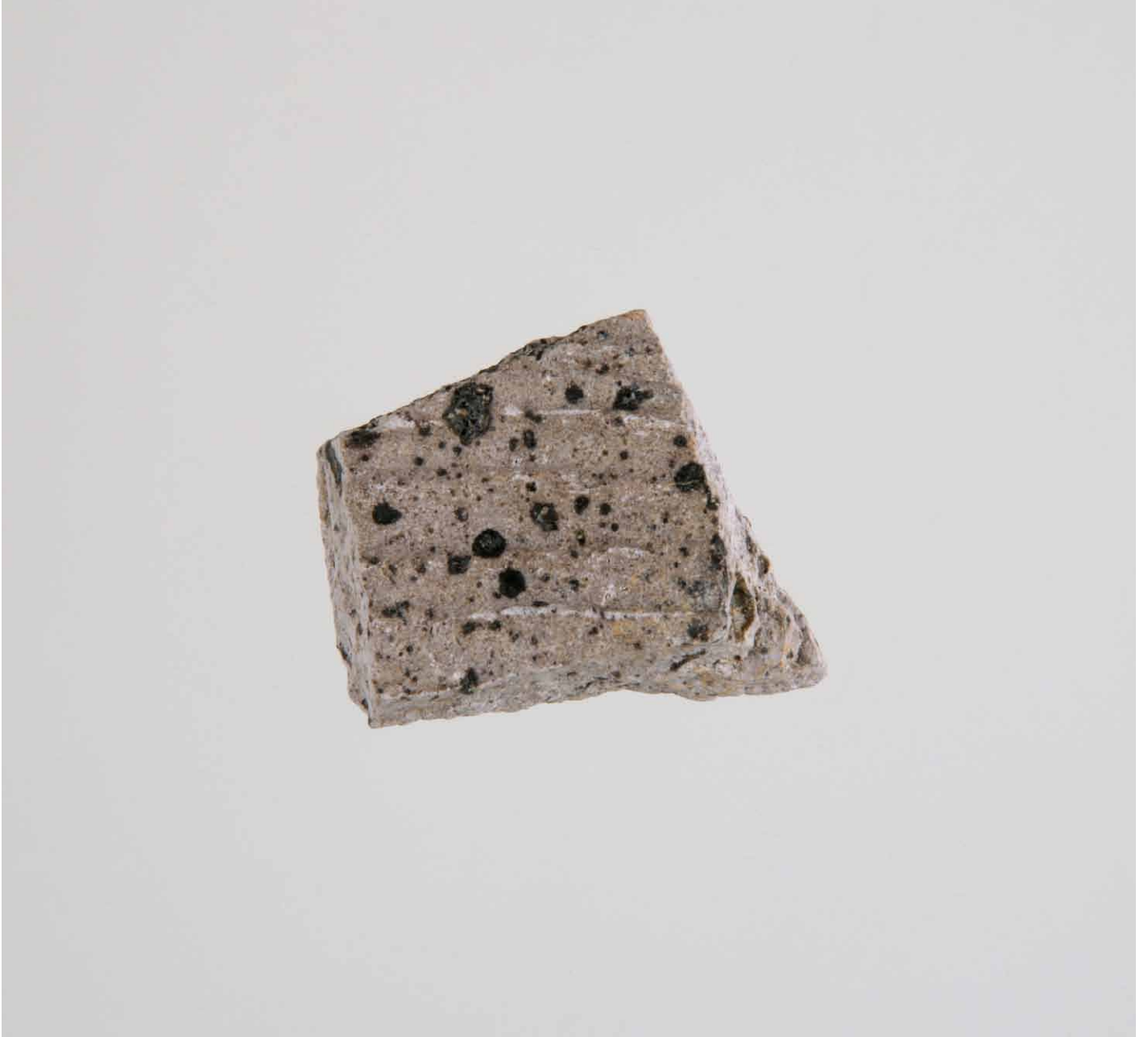
写真 163. 条 275SK278 灰色砂 内面