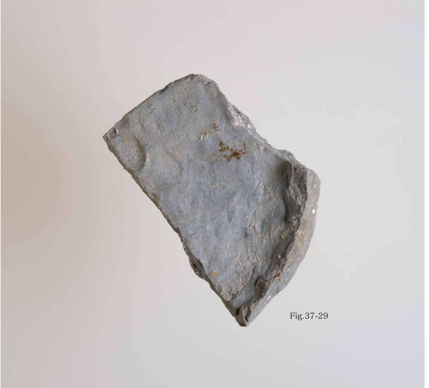
写真 197. 条 275 灰色砂 2 裏