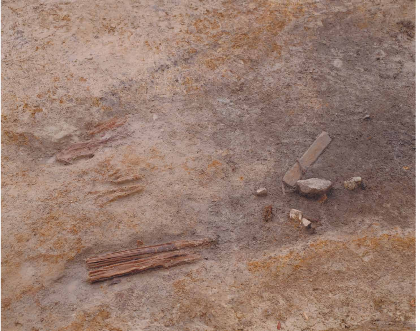
写真 19. 条坊跡第 275 次調査 275SD045 木製品出土状況（北から）