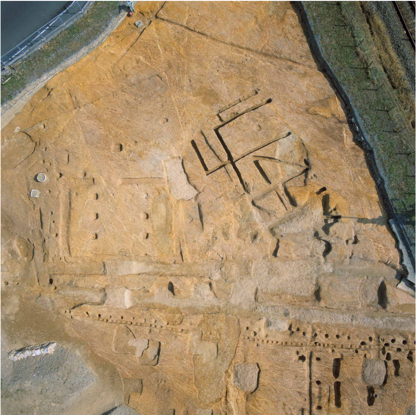
写真 219. 条坊跡第 285 次調査 空中写真 調査区北東部 全景（上が北）