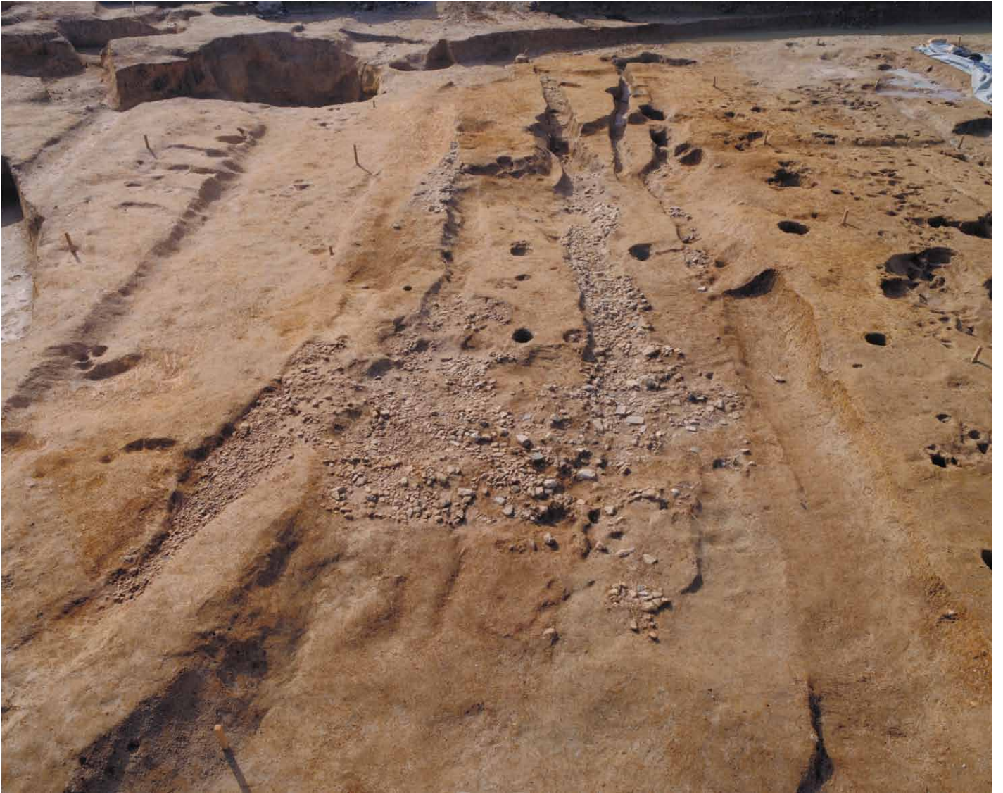
写真 66. 条坊跡第 275 次調査 275SF270 検出状況 8 ラインより南（北から）