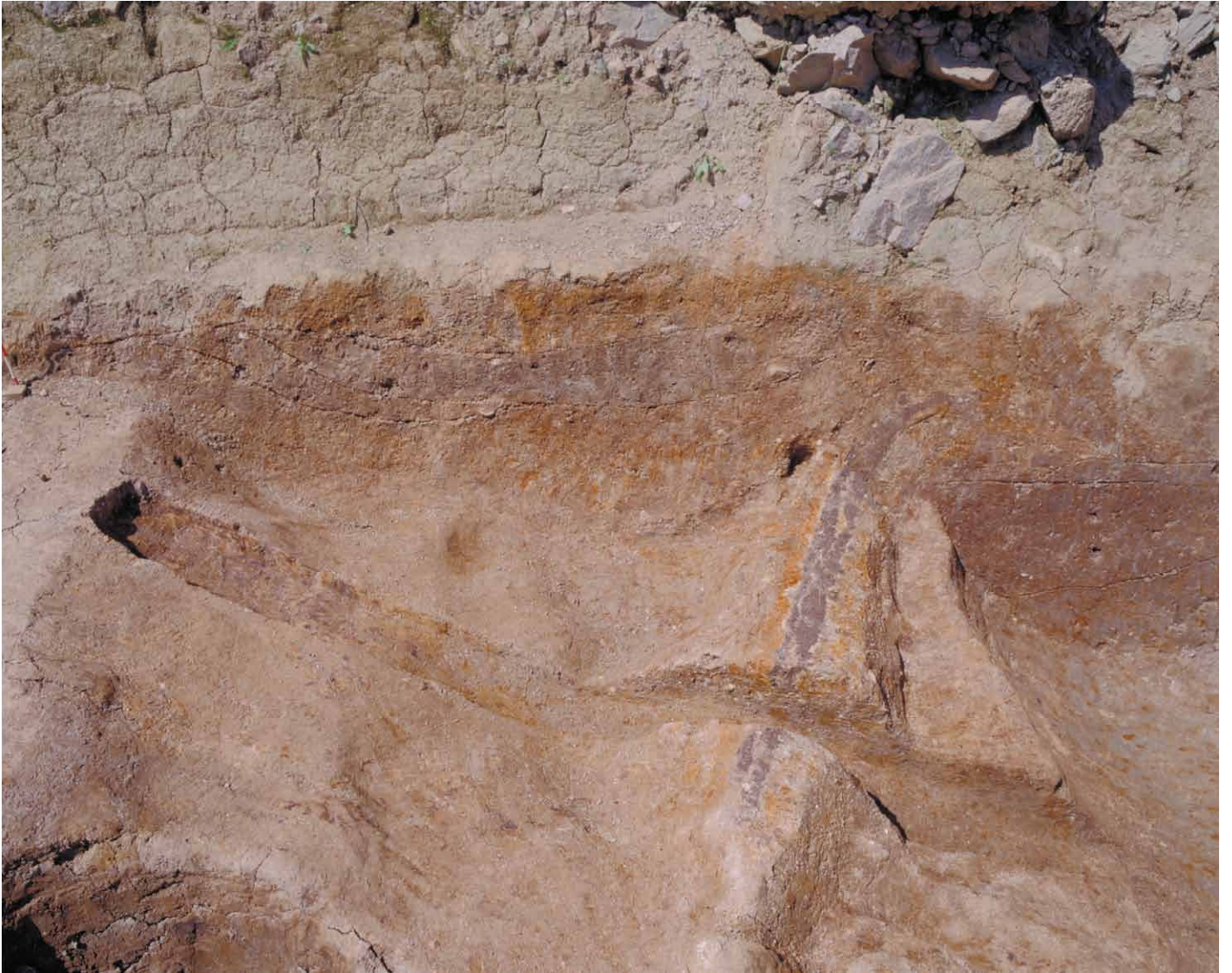
写真 38. 条坊跡第 275 次調査 275SX060 断割土層観察図（南東から）