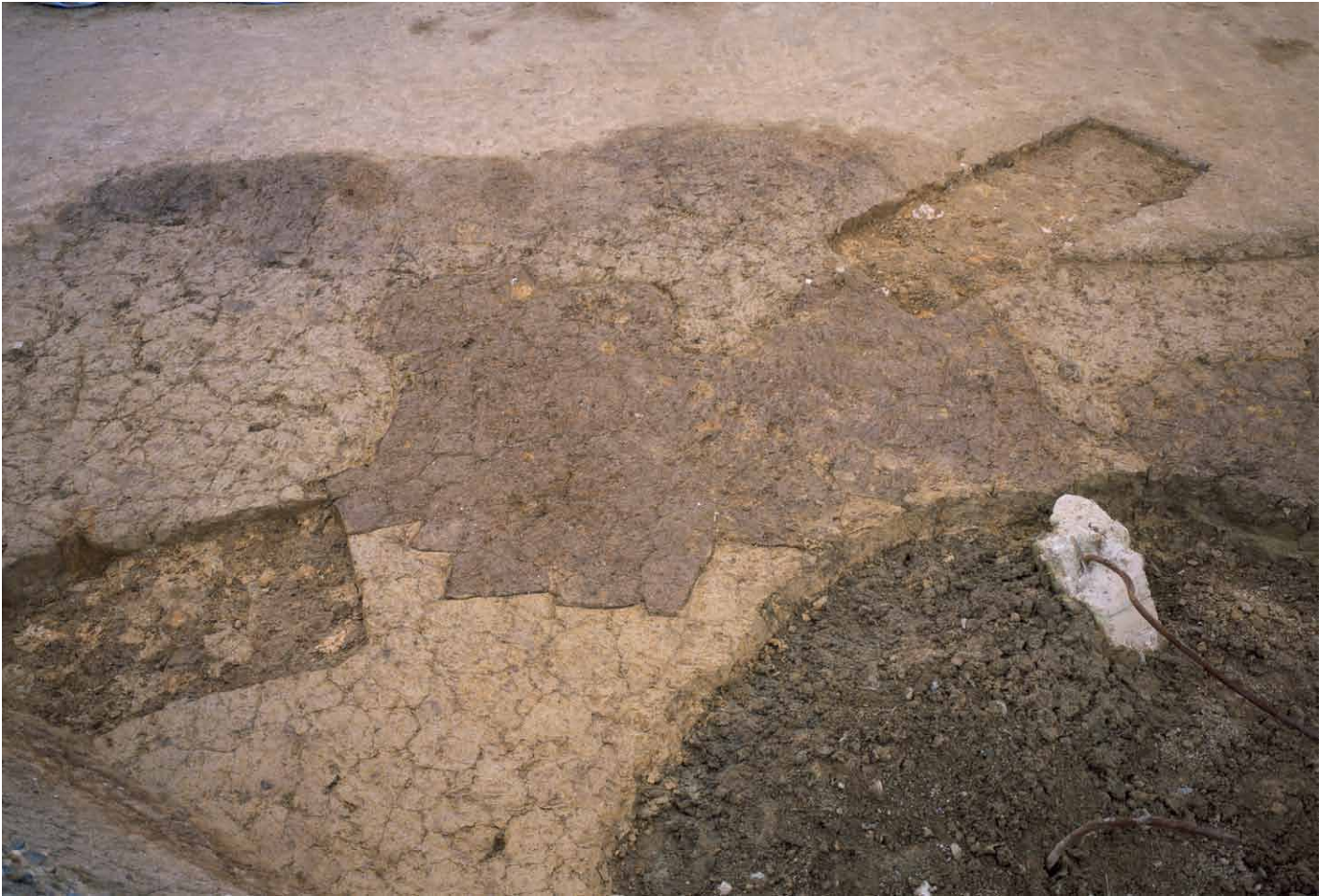
写真 290. 条坊跡第 285 次調査 285SK110 連続土坑状遺構 検出状況（東から）南側