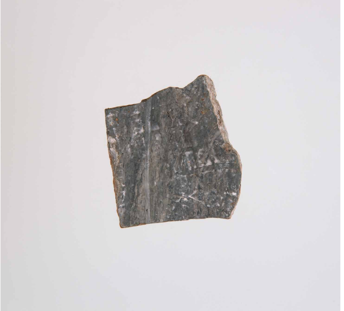
写真 171. 条 275SX284 内面