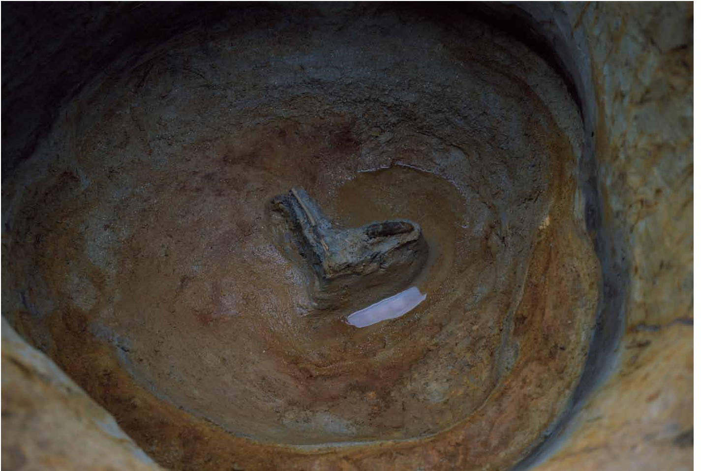
写真 251. 条坊跡第 285 次調査 285SE025 木製品陽物出土状況 近景（東から）