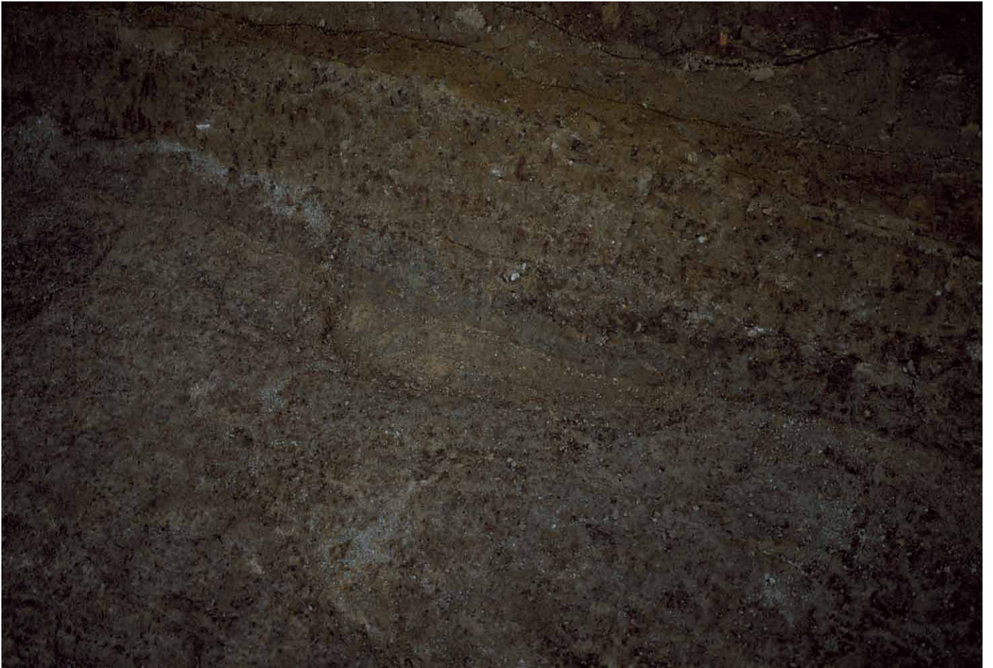
写真 240. 条坊跡第 285 次調査 285SB0155e 一段下げ（北から）