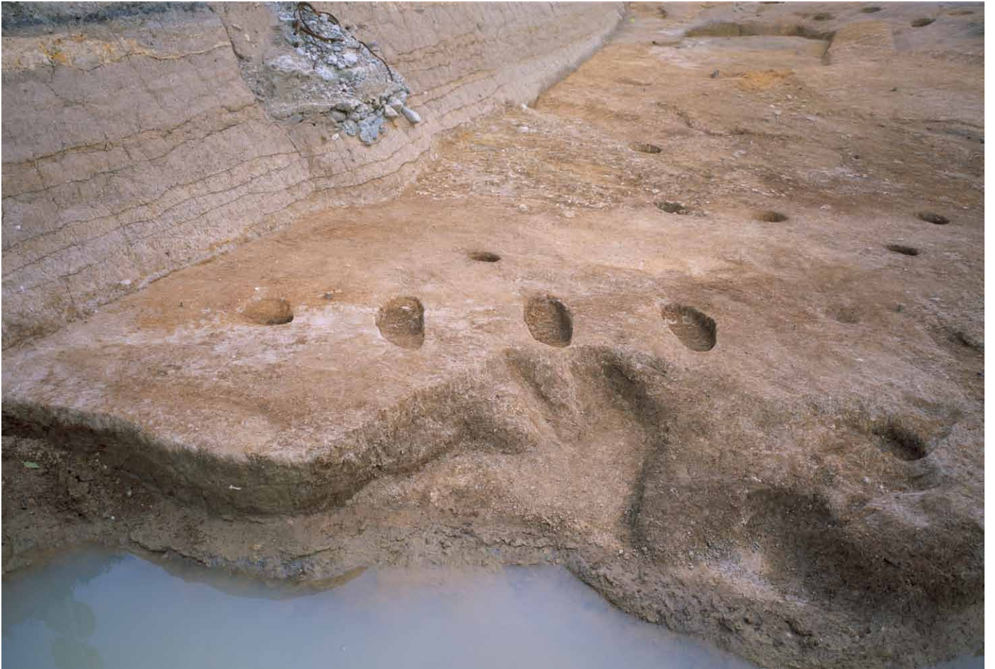
写真 277. 条坊跡第 285 次調査 285SX065a ~ d 完掘状況 (西から)