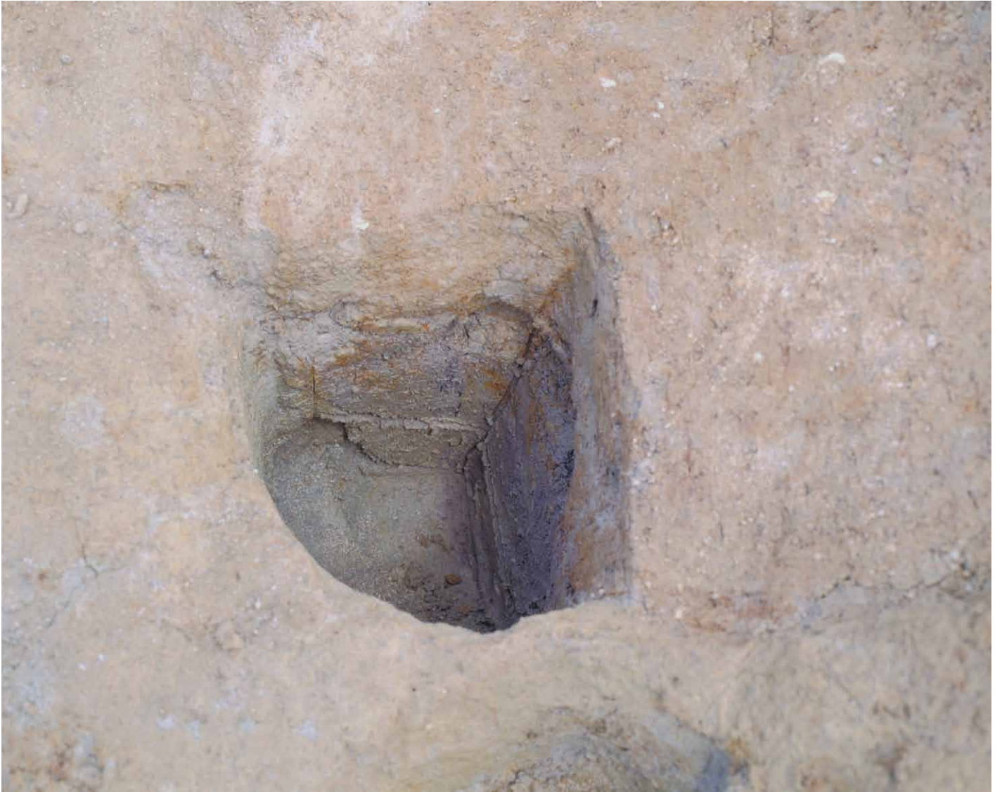
写真 46. 条坊跡第 275 次調査 275SB385g 土層観察（南から）