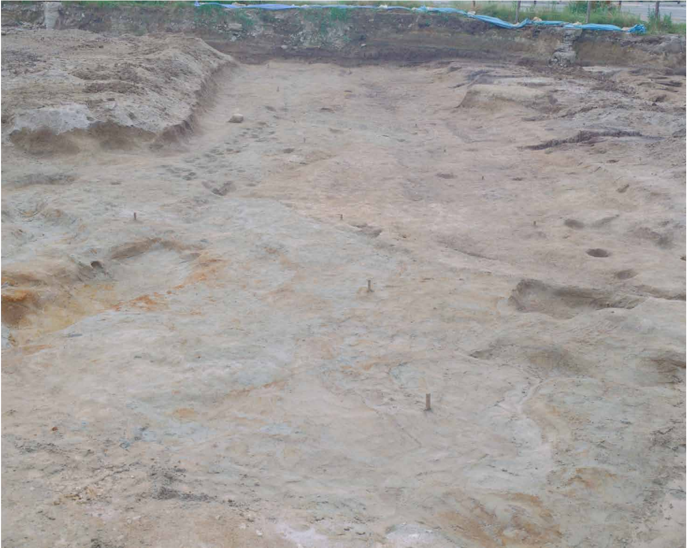
写真 69. 条坊跡第 275 次調査 条坊路交差点（最終面）（東から）