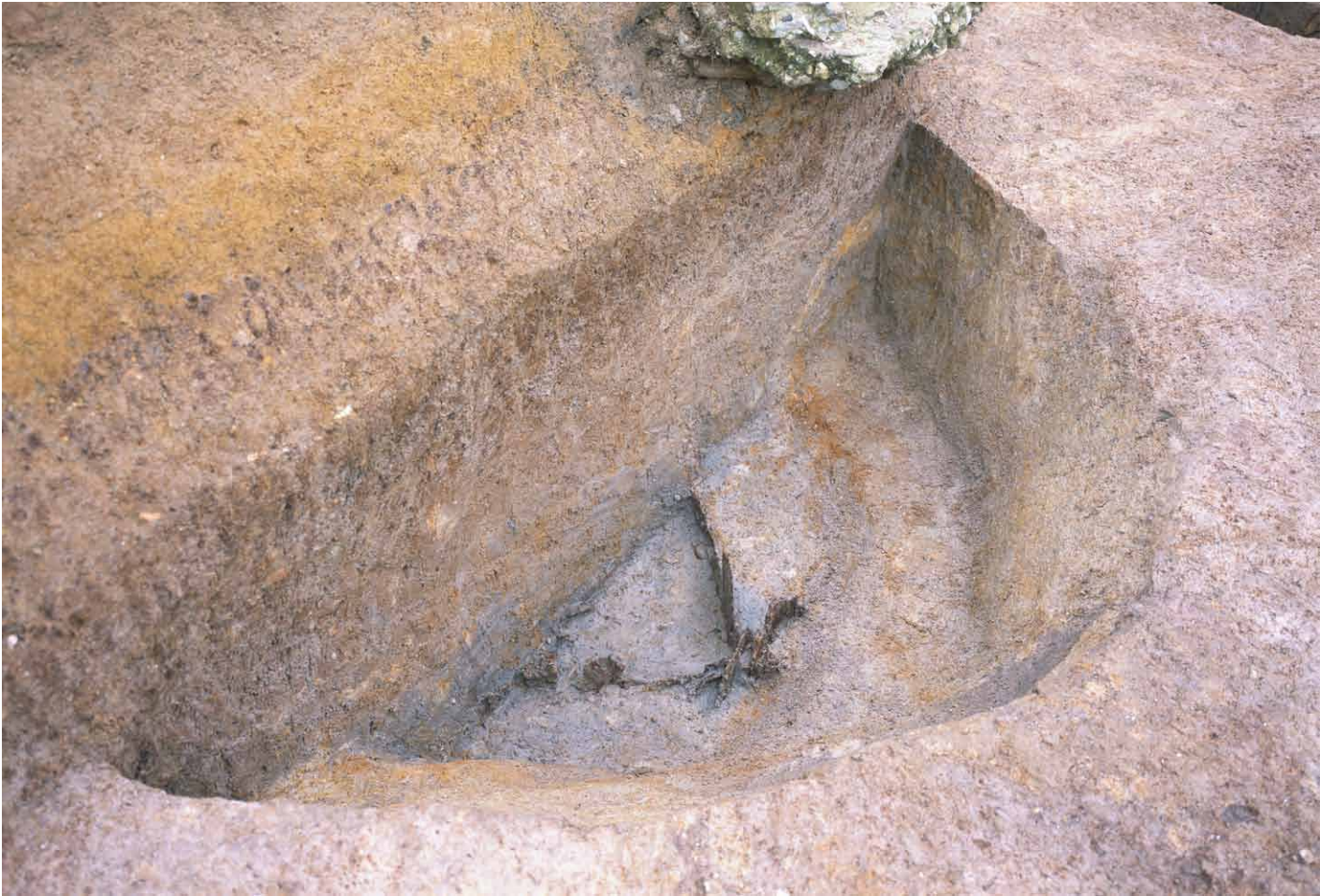
写真 225. 条坊跡第 285 次調査 285SE001 井戸枿検出状況（北から）