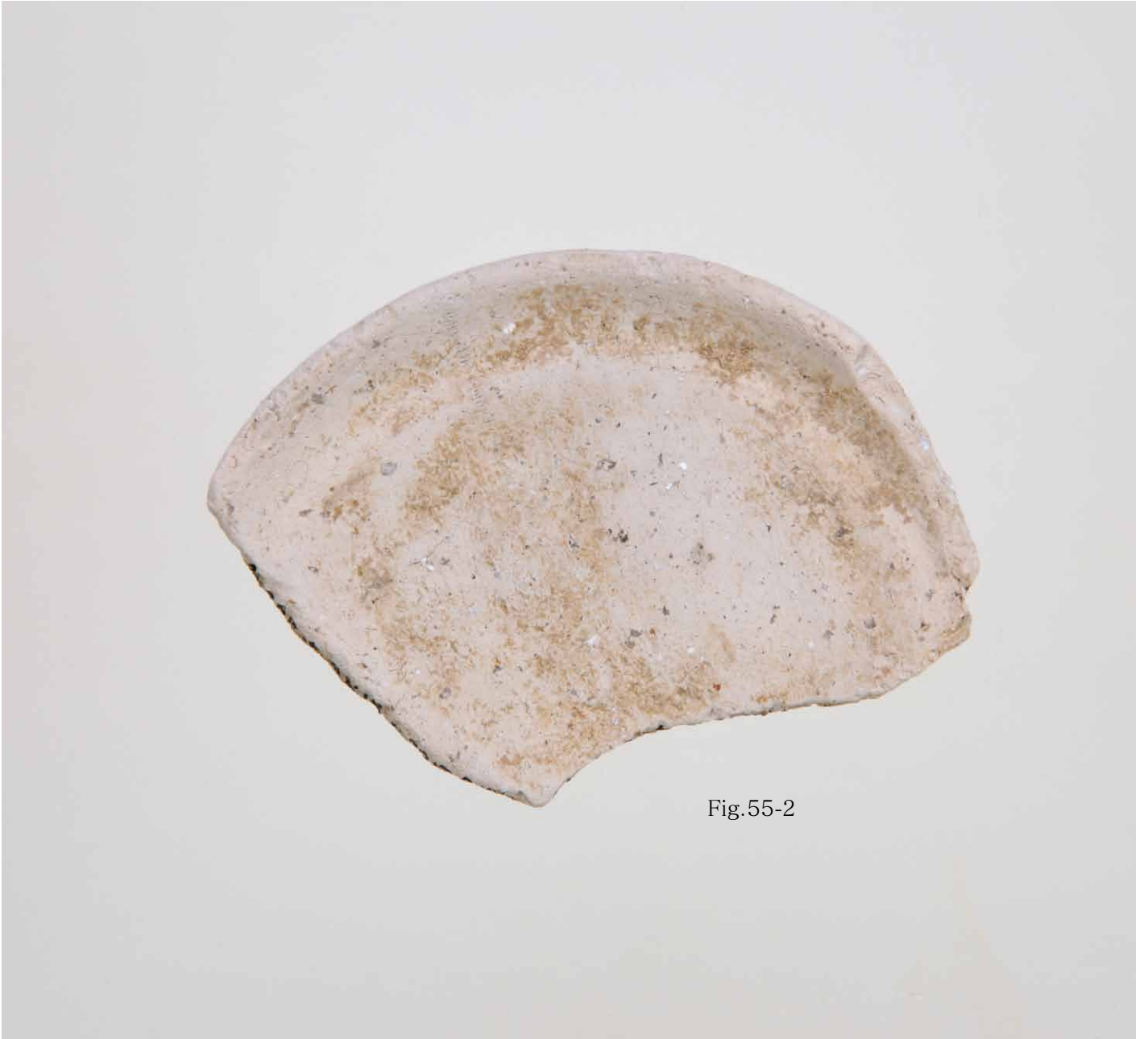
写真 328. 条 285SX030 灰色粘質土 内面