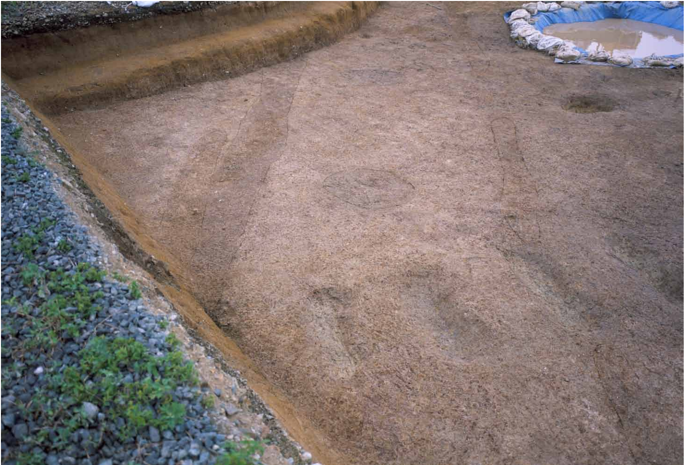
写真 228. 条坊跡第 285 次調査 285SD002・005・010 検出状況（南から）