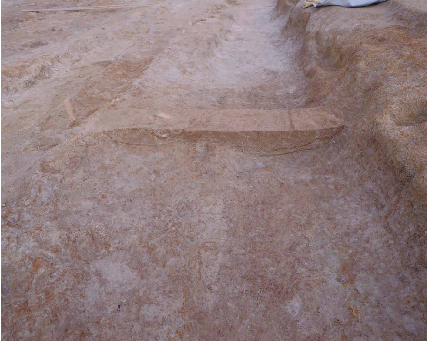
写真 22. 条坊跡第 275 次調査 275SD050 土層観察（西から）