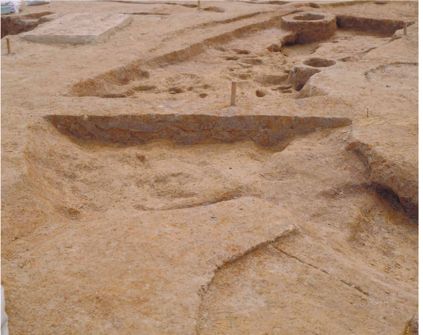
写真 10. 条坊跡第 275 次調査 275SD015 土層観察 2(北東から)