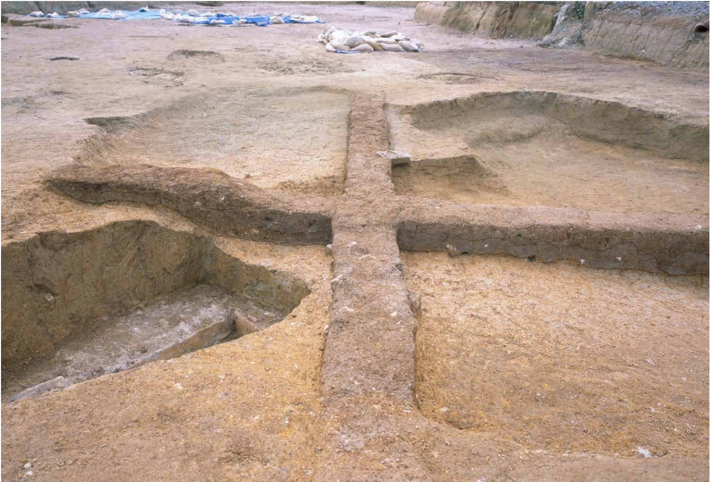
写真 257. 条坊跡第 285 次調査 285SX030・035 東西ベルト土層観察 東半（北から）