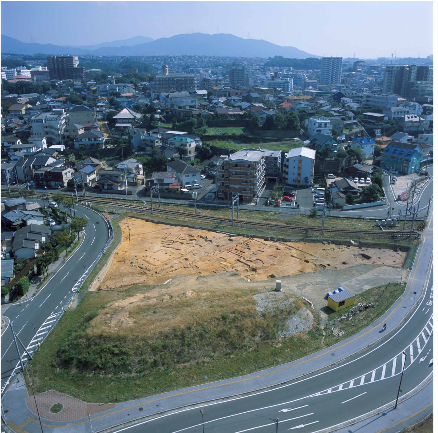
写真 216. 条坊跡第 285 次調査 空中写真 条 285 次現場と般若寺を望む（上が東）