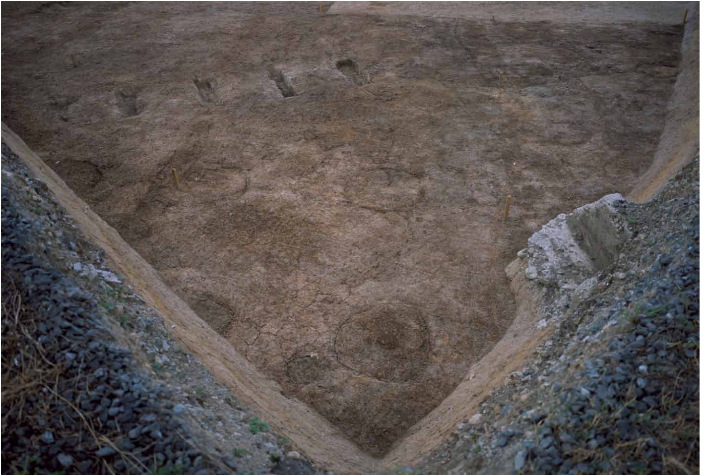
写真 232. 条坊跡第 285 次調査 285SB015 検出状況（南から）