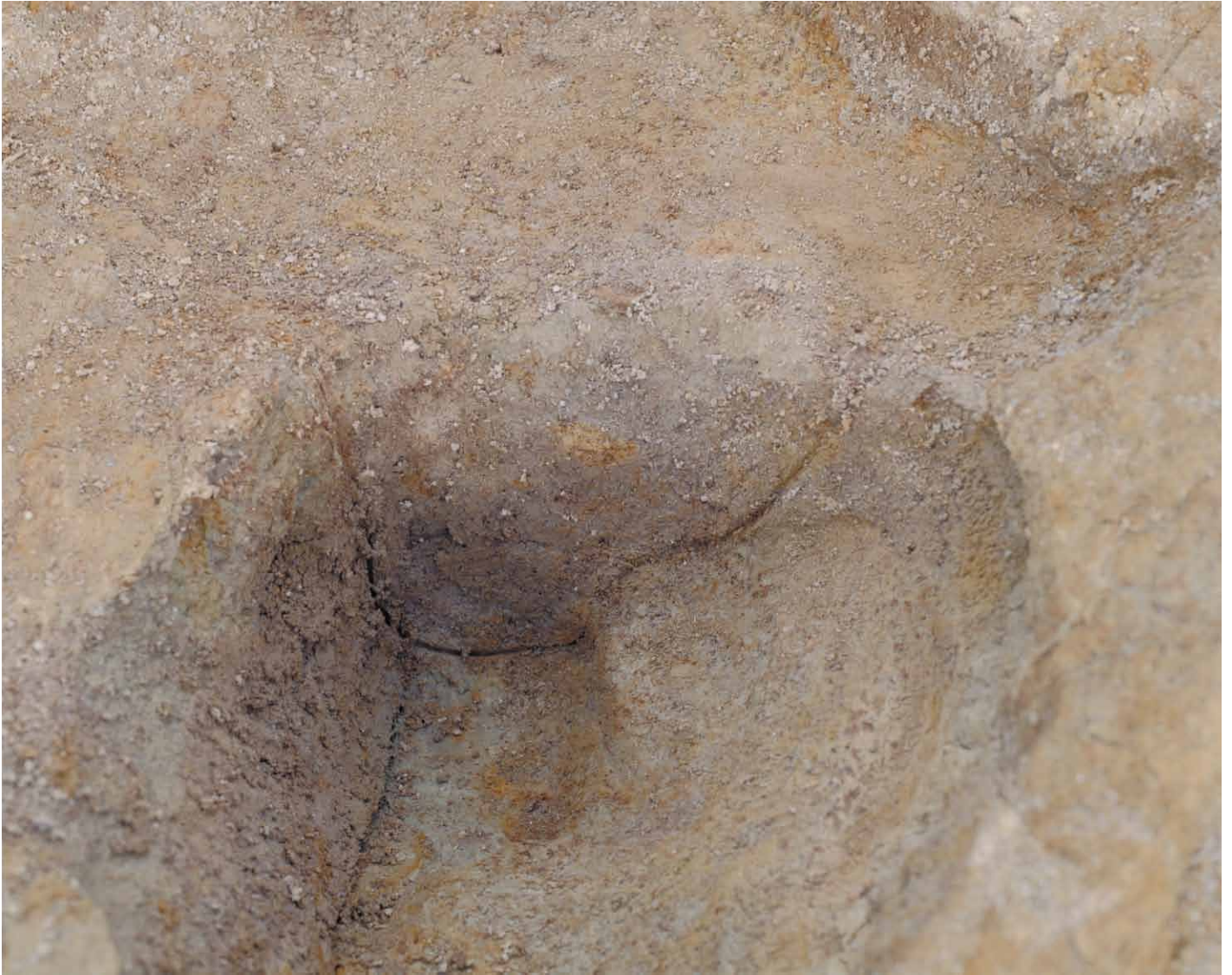
写真 56. 条坊跡第 275 次調査 275SB400d 土層観察（西から）