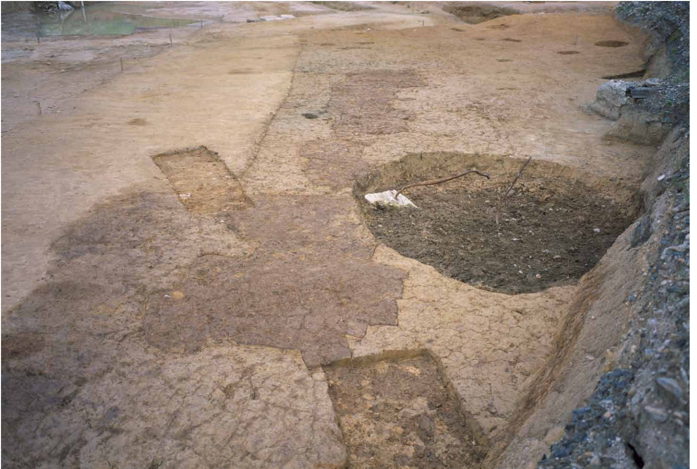
写真 289. 条坊跡第 285 次調査 285SK110 連続土坑状遺構 検出状況（南から）