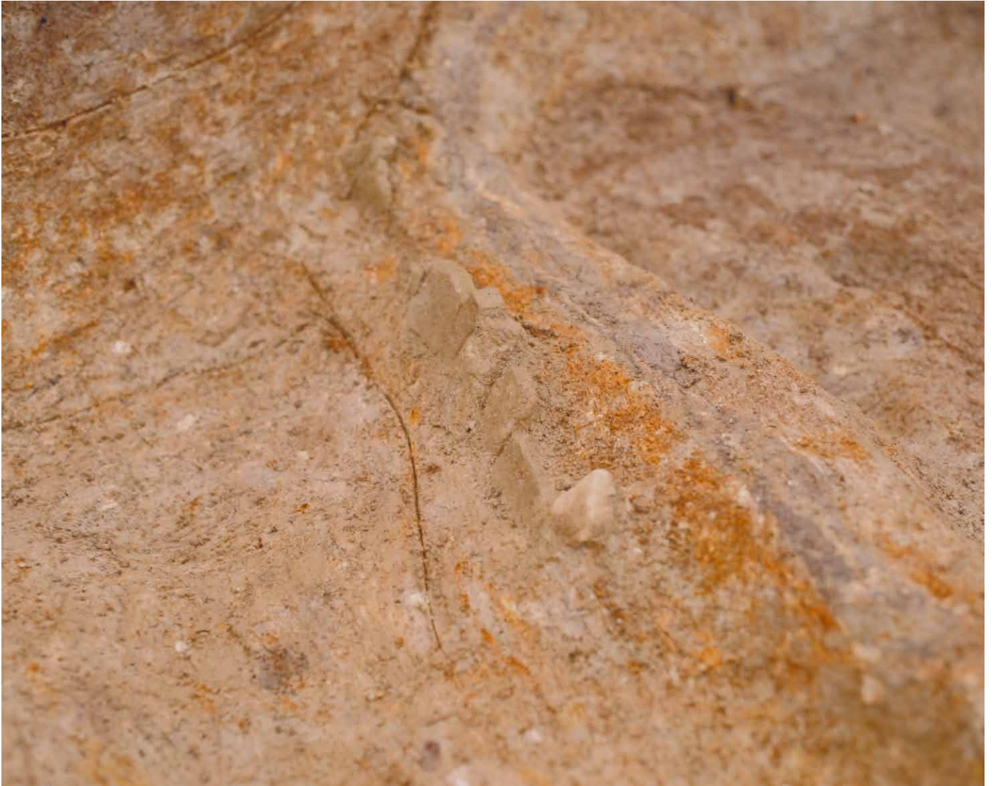
写真 34. 条坊跡第 275 次調査 275SX060 窯壁裏瓦出土状況（南東から）