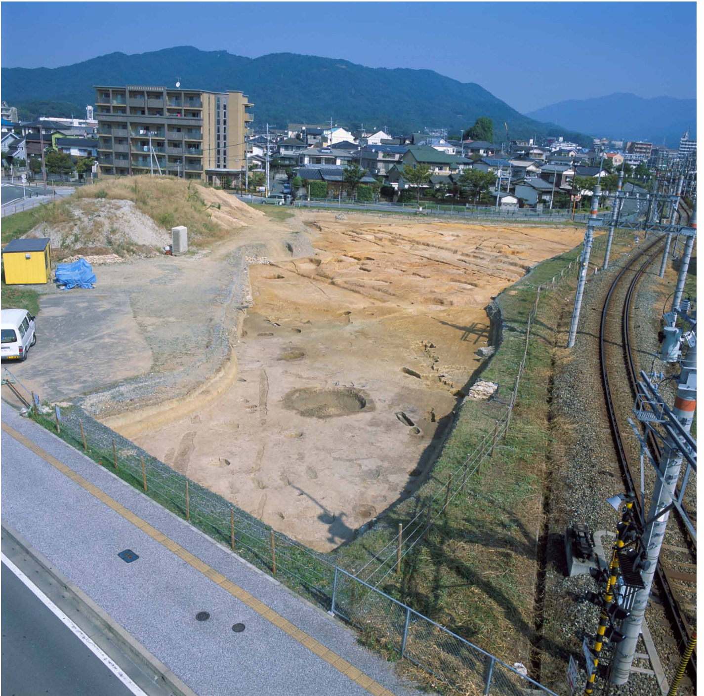
写真 214. 条坊跡第 285 次調査 空中写真 推定 左郭二坊路を望む（上が北）