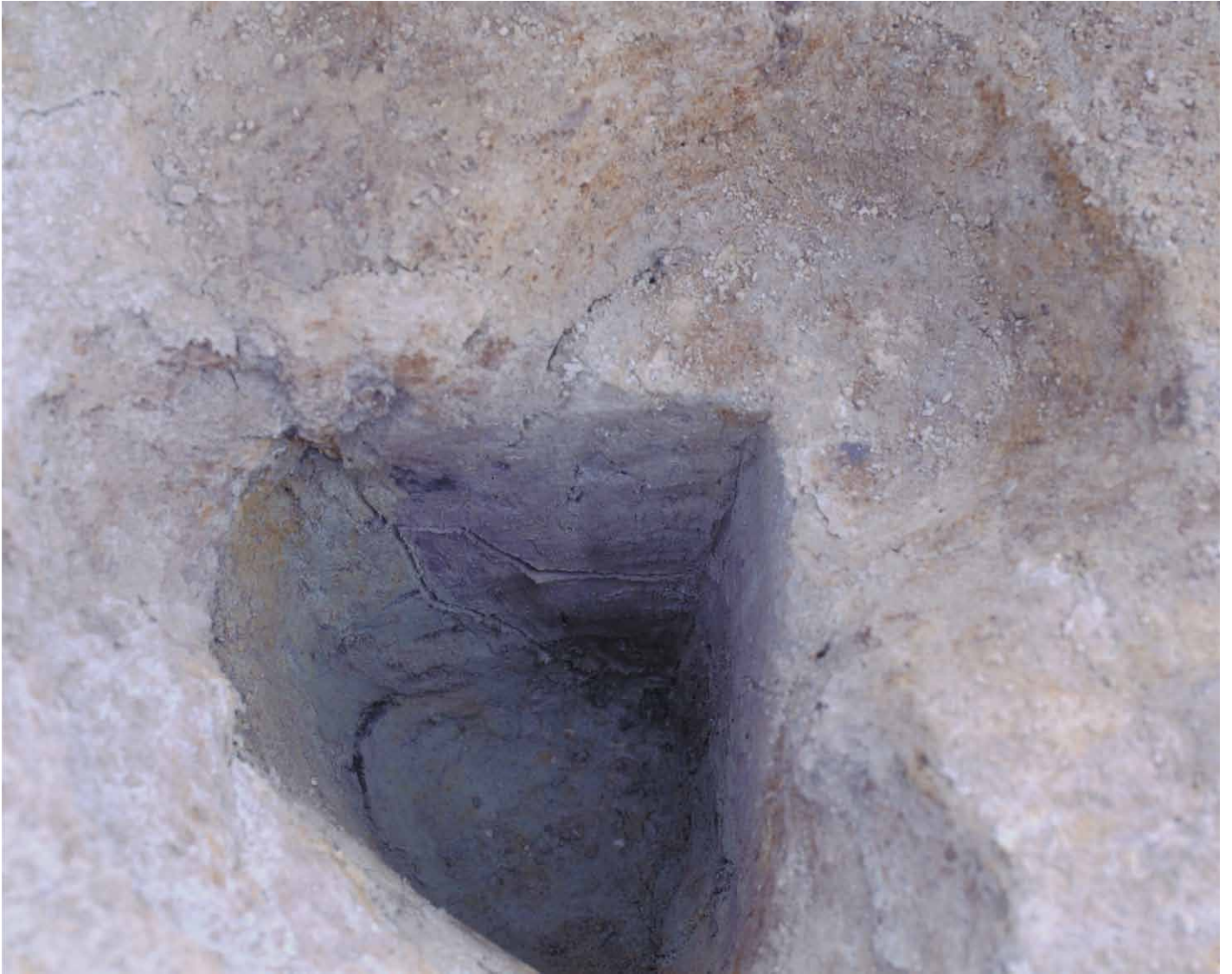
写真 42. 条坊跡第 275 次調査 275SB195f 土層観察（西から）