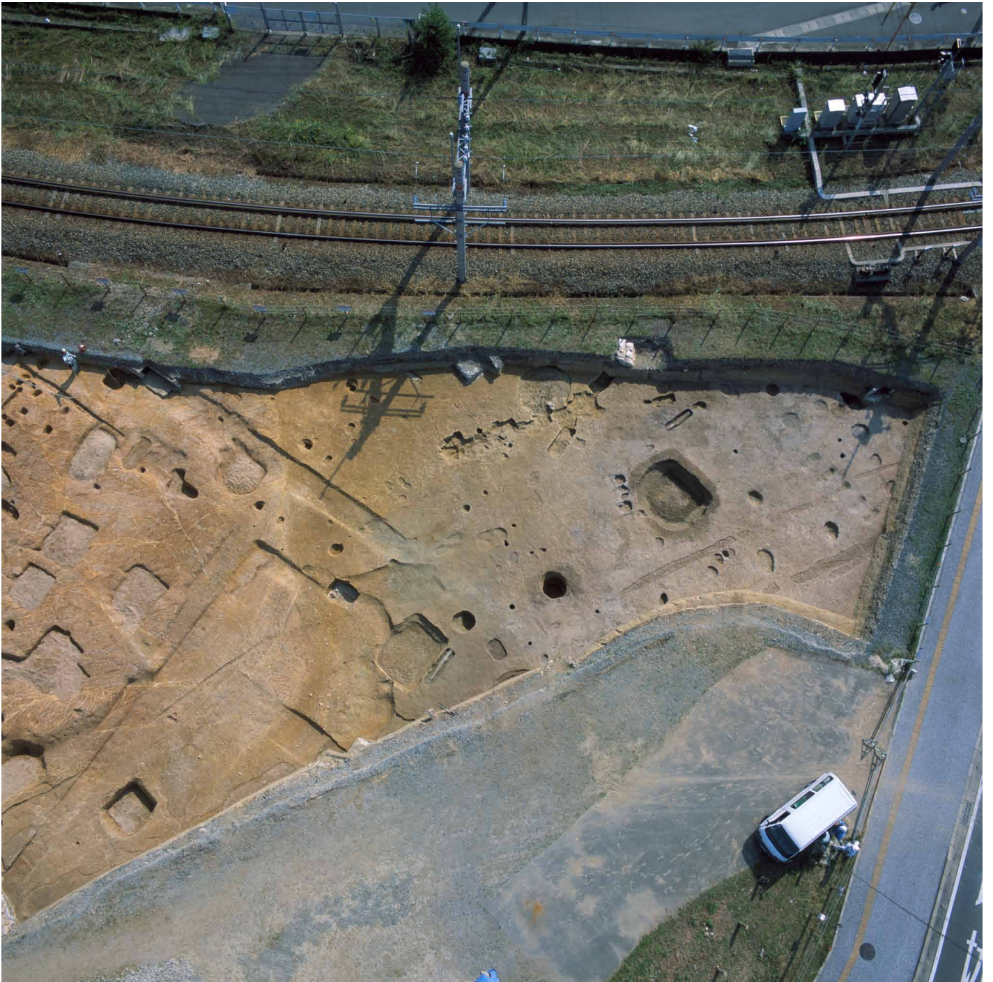
写真 221. 条坊跡第 285 次調査 空中写真 推定二坊路周辺 全景（上が東）