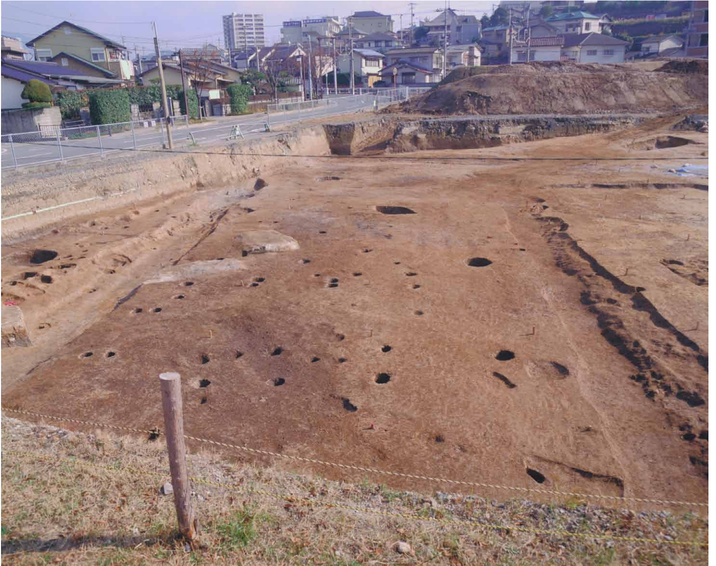
写真 24. 条坊跡第 275 次調査 275SD045-275S050 間完掘（西から）