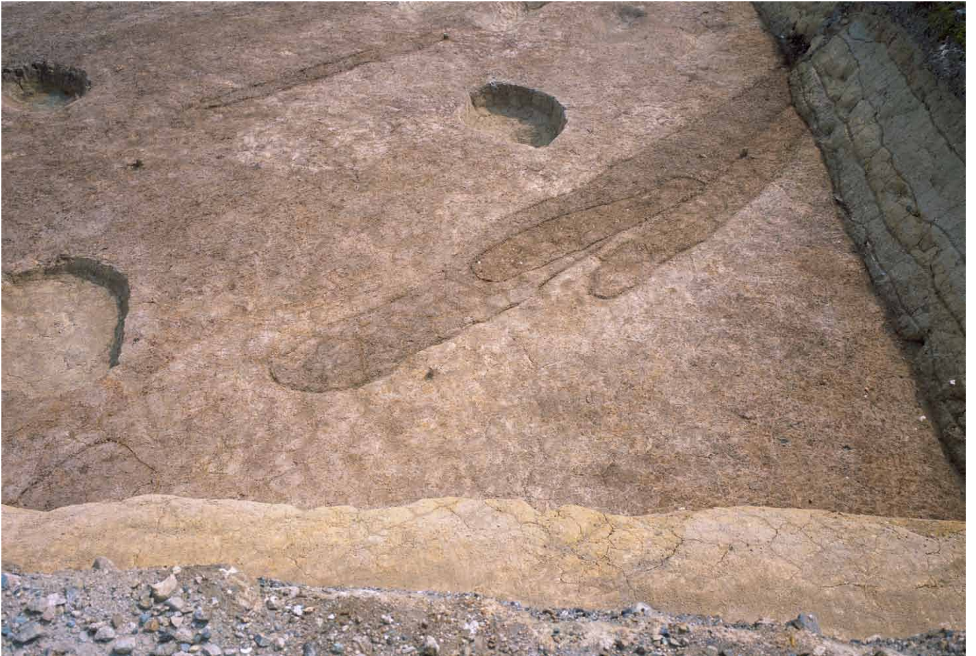
写真 230. 条坊跡第 285 次調査 285SD002・005・043 検出状況（西から）