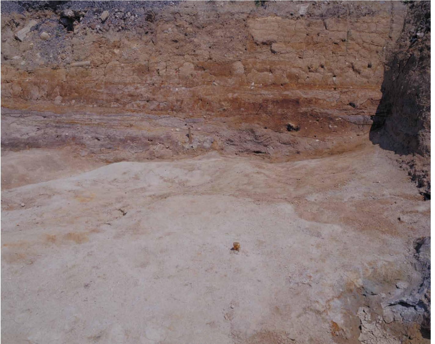
写真 72. 条坊跡第 275 次調査 北壁土層観察 2.3 ライン付近 (南から)