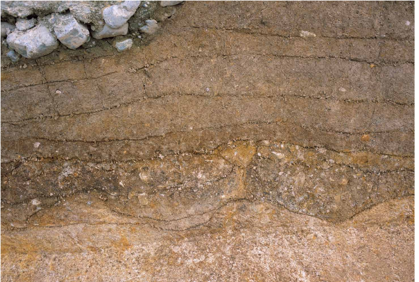
写真 296. 条坊跡第 285 次調査 調査区北壁トレンチ 土層観察②（南から）