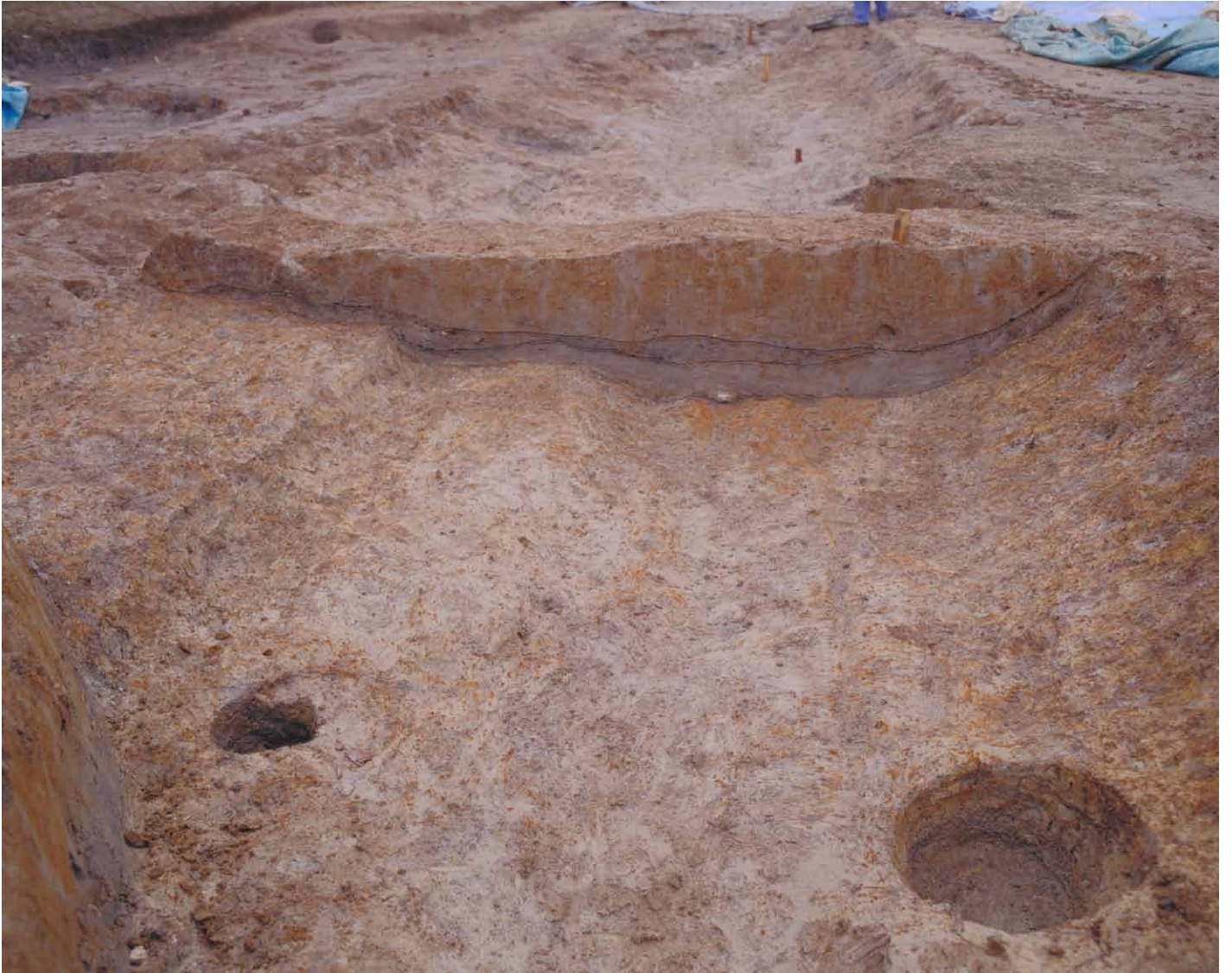
写真 18. 条坊跡第 275 次調査 275SD045 土層観察（西から）