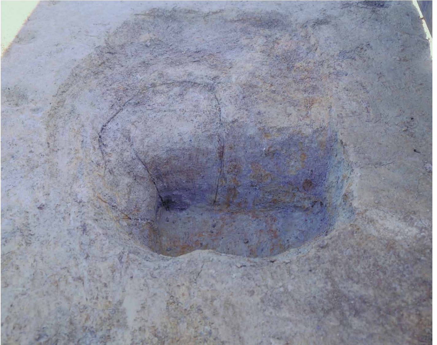
写真 41. 条坊跡第 275 次調査 275SB195m 土層観察（南から）