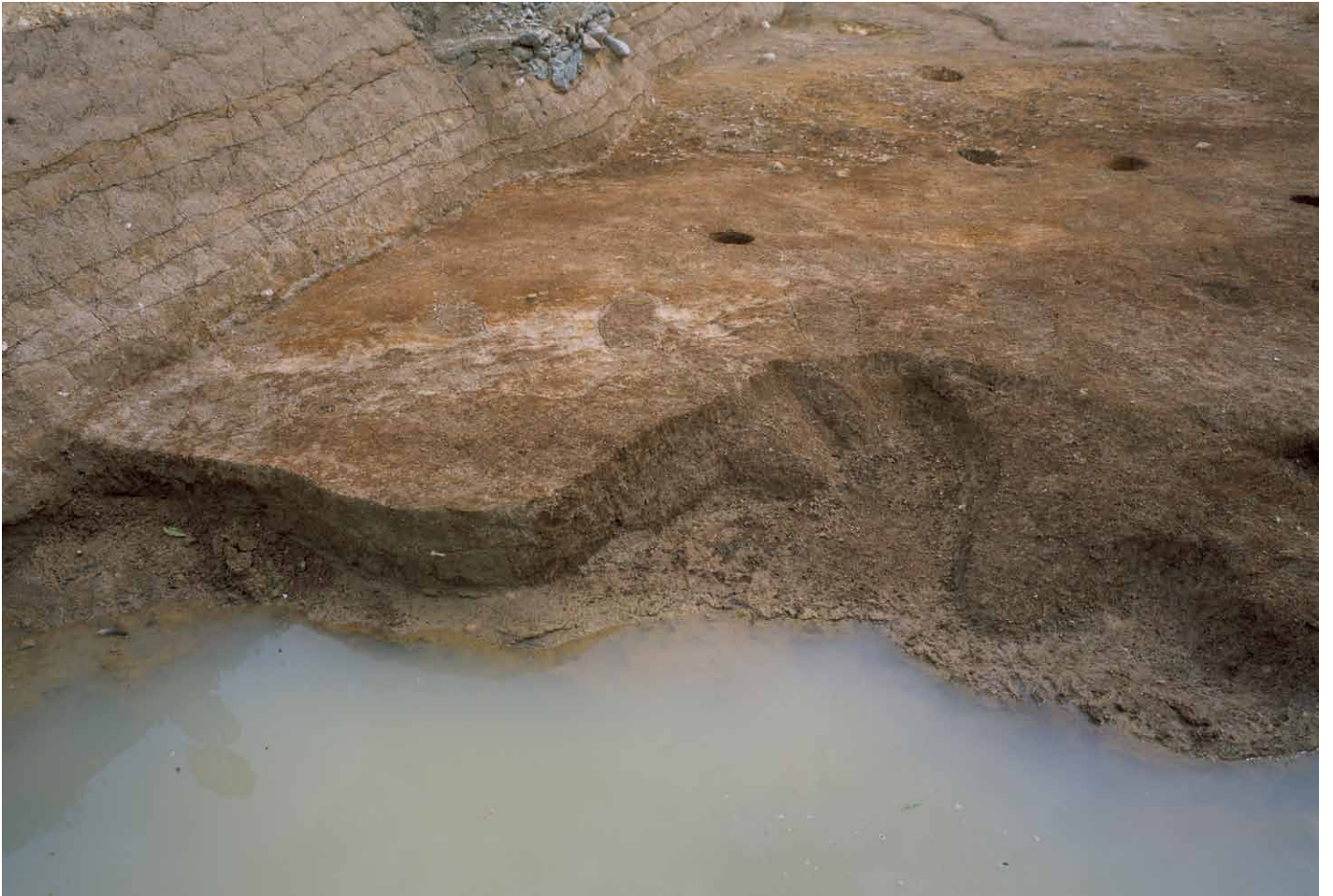
写真 272. 条坊跡第 285 次調査 285SX065a ~ d 波板状痕跡 検出状況 (西から)