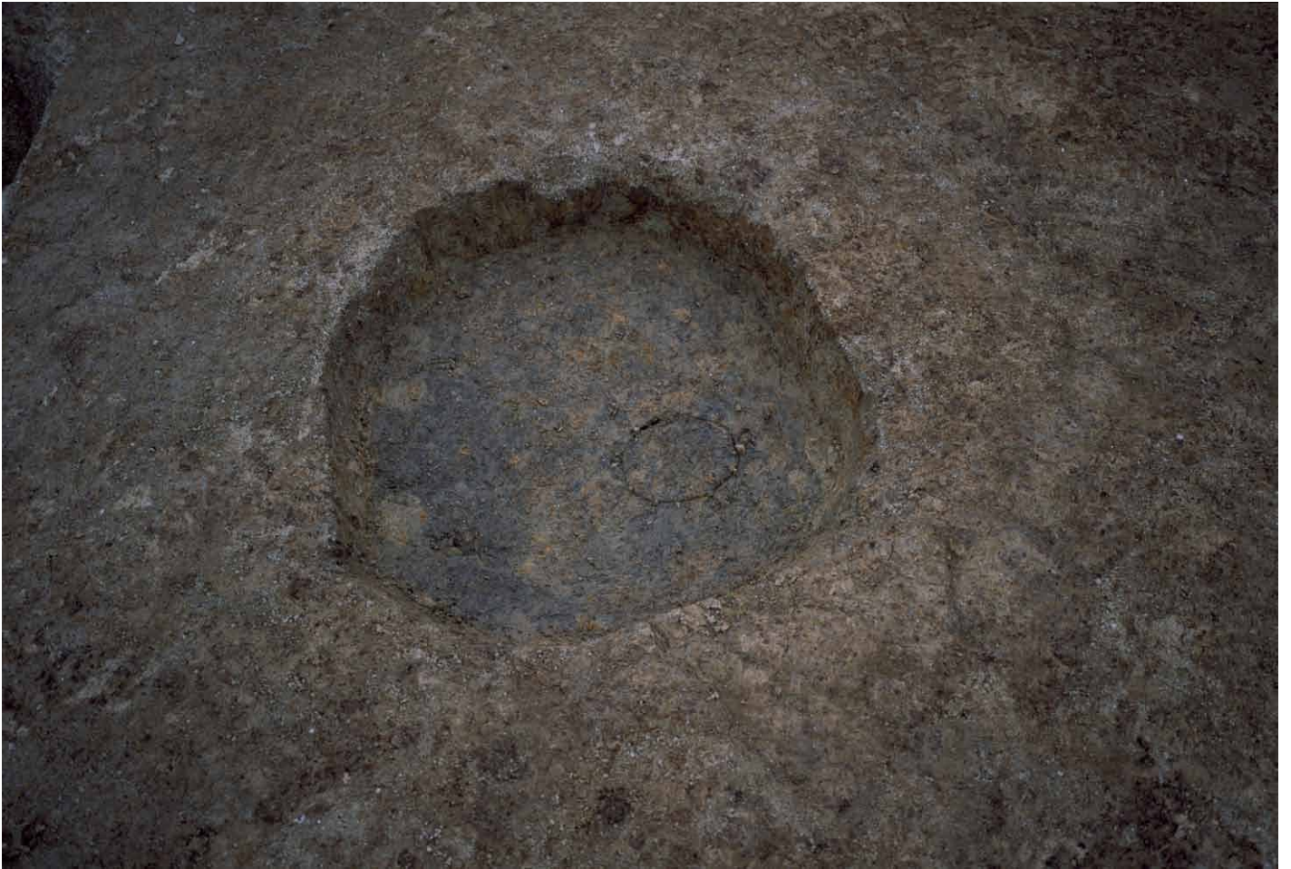
写真 237. 条坊跡第 285 次調査 285SB015b 柱痕検出状況（北から）