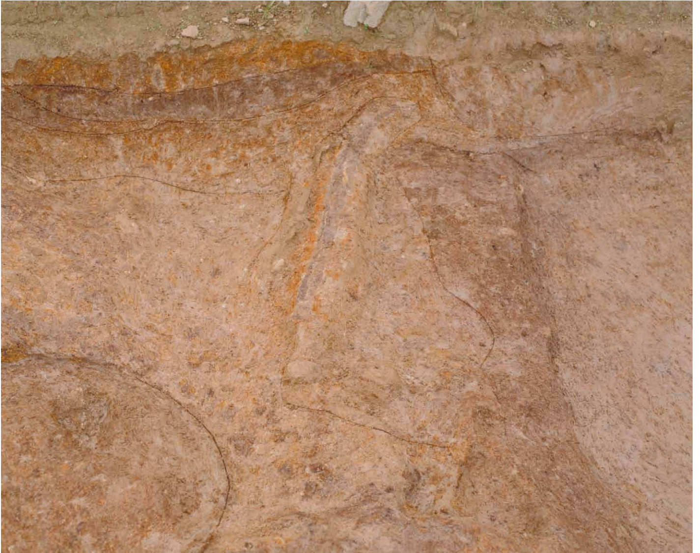
写真 33. 条坊跡第 275 次調査 275SX060 検出状況（東から）