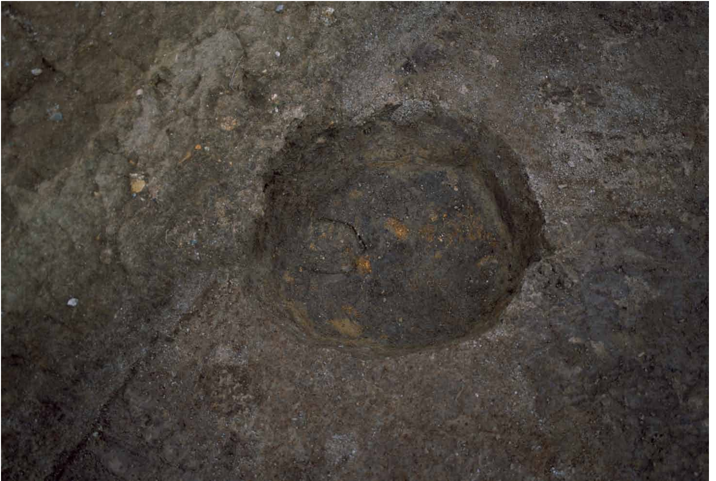
写真 243. 条坊跡第 285 次調査 285SB020a 柱痕検出状況（北から）