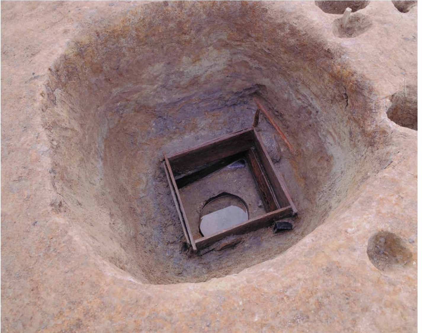
写真 30. 条坊跡第 275 次調査 275SE055 井戸枠・曲物・支柱杭・石・磚検出状況（西から）