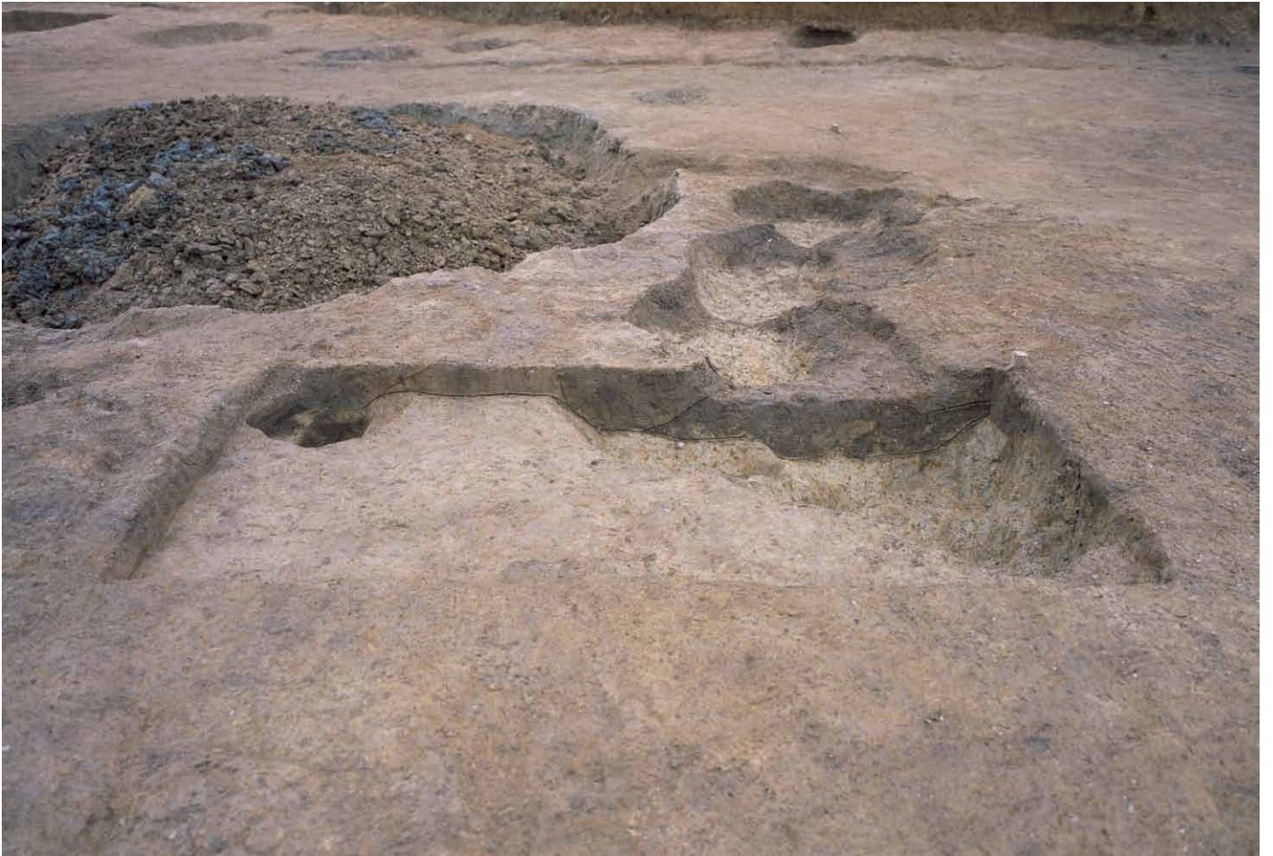
写真 306. 条坊跡第 285 次調査 調査区南部トレンチ 3 (東から)