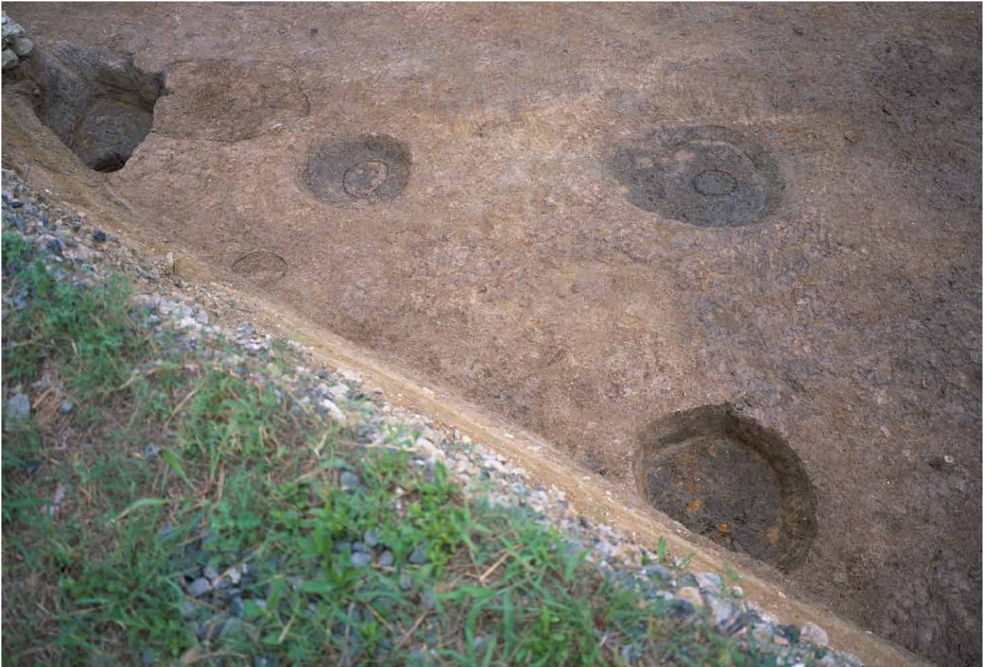
写真 242. 条坊跡第 285 次調査 285SB020 柱痕検出状況（東から）