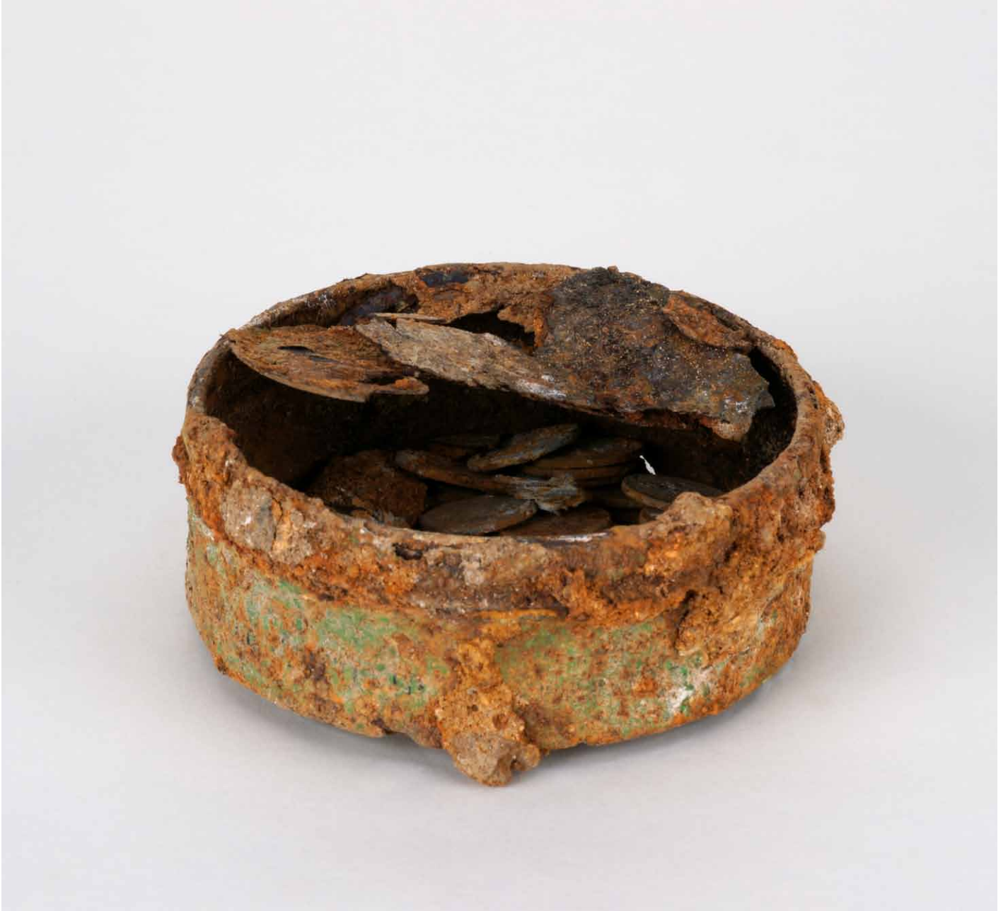
写真 350. 条 285SX105