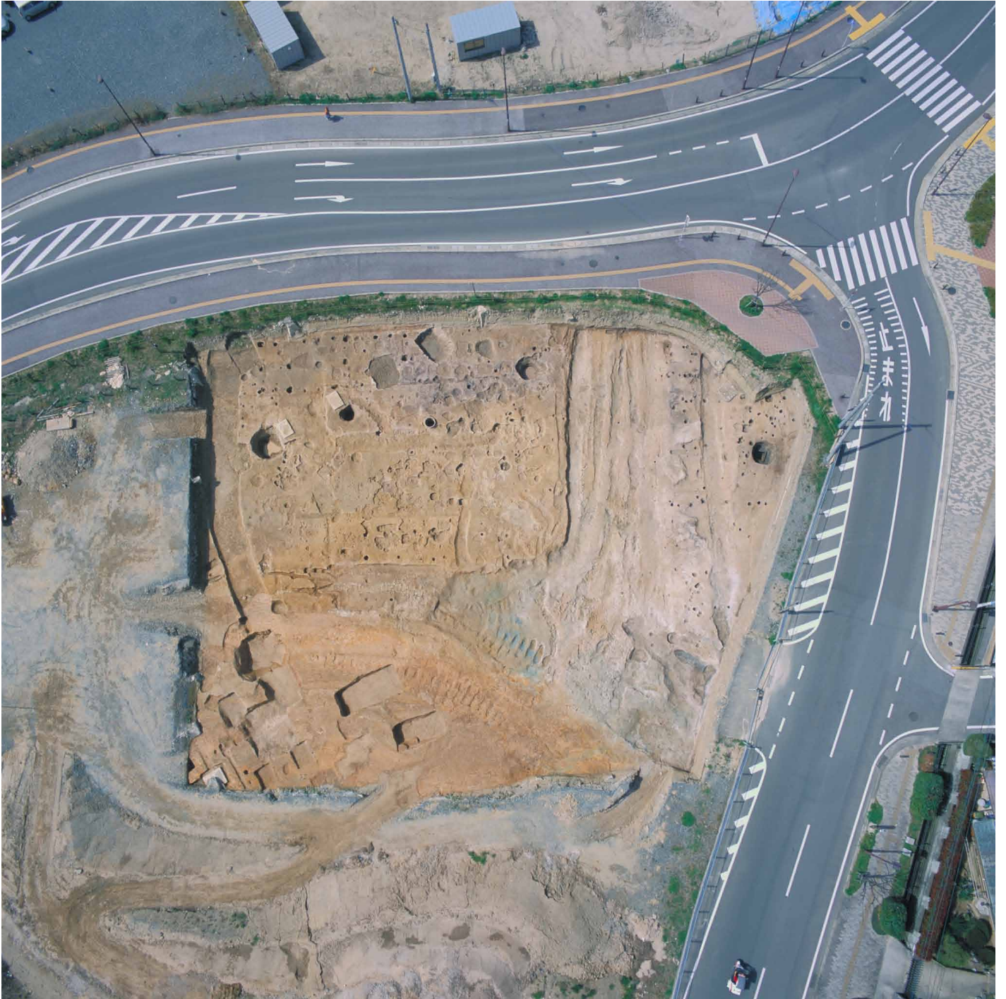
写真 6. 条坊跡第 275 次調査 空中写真 第 2 面調査区全景（上が西）