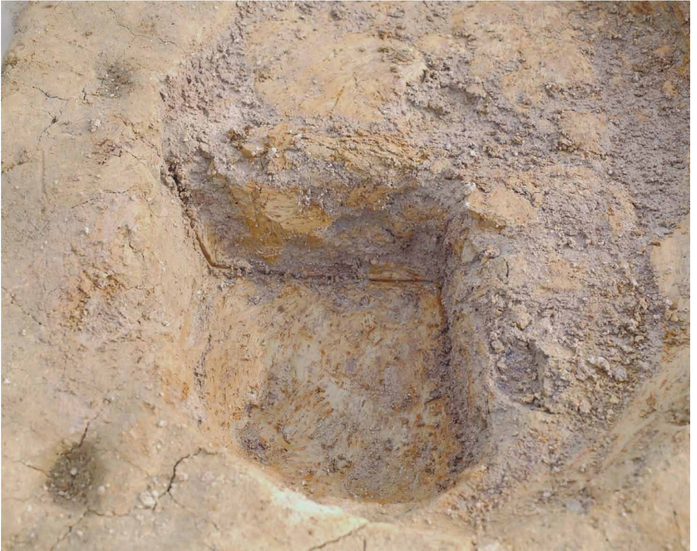
写真 55. 条坊跡第 275 次調査 275SB400a 土層観察（北から）