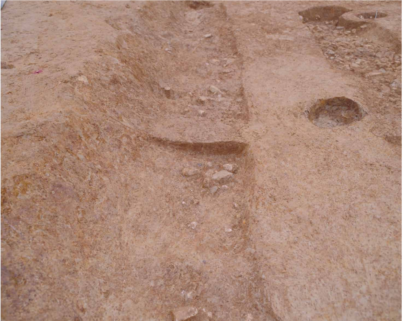
写真 60. 条坊跡第 275 次調査 275SD212 土層観察（南から）