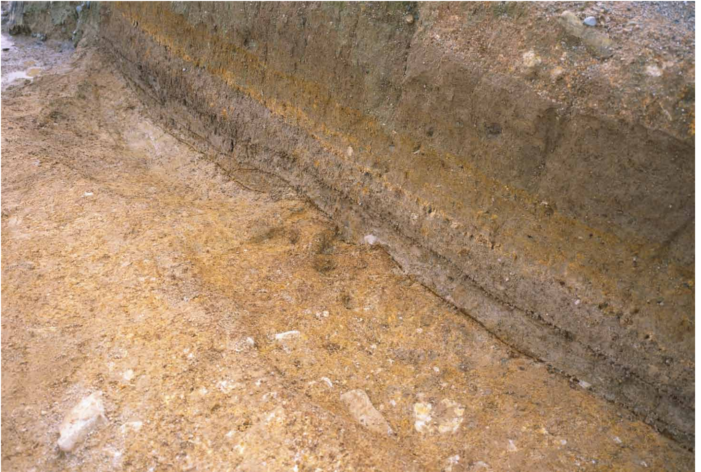
写真 282. 条坊跡第 285 次調査 285SX075 完掘状況（北から）