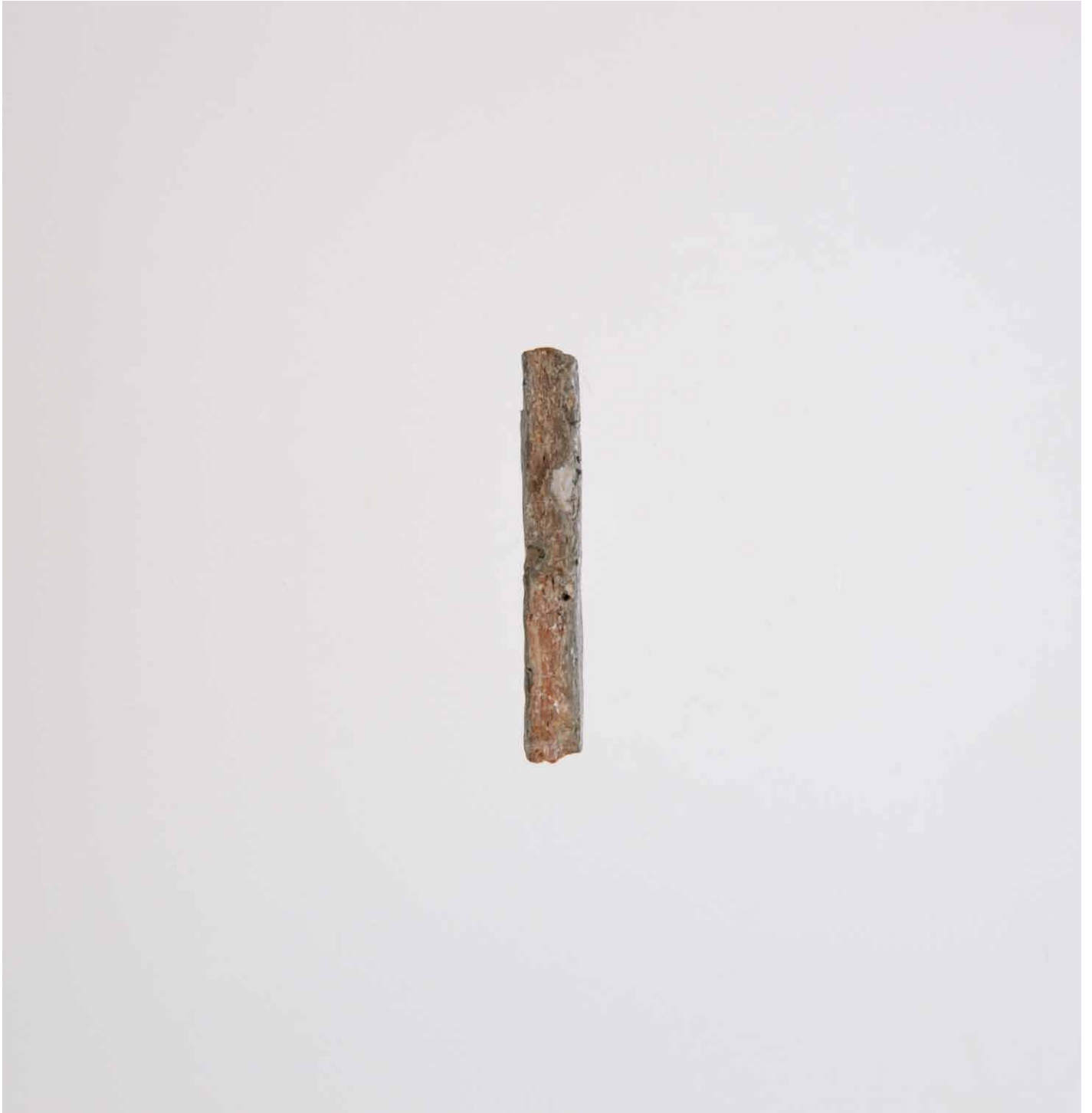
写真 170. 条 275SX284 断面