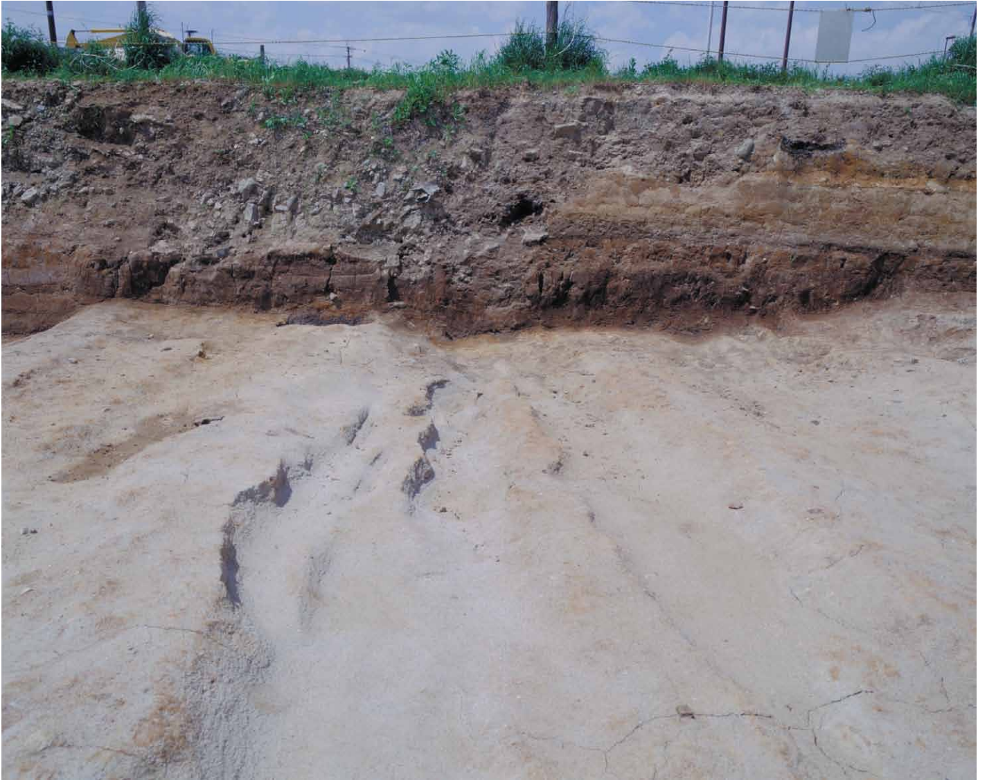
写真 75. 条坊跡第 275 次調査 西壁土層断面 条路（東から）