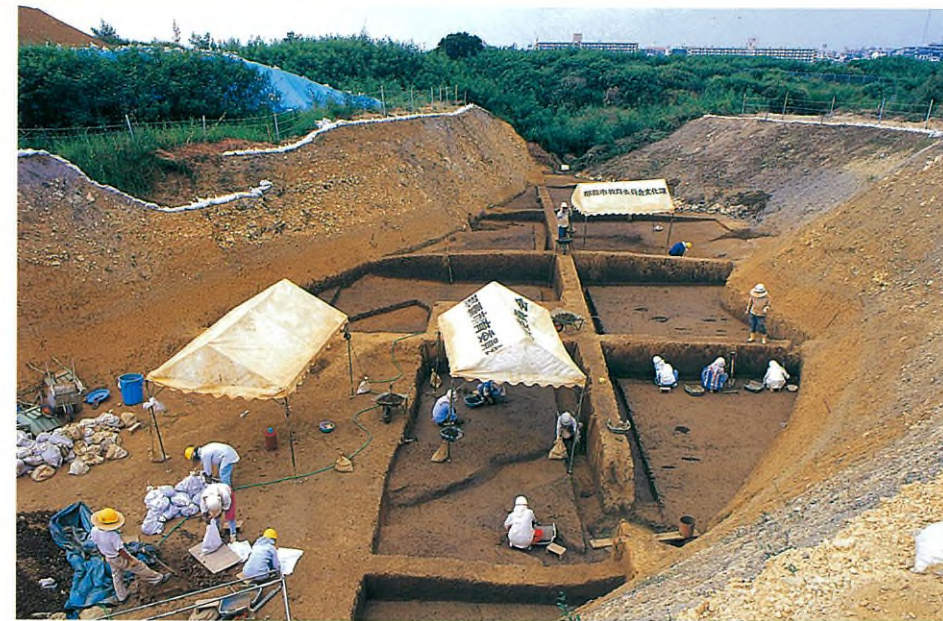
発掘調査の作業状況 (南から) 夏場は、厳しい暑さの中、 テントを張っての作業。