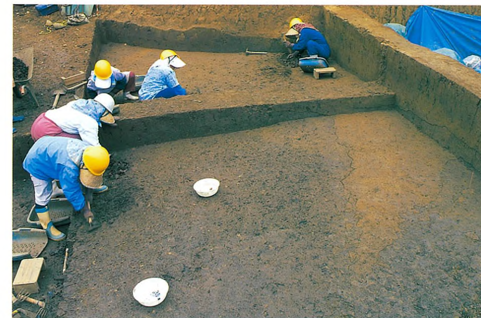
遺構検出状況 (南東から) 14・15世紀頃と考えられ る溝状遺構と鋤跡。