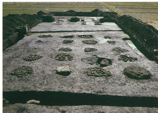
泉崎村関和久官衙遺跡2号建物跡