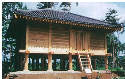
関和久官衙遺跡2号建物跡を復元した まほろん野外展示の正倉