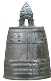
新地町向田 A 遺跡出土の 鋳型から復元した鉄製梵鐘

2022 年から続いている企画展「U-15 の考古学」シリーズ。 今回は平安時代にスポットをあててご紹介します。