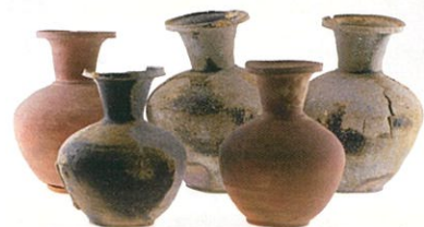
写真2 出土した須恵器壺

炭窯跡の操業後に天井がかなり崩れ落ちた段階で窯内に置かれたもので、本来は正立していたものと推測されます。また、これらの壺は口の一部が欠けたり、胴や底にヒビが入っているものばかりで、実用的ではありません(写真2)。