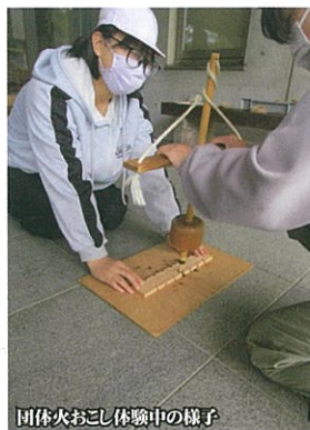
団体火おこし体験中の様子