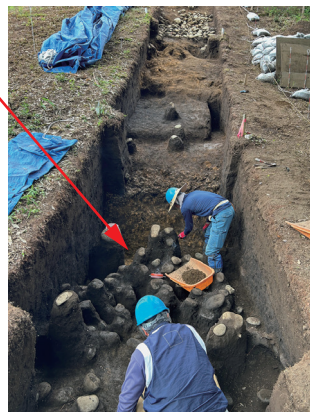
S60 東斜・裾部の様子(東から) 手前の石は上から落下したもの