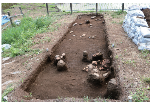
S72 西斜・土器の見つかった様子(東から)