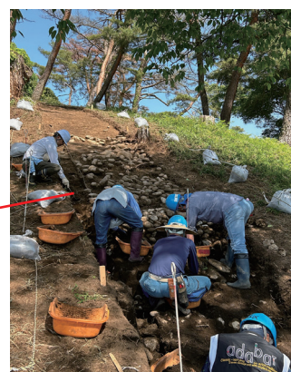
上から転落した葺石の様子(西から)