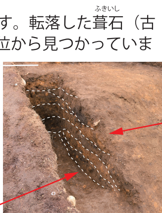
S60 西斜・墳丘の盛土