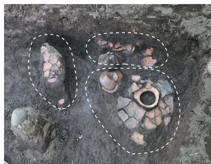
3個以上の土器が出土しています。(南から)