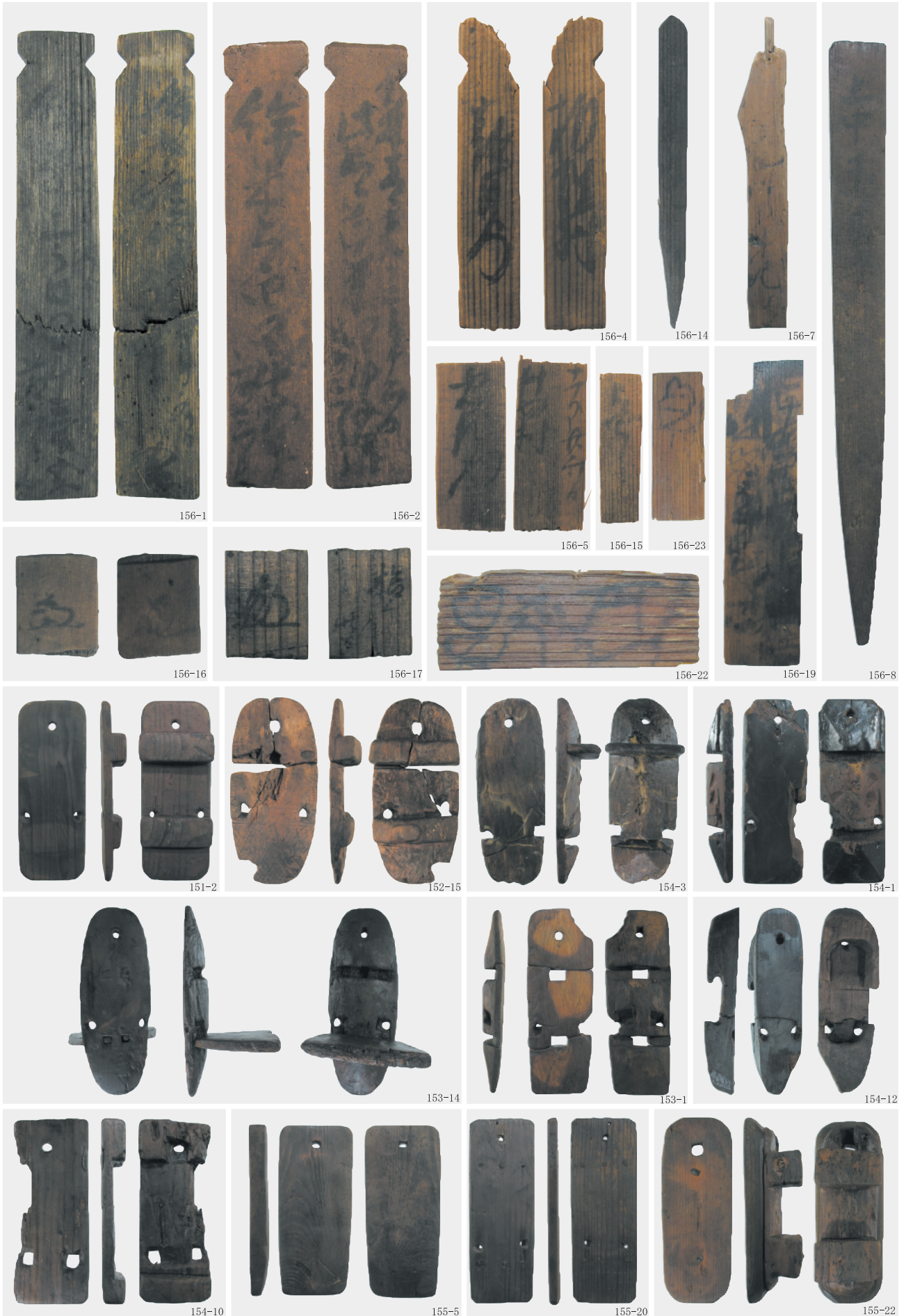
木簡・墨書・下駄