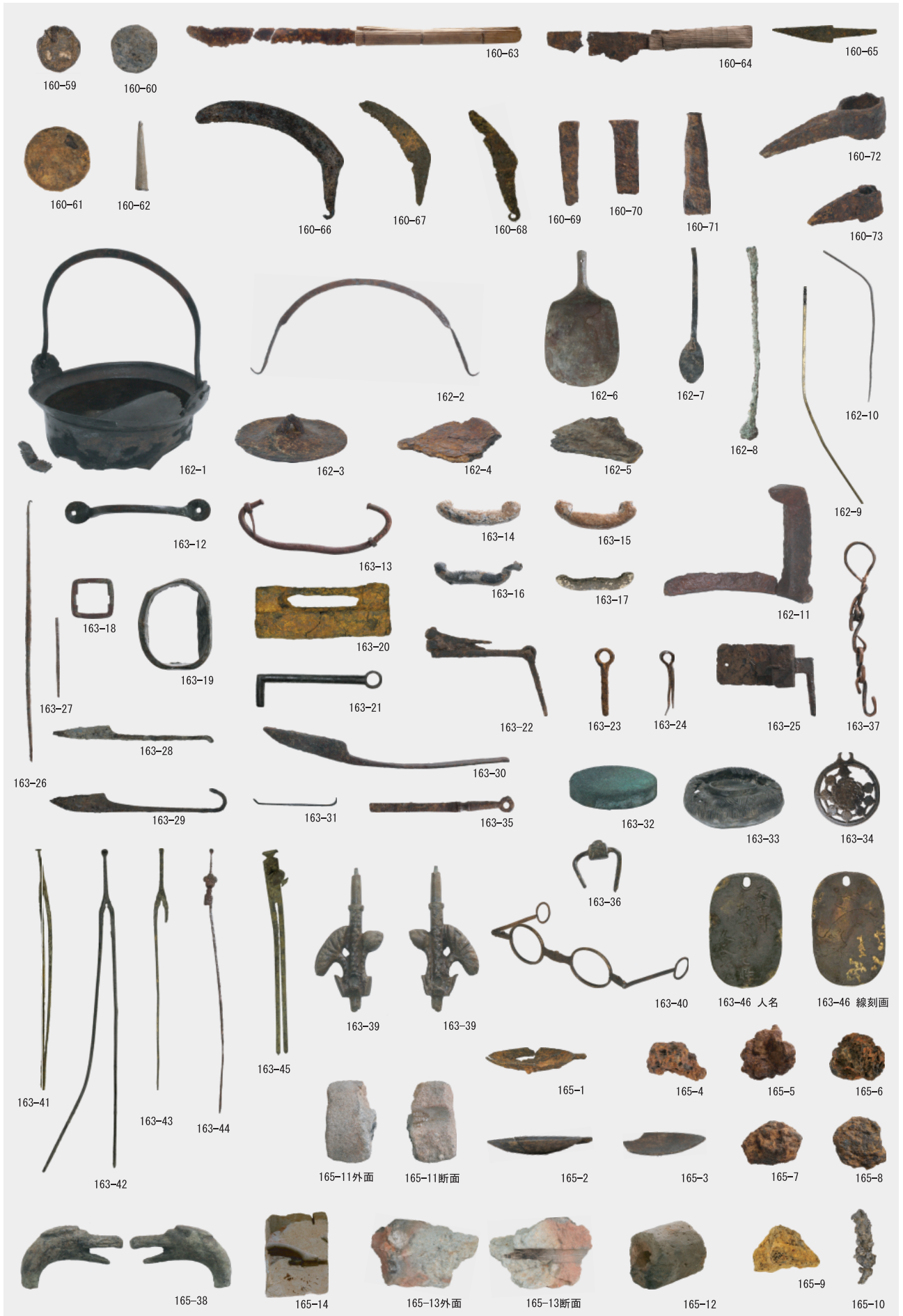
農工具・日用品・その他