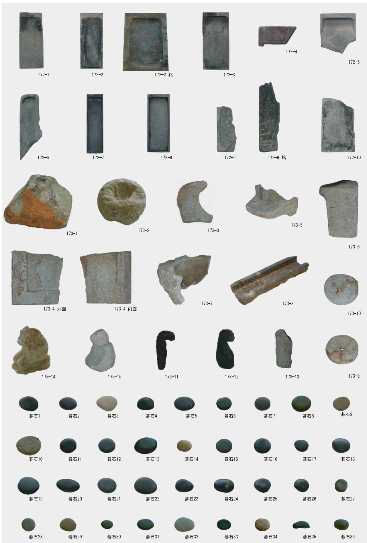
硯・石塔類・碁石・その他