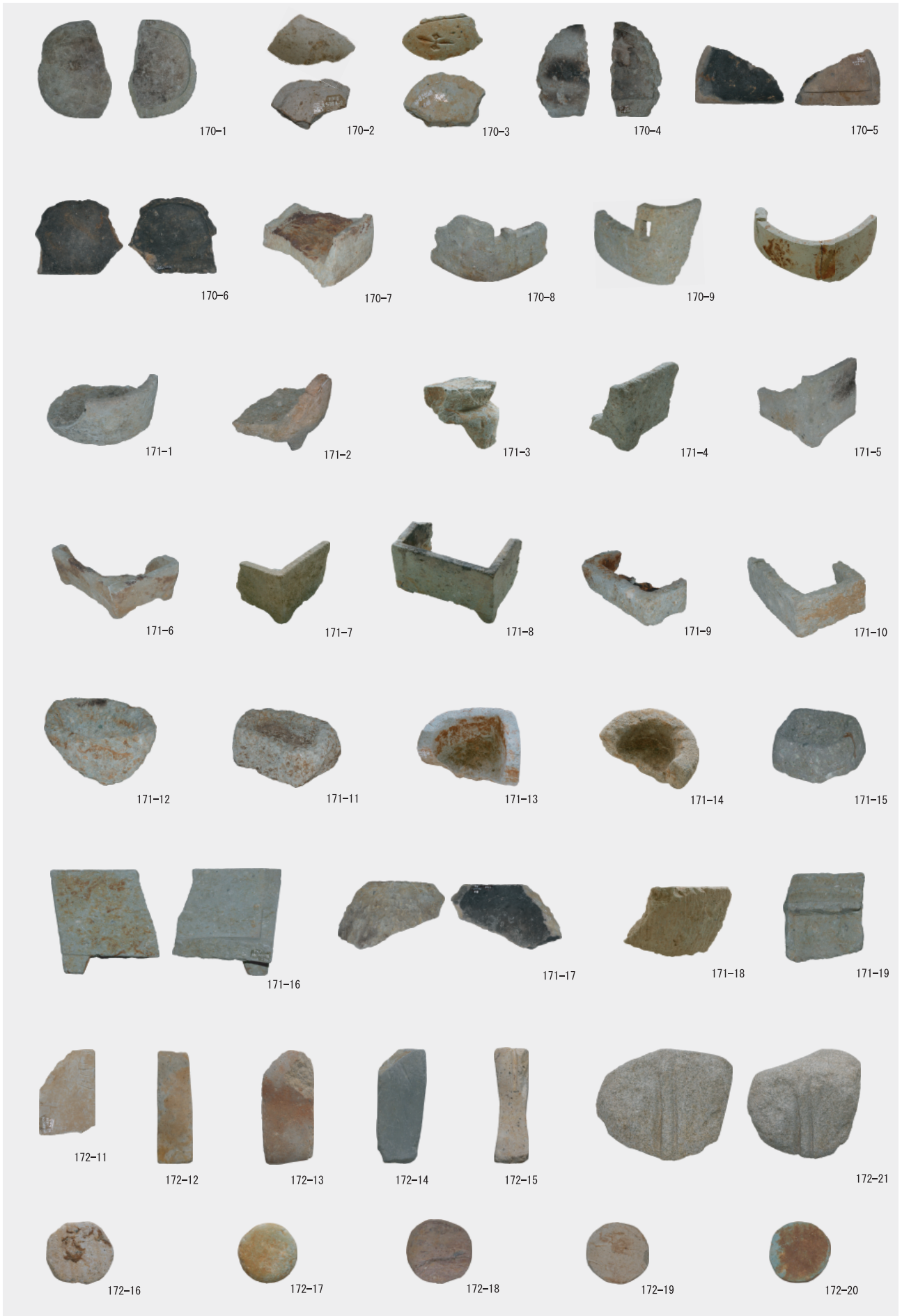
バンドコ（行火）・容器類・砥石