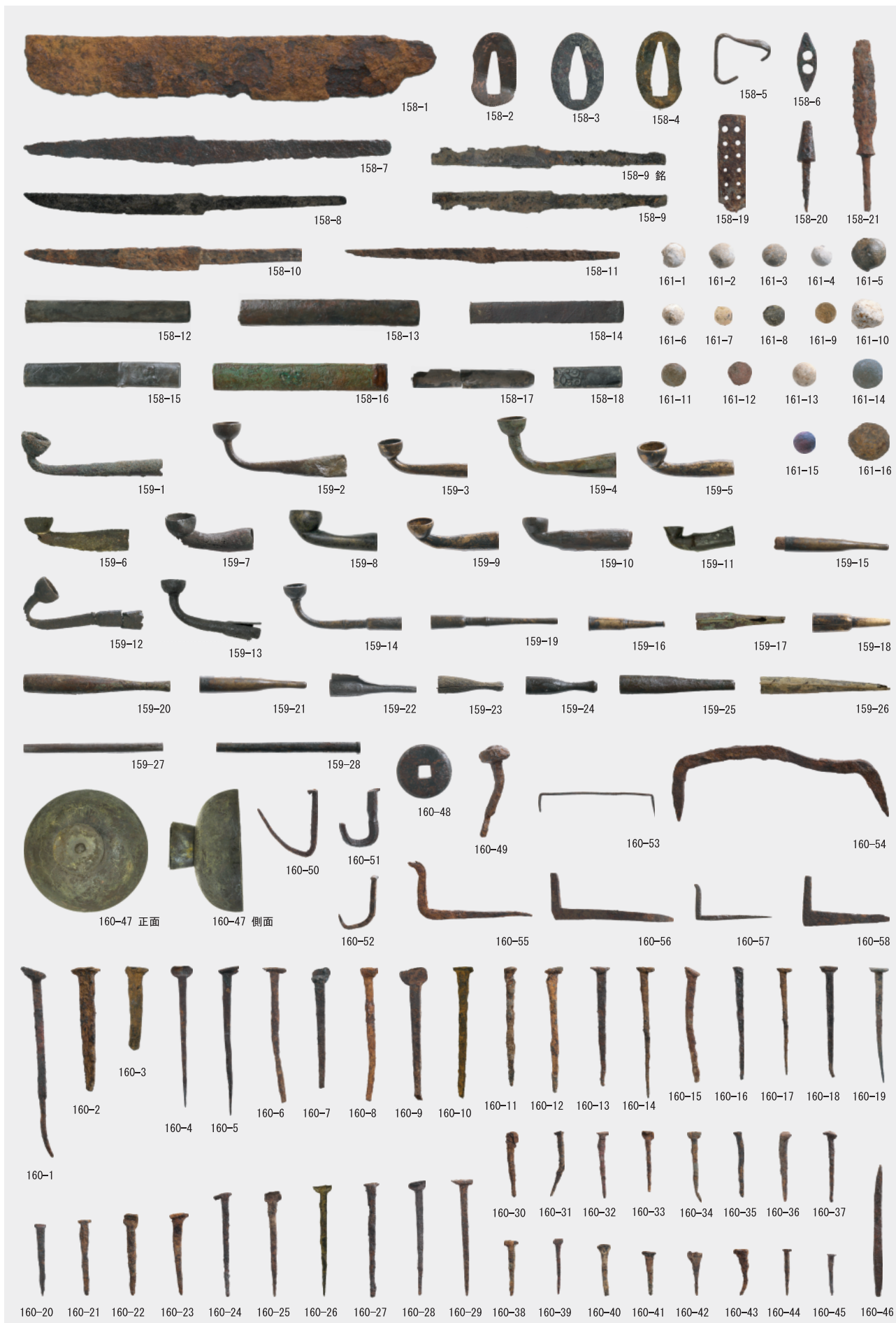
武器武具・煙管・釘類