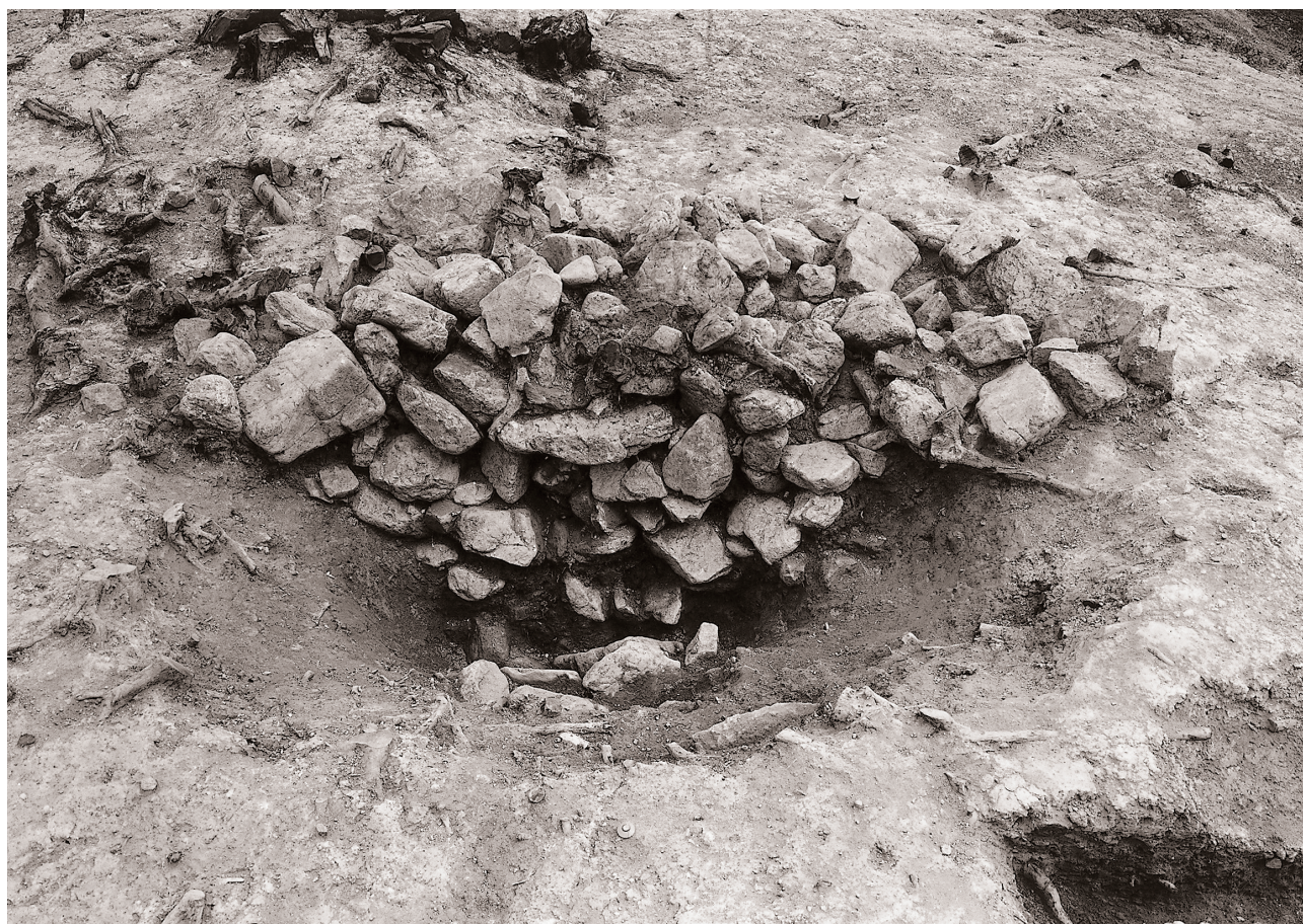
(1) 上部集石半截状況（北西より）