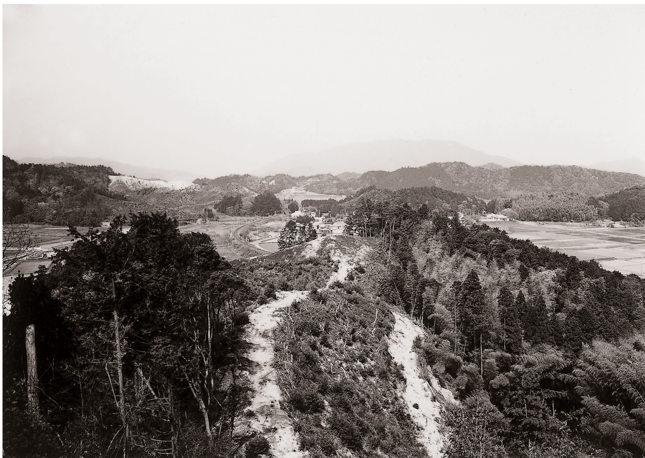
(1) 調査区遠景 (東より)