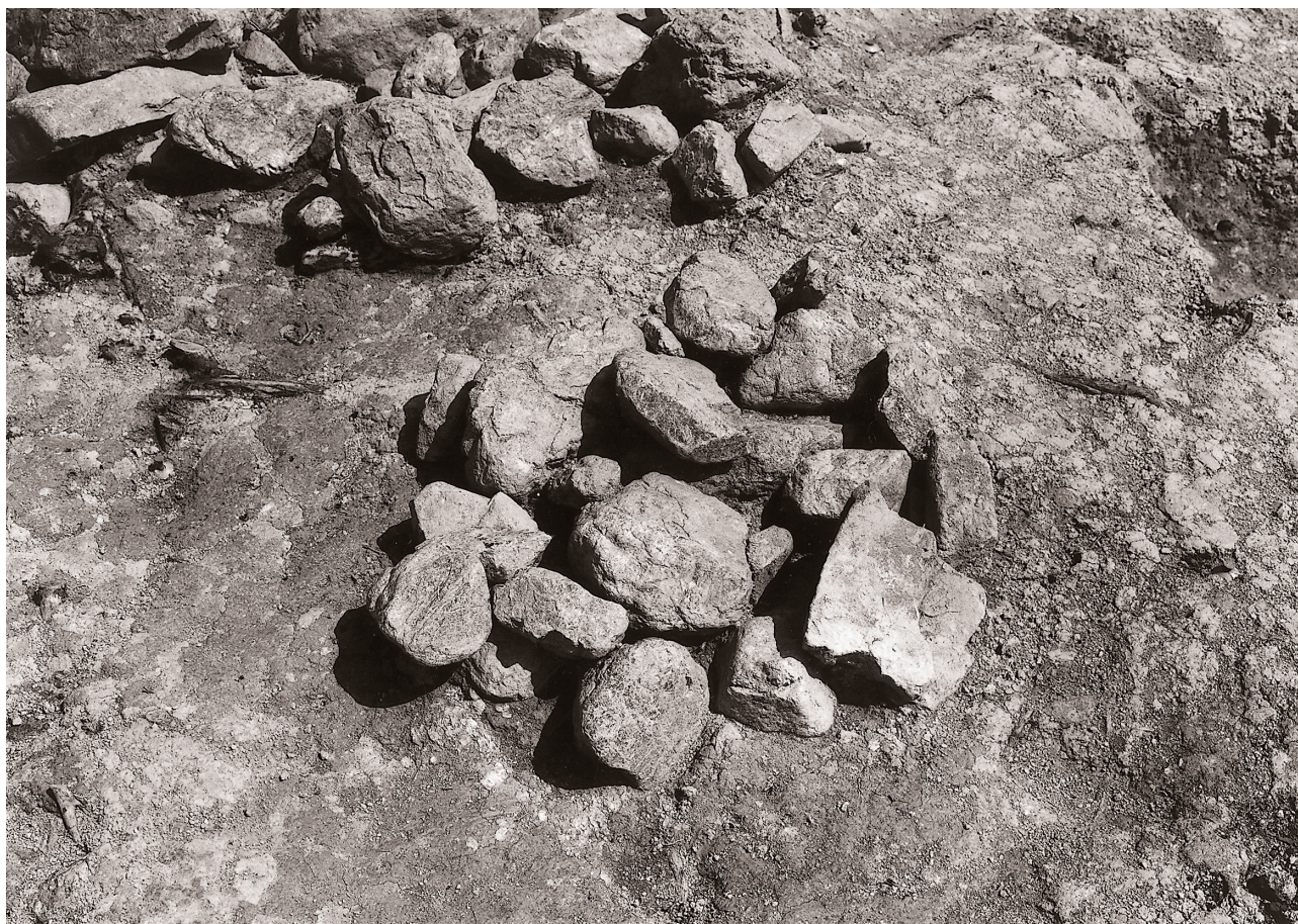
(1) 検出状況 (北西より)