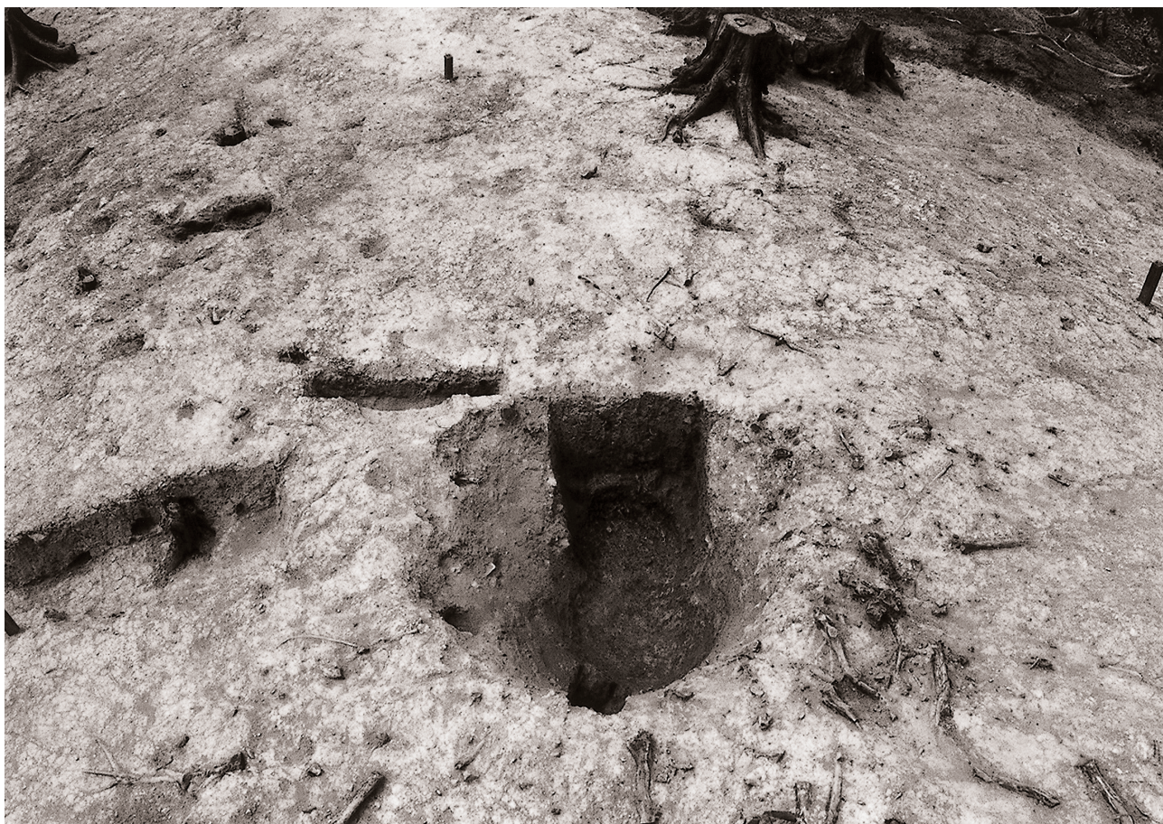
(5) 完掘状況 (南東より)