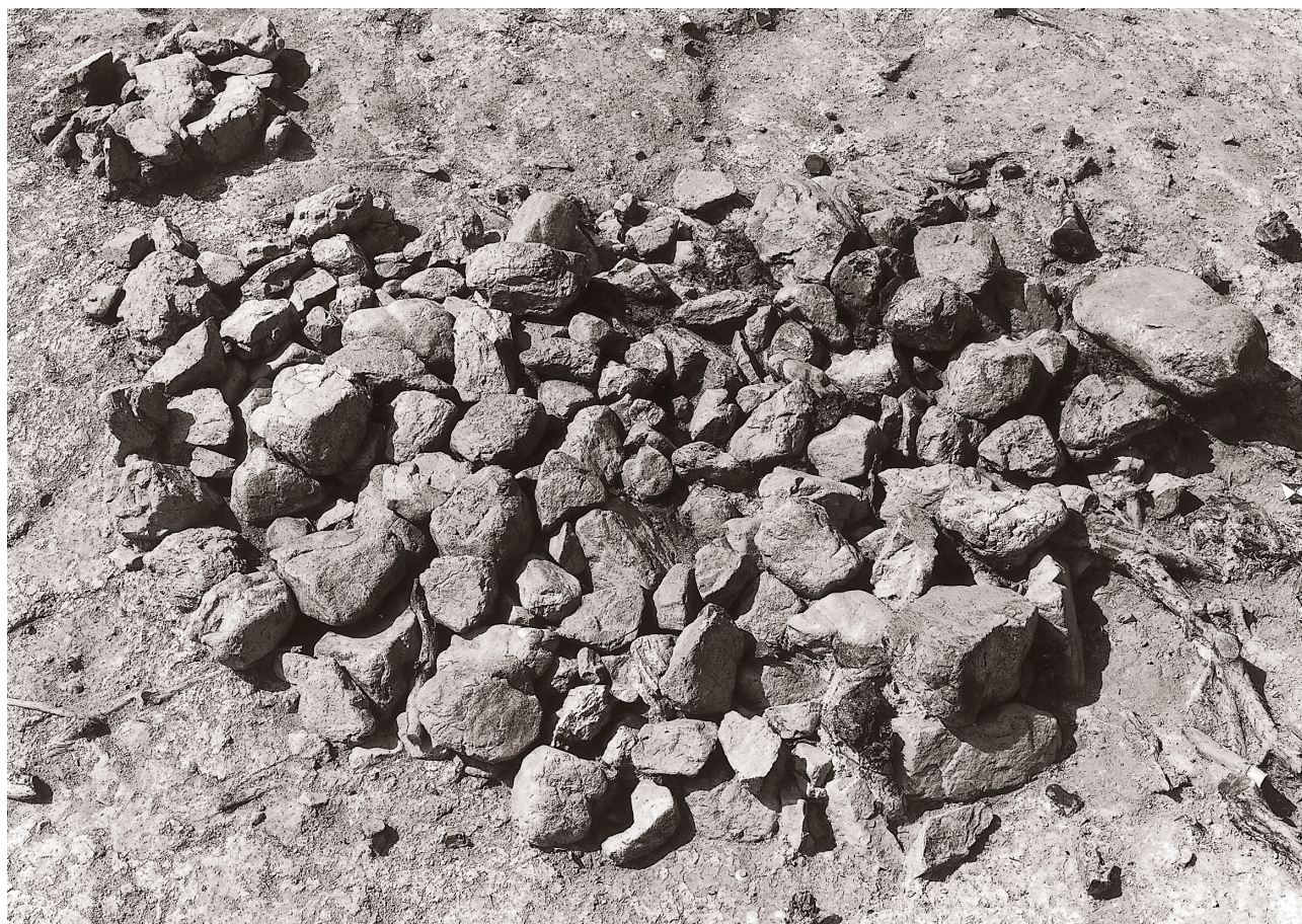
(1) 上部集石検出状況 (南東より)