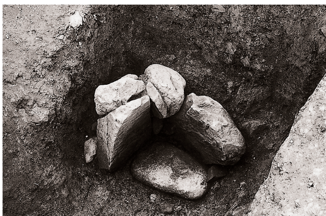
(4) 石組解体状況④ (南東より)