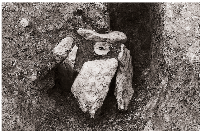
(1) 石組解体状況① (南東より)