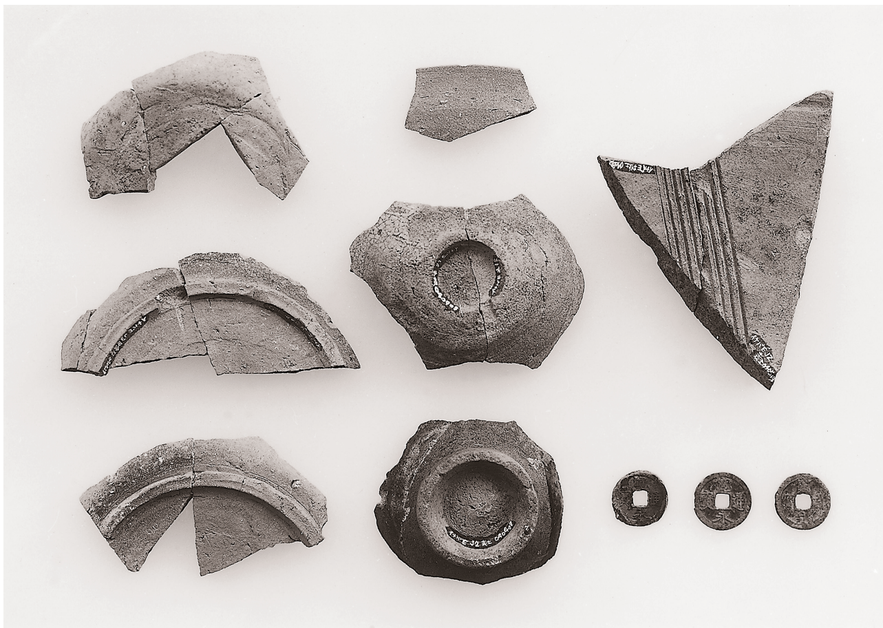
(2) E地区出土土器・銭貨