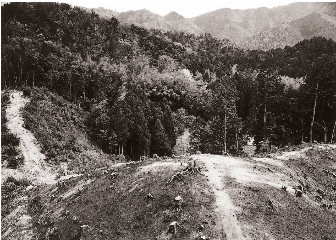
(1) 調査前近景 (北西より)