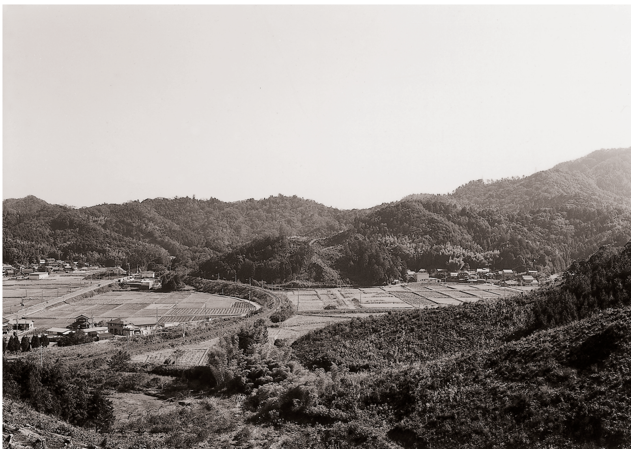
(2) 調査区遠景 (西より)