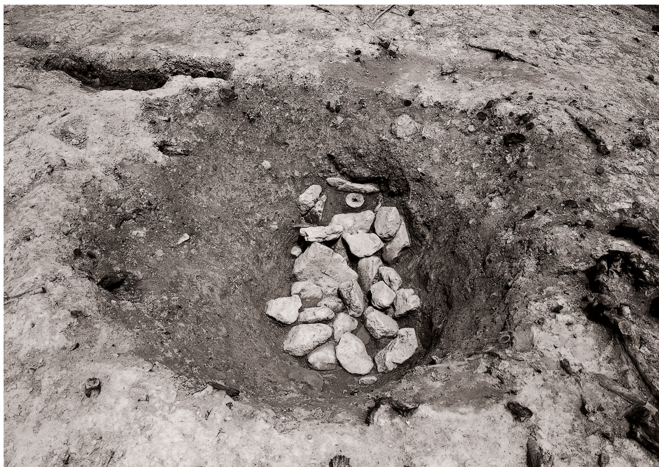
(2) 下部集石検出状況（南東より）