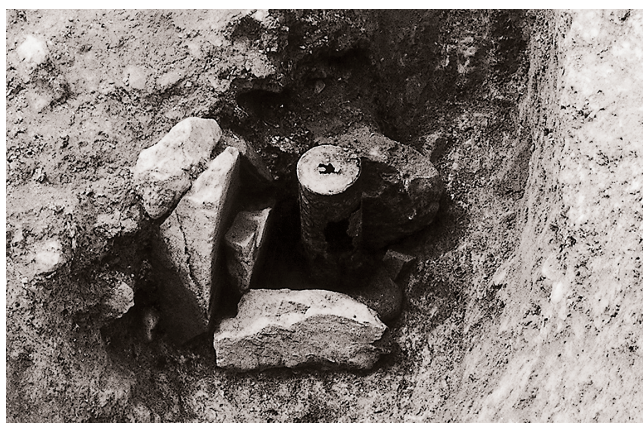
(3) 石組解体状況③ (南東より)