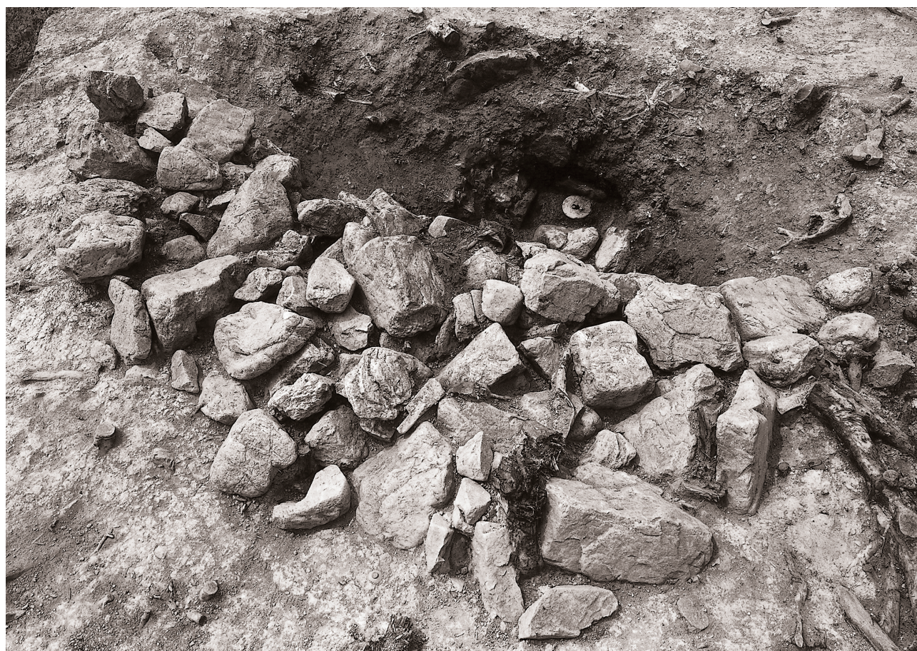
(2) 経筒確認状況 (南東より)