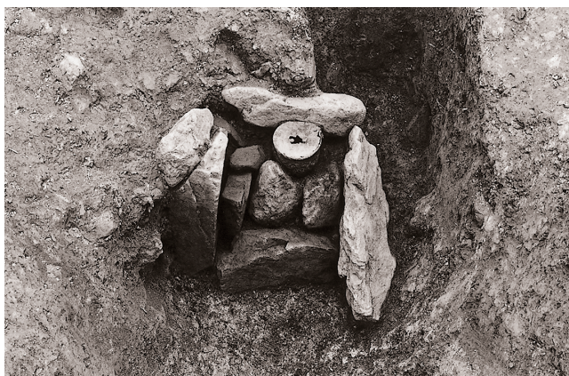
(2) 石組解体状況② (南東より)