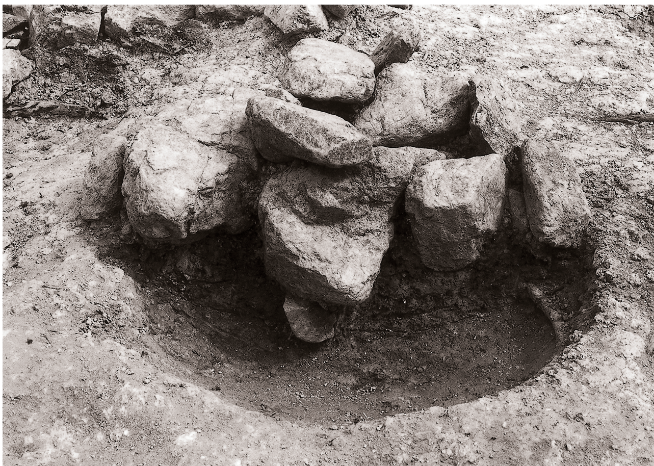
(2) 半截状況 (北西より)