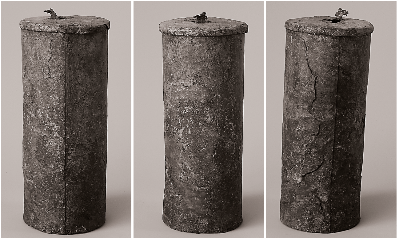
(2) 銅製経筒 (保存処理後)