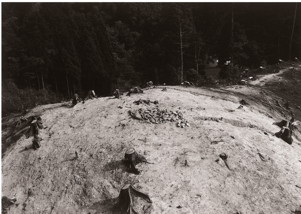
(2) 遺構検出状況 (北西より)