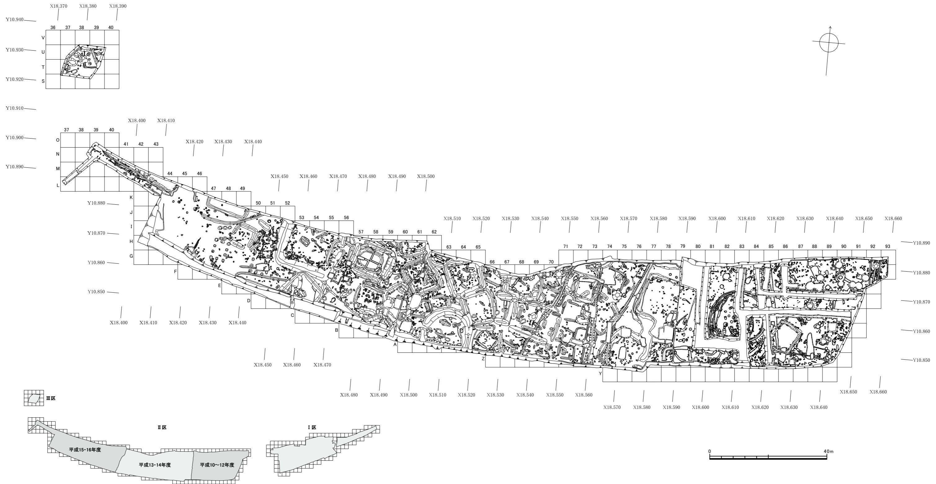
第7図 調査Ⅱ・Ⅲ区下層遺構全体図（縮尺1/800）