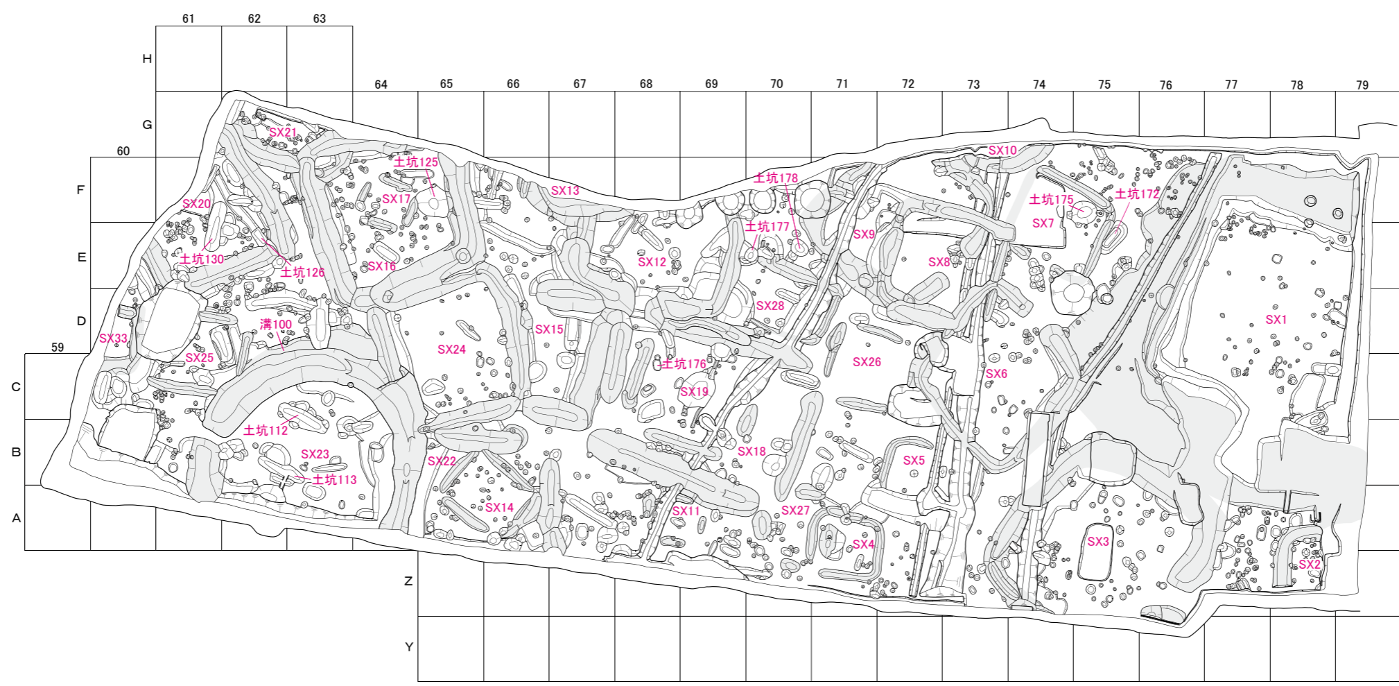
第10図 調査Ⅱ区下層遺構図(2) 平成13・14年度(縮尺1/400)