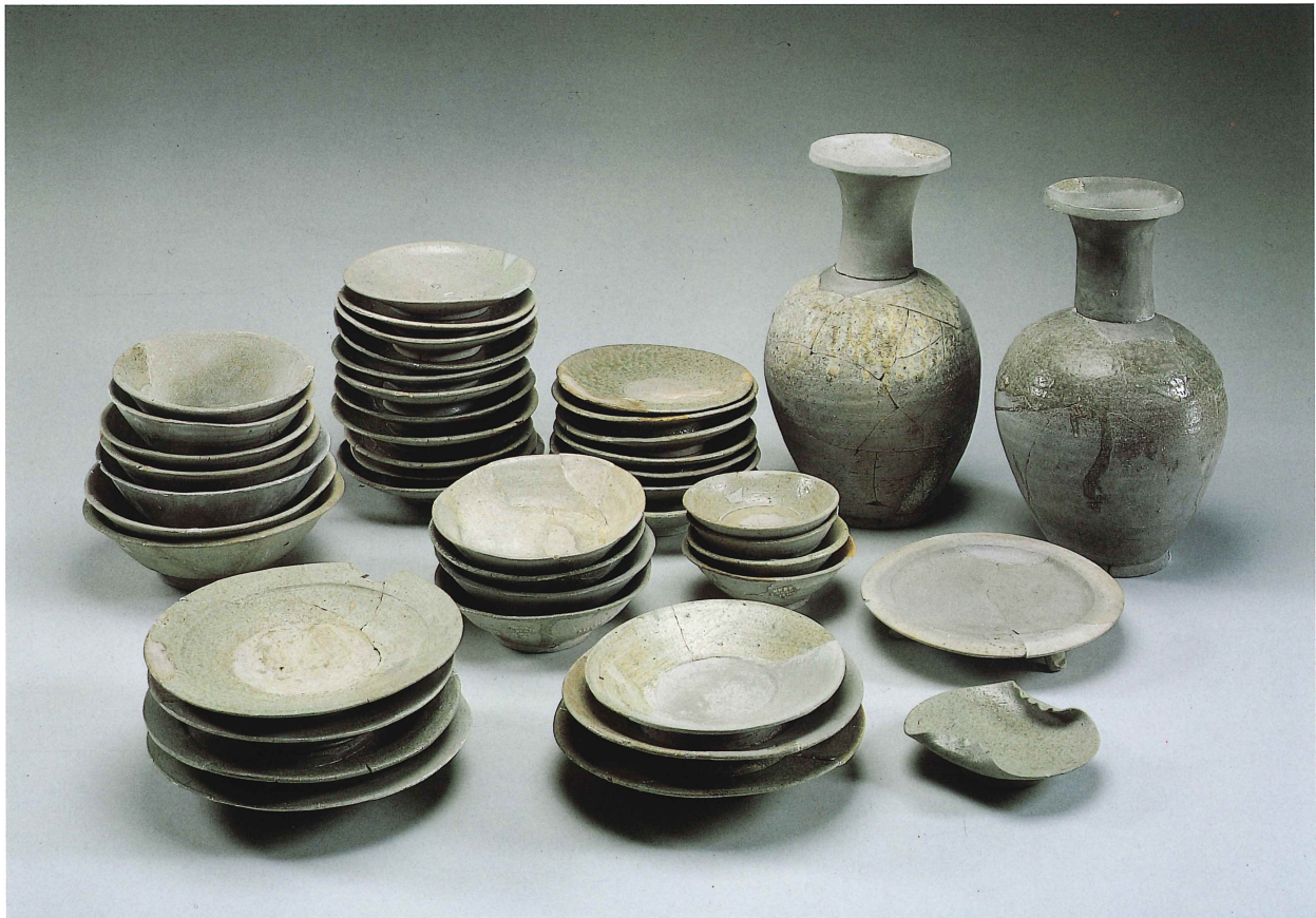
第54号掘立柱建物跡出土灰釉陶器