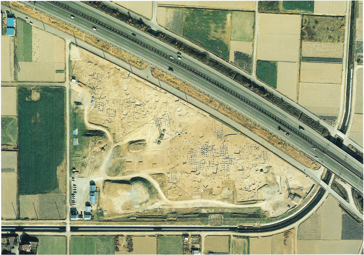
中堀遺跡空中写真