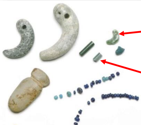
石製品・ガラス製品

鉄製品の出土量や砥石の使用痕に加えて、小型の工具、鉄製品の裁断片も出土していることから、大原遺跡において鉄製品の生産が行われていた可能性もあります。