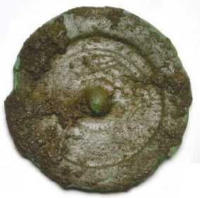
こがたぼうせいきょう 小型仿製鏡