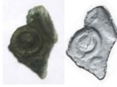
ぼうせいきょう 仿製鏡 (破鏡)