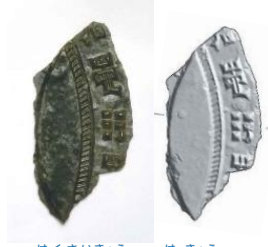
はくさいきょう 船載鏡 (破鏡)