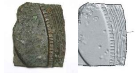
はくさいきょう 船載鏡 (破鏡)