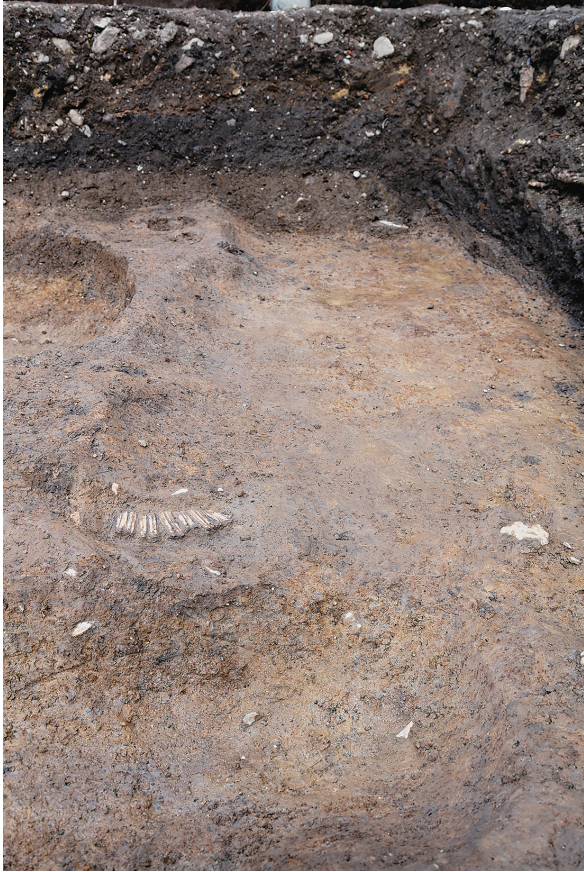
1 SD8ウマ歯列出土状況（南から）