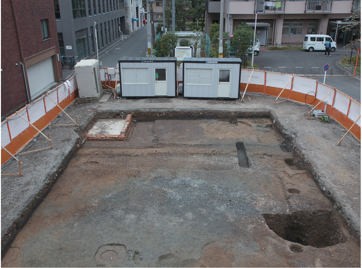
1 3区第1面全景（東から）