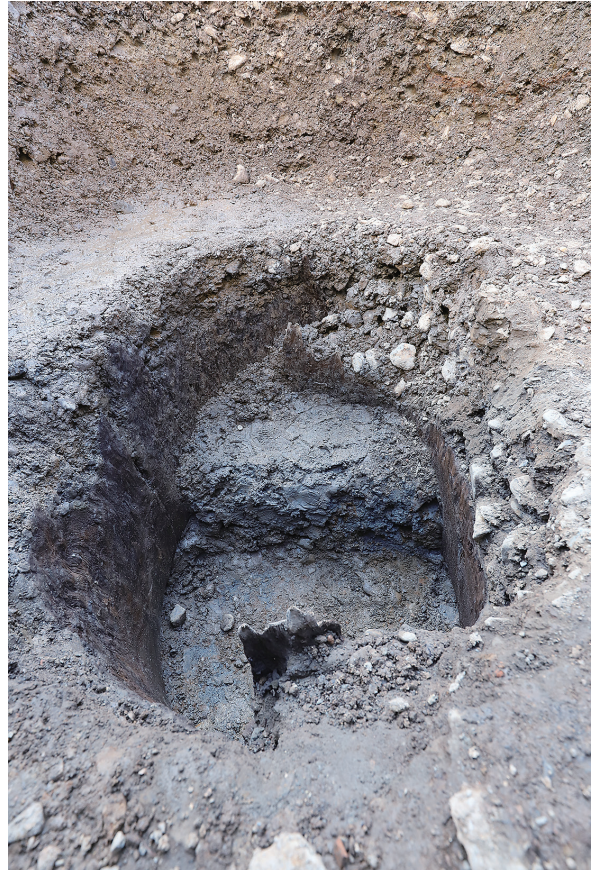
3 SE64 木枠内底部断面（東から）