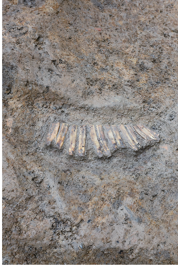
2 SD8ウマ歯列出土状況（南から）