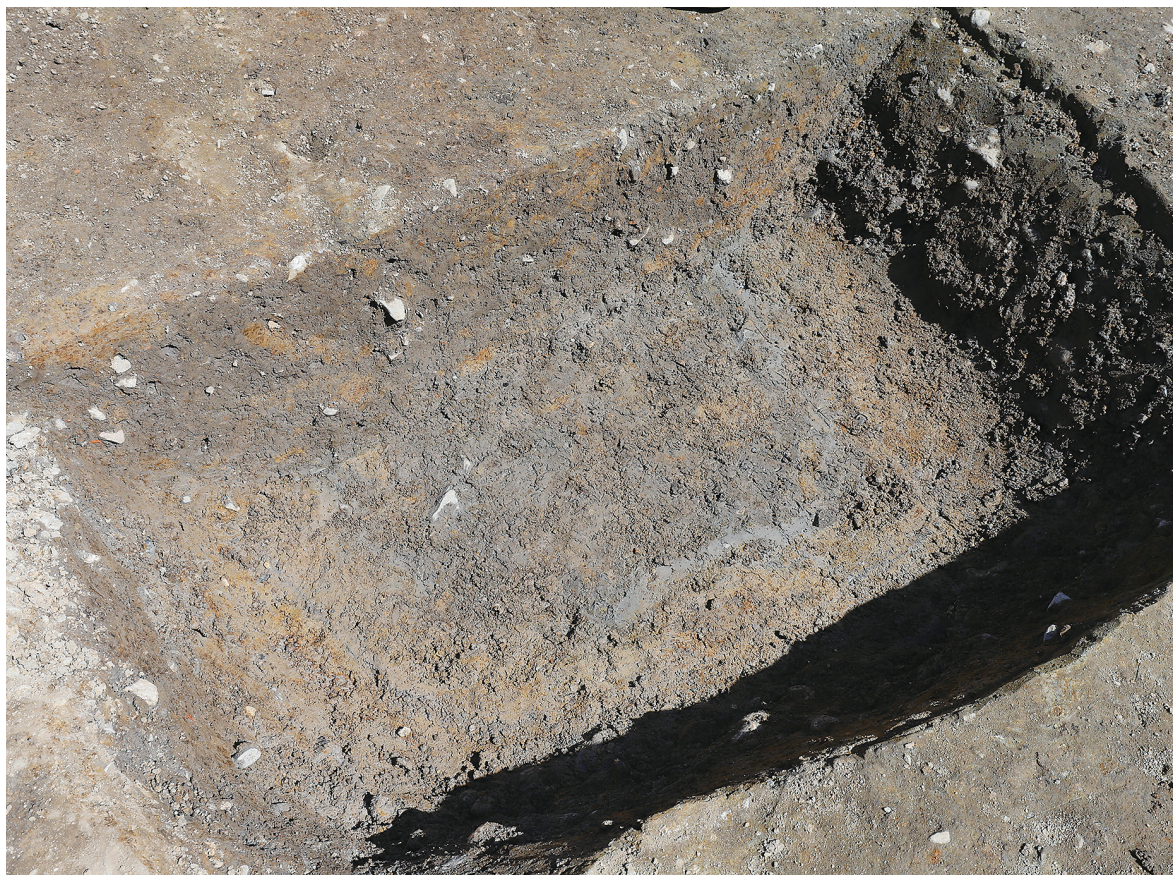
1 SK102南半粘質土検出状況（南西から）