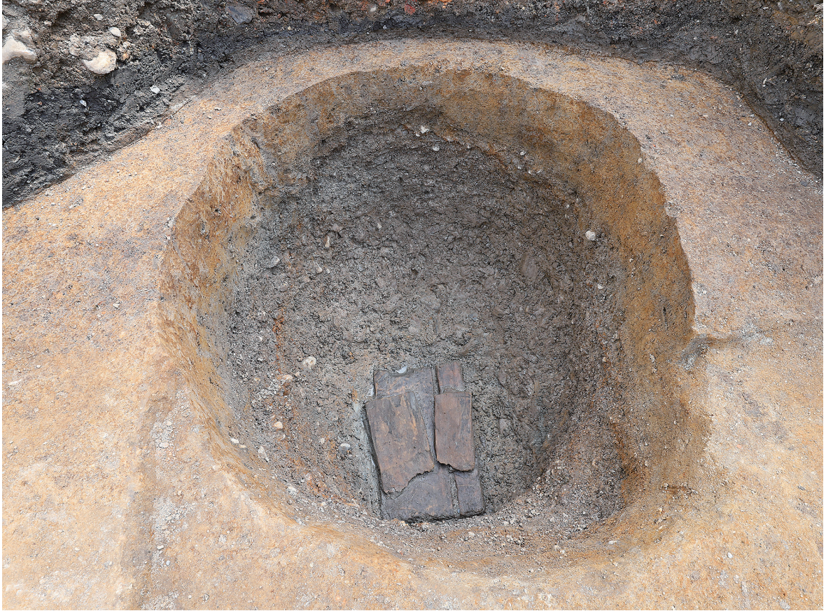
1 SK106底部木材出土状況（北から）