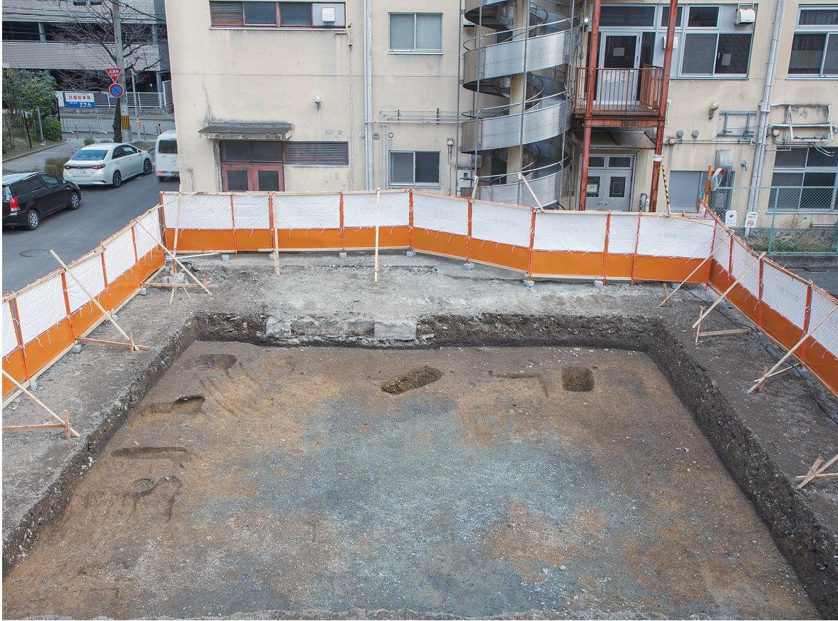
1 1区第1面全景（西から）