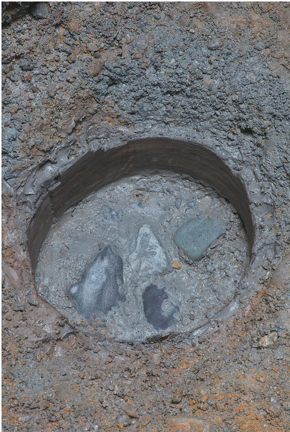
3 SE25底部曲物内（北から）