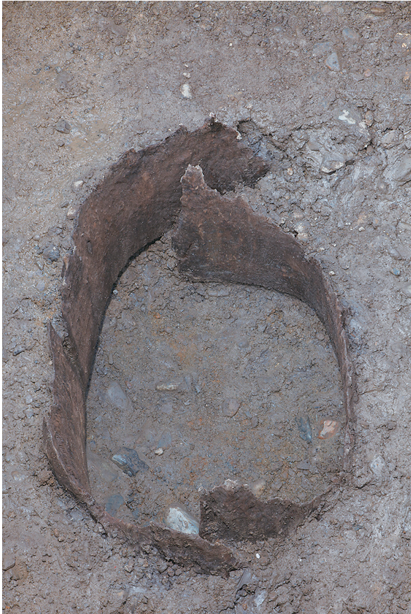
2 SE64 木枠内完掘状況（東から）