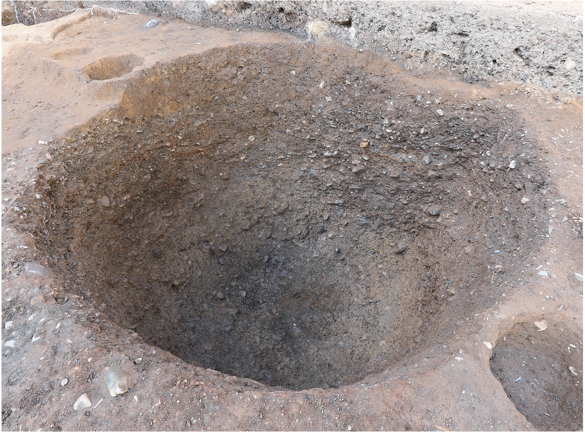
1 SE64完掘状況（南東から）