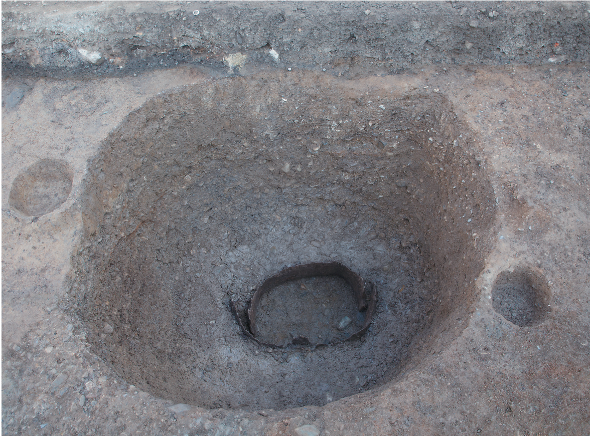
1 SE64 木枠内完掘状況（南から）