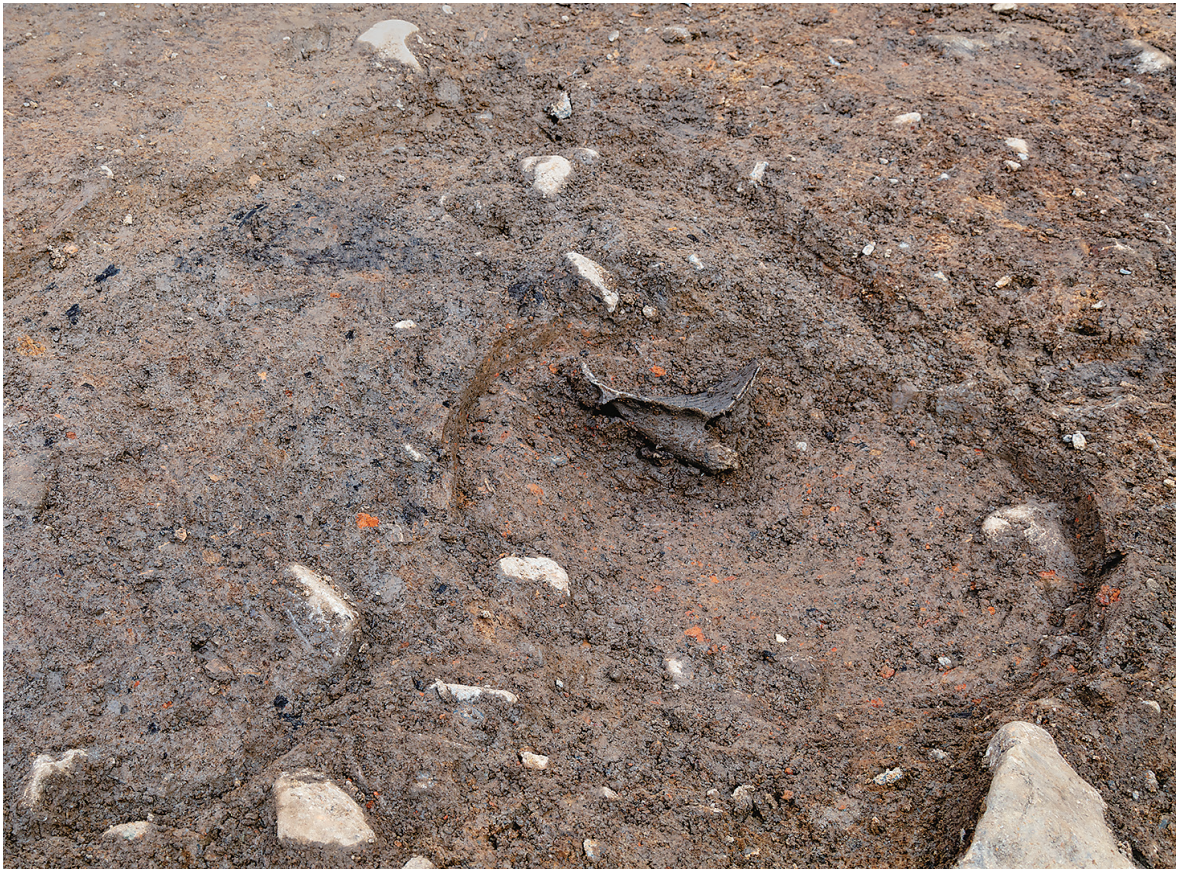
2 SE12上部瓦器羽釜出土状況（南西から）