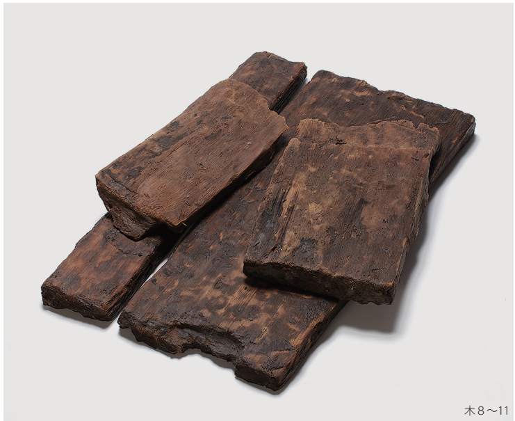
調査区内出土木製品