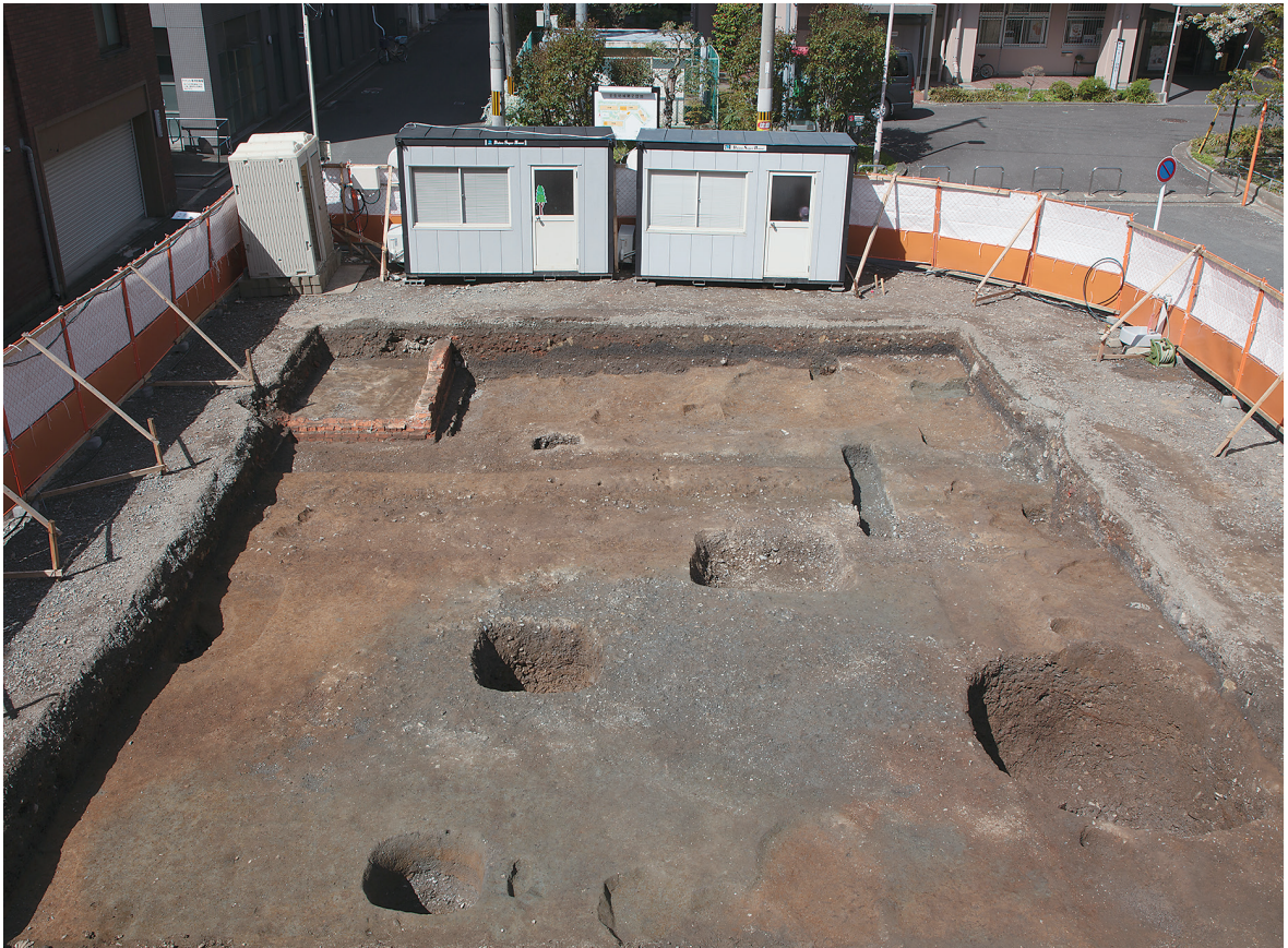
2 3区第2面全景（東から）