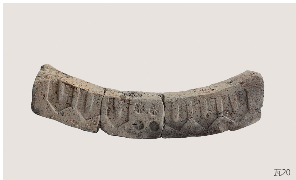
SE64・SE12出土遺物、調査区内出土瓦