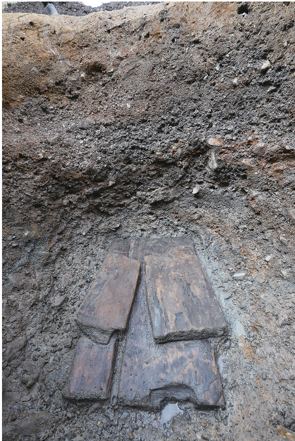
2 SK106底部木材出土状況（南から）