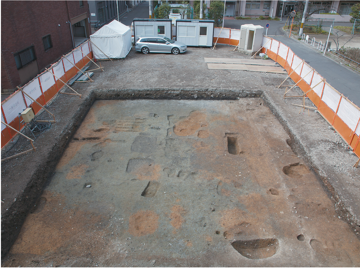
1 2区第1面全景（東から）