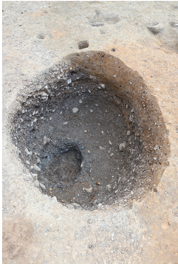
4 SE25曲物除去後（北から）