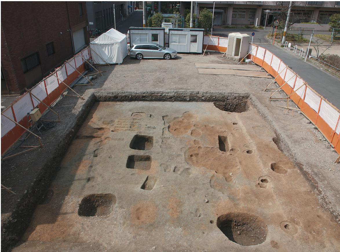
2 2区第2面全景（東から）