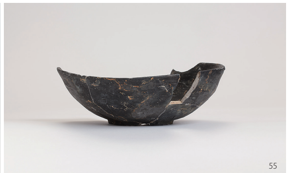
SK76 · SE25 · SE101 · SK102 · SE64 出土遺物