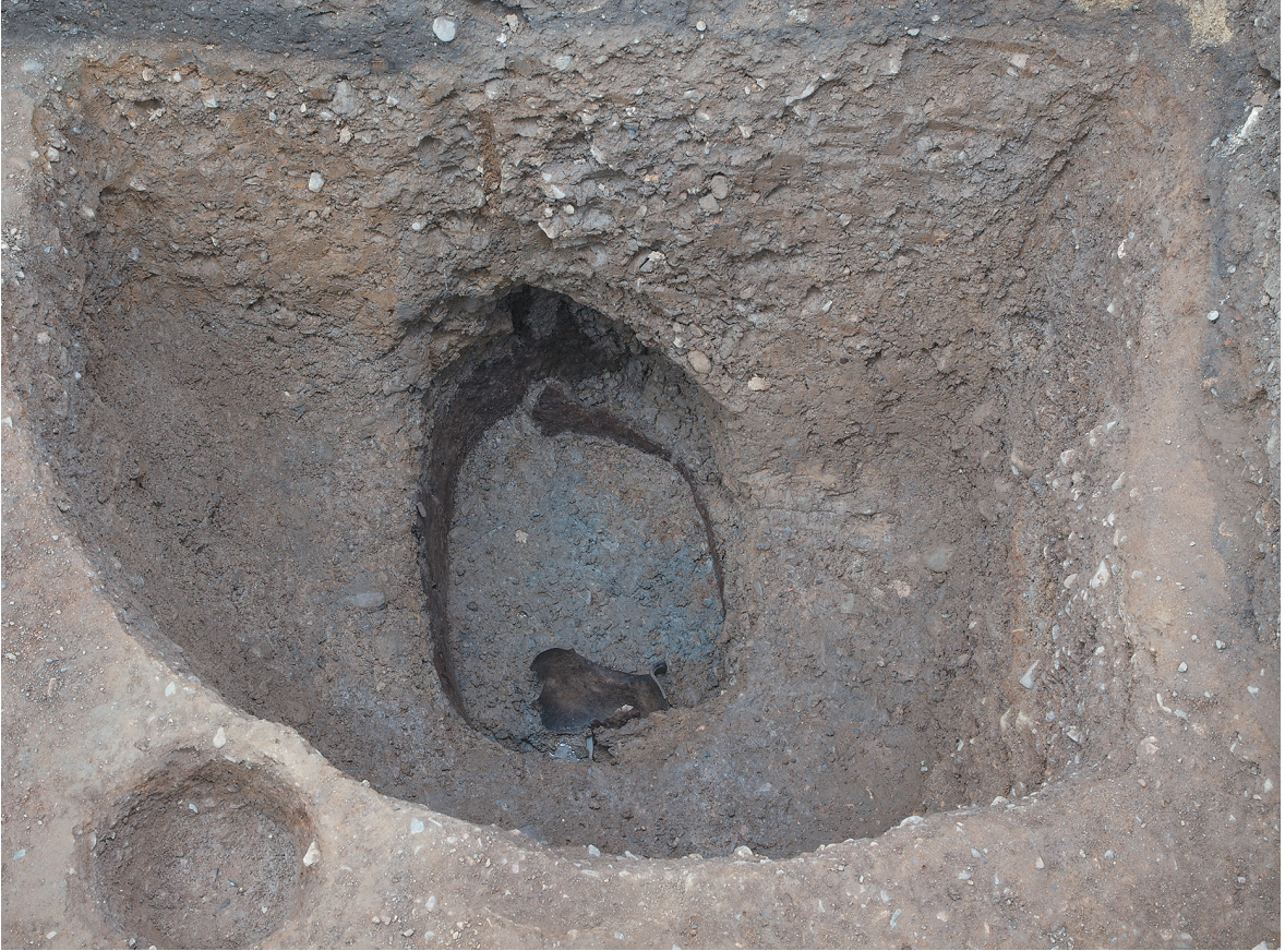
1 SE64 木枠検出状況及び断面（東から）