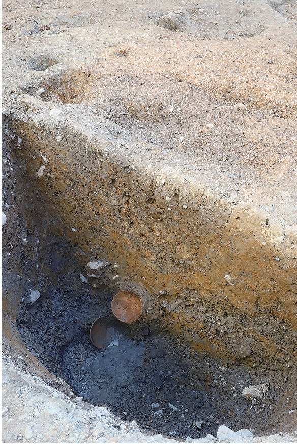
1 SE25土師器皿出土状況（北東から）