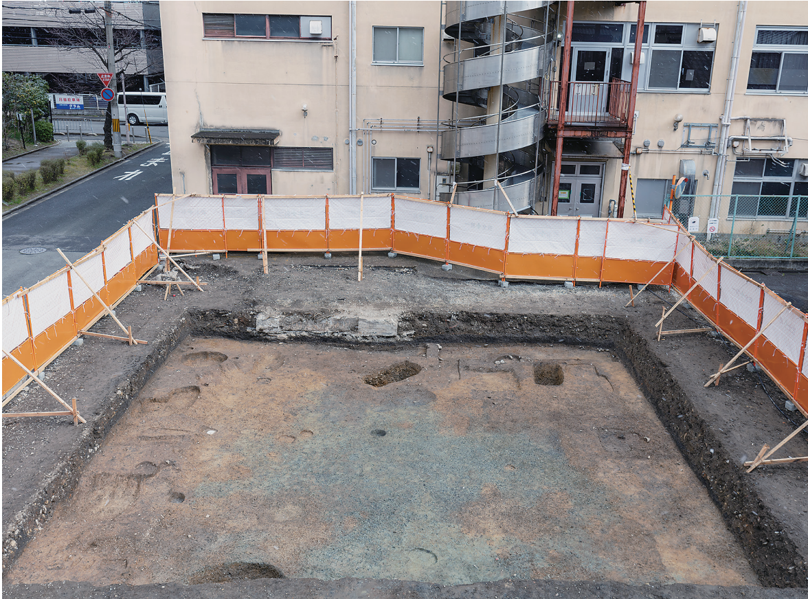
2 1区第2面全景（西から）