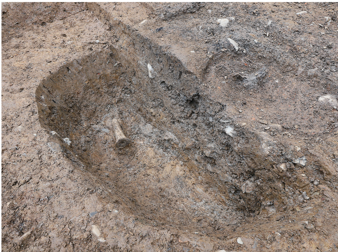
1 SE12白色土器高杯脚部出土状況（南西から）