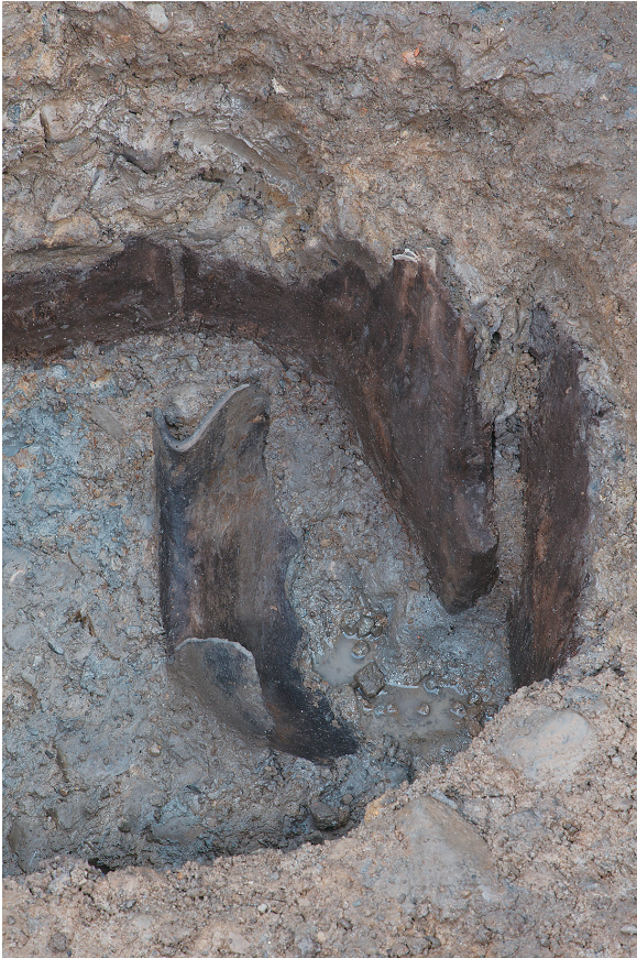
2 SE64 木枠内須恵器出土状況（南から）