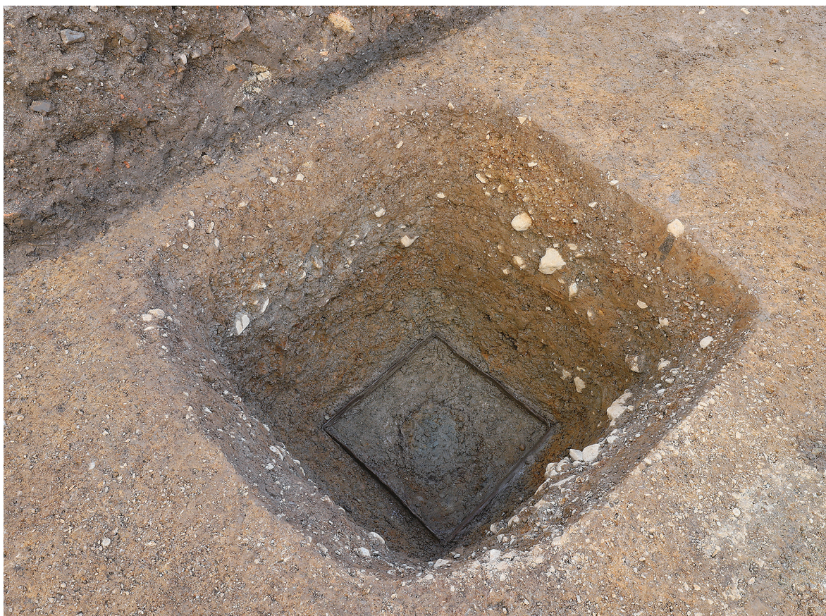
2 SE12完掘状況（北東から）