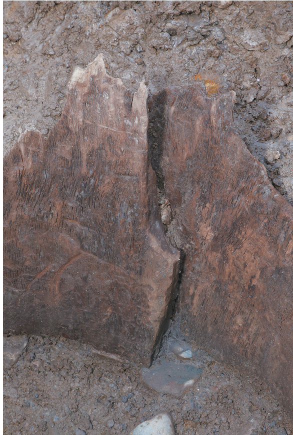
3 SE64 木枠組合わせ部（西から）