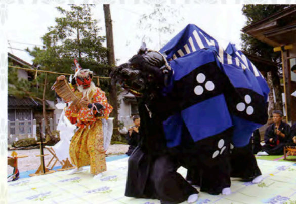
埴田神社青獅子舞「ささら舞」

伊勢流の特徴を持つ獅子舞のほか、出雲地方に古くから伝わる「投げ獅子」と言われる獅子頭を投げつけるように舞う三谷神社投げ獅子舞や、獅子頭が青黒く塗られている埴田神社青獅子舞など、田楽系の流れをくむ出雲地方独特の素朴で古い形態も現在まで継承されています。