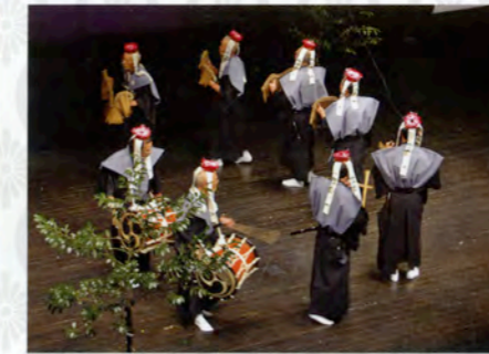
多久神社のささら舞

多久神社で奉納されるささら舞は、およそ500年前に近江国の松本村から船に乗って多久地方に移住してきた松本一族が、大波小波を乗り越えた船旅の苦難をしのいで始めたものが起源と伝えられています。