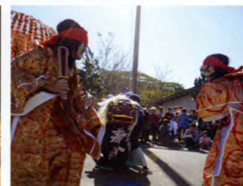
佐志武神社奉納神事舞