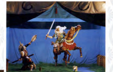
直江一式飾り「決戦川中島」