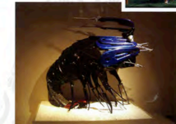
平田一式飾り 自転車部品一式「海老」

一式飾りは、身近な生活用具である陶器、金物、茶器等を組み合わせて、歴史上の人物やおとぎ話などの一場面を独特な発想と技巧を凝らして飾る独特の民俗芸術です。