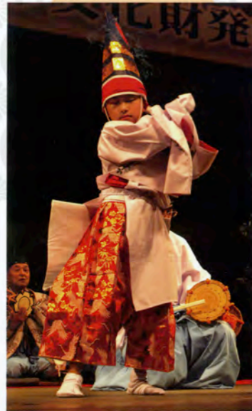
宇那手神楽「三番叟」