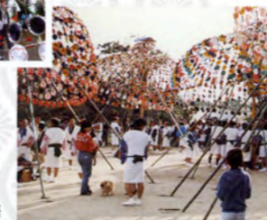
佐志武神社奉納神事舞

神事花は、芯となる柱に竹を枝垂れ桜のように垂らし、色とりどりの紙花をつけた花笠で、大きなものでは高さ5メートル、重さ200キログラムにもなります。