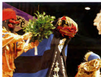
三谷神社投げ獅子舞