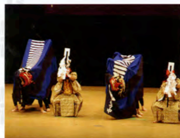
野尻大歳神社獅子舞