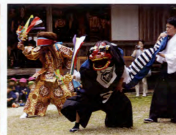
宇那手火守神社獅子舞