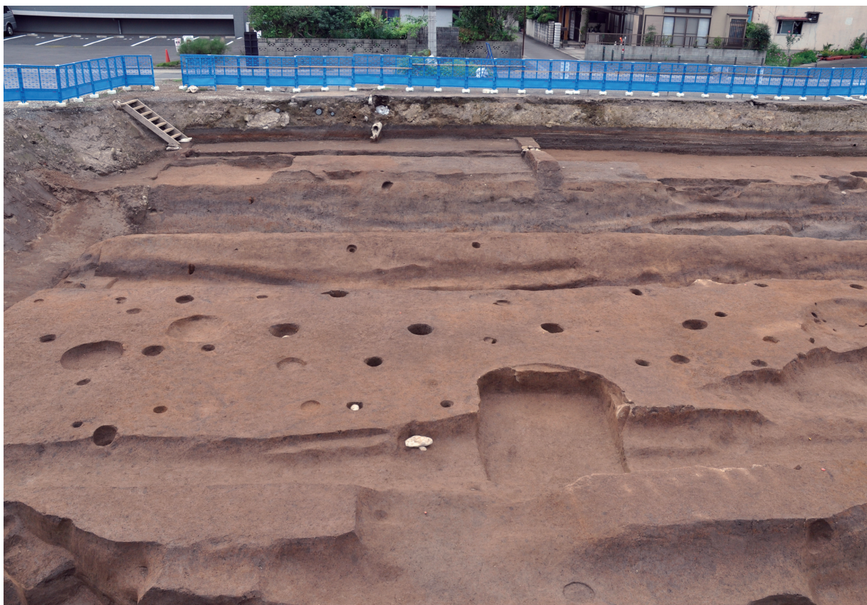
S453 (ほぼ中央で柱穴が南北に並ぶ：東から)