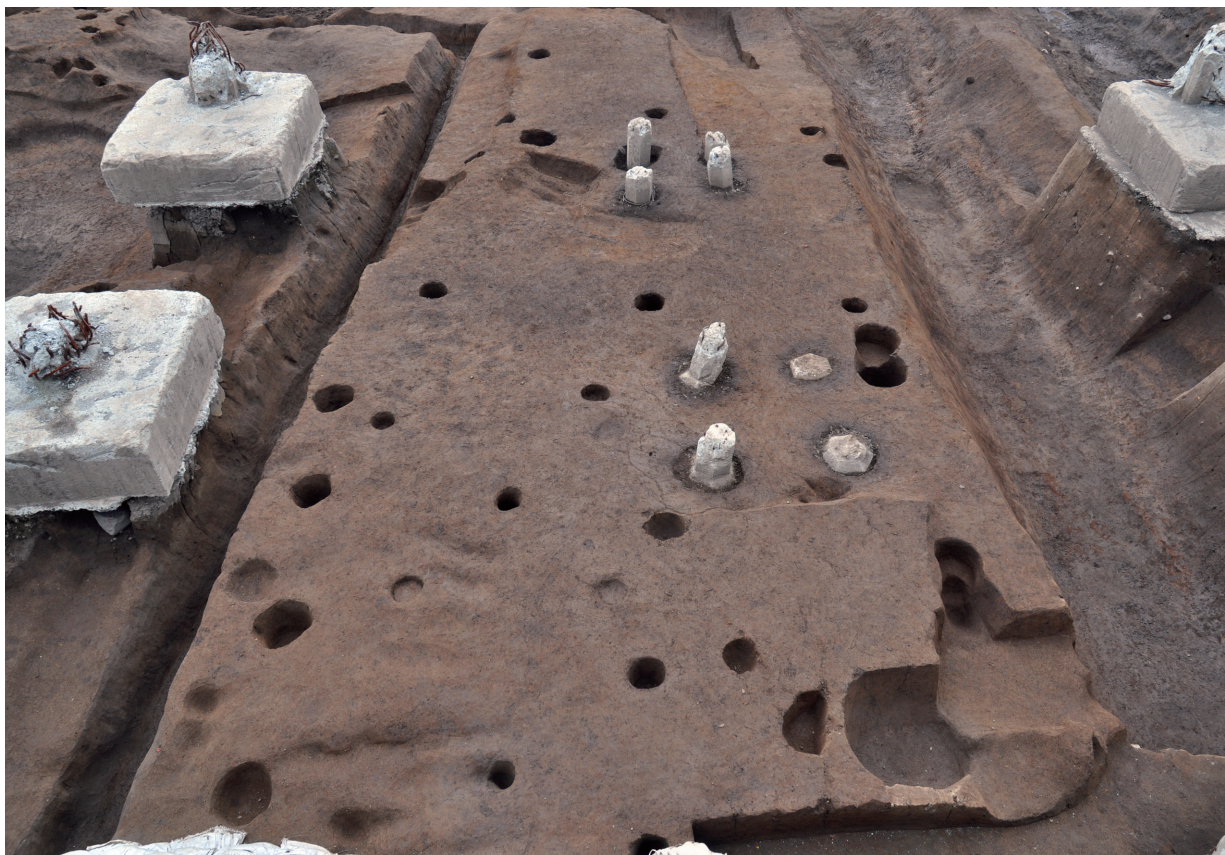
S452 (掘立柱建物：南から)