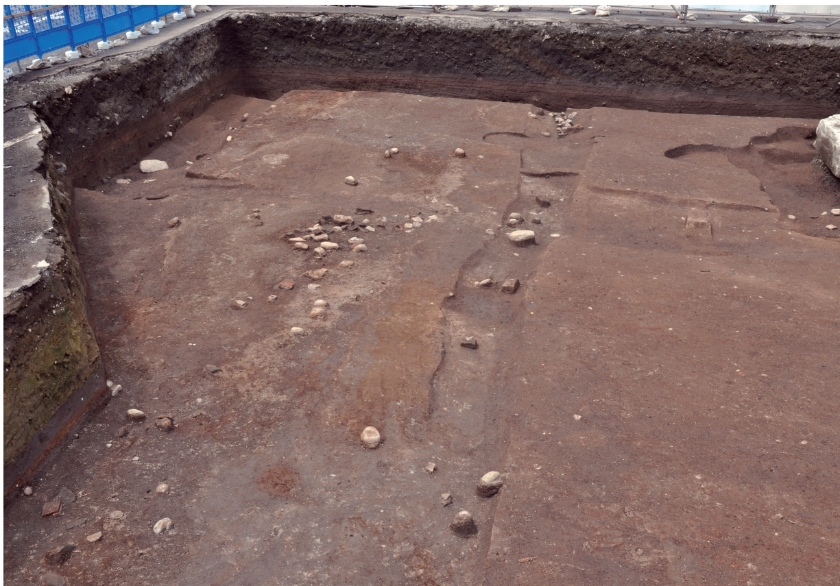
道路（最初の検出面：南から）