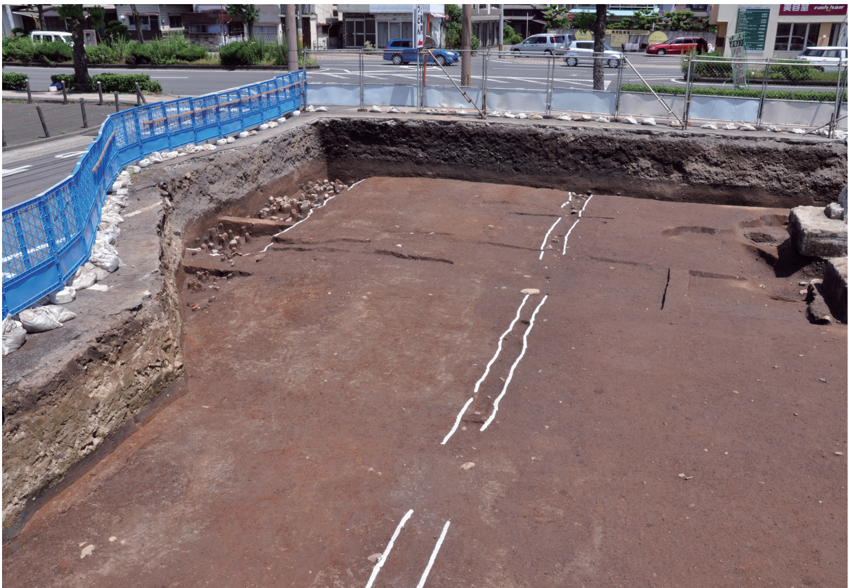
道路 (最初の検出面：南から)