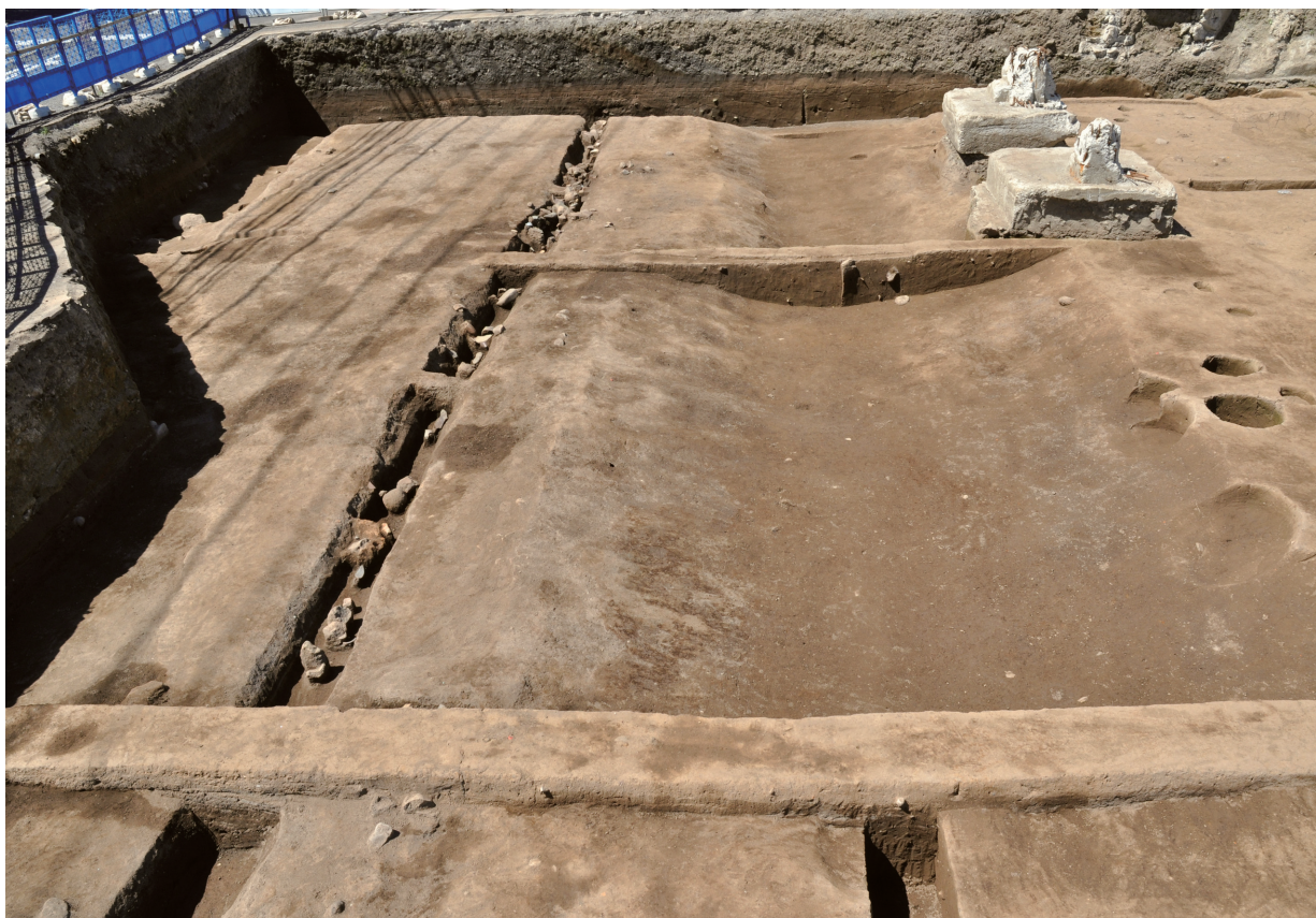
道路とSD120（天正14年の島津侵攻直前の状況）