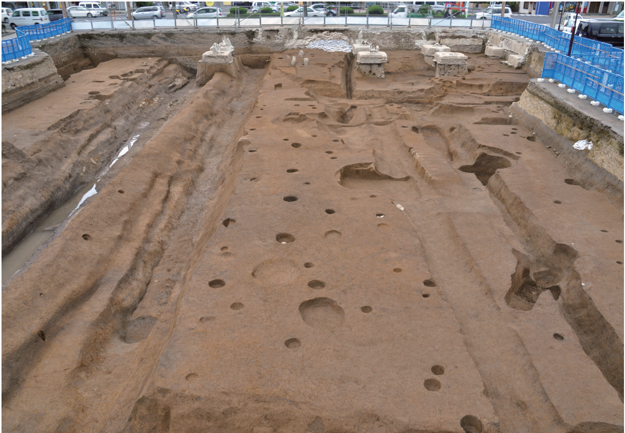
S453 (ほぼ中央で柱穴が南北に並ぶ：南から)