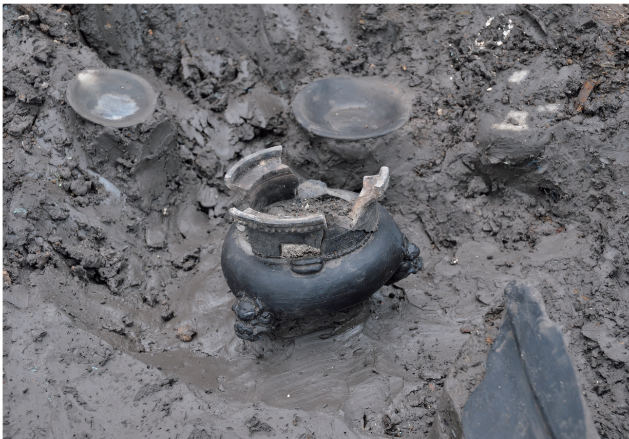
SD120 (瓦質火鉢1125出土状況)