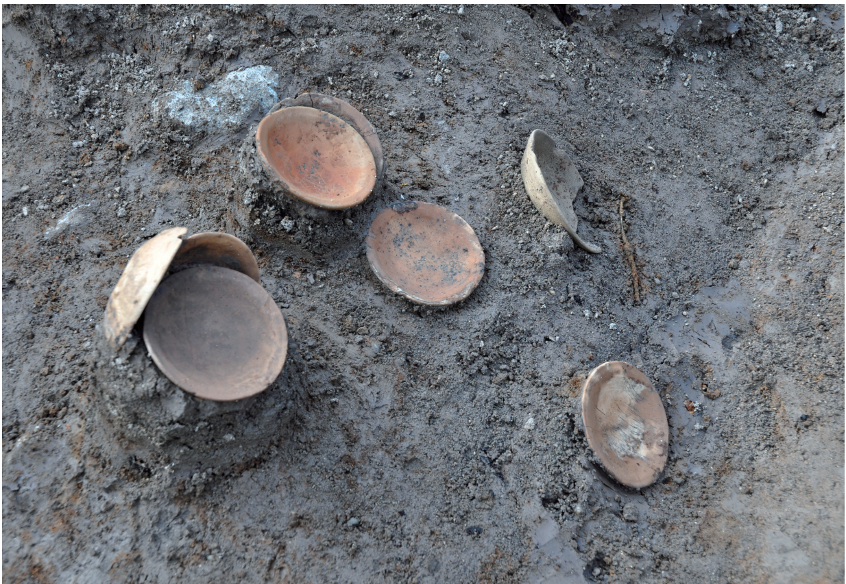
SD120 (京都系土師器出土状況)