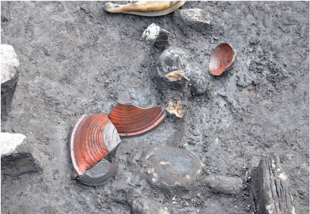
SD120 (備前播鉢出土状況)