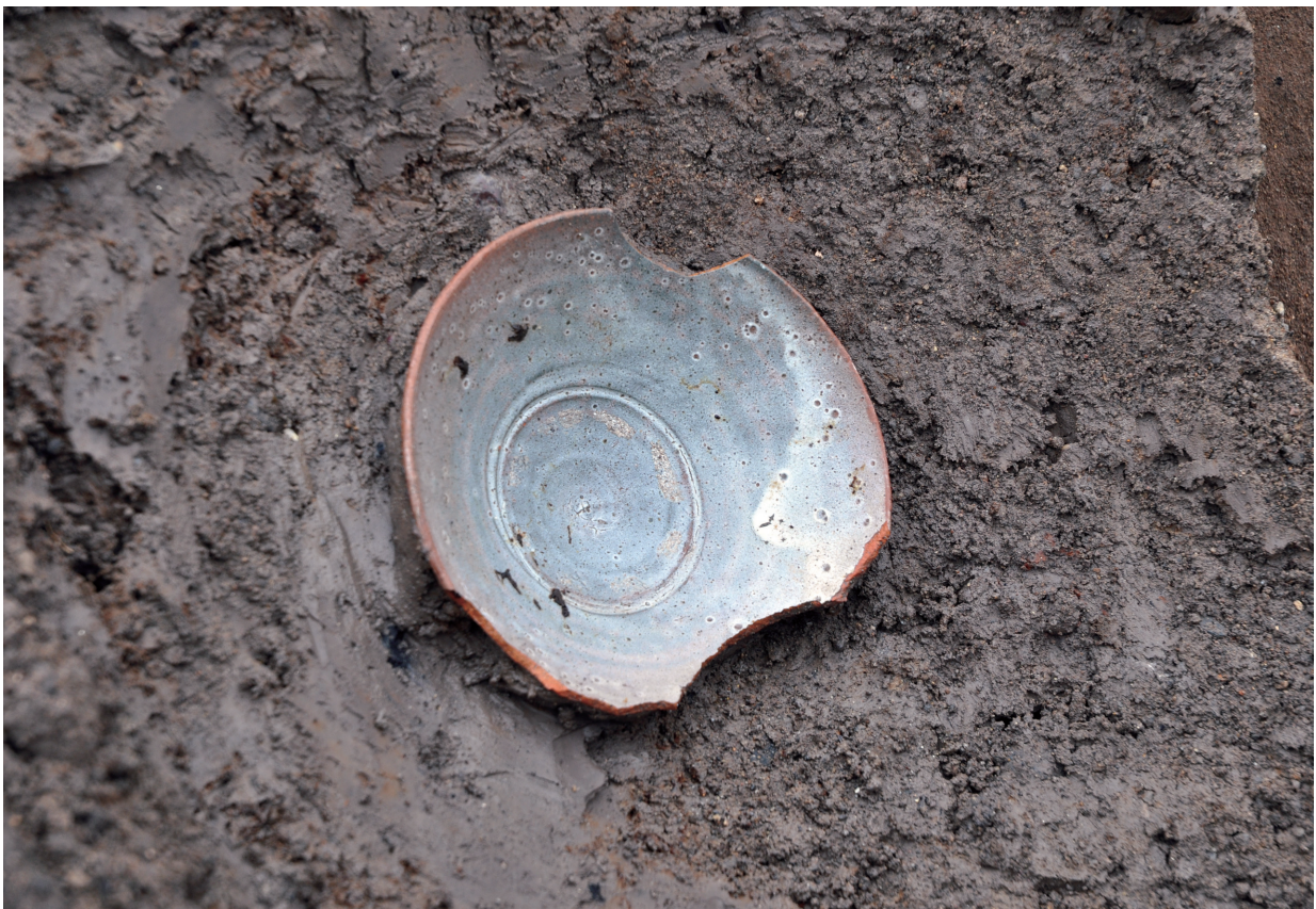
SD120 (朝鮮王朝産陶器碗982出土状況)