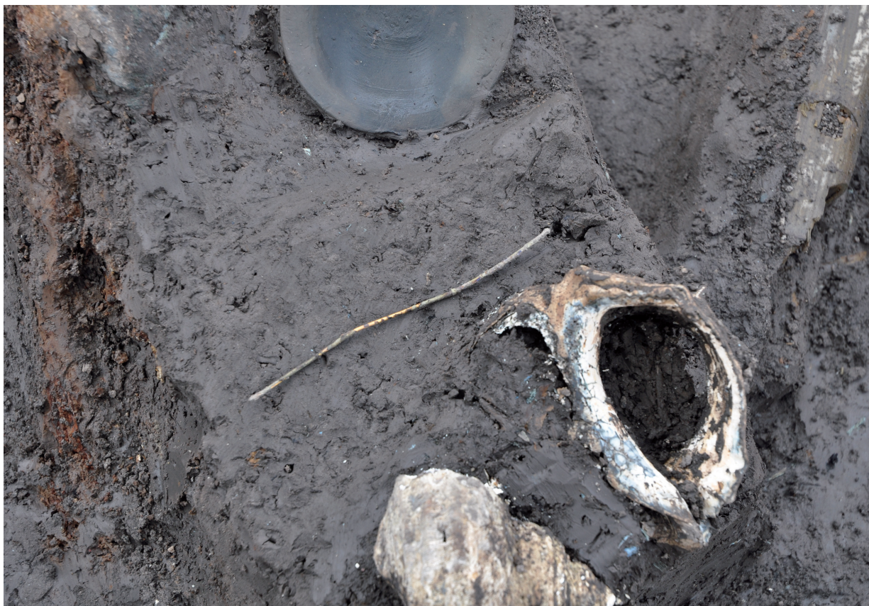
SD120 (針金状銅製品1634出土状況)