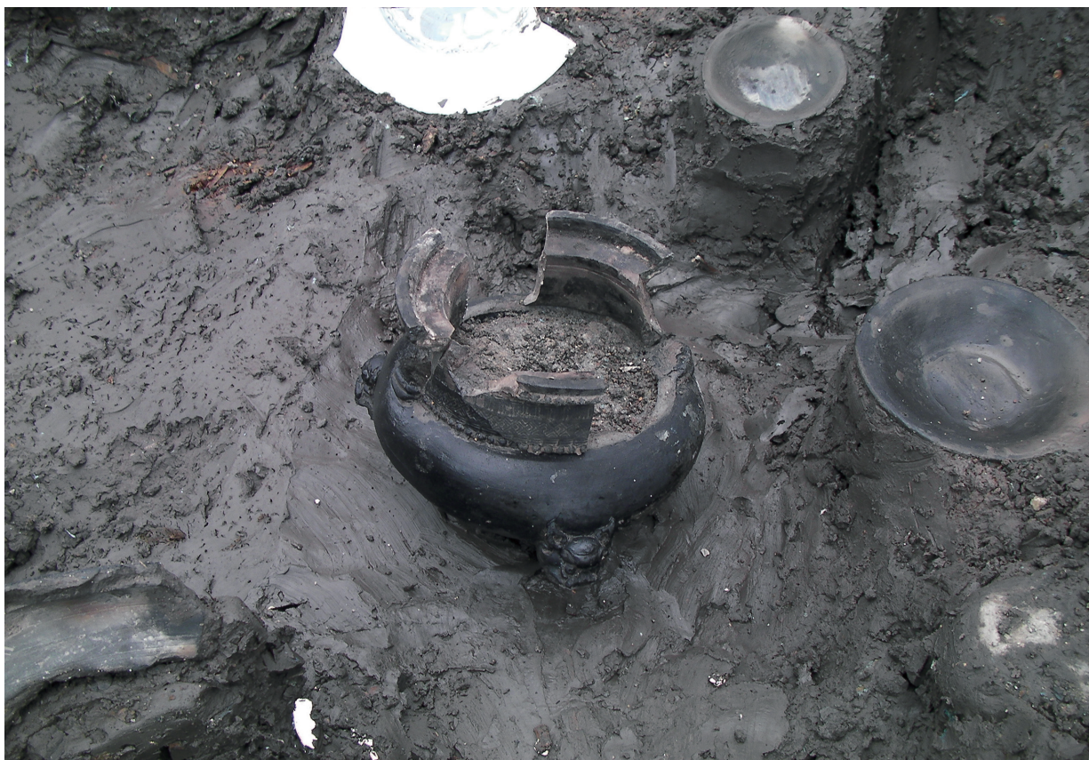
SD120 (瓦質火鉢1125出土状況、中に灰が詰まっている)