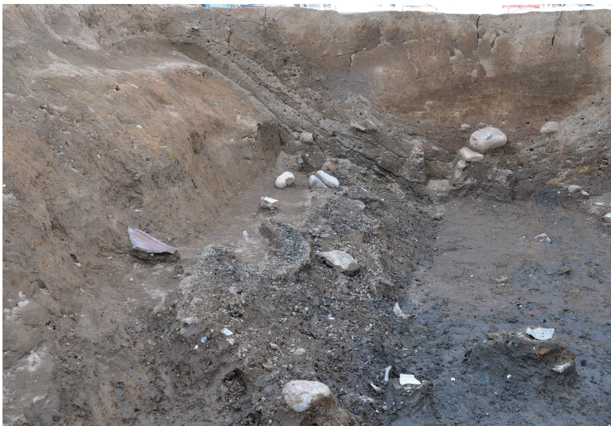
SD120 (銅滓を含む土の堆積状況)