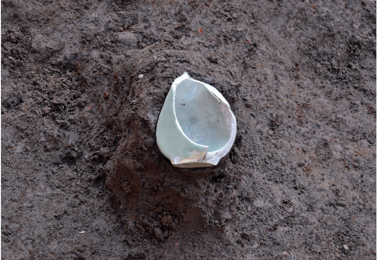
SD120 (青磁掛花入れ742出土状況)