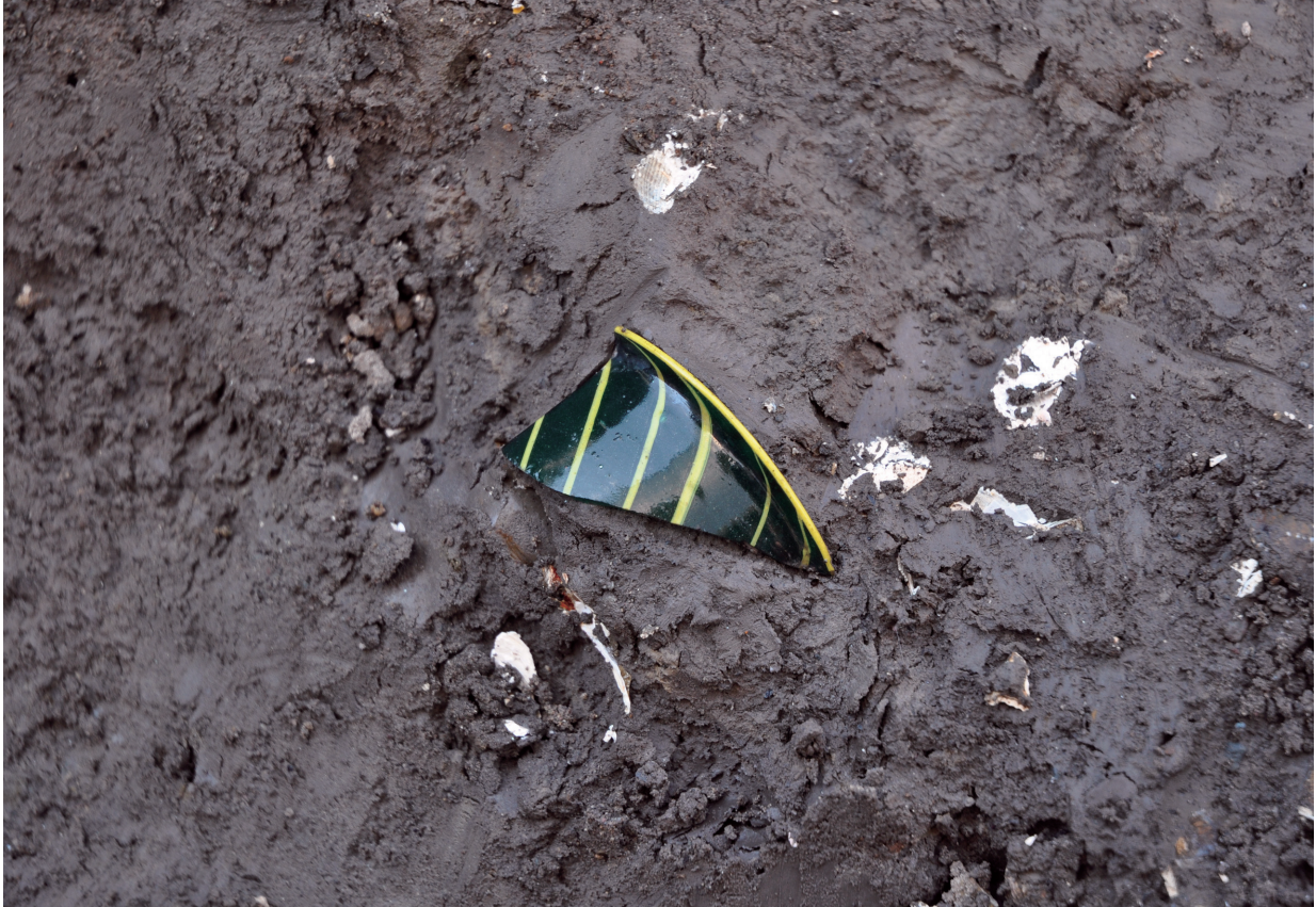
SD120 (ガラス器1614出土状況)