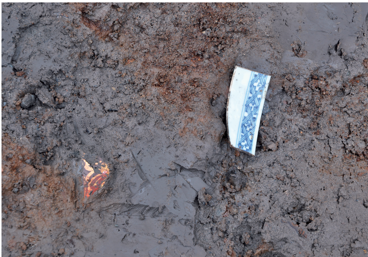
SD120 (五彩金襴手965出土状況、左側に剥がれた金と赤彩が見える)