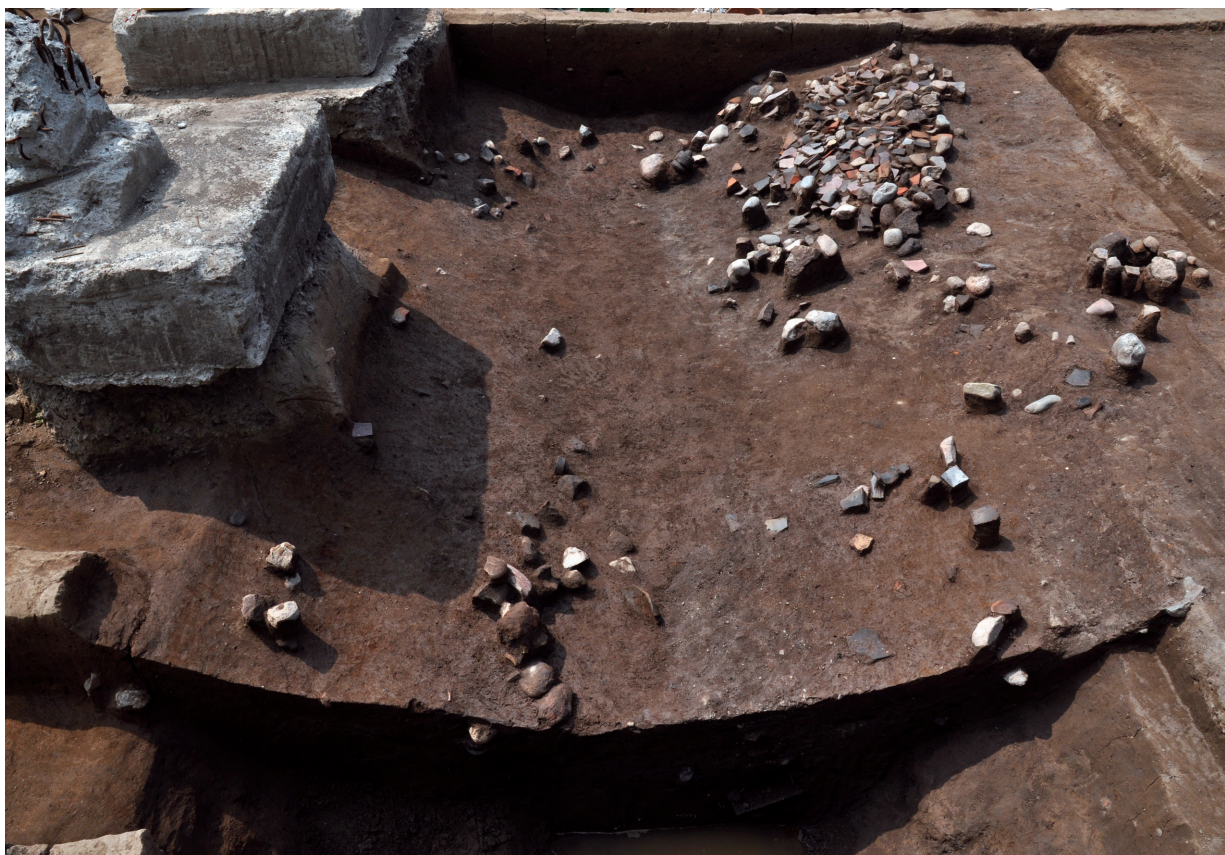
SD120 (遺物出土状況、西側から瓦が流れ込んでいる)