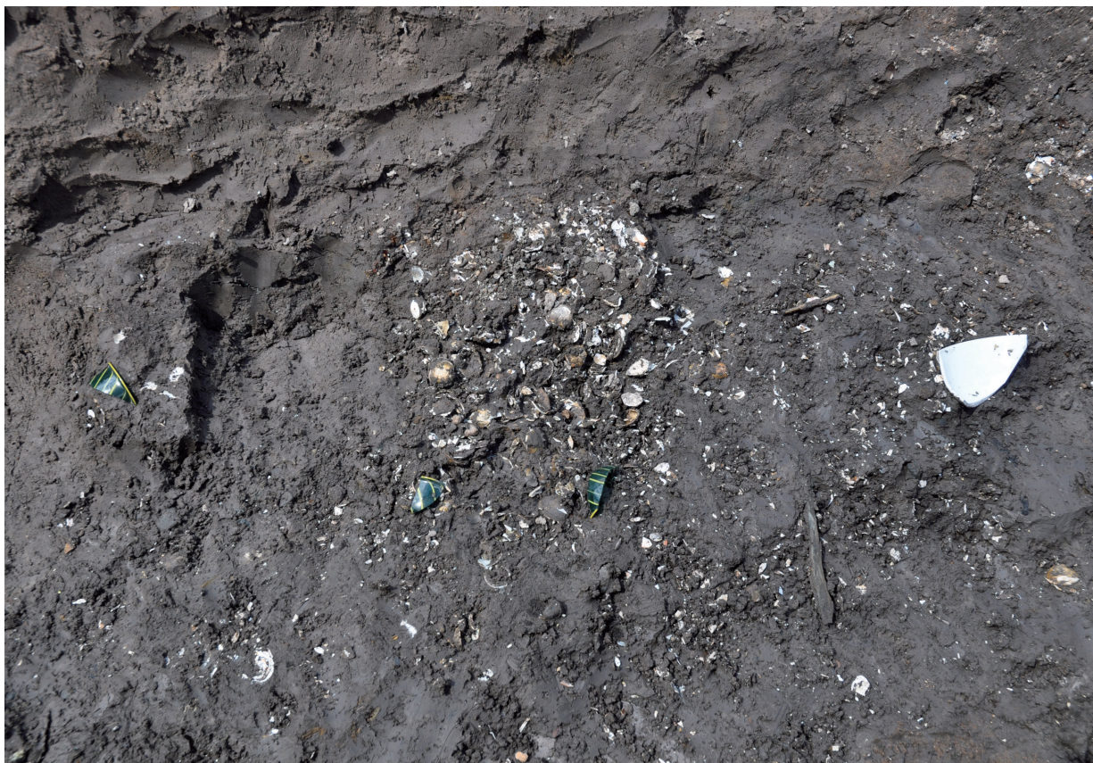
SD120 (ガラス器1614が貝層上で出土)