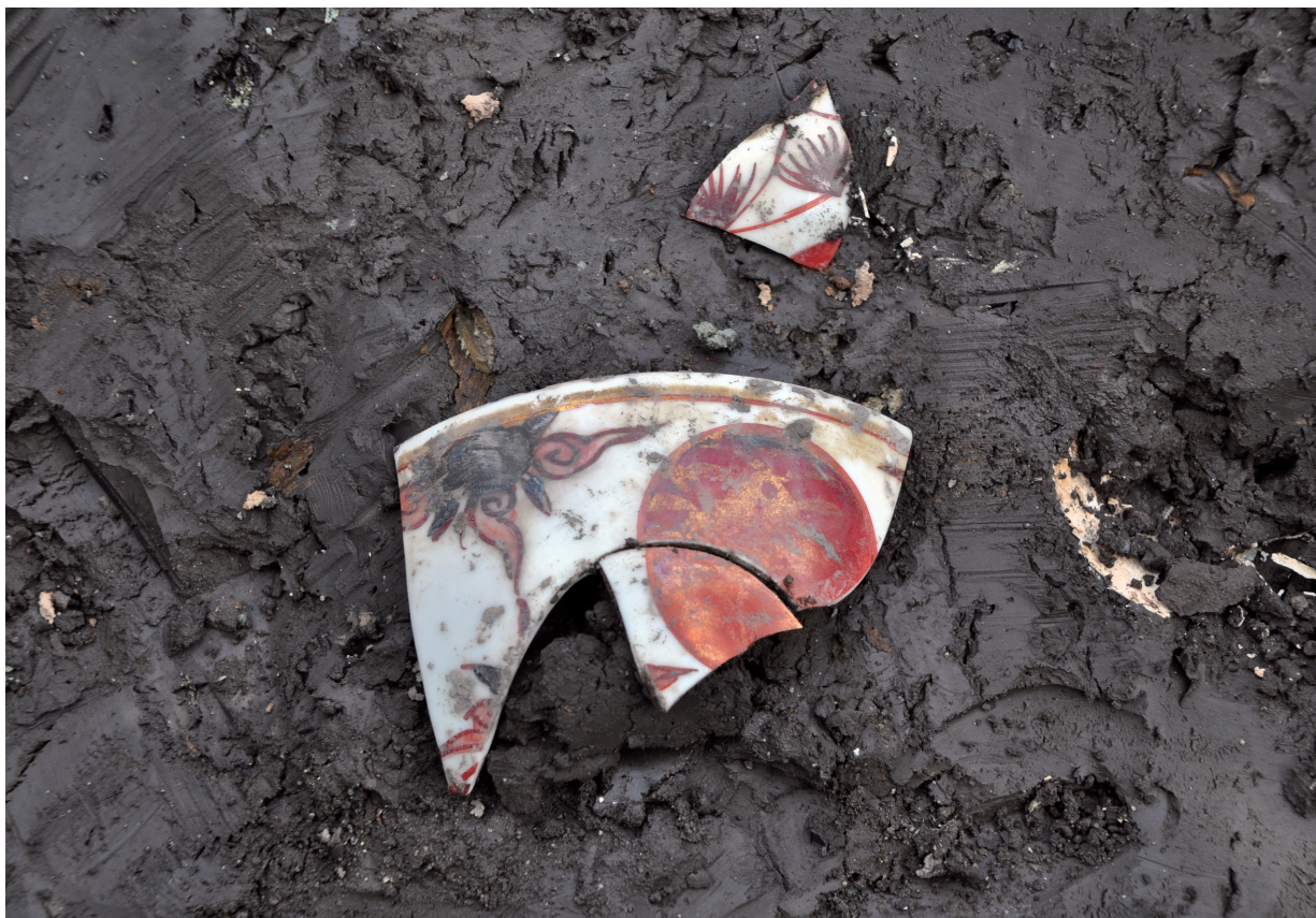
SD120 (五彩金襴手963出土状況)