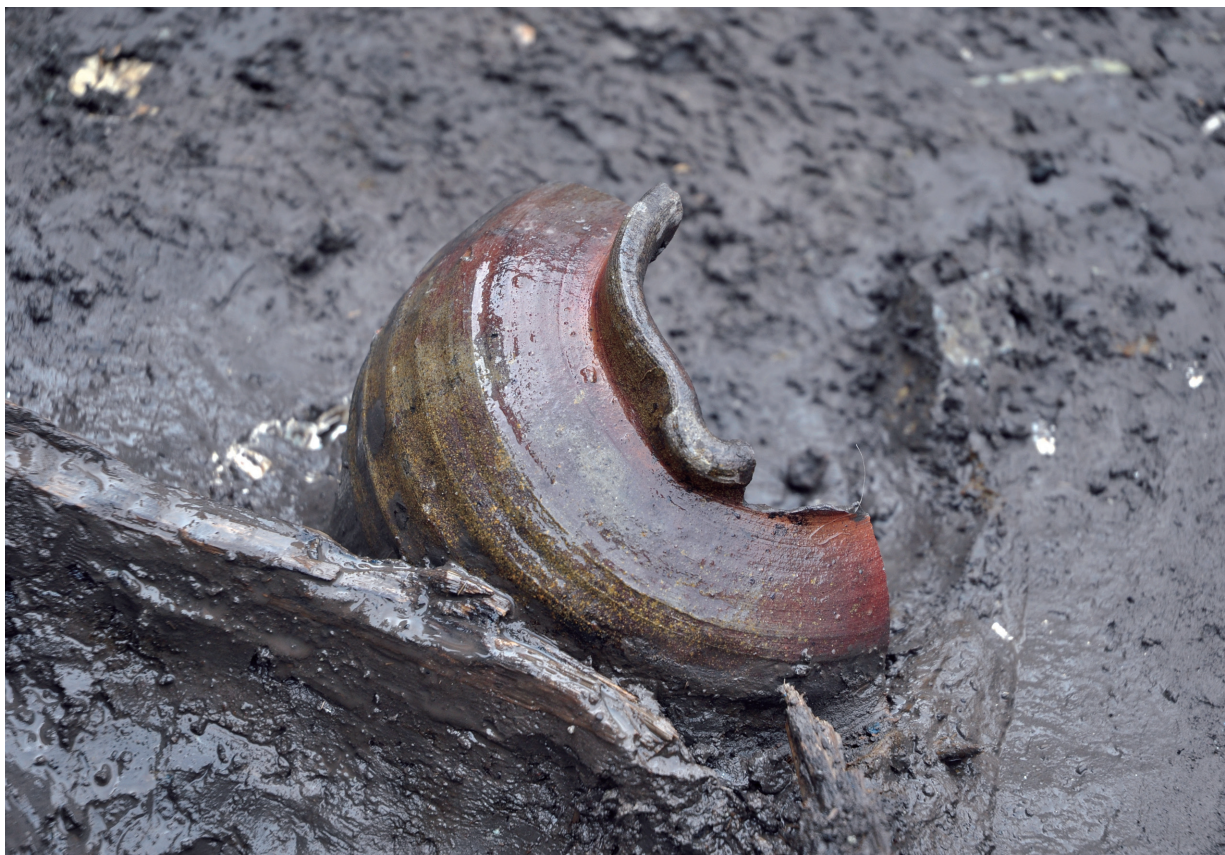
SD120 (備前短頸壺1059出土状況)