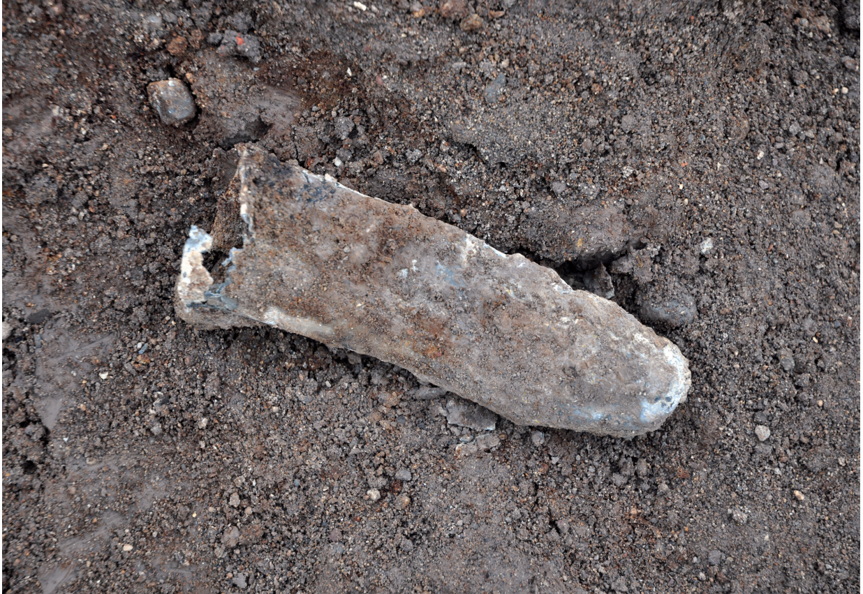
SD120 (不明金属器1639出土状況)