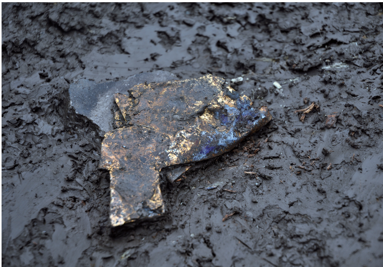
SD120 (不明金属製品1626出土状況)