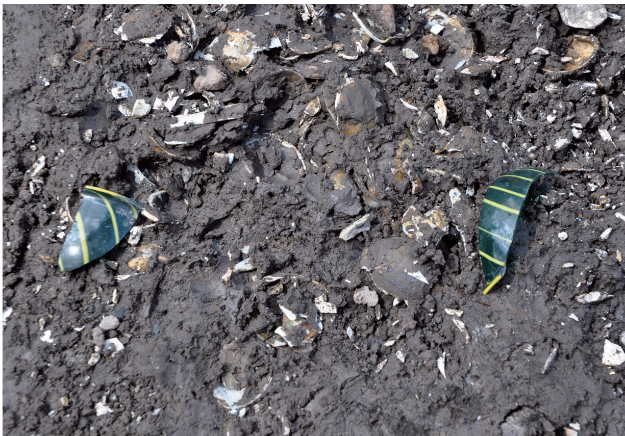
SD120 (ガラス器1614出土状況)