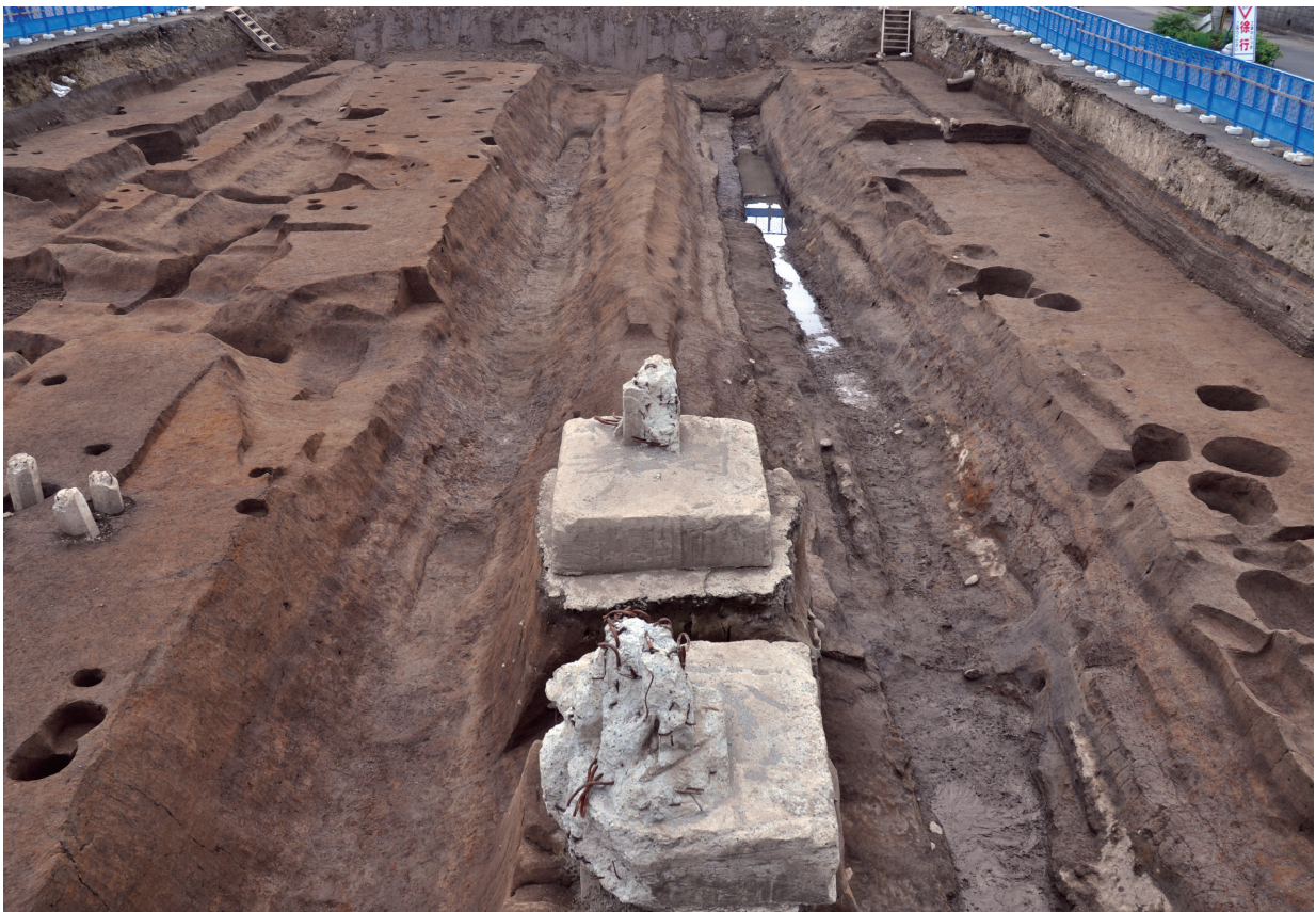
SD120 (完掘状況、左がSD120、右はSD160：南から)