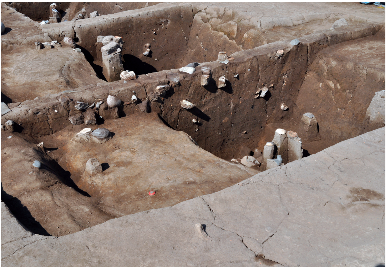
SK101 (土層断面、SD156との関係)