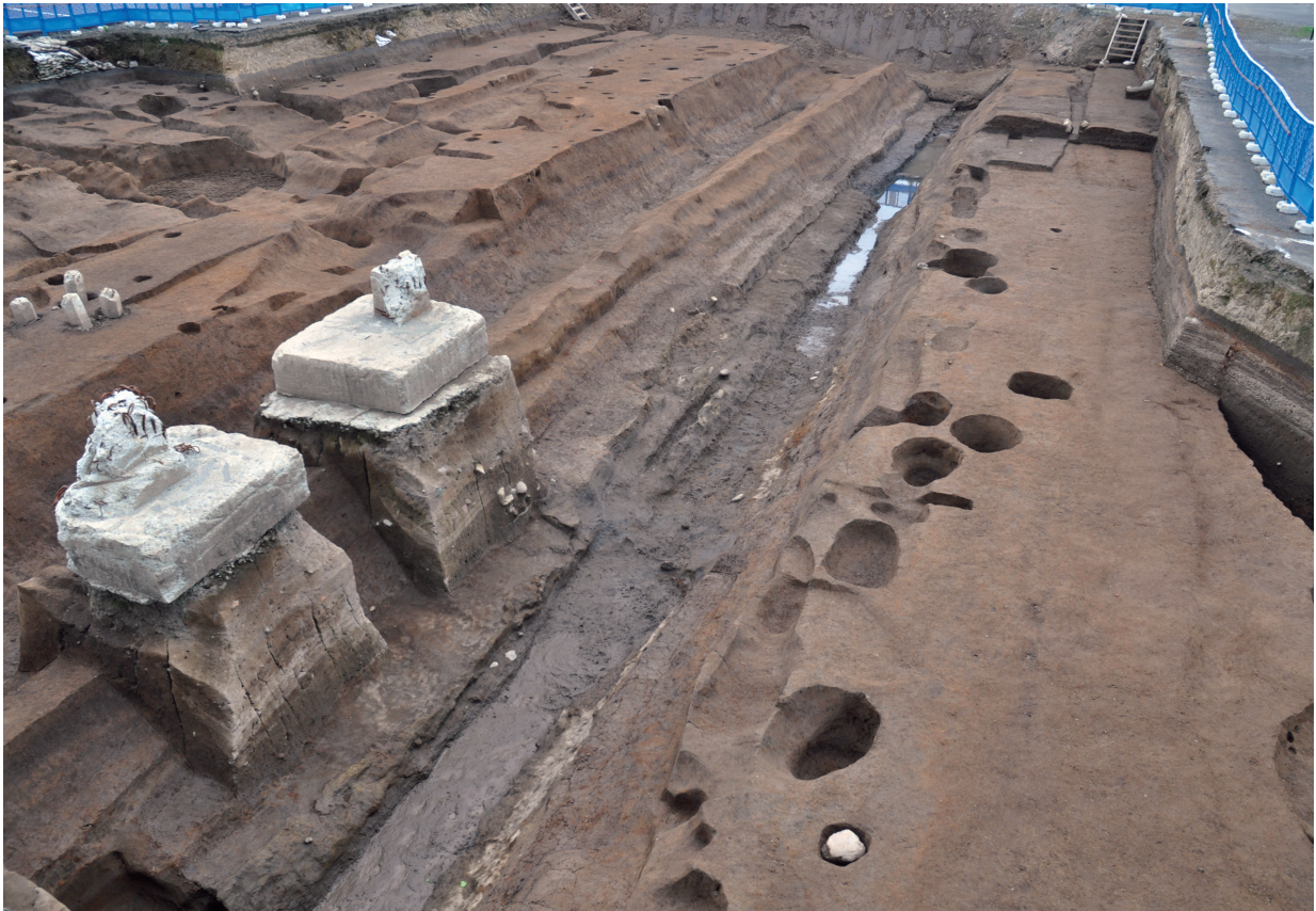
SD120 (完掘状況：北西から)