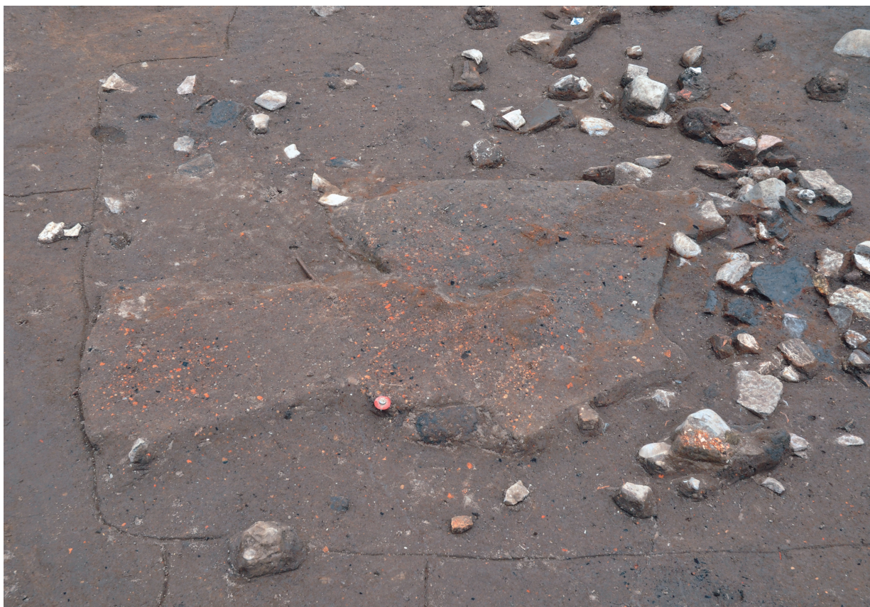
SK101 (上面の焼土の広がり)