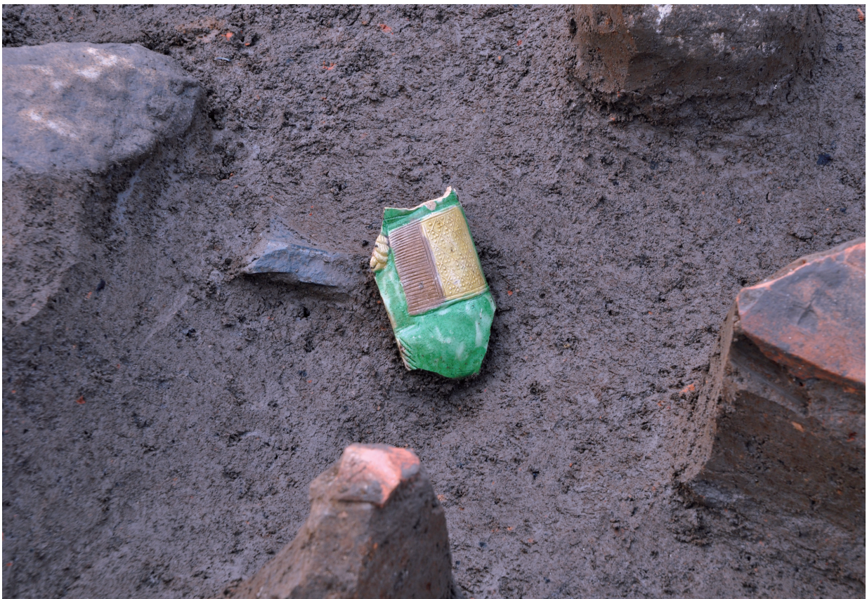
SE070 (華南三彩 (119) 出土状況)