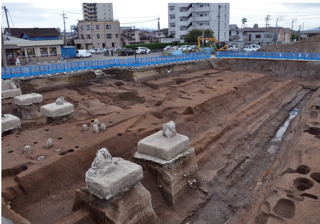
SD120 (完堀状況、手前がSD120：北西から)