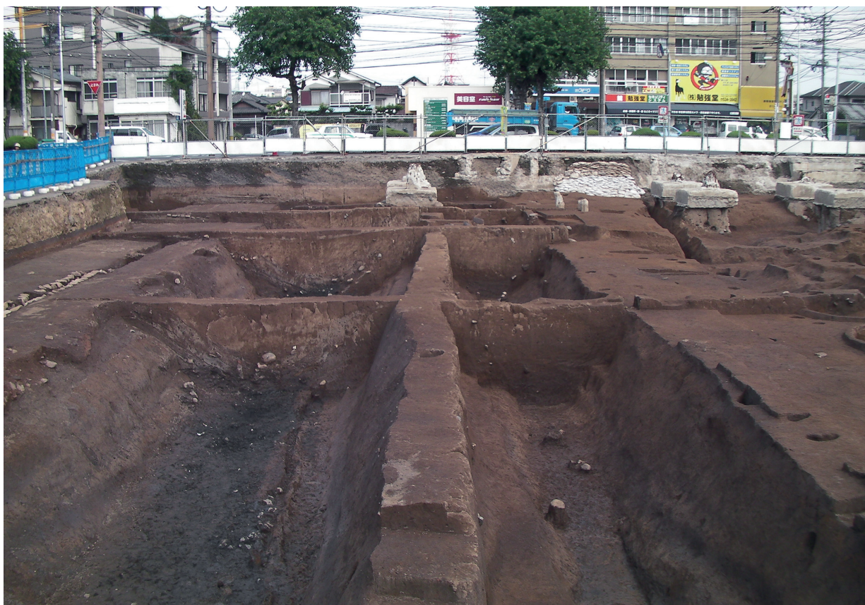
SD120 (完堀状況、右がSD120、左はSD160：北から)