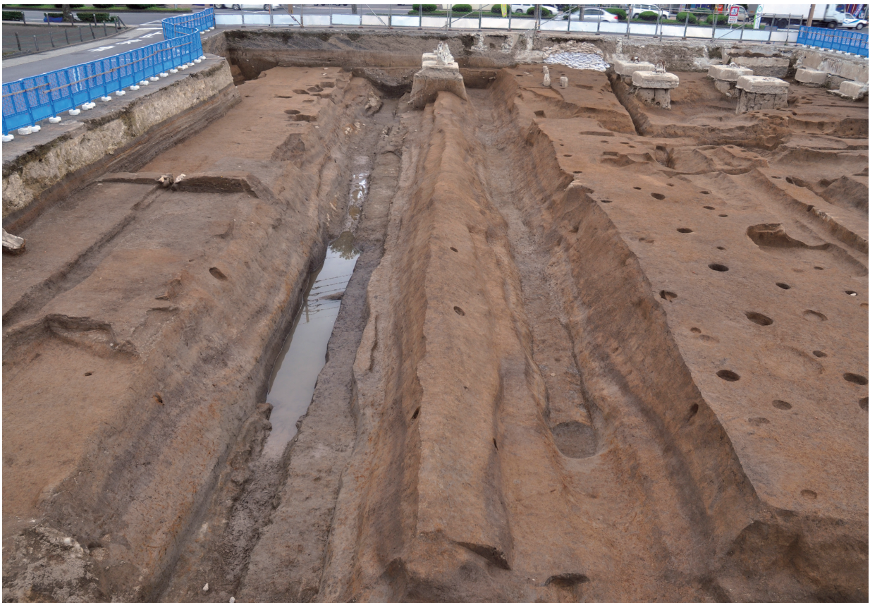
SD120 (完掘状況、左がSD120、右はSD160：南から)