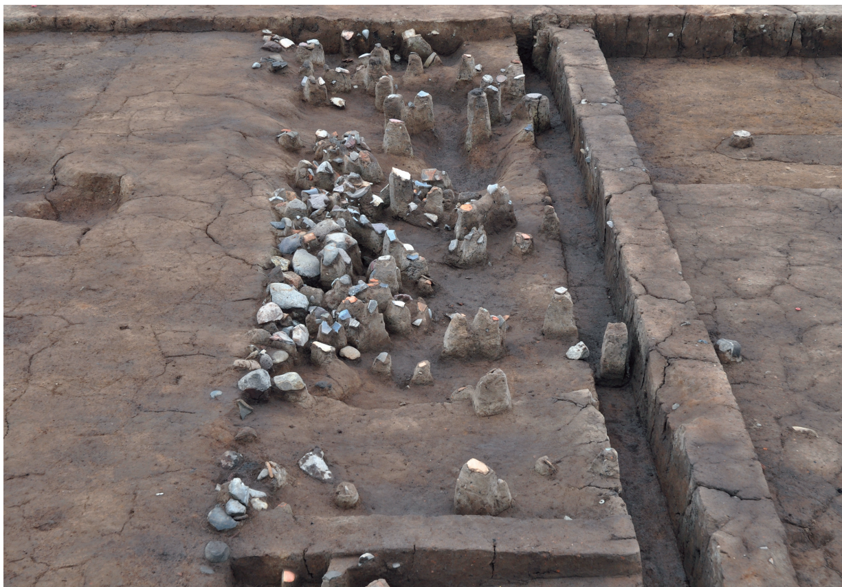
SD071 (遺物出土状況：南から)