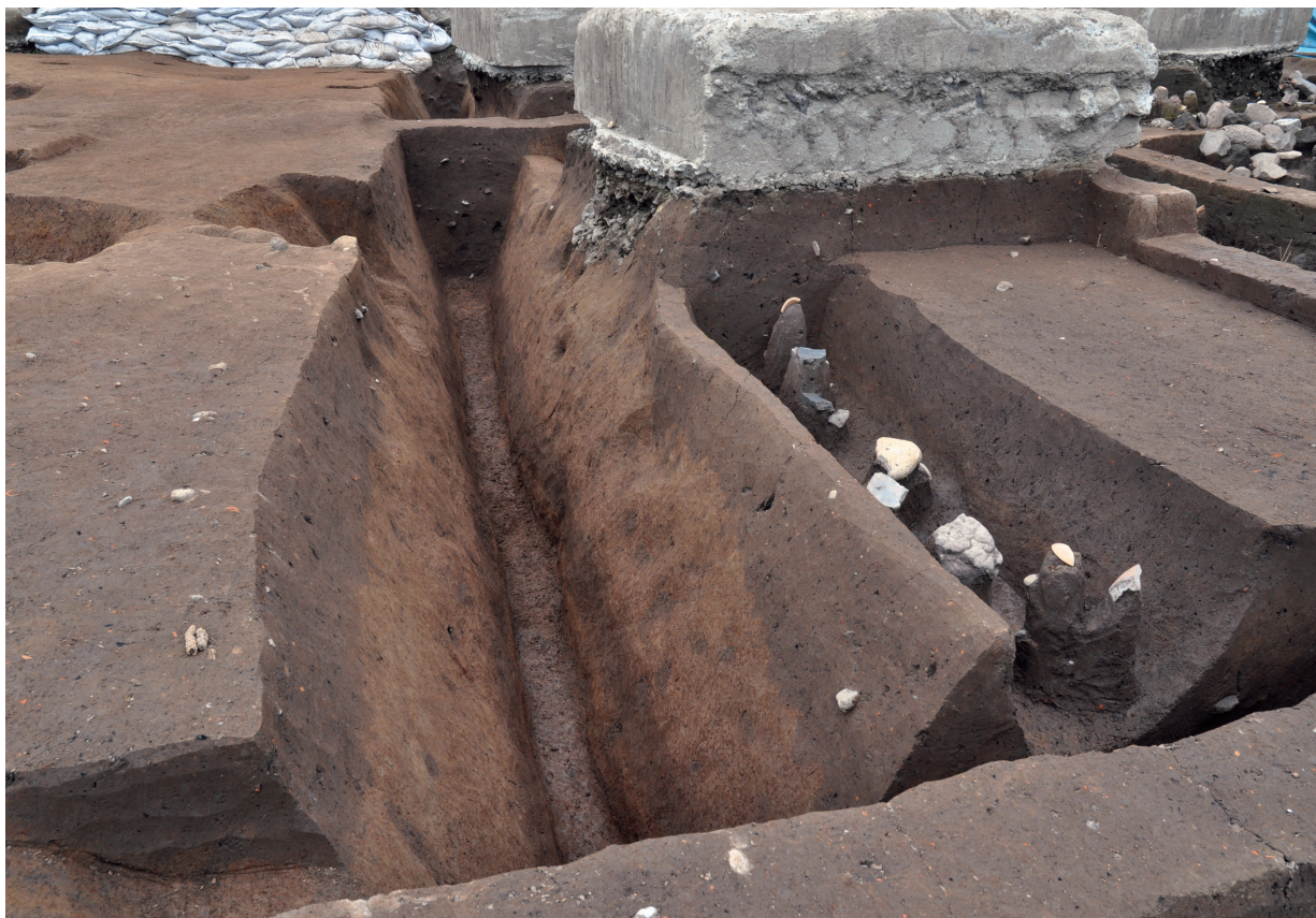
SD060A、B (完堀状況、左がSD060A：南から)