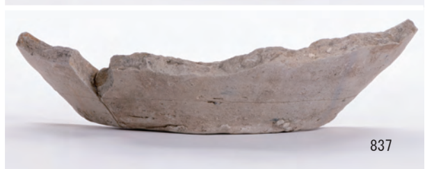
A 8区 河道S9 下層有機質層0~20cm