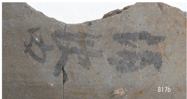
A 8 区 河道S9 下層有機質層0~20 cm