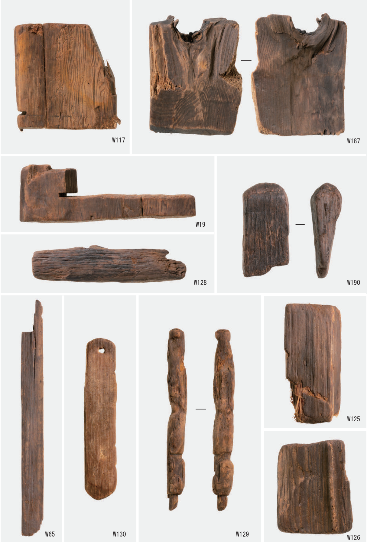
残材 (W19・W117・W187), 用途不明 (W65・W130・W125・W129・W126・W128・W190)