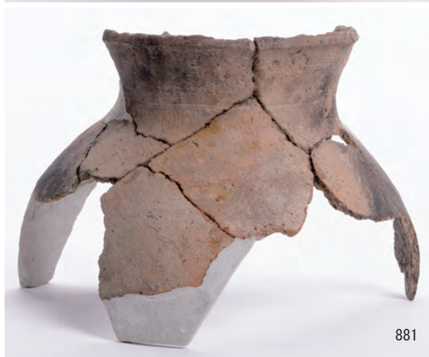
B区 河道S40 (895・907・910~912), 溝S46 (878・881)