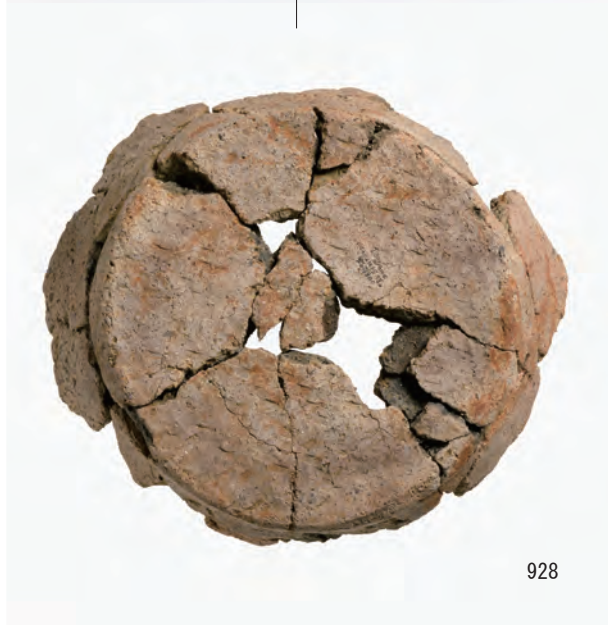
B区 土坑S36 (913・914), 河道S47 (926～928)