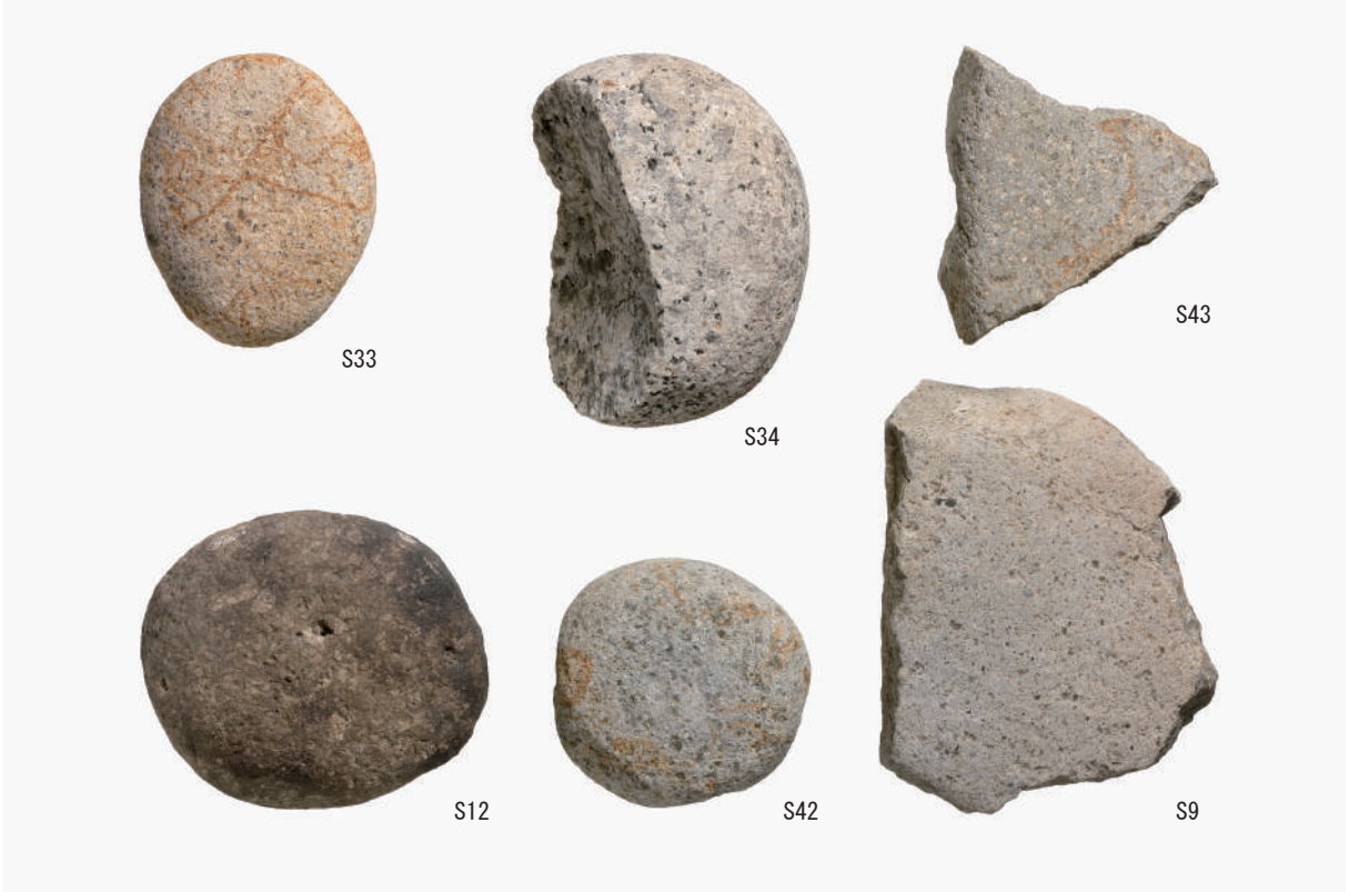
磨石・敲石 (S12・S33・S34・S42), 砥石 (S9・S43)