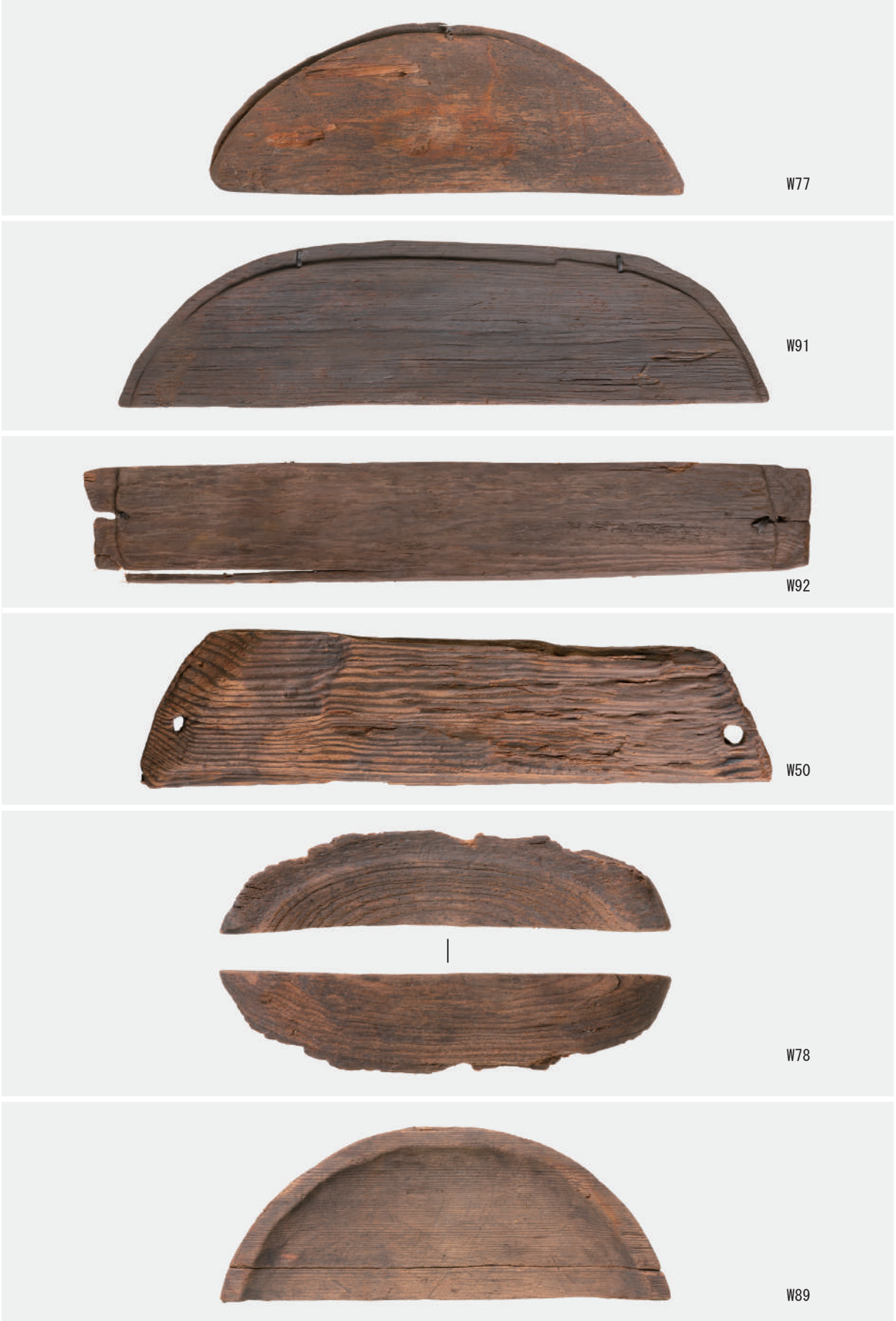
曲物底板 (W77・W91・W92), 容器蓋 (W50・W78), 皿 (W89)