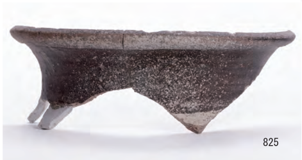
A 8 区 河道S9 下層有機質層0~20cm