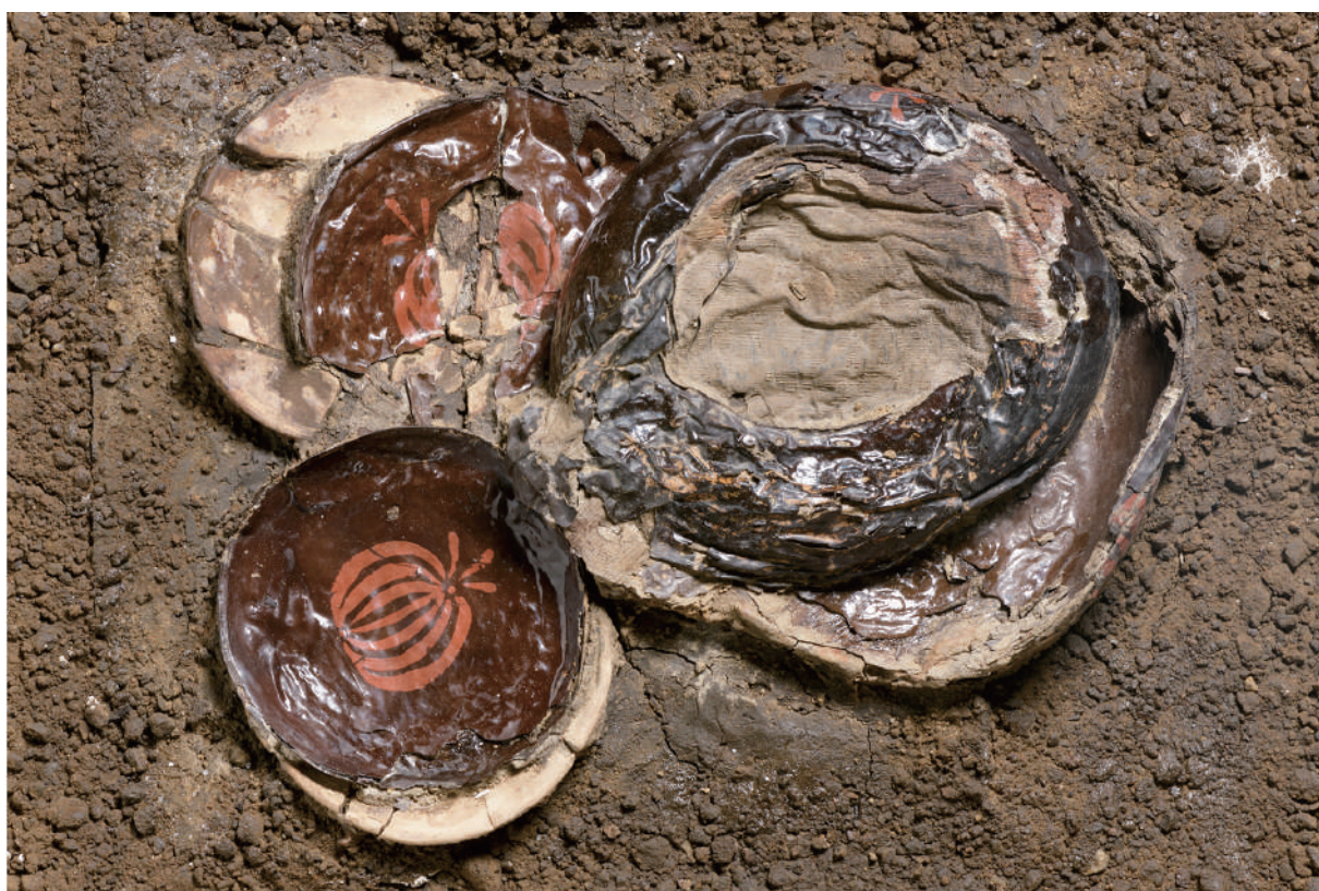
漆器 (W196 ~ W199), 土器 (992・993)