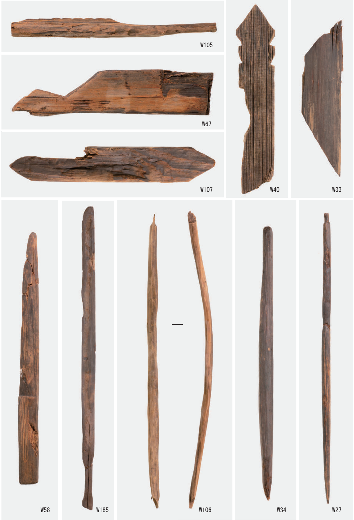
ささら (W105), 鳥形 (W67), 舟形 (W107), 刀形 (W58・W185), 弓形 (W106), 斎串 (W40・W33), 串 (W27・W34)