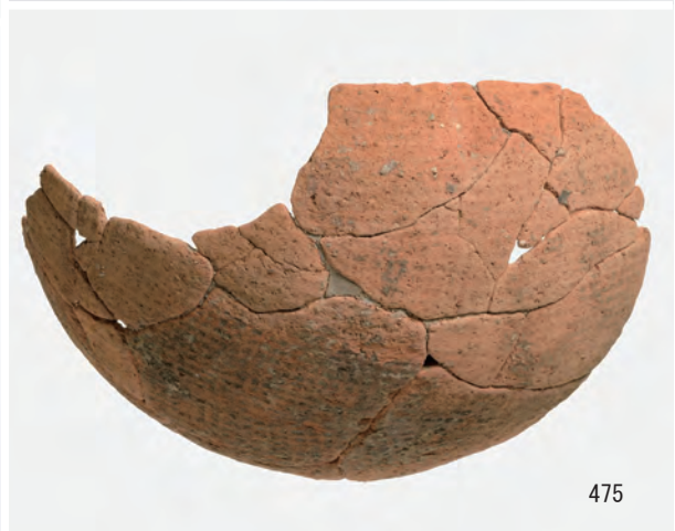
A 3区 竪穴建物S200 (451・452・456), S1 (469~471), S5 (474・475)