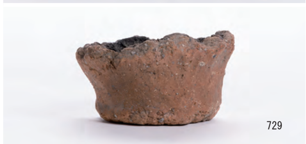
A 8区 河道S9 中層砂層 (697・699・702・707・709・710・712・714・717・716・720), 下層有機質層0~20cm (729)