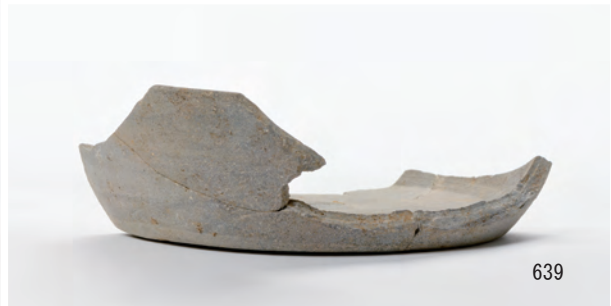
A 5区 溝S145 (610・625・626), 土坑S359 (630・632・634・635・637・639)