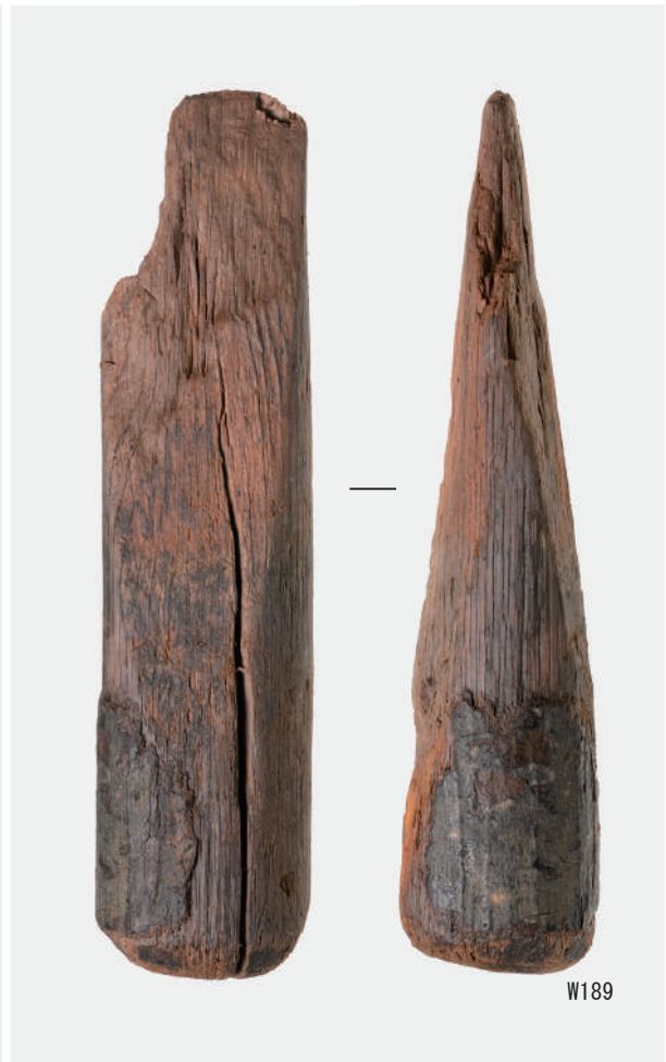
横槌 (W81・W135), 豎杵 (W82・W83・W189)