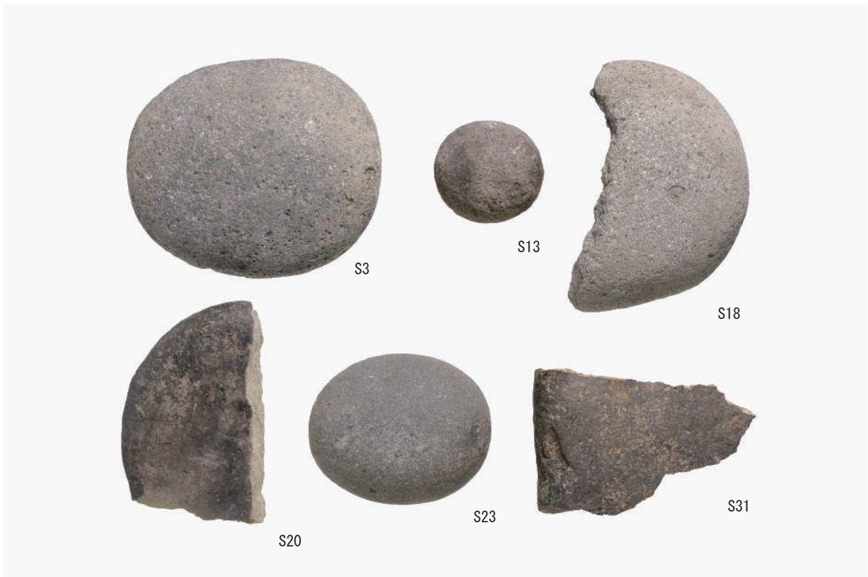
磨石・敲石 (S3・S13・S18・S20・S23), 砥石 (S31)