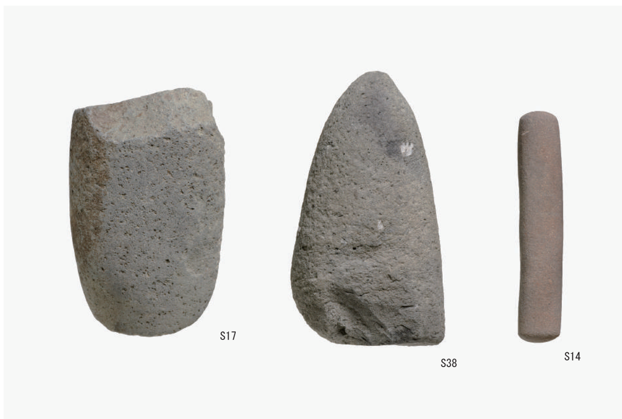
磨製石斧（S17・S38），棒状石製品（S14）