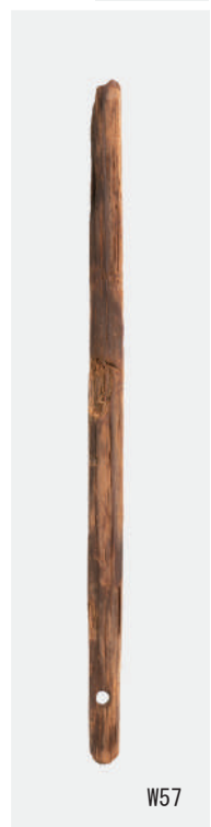
下駄 (W102), 櫛 (W26), 丸木弓 (W110・W170・W188), 壺鐙 (W141), 扇骨 (W57)