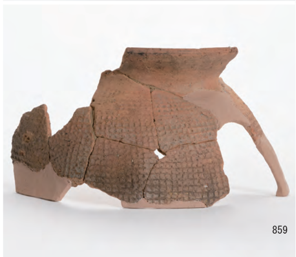
A 8 区 河道S9 下層有機質層20～40 cm (847・849～851), 40～60 cm (857～860)