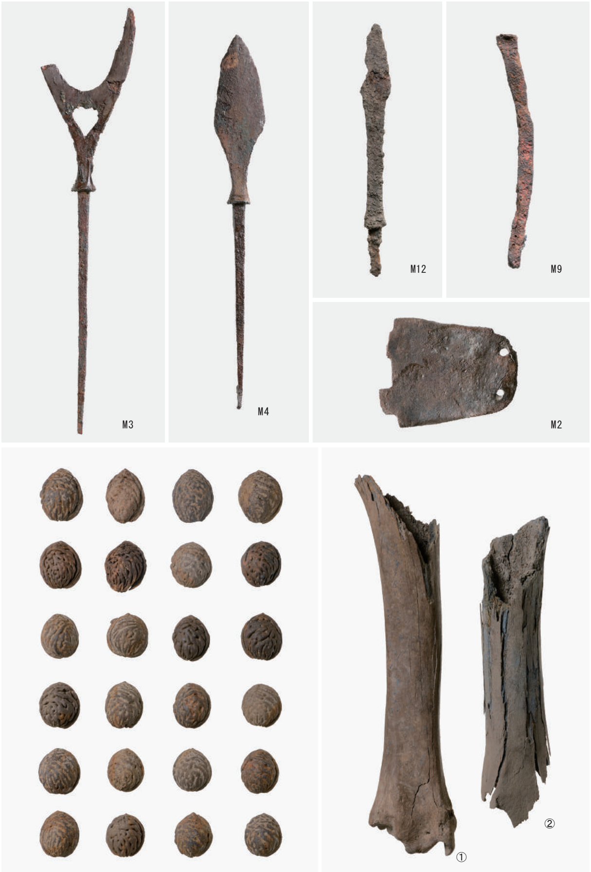
鍬 (M3・M4・M12), 釘 (M9), 鉸具 (M2), モモ核 (下段左), ウシ脛骨 (下段右)