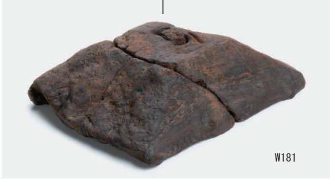
錘 (W25・W66・W84・W85・W136・W137・W168), 軸受台 (W88・W181)