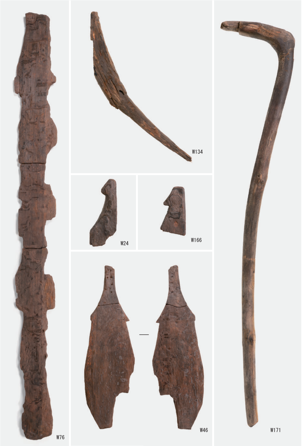
鋤未製品 (W76), 曲柄鋤 (W24・W166・W46), 鋤曲柄 (W134), 斧柄 (W171)