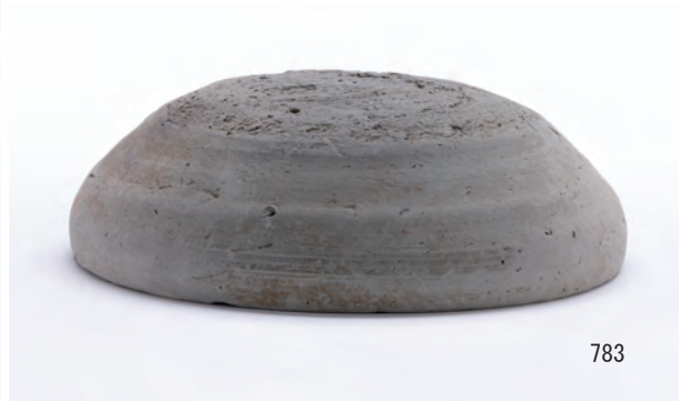
A 8区 河道S9 下層有機質層0~20cm