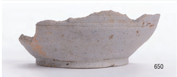
A 5区 土坑S359 (638), 小穴S118 (641)、A 7区 溝S378 (647), S367 (654・649~651)