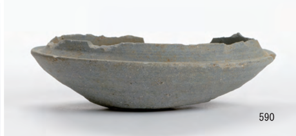
A 5 区 豎穴建物S279 (570), 溝S145 (578・579・582・585~589・590・604・615)