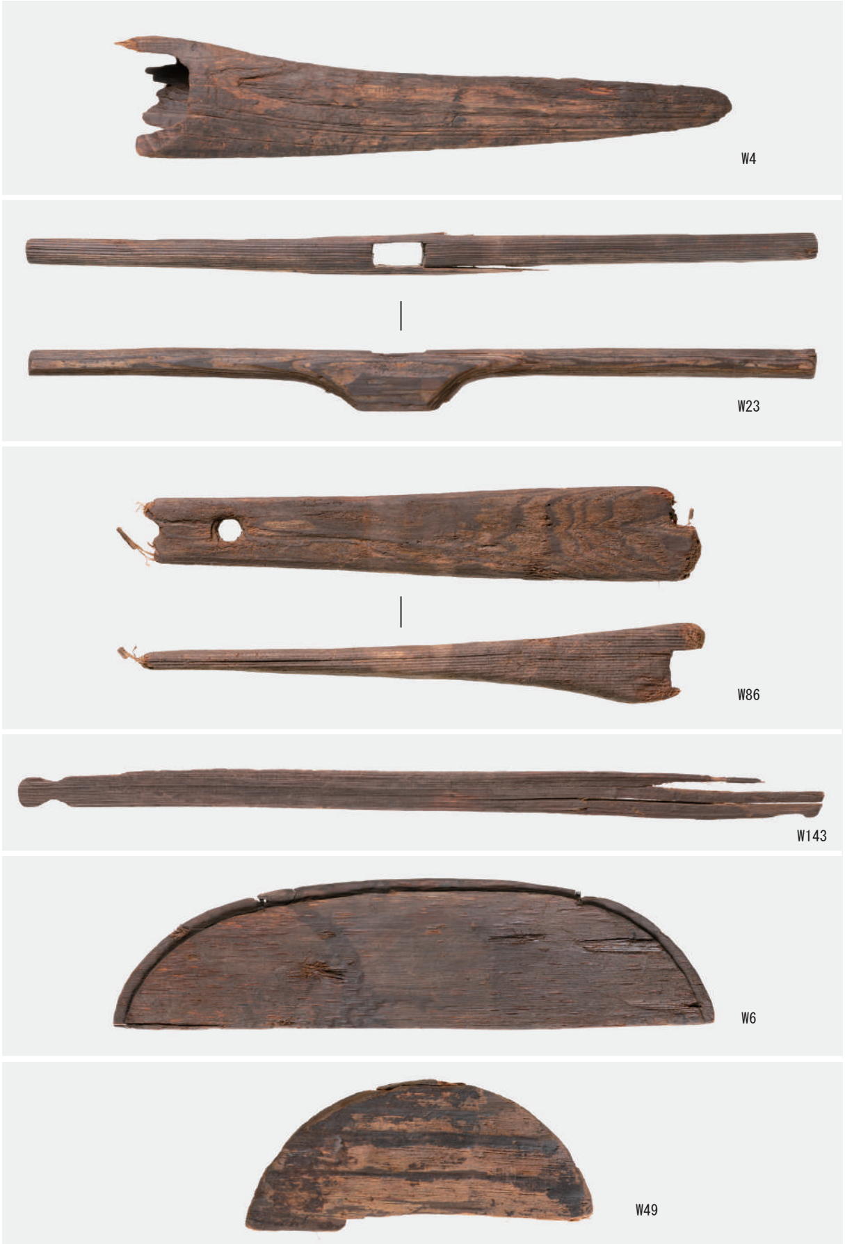
棒 (W23・W86), 桴 (W4), 布卷具 (W143), 曲物底板 (W6・W49)