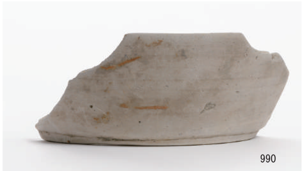
C区 河道S270 (963~968), S271 (971·973·975·976·987·989·990)