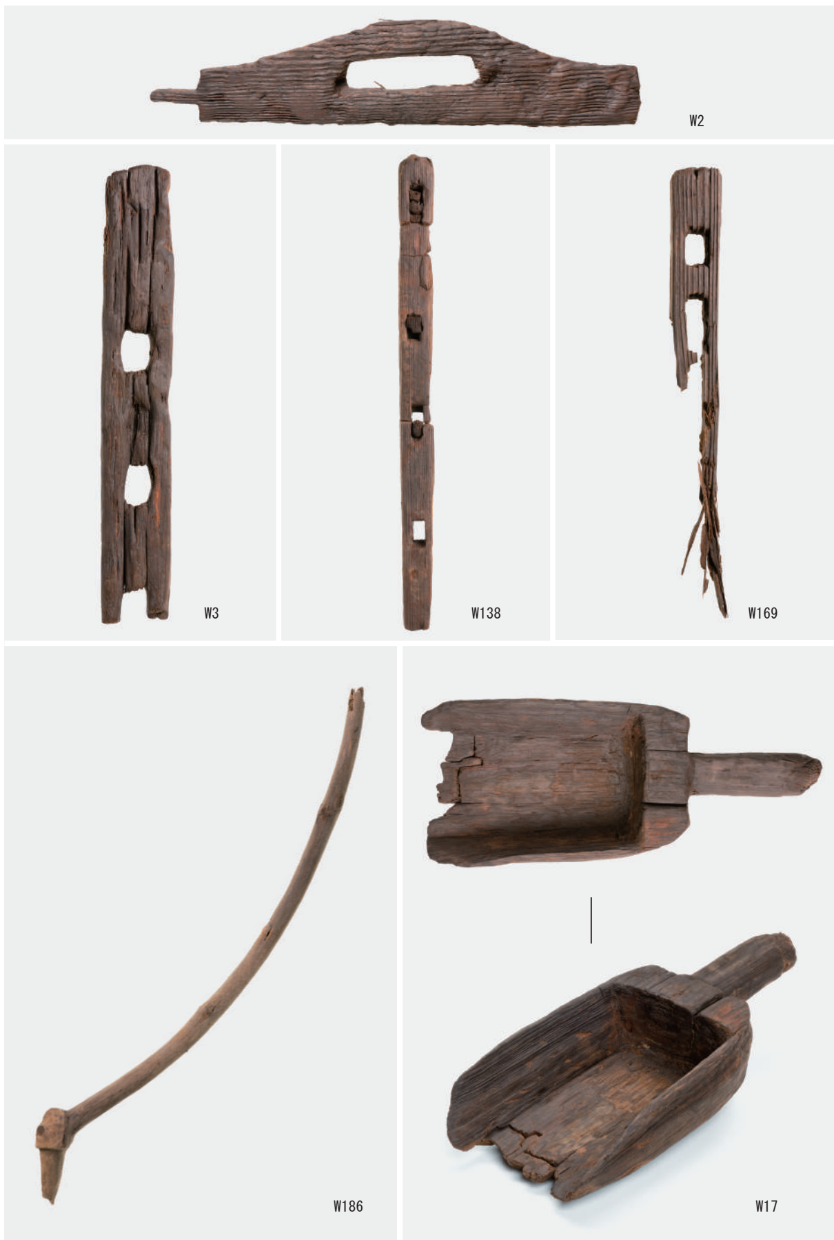
杵型田下駄 (W2・W3・W138・W169), タモ杵 (W186), アカスクイ (W17)