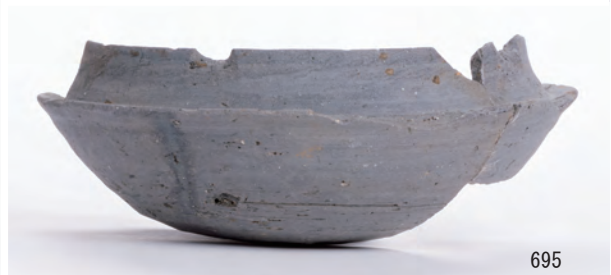
A 7区 土坑S397 (658・660), S409 (661)、A 8区 河道S9 上層粘土層 (691), 中層砂層 (692~695・698)