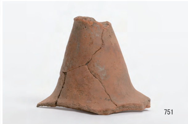
A 8区 河道S9 下層有機質層0~20cm