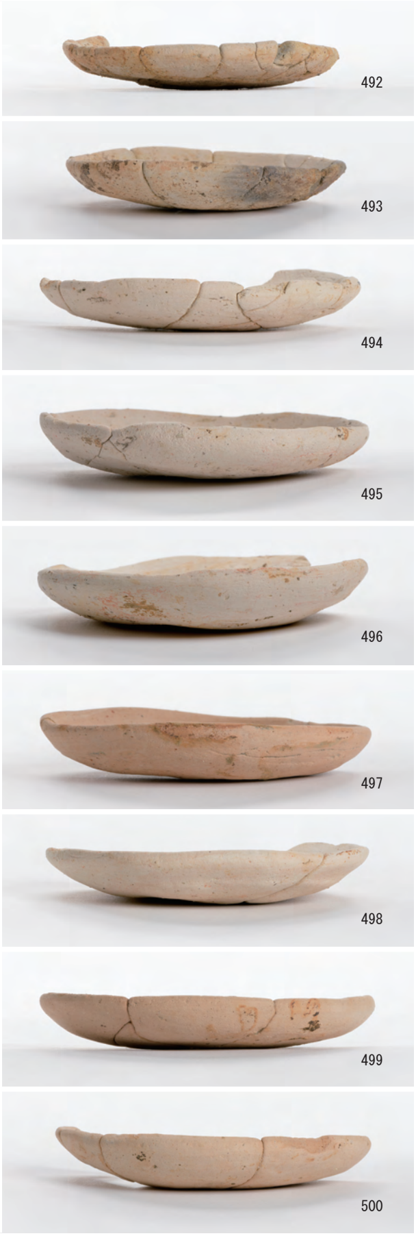
A 3区 土坑S319 (518・519), 小穴S9 (525・526・528・529), 溝S3 (492~500・510)