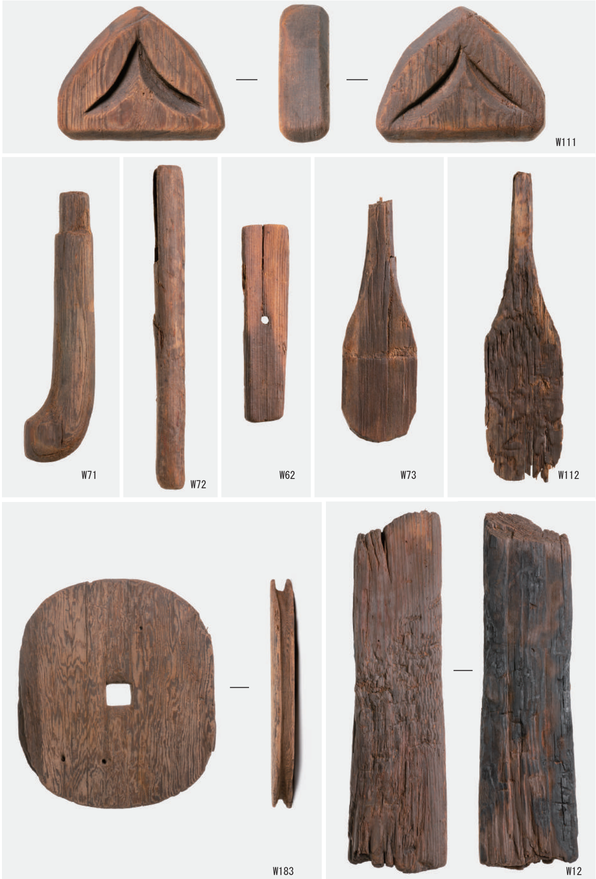
細工物 (W111), 柄 (W71・W72・W62), ヘラ (W73・W112), 滑車 (W183), 作業台 (W12)