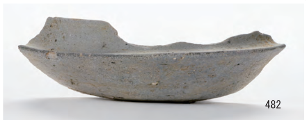
A 3 区 豎穴建物 S379 (461 ~ 463 · 465 · 466), S312 (477 · 480 ~ 482)