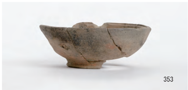
A 1 区 河道S9 南半40~60 cm