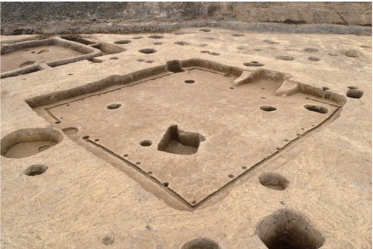
A 5区 竪穴建物S209 (南東から)