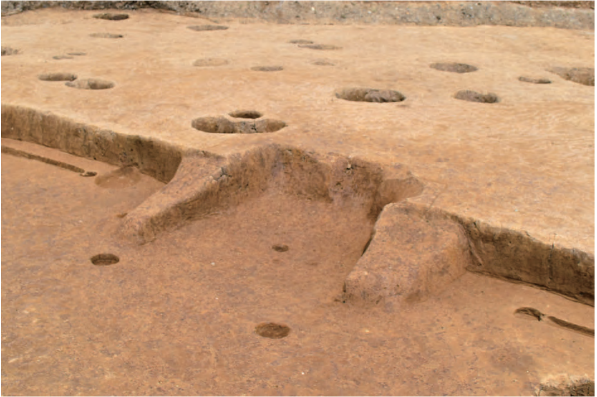
A 5区 竪穴建物S209 カマド (南東から)