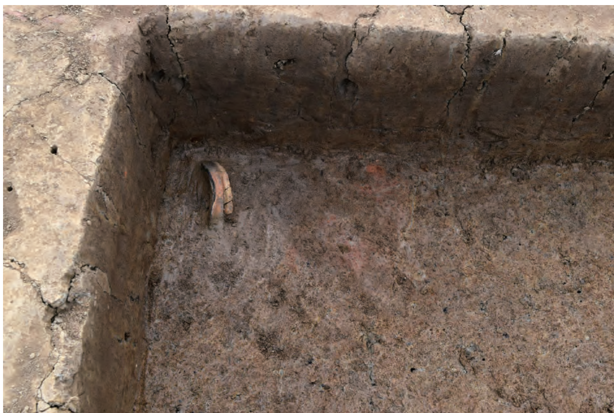
A 5 区 竪穴建物S276 遺物出土状況（土器562 / 東から）