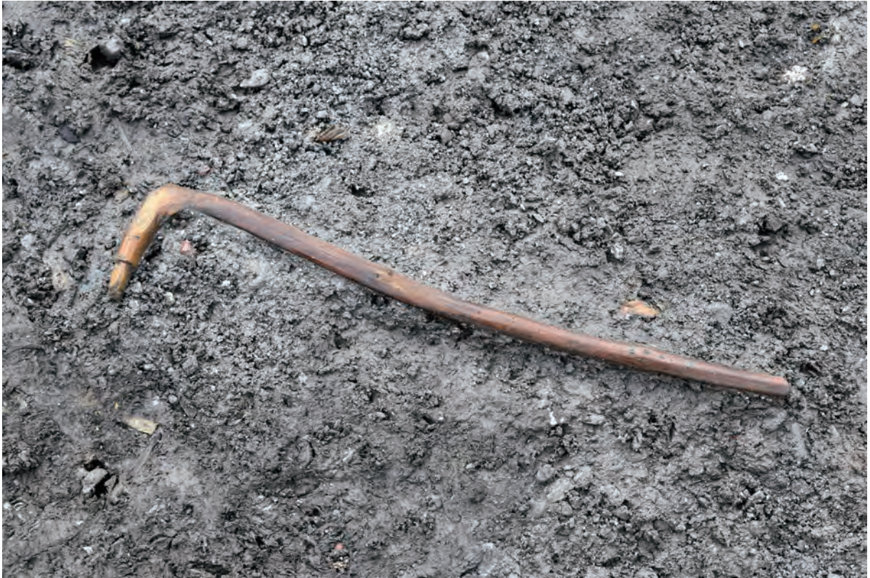
A 8区 河道S9 遺物出土状況 (W171 / 北東から)