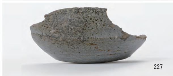
A 1 区 河道S9 南半20~40cm