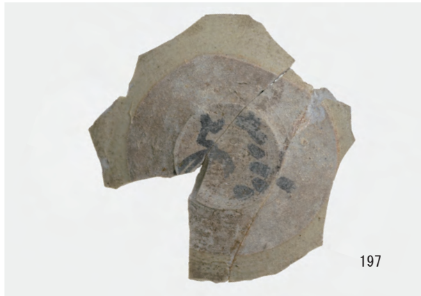
A 1 区 河道S9 南半0~20cm