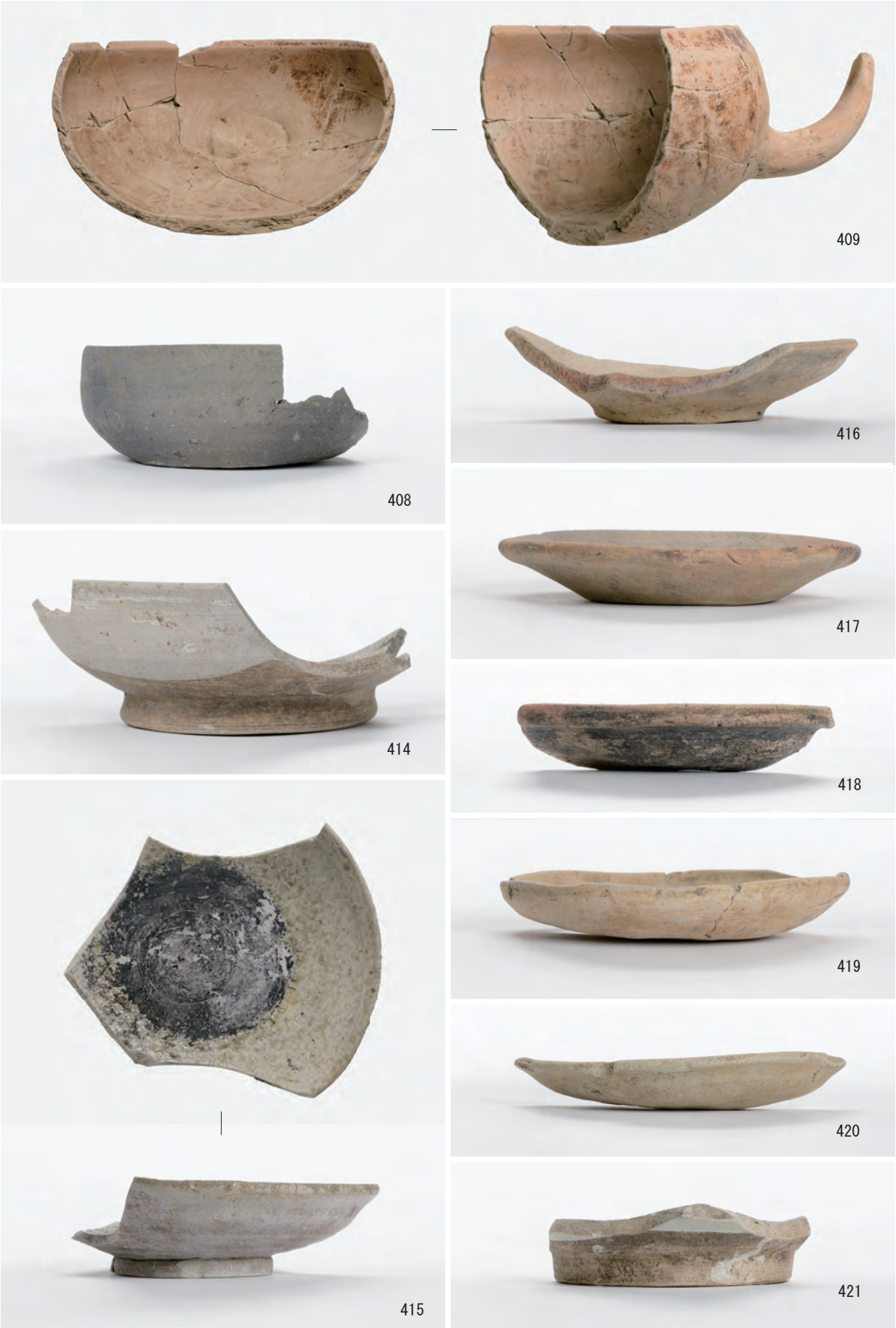
A 1 区 河道S9 南半80cm～最下層