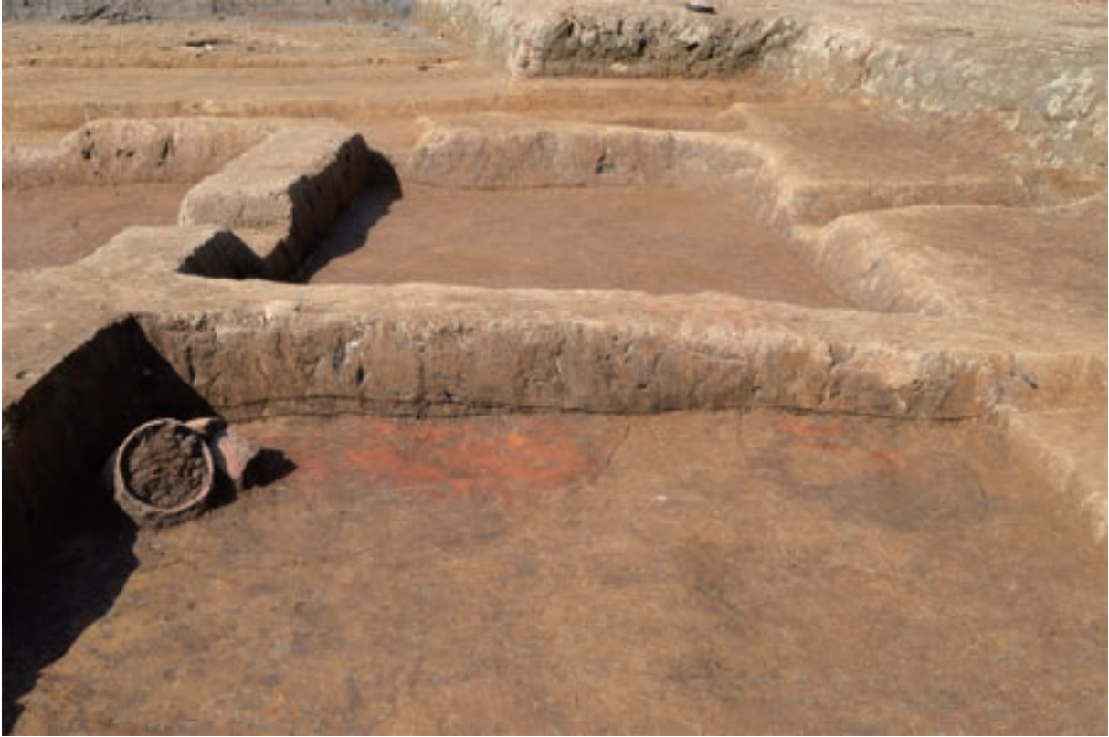
A 3区 竪穴建物S379 遺物出土状況（土器461 /北東から）