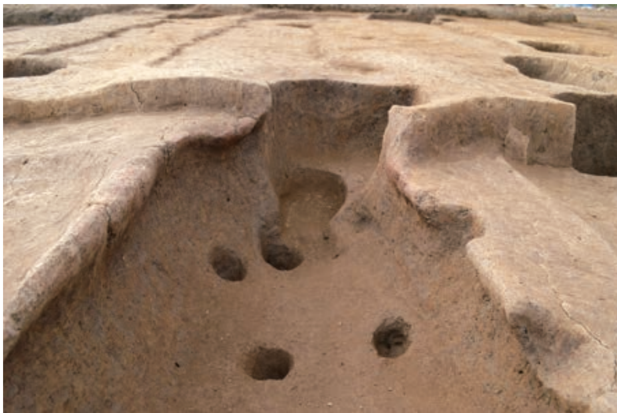
A 3区 竪穴建物S312 北西辺カマド (南東から)