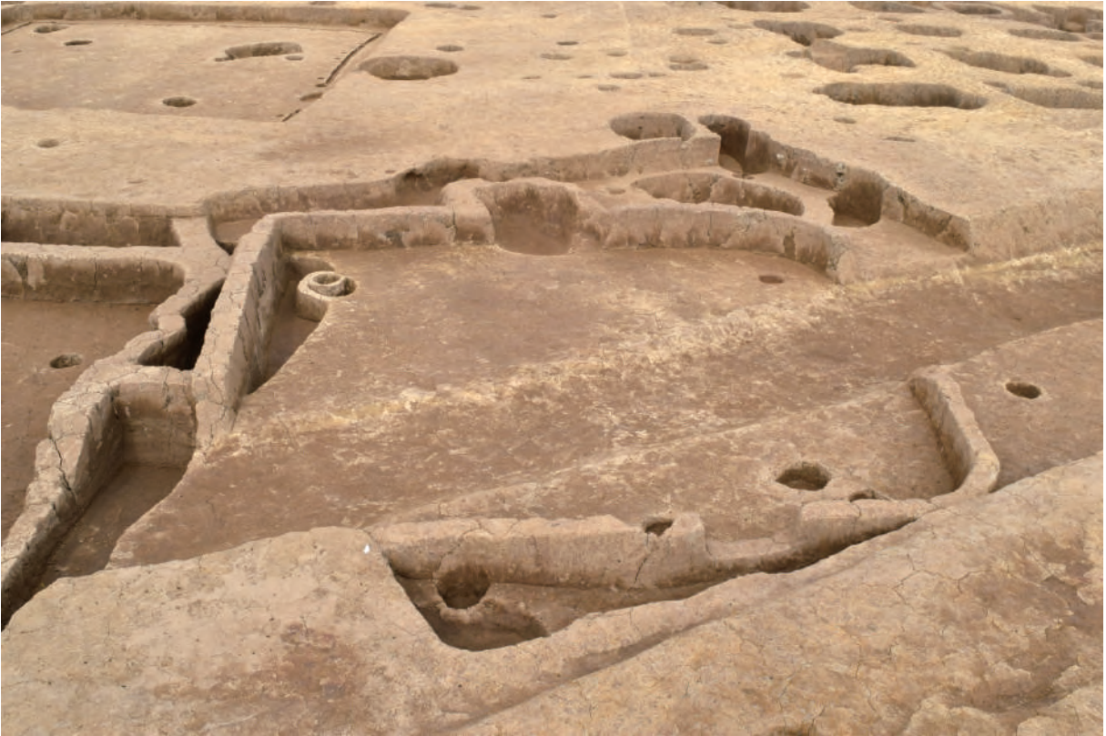
A 5区 竪穴建物S279・S473 (南西から)