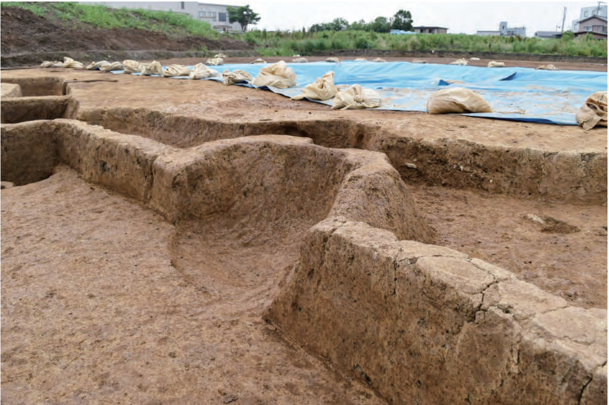
A 5区 竪穴建物S473 カマド (南から)