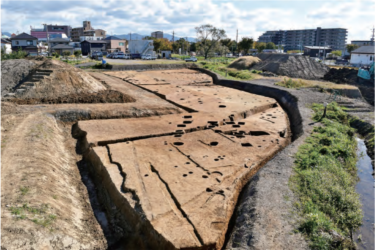
A 7 区 北西部 (北西から)