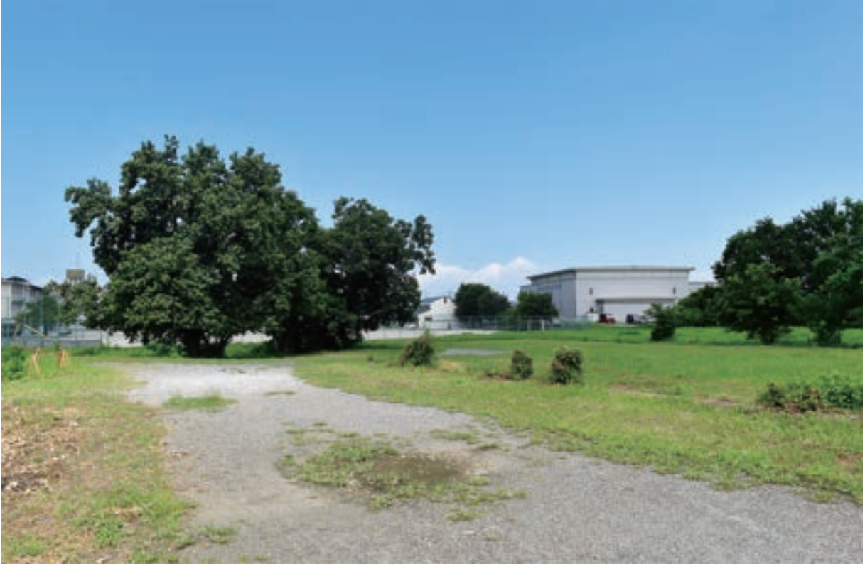
調査前状況（南東から）