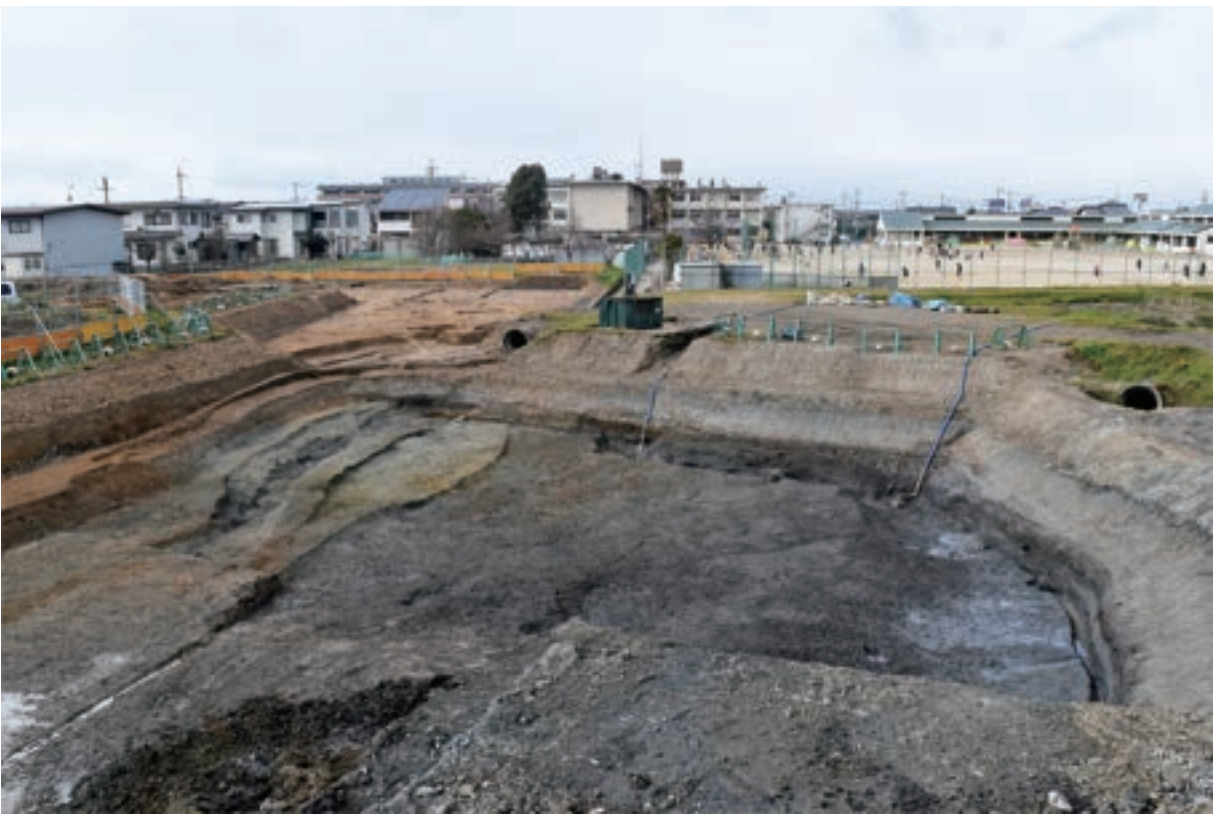
A1区 北西部（南東から）