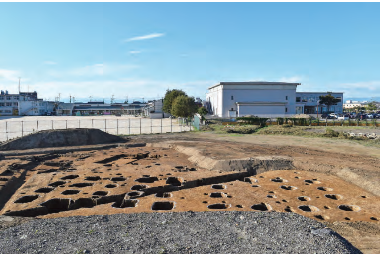
A 5区 掘立柱建物SB7・SB8（南東から）