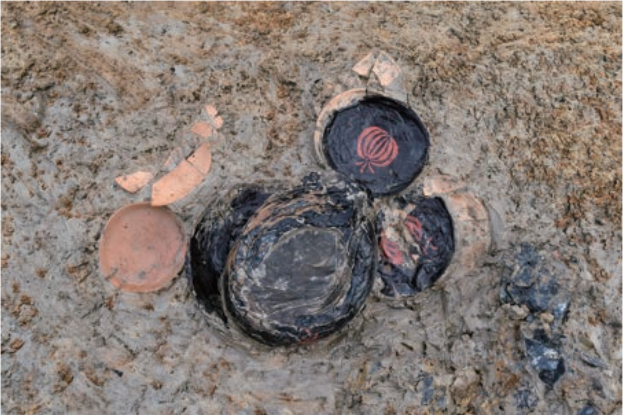
A 3区 溝S3 遺物出土状況 (土器992・993, 漆器W196 ~ W199 /南西から)