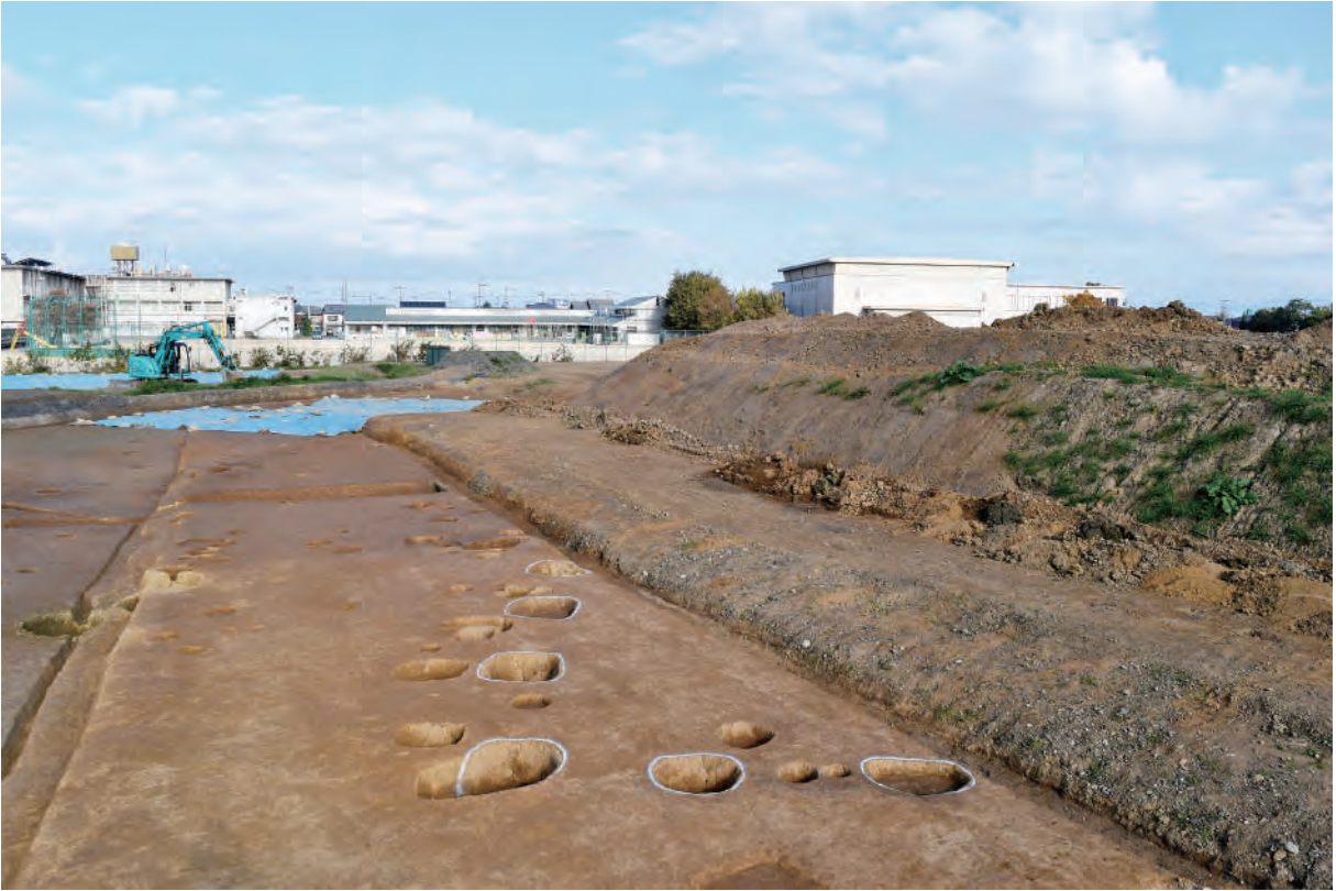
A 7区 掘立柱建物SB5 (南東から)