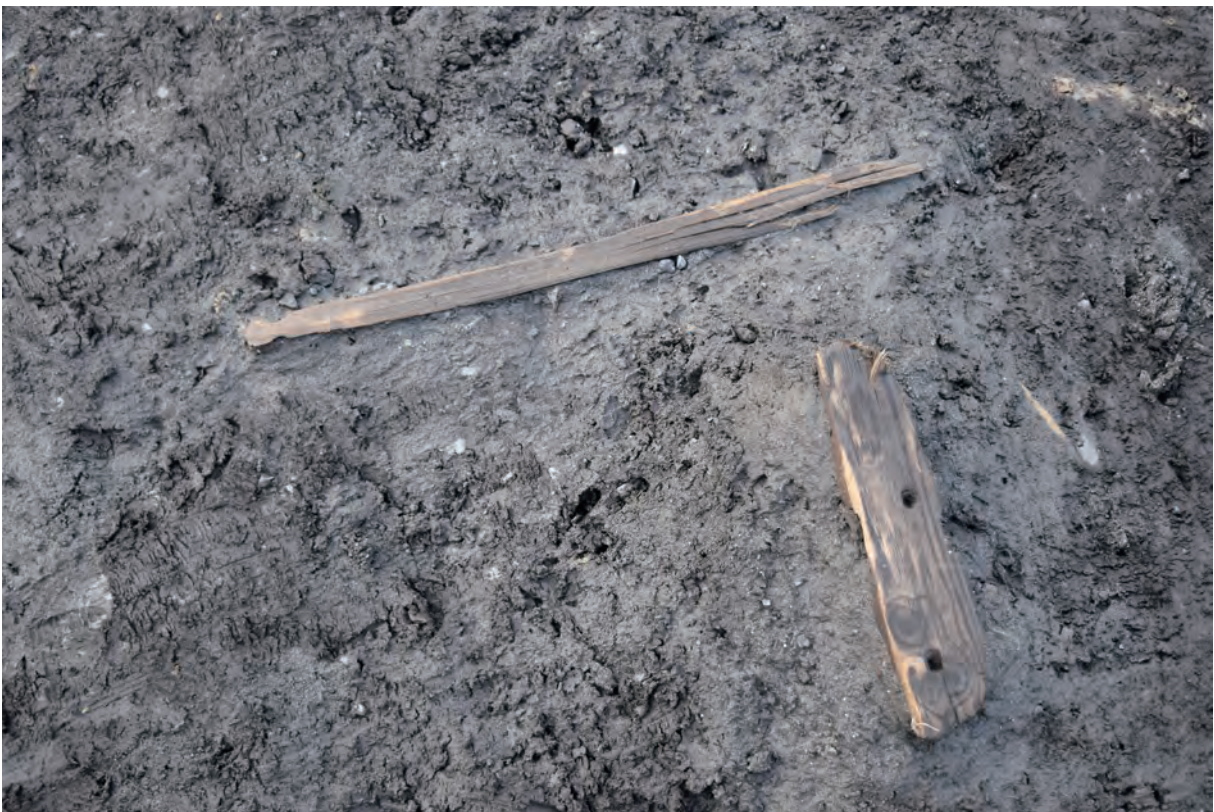
A 8区 河道S9 遺物出土状況 (W143・147 / 南東から)