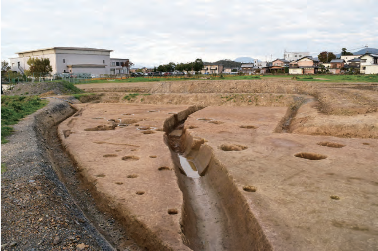
A 7区 溝S378 (南西から)