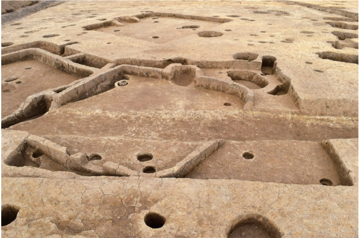
A 5 区 竪穴建物S279・S473 (南西から)