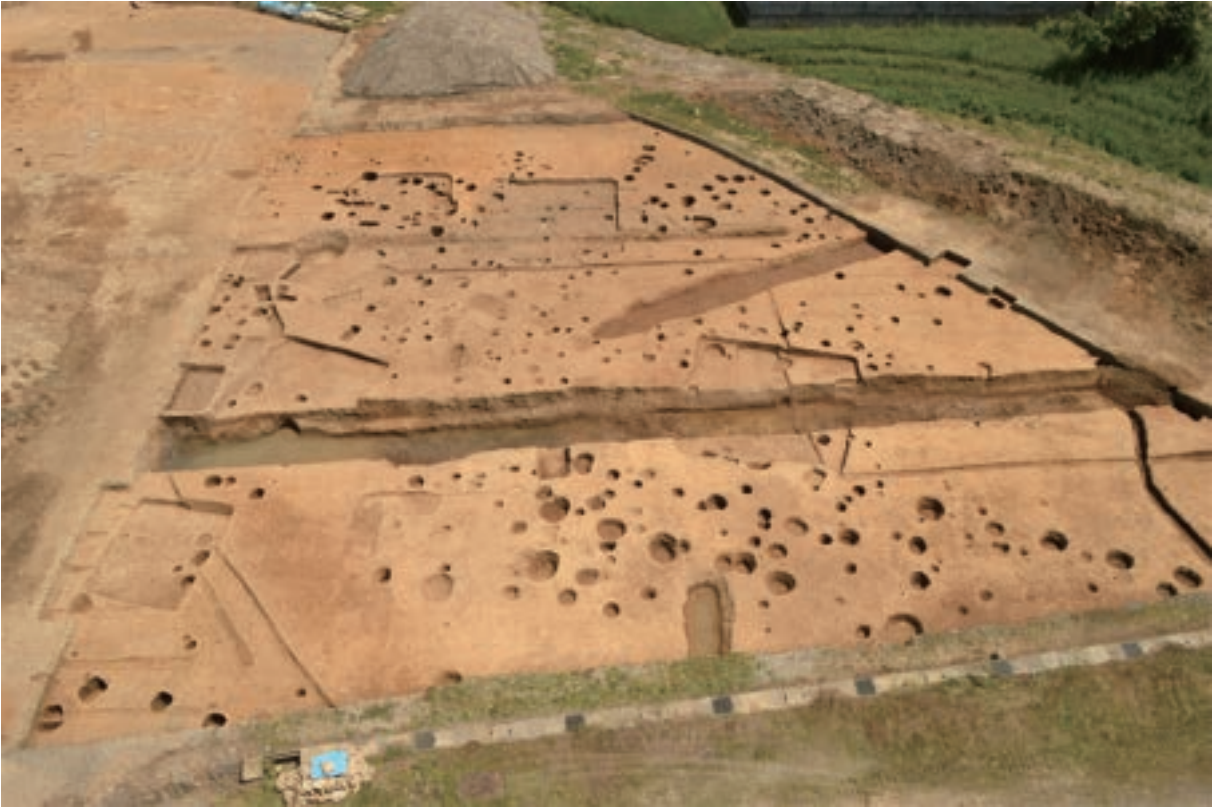
A 3区 (南西から)