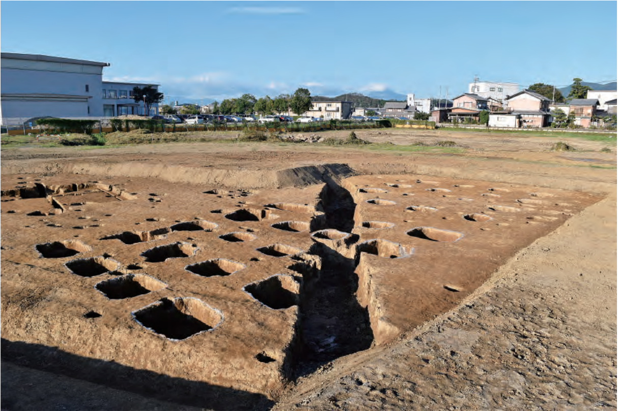
A 5 区 溝S145, 掘立柱建物SB7・SB8 (南西から)