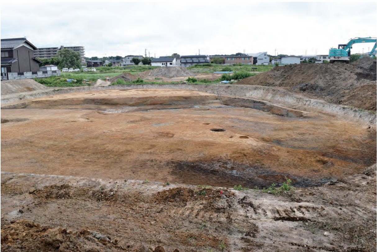
B区 北東部（北東から）