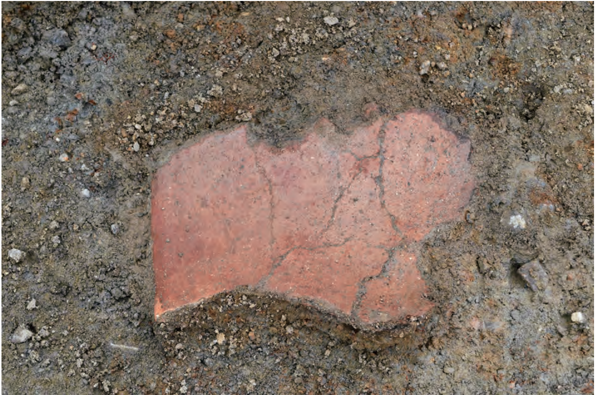
B区 下層 河道S47 遺物出土状況（土器926 /北東から）