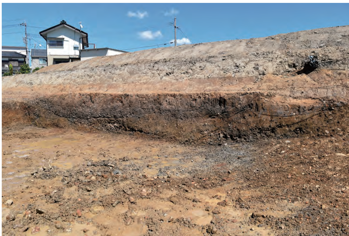
B区 河道S40 断面 (北西から)