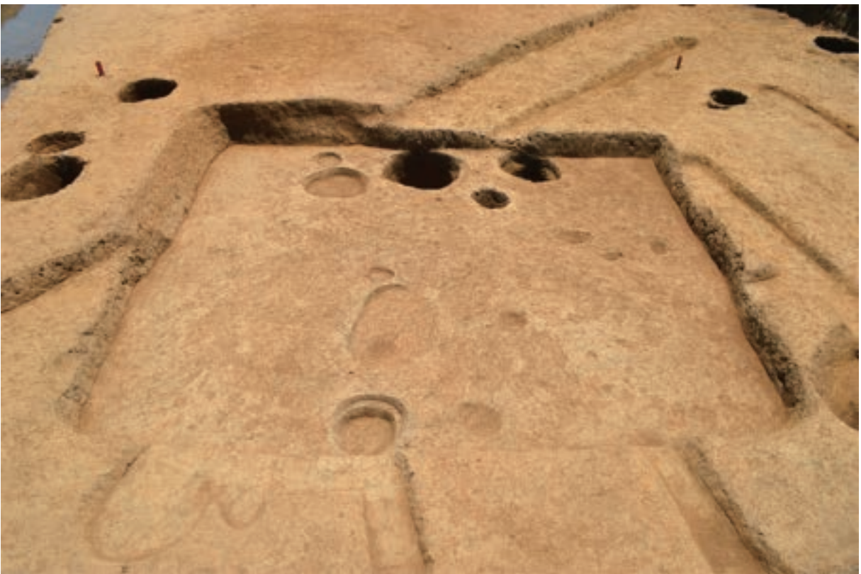
A 3区 竪穴建物S379（北西から）