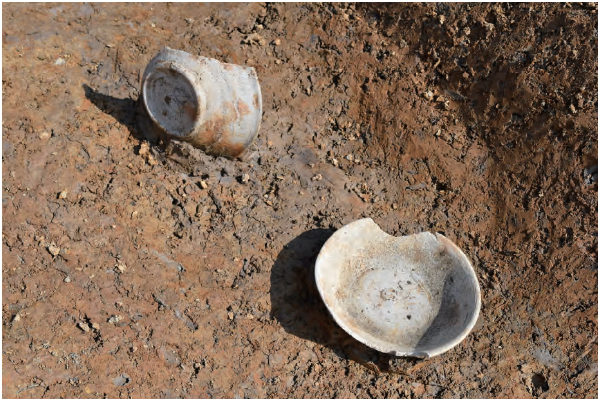
A 7区 溝S367 遺物出土状況 (土器649・651 / 西から)