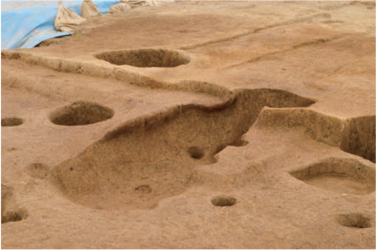
A 3区 竪穴建物S312 北西辺カマド（東から）