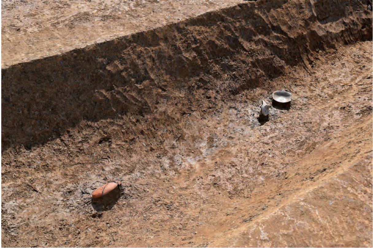
A 7区 溝S367 遺物出土状況 (土器649・651・654 / 北から)