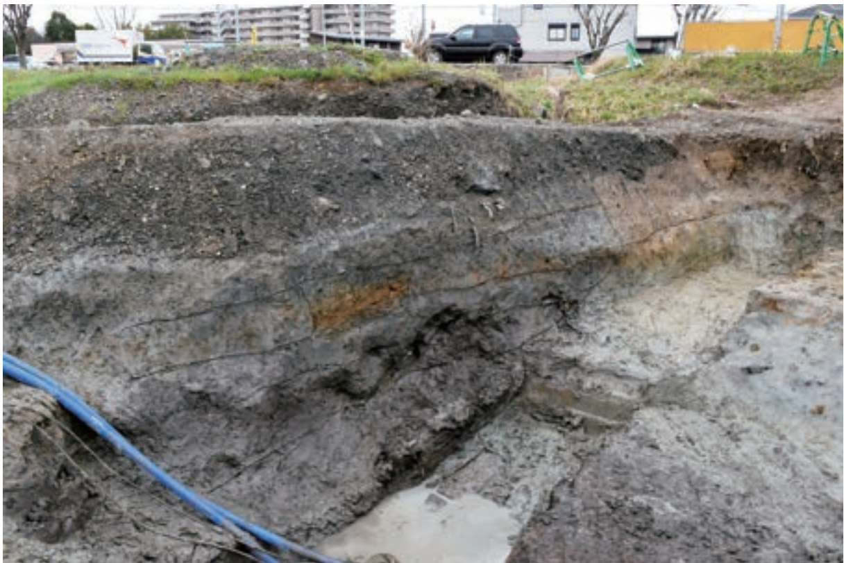
A 1 区 河道S9 断面 (北から)