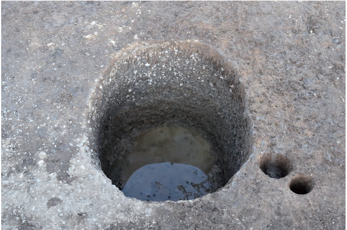
C区 井戸S52 (南西から)