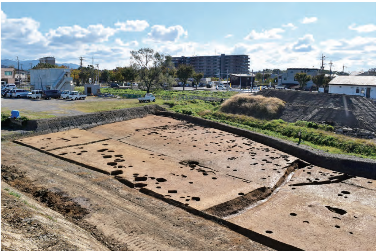
A 7 区 南東部 (北西から)