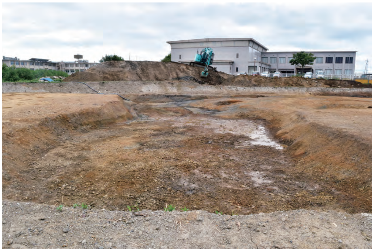
B区 河道S40 (南東から)