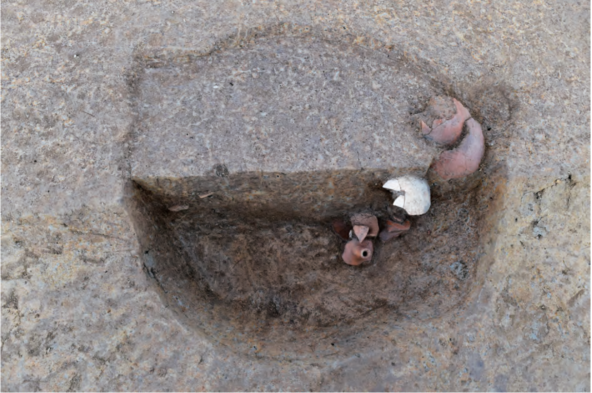
A 7区 土坑S397 遺物出土状況（南西から）