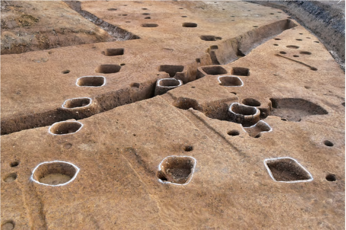
A 7区 掘立柱建物SB11・溝S378 (北西から)