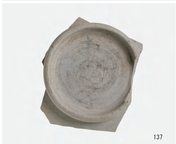
A 1 区 河道S9 南半 0~20cm