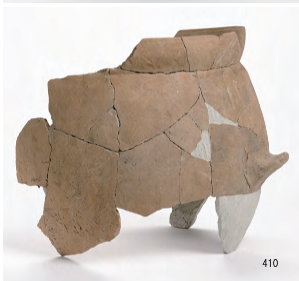
A 1 区 河道S9 南半80 cm ~ 最下層