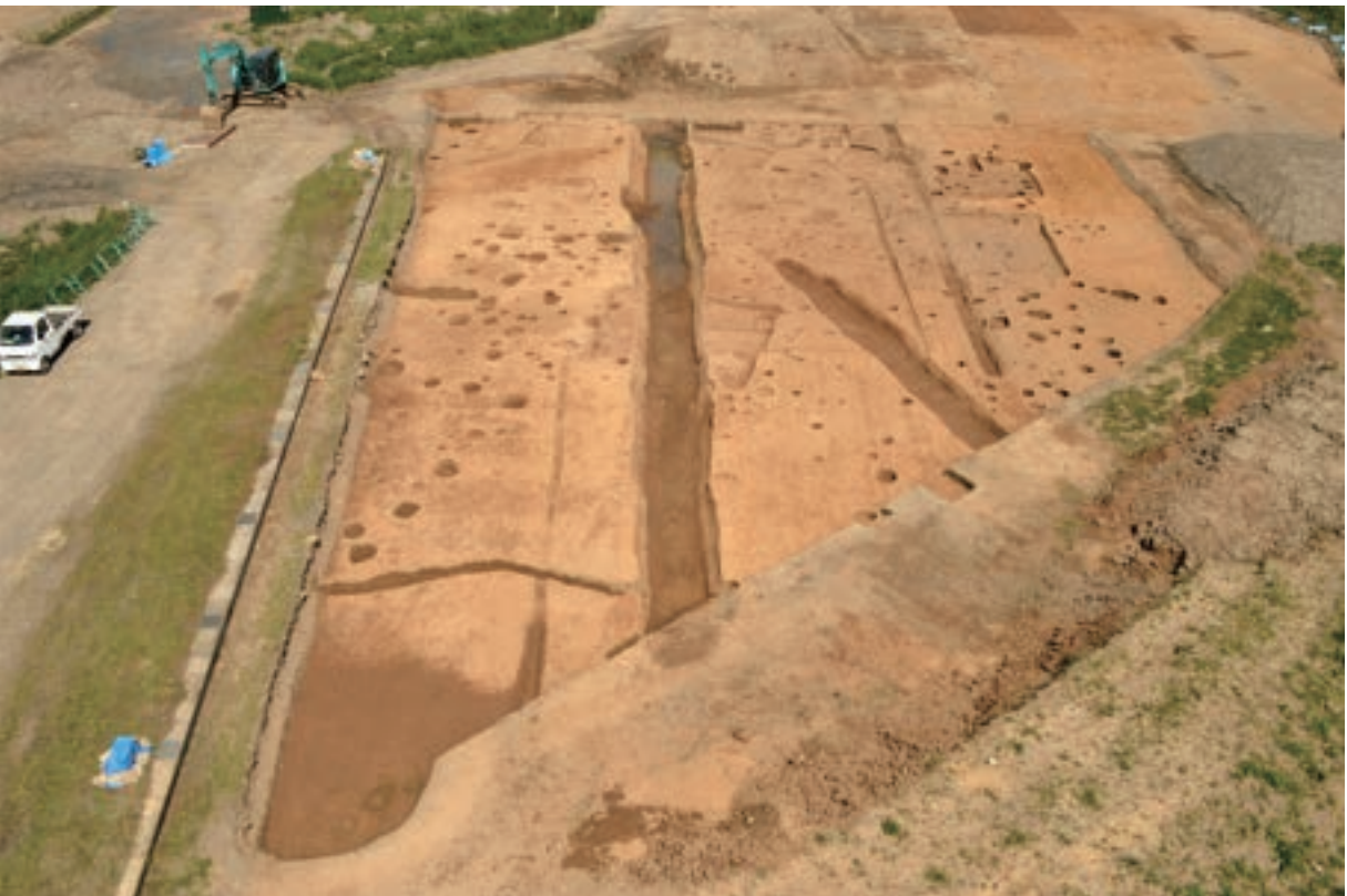
A 3区 (南東から)