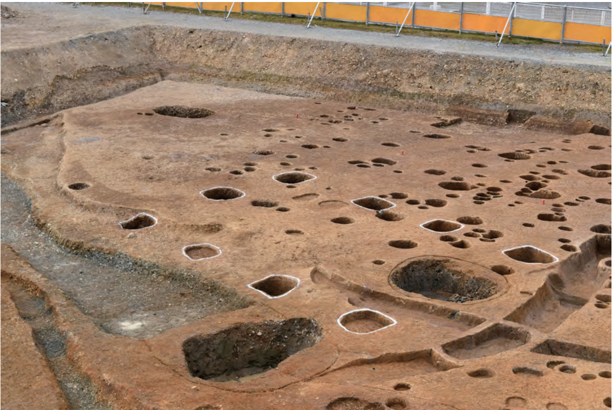
C区 掘立柱建物SB13（南東から）