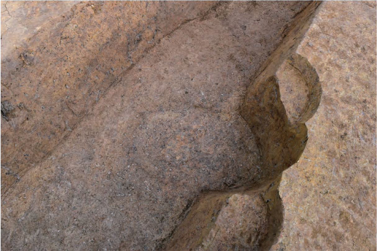
A 7区 掘立柱建物SB12 S431 (南東から)