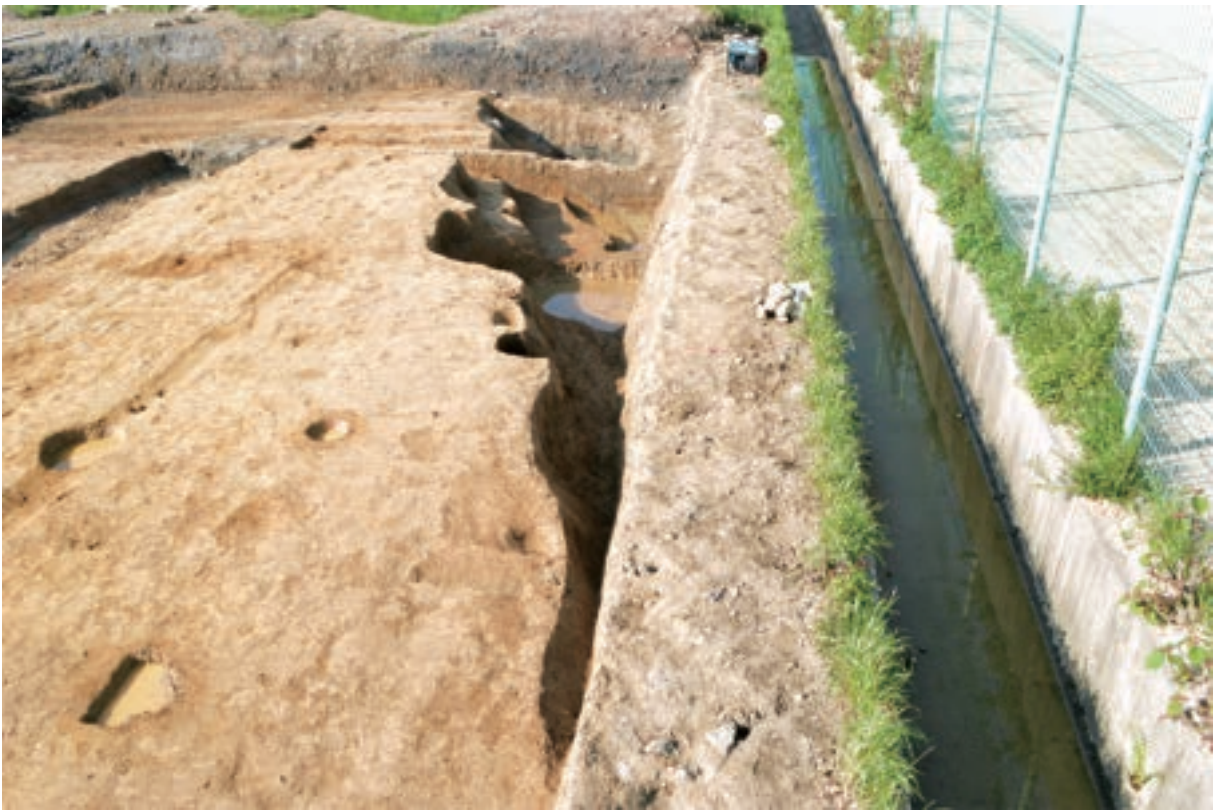
A 4区 河道S24 (北東から)