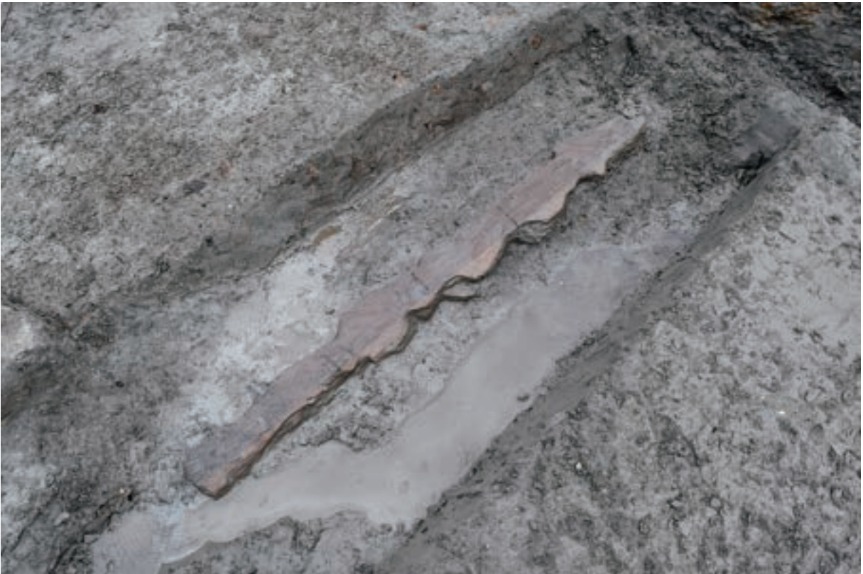
A 1区 河道S9 遺物出土状況 (W76 / 南西から)