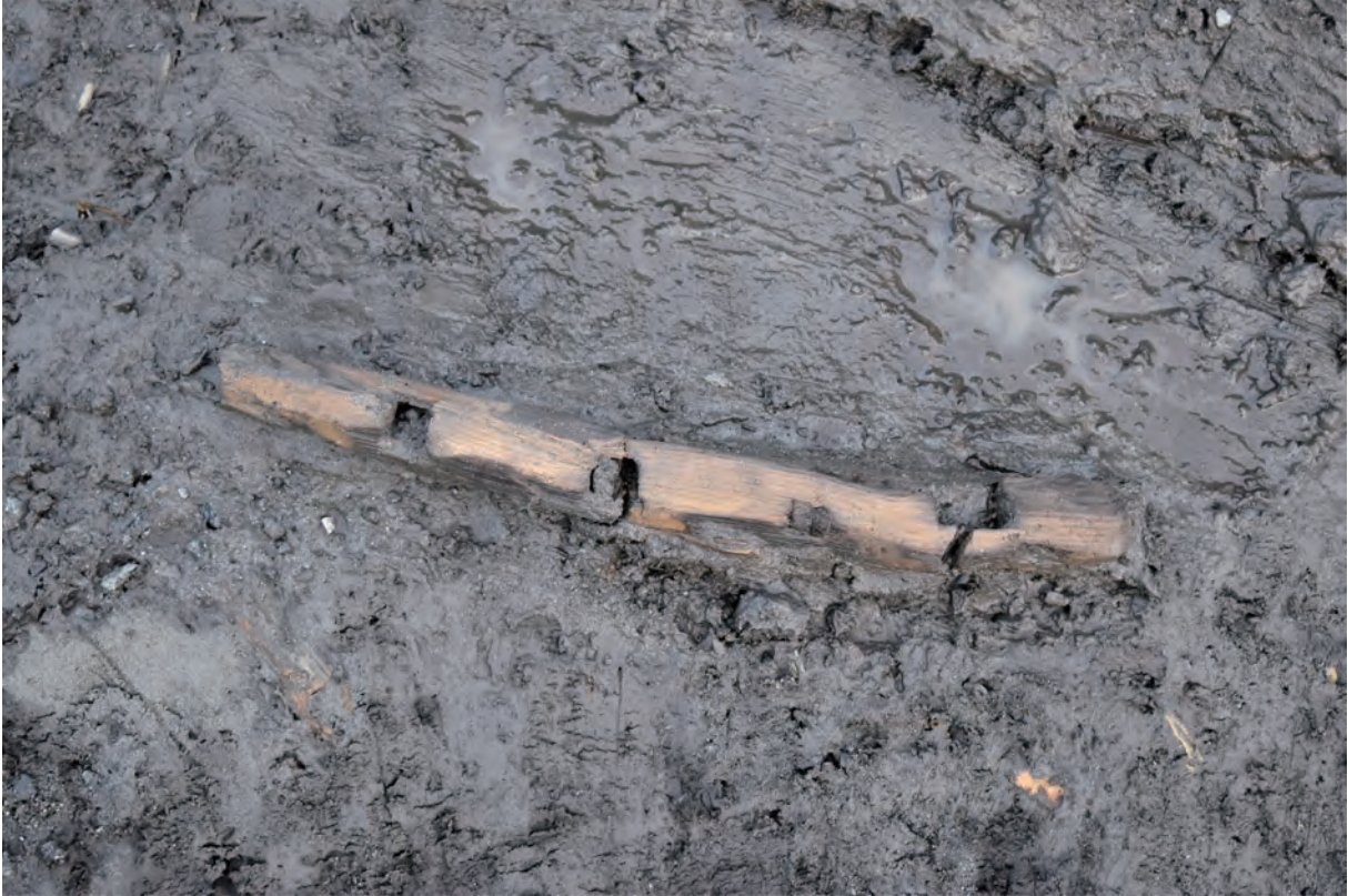
A 8区 河道S9 遺物出土状況 (W138 / 西から)