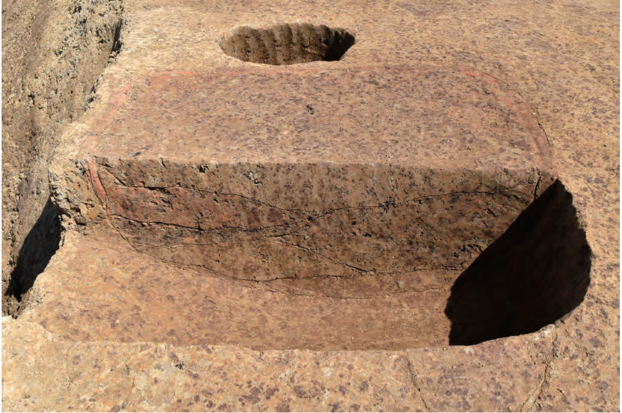
A 5 区 土坑S376断面（南から）