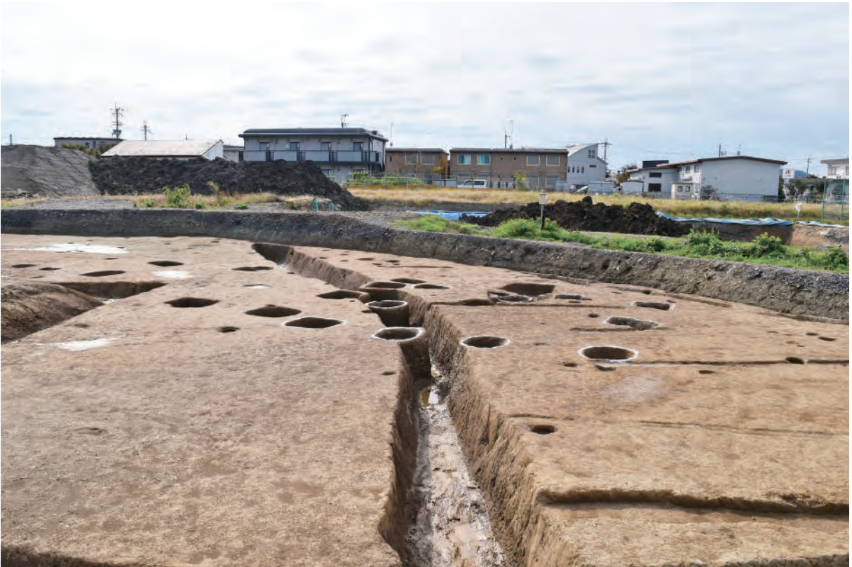
A 7区 掘立柱建物SB11・溝S378 (北東から)