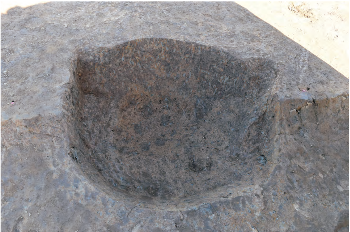
A 7区 土坑S397（南西から）