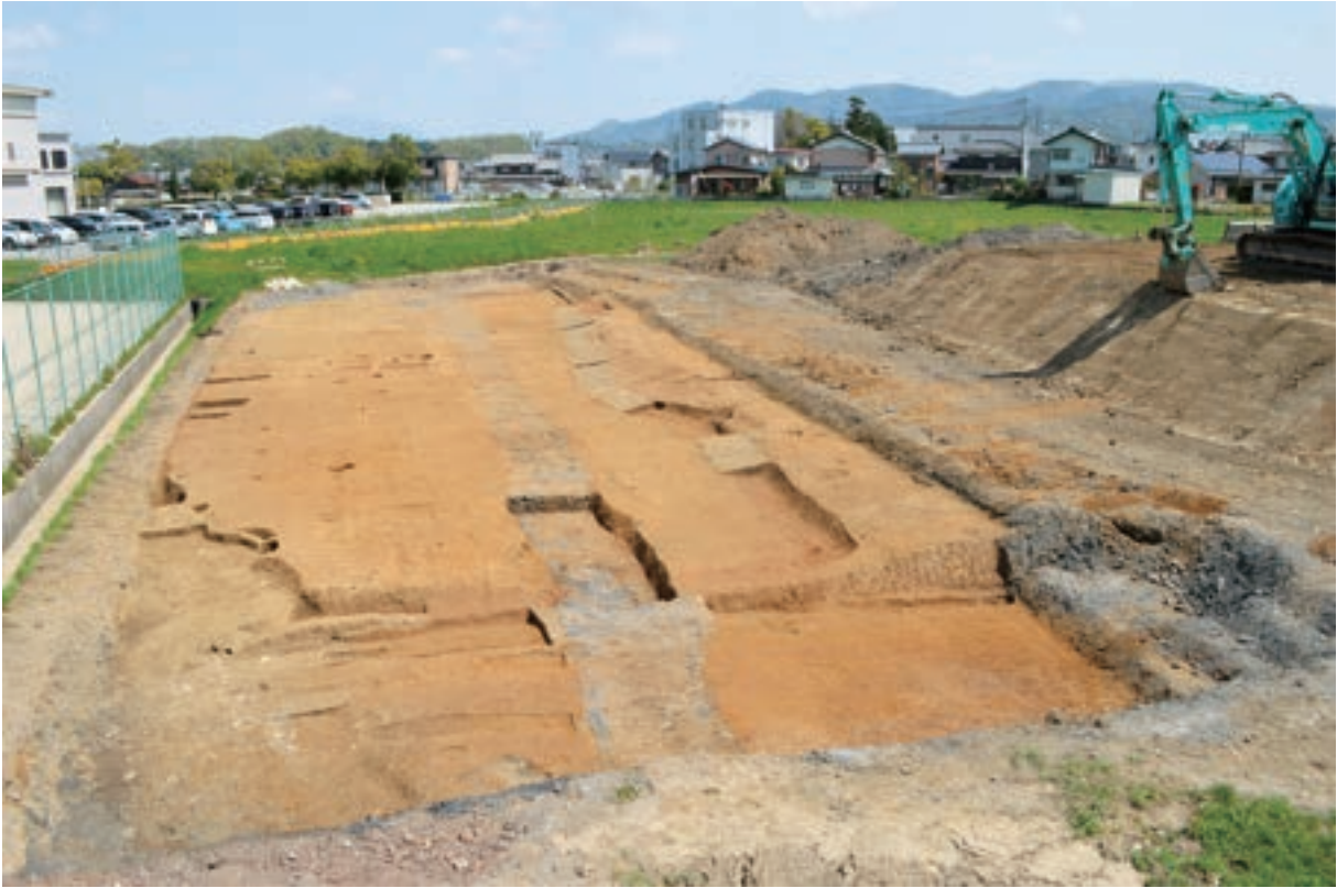
A 4区 (南西から)