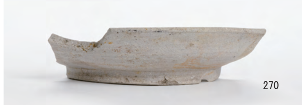
A 1 区 河道S9 南半20~40cm