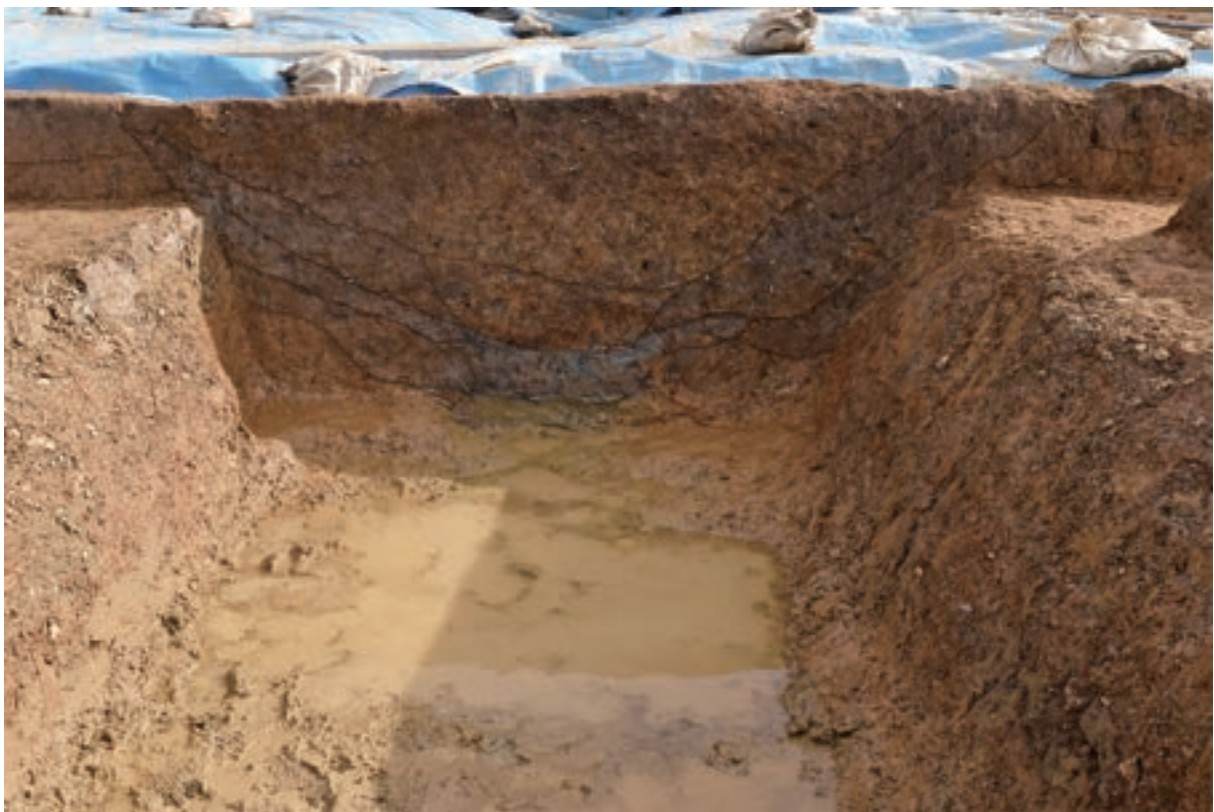
A 3区 溝S3断面 (南東から)