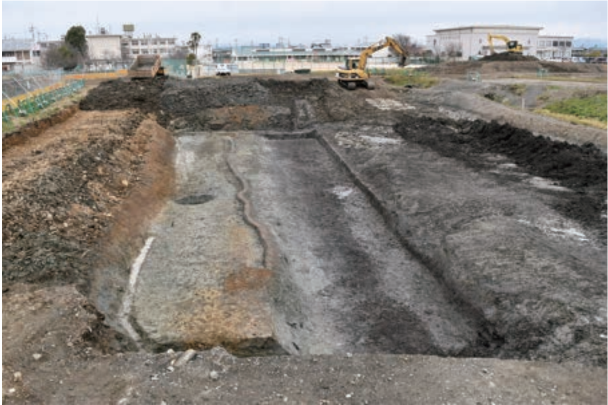
A 1 区 南東部 (南東から)