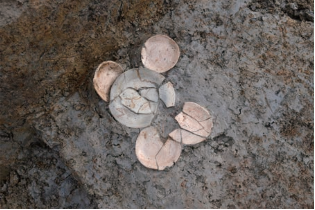
A 3区 溝S3 遺物出土状況 (土器494 ~ 496・498・505 /西から)