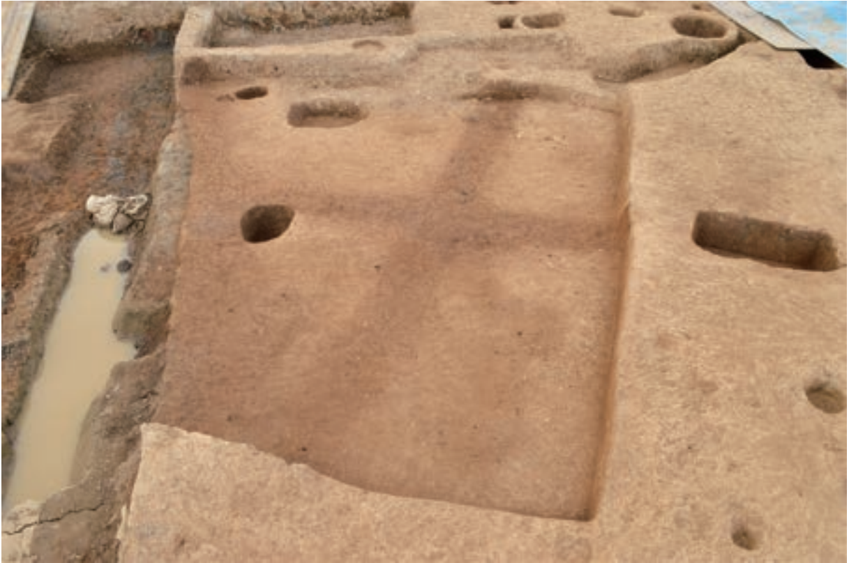
A 3区 竪穴建物S343 (南東から)