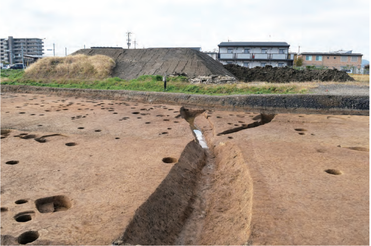
A 7区 溝S367 (北東から)