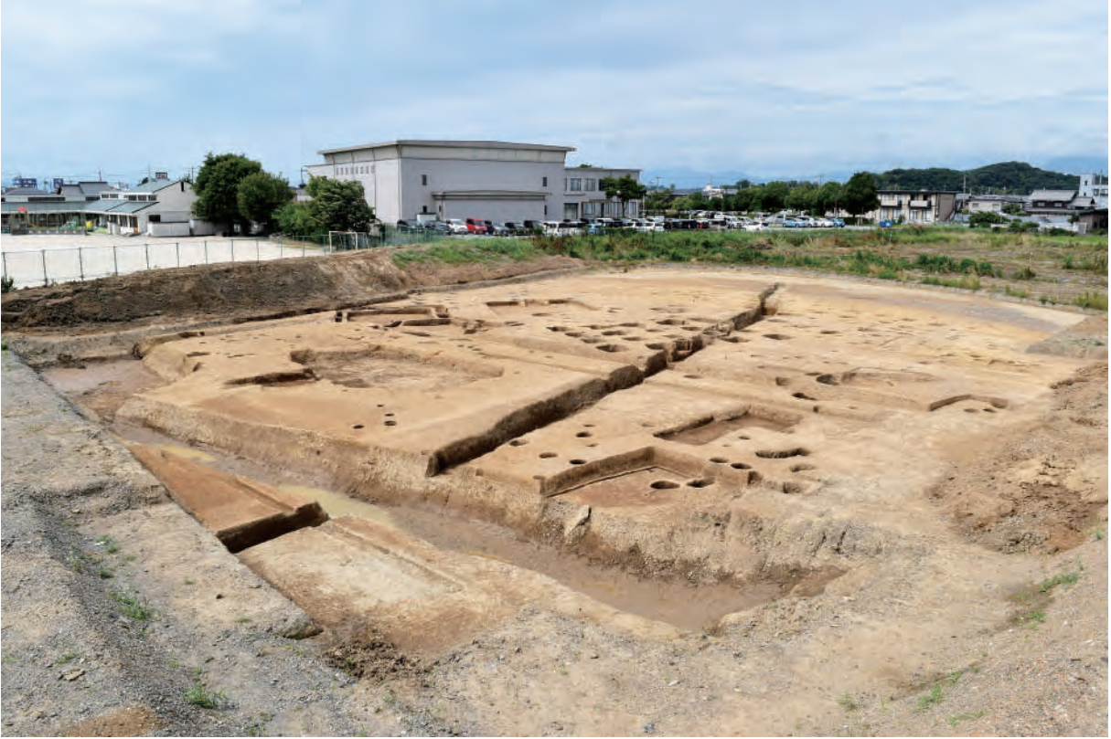
A 5 区 (南から)