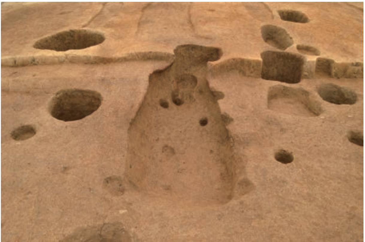
A 3区 竪穴建物S312 北西辺カマド (南東から)