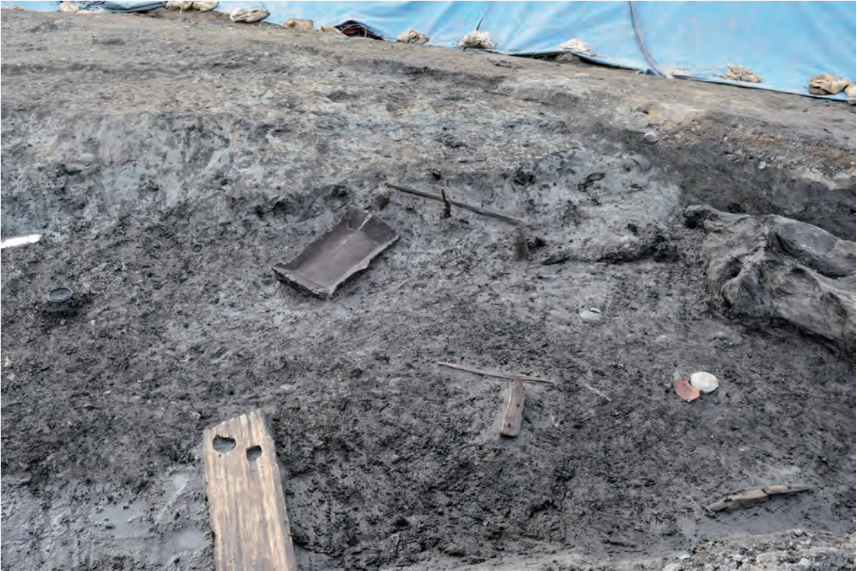
A 8区 河道S9 遺物出土状況（南東から）