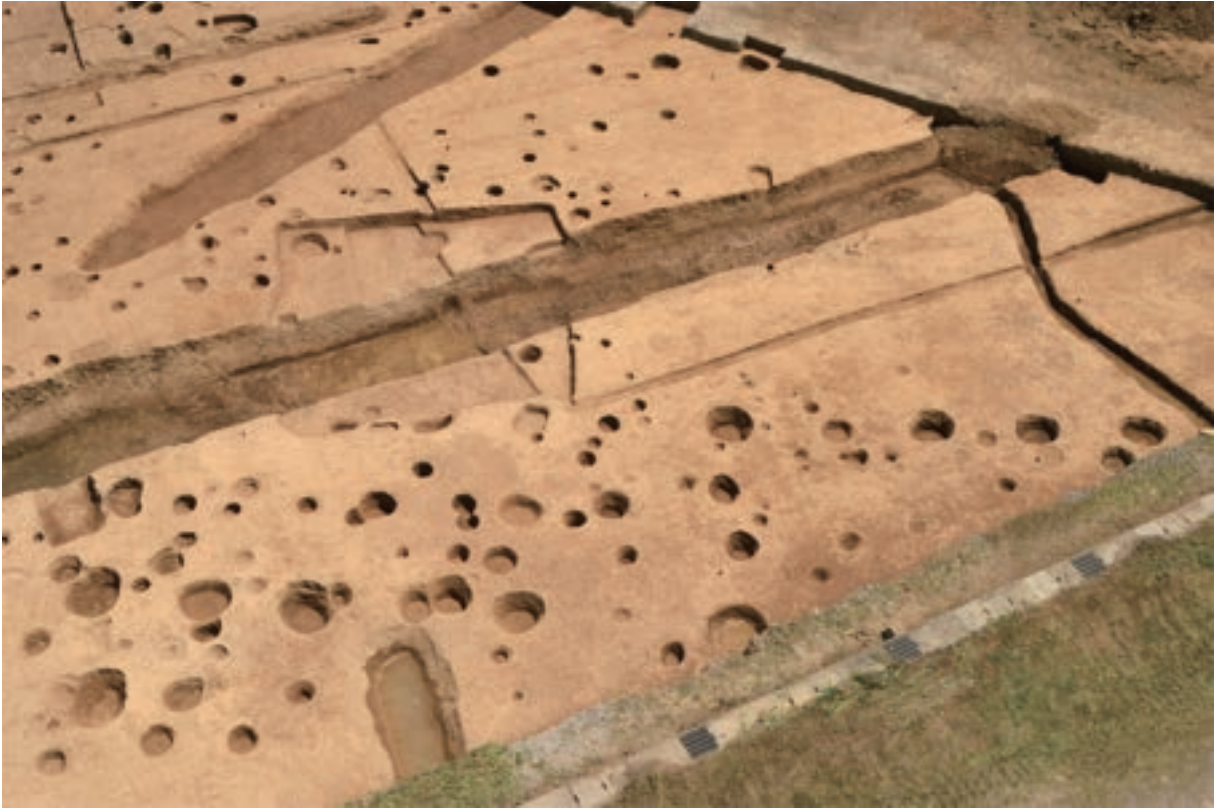
A 3区 掘立柱建物SB4・SB5 (南東から)