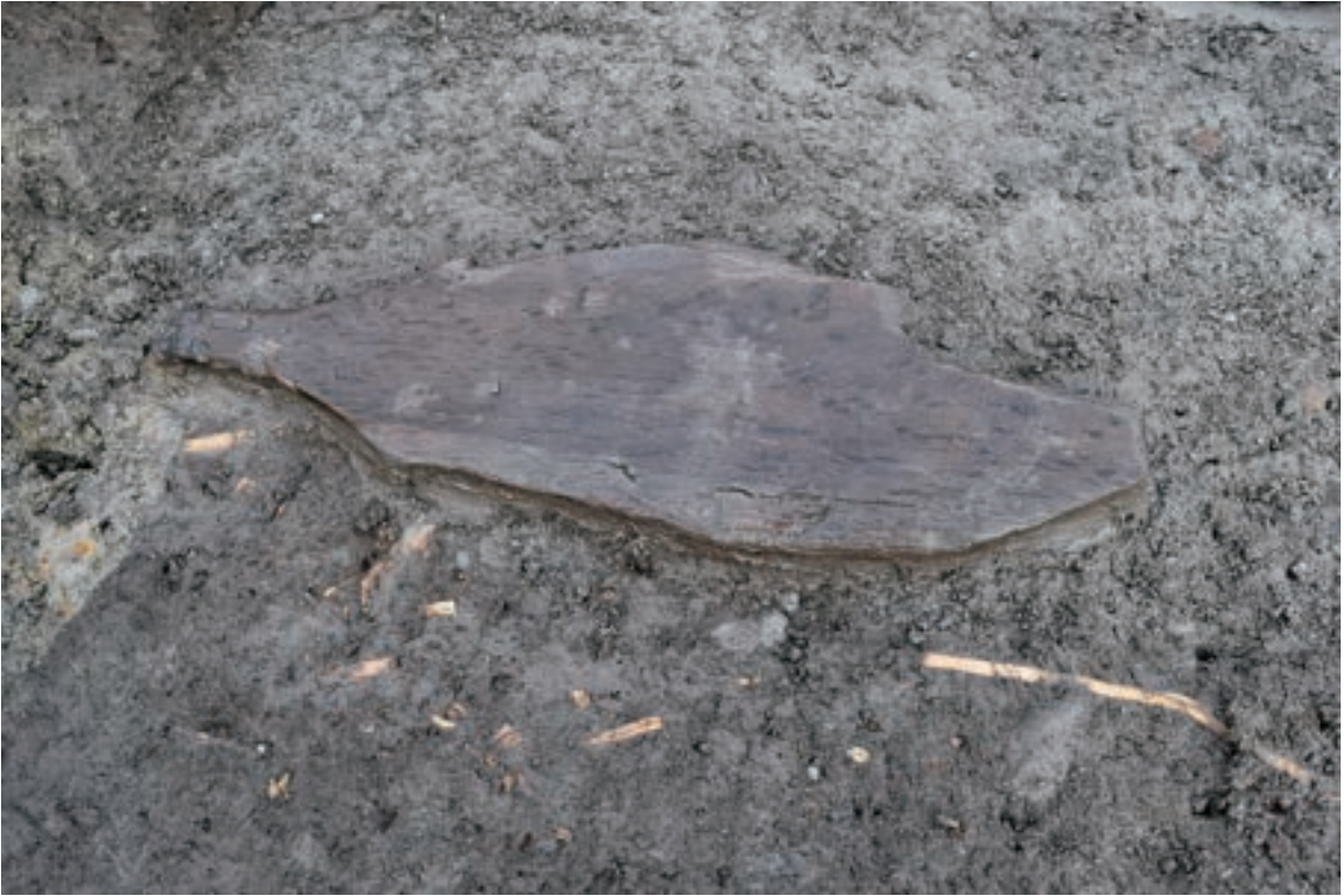
A 1区 河道S9 遺物出土状況 (W46 / 南西から)