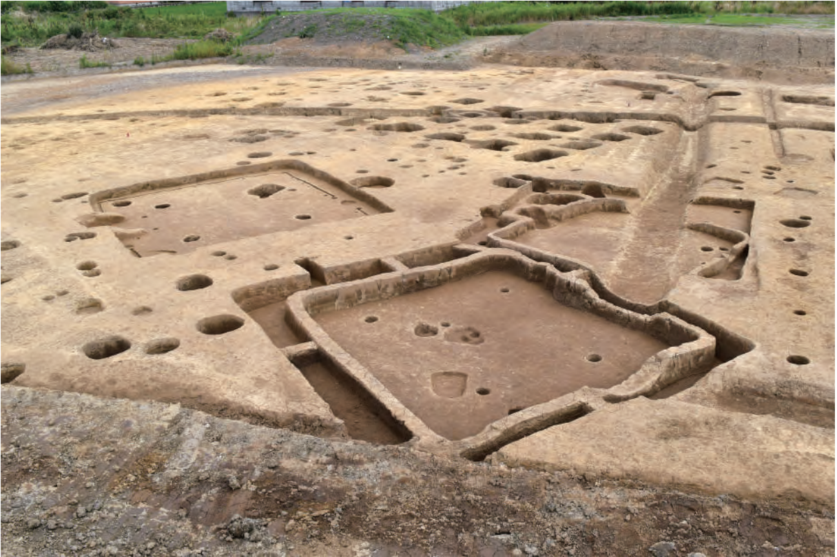
A 5区 建物群（北西から）