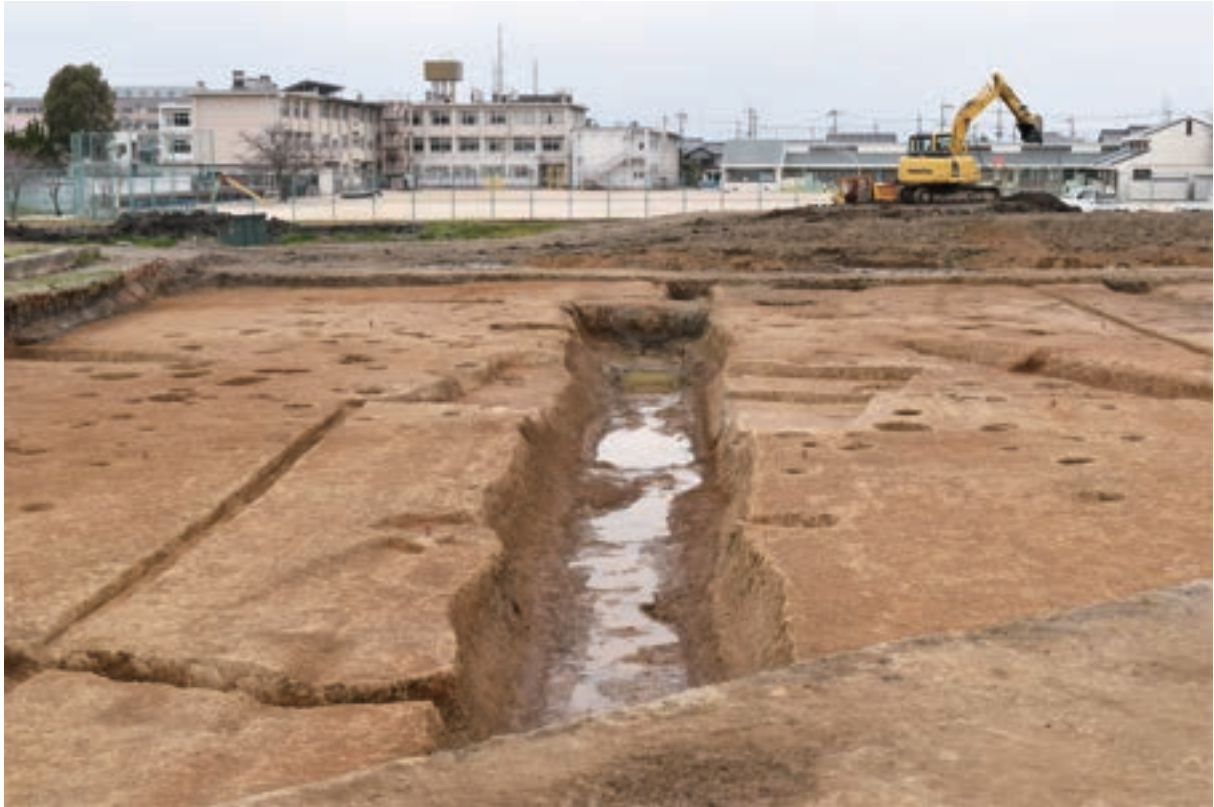
A 3区 溝S3 (南東から)