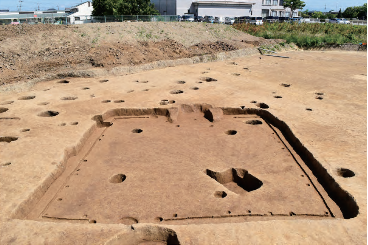
A 5区 竪穴建物S209 (南から)