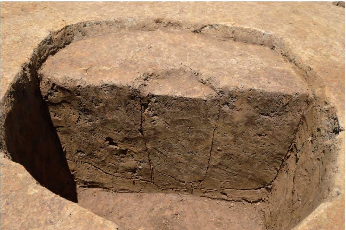
A 5区 掘立柱建物SB7 S318断面 (南東から)