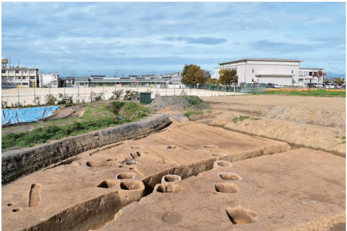
A 7区 掘立柱建物SB11・溝S378 (南東から)