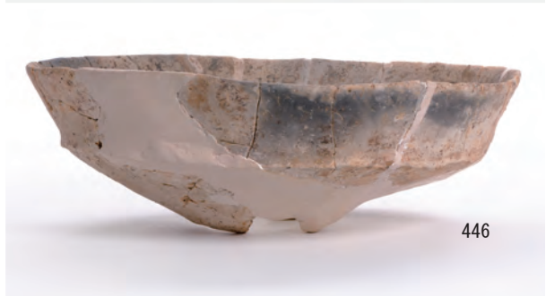
A 2区 溝S2 (426), A 3区 竪穴建物S200 (435・436・438・445・446)