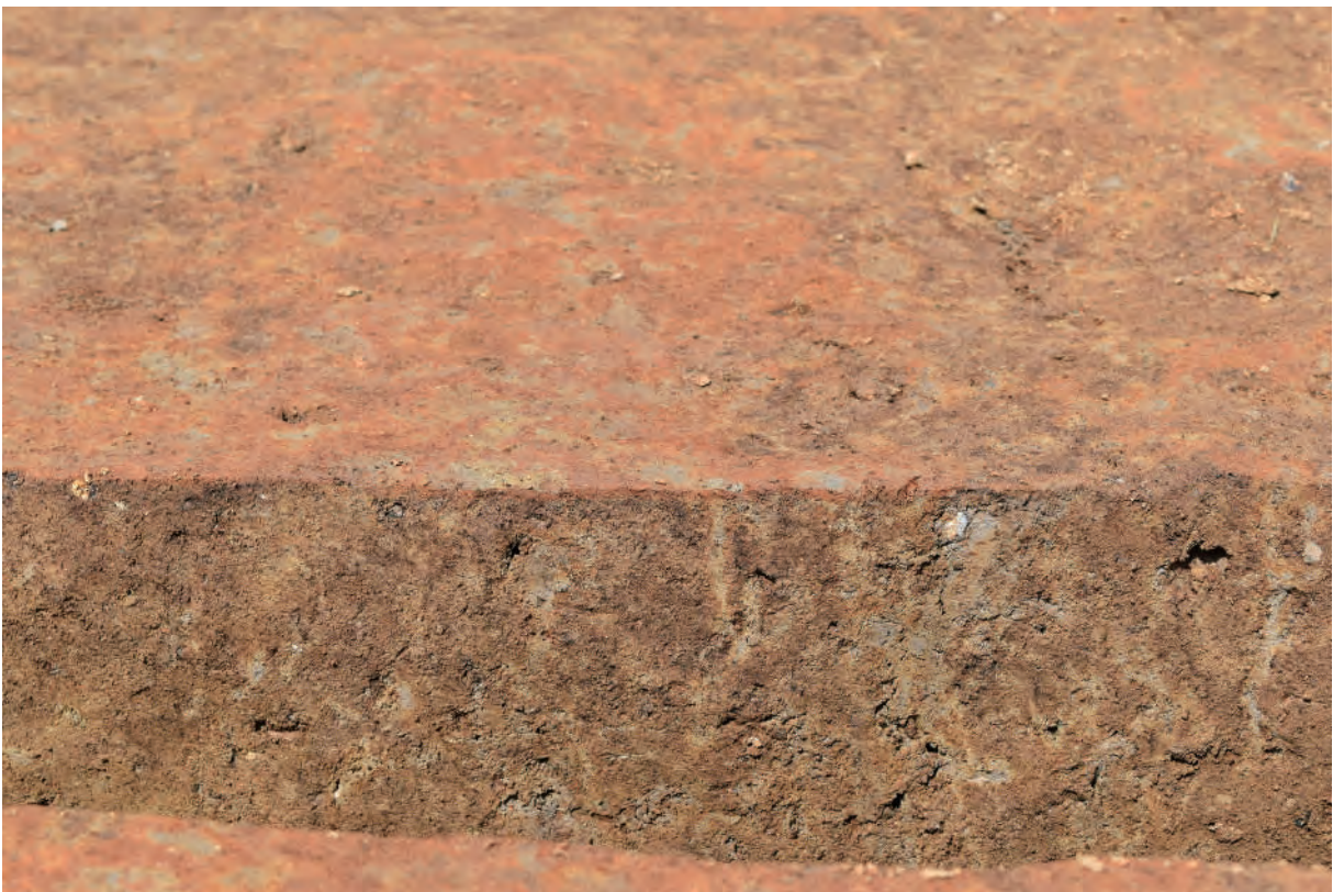
A 5区 竪穴建物S360 貼床断面（南西から）