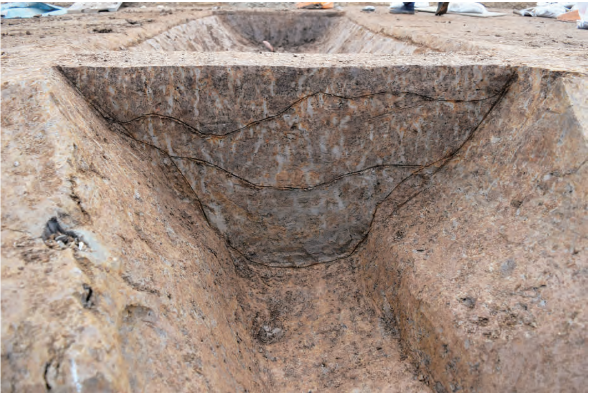
A 7区 溝S367断面 (南西から)