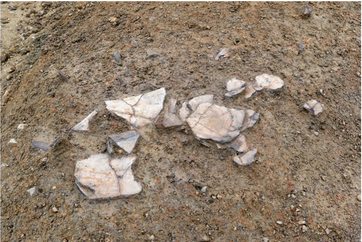
B区 下層 河道S47 遺物出土状況 (土器927・928 / 北西から)