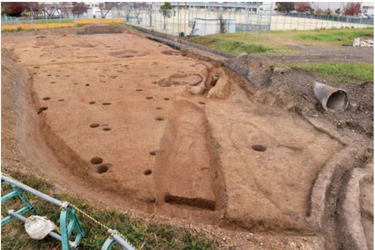
A2区 南部 (南から)