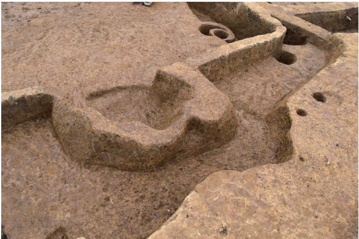
A 5 区 竪穴建物S279・S473 カマド (南東から)