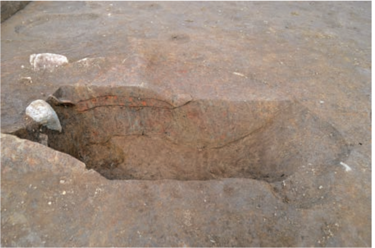
A 3区 竪穴建物S312 北西辺カマド断面（南西から）