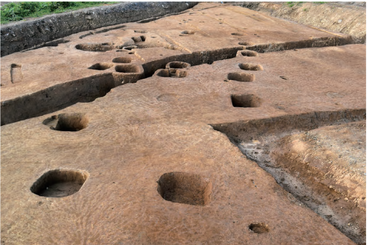
A 7区 掘立柱建物SB12 (南東から)