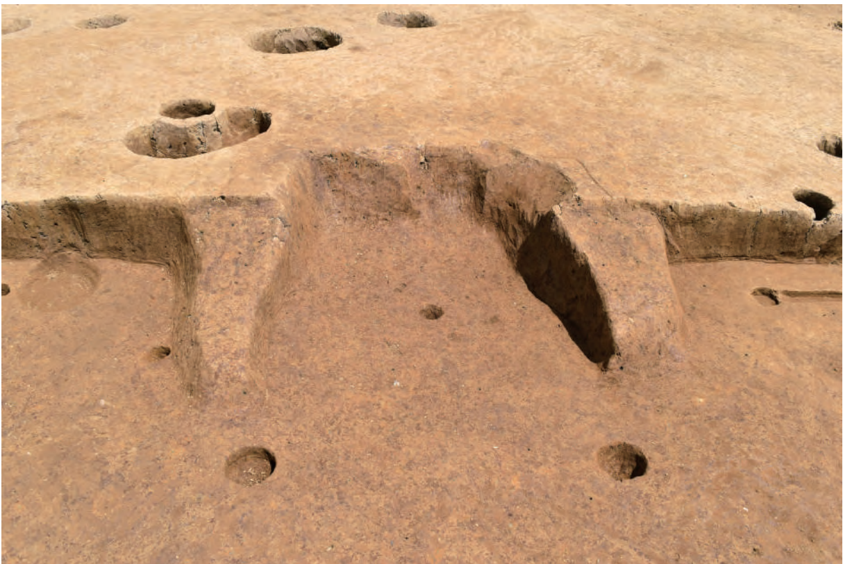
A 5区 竪穴建物S209 カマド (南から)