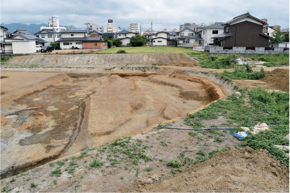
B区 下層 河道S47 (北西から)