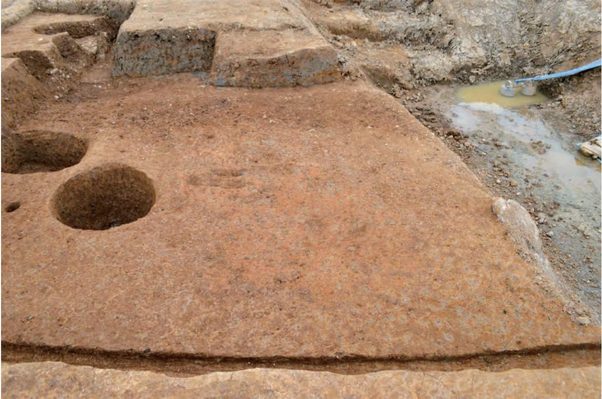
A 5区 竪穴建物S360 貼床（北西から）