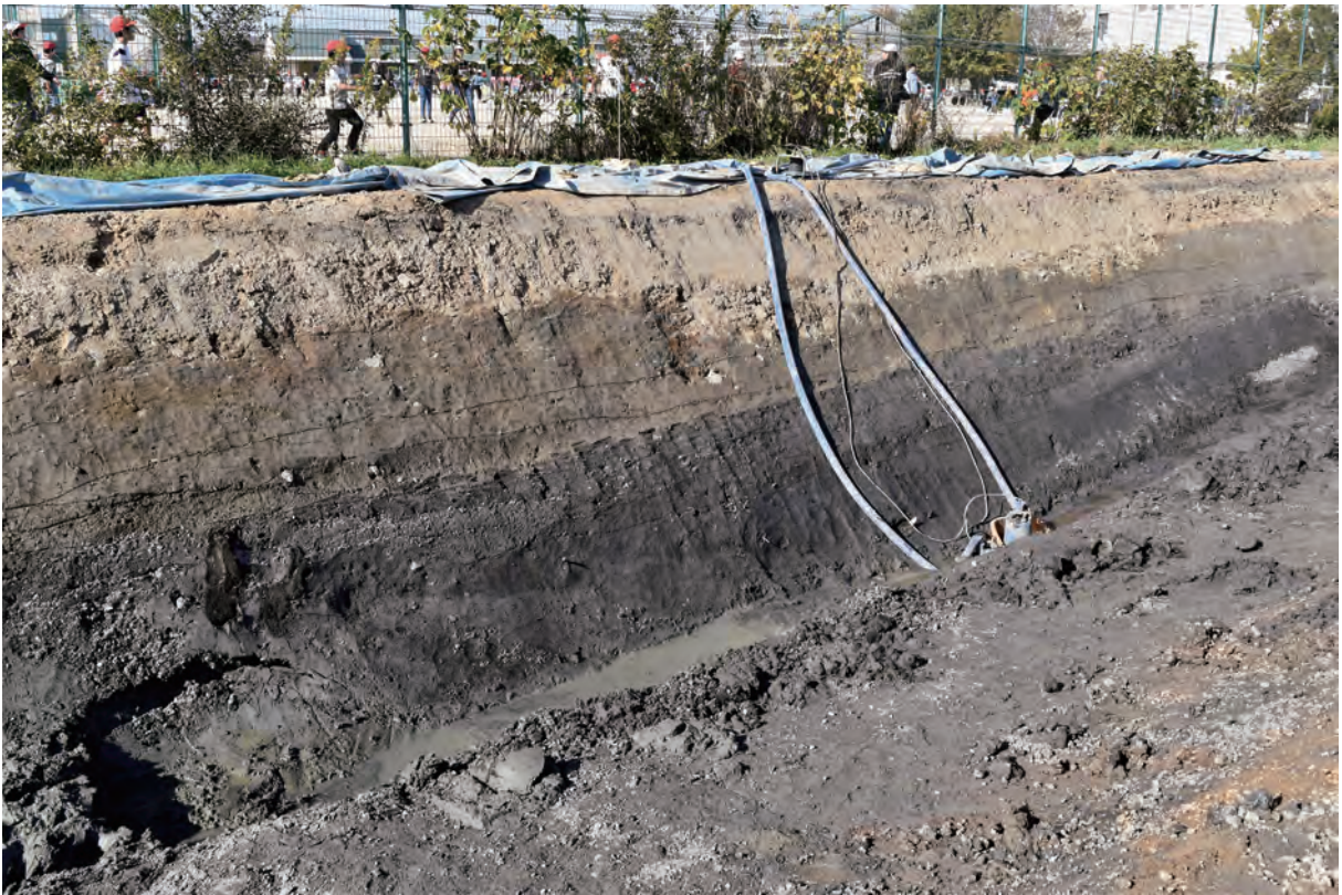
A 8 区 河道S9断面 (南から)