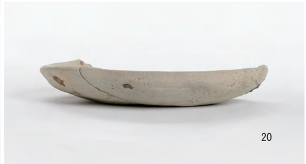
A 1 区 溝S8 (1~3・7・12・13), 土坑S10 (20)