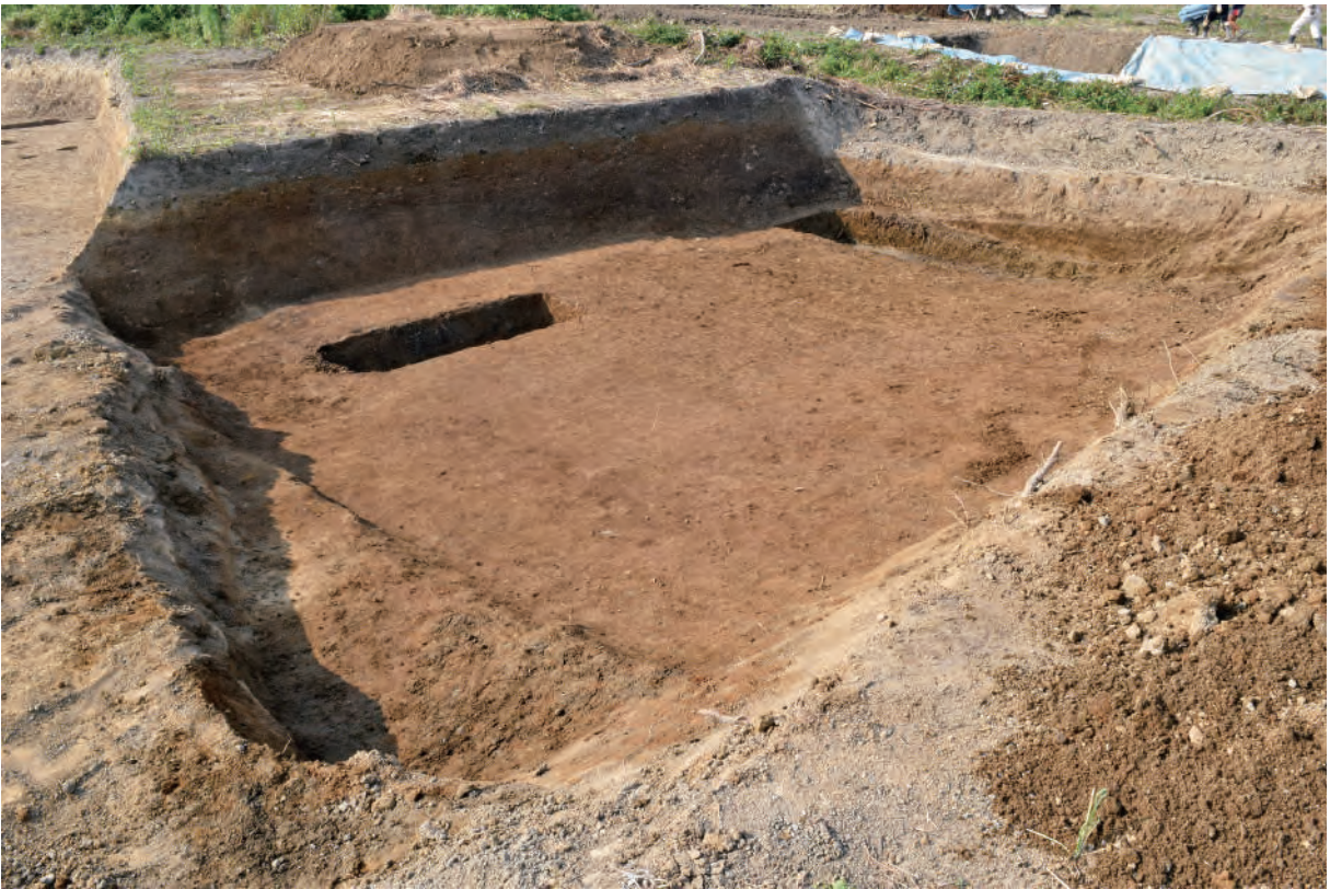
A 6 区（南から）