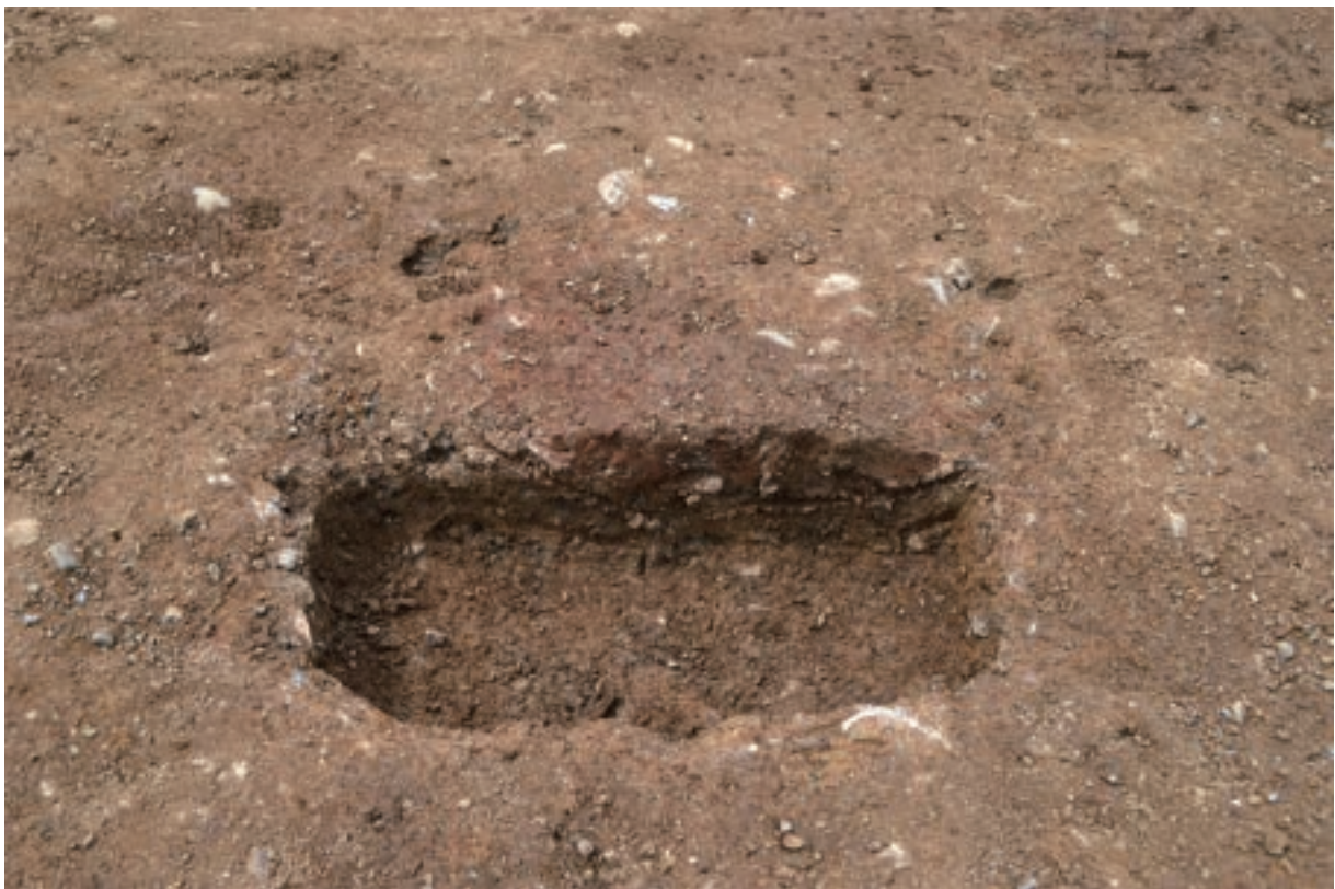
A 3 区 竪穴建物S200 焼土断面 (北東から)