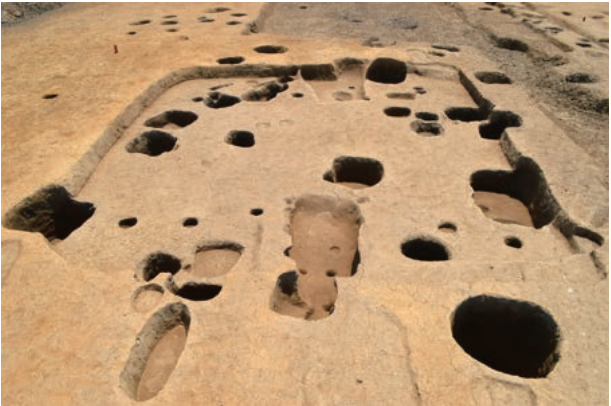
A 3区 竪穴建物S312 (北西から)