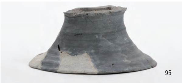
A 1 区 河道S9 北半40~60cm (73・88~93・95), 60~80cm (97・98), 80cm~最下層 (103)