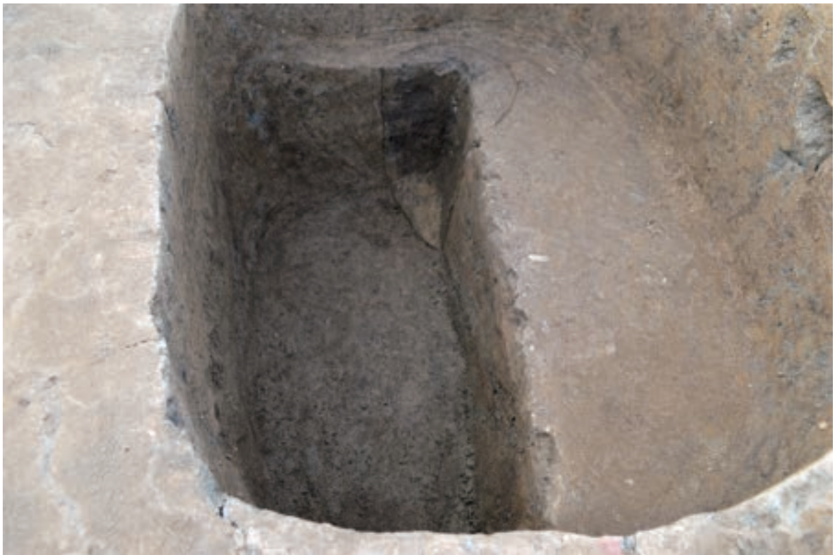
A 3区 掘立柱建物SB6 S397 柱痕断面 (南東から)