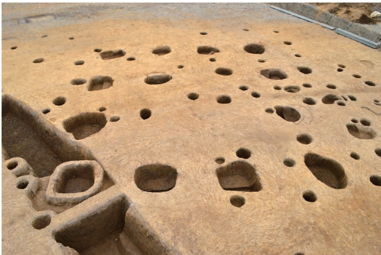
A 5 区 掘立柱建物SB8 (南西から)