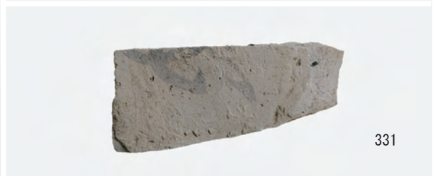
A 1 区 河道 S9 南半 40 ~ 60 cm