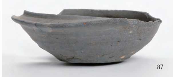
A 1 区 河道S9 北半20~40cm (65), 40~60cm (71・80~87)