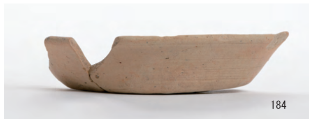
A 1区 河道S9 北半80cm~最下層 (105~107), 河道S9 南半0~20cm (116・118・121・124・126・128・133・184)