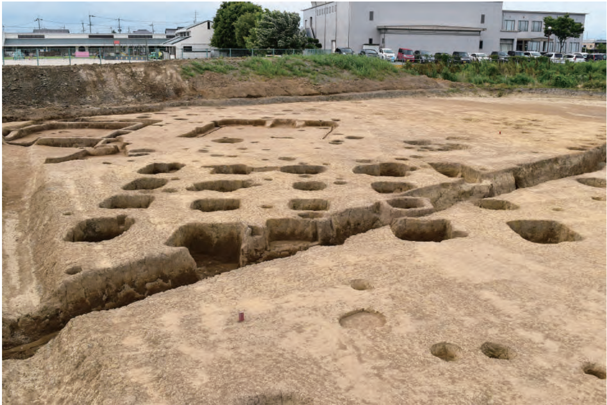
A 5 区 掘立柱建物SB7 (南東から)