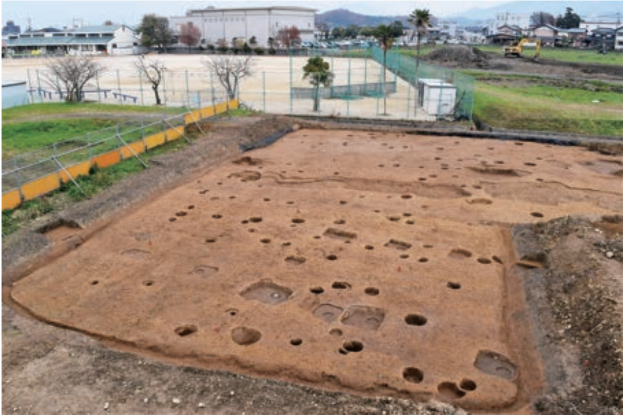
A2区 北部 (南西から)