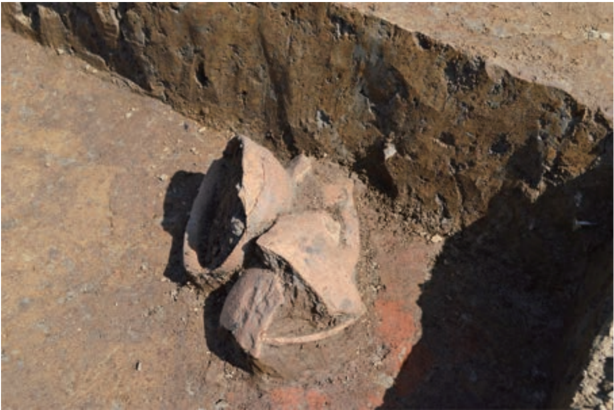
A 3区 竪穴建物S379 遺物出土状況（土器461 /北から）