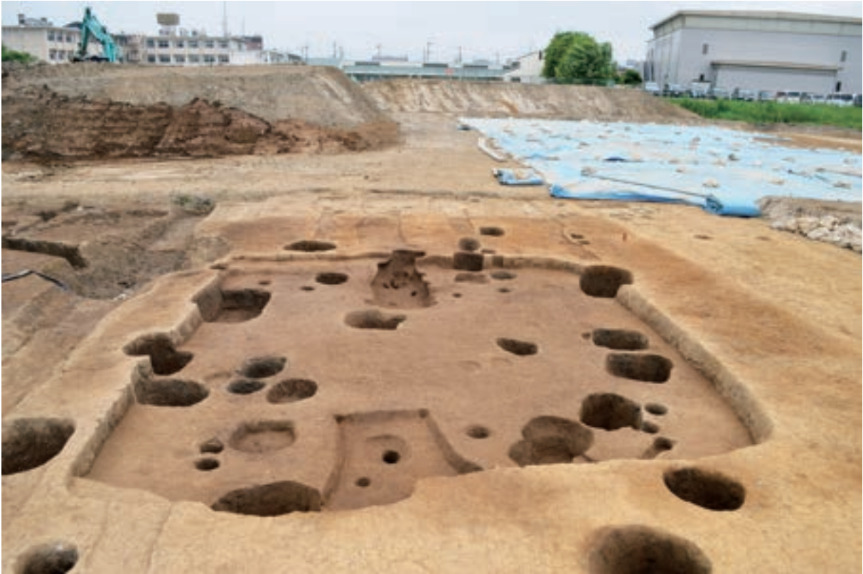
A 3区 竪穴建物S312 (南東から)