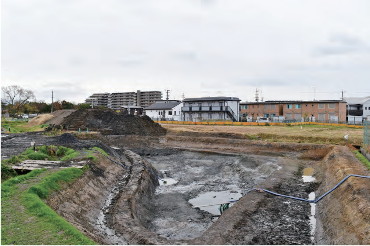
A 8 区 (北から)