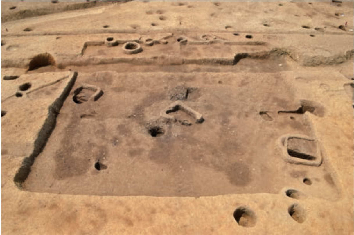
A 3 区 竪穴建物S200 (北東から)