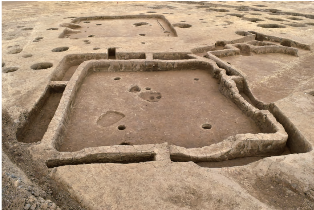
A 5 区 竪穴建物S276・S472（西から）