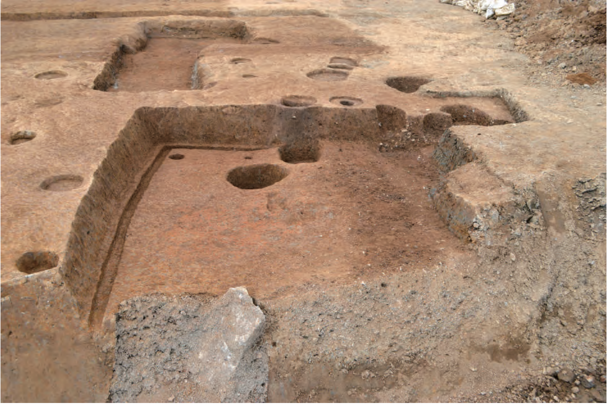
A 5区 竪穴建物S360 (南西から)