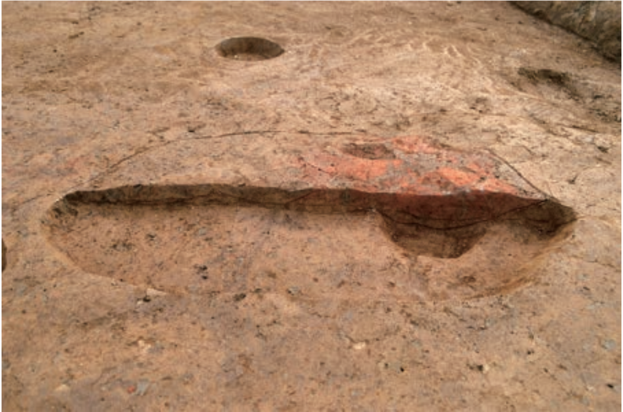
A 3区 竪穴建物S379 炉断面（北東から）