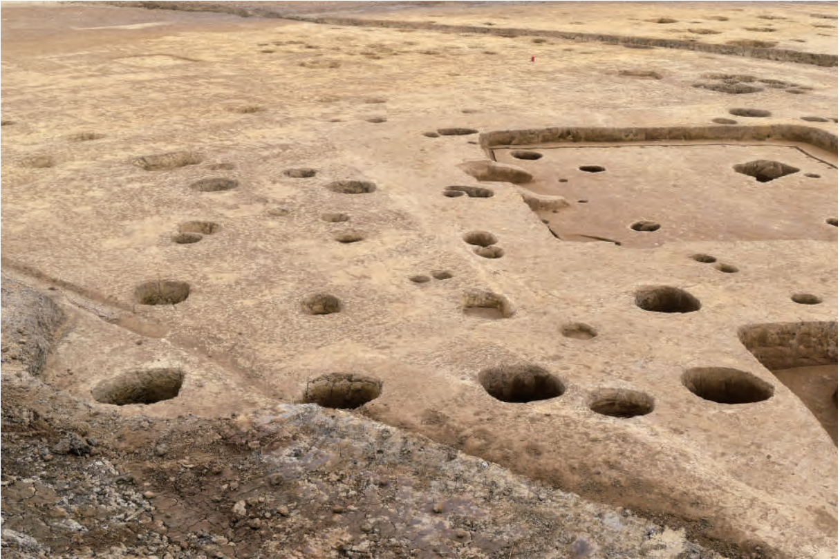
A 5区 掘立柱建物SB10 (西から)