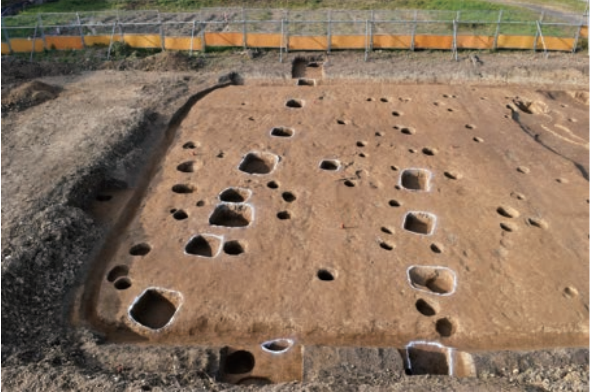
A 2区 掘立柱建物SB1・柵SA1 (南東から)