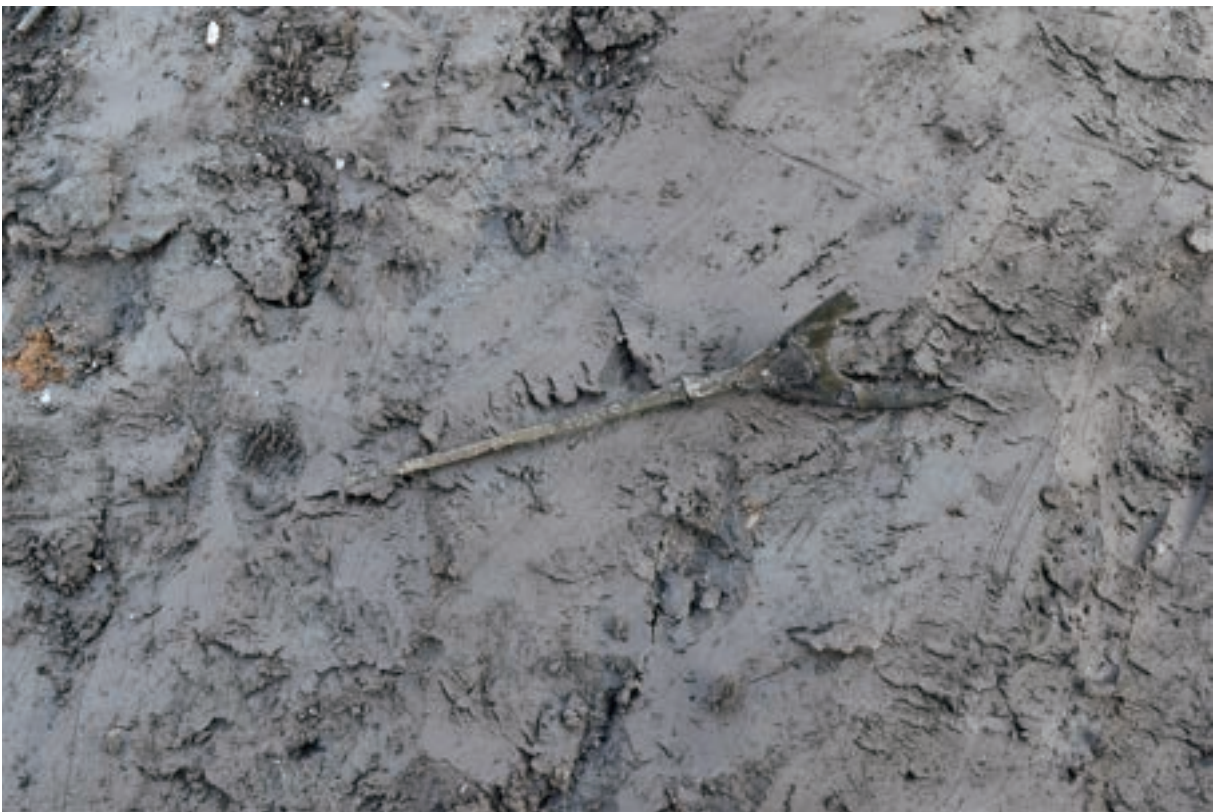
A 1区 河道S9 遺物出土状況 (M1 / 西から)