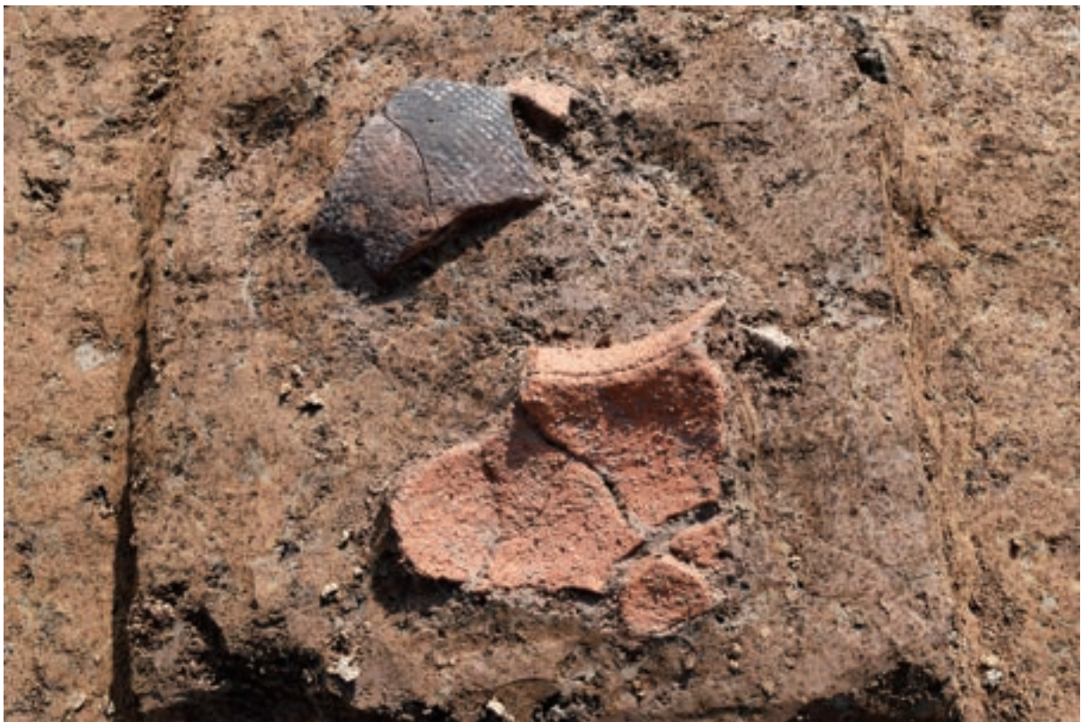
A 3区 竖穴建物S1 遺物出土状況 (土器469・470 / 北から)