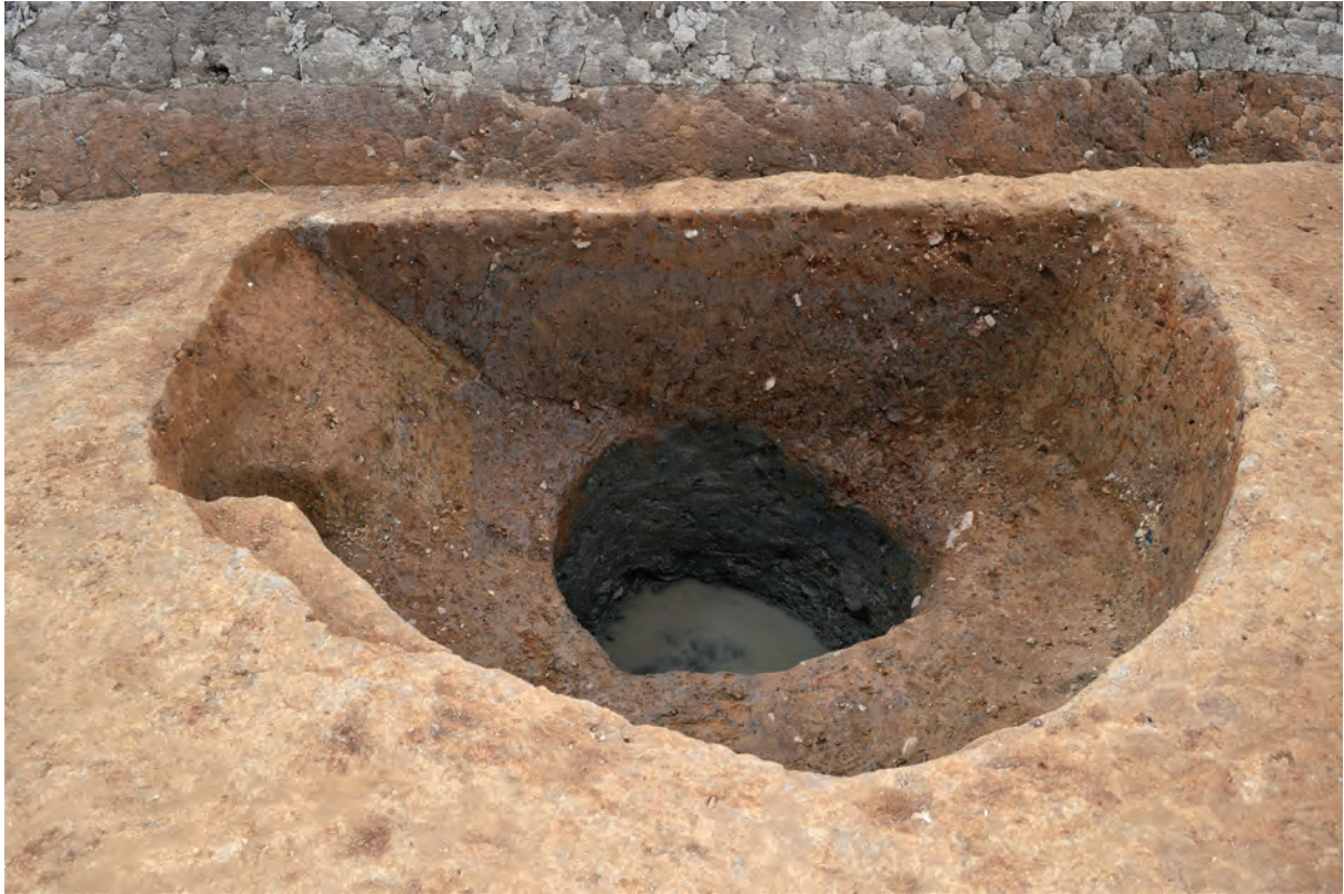
B区 井戸S2 (北東から)