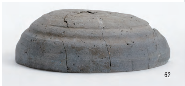
A 1 区 河道S9 北半0~20cm (30・33・36・37・39・40・45・51・52・54), 20~40cm (61・62)