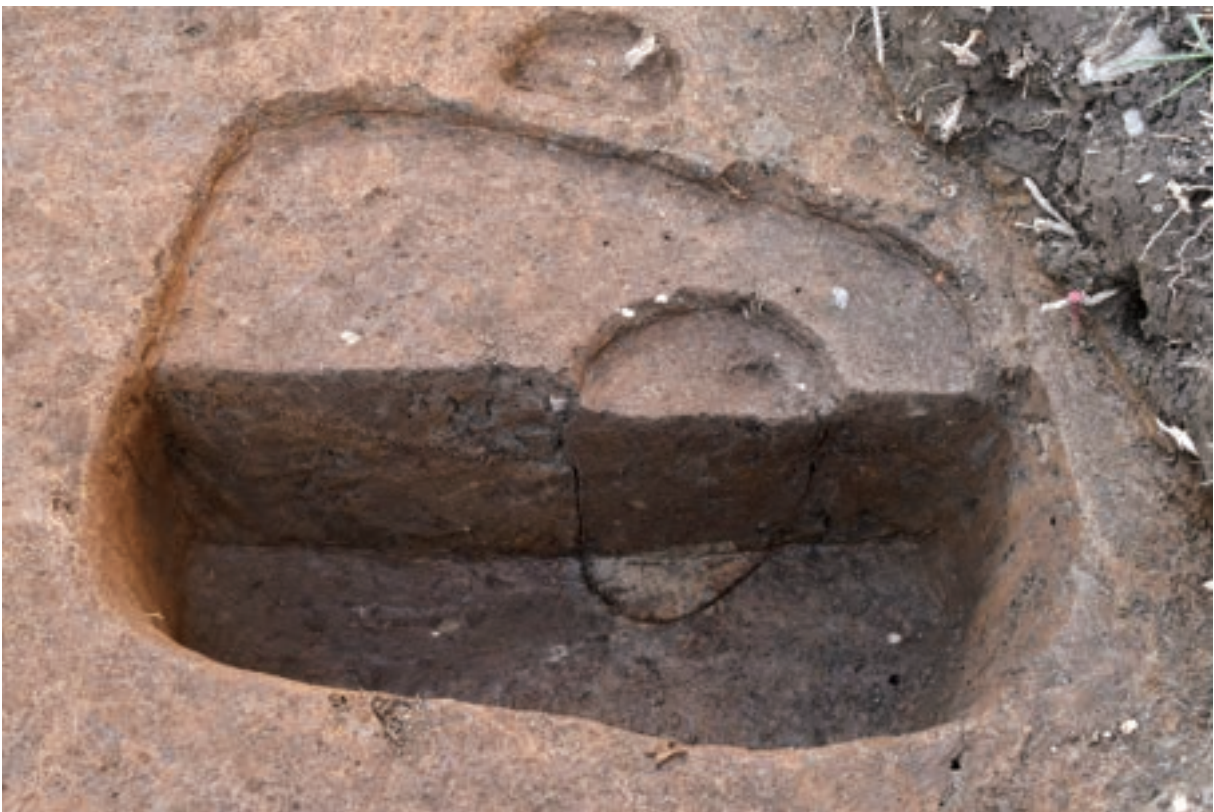
A 2区 柵SA1 S199 断面 (北東から)