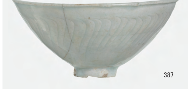
A 1 区 河道S9 南半40~60cm (348・349), 60~80cm (384・386~389)