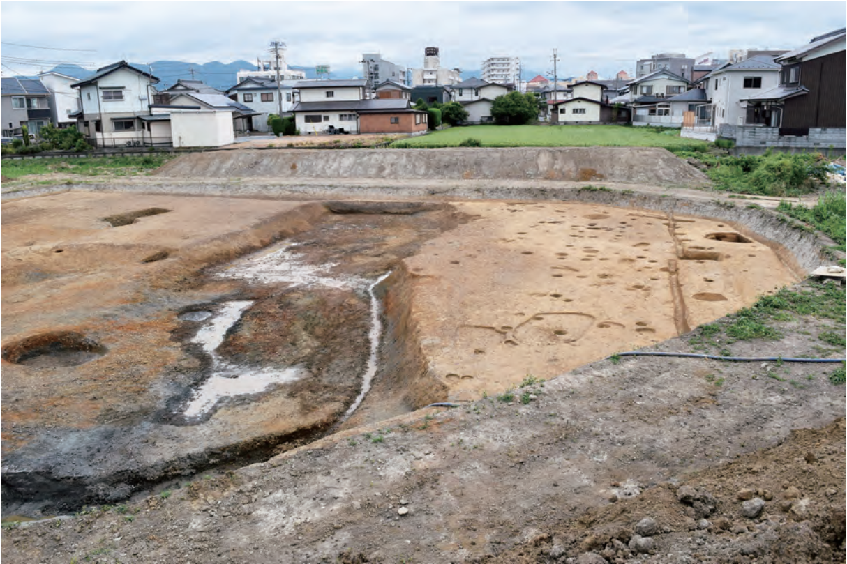
B区 南西部（北西から）