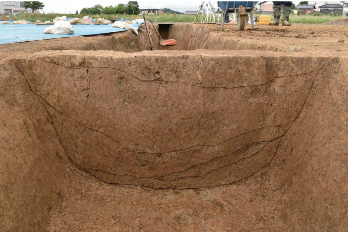
A 5 区 溝S145断面 (南西から)