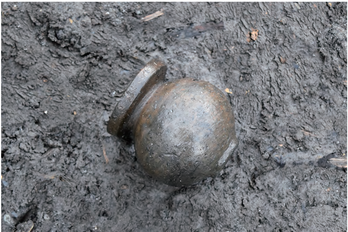
A 8区 河道S9 遺物出土状況 (土器857 / 北東から)