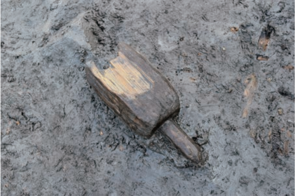
A 1区 河道S9 遺物出土状況 (W17 / 南から)