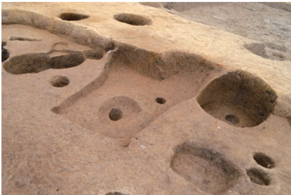
A 3区 竪穴建物S312 南東辺カマド (西から)