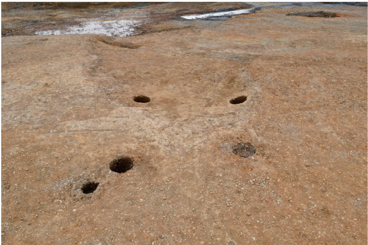
B区 小穴S44 (北東から)