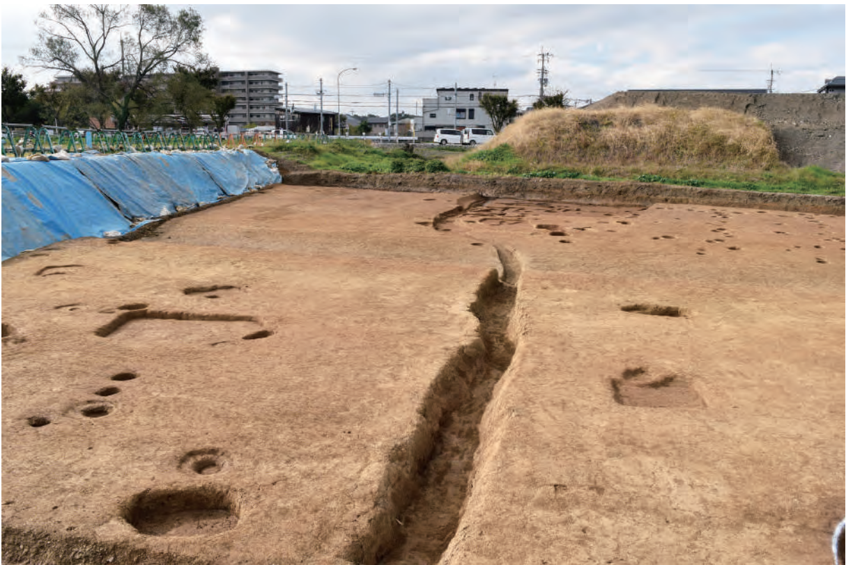
A 7区 溝S45 (北東から)