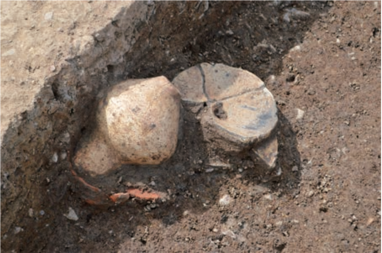
A 3区 竪穴建物S200 遺物出土状況（土器435・445・451／東から）