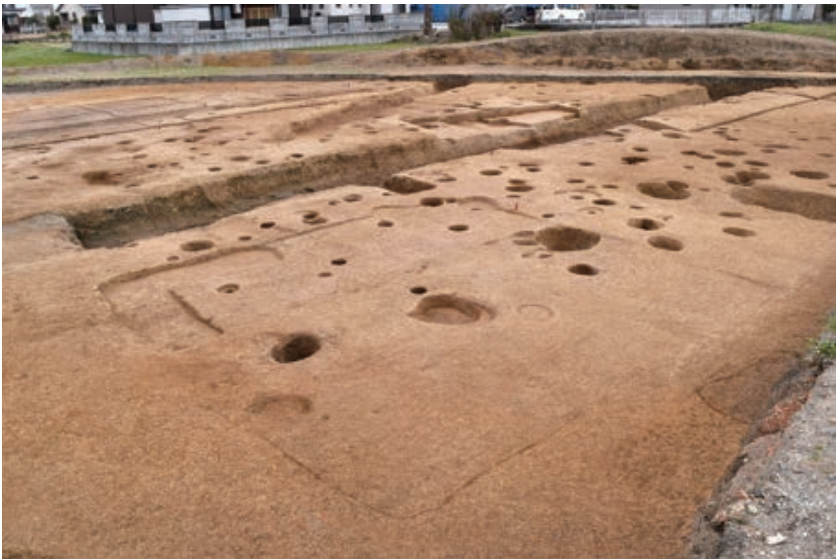
A 3区 竪穴建物S260（北西から）