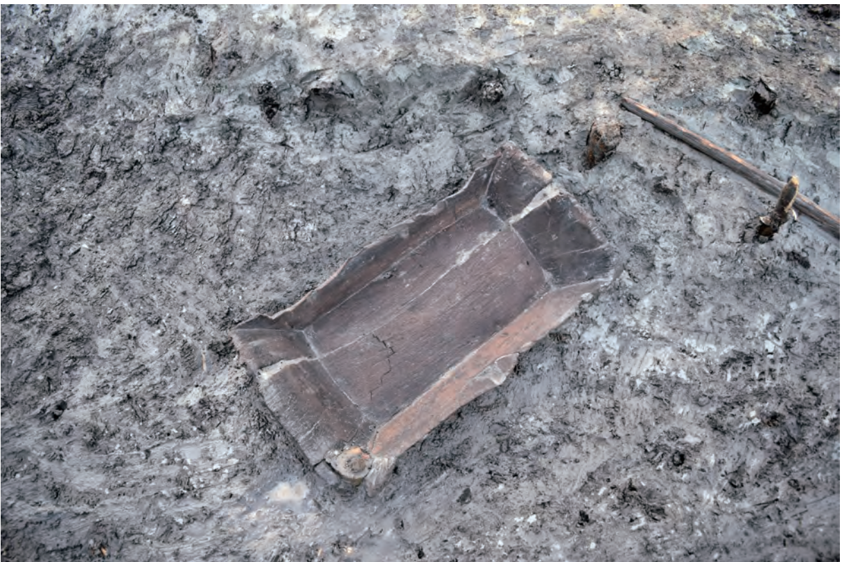
A 8区 河道S9 遺物出土状況（W140 /南東から）