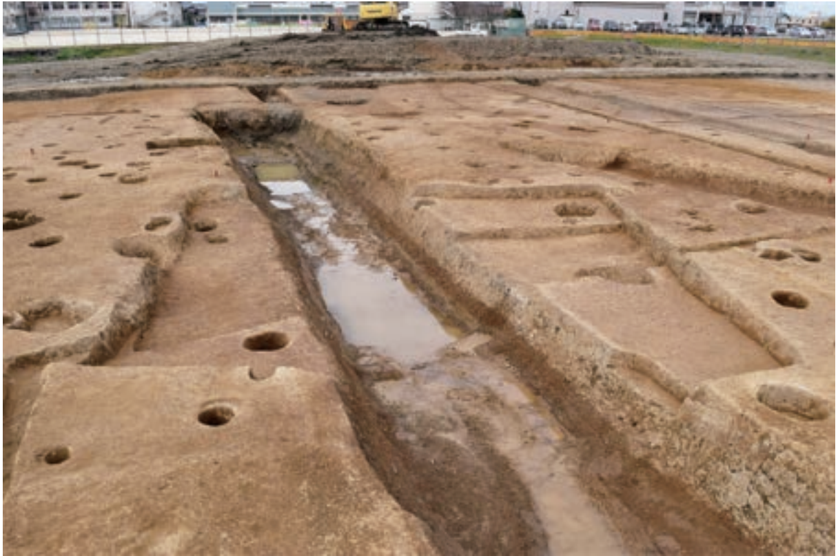
A 3区 竖穴建物S1 (南東から)