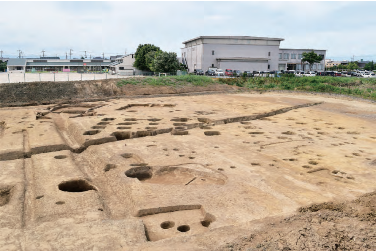
A 5 区 建物群 (南東から)